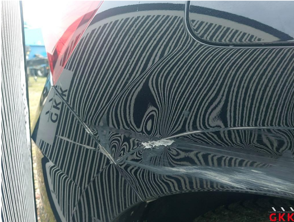
Bild 15 Seitenwand rechts verformt