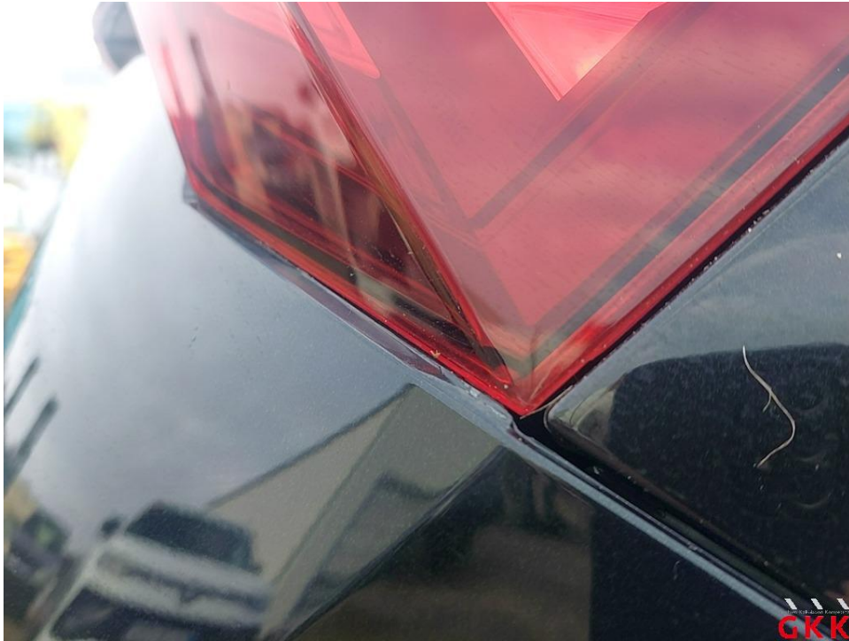
Bild 13 Rücklicht anstoßbeschädigt