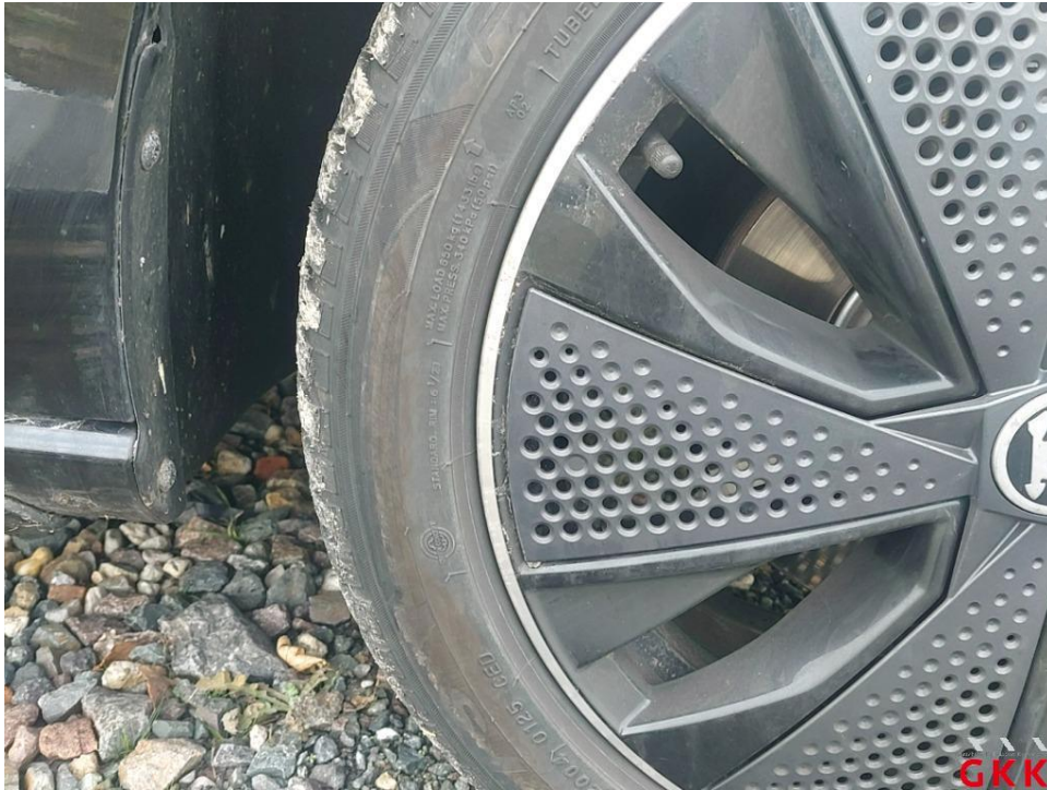
Bild 25 Reifen vorn rechts verschliffen