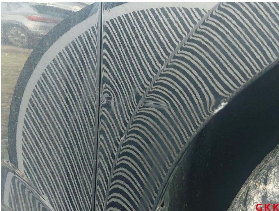
Bild 22 Kotflügel vorn rechts - verformt