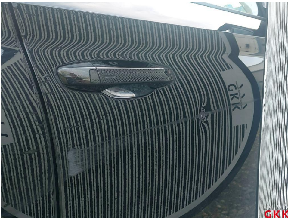
Bild 20 Tür vorn rechts - verformt