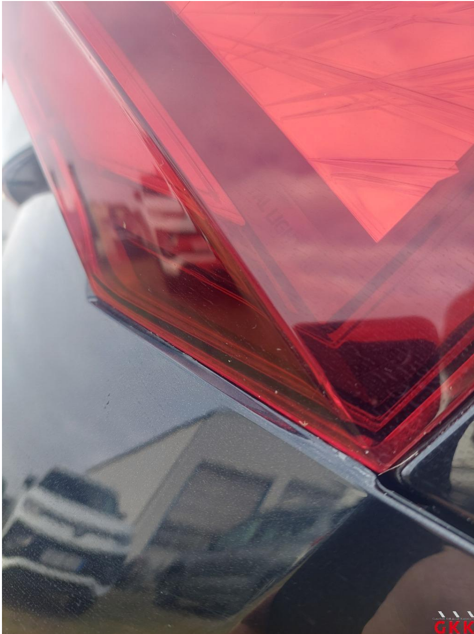
Bild 14 Rücklicht anstoßbeschädigt