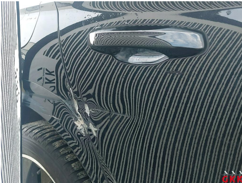
Bild 19 Tür hinten rechts - verformt