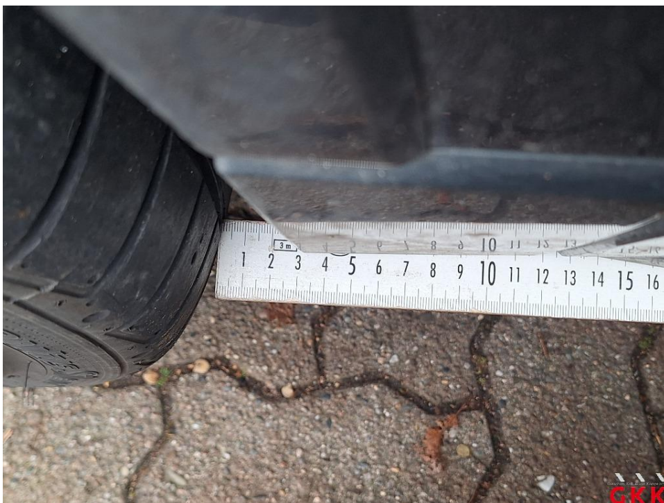
Bild 16 Radabstand links