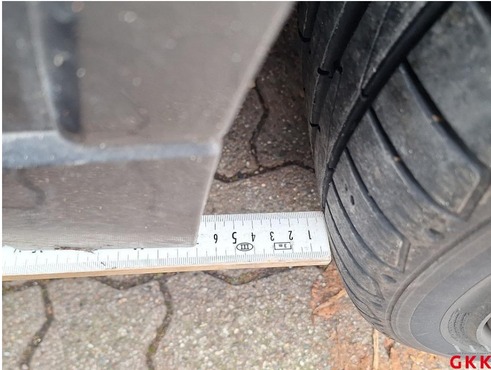
Bild 17 Radabstand rechts