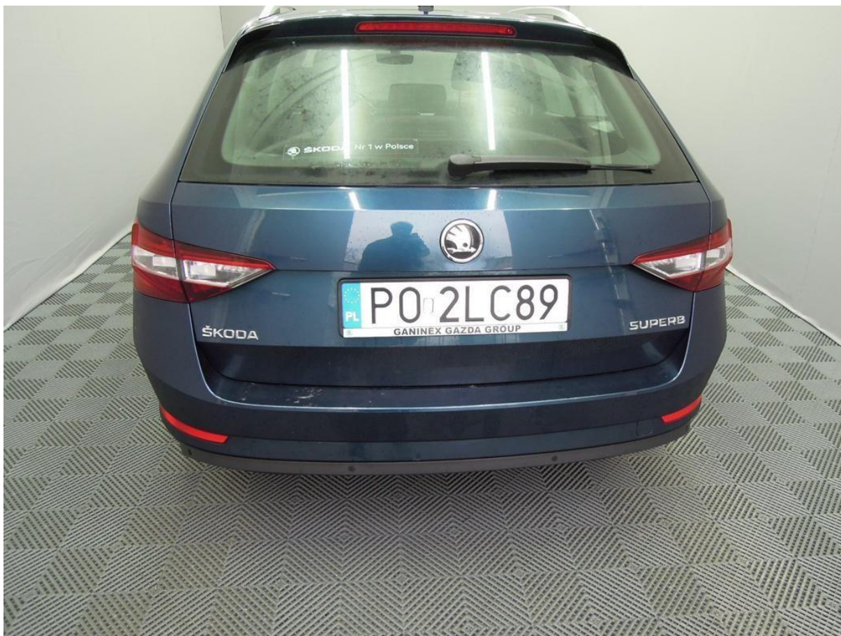
Fot. nr 28