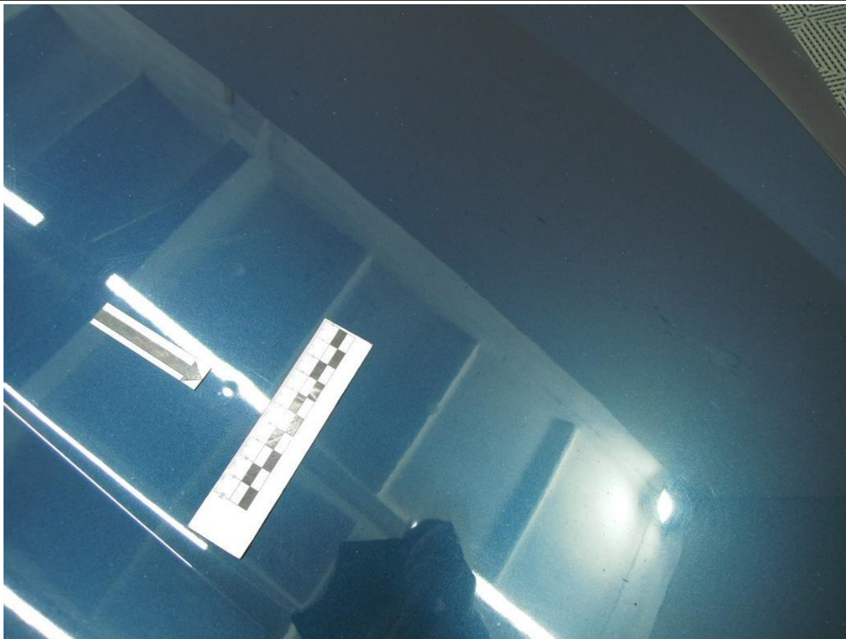
Fot. nr 27