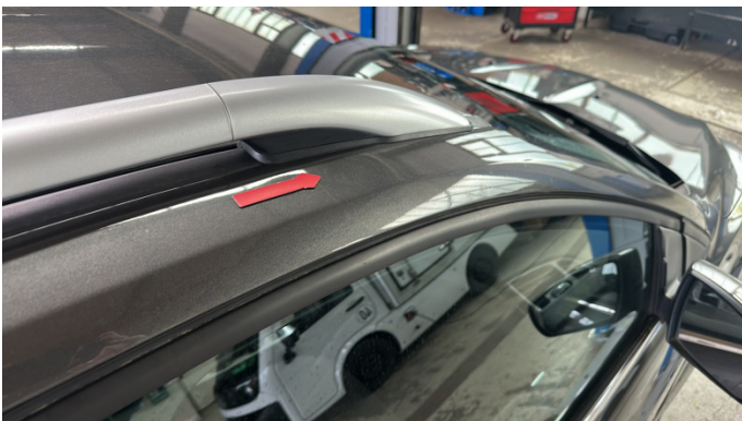
3. Dachrahmen - Rechts 1 Delle -