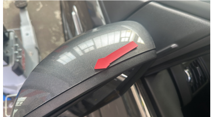
7. Außenspiegel Gehäuse - Links Kratzer -