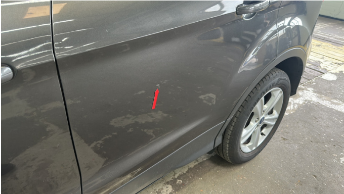
4. Tür Hinten - Links 1 Delle -