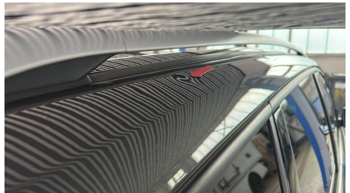
2. Dachrahmen - Rechts 1 Delle -