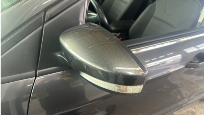
7. Außenspiegel Gehäuse - Links Kratzer -