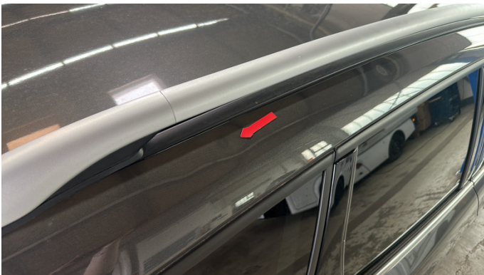
2. Dachrahmen - Rechts 1 Delle -