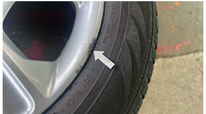
13. 2. Radsatz Kratzer -