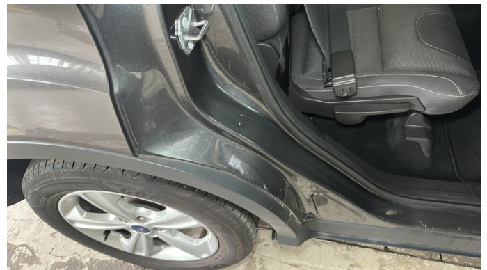
10. Einstieg Hinten rechts 1 Delle -