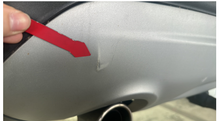
5. Stoßfänger Hinten Bruch -