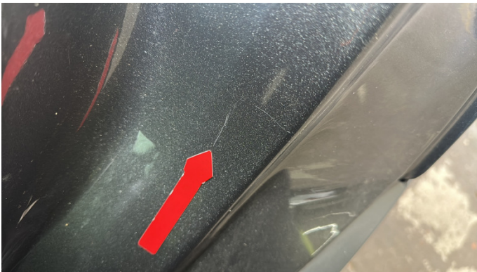
11. Einstieg Hinten links Kratzer -