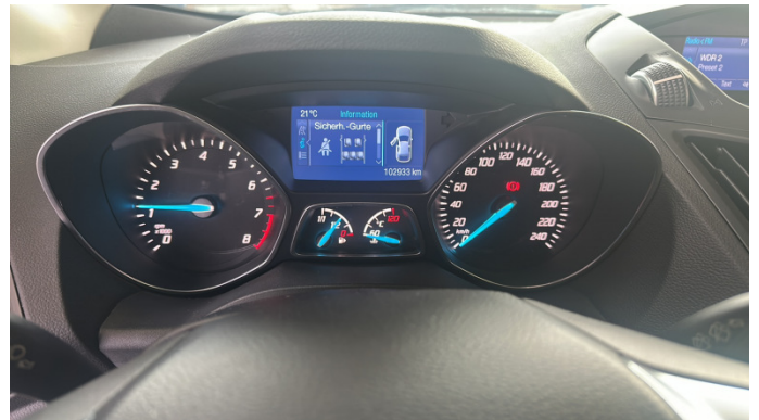
12. Warnleuchte In Ordnung -