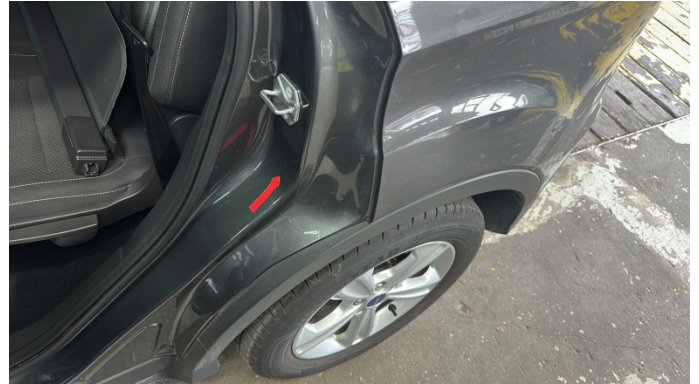
11. Einstieg Hinten links Kratzer -