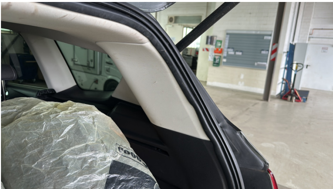
8. Kofferraumverkleidung Rechts Kratzer -