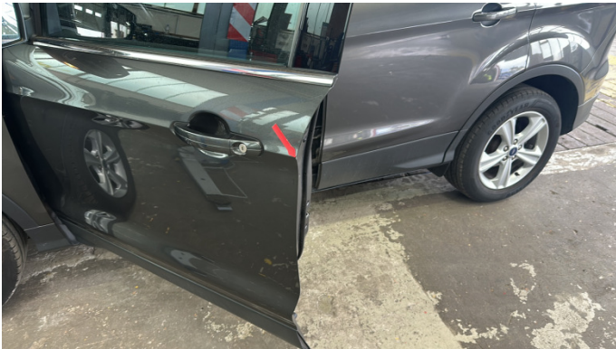
1. Tür Vorne - Links Kratzer -