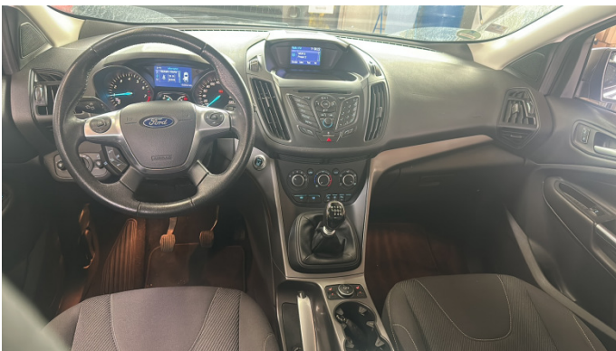
9. Armaturenbrett In Ordnung -