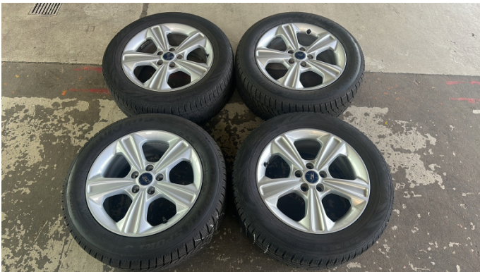
13. 2. Radsatz Kratzer -