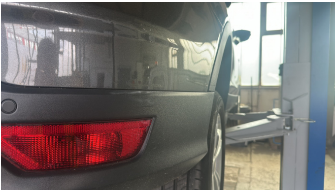
6. Stoßfänger Hinten Nicht In Ordnung -