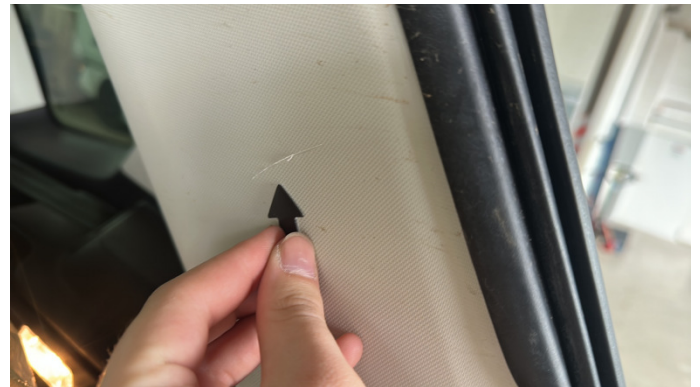
8. Kofferraumverkleidung Rechts Kratzer -