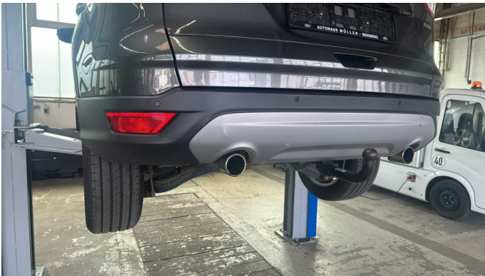
5. Stoßfänger Hinten Bruch -