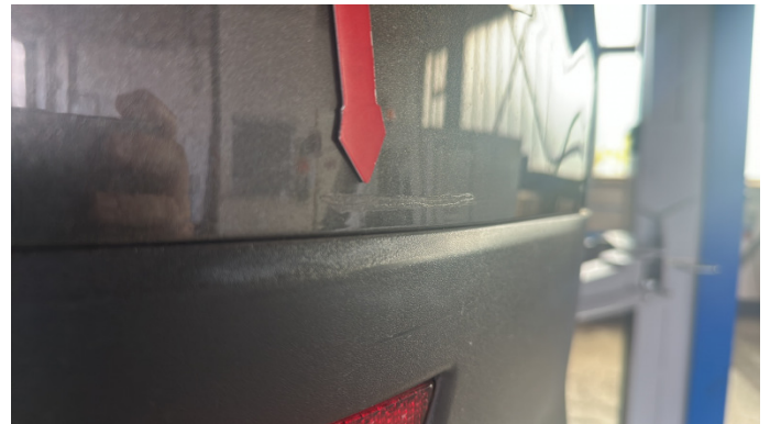
6. Stoßfänger Hinten Nicht In Ordnung -