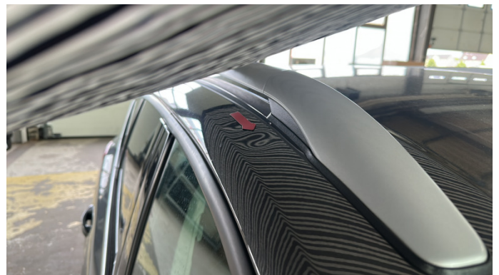
3. Dachrahmen - Rechts 1 Delle -