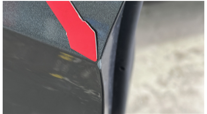
1. Tür Vorne - Links Kratzer -