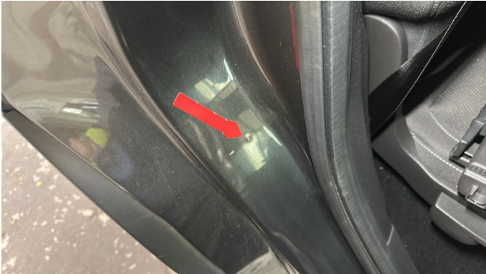
10. Einstieg Hinten rechts 1 Delle -