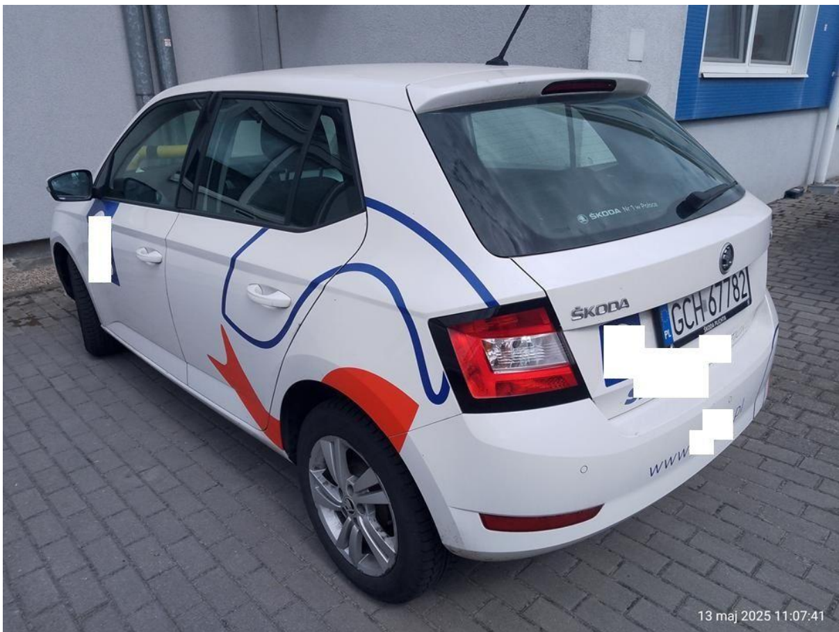
Fot. nr 2