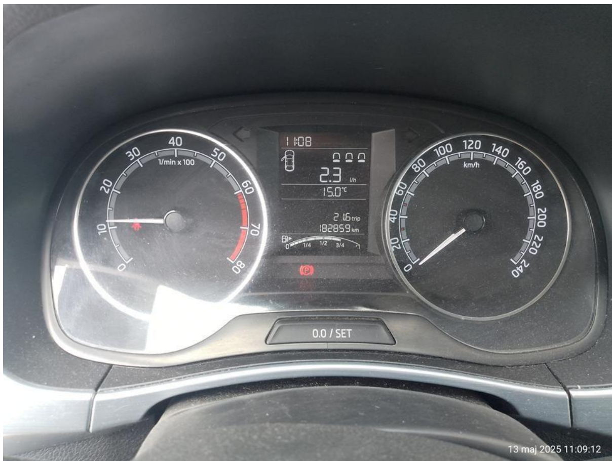
Fot. nr 18