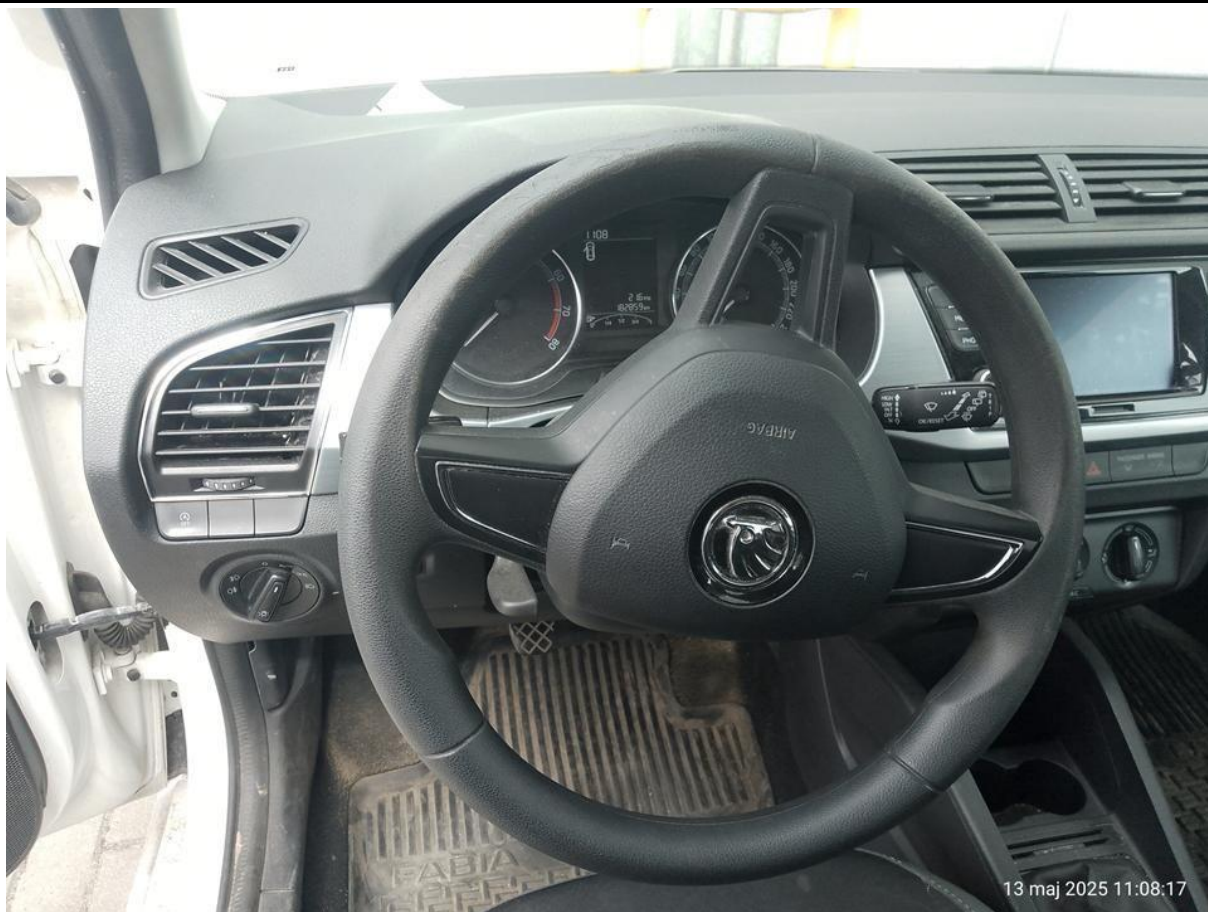
Fot. nr 13