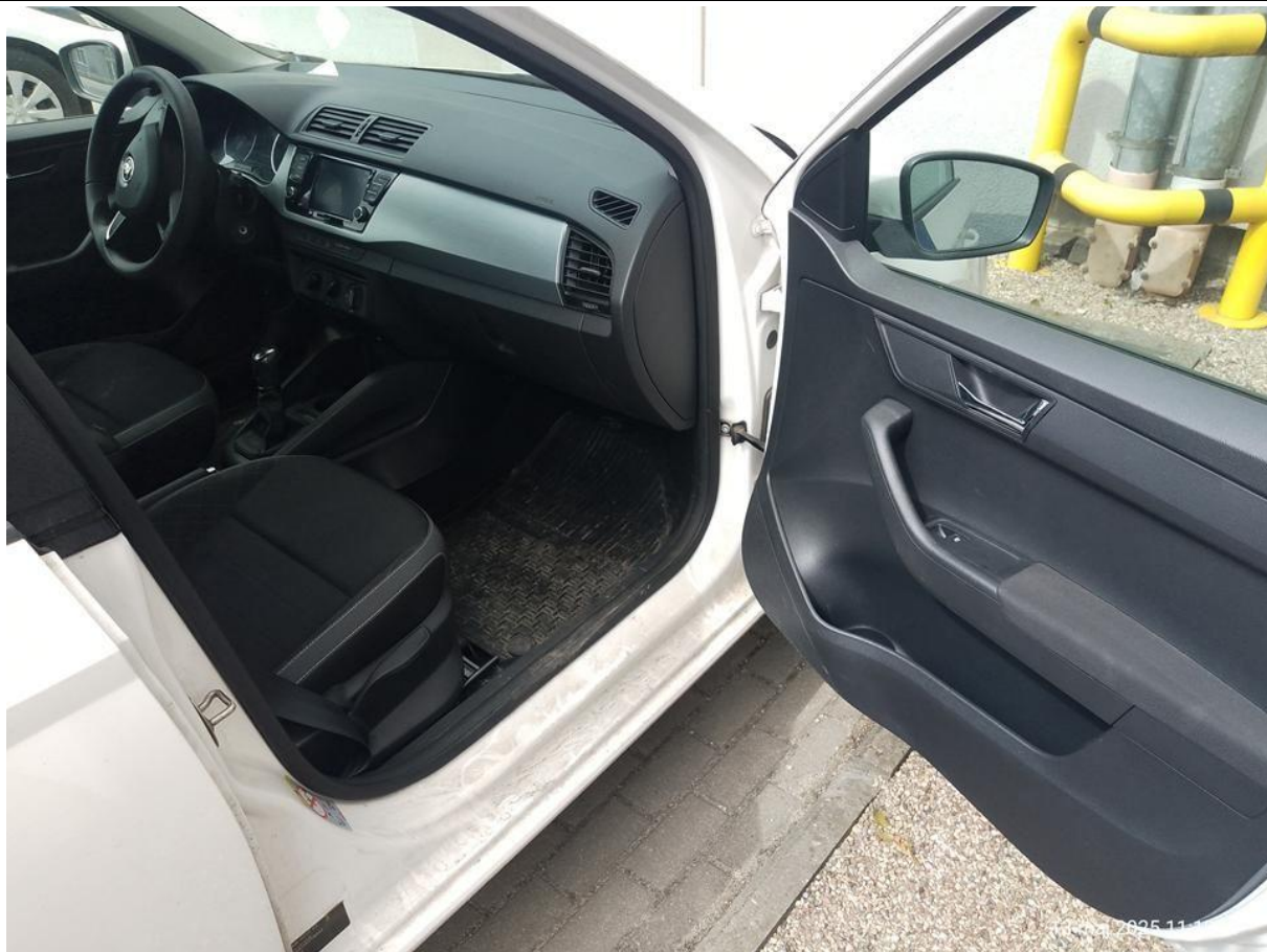
Fot. nr 29