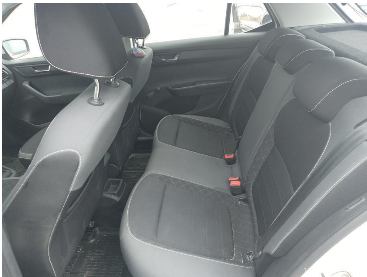
Fot. nr 22