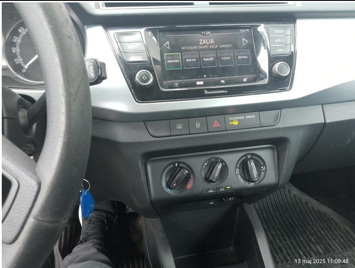
Fot. nr 19