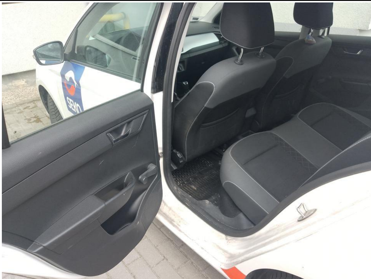
Fot. nr 21