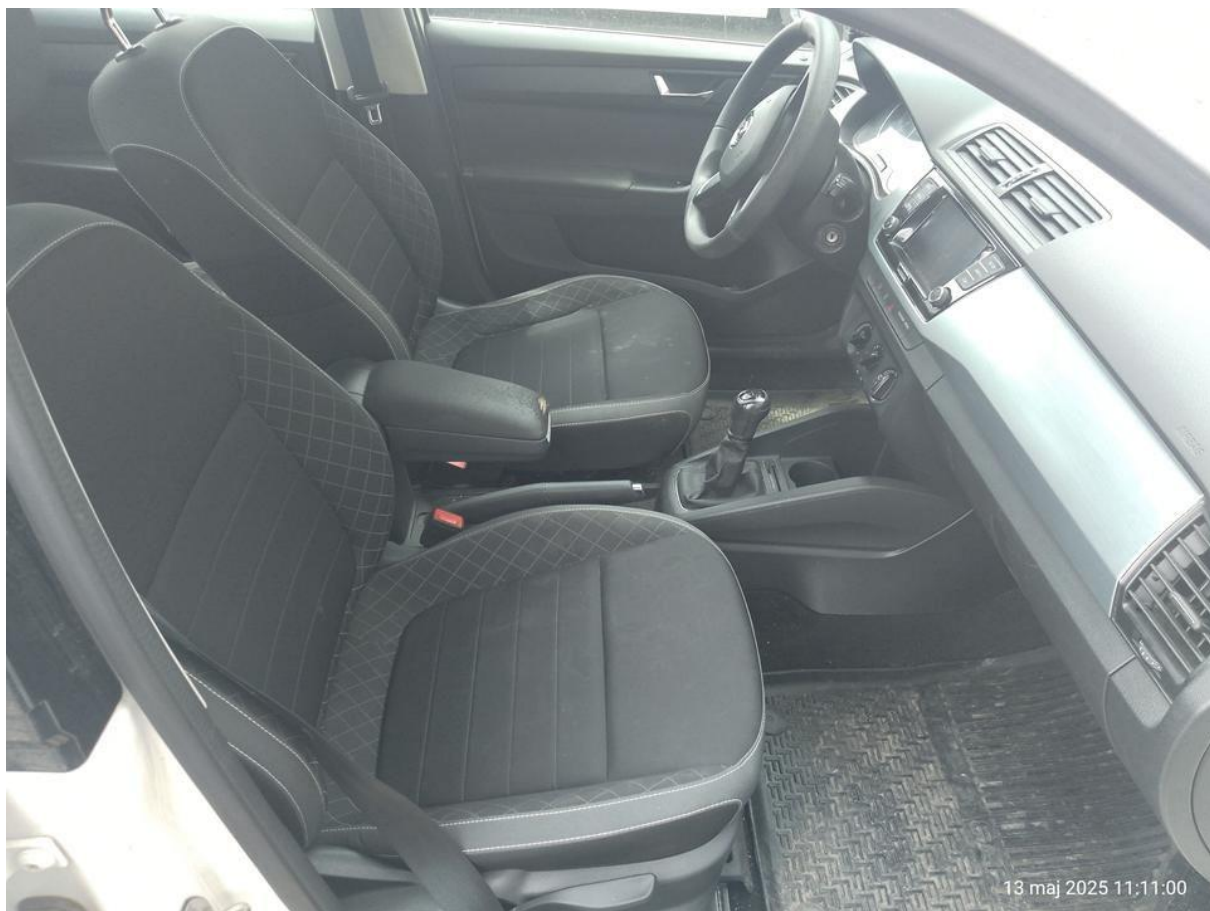
Fot. nr 30