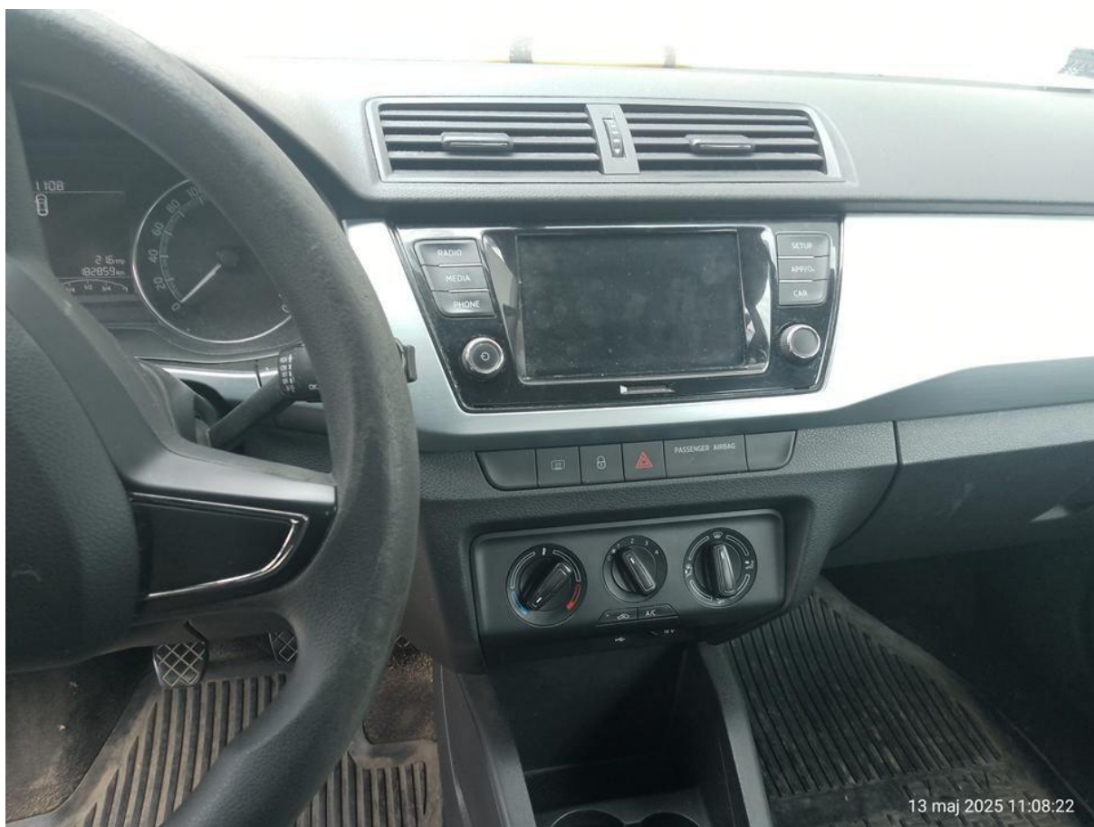
Fot. nr 14