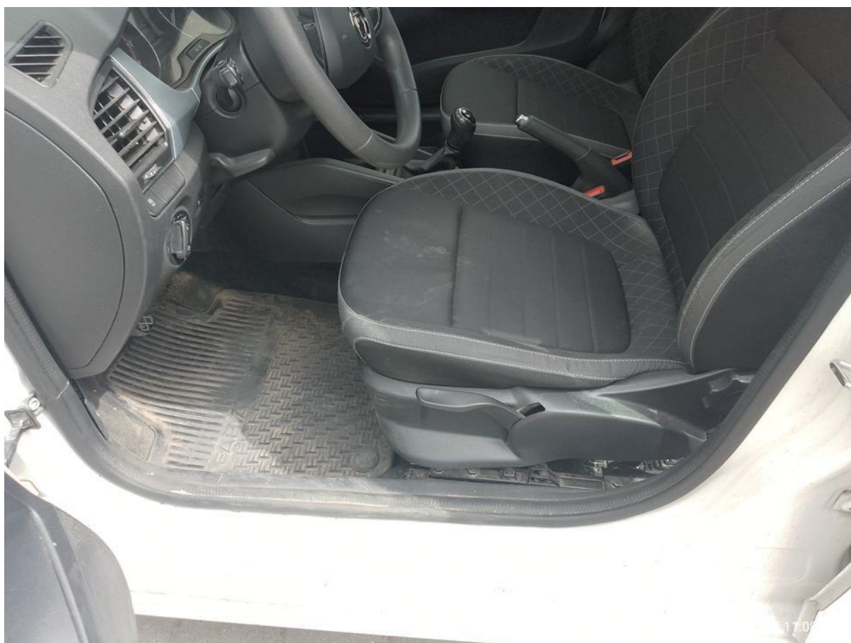
Fot. nr 12