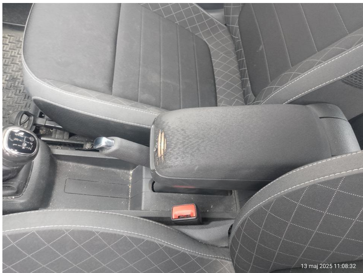
Fot. nr 16