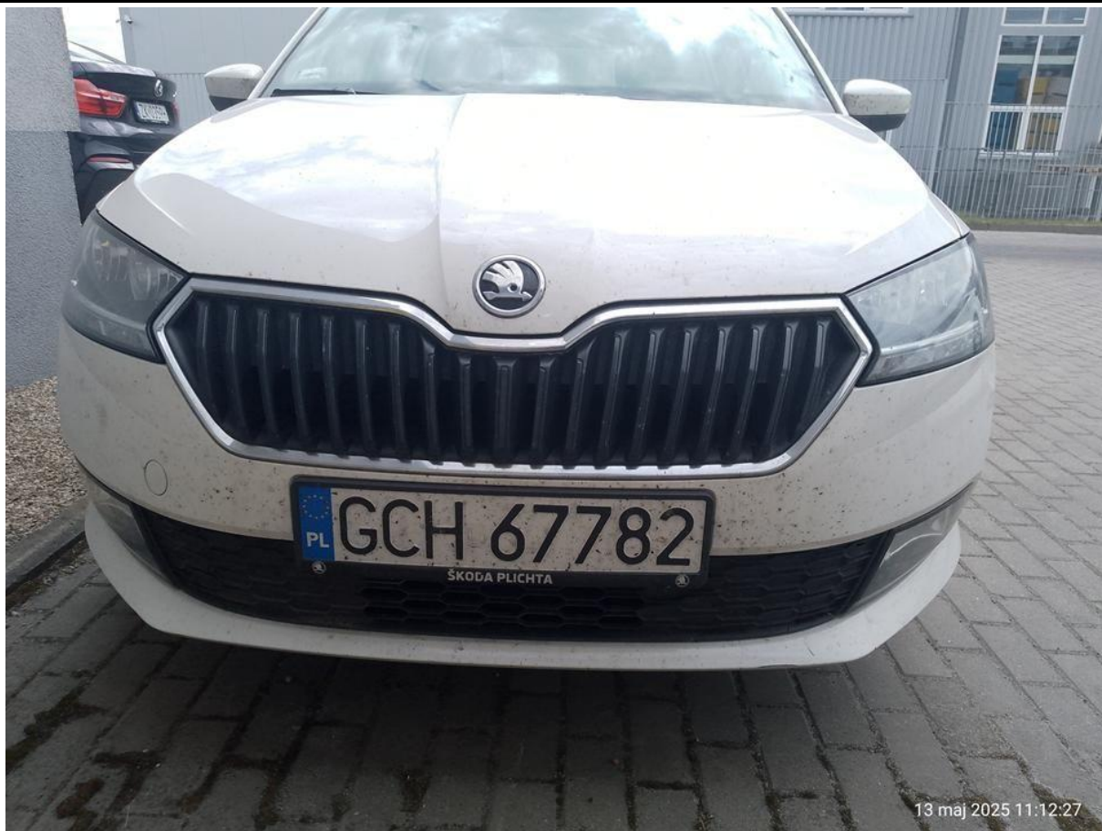
Fot. nr 31