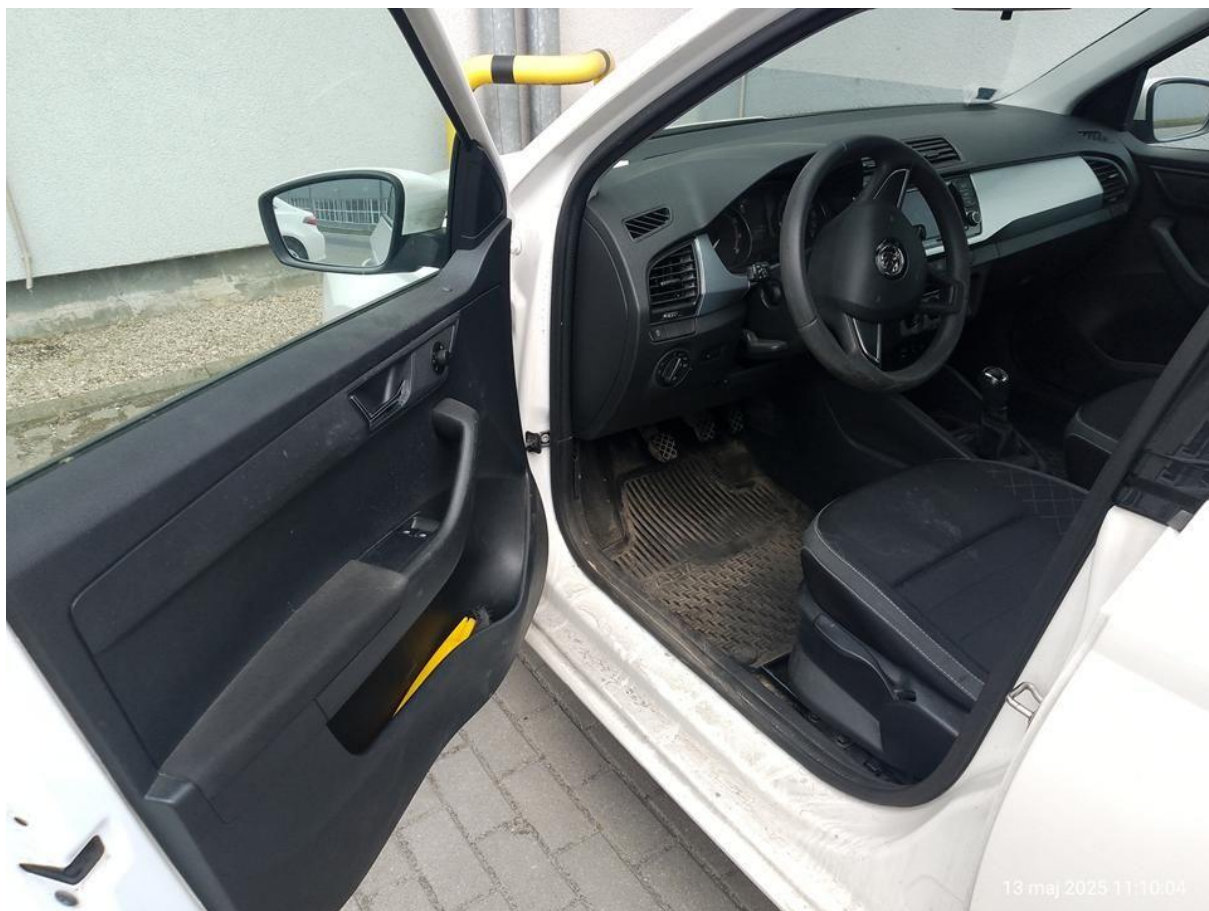
Fot. nr 20