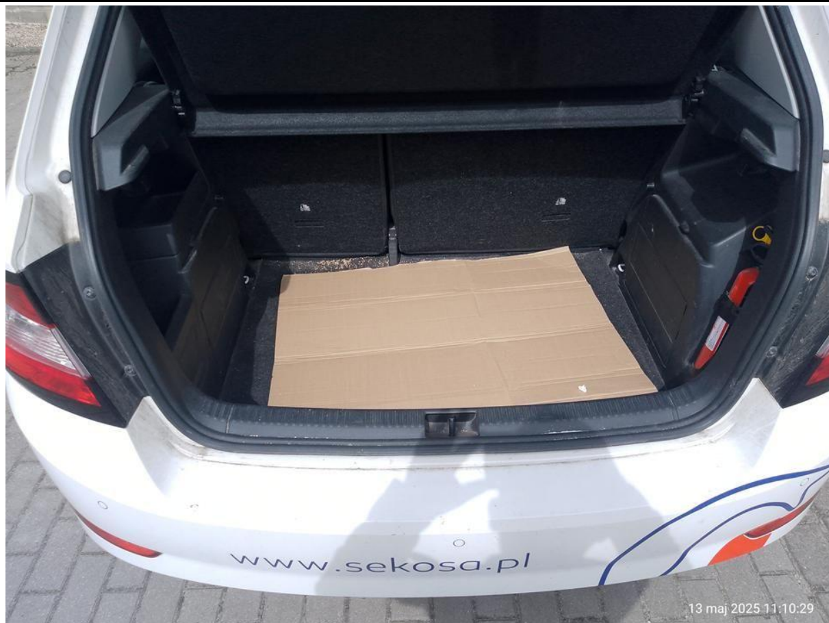
Fot. nr 25