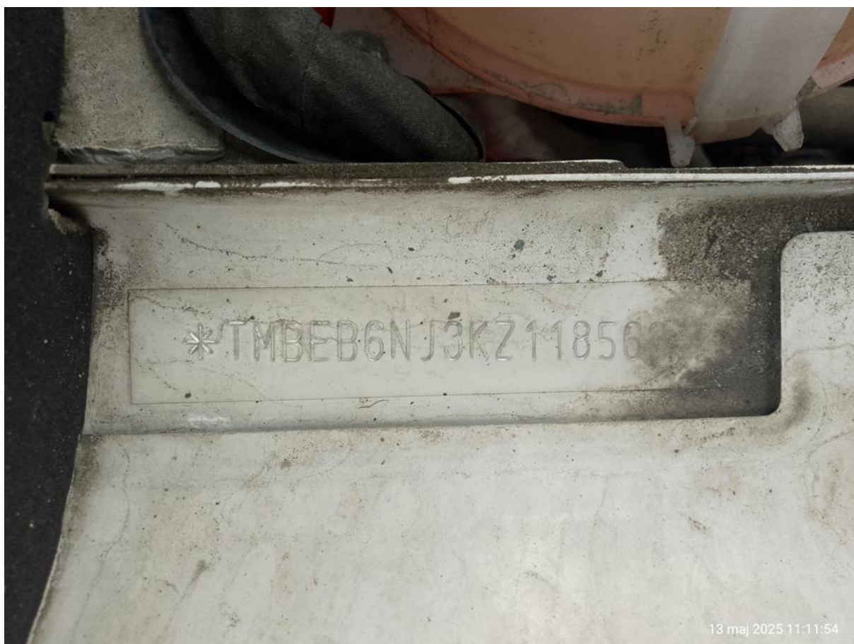
Fot. nr 8