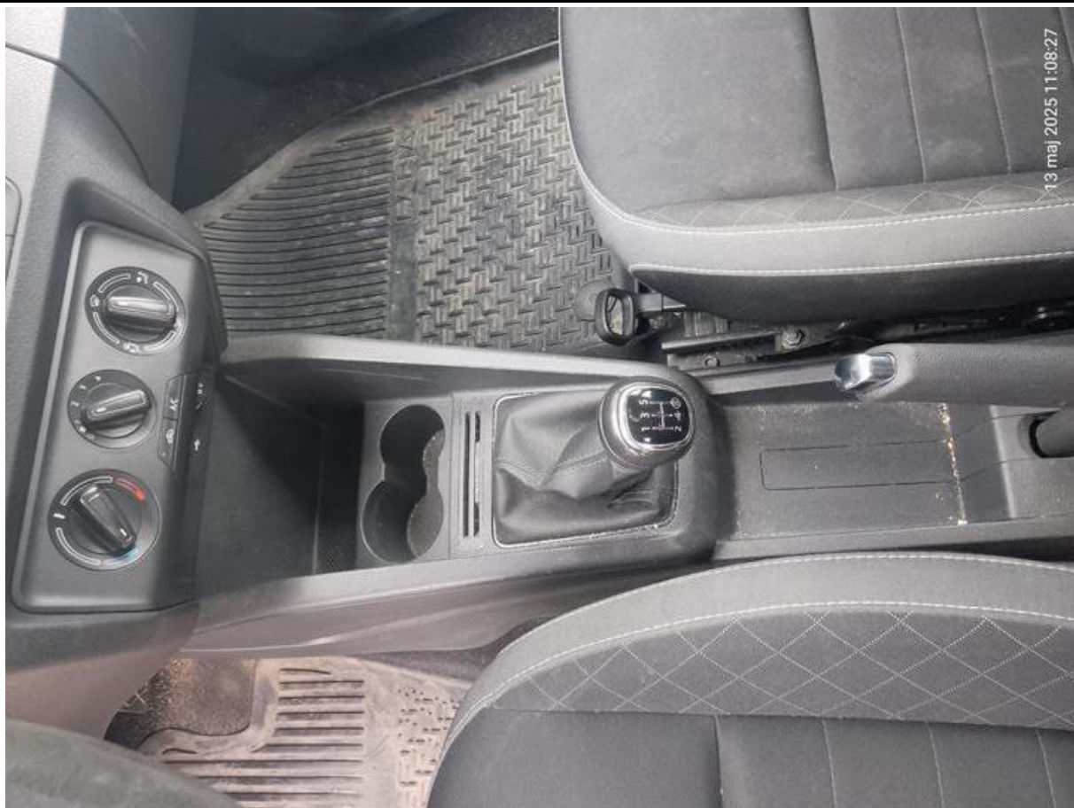
Fot. nr 15