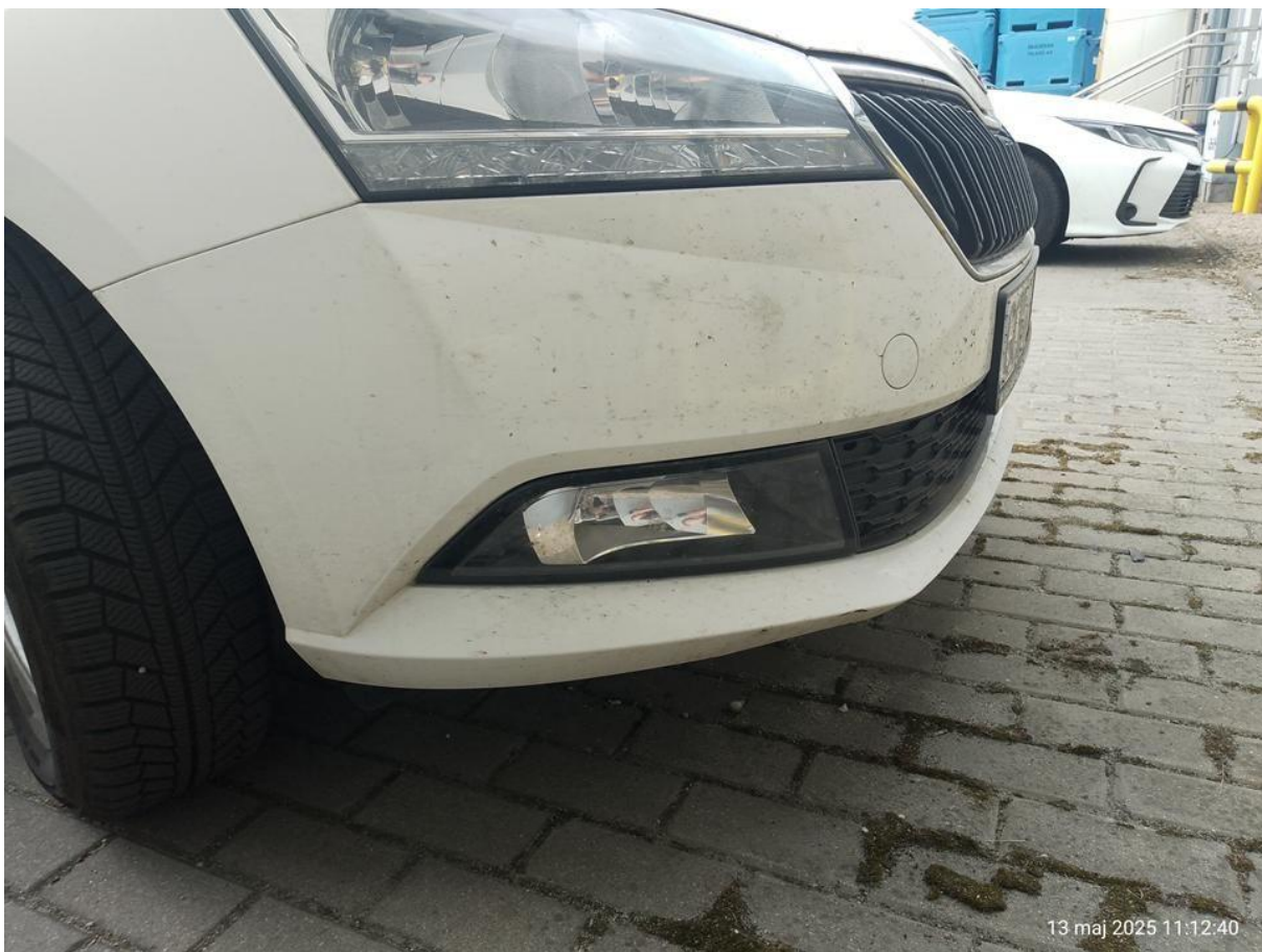
Fot. nr 34