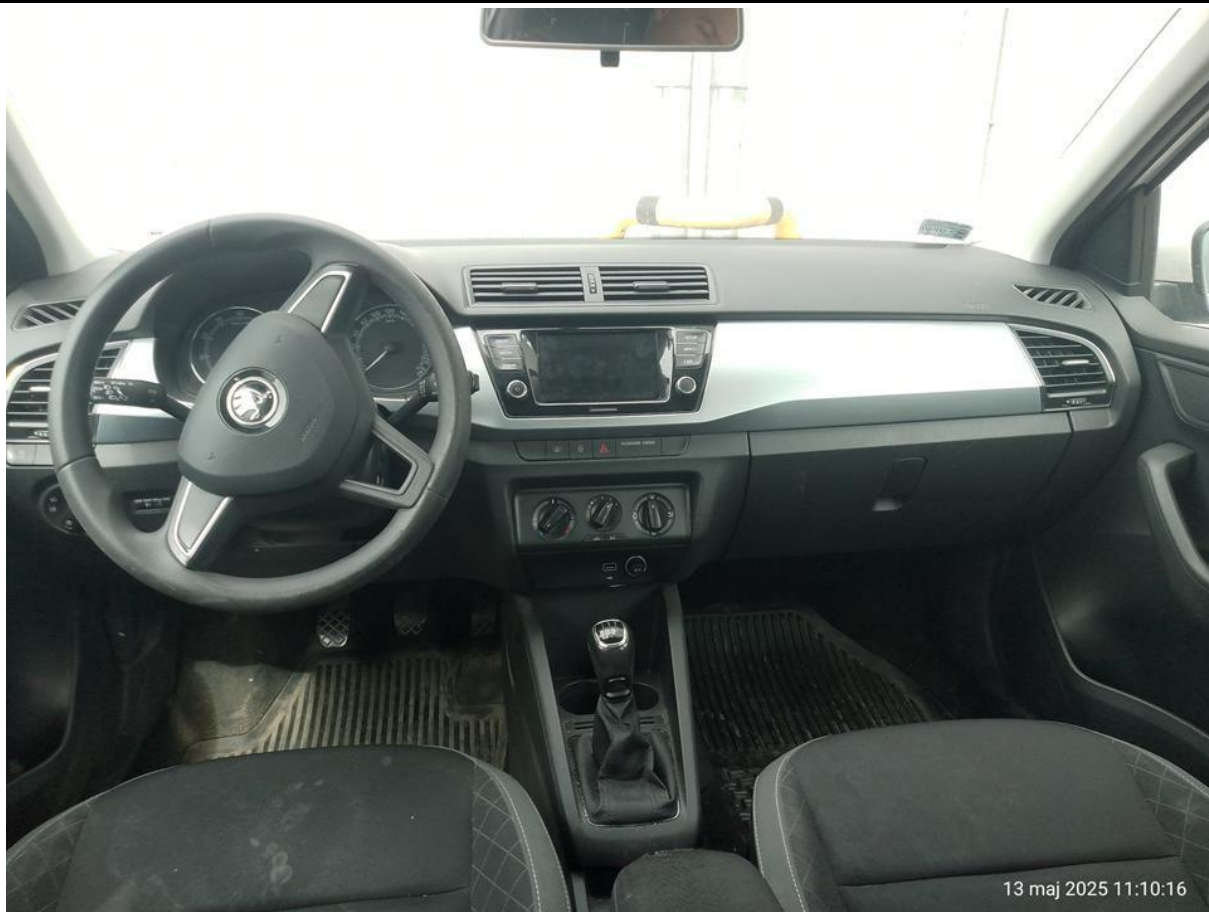
Fot. nr 23