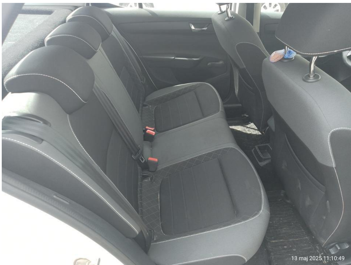
Fot. nr 28