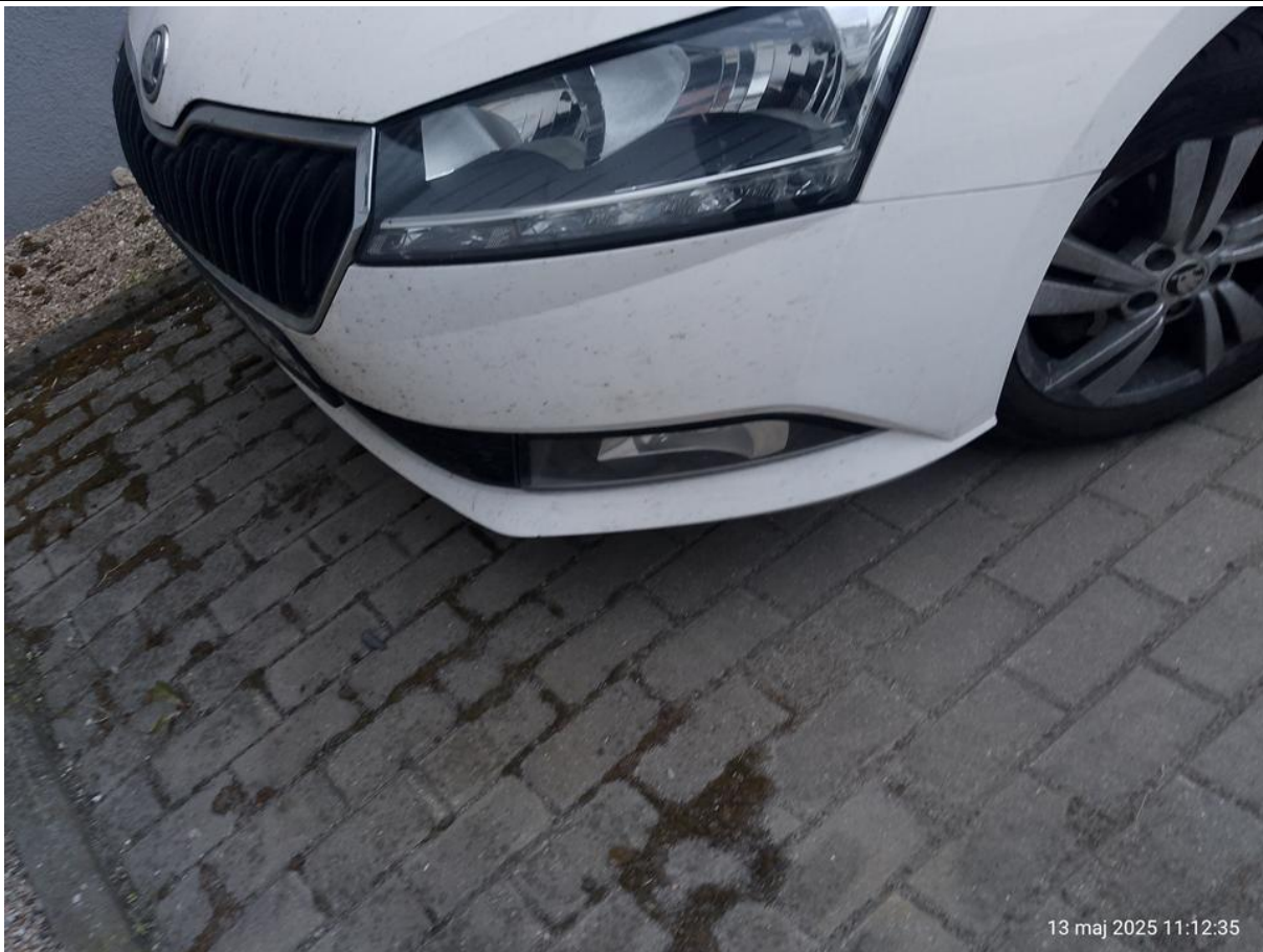
Fot. nr 33