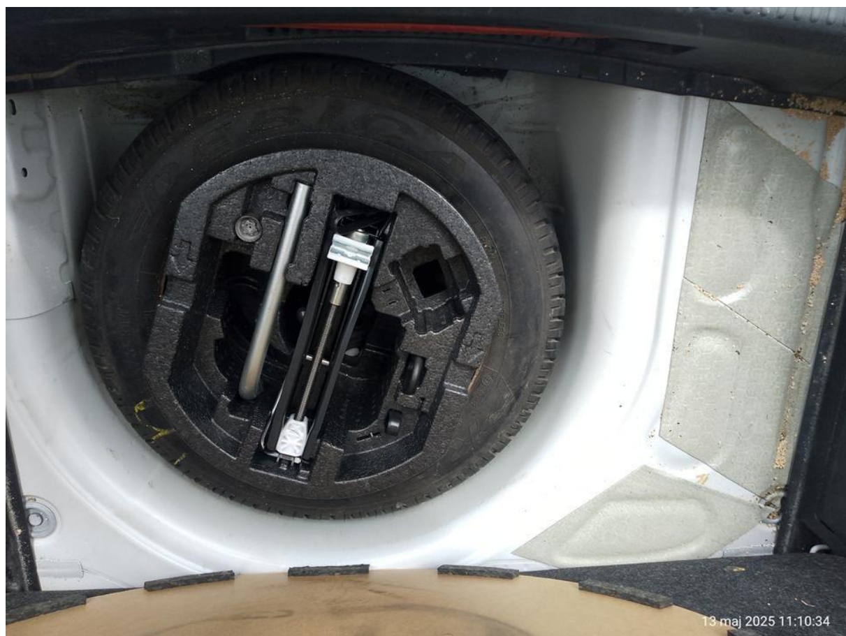
Fot. nr 26