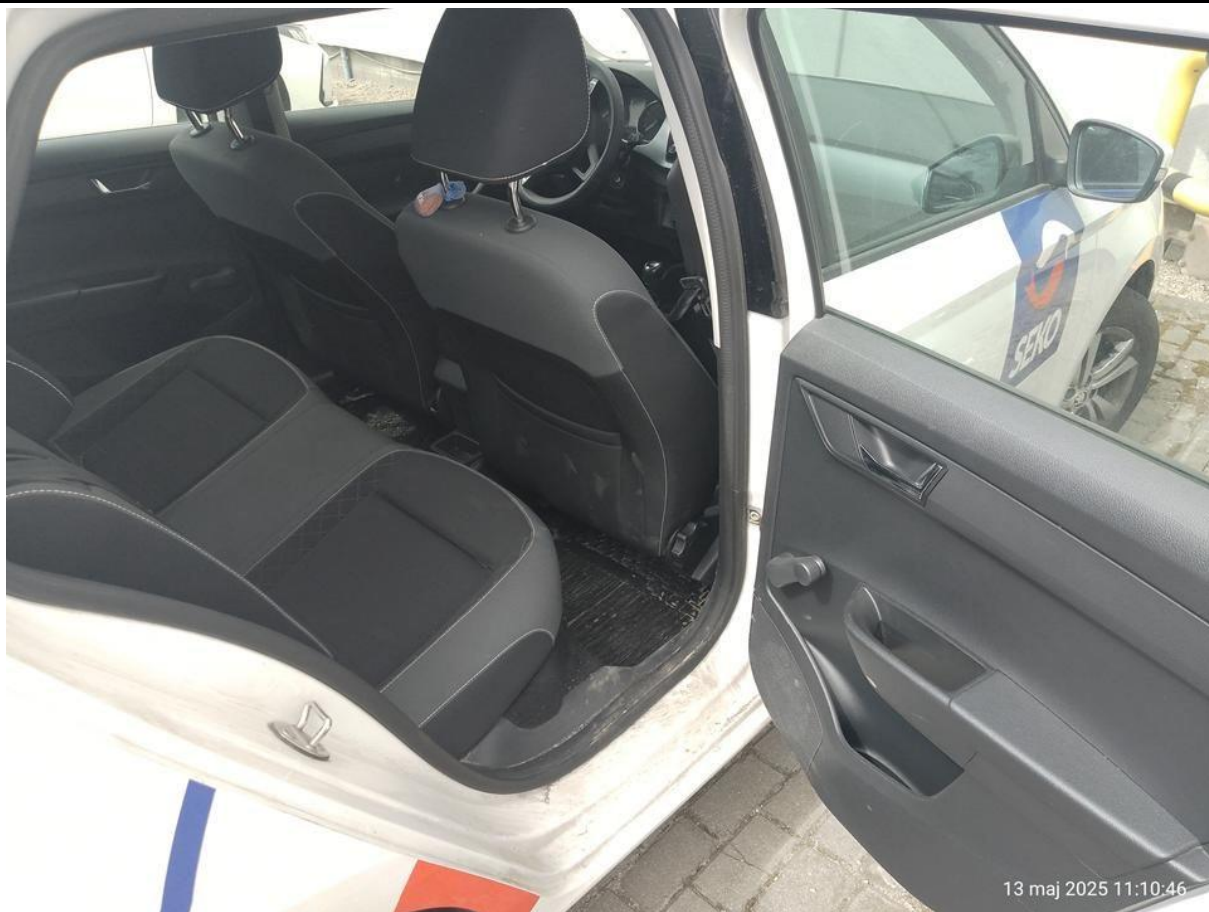
Fot. nr 27