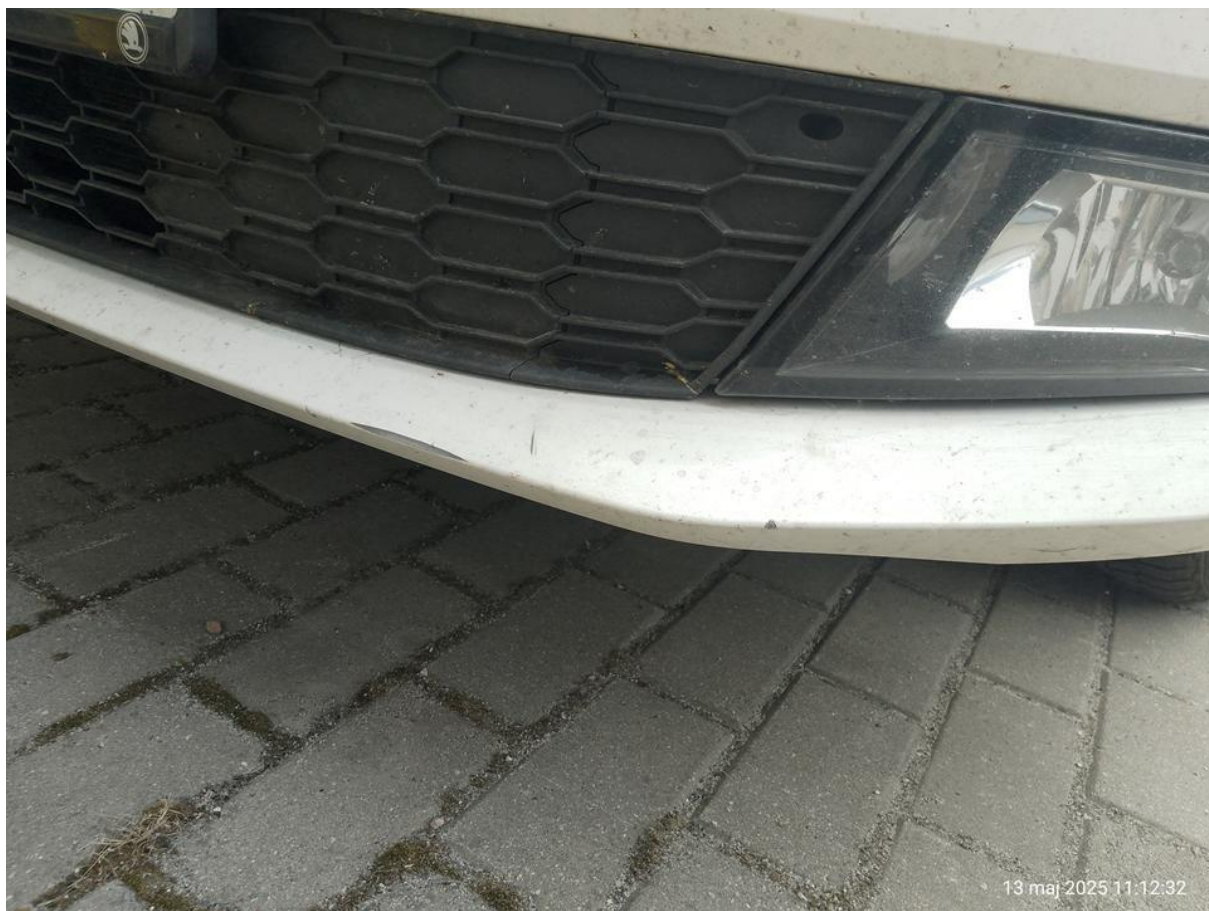
Fot. nr 32