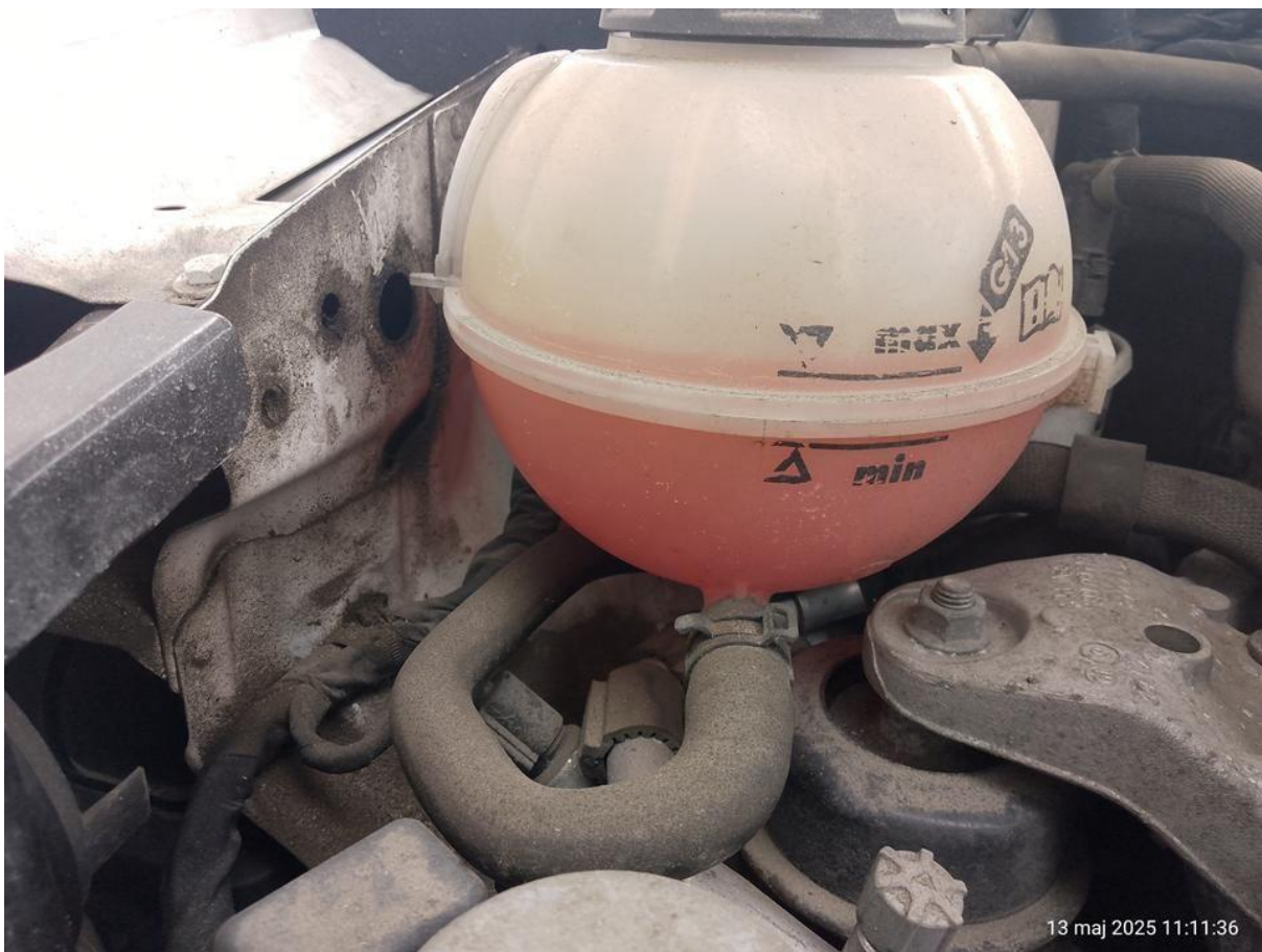
Fot. nr 10