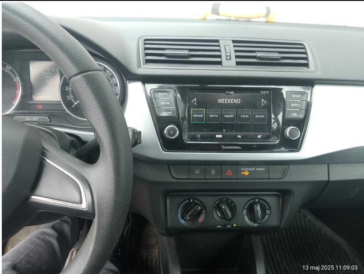
Fot. nr 17