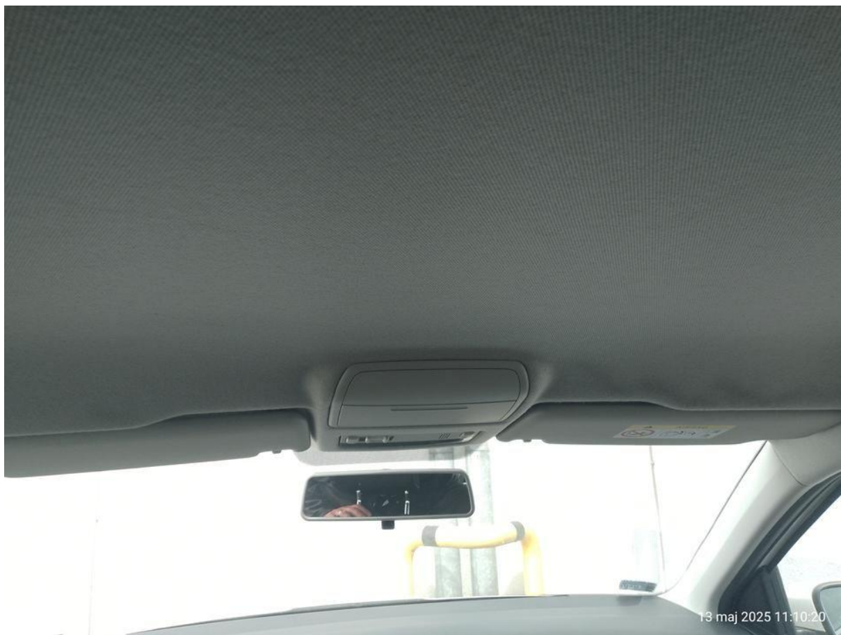
Fot. nr 24