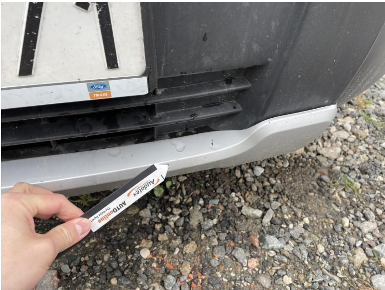
Fot. nr 69