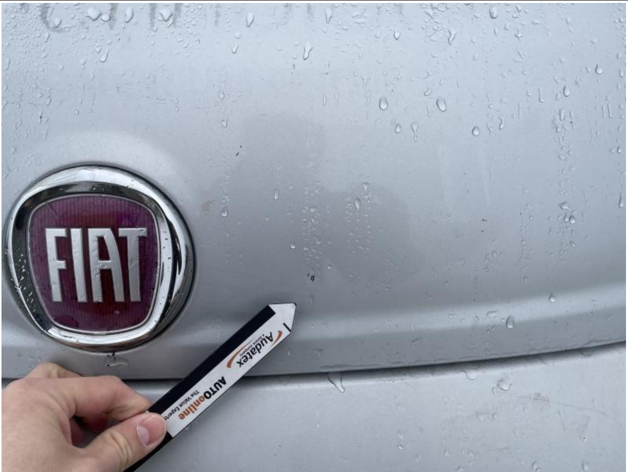
Fot. nr 67