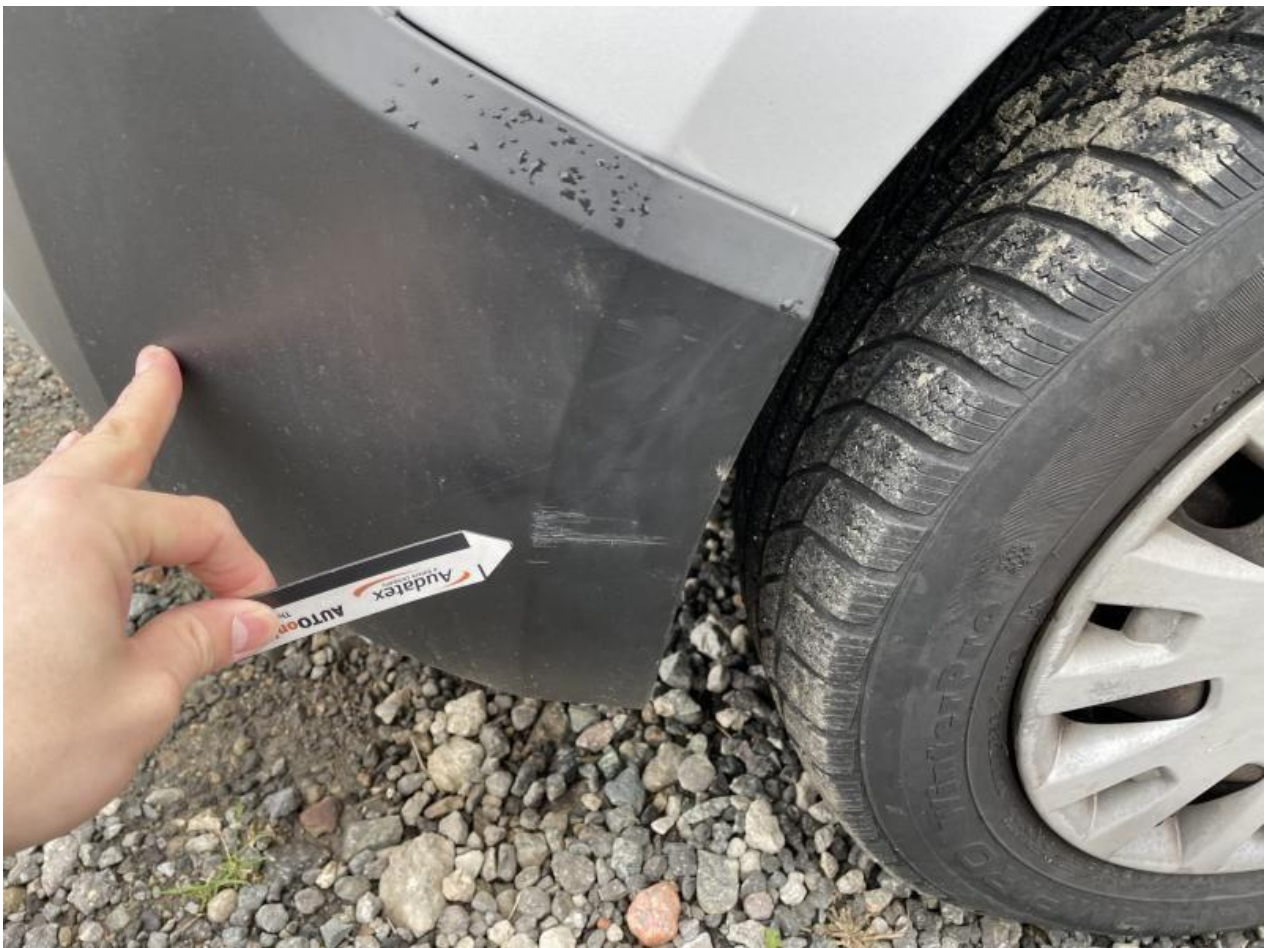
Fot. nr 60