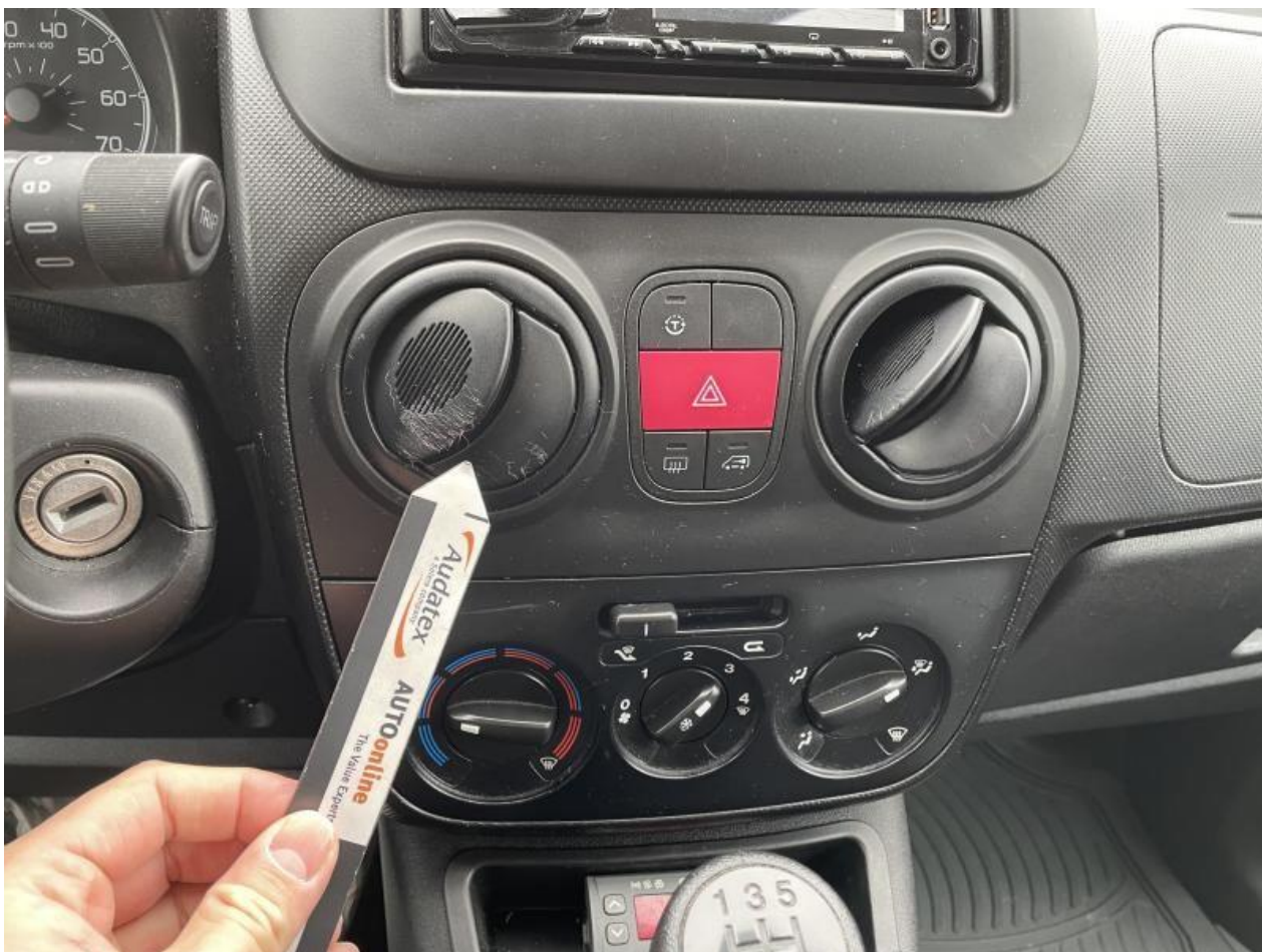
Fot. nr 54