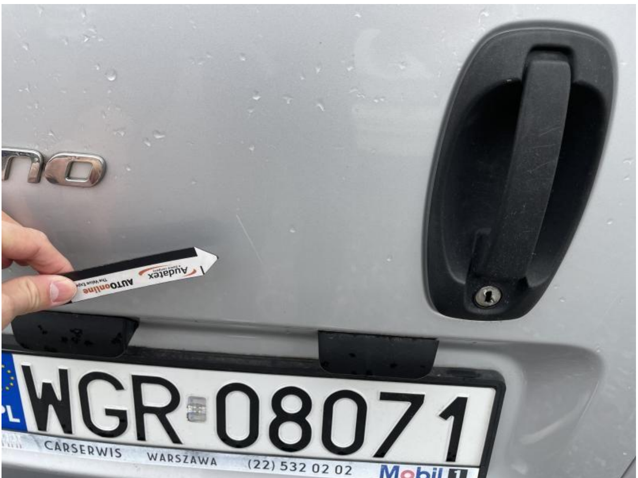
Fot. nr 62