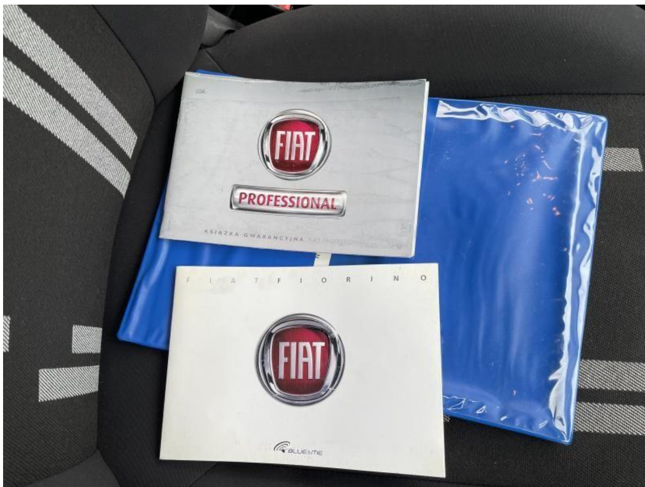
Fot. nr 76