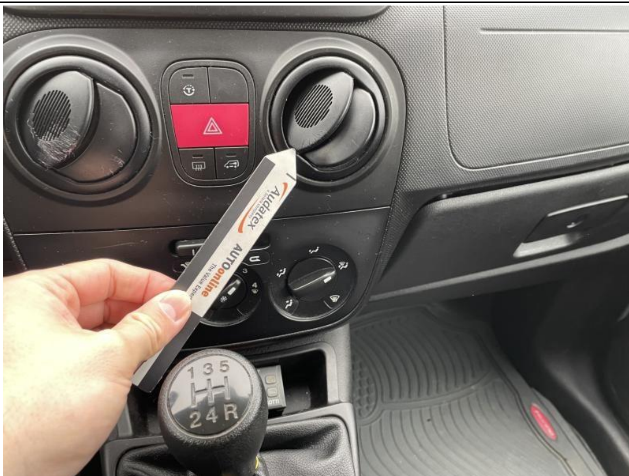
Fot. nr 55