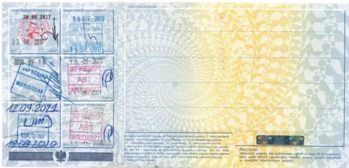
Fot. nr 75