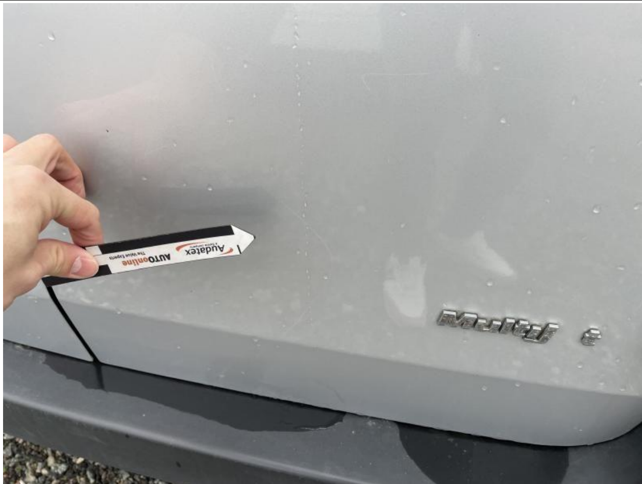
Fot. nr 63