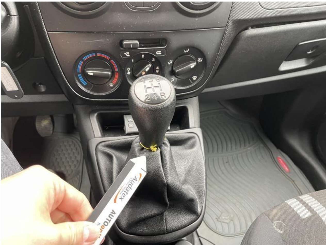
Fot. nr 57