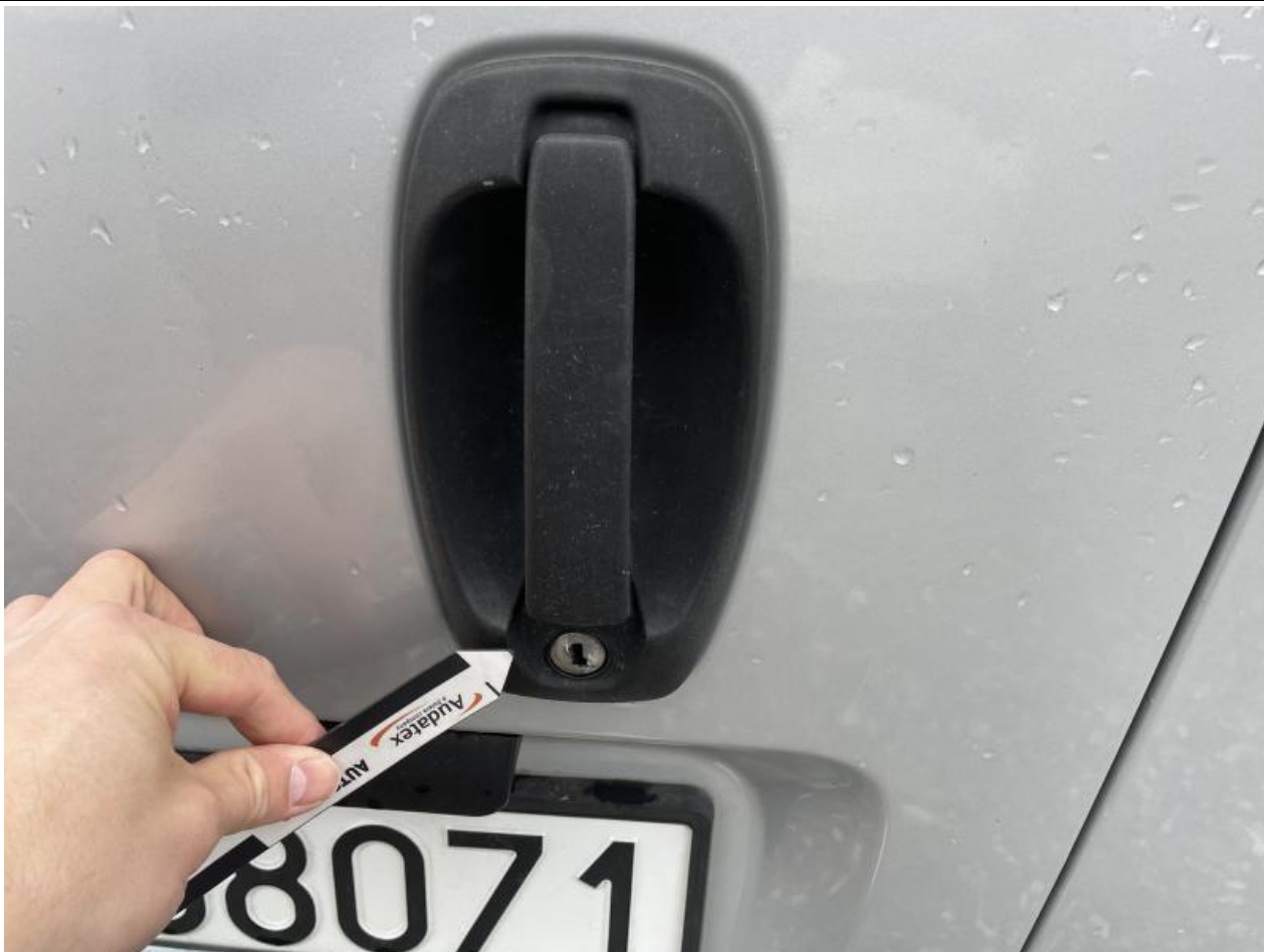
Fot. nr 71