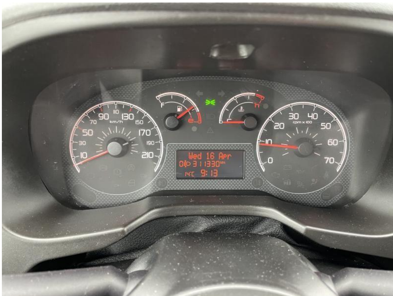
Fot. nr 56