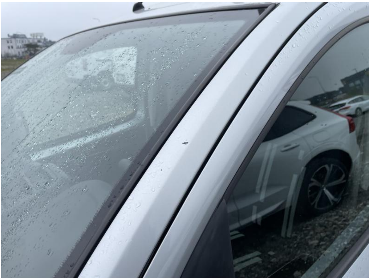
Fot. nr 72