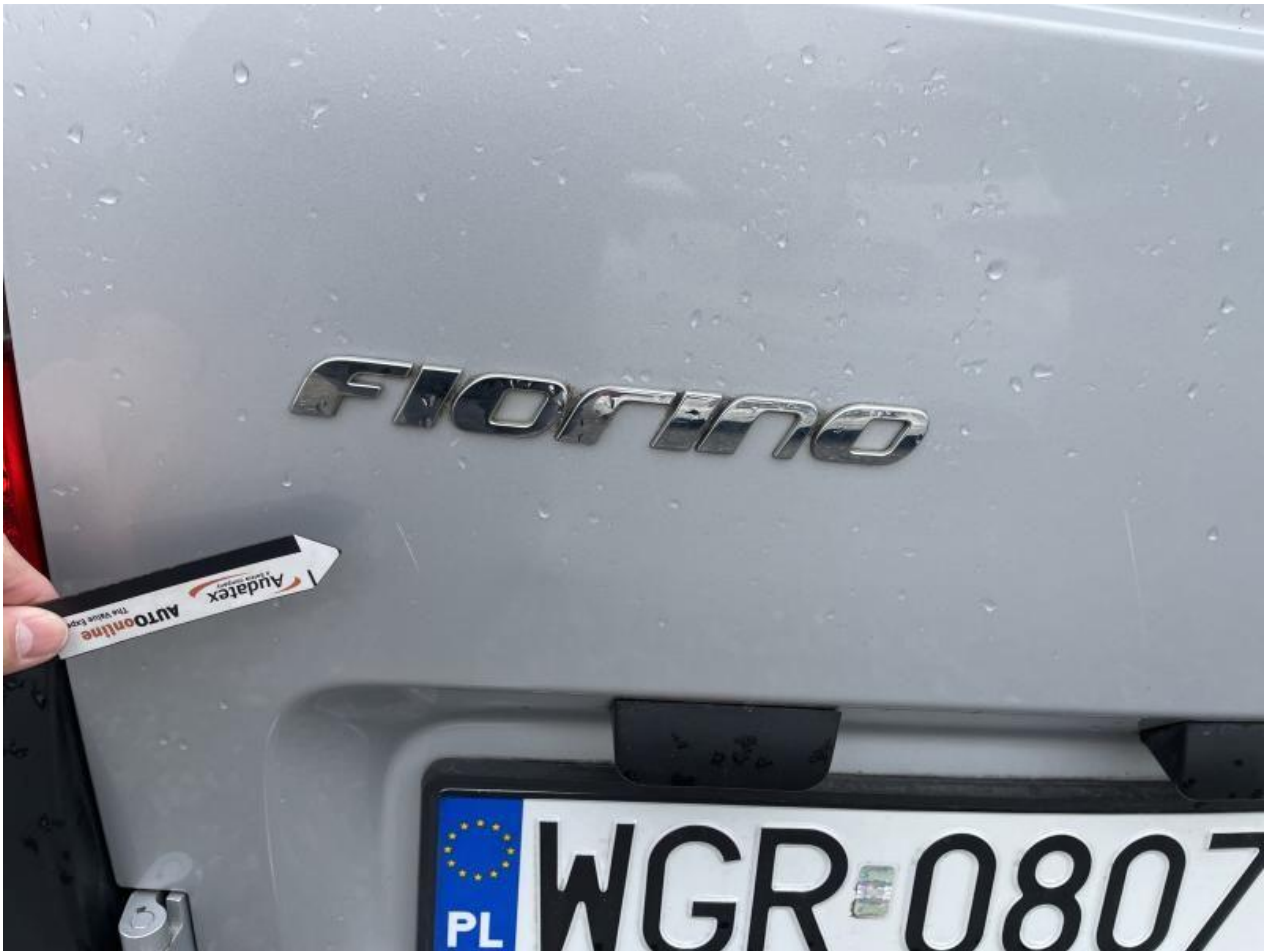
Fot. nr 61