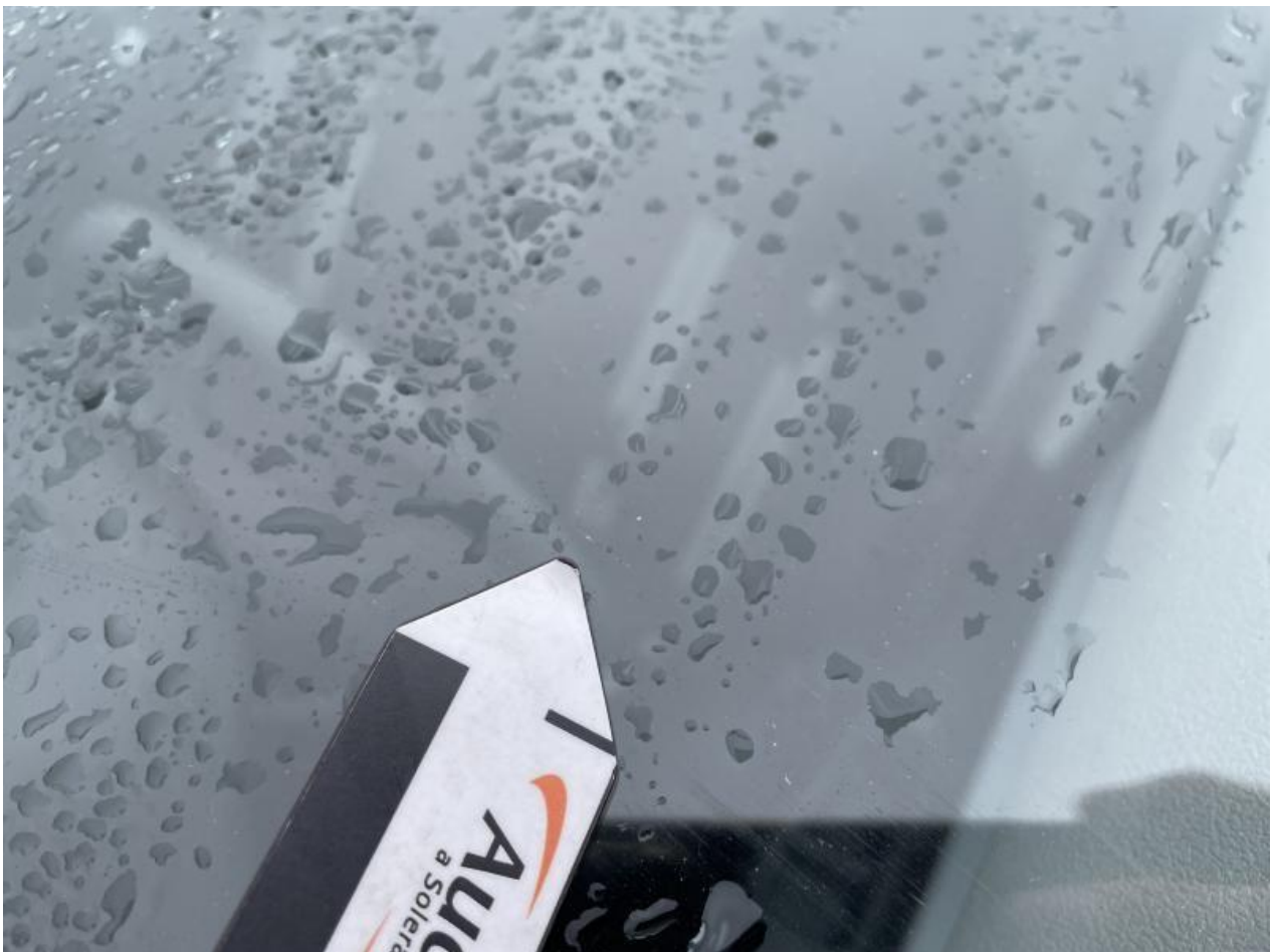
Fot. nr 58