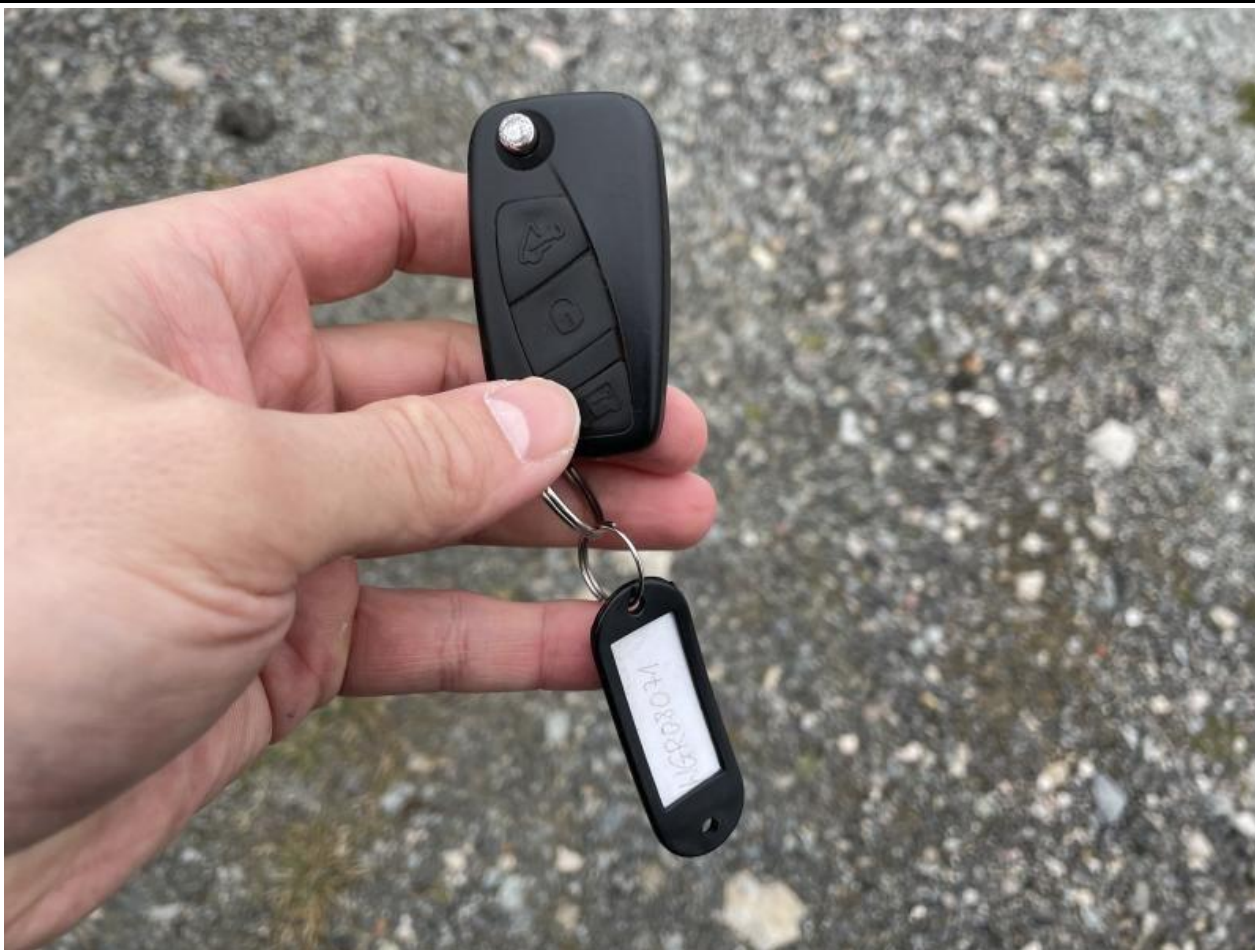
Fot. nr 73