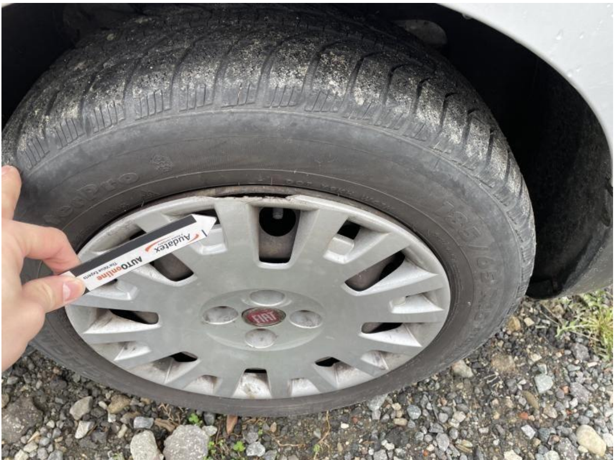
Fot. nr 66