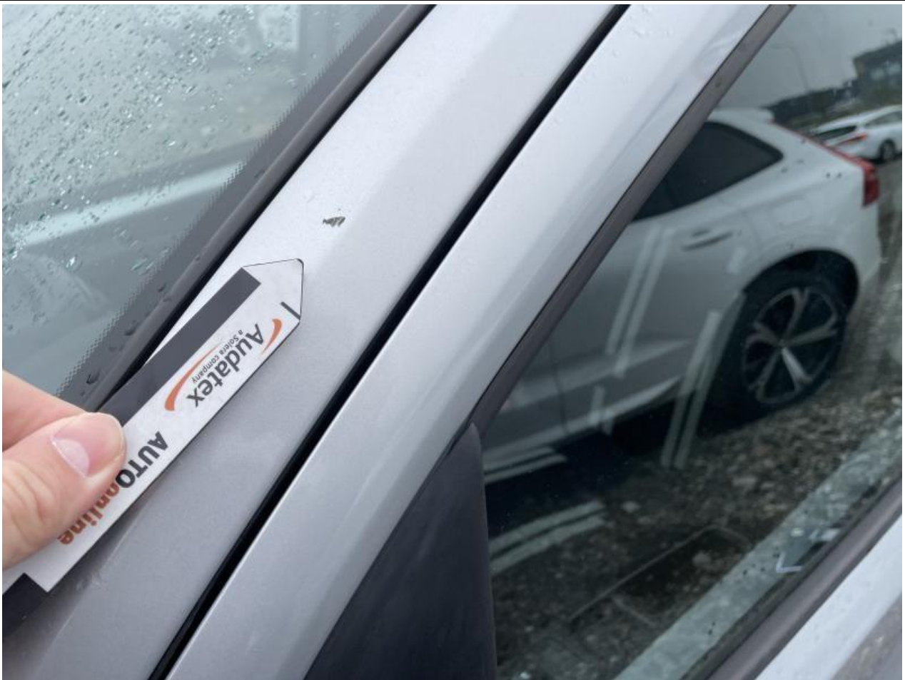
Fot. nr 59