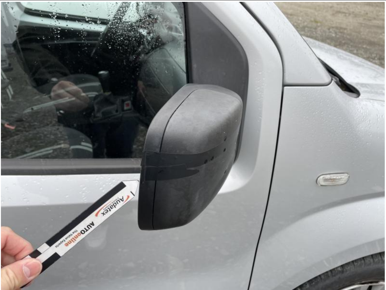
Fot. nr 65