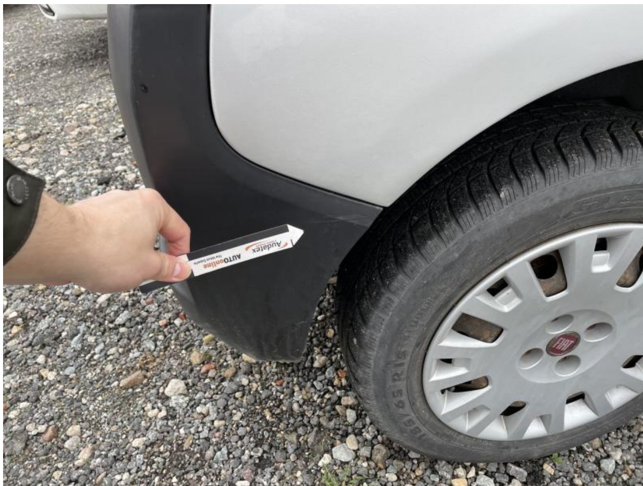
Fot. nr 64