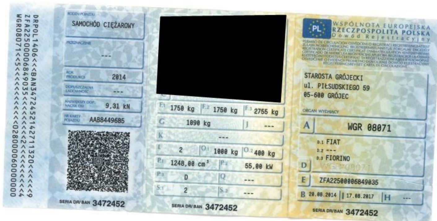
Fot. nr 74