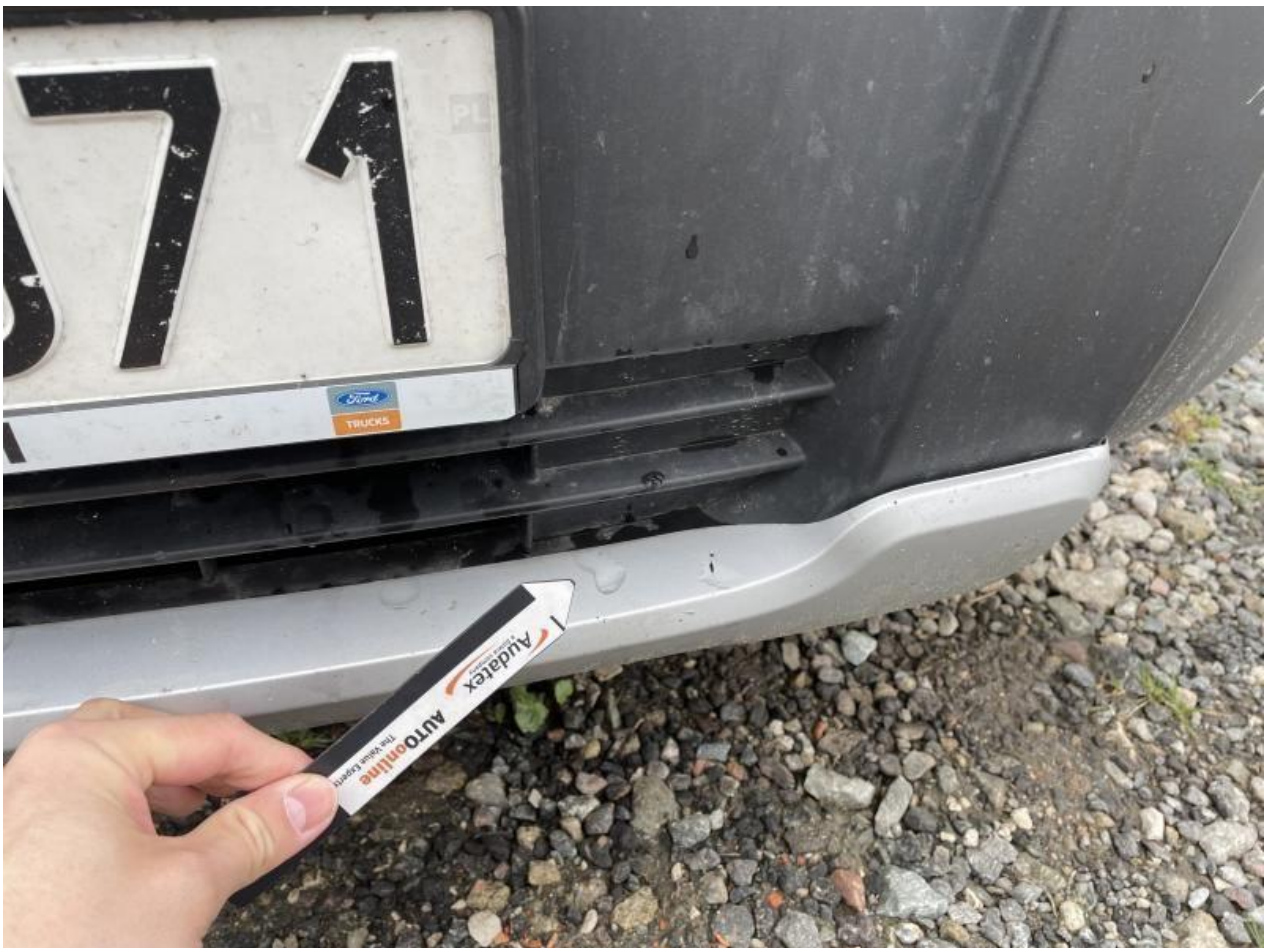
Fot. nr 68