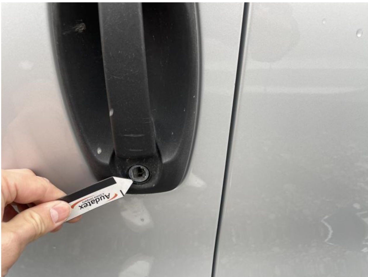
Fot. nr 70