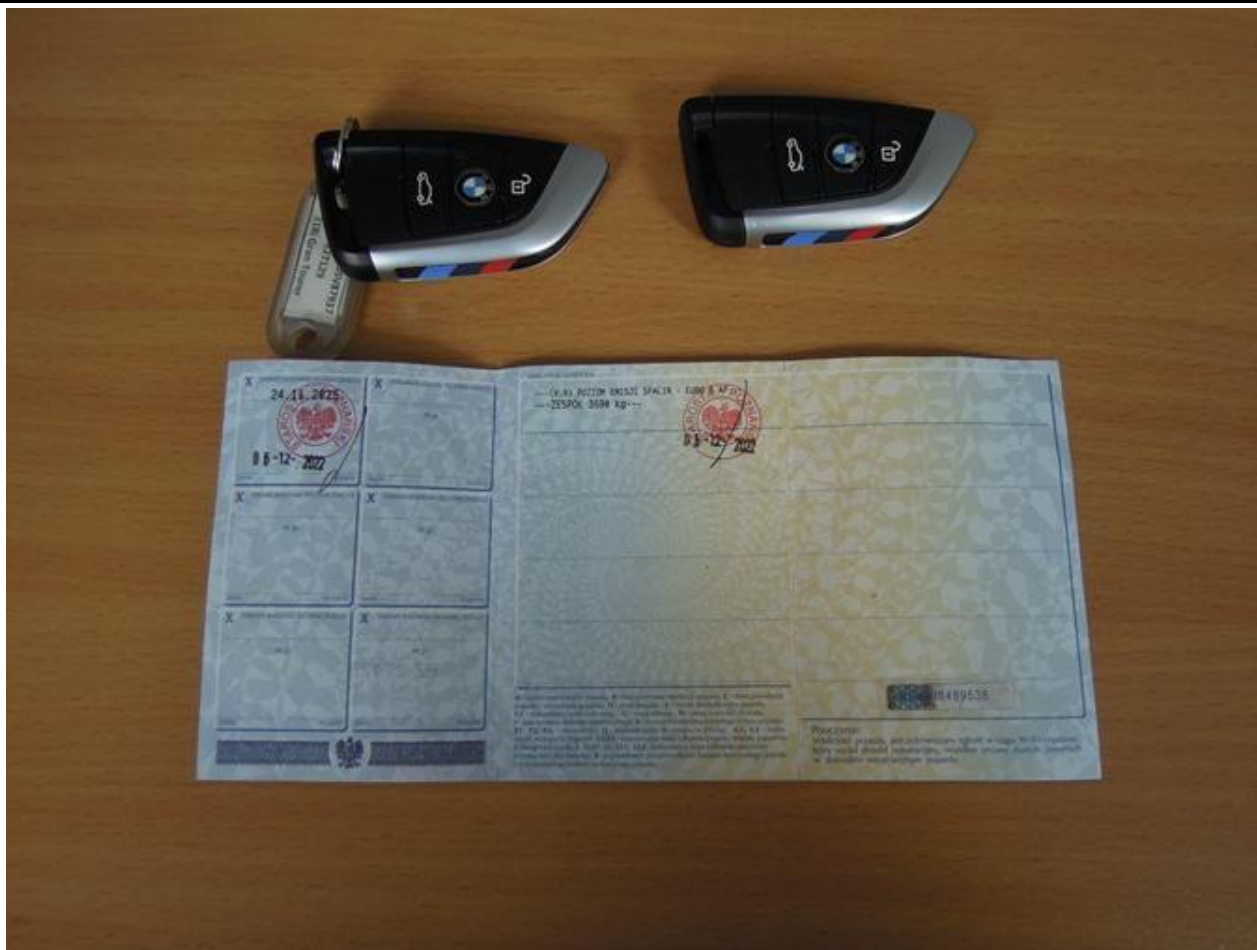
Fot. nr 73

Dokument wystawiony elektronicznie, wa ny bez podpisu