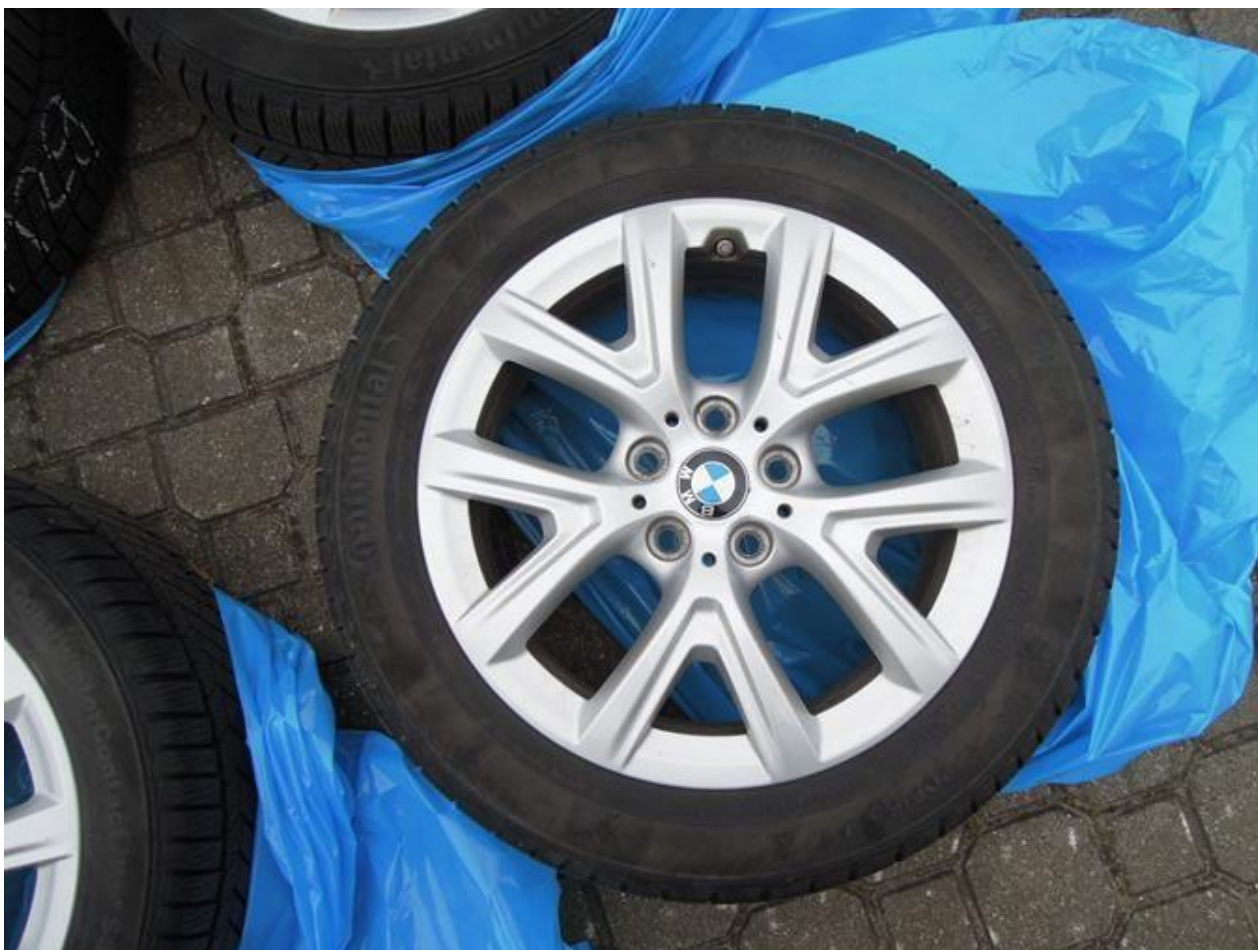
Fot. nr 66