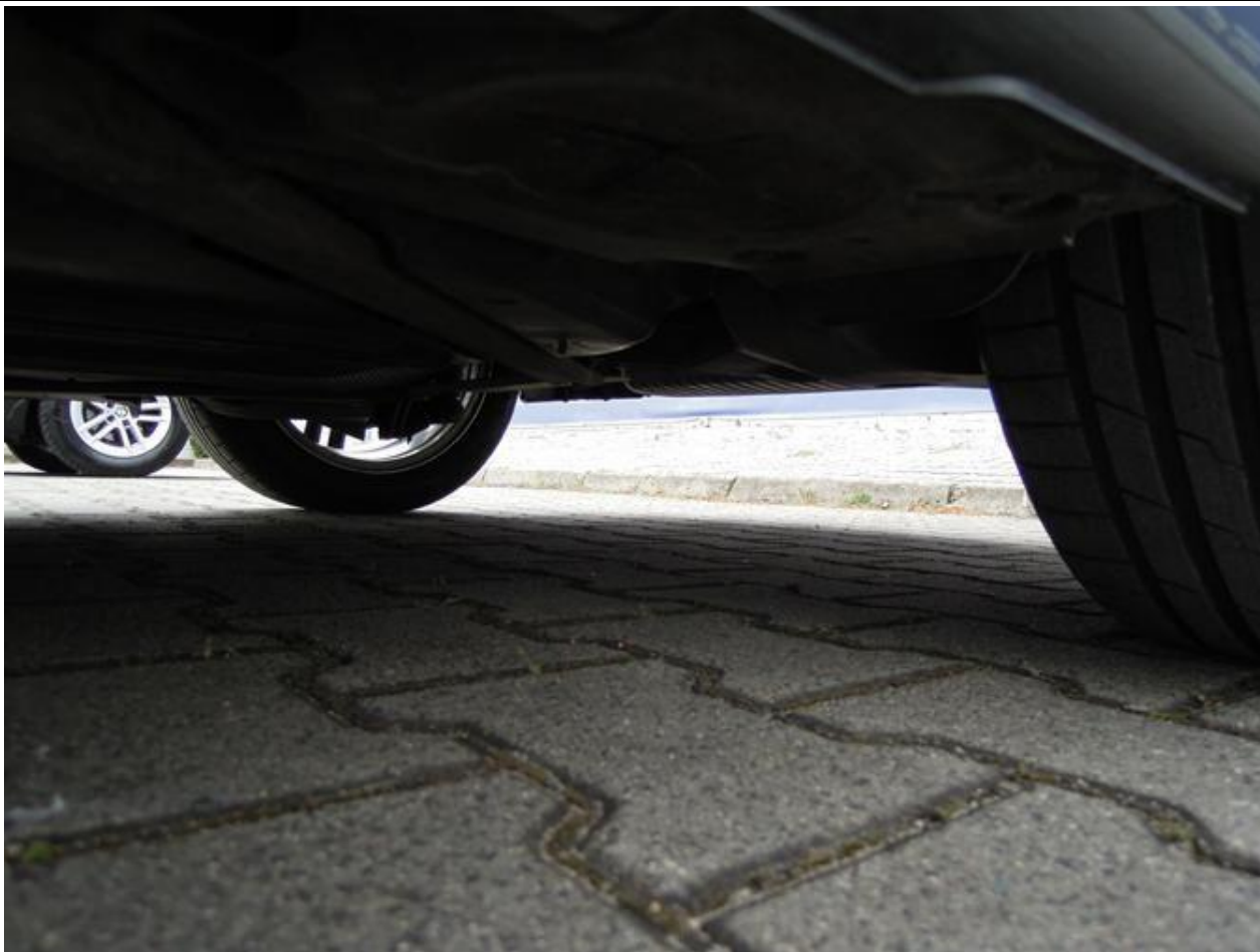
Fot. nr 61