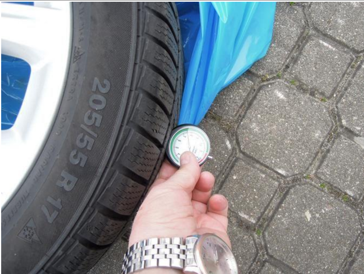
Fot. nr 67