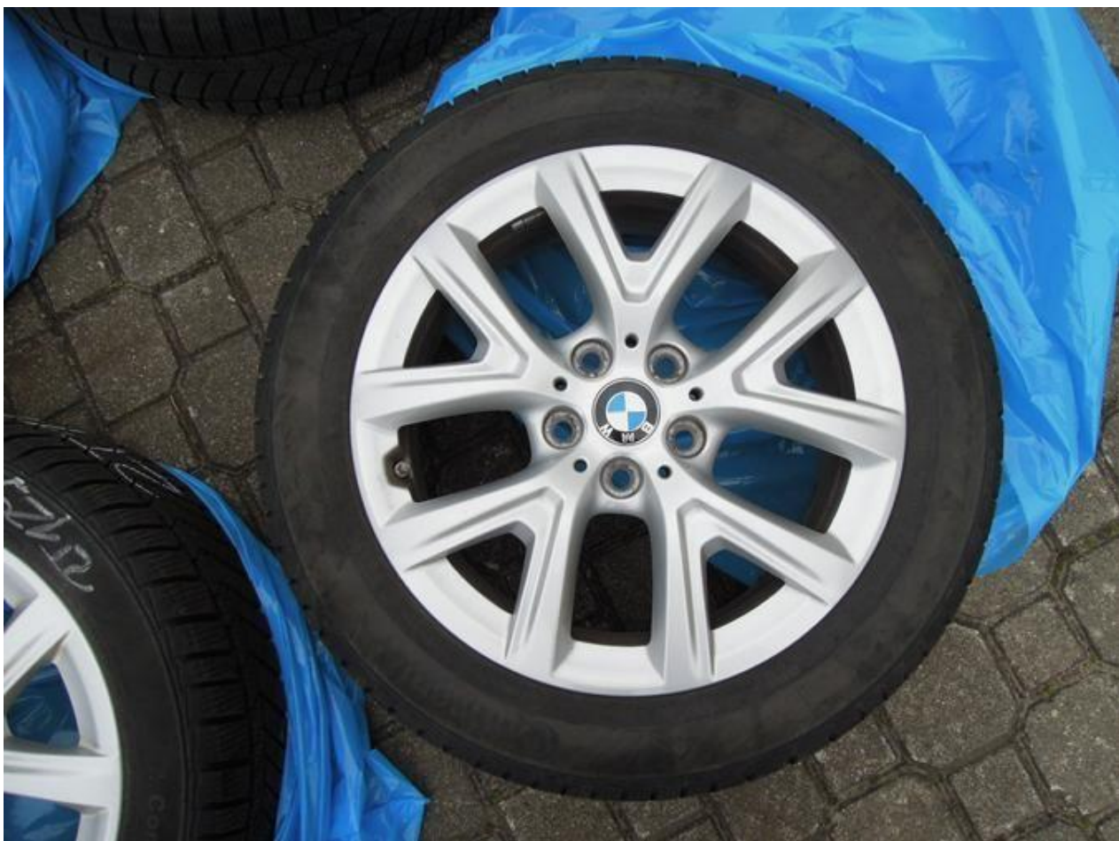
Fot. nr 64