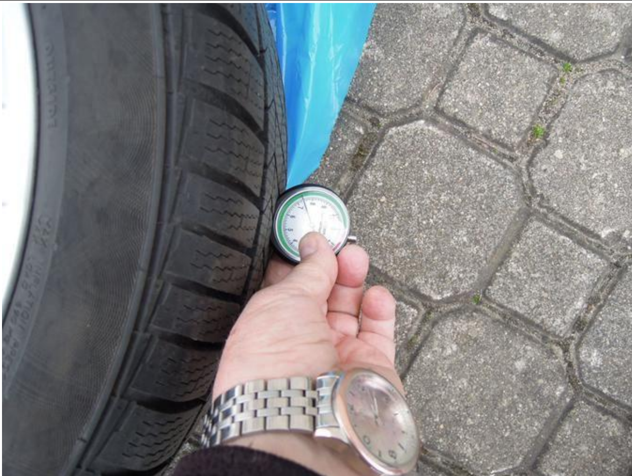
Fot. nr 65