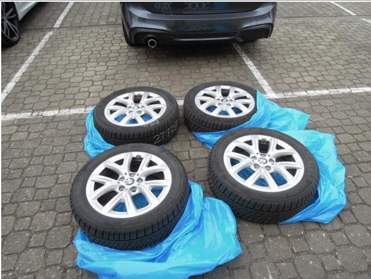
Fot. nr 63