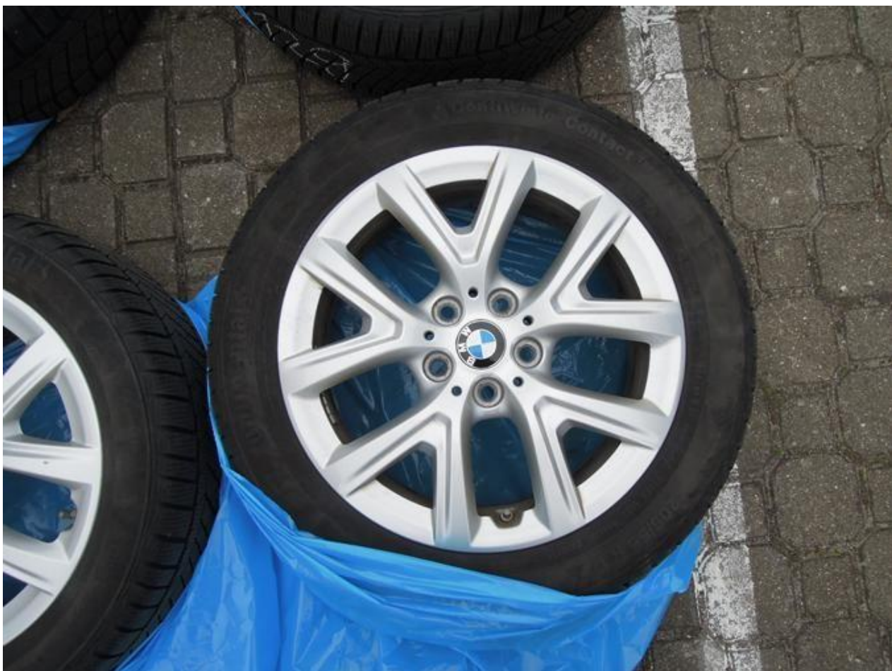
Fot. nr 68