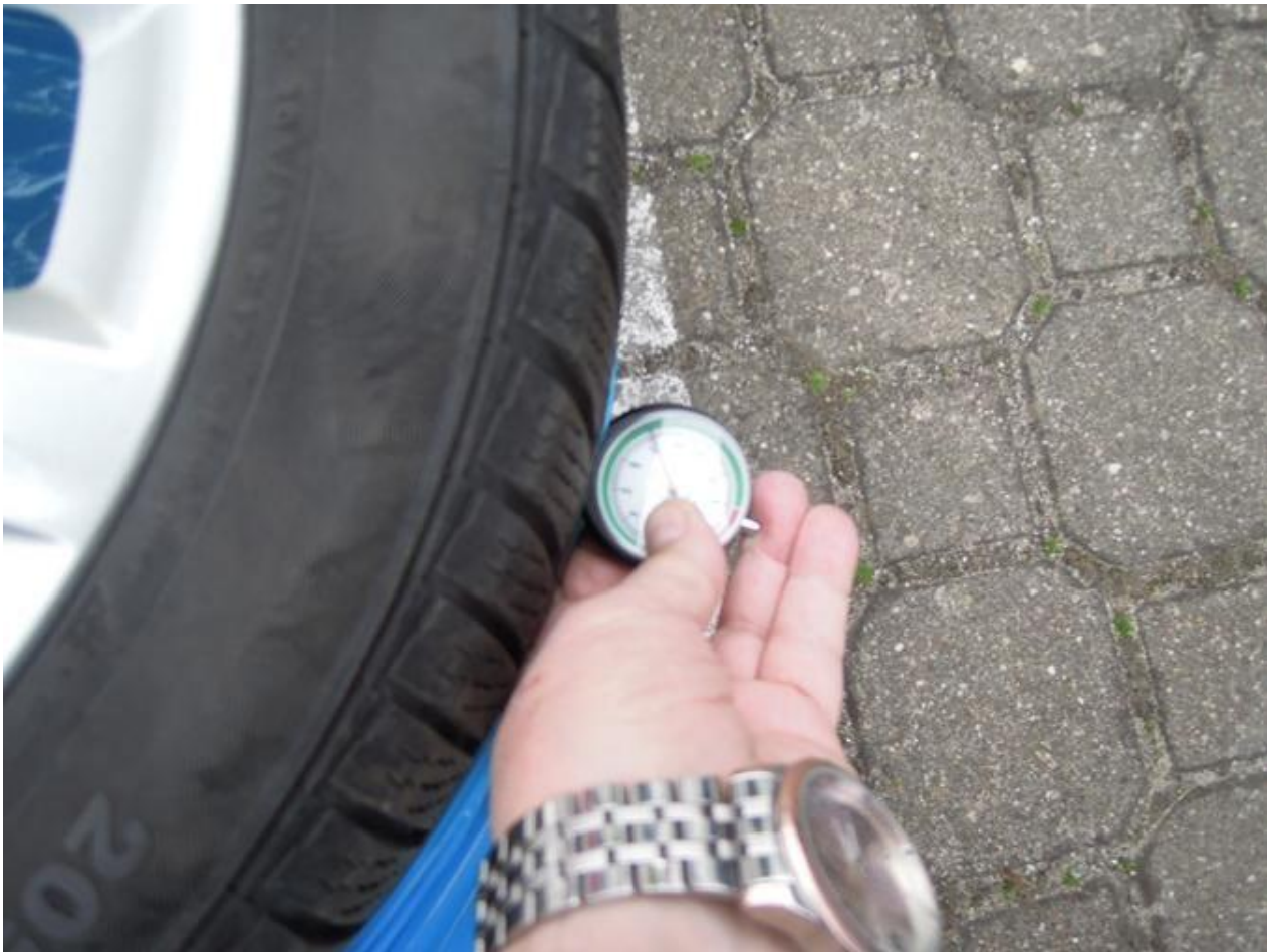
Fot. nr 69