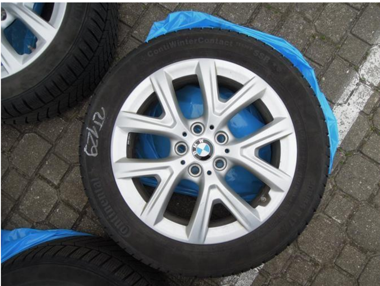
Fot. nr 70