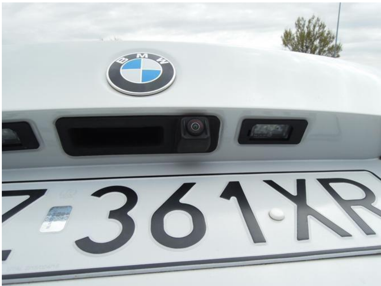
Fot. nr 20