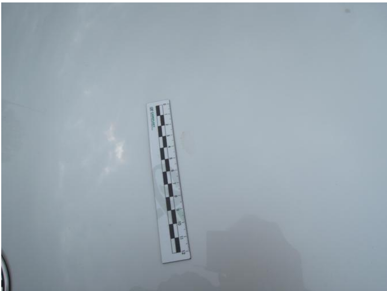
Fot. nr 30