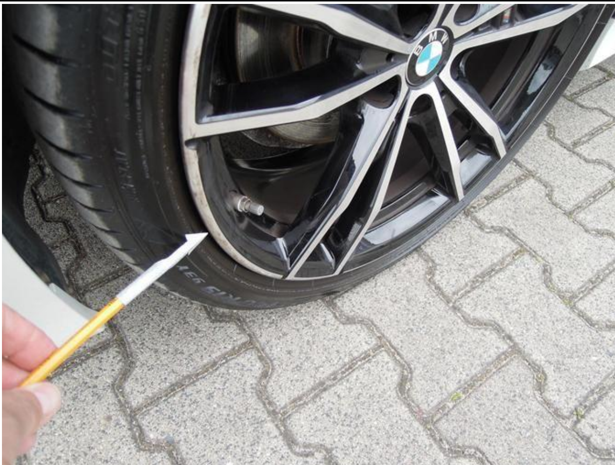
Fot. nr 33