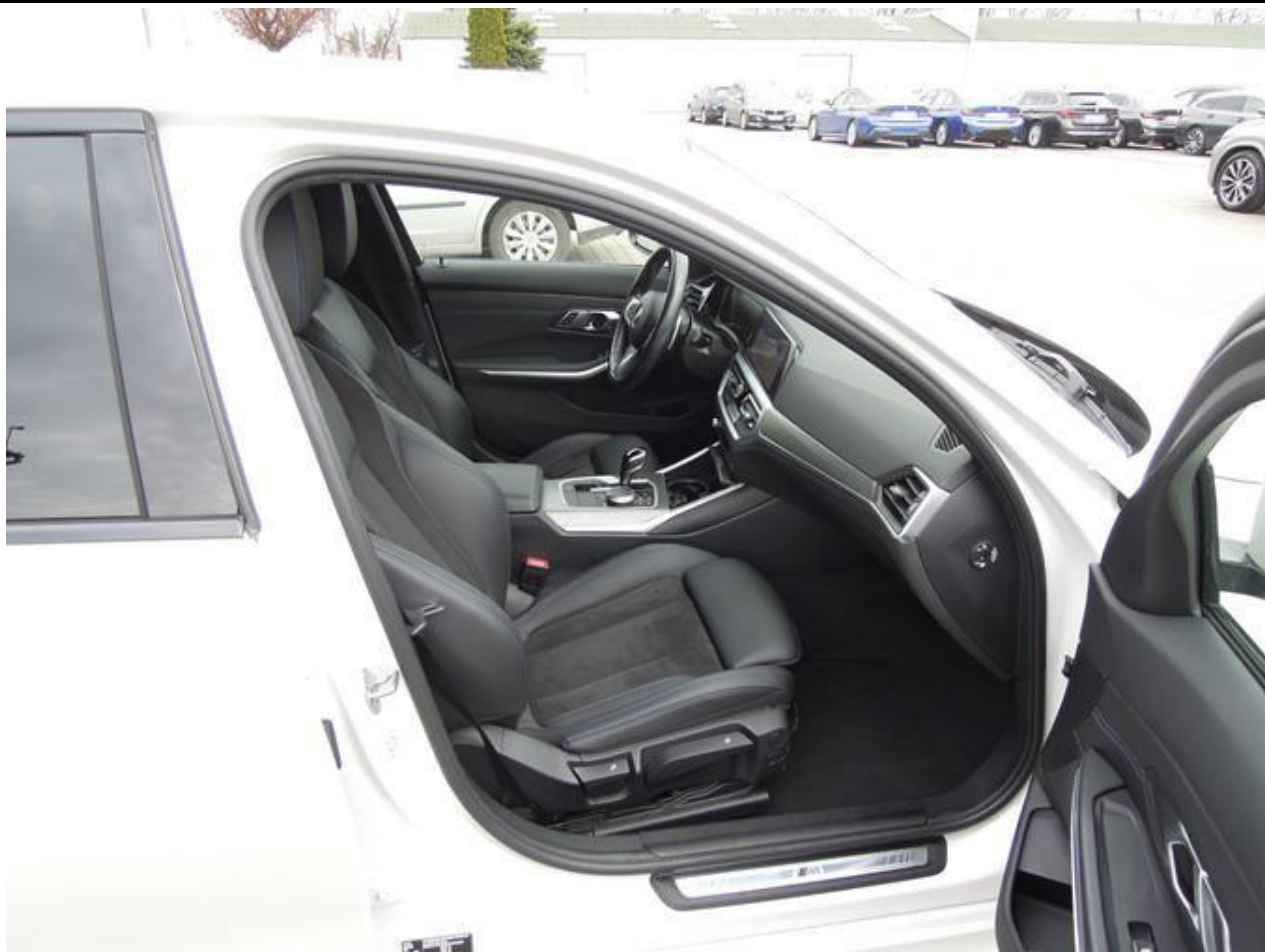
Fot. nr 25