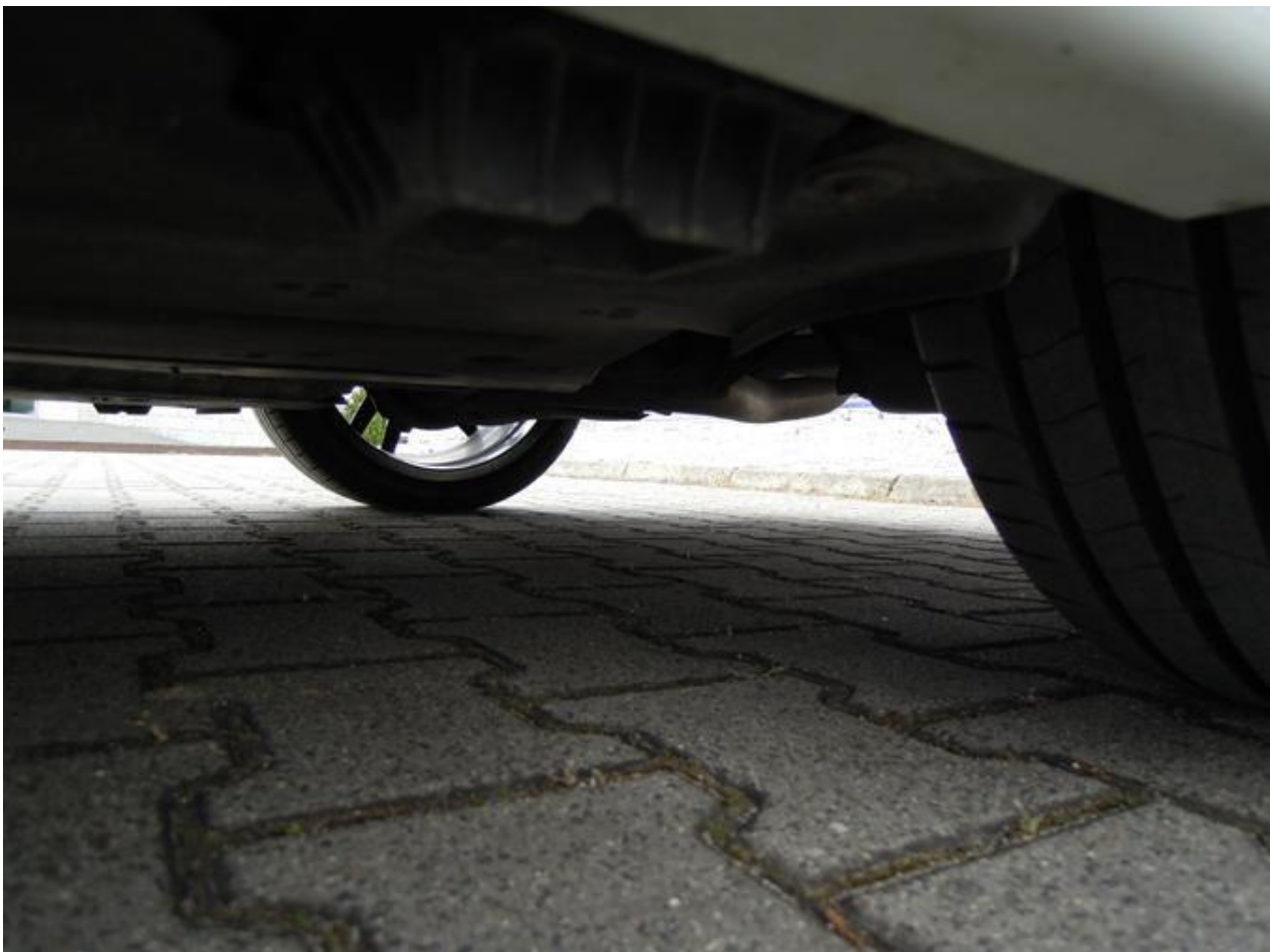
Fot. nr 60