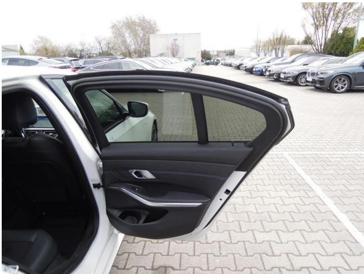
Fot. nr 22