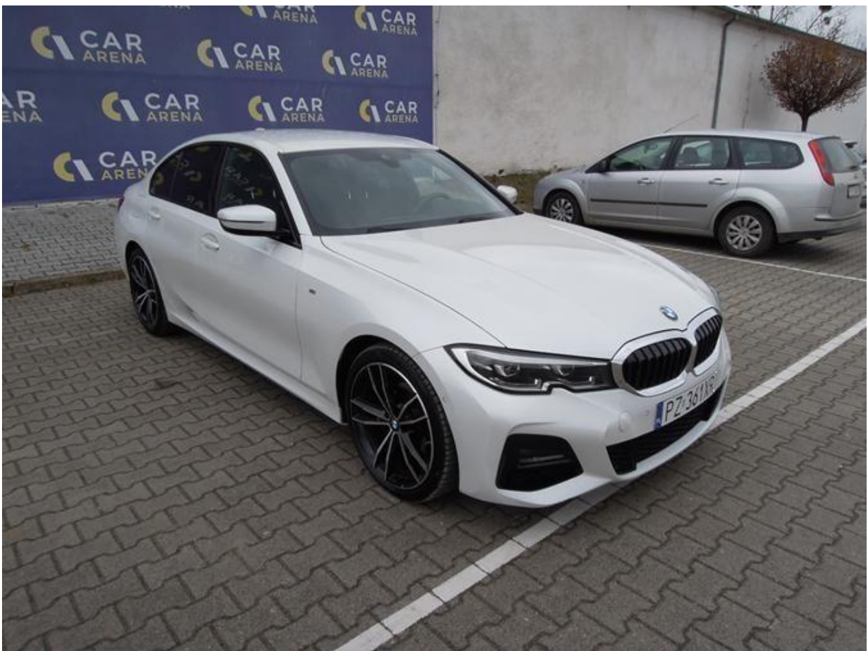
Fot. nr 6