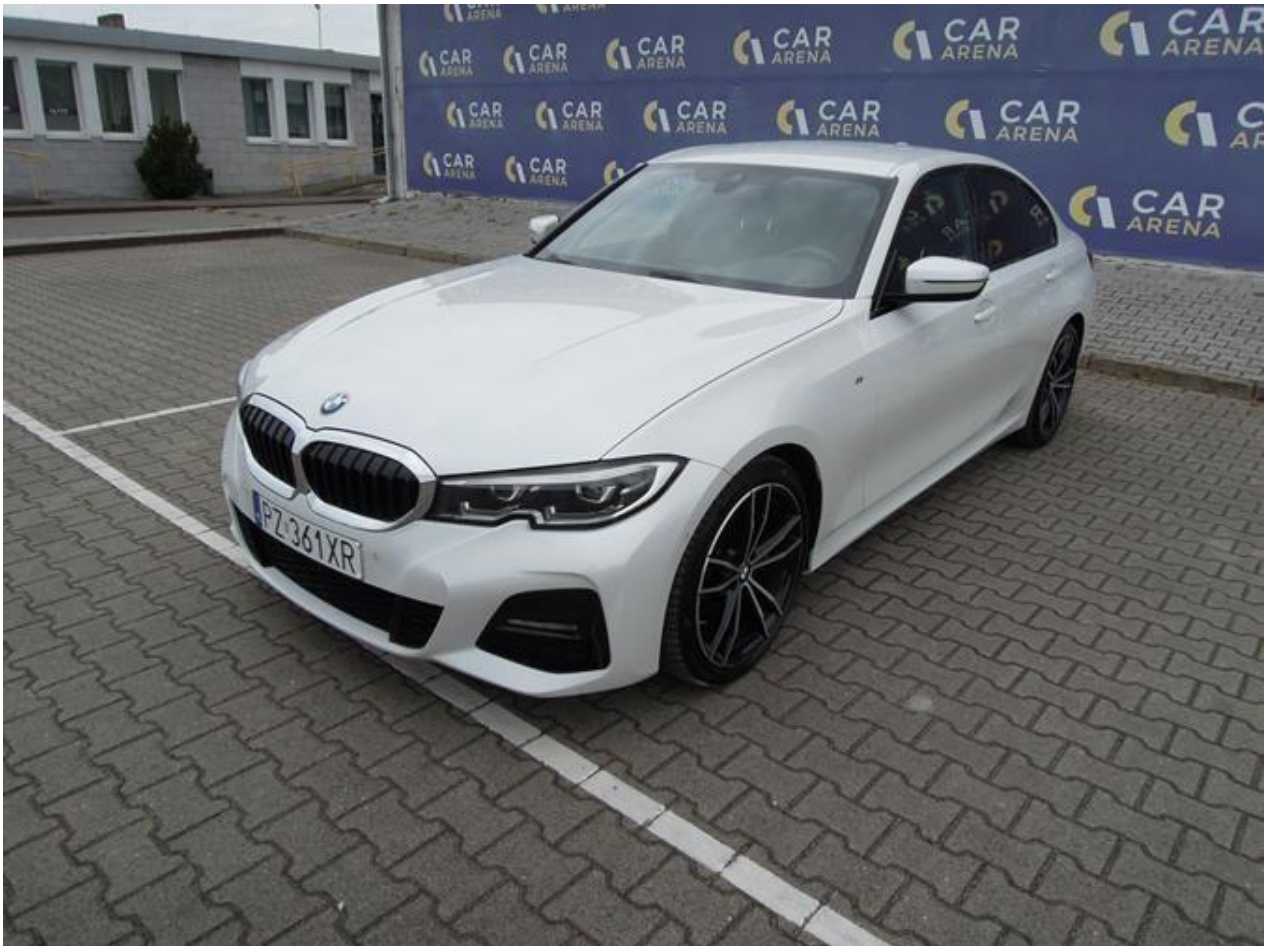
Fot. nr 1