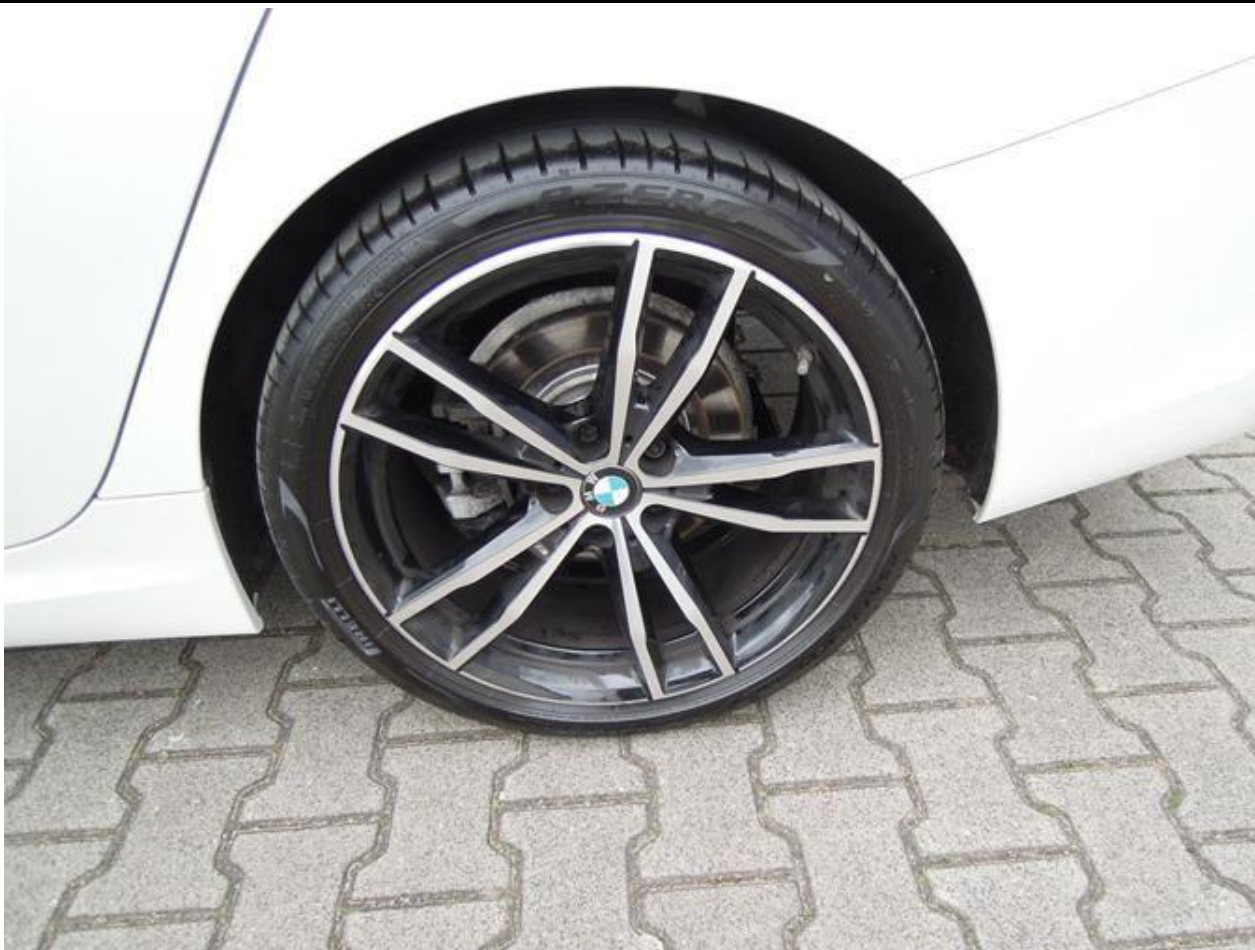
Fot. nr 47