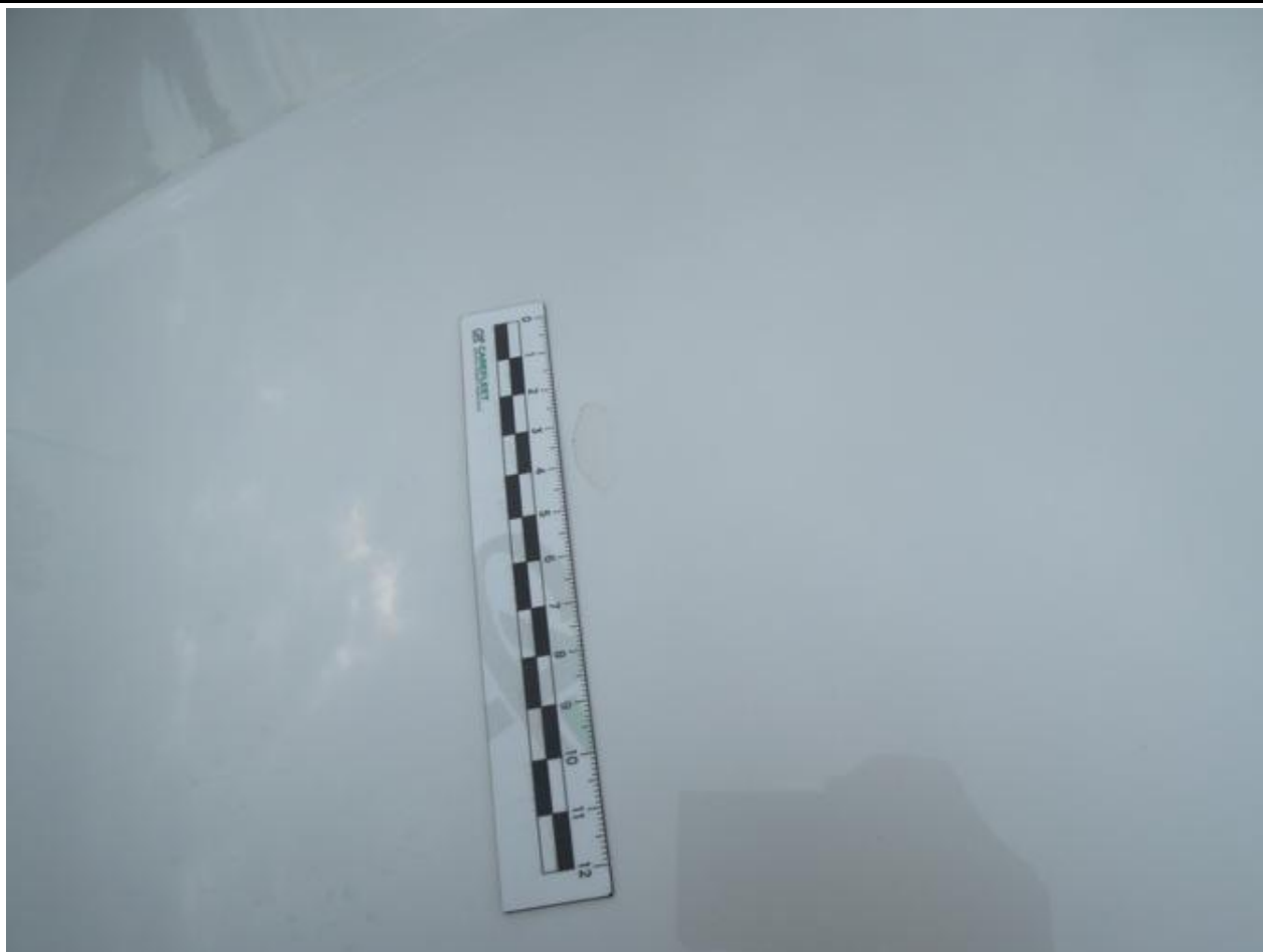
Fot. nr 31