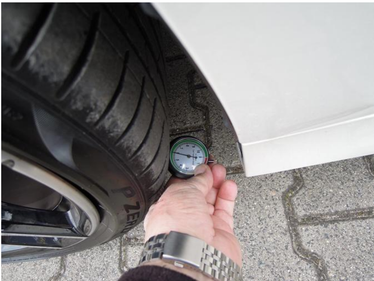
Fot. nr 46