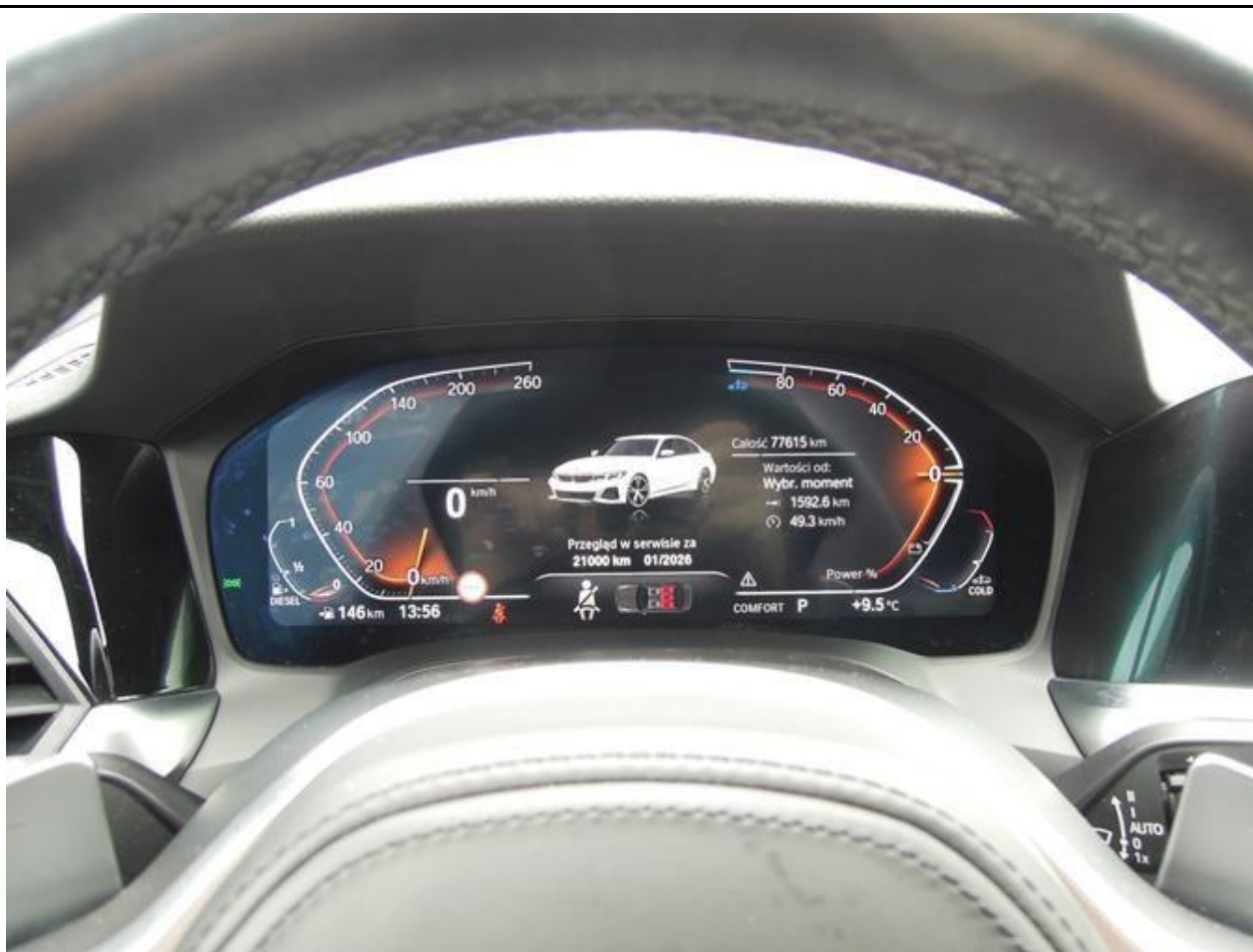
Fot. nr 9