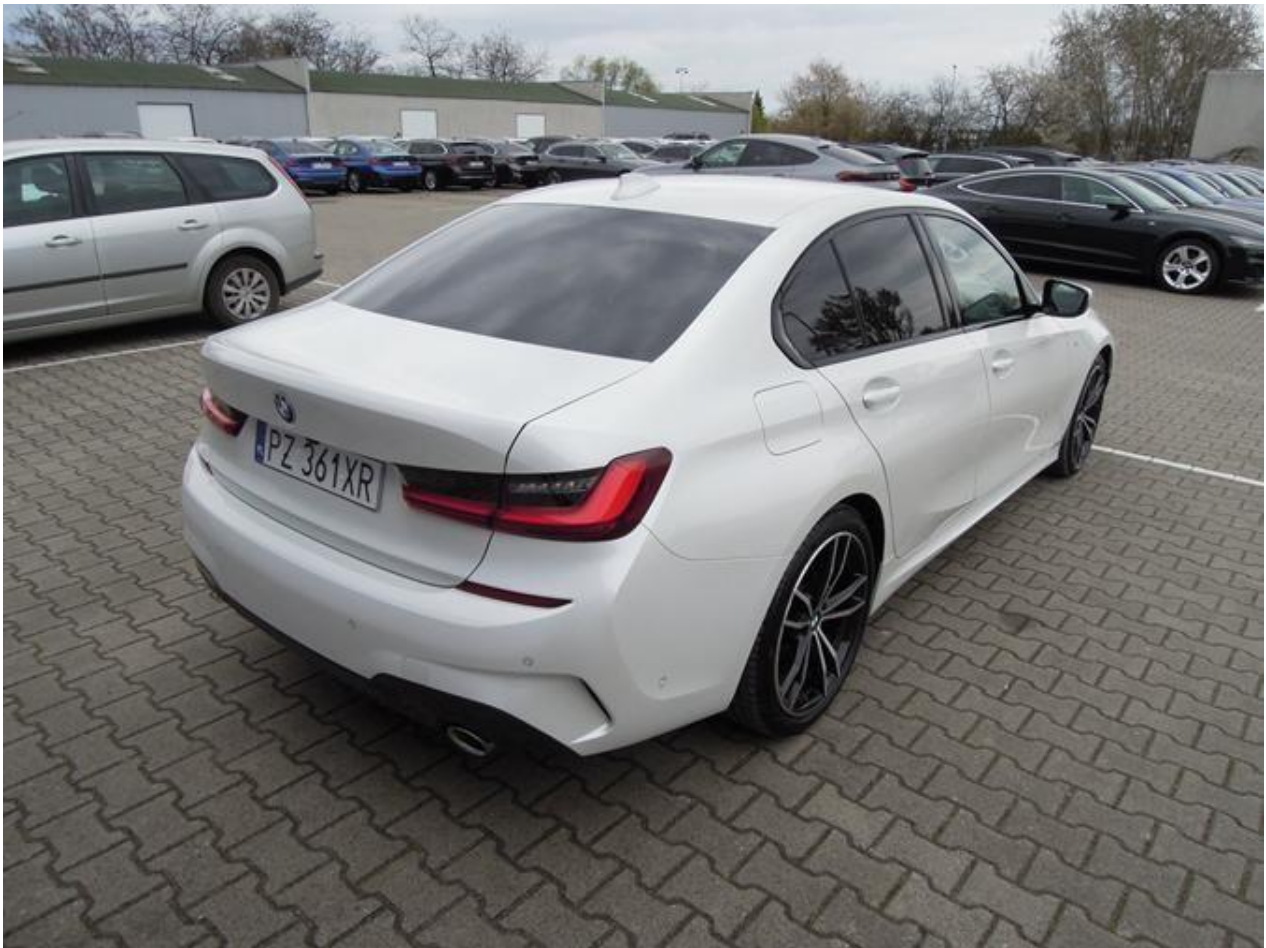
Fot. nr 5