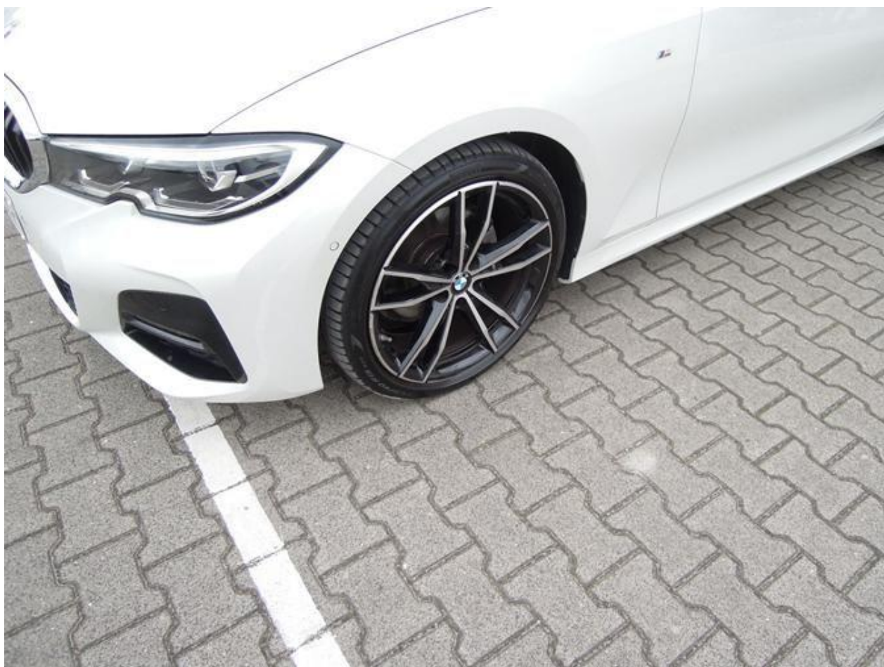
Fot. nr 32