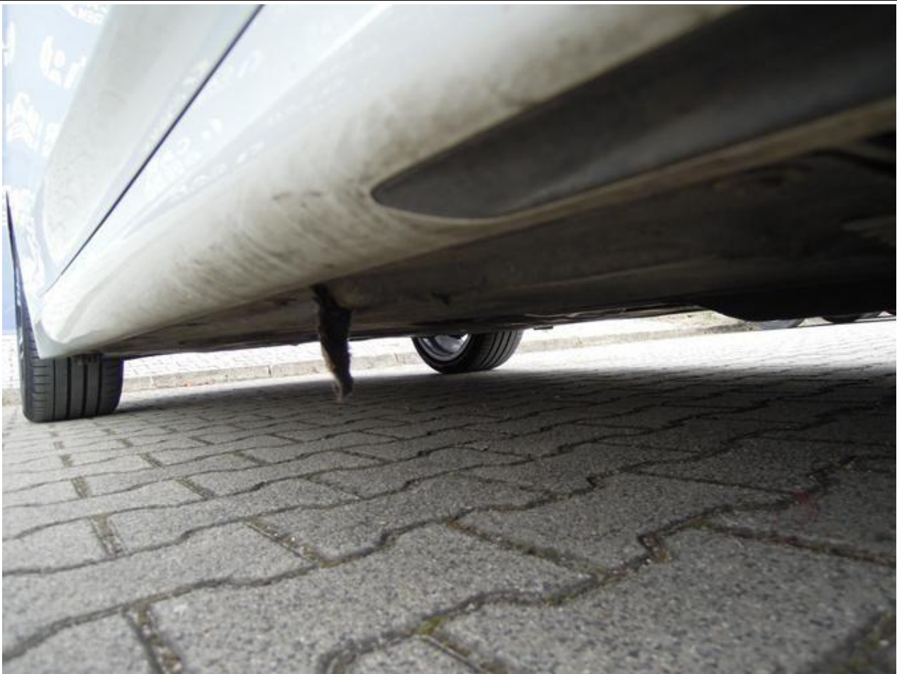
Fot. nr 57