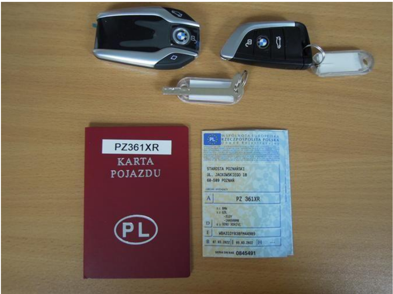
Fot. nr 72