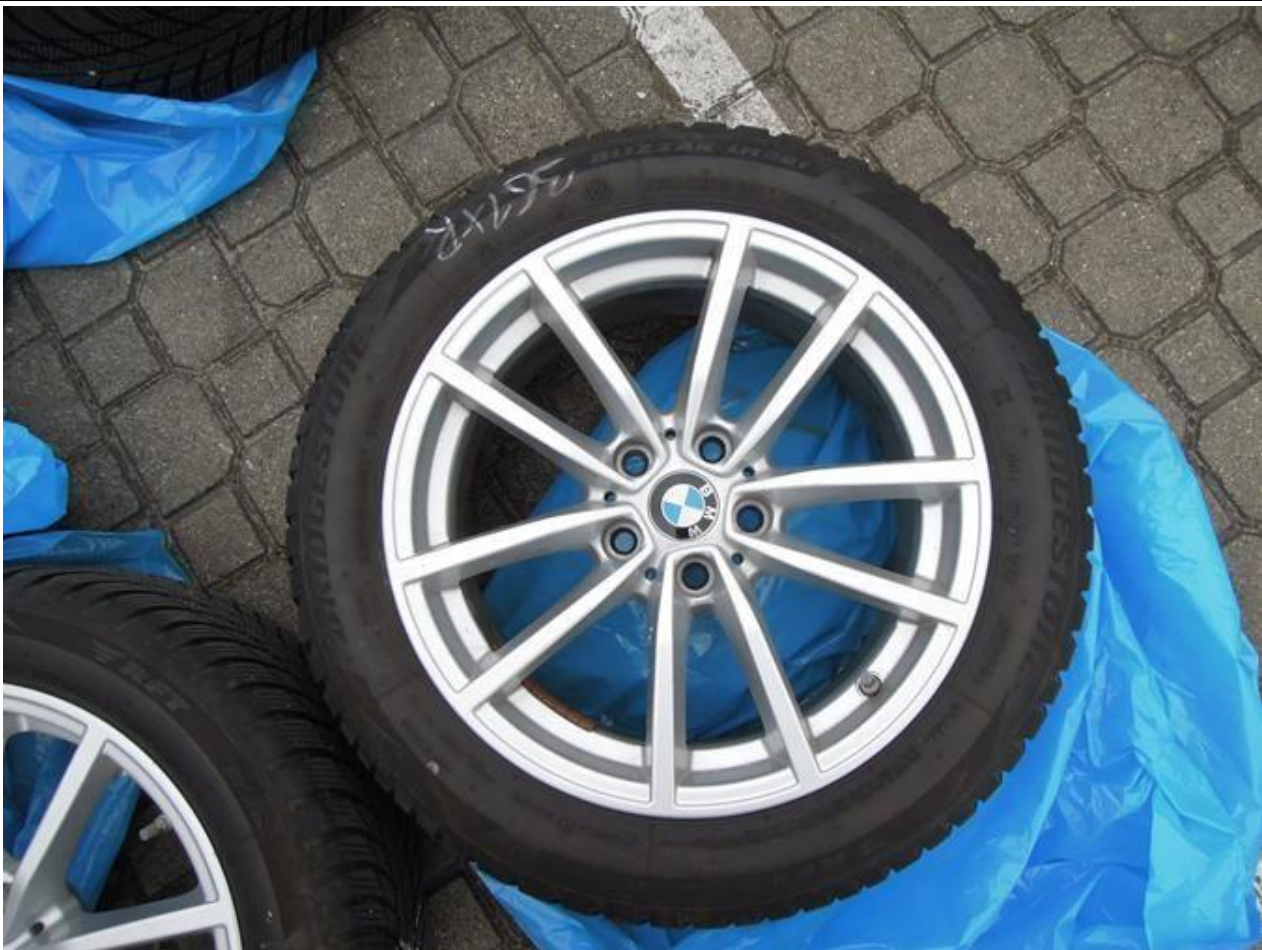
Fot. nr 67