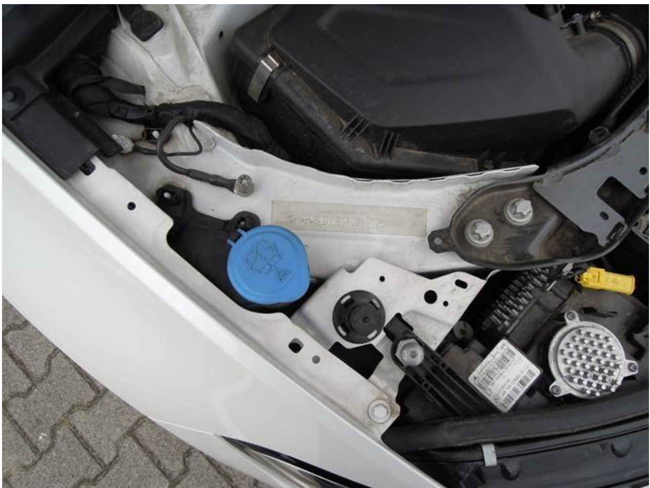
Fot. nr 8