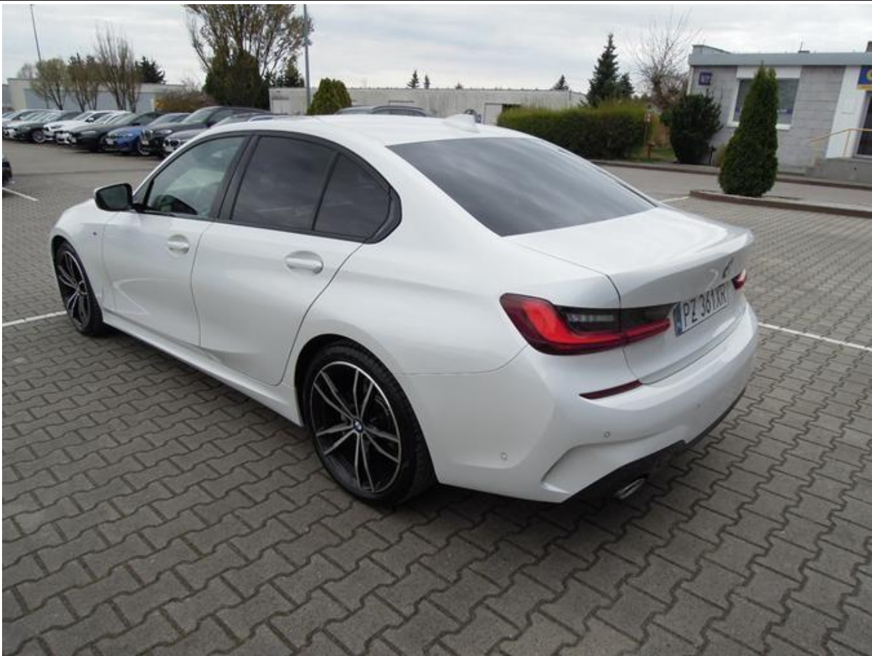
Fot. nr 3