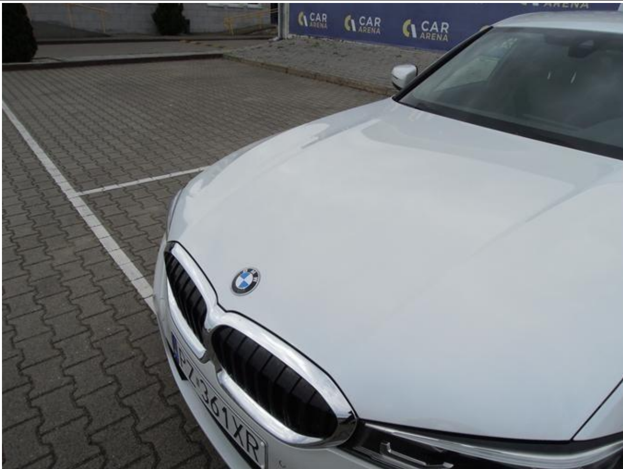
Fot. nr 29