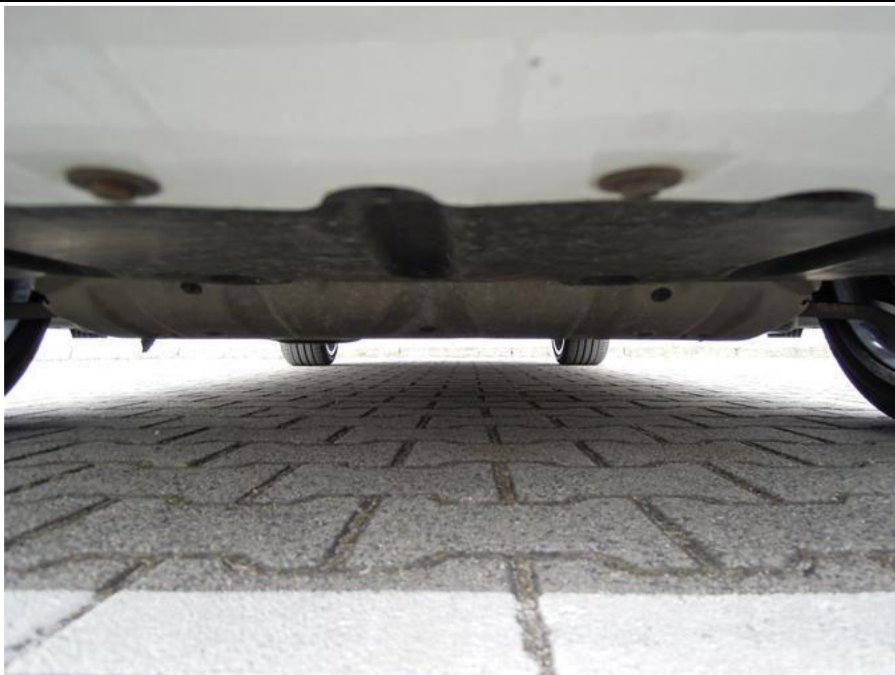
Fot. nr 53