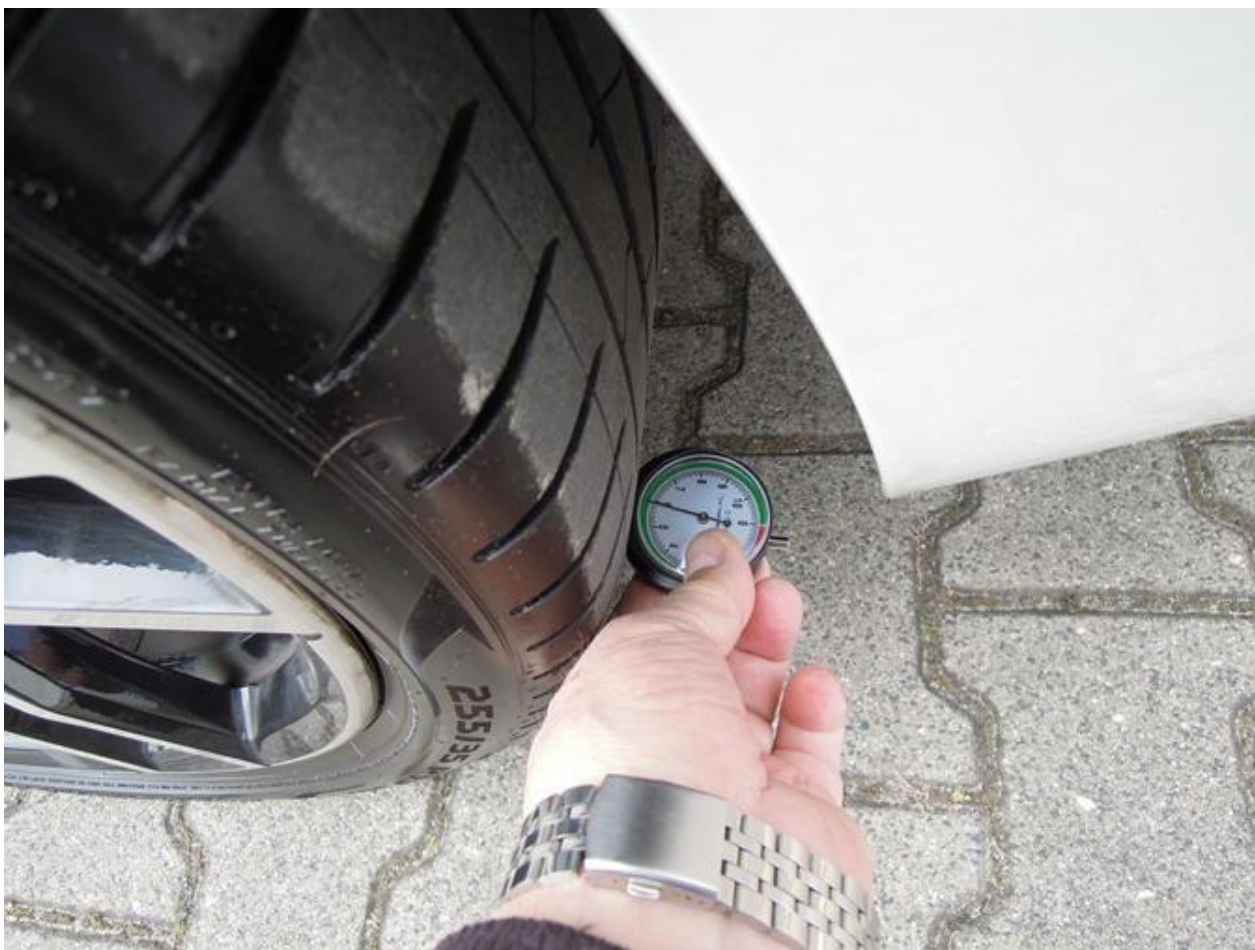
Fot. nr 48