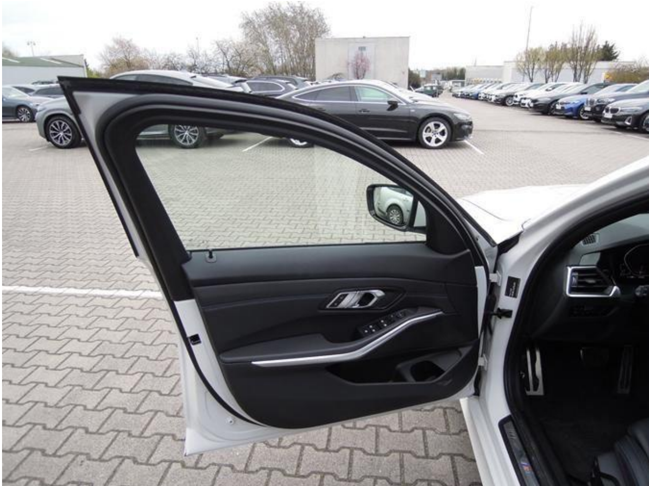
Fot. nr 13