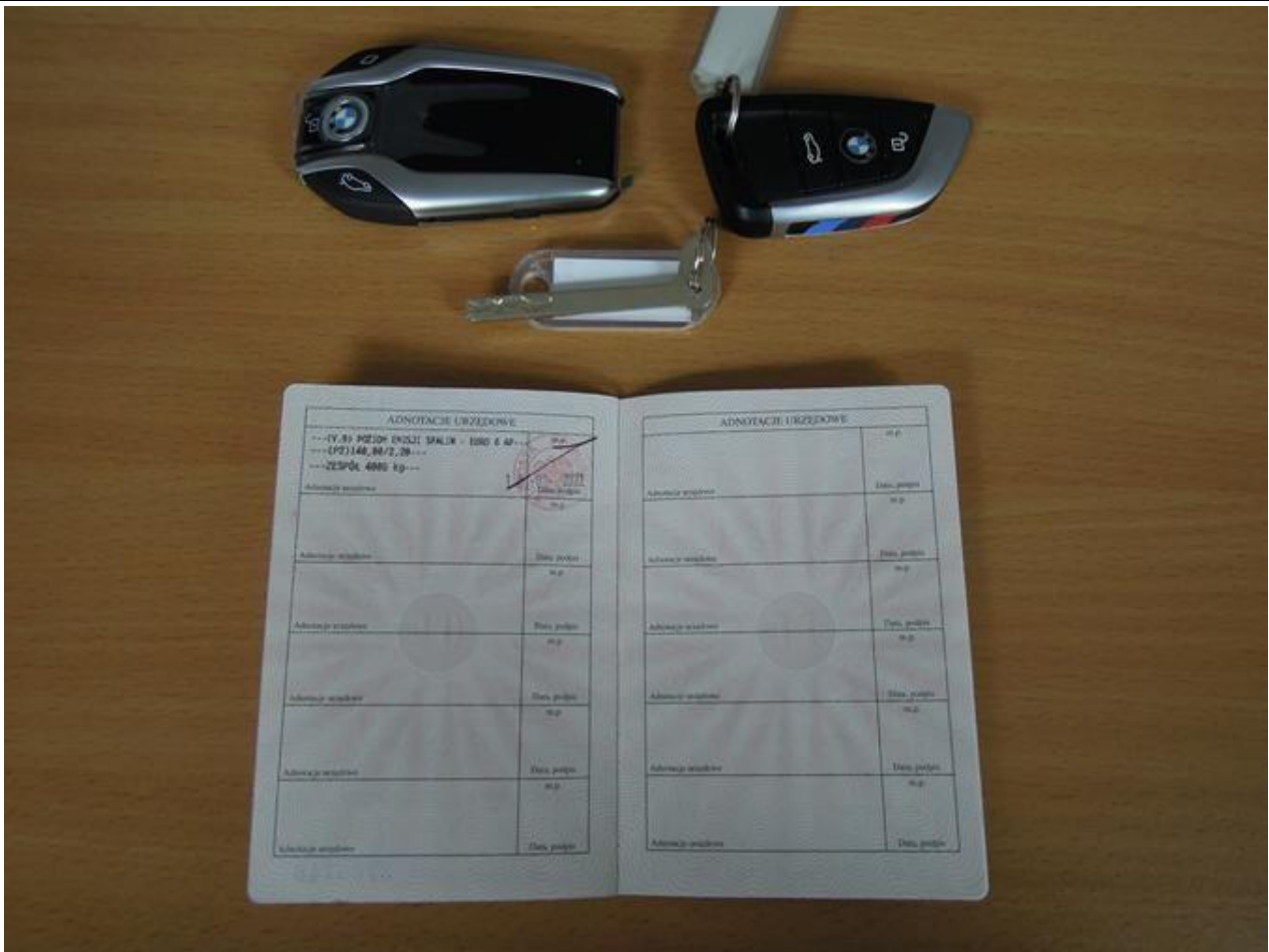
Fot. nr 75

Dokument wystawiony elektronicznie, wa ny bez podpisu