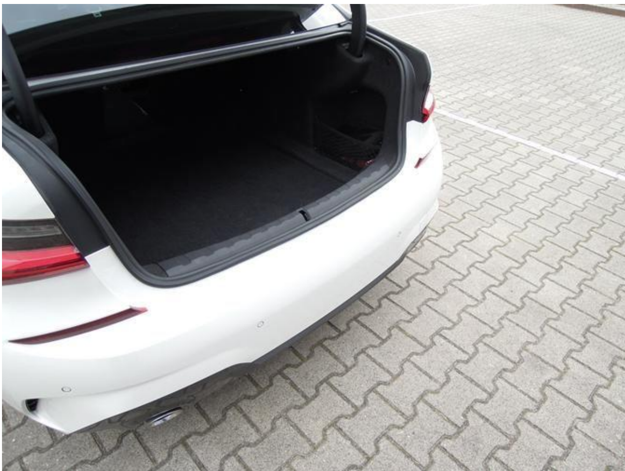
Fot. nr 34