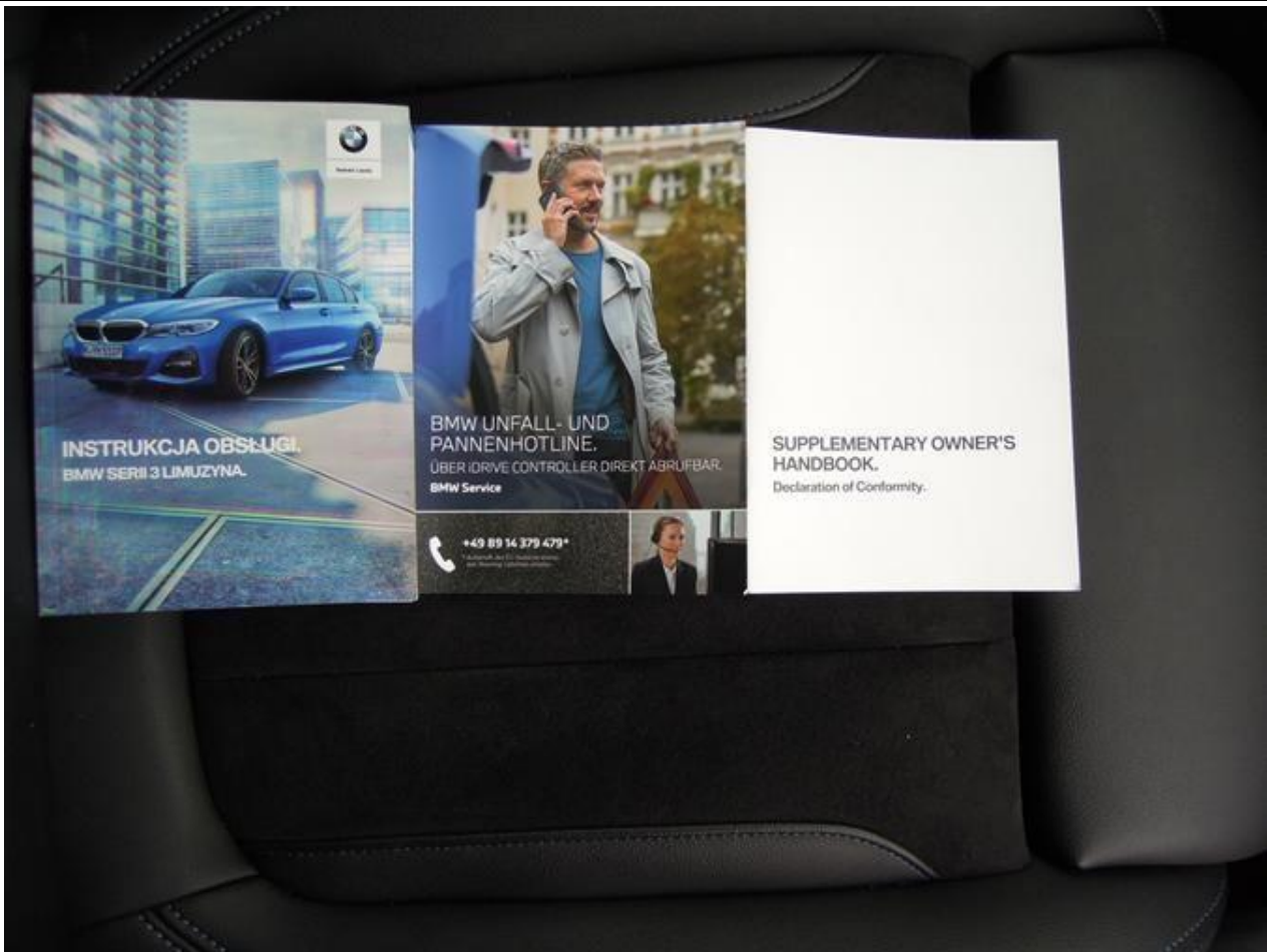
Fot. nr 61