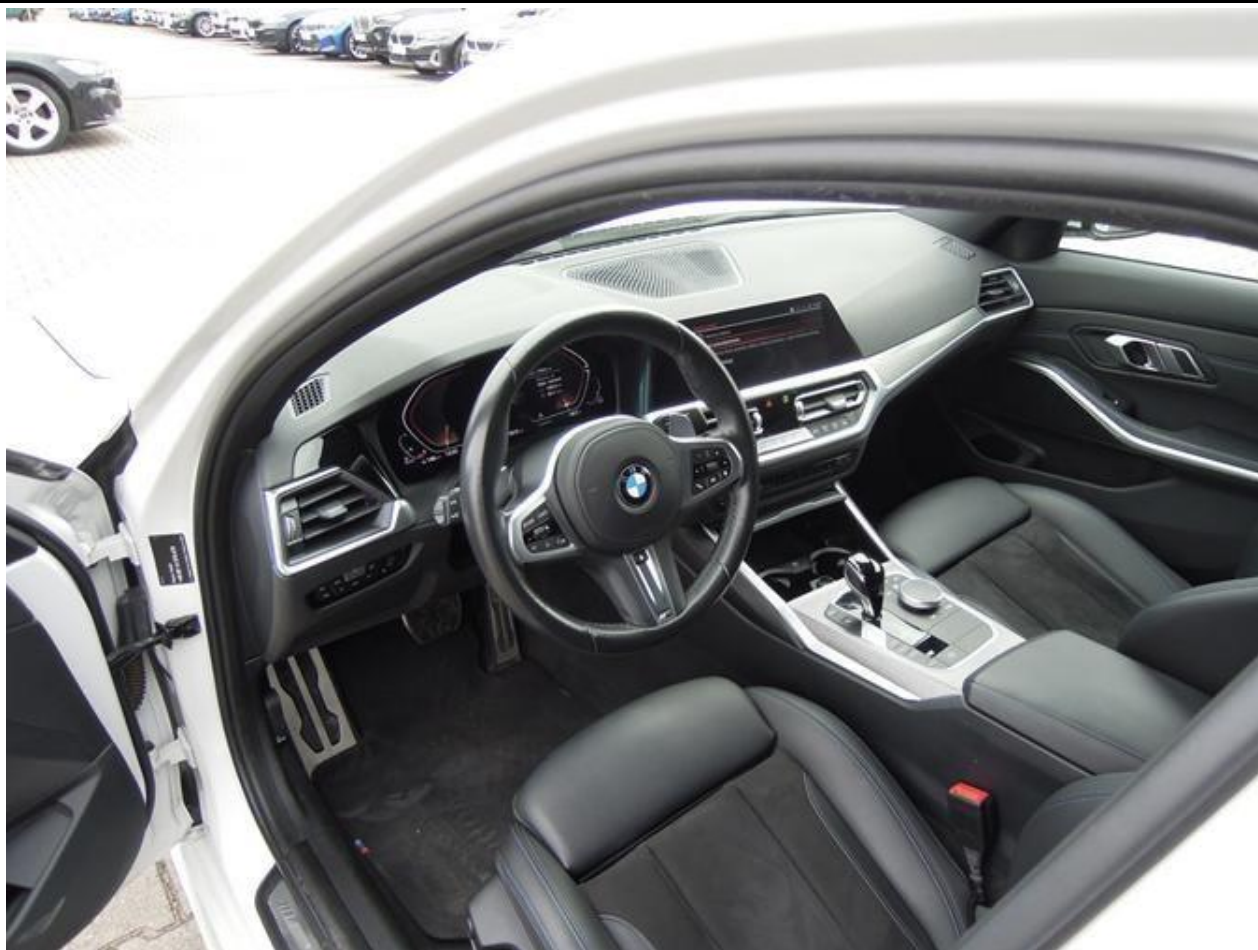
Fot. nr 15