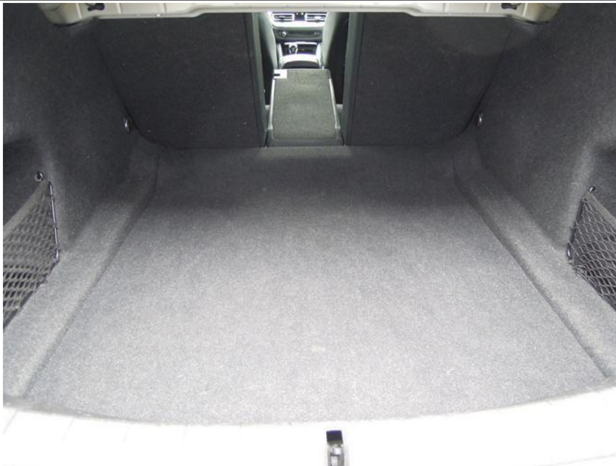
Fot. nr 21