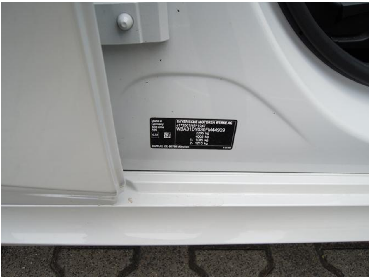
Fot. nr 7