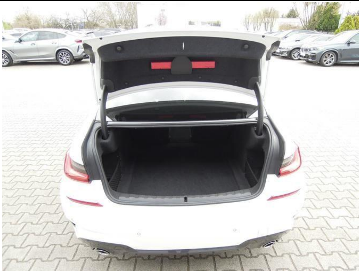
Fot. nr 19