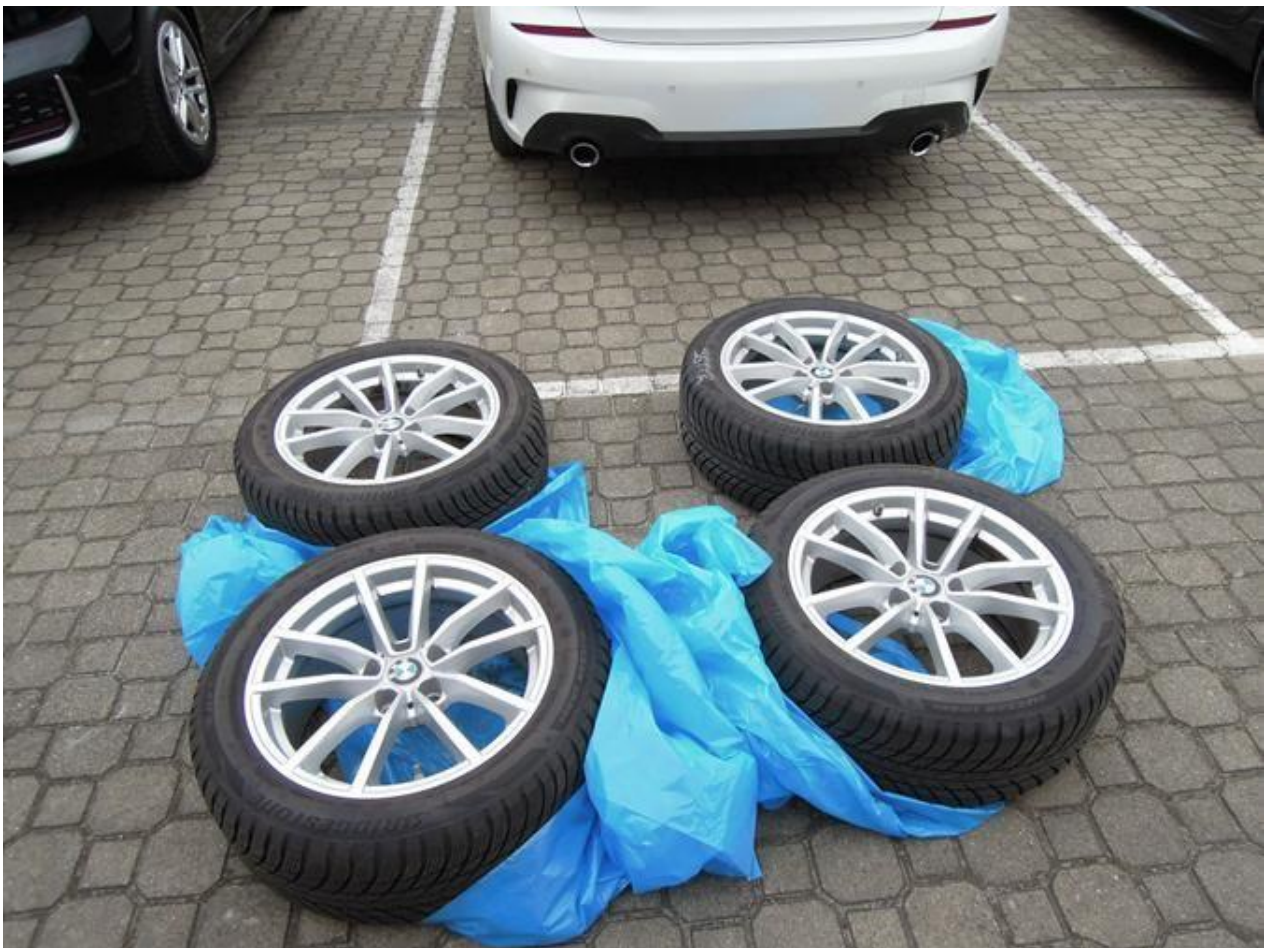
Fot. nr 62