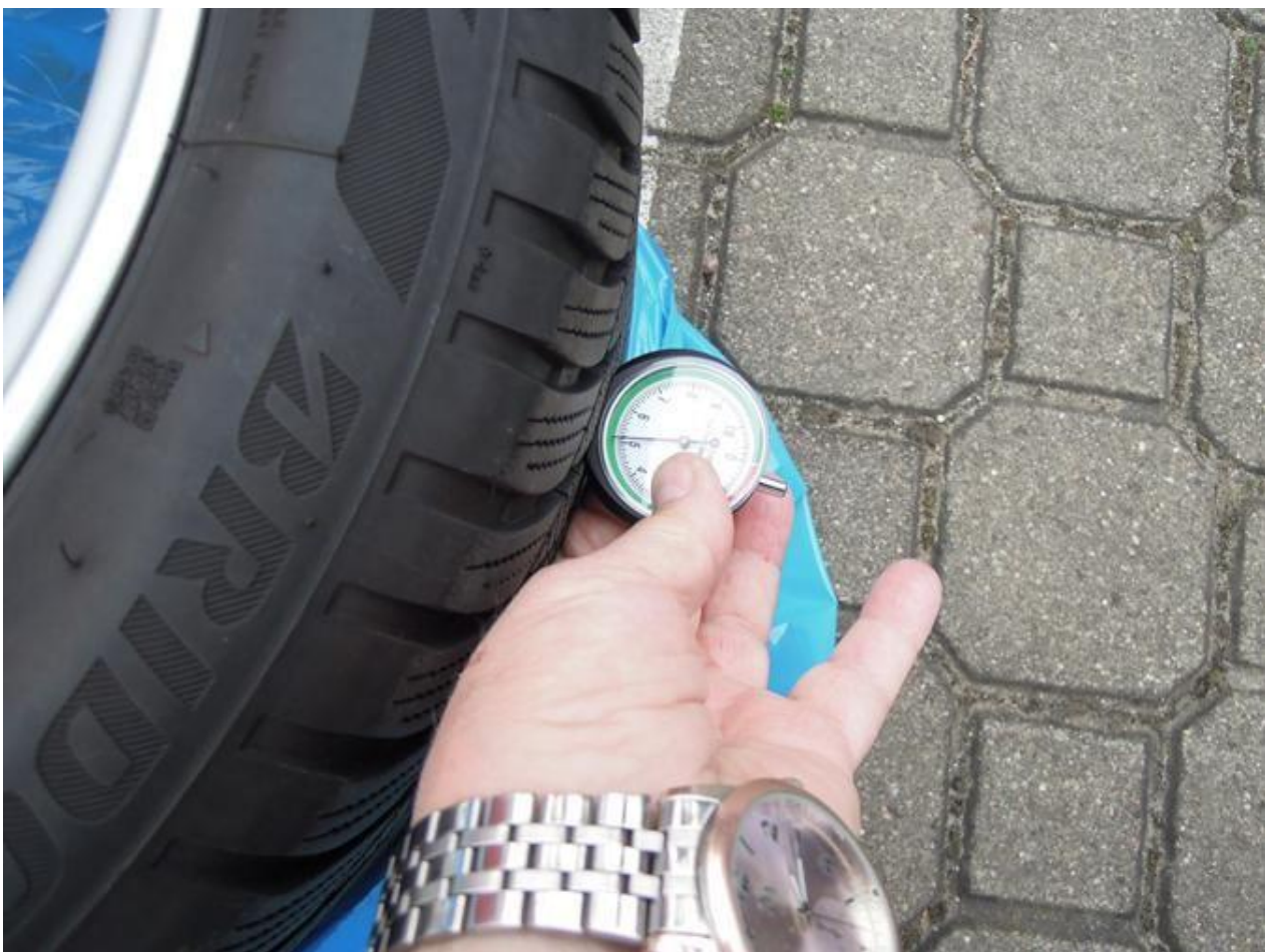
Fot. nr 68