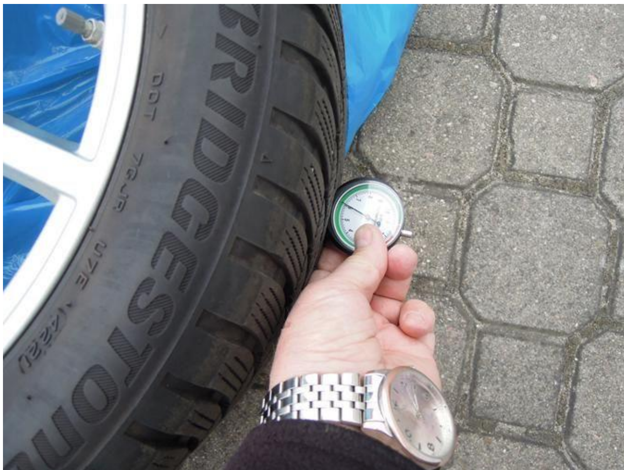
Fot. nr 64