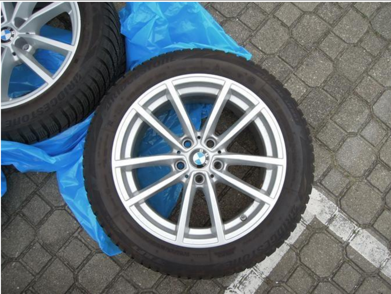
Fot. nr 69