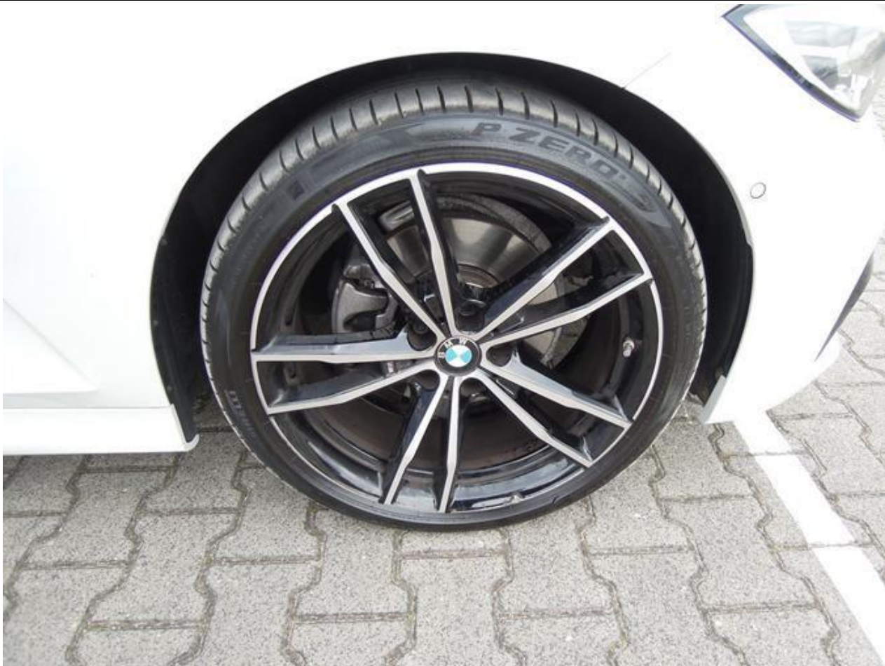
Fot. nr 49