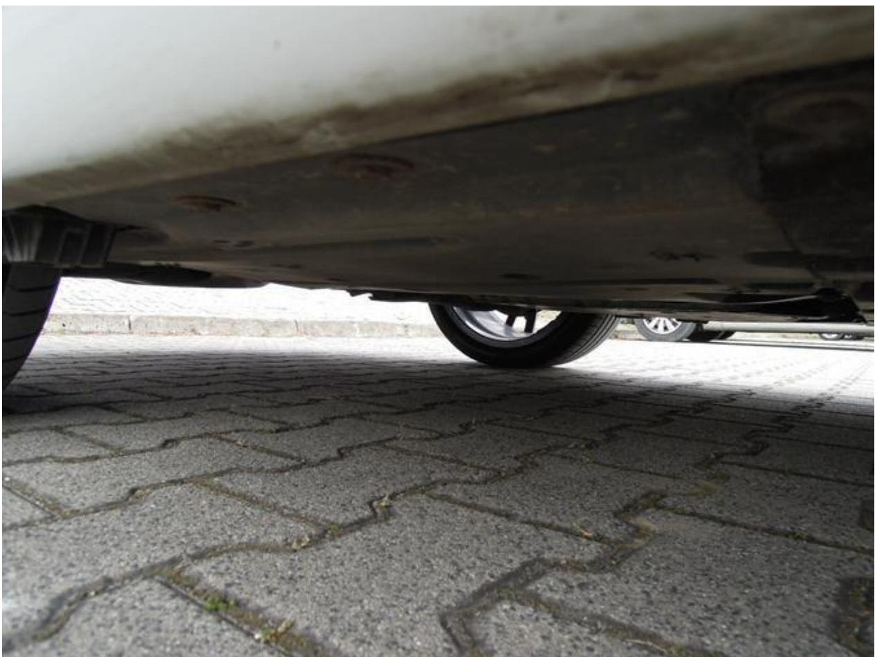
Fot. nr 58