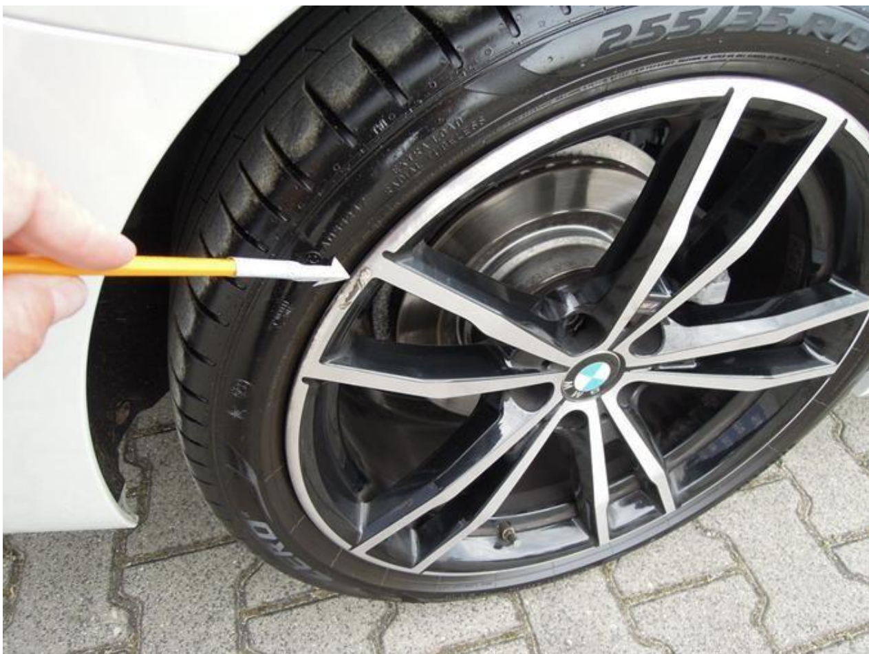
Fot. nr 44