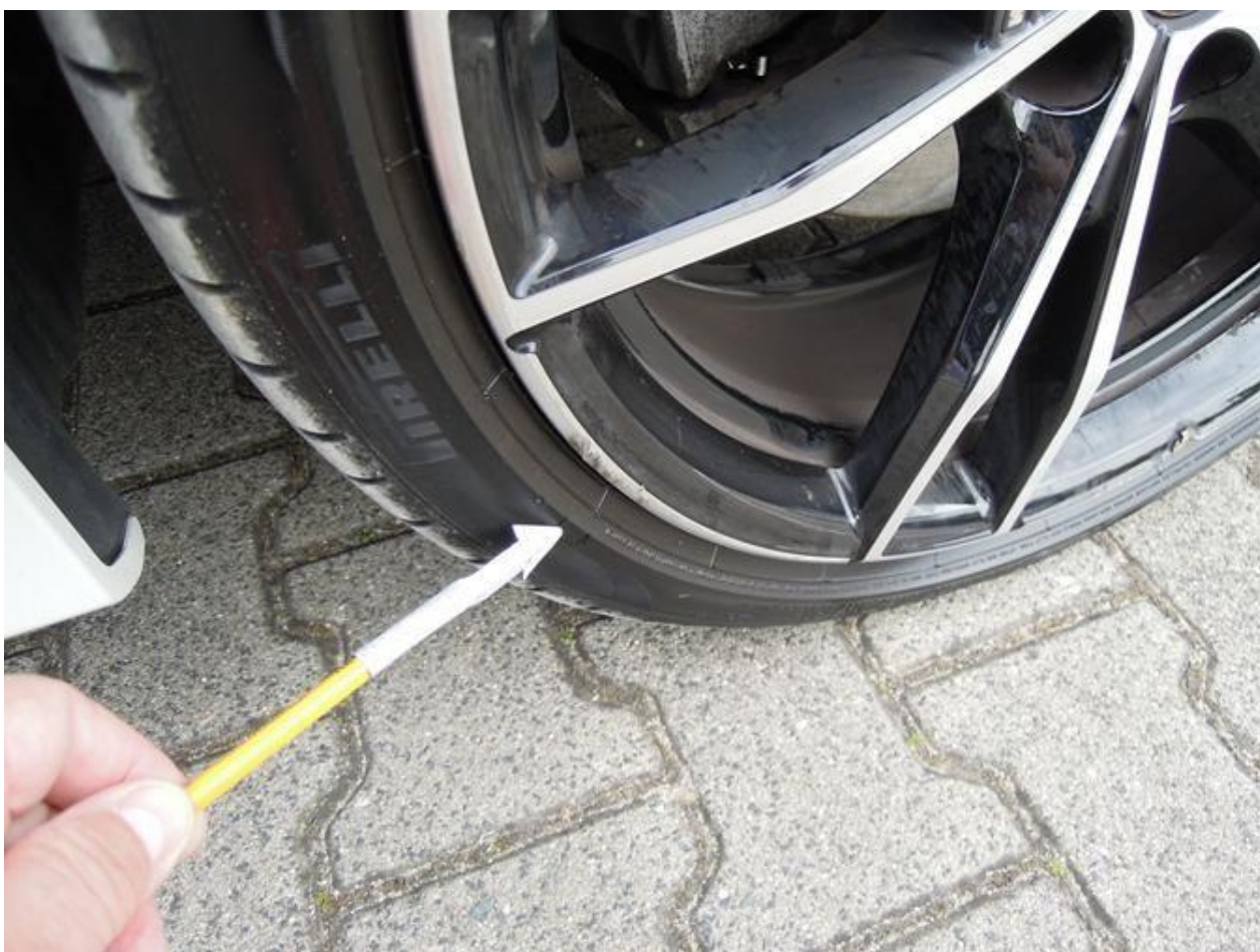
Fot. nr 40