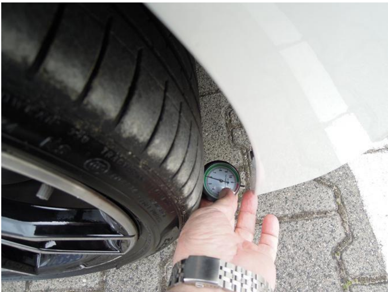
Fot. nr 50