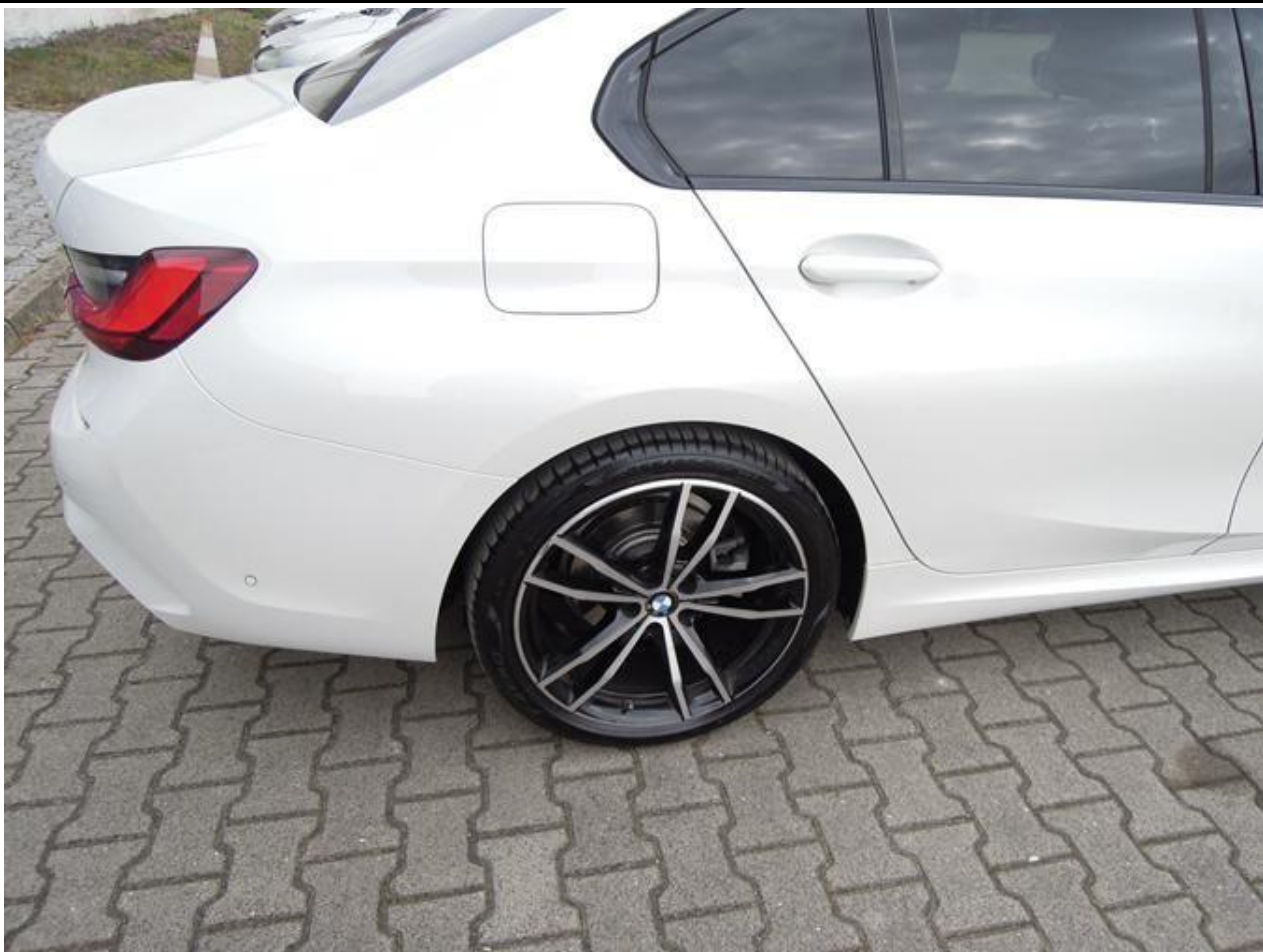
Fot. nr 43