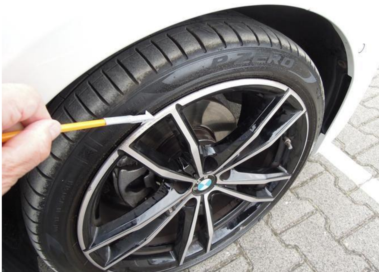
Fot. nr 38