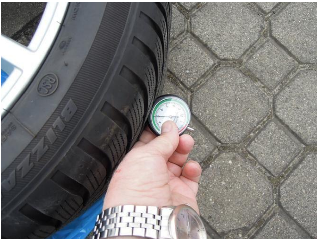
Fot. nr 66