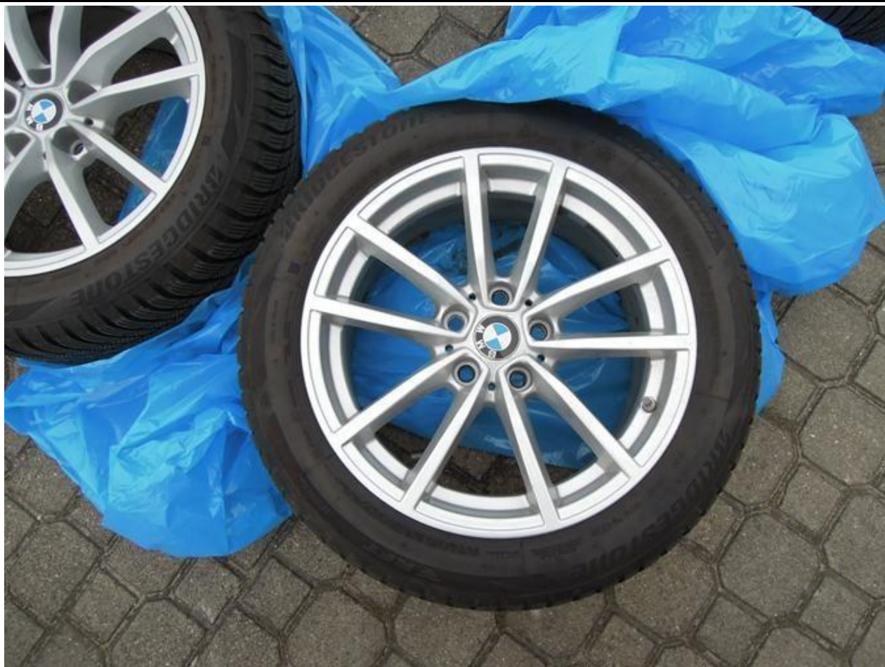
Fot. nr 63