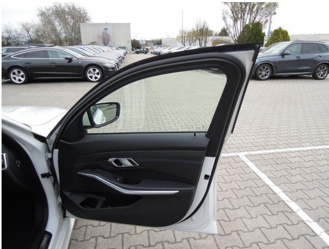
Fot. nr 24