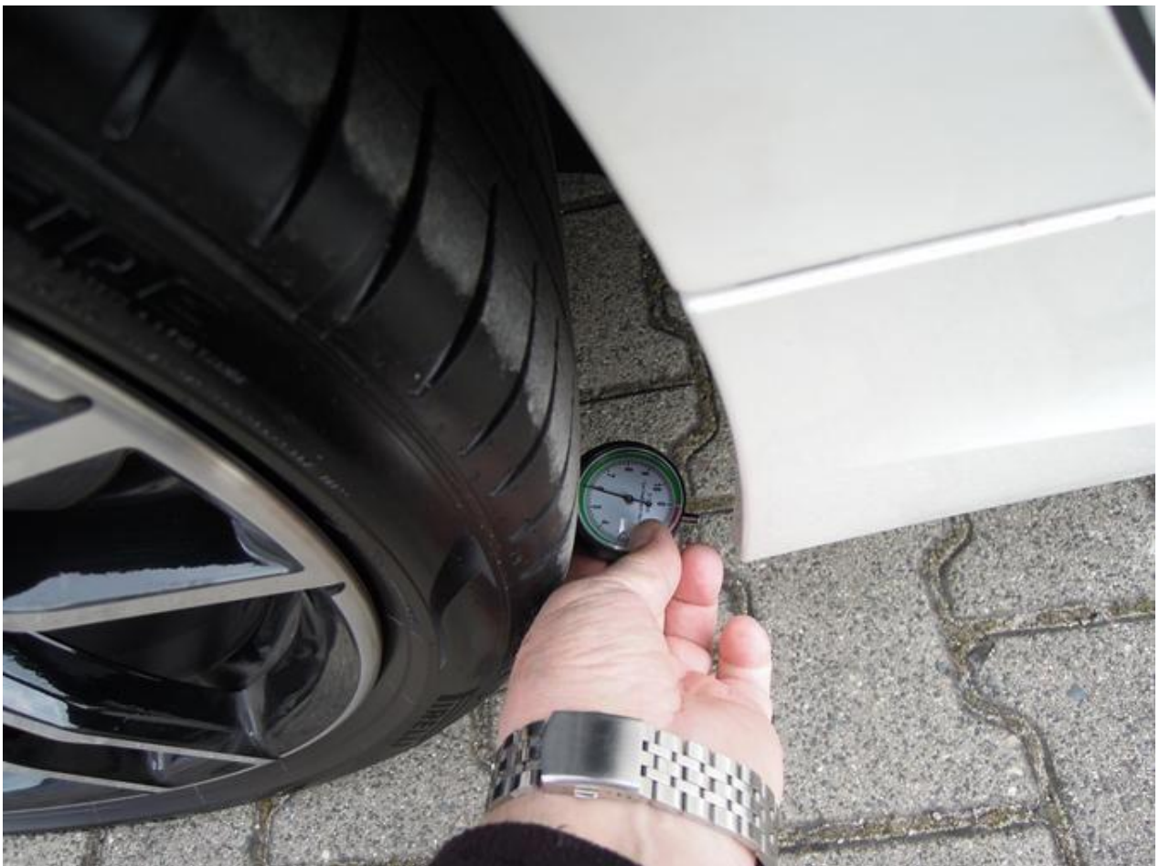
Fot. nr 52