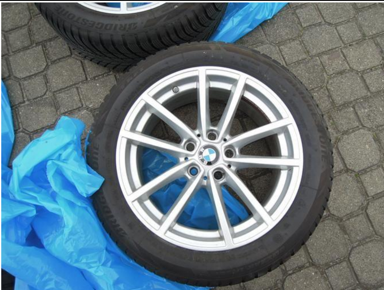
Fot. nr 65