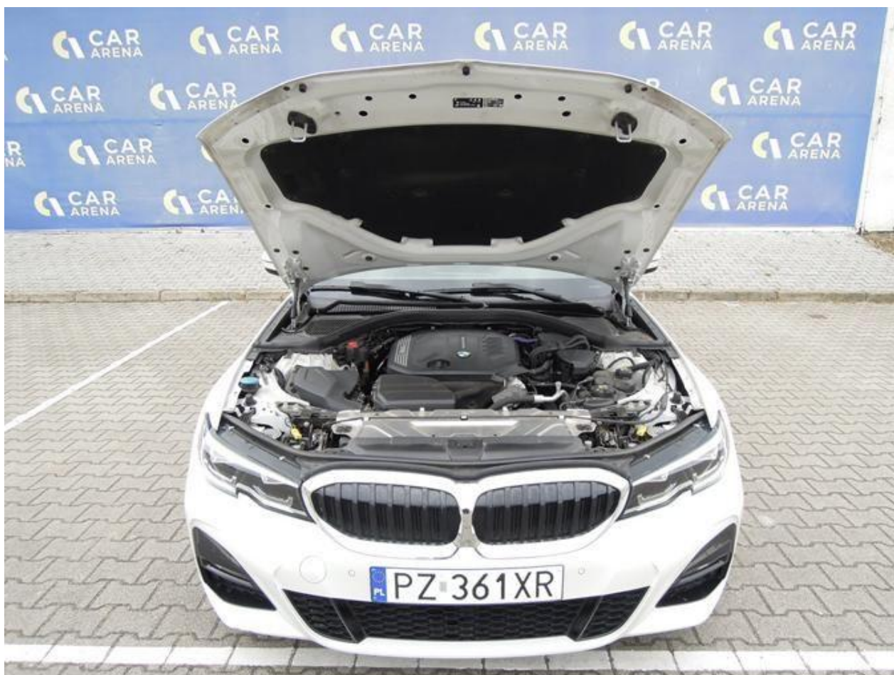
Fot. nr 10