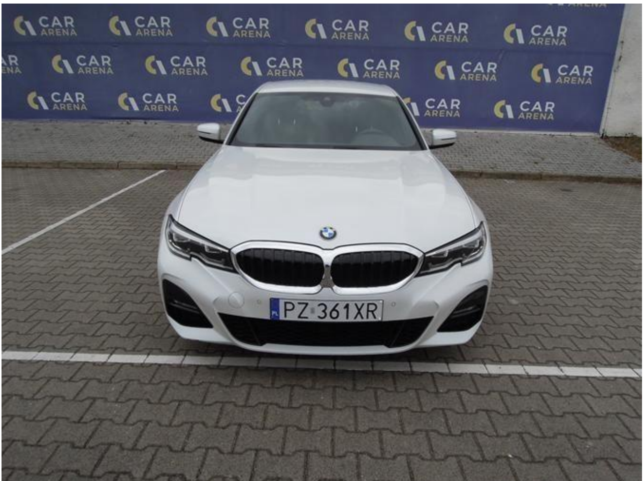
Fot. nr 2