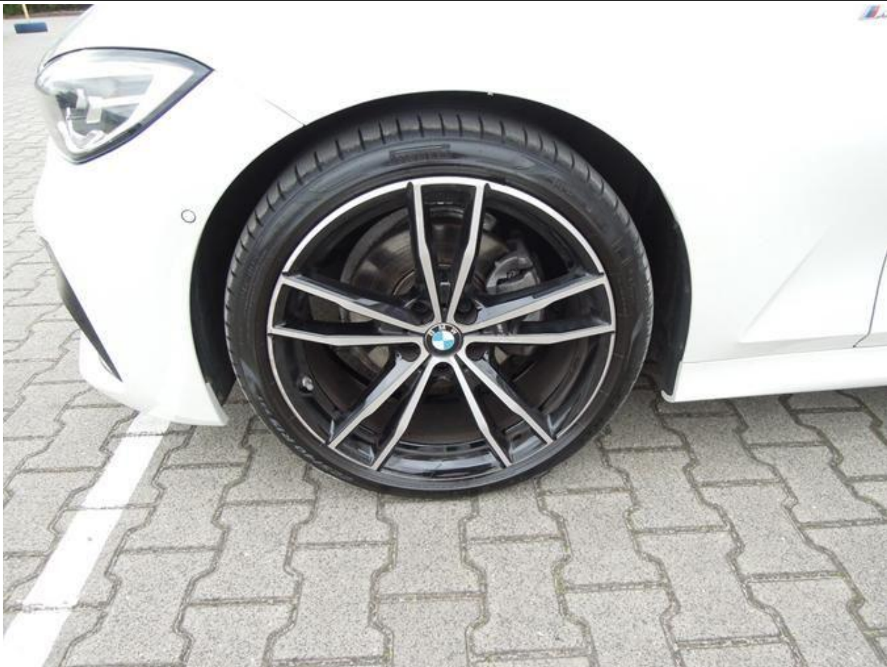
Fot. nr 45