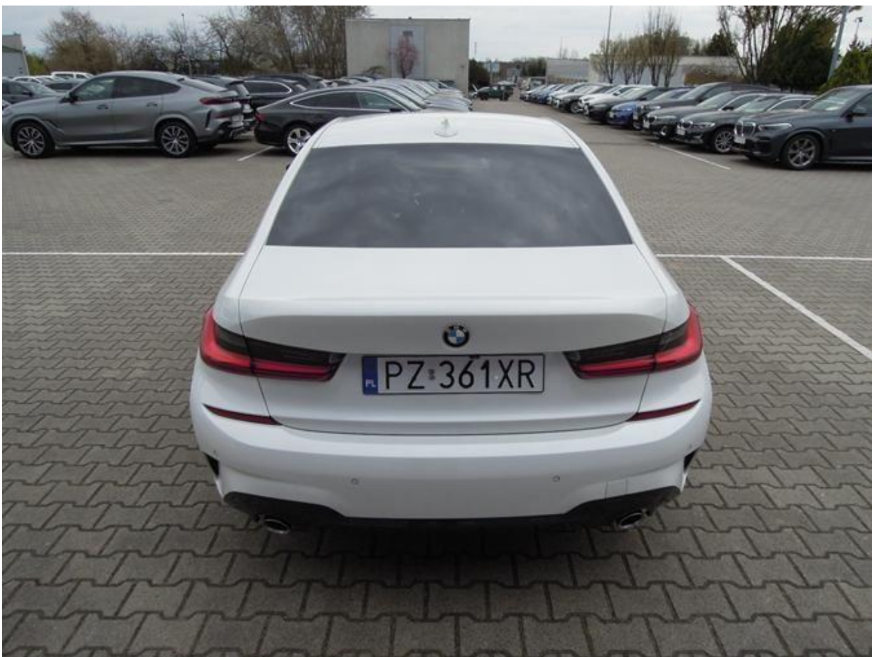
Fot. nr 4