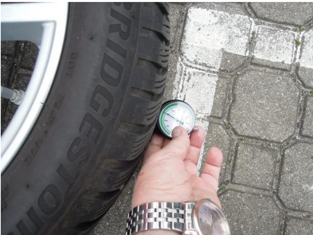
Fot. nr 70