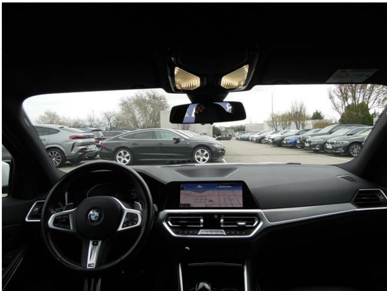
Fot. nr 18