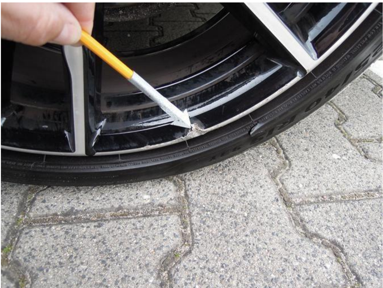
Fot. nr 42