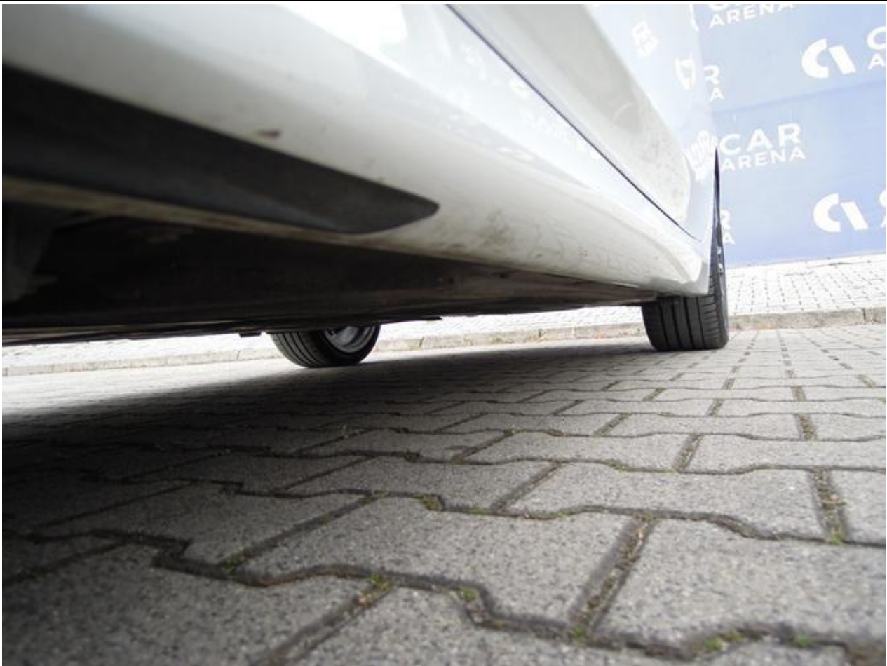
Fot. nr 55