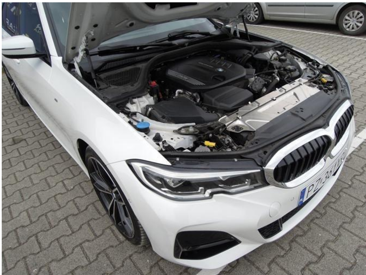
Fot. nr 12