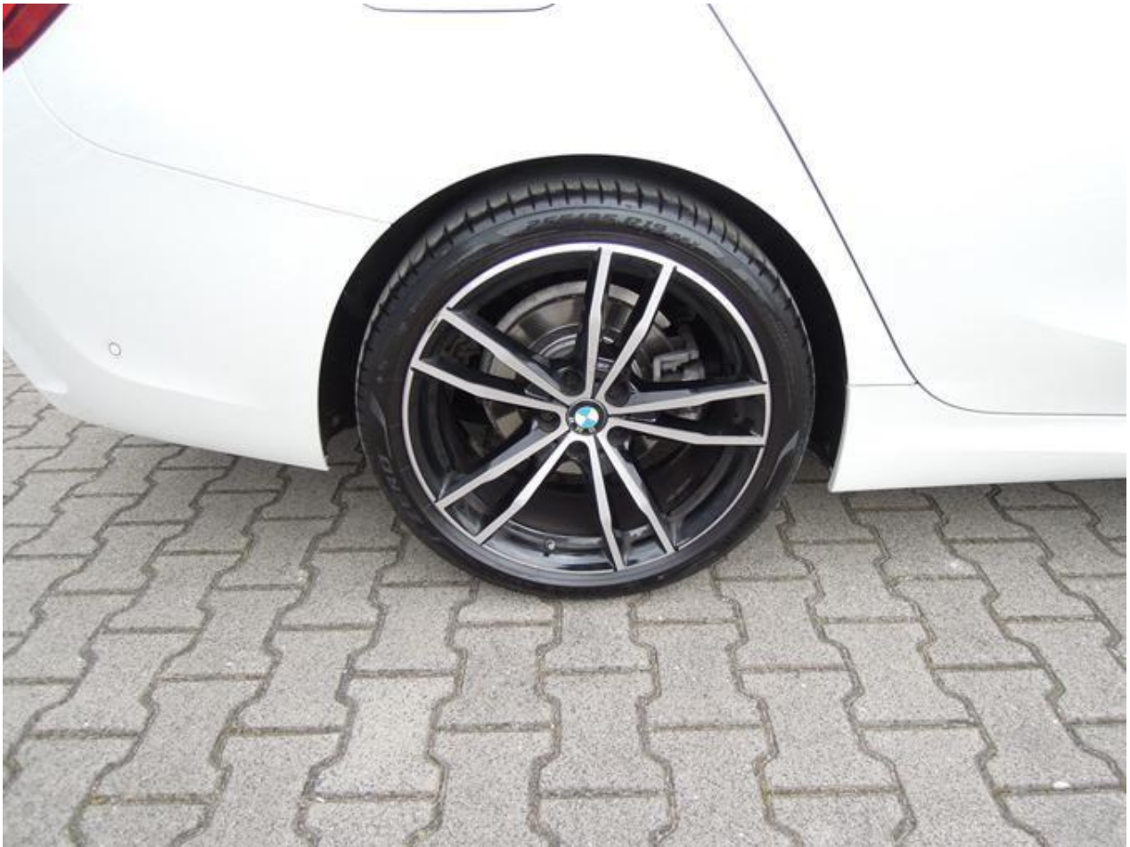
Fot. nr 51