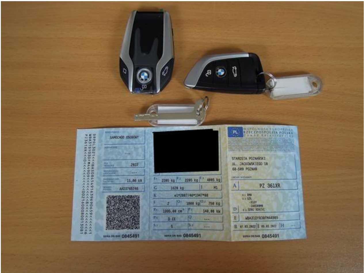
Fot. nr 71