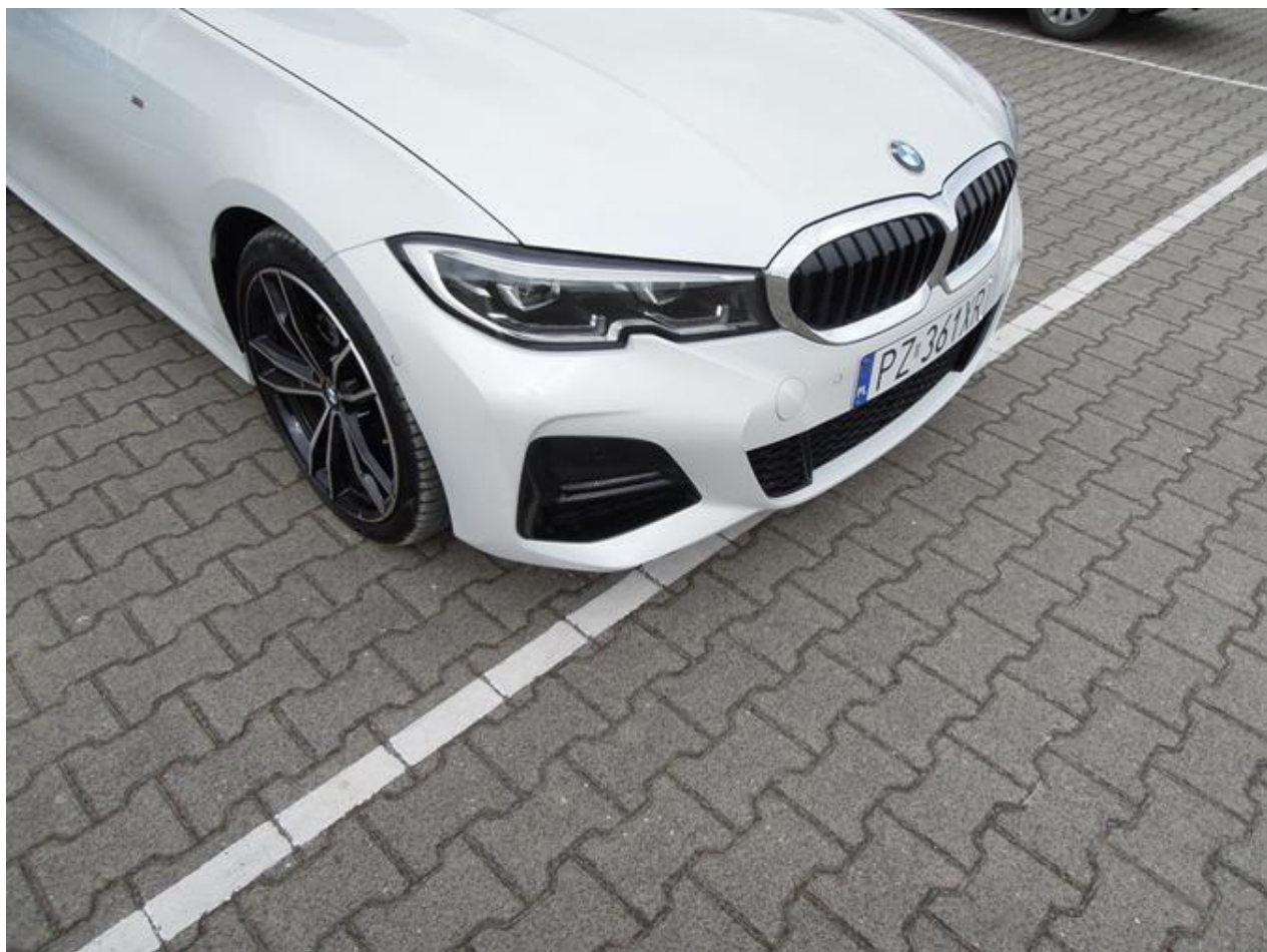
Fot. nr 26