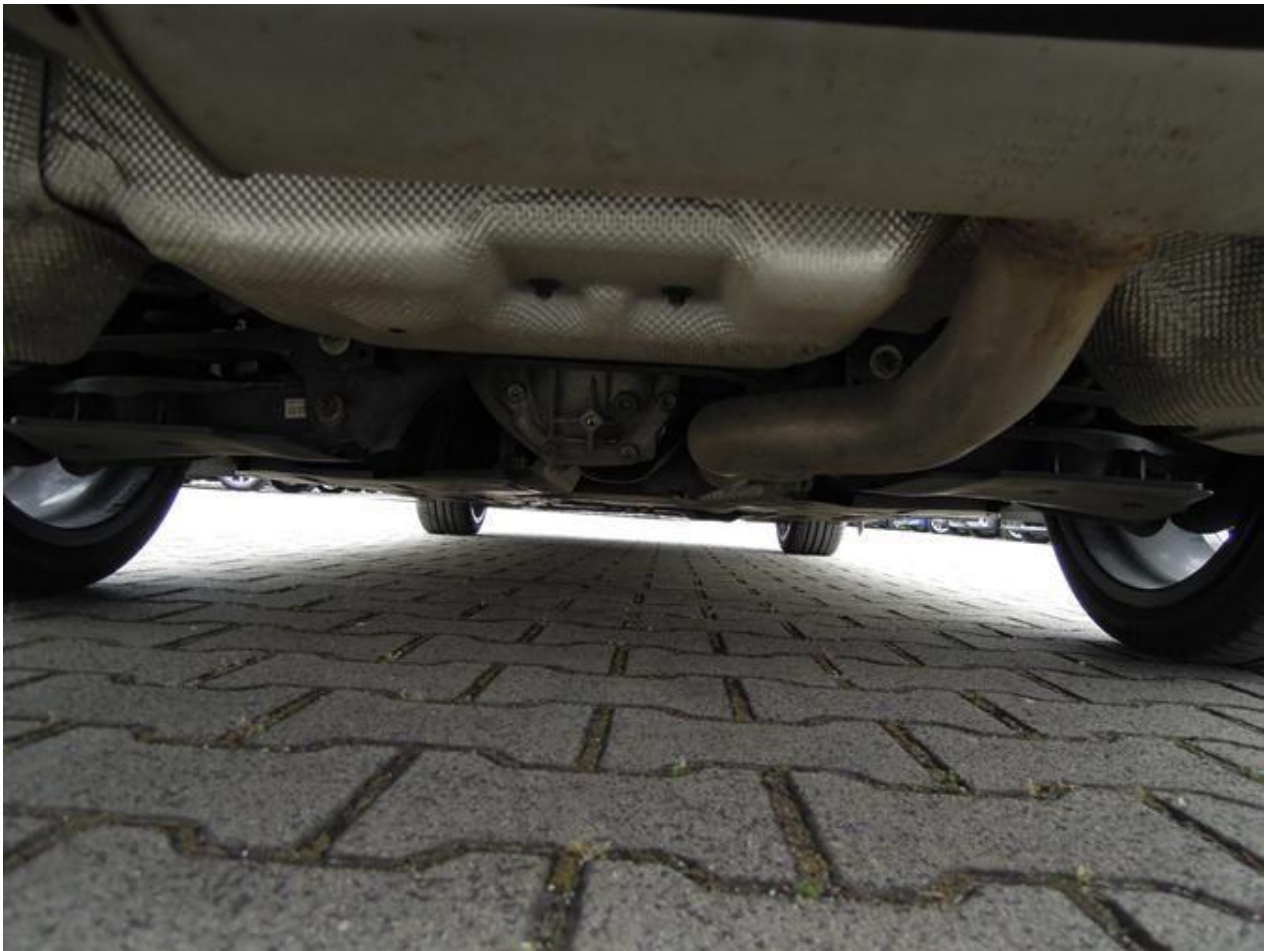
Fot. nr 59