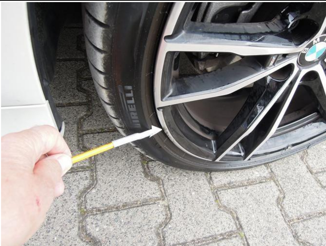
Fot. nr 39