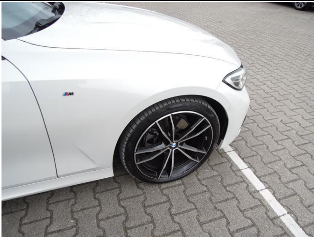
Fot. nr 37