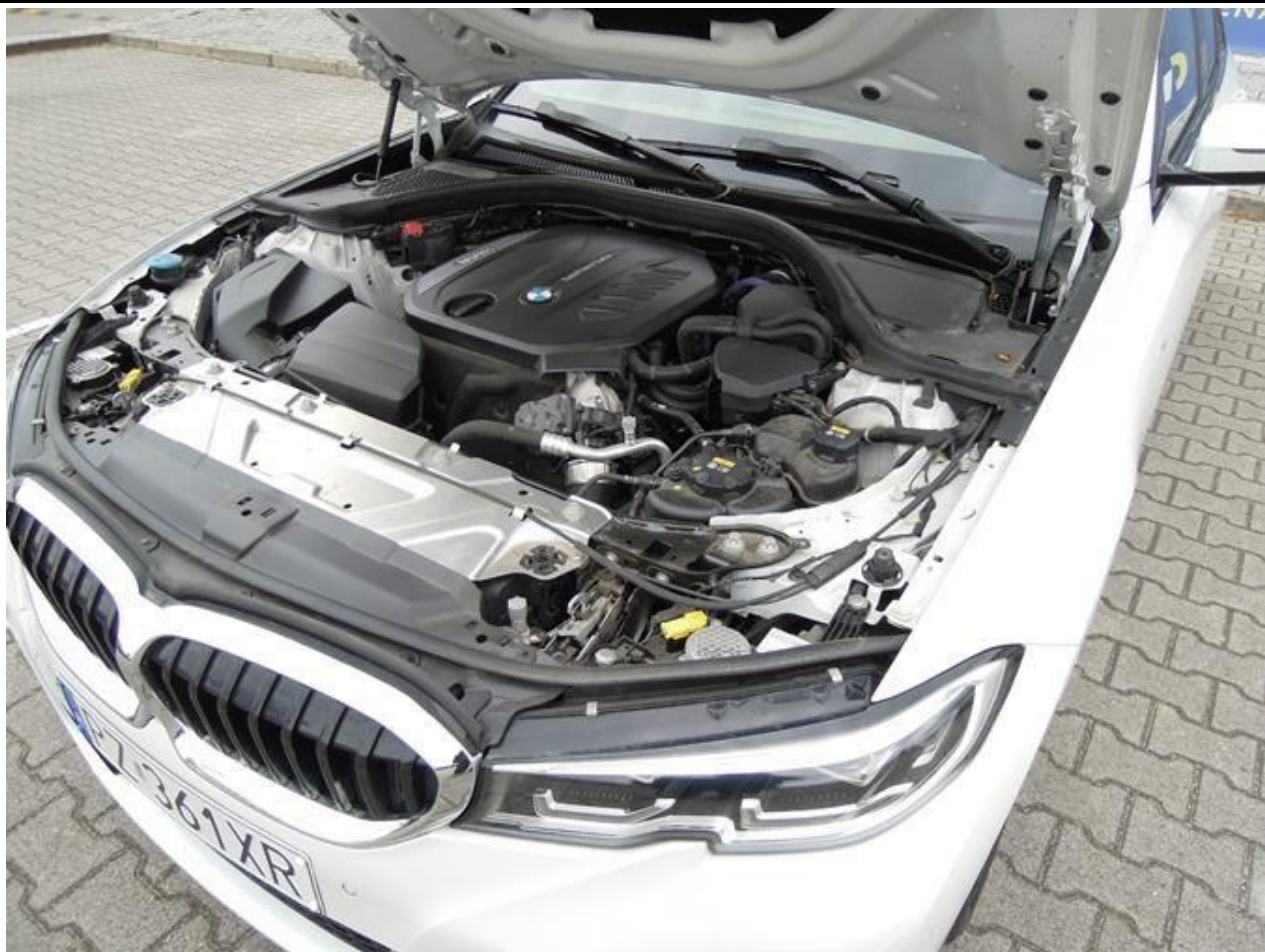
Fot. nr 11