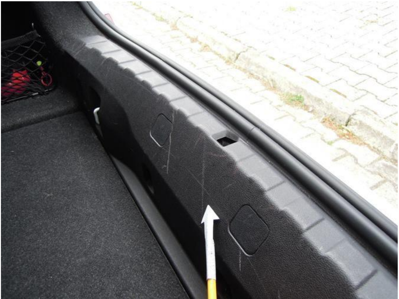
Fot. nr 35