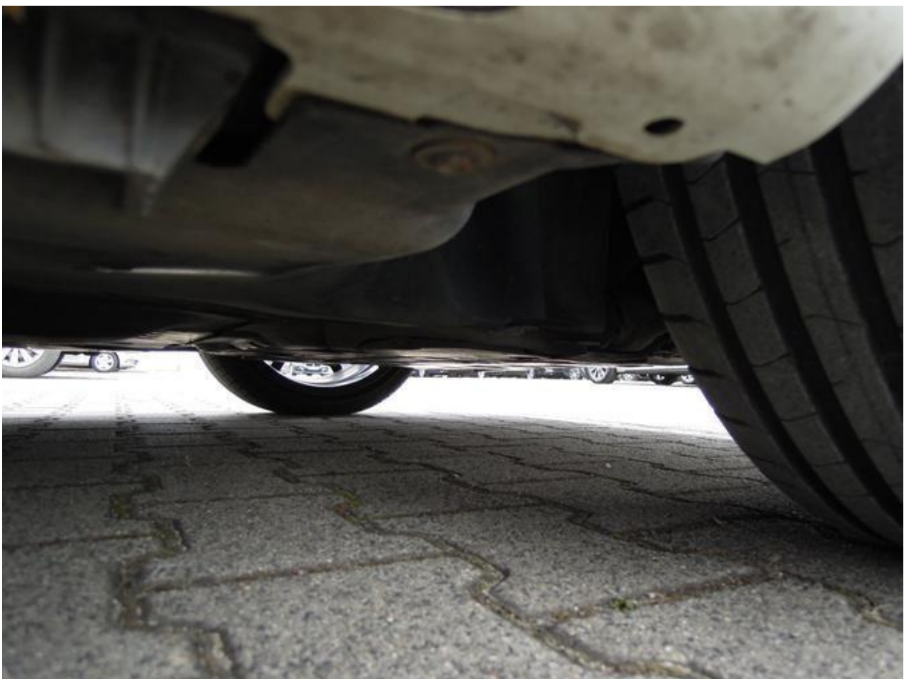
Fot. nr 56