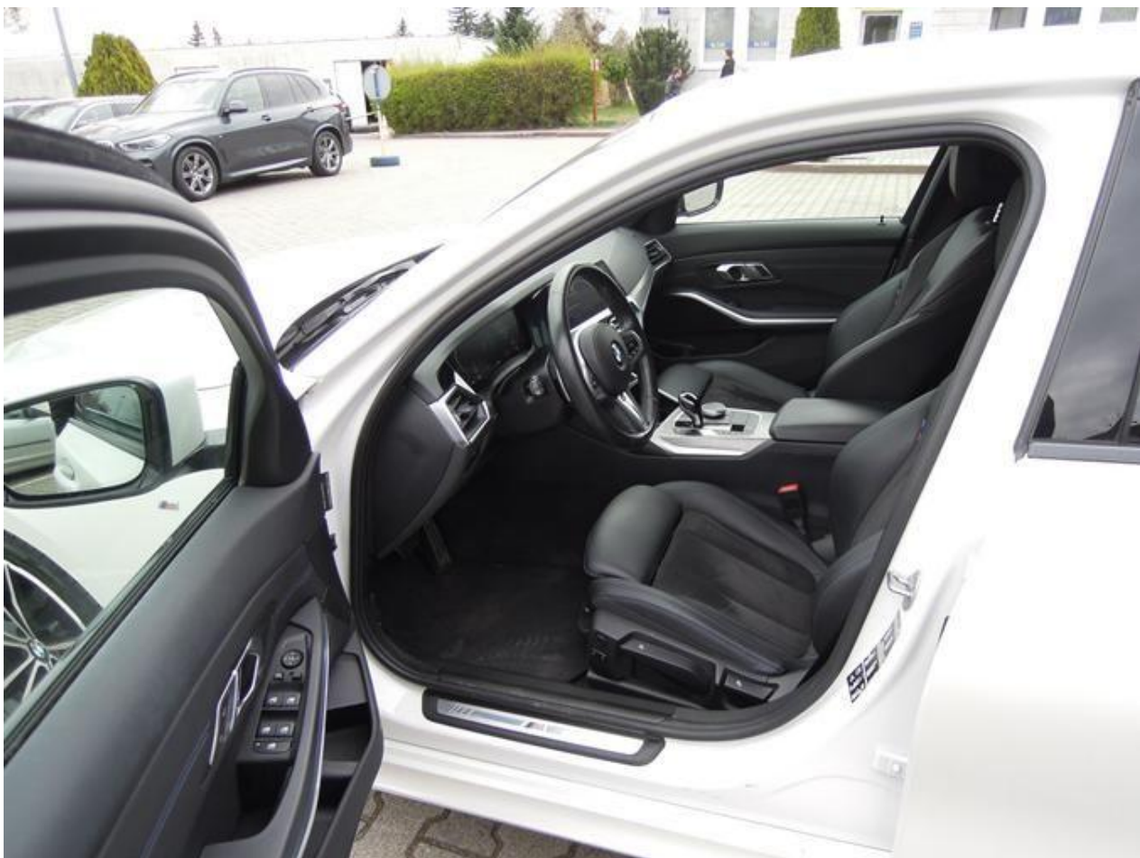
Fot. nr 14