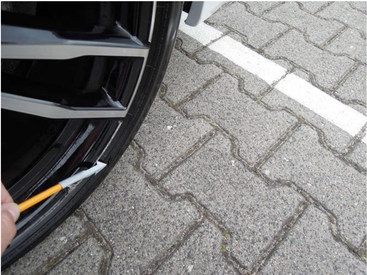
Fot. nr 41