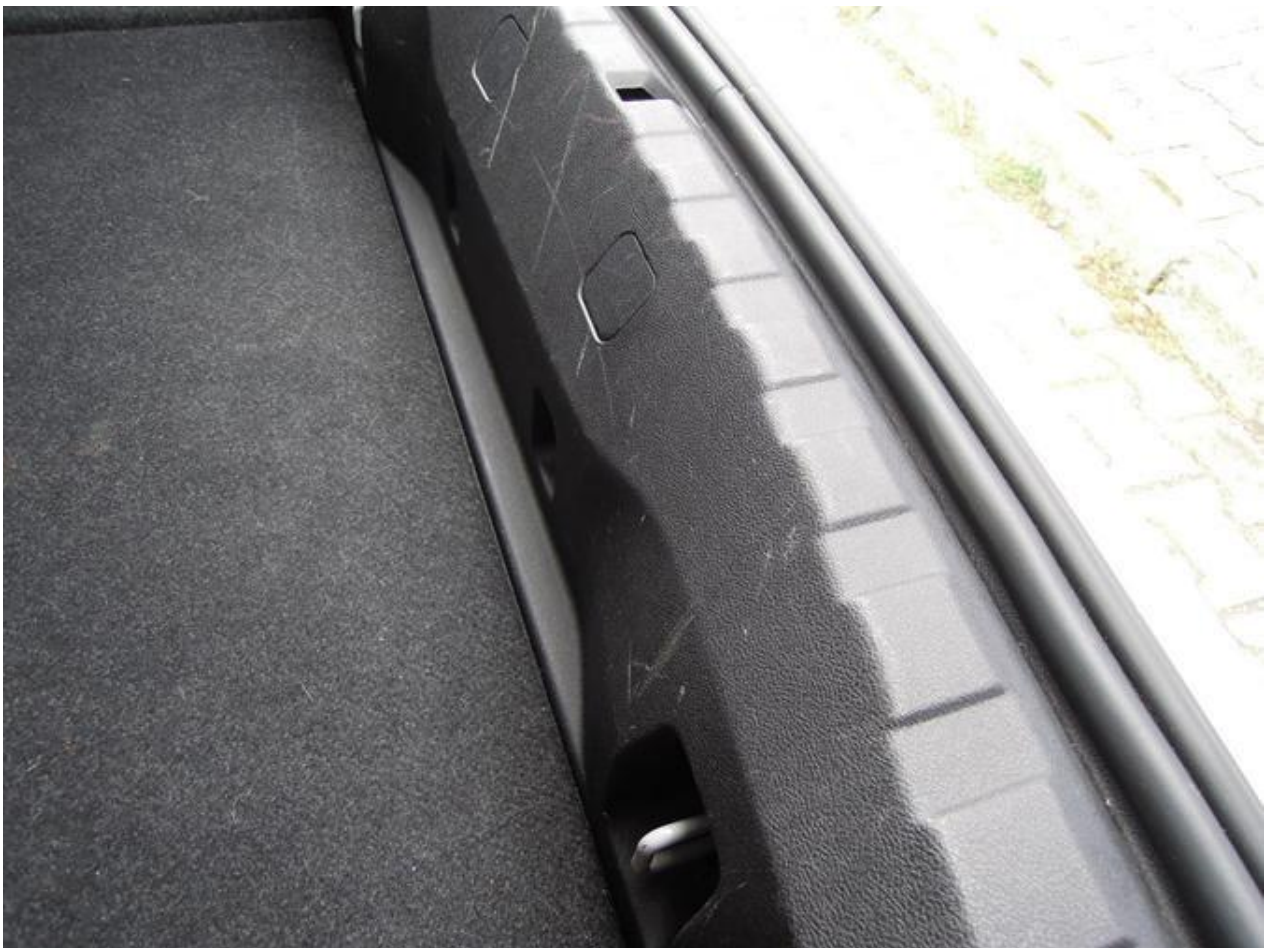
Fot. nr 36