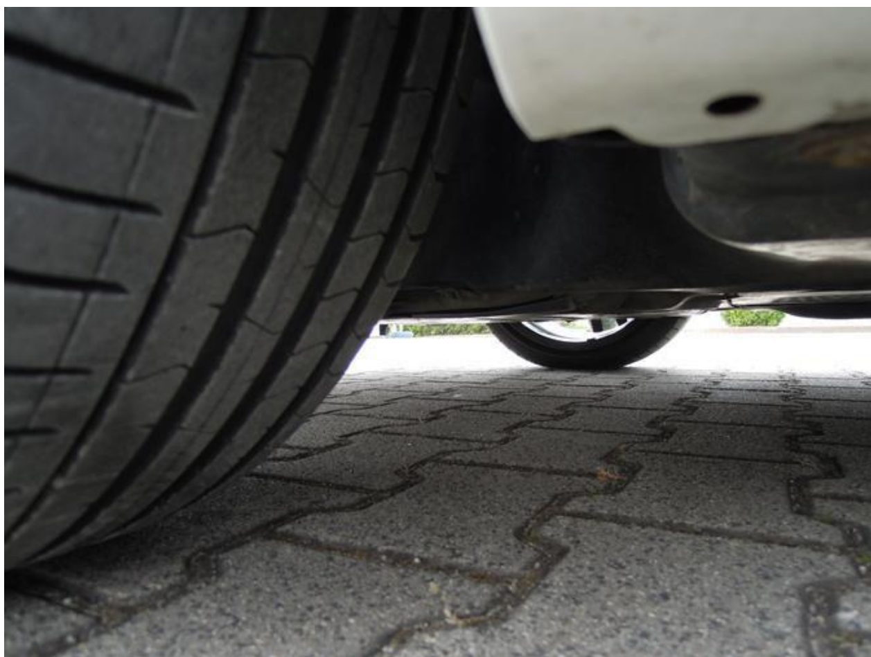
Fot. nr 54