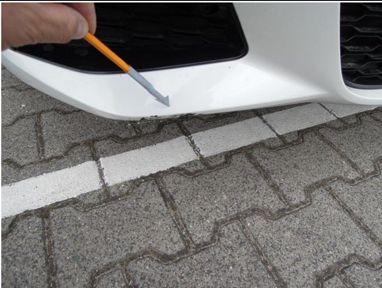
Fot. nr 27