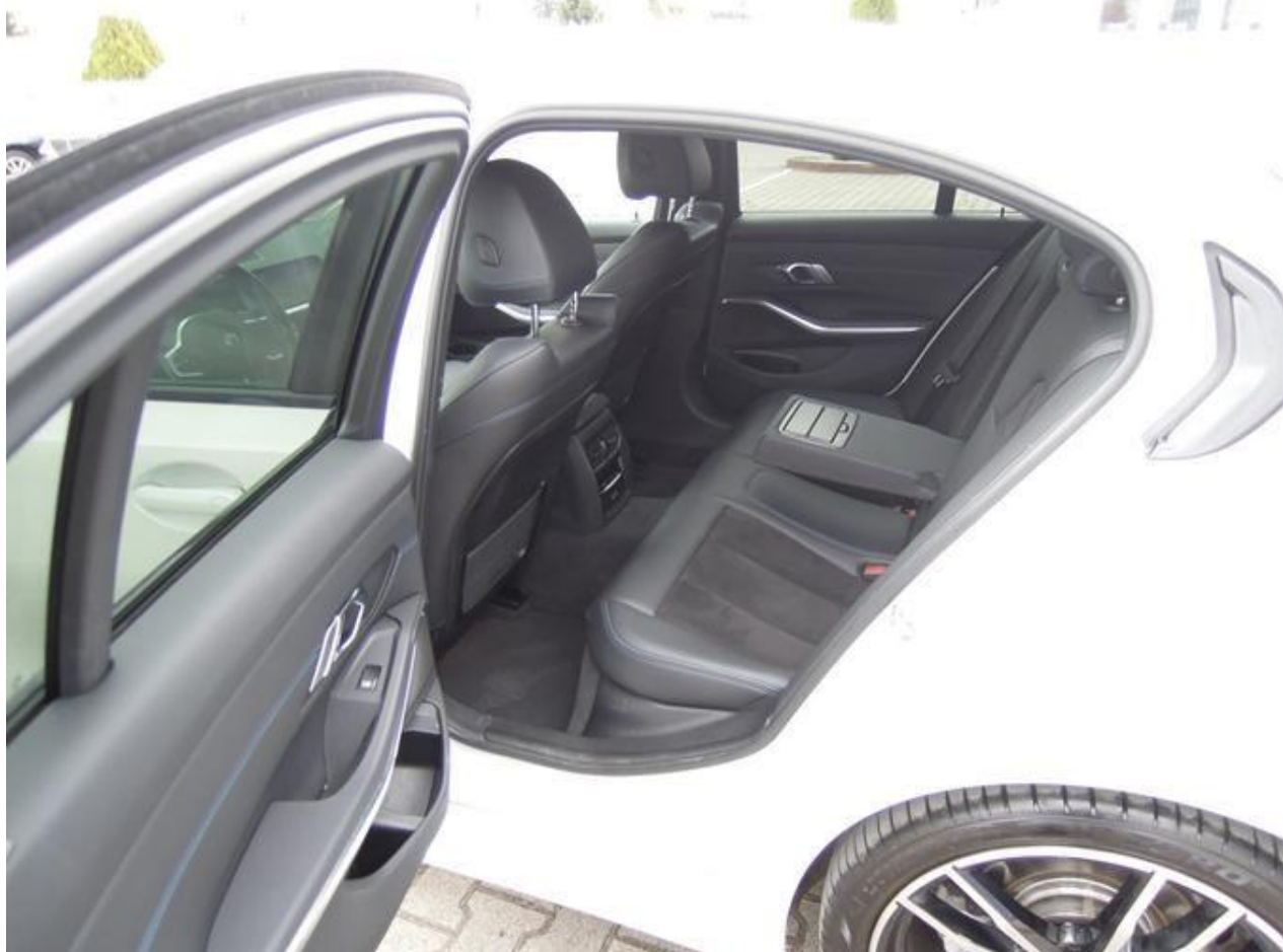
Fot. nr 17