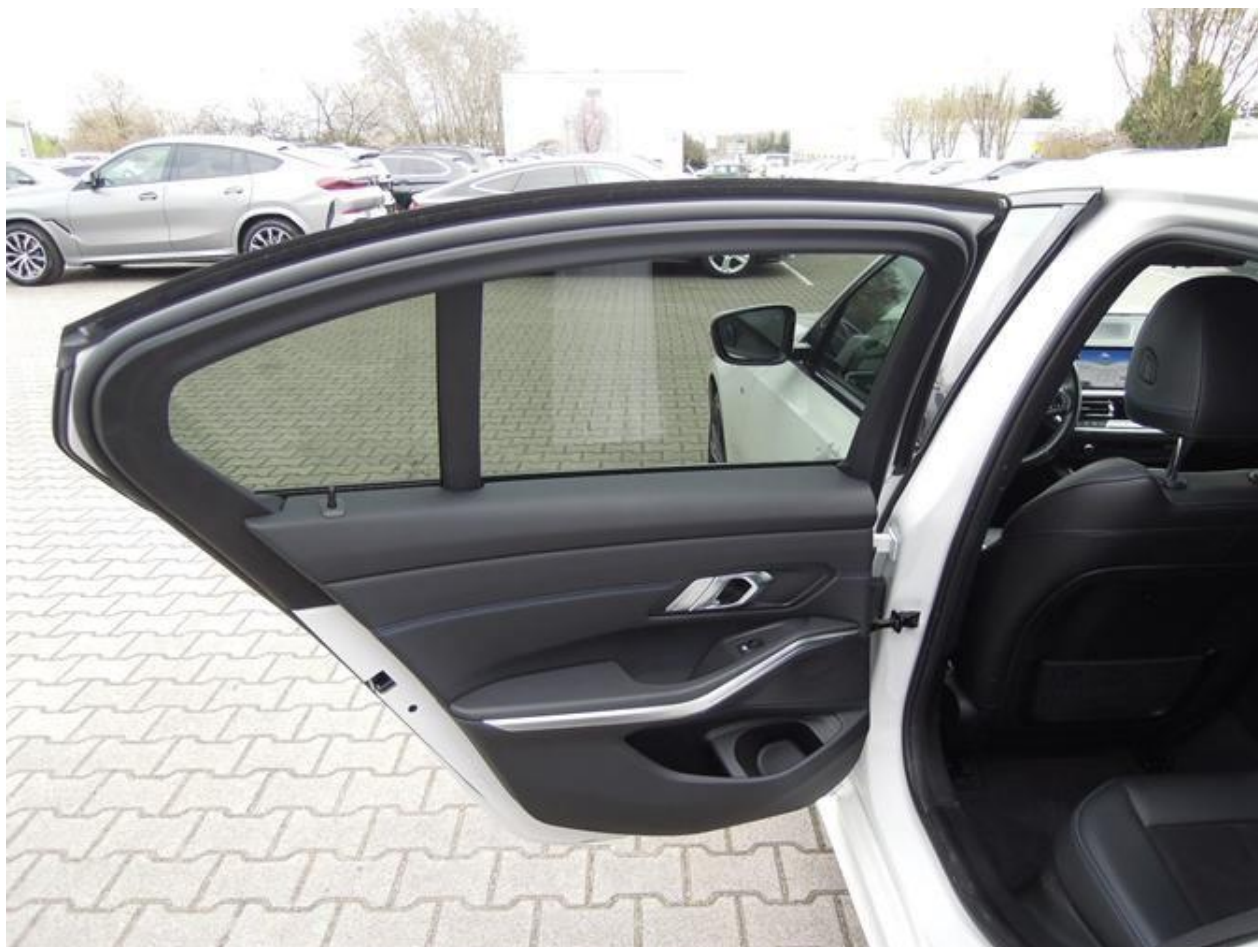
Fot. nr 16