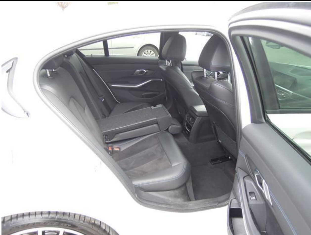
Fot. nr 23