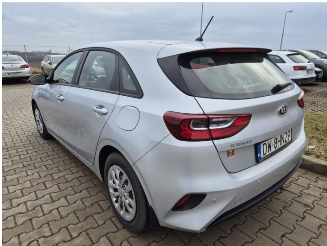
Fot. 9 Przekątna tylna lewa