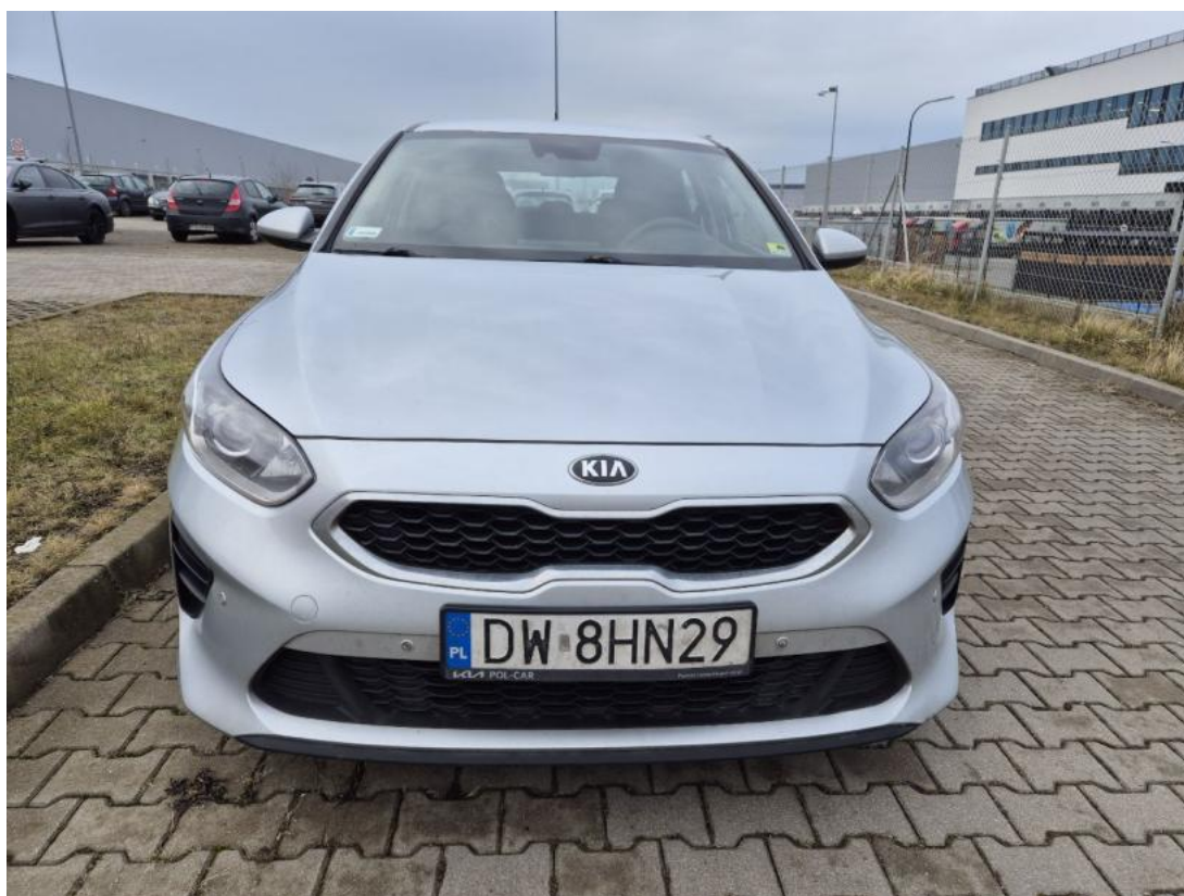
Fot. 2 Przód