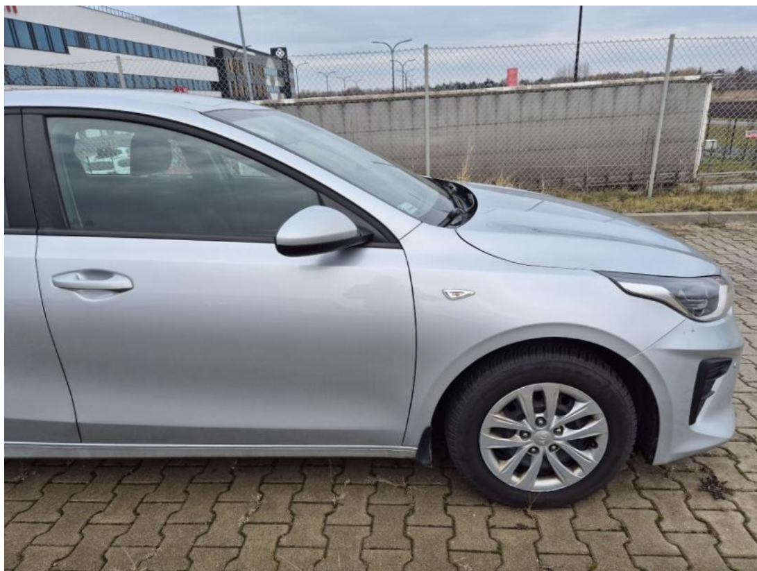
Fot. 5 Bok prawy z przodu