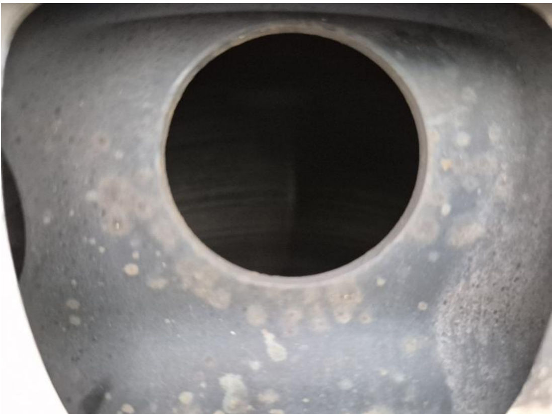
Fot. 28 Tarcza hamulcowa przednia lewa