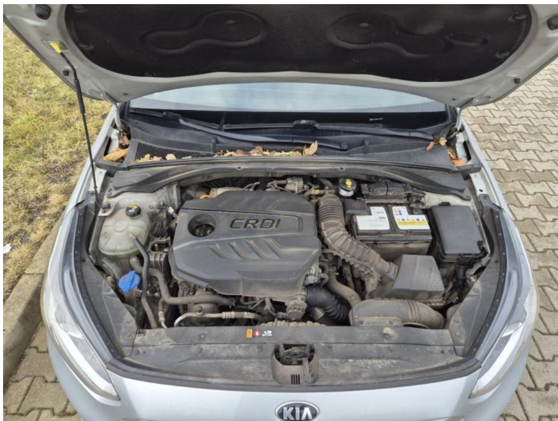
Fot. 23 Komora silnika