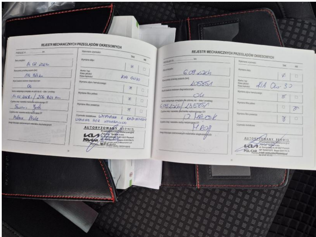
Fot. 35 Książka serwisowa – ostatni przegląd