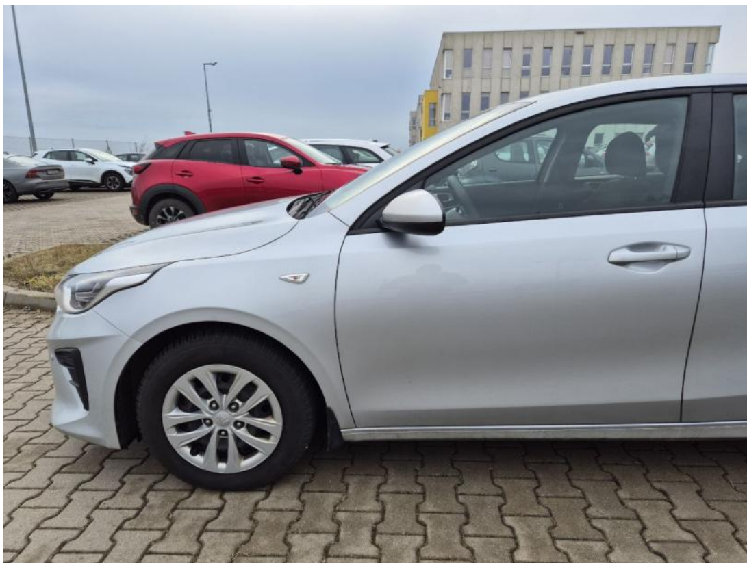
Fot. 11 Bok lewy z przodu