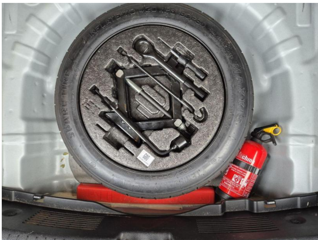
Fot. 25 Koło zapasowe