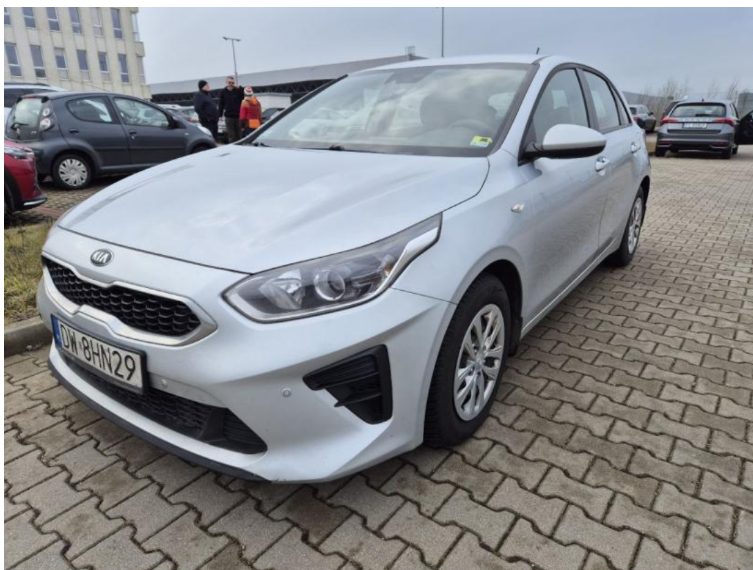
Fot. 1 Przekątna przednia lewa