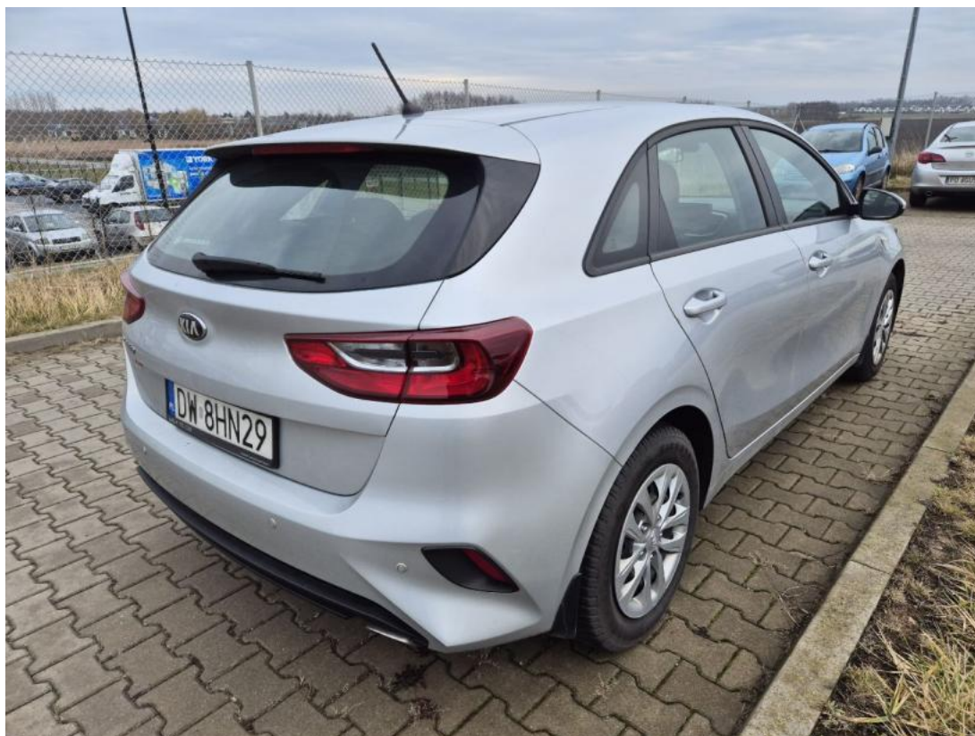
Fot. 7 Przekątna tylna prawa