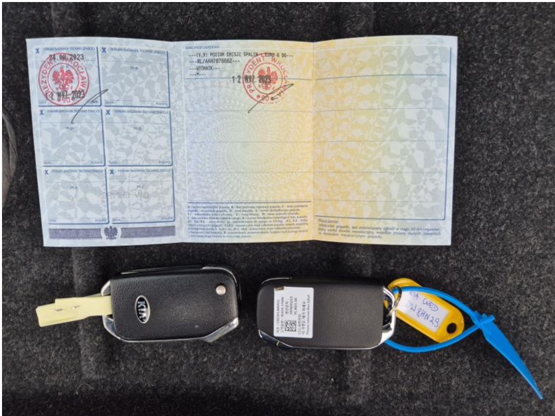
Fot. 33 Dow. Rej. Str.2 i klucze