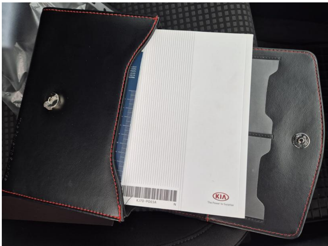
Fot. 36 Instrukcje