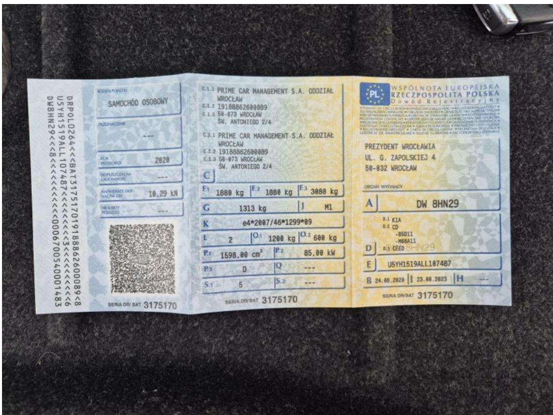
Fot. 32 Dowód rej. Str. 1