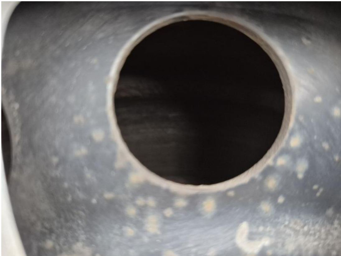
Fot. 31 Tarcza hamulcowa tylna lewa