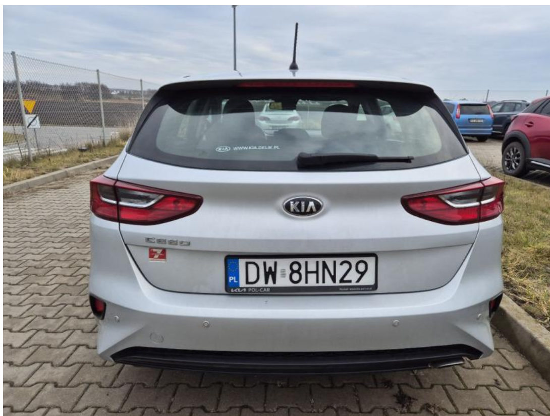
Fot. 8 Tył