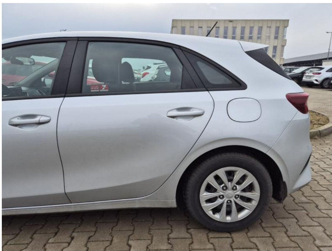
Fot. 10 Bok lewy z tyłu