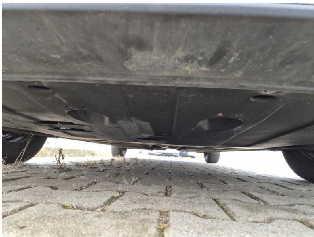
Fot. 26 Spód pojazdu przód