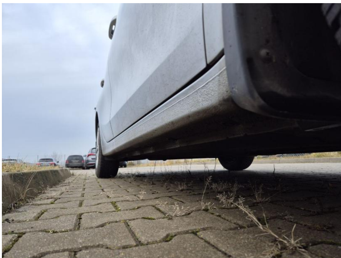
Fot. 4 Próg prawy (widok od przodu)