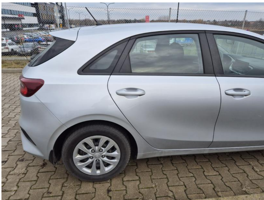
Fot. 6 Bok prawy z tyłu