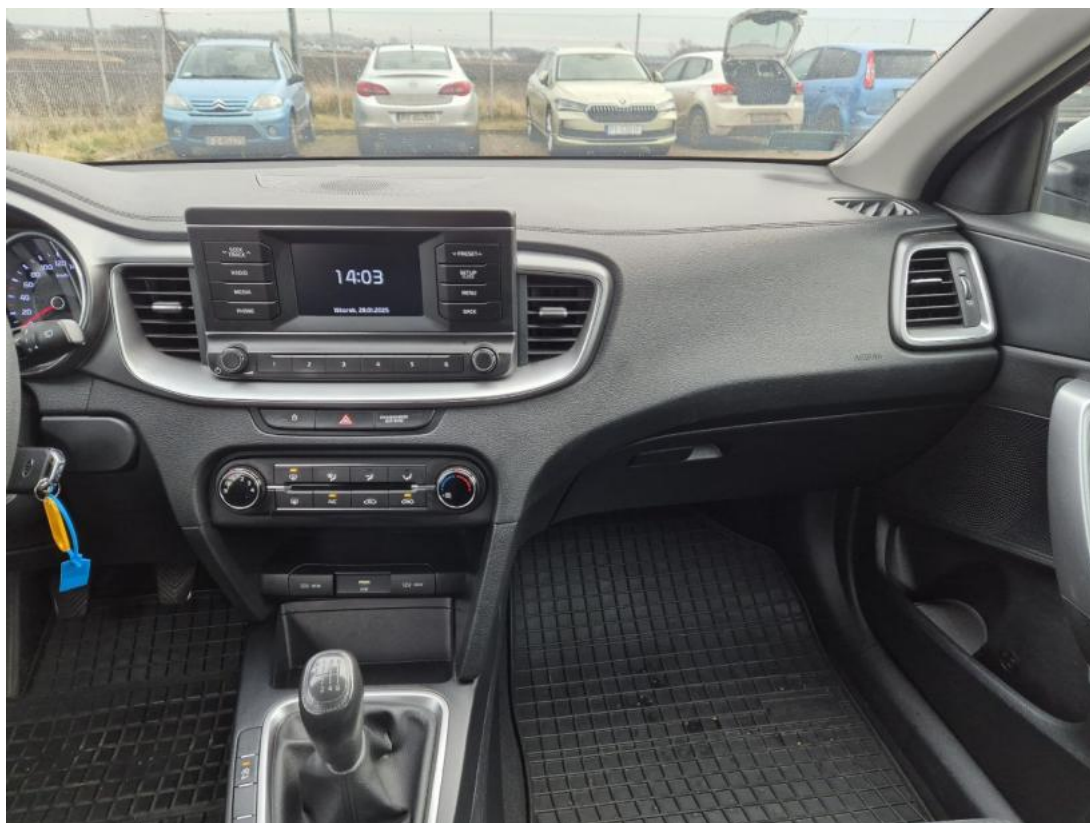
Fot. 19 Konsola środkowa