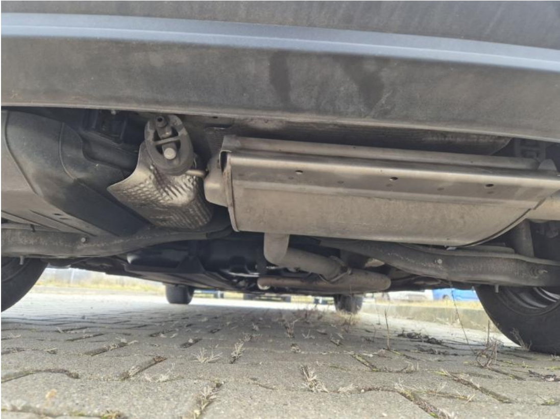
Fot. 27 Spód pojazdu tył