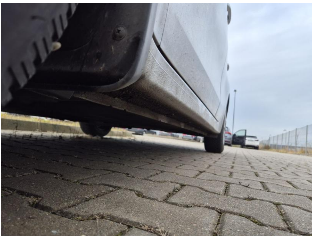
Fot. 12 Próg lewy (widok od przodu)