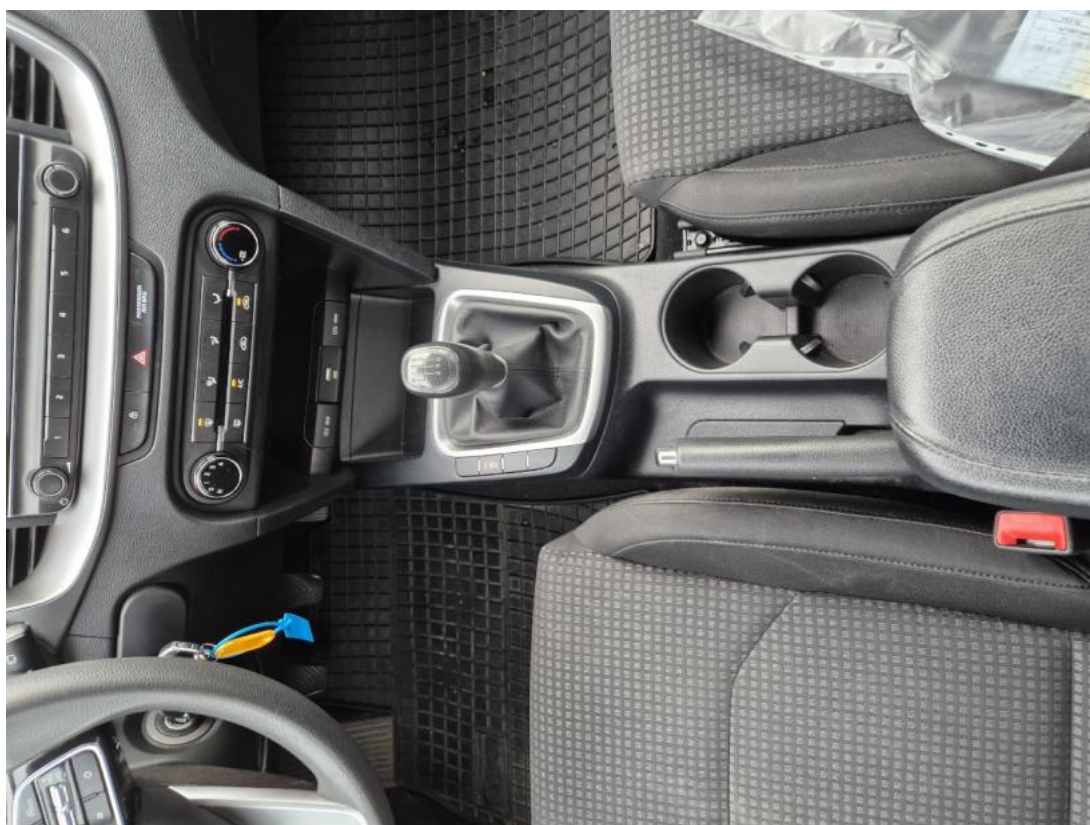
Fot. 20 Tuneł środkowy