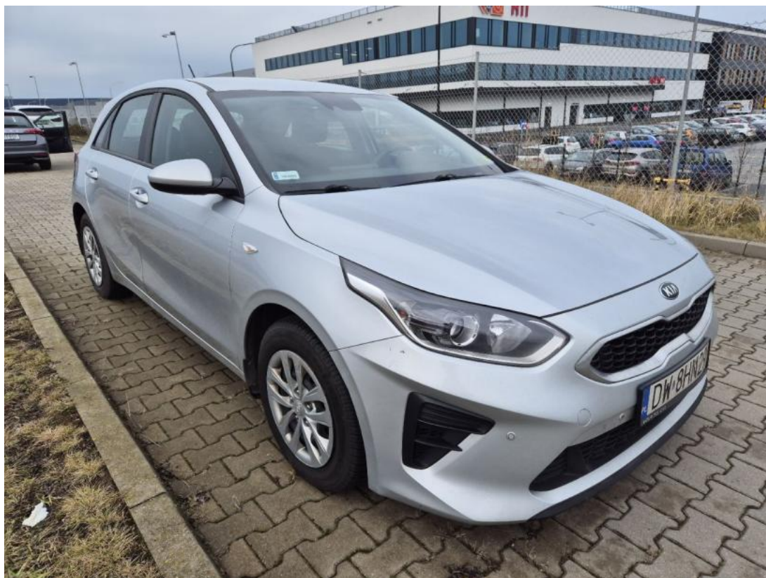
Fot. 3 Przekątna przednia prawa