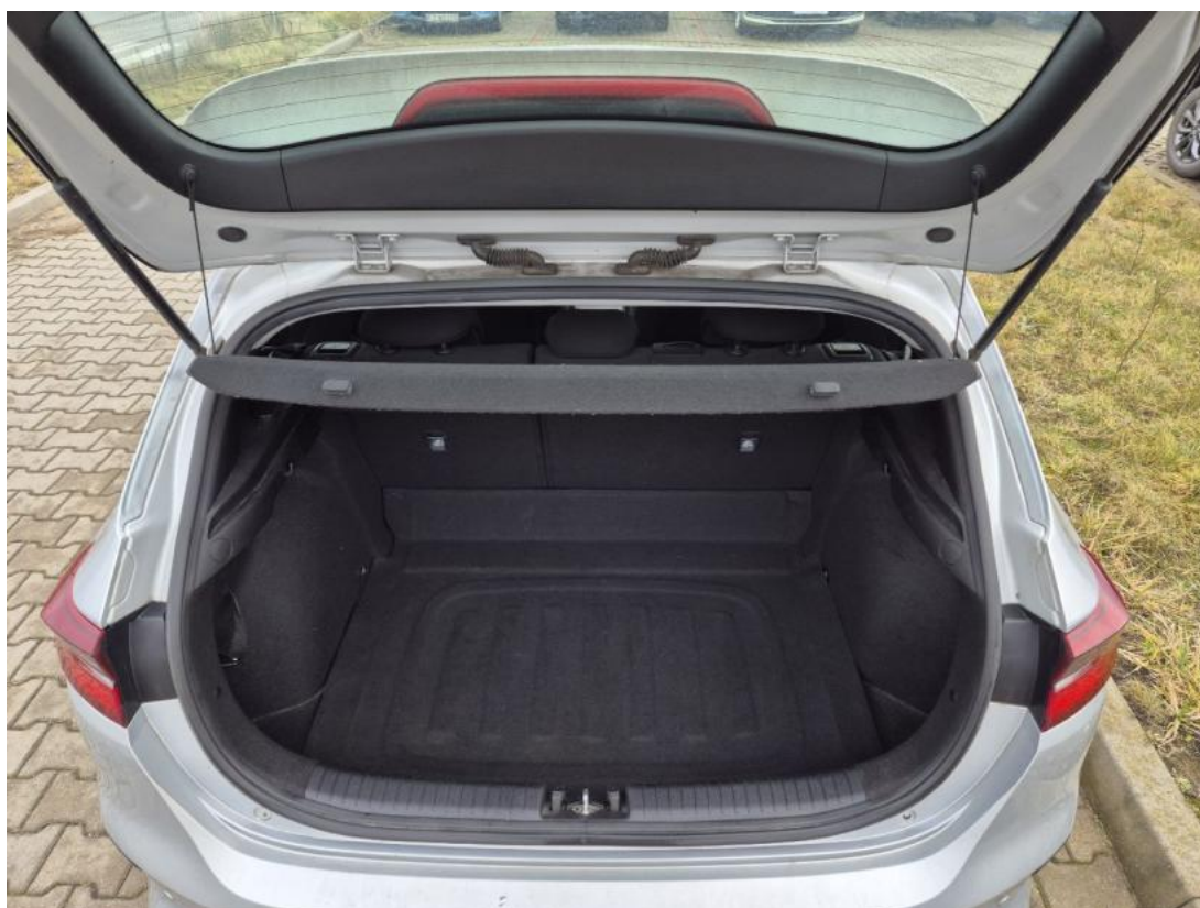
Fot. 24 Bagażnik