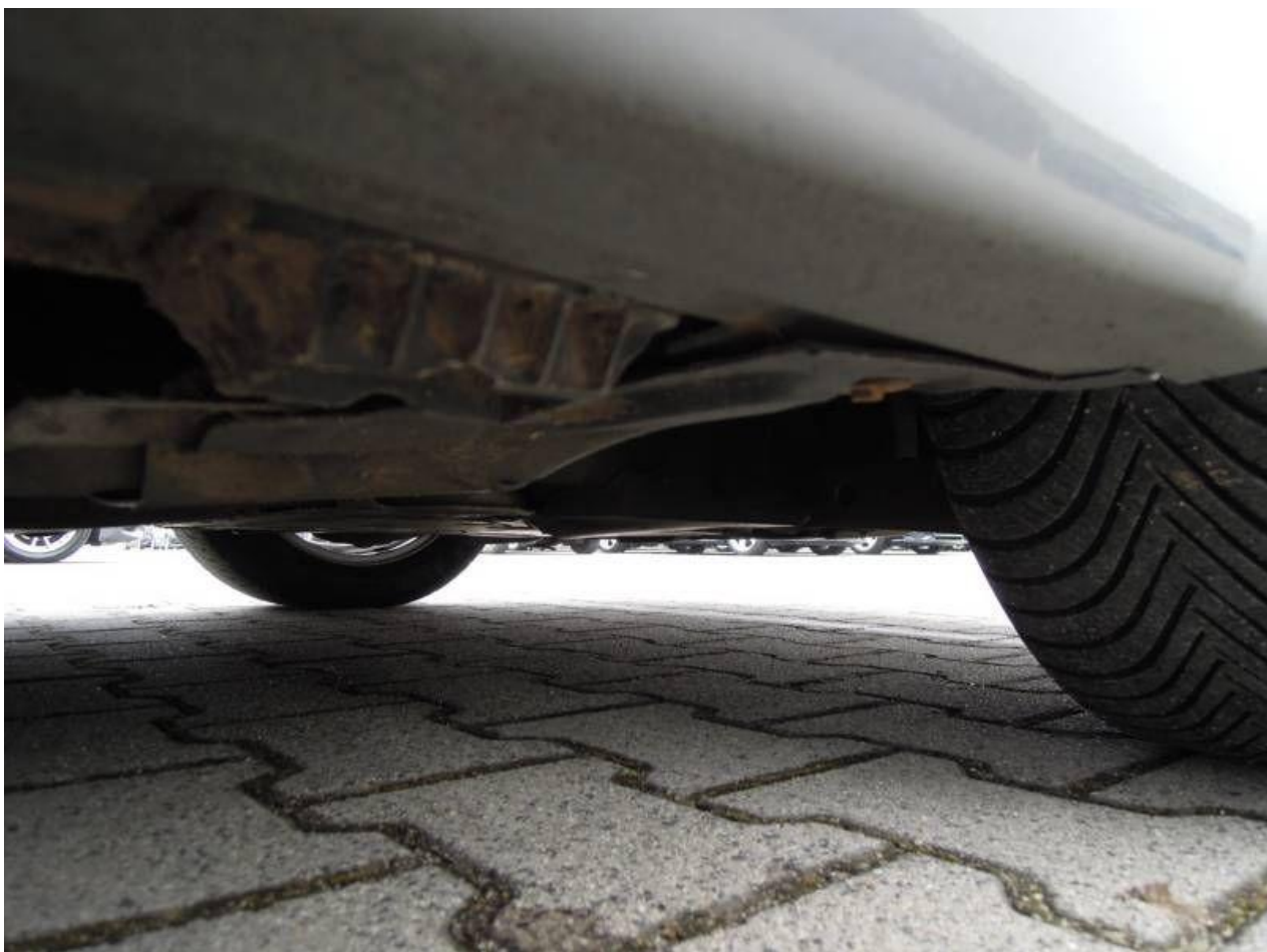
Fot. nr 66