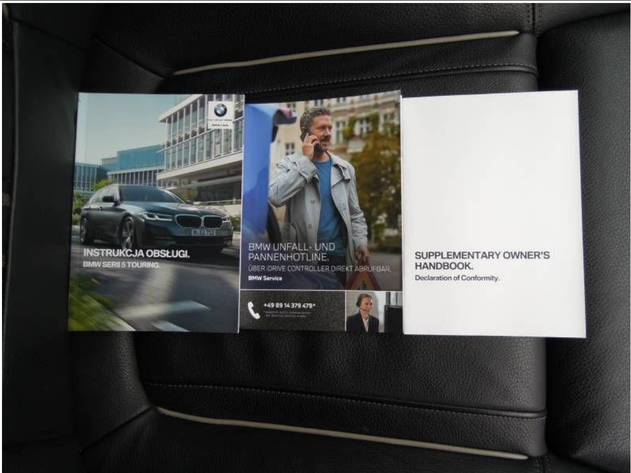
Fot. nr 71