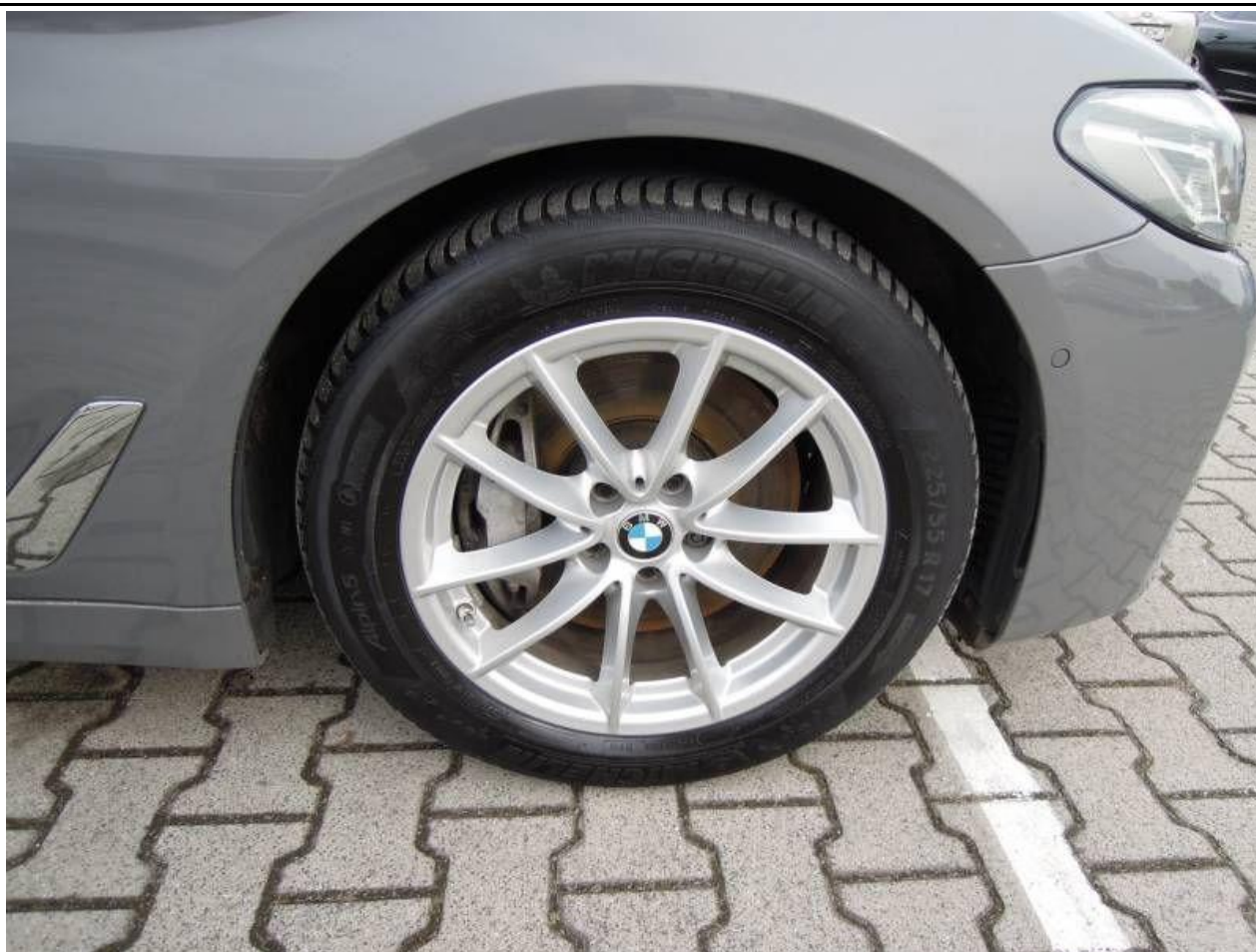
Fot. nr 61