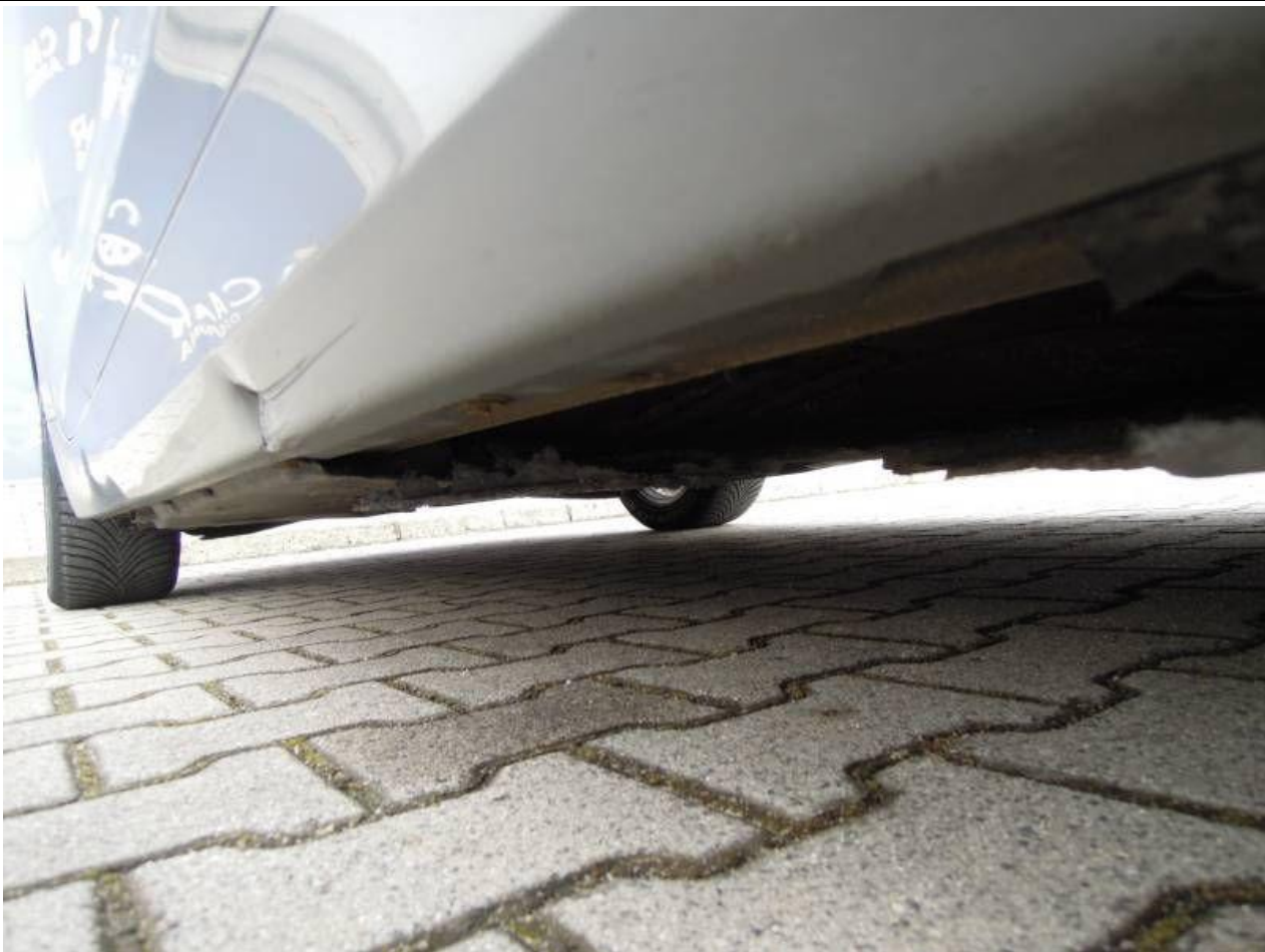
Fot. nr 67