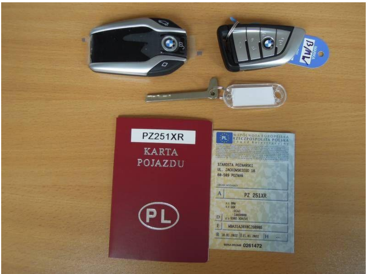
Fot. nr 72