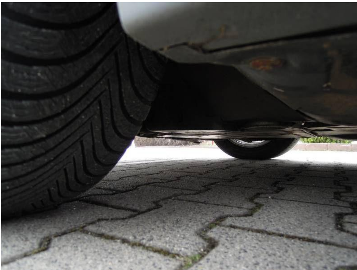
Fot. nr 64