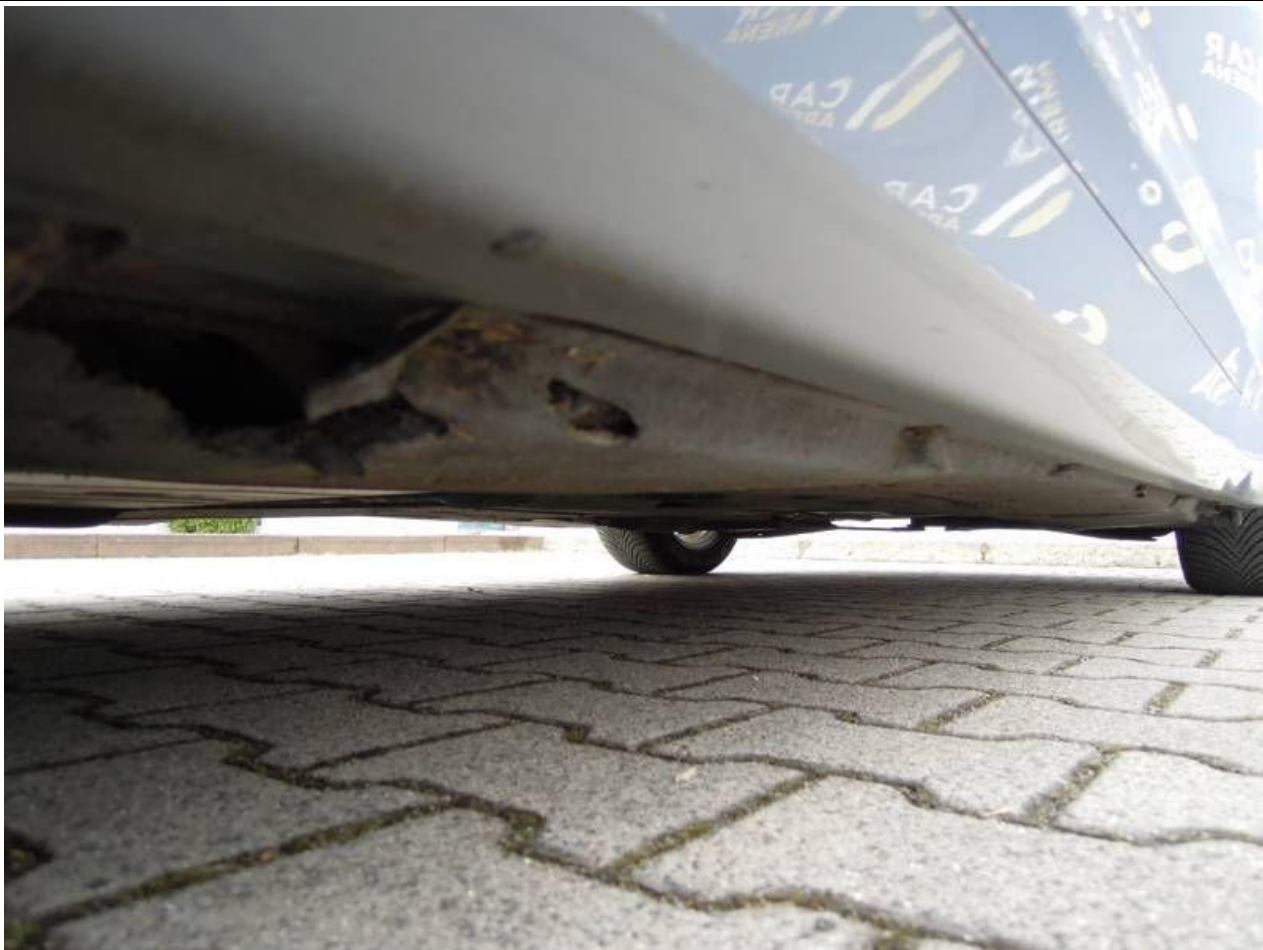
Fot. nr 65