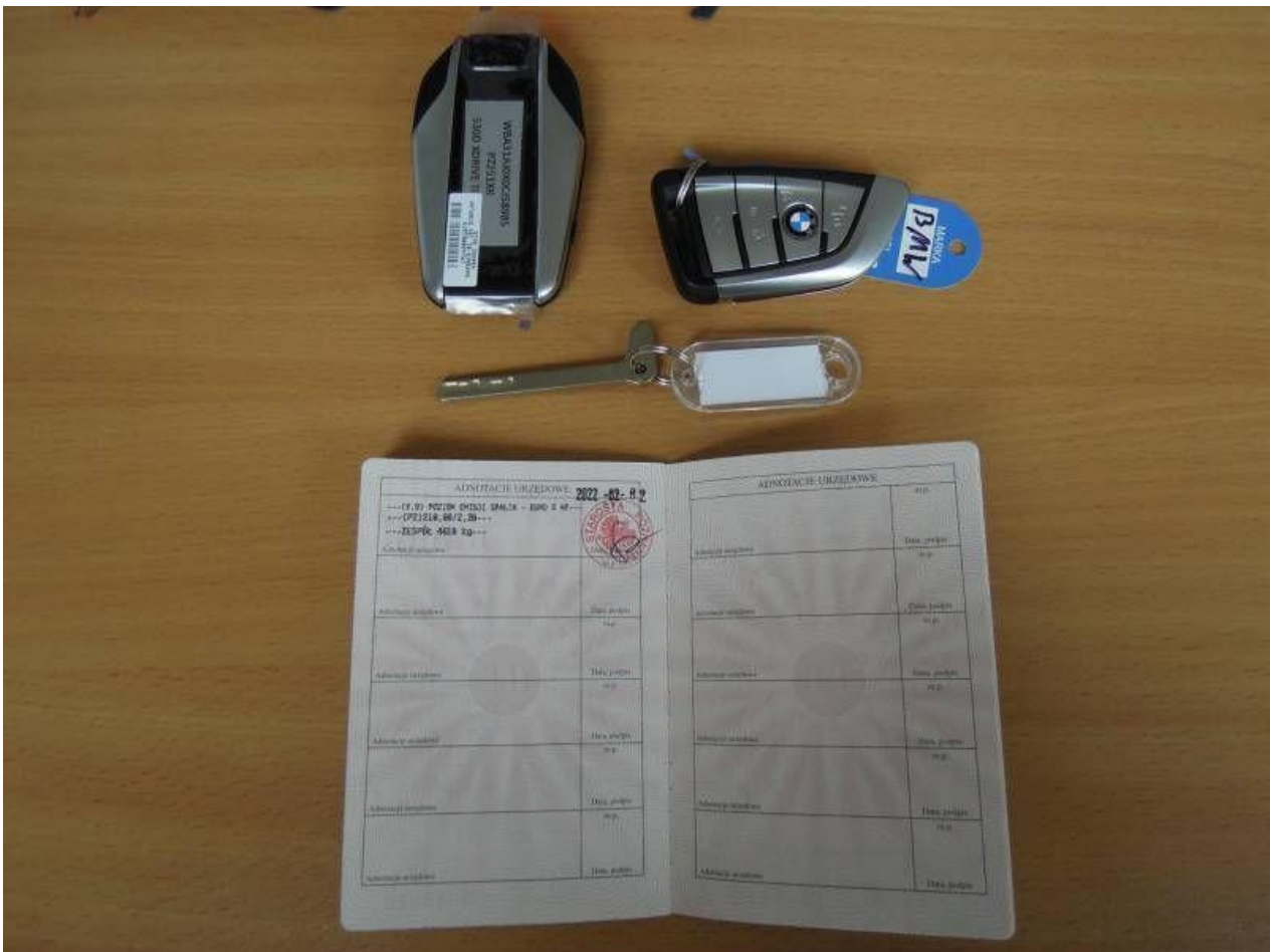
Fot. nr 74