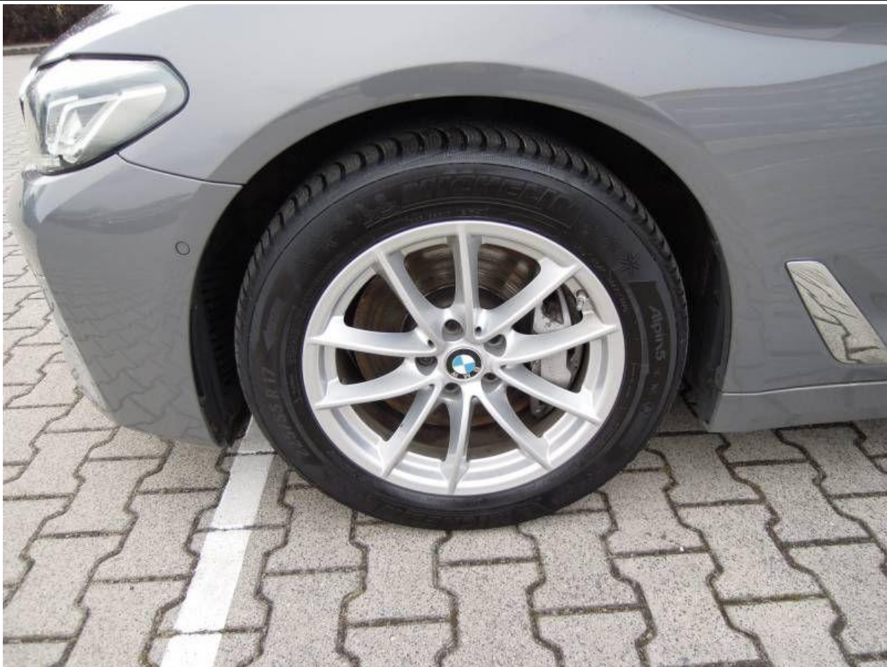
Fot. nr 59