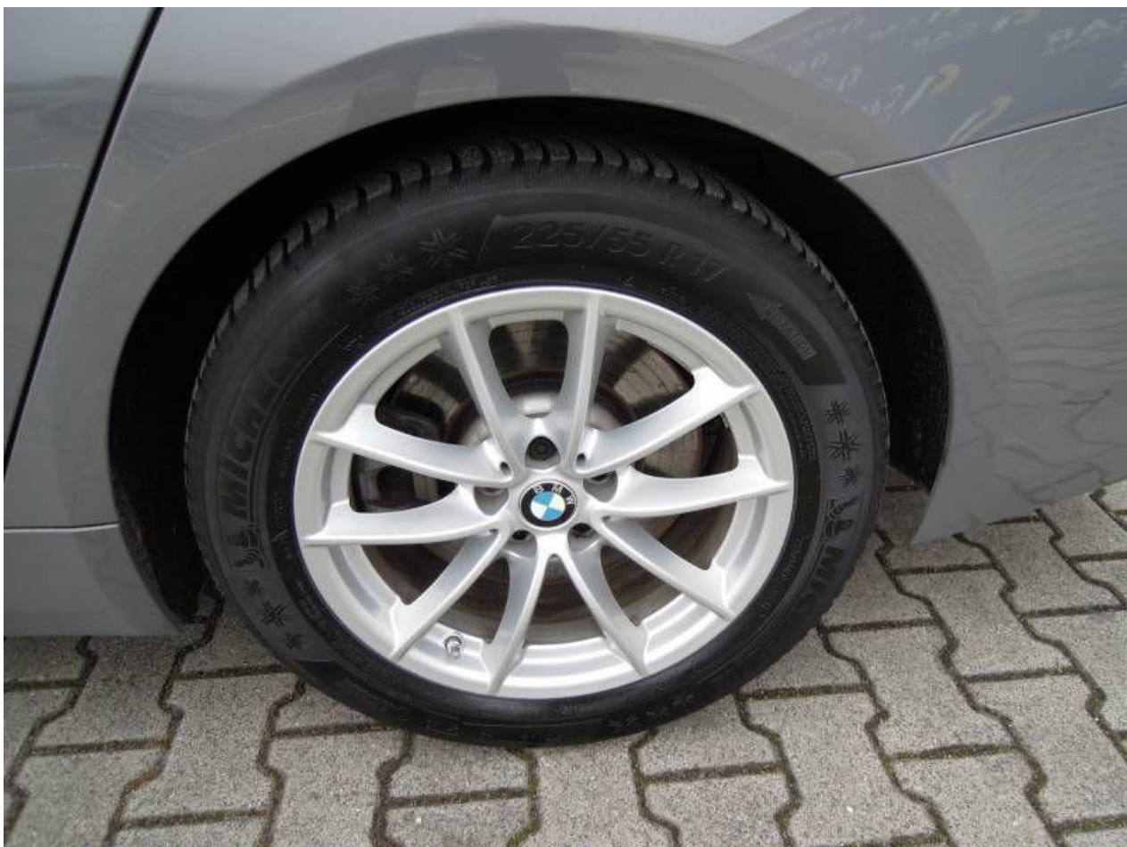
Fot. nr 60