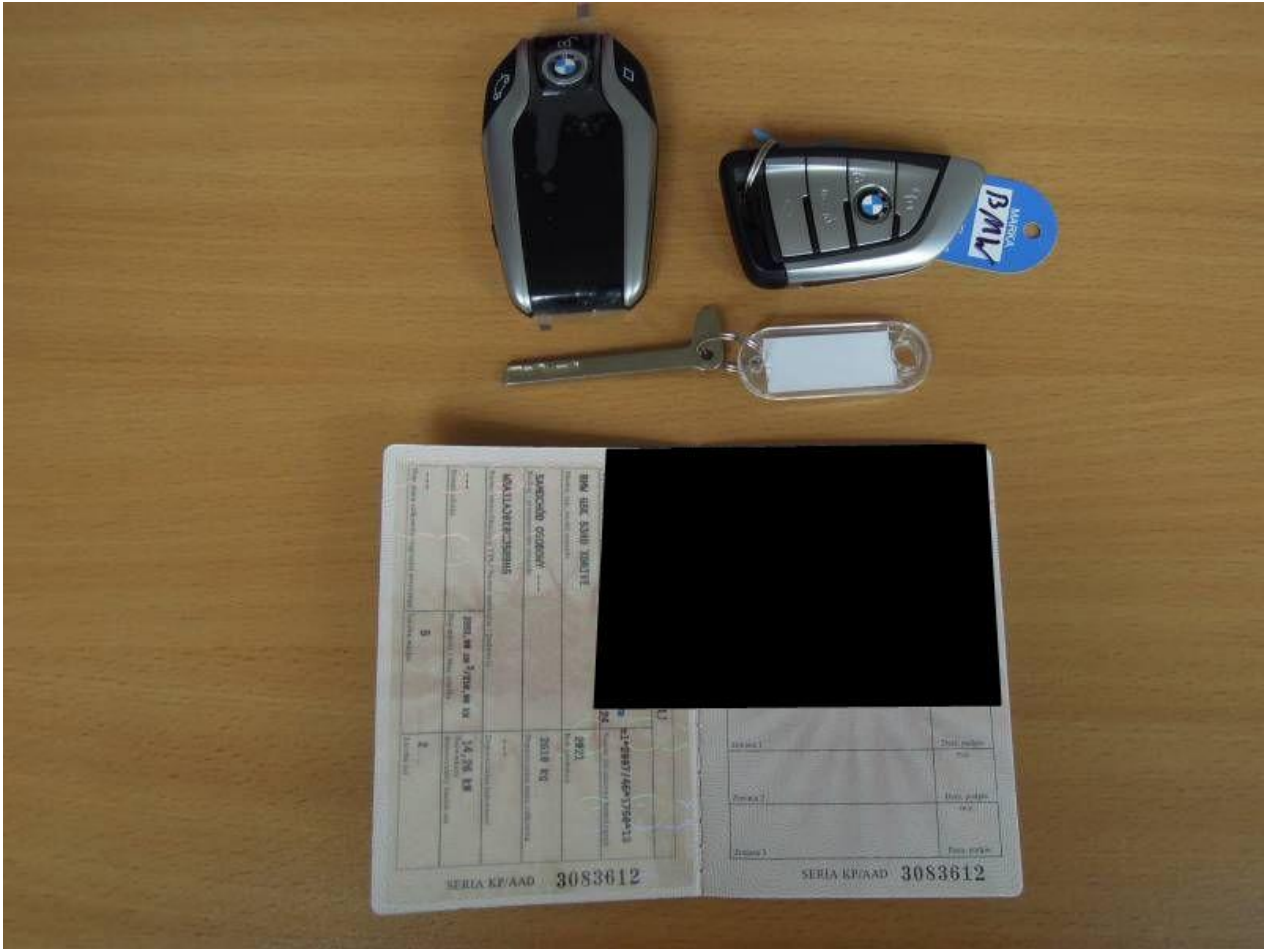
Fot. nr 73