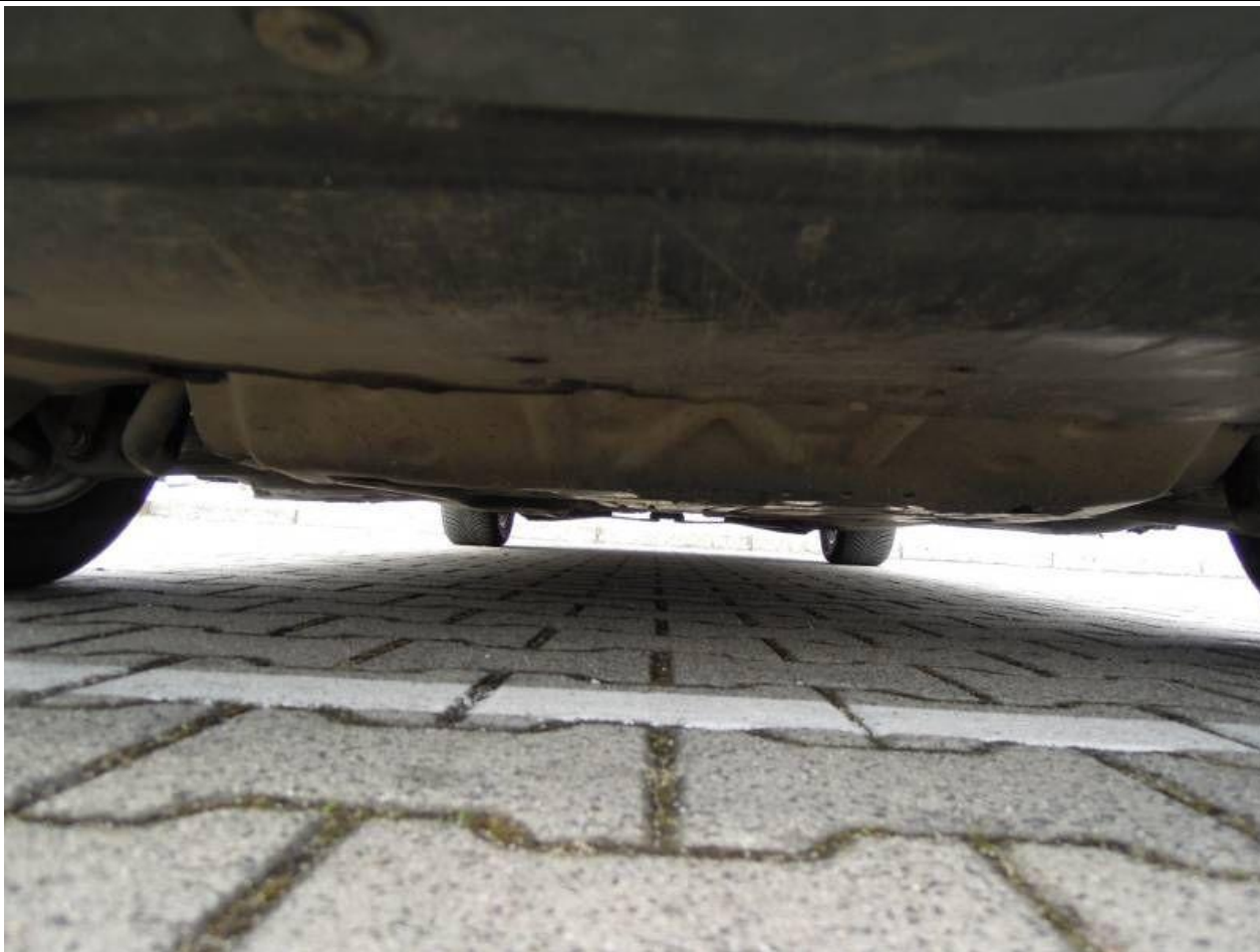
Fot. nr 63