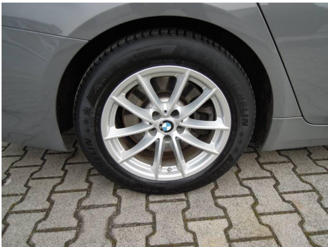
Fot. nr 62