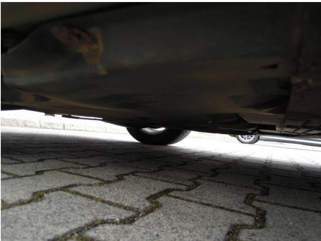
Fot. nr 68