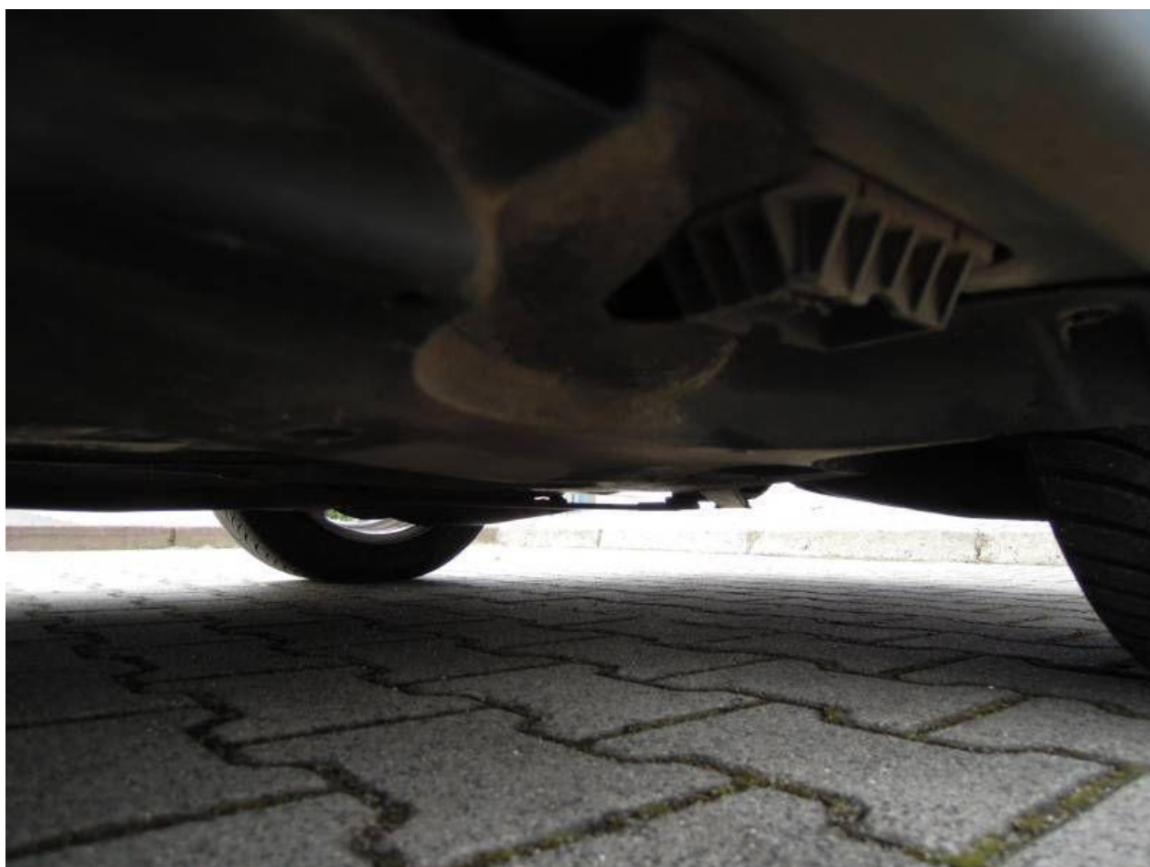
Fot. nr 70