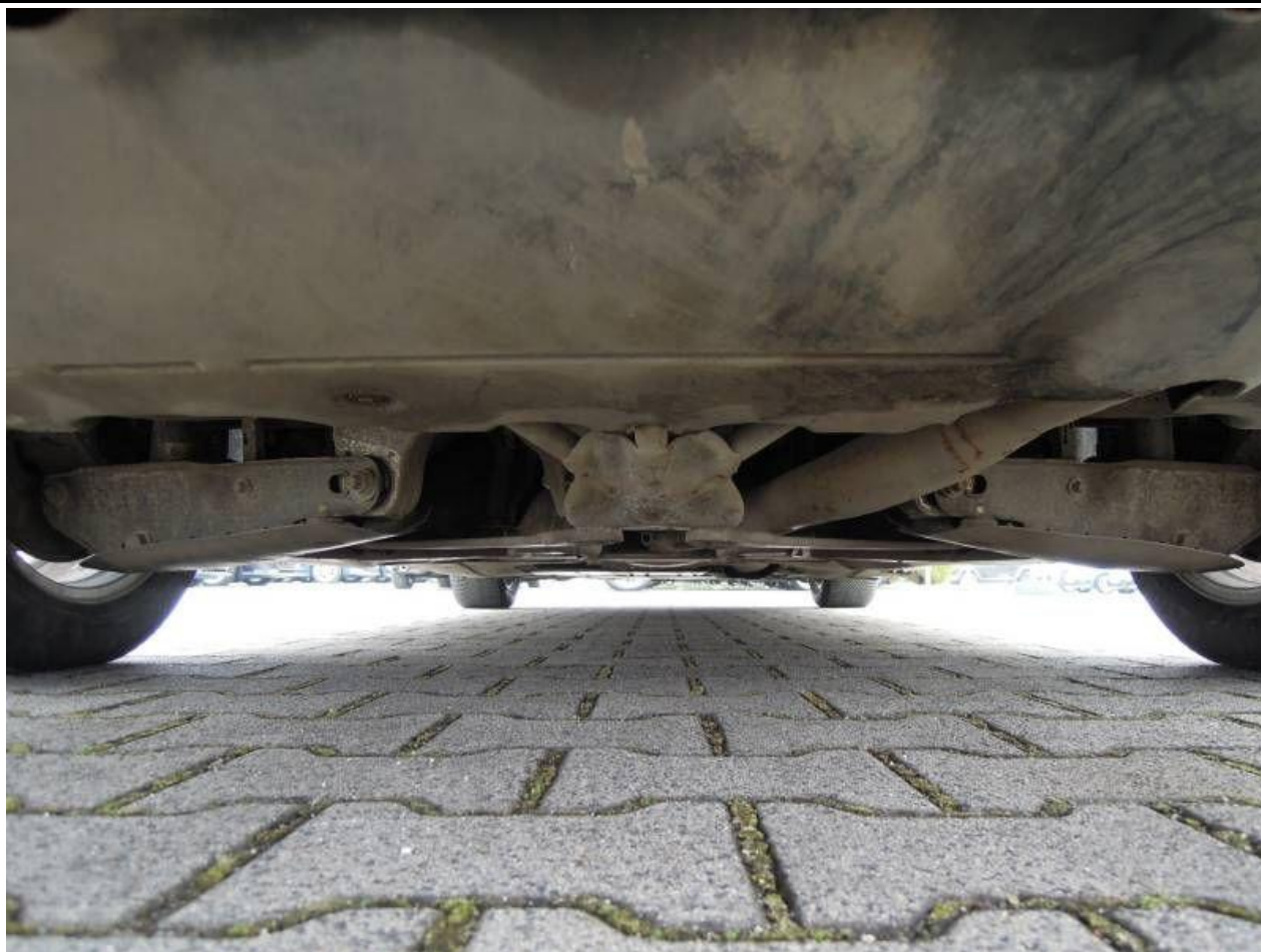
Fot. nr 69