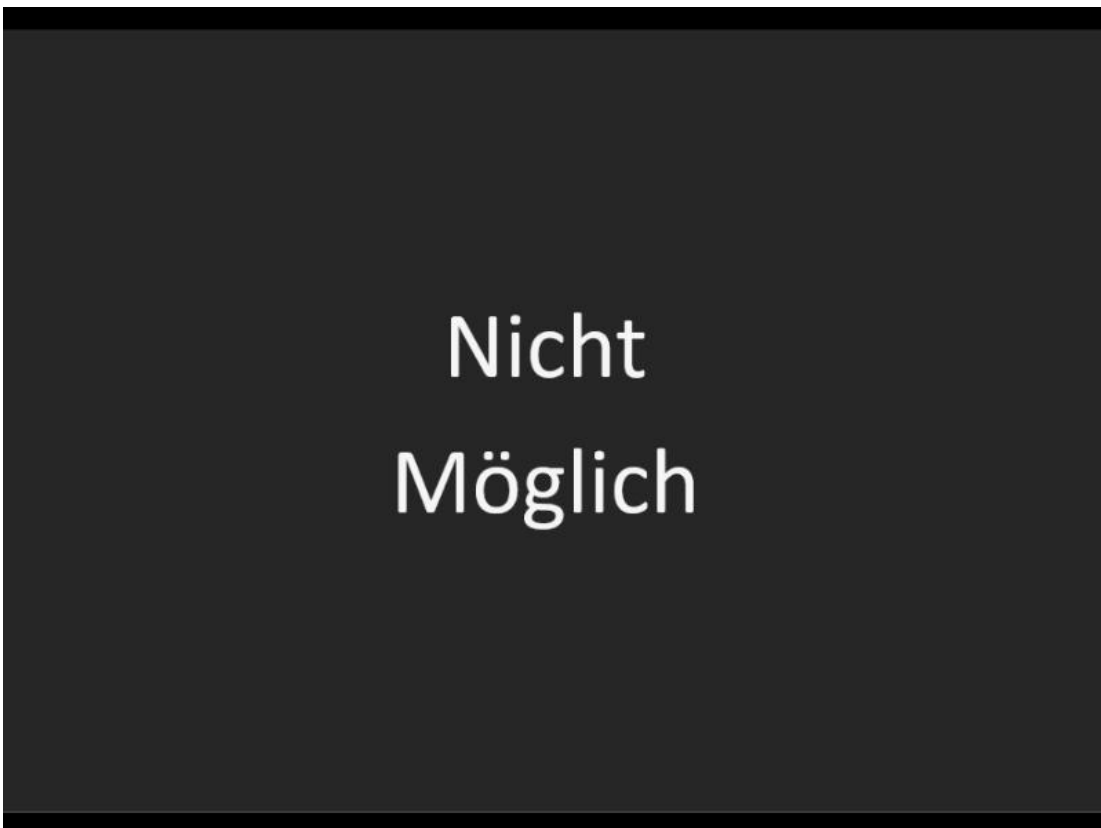
Innenraum durch Türe hinten rechts