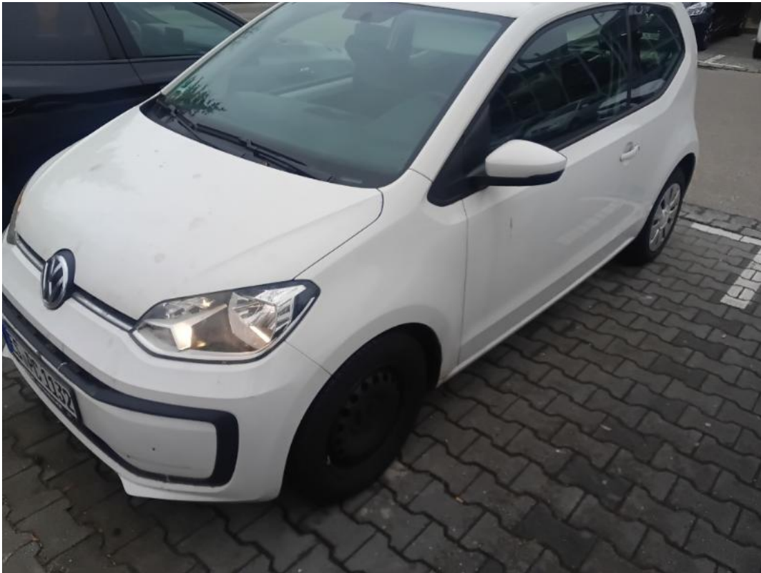
Diagonale vorne links