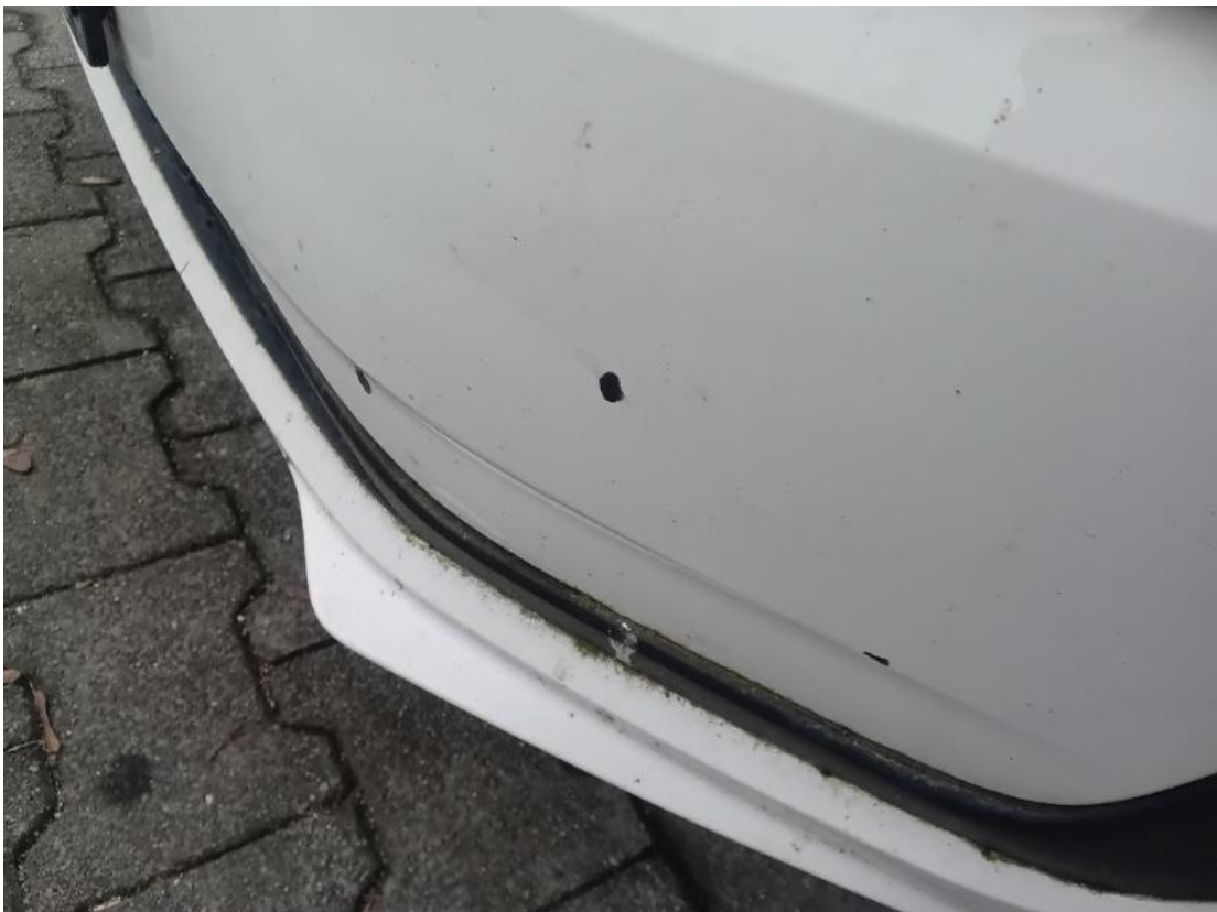
4. Stoßfänger vorne - Lackbeschädigung