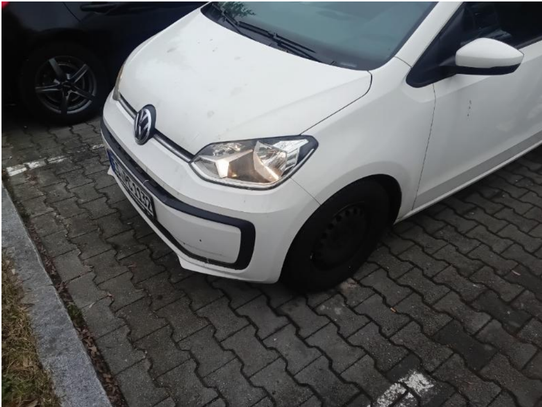
4. Stoßfänger vorne - Lackbeschädigung