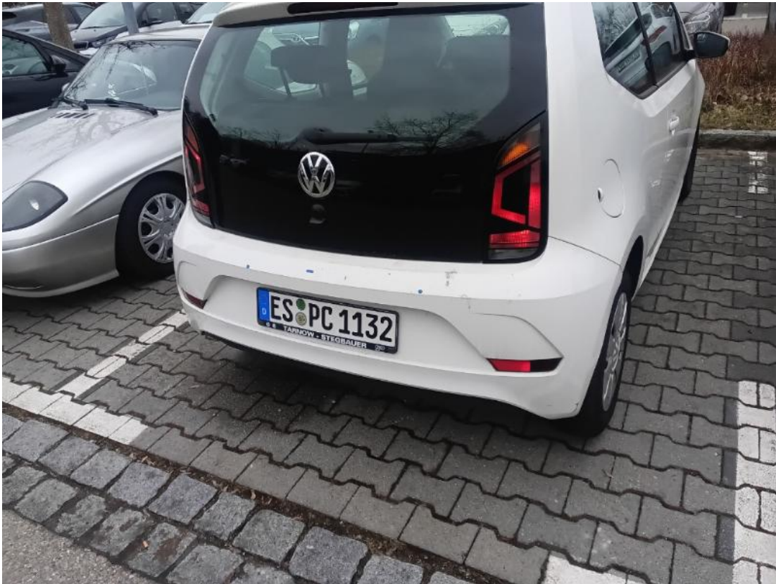
2. Heckblende - Klebereste