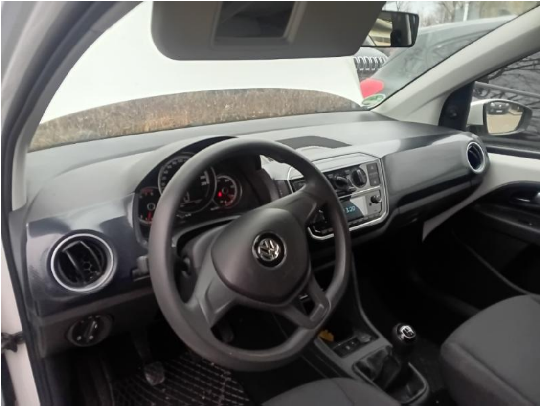
Armaturenbrett von der hinteren Sitzbank