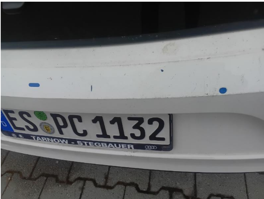
2. Heckblende - Klebereste