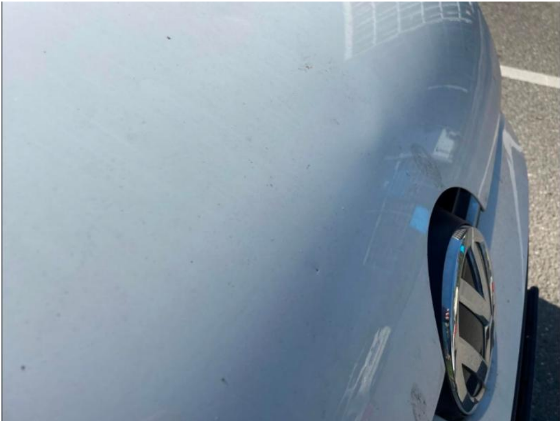
8. Motorhaube - Verformt