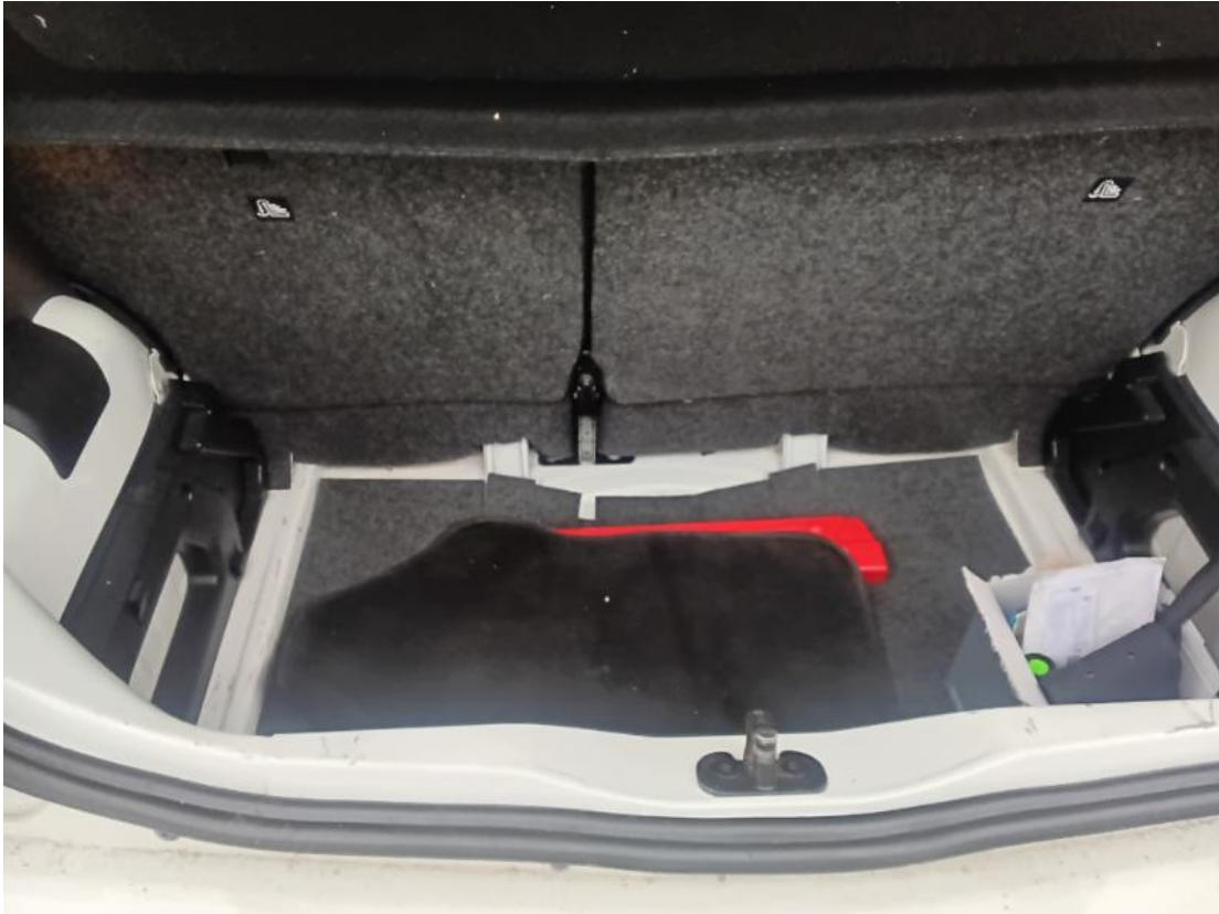
Kofferraum / Laderaum