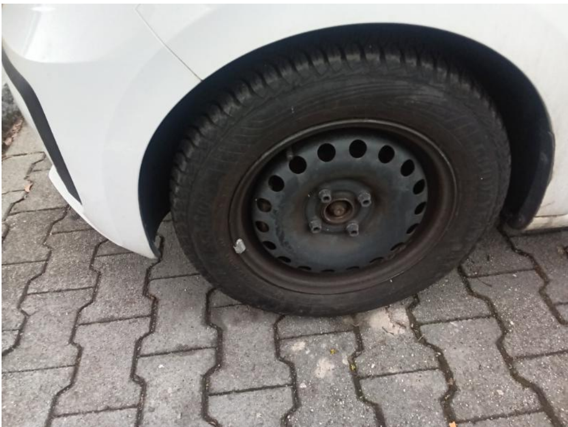
Montiertes Rad vorn links