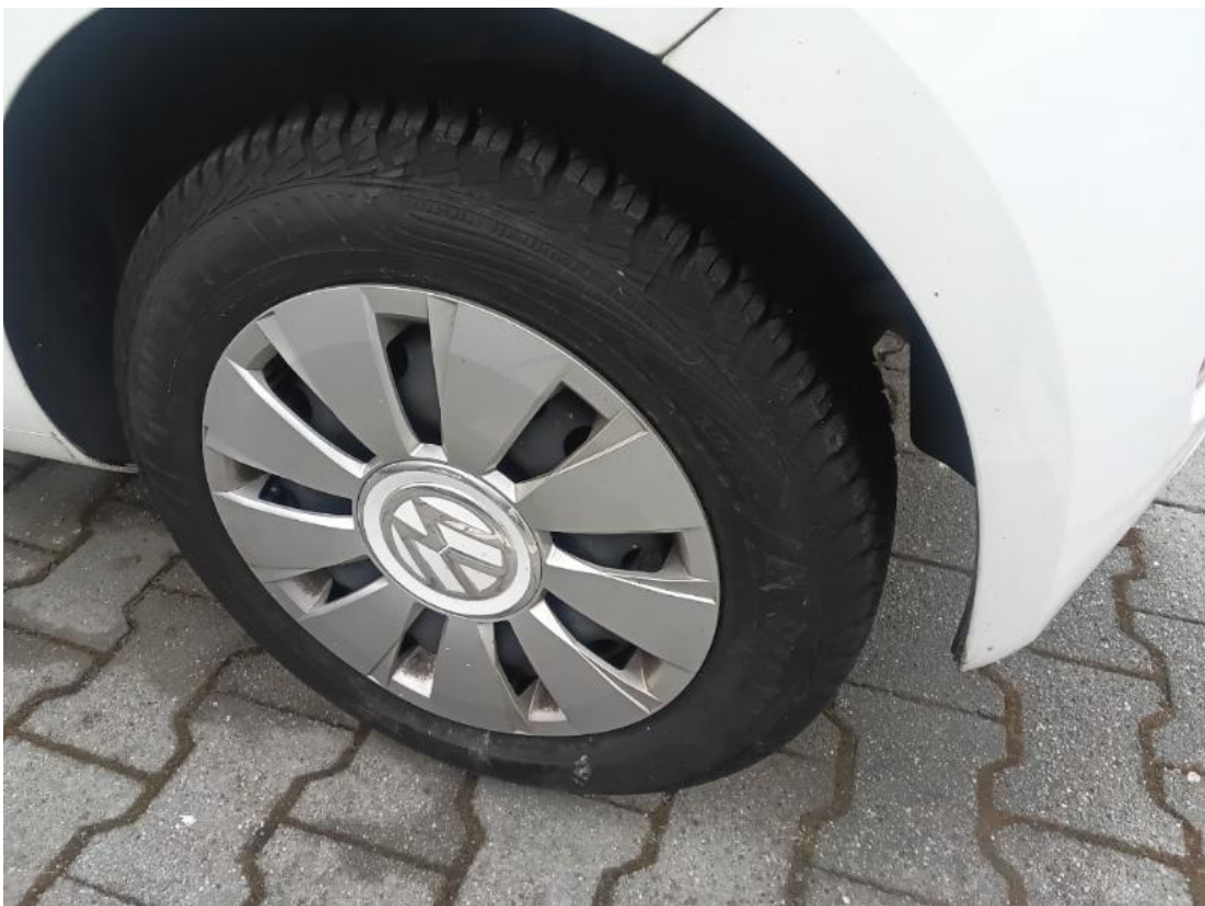
Montiertes Rad hinten links