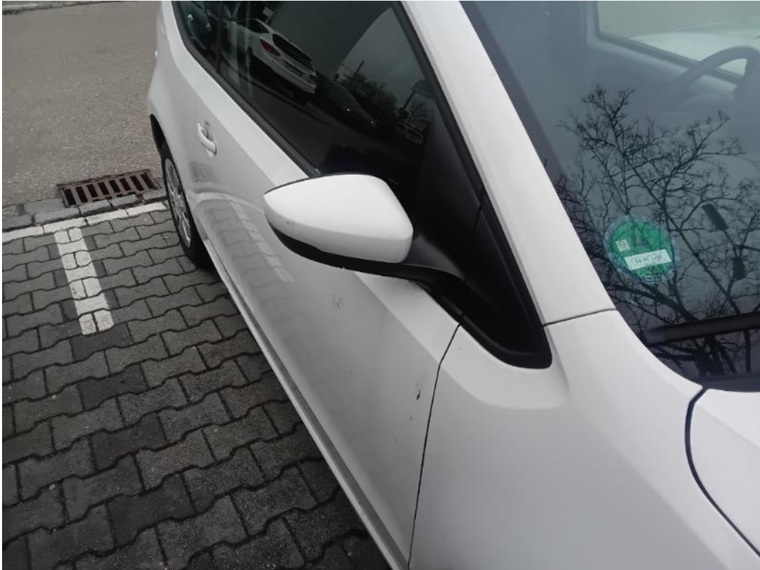
3. Spiegelgehäuse rechts - Verkratzt