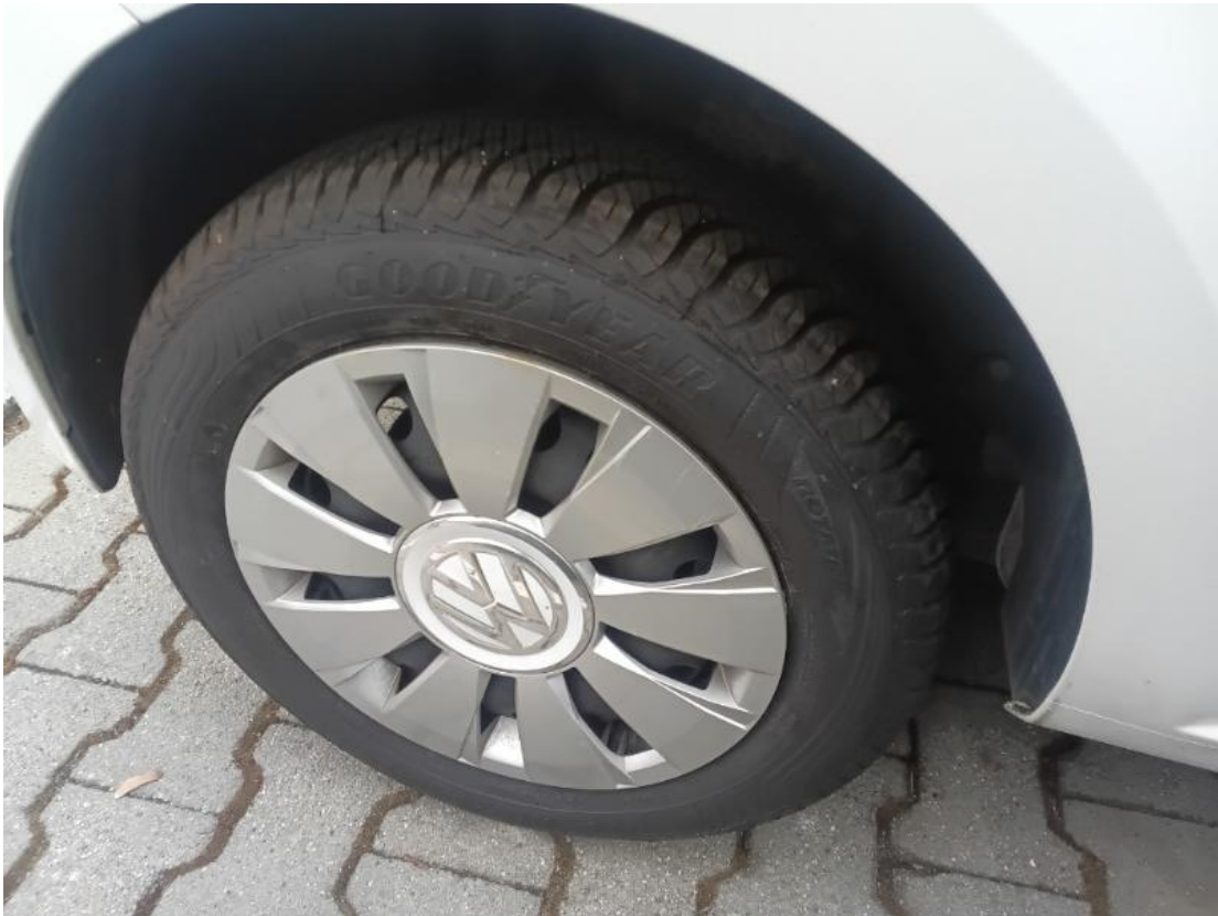
Montiertes Rad hinten rechts