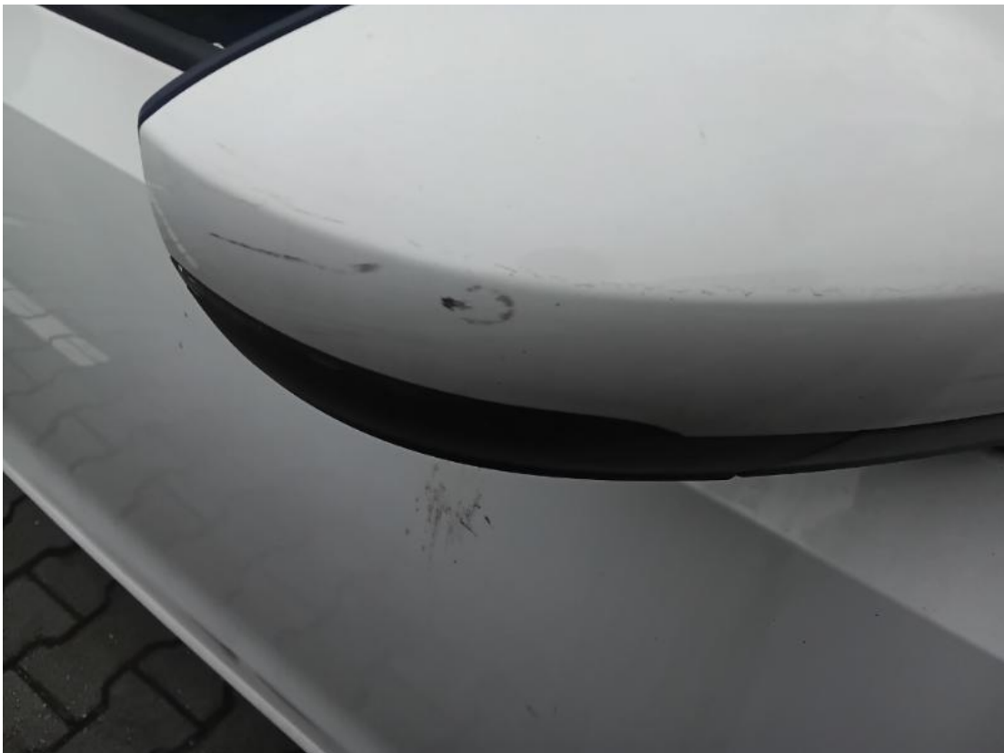
3. Spiegelgehäuse rechts - Verkratzt