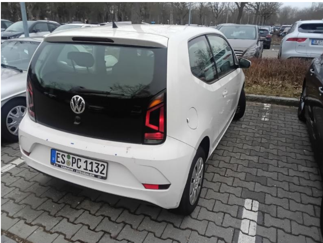
Diagonale hinten rechts