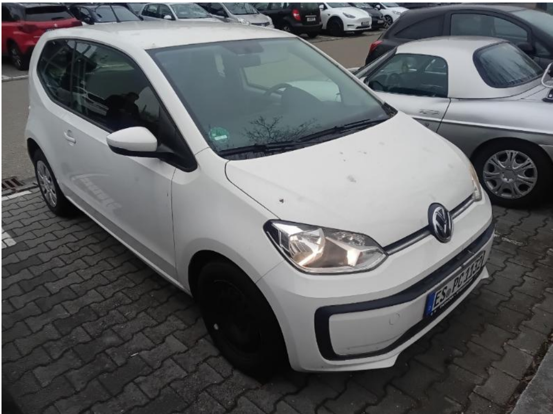
Diagonale vorne rechts