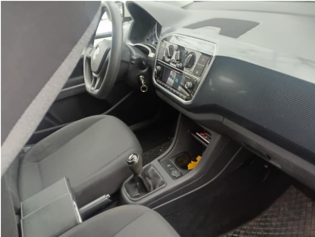
Innenraum durch Tür vorne rechts