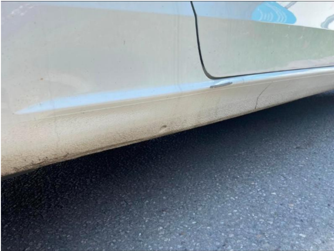
6. Schweller rechts - Kratzer