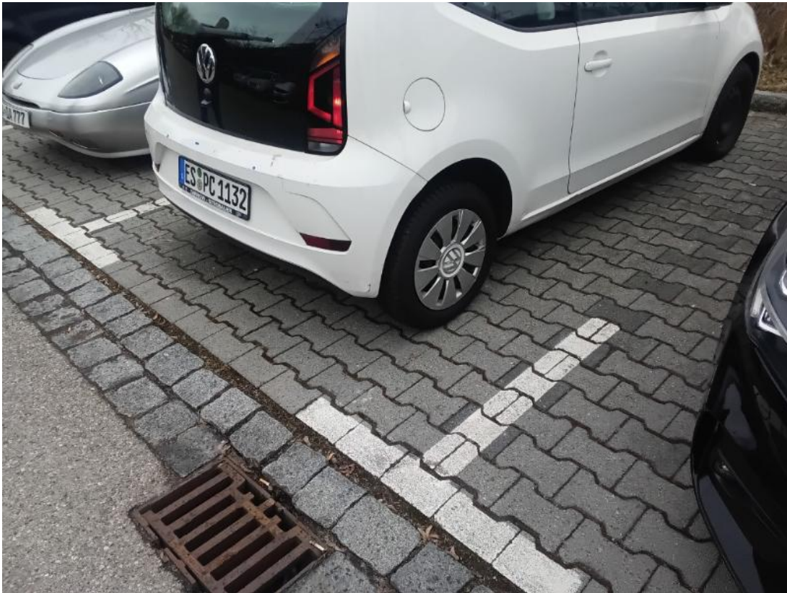
1. Heckverkleidung - Lackbeschädigung