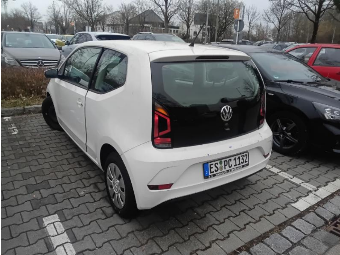
Diagonale hinten links