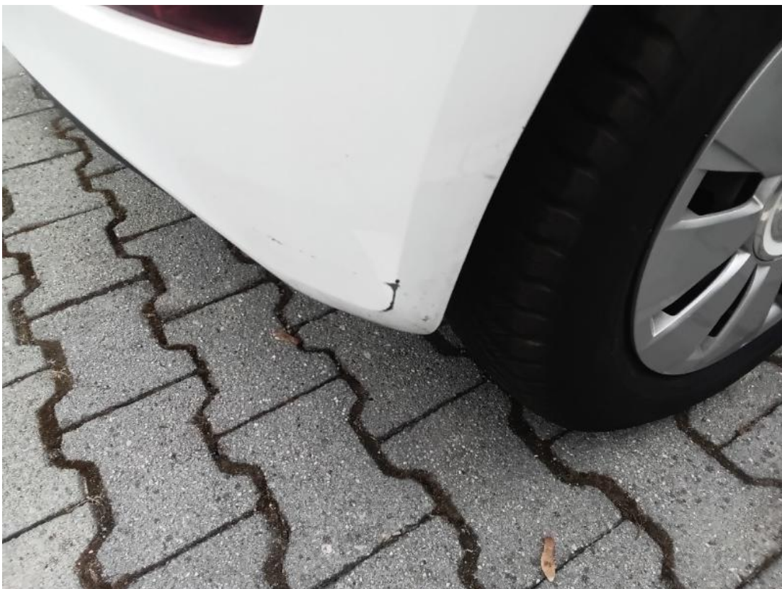
1. Heckverkleidung - Lackbeschädigung