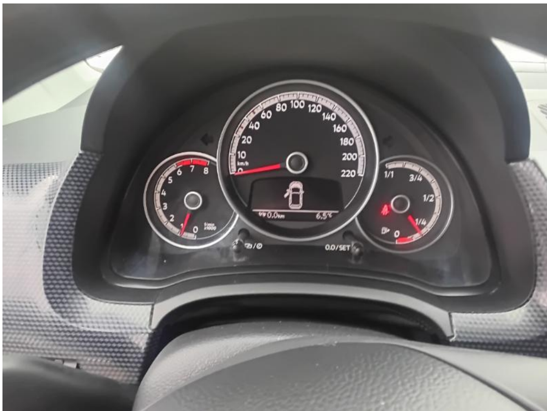
Tacho bei lfd. Motor