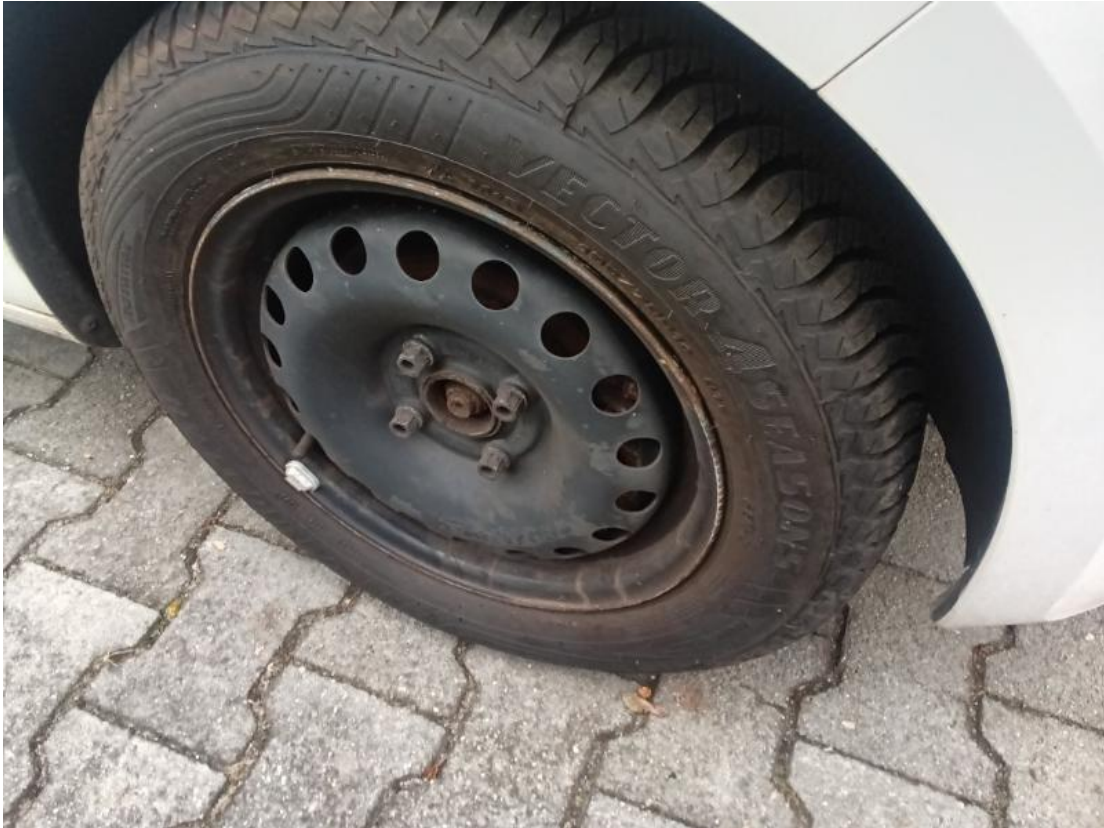
Montiertes Rad vorn rechts