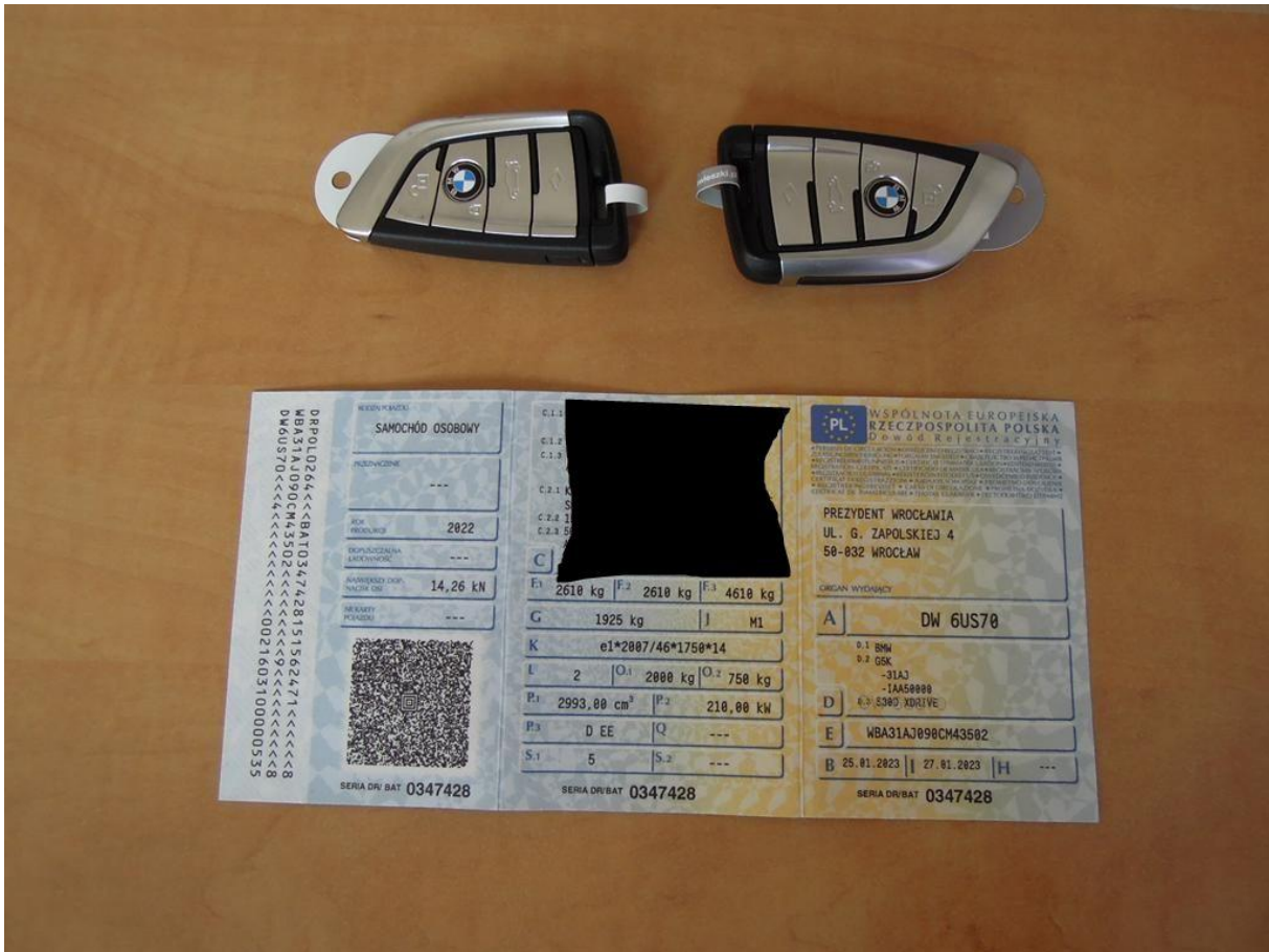
Fot. nr 61