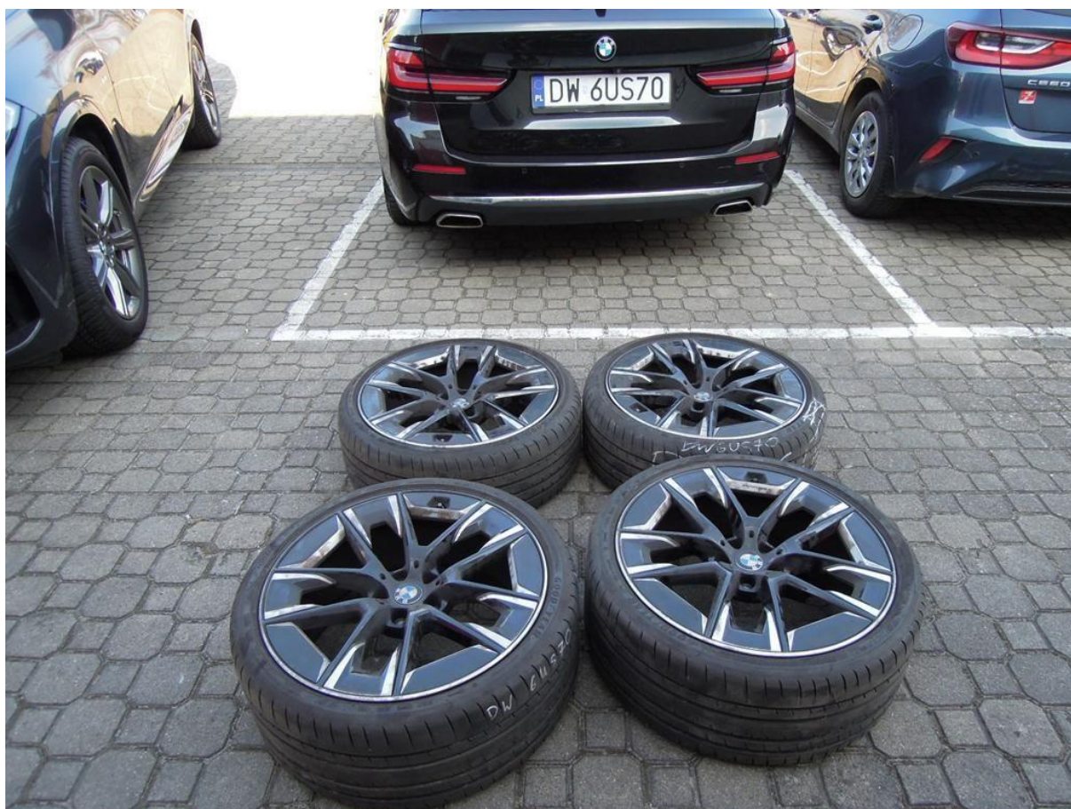
Fot. nr 60