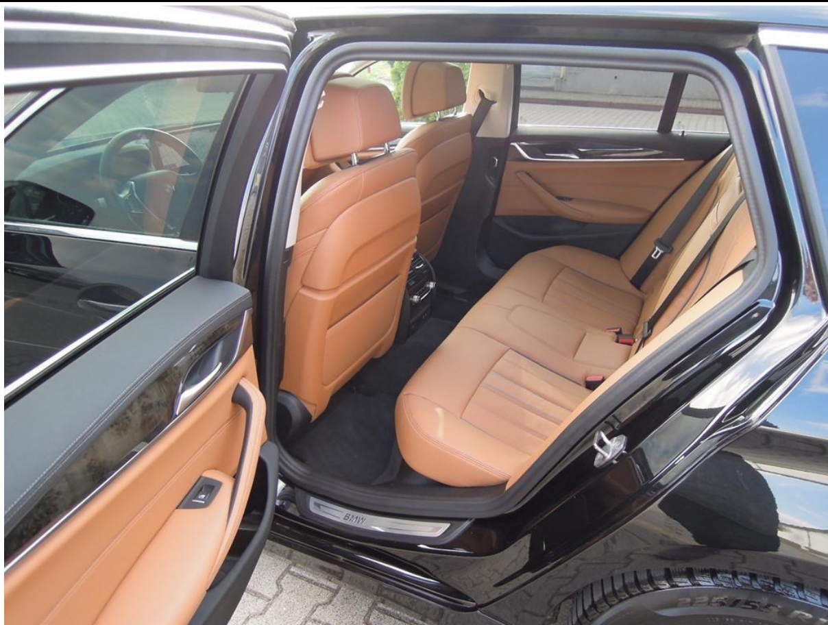
Fot. nr 17