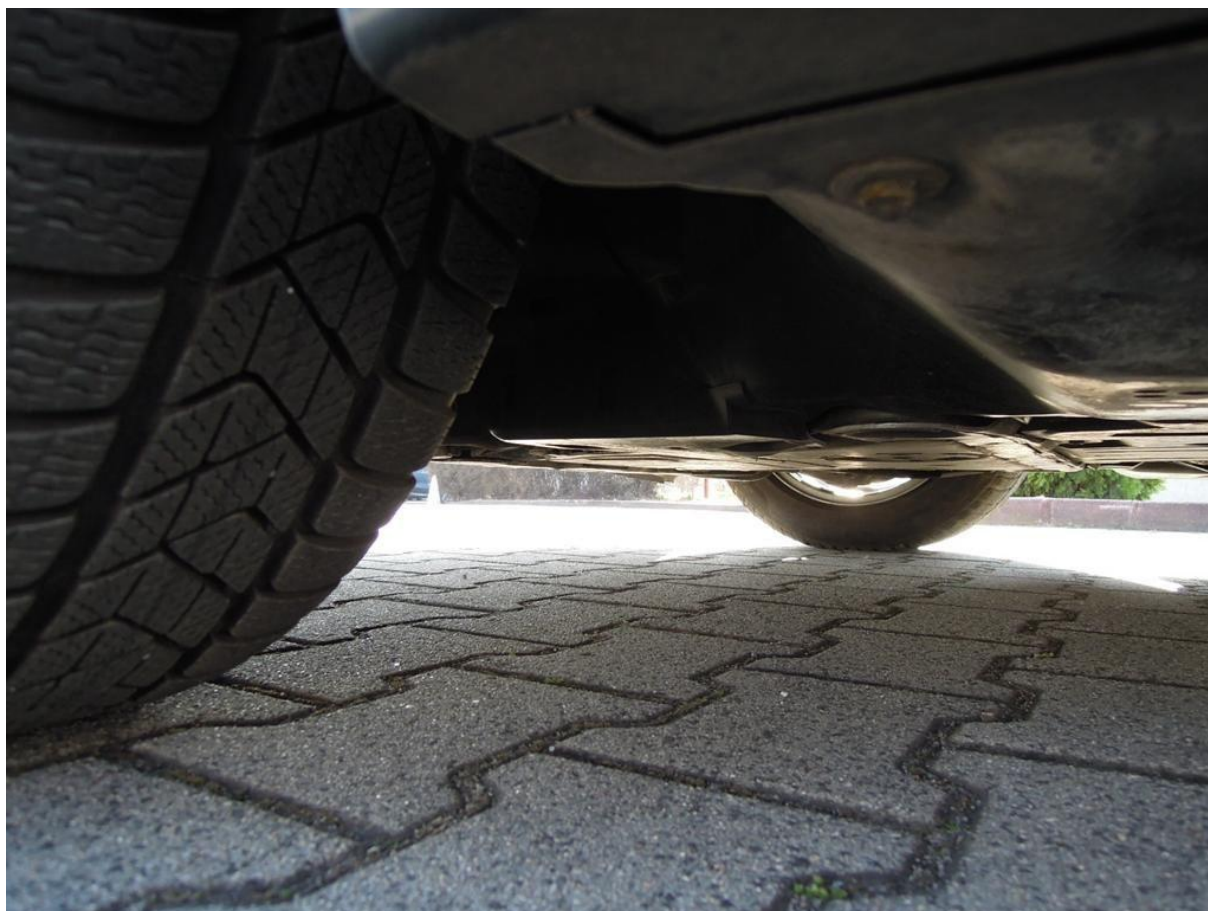
Fot. nr 52