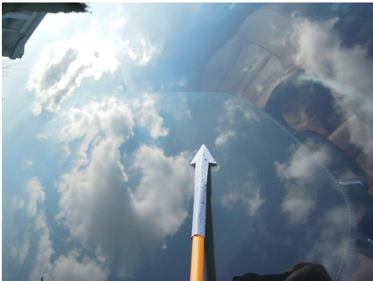
Fot. nr 38