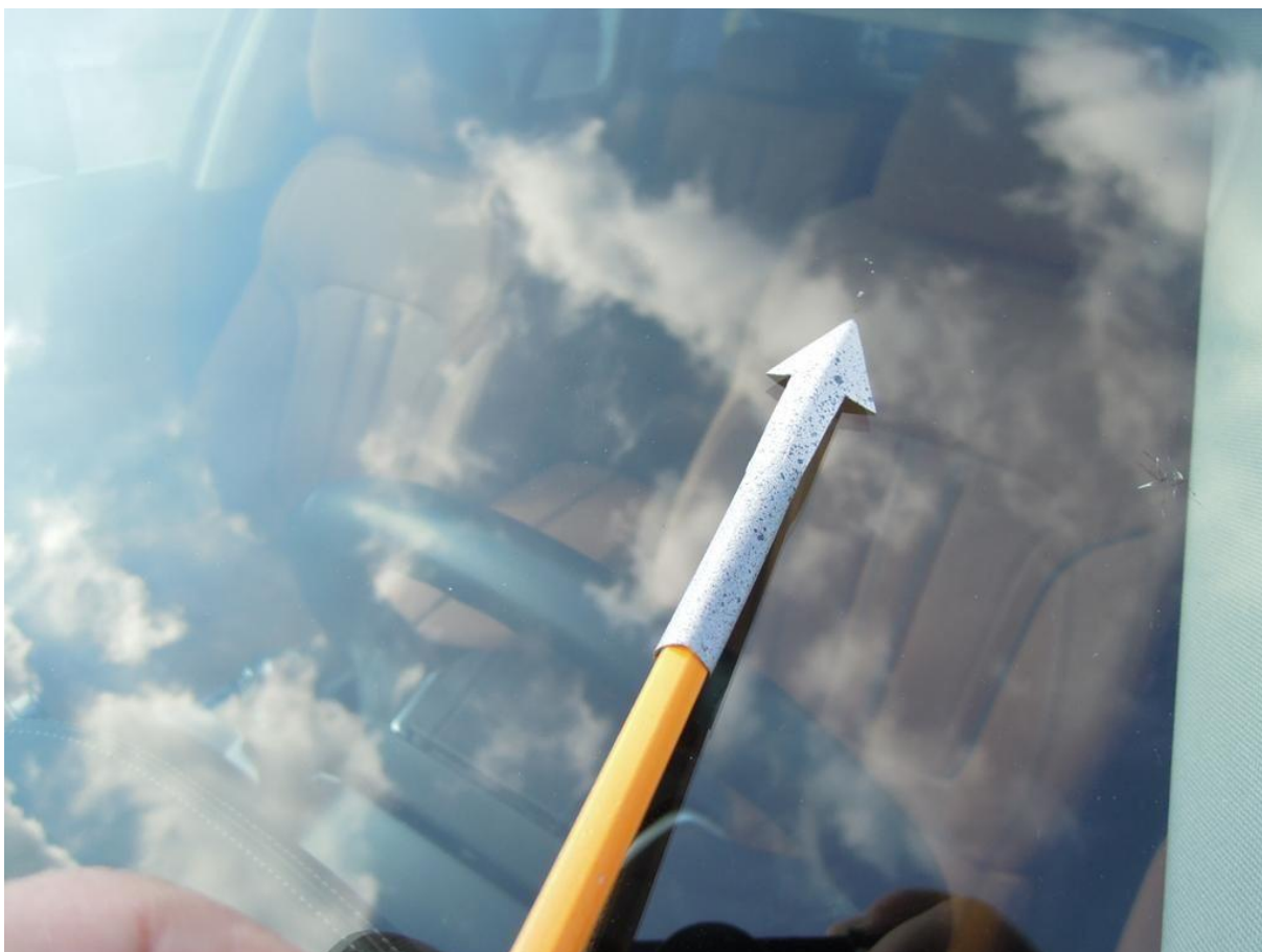
Fot. nr 40