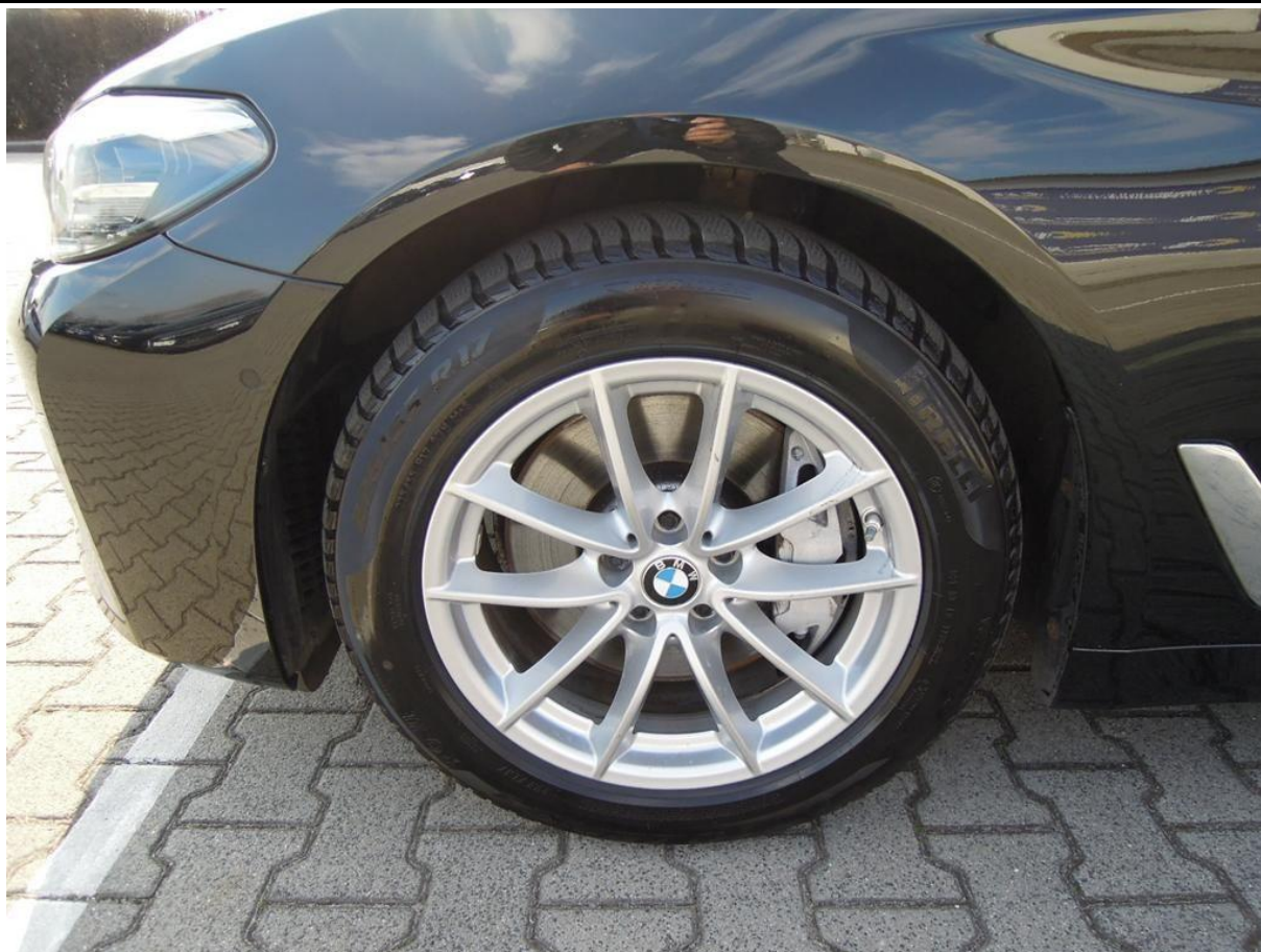
Fot. nr 47