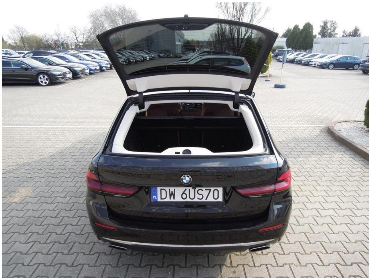
Fot. nr 20