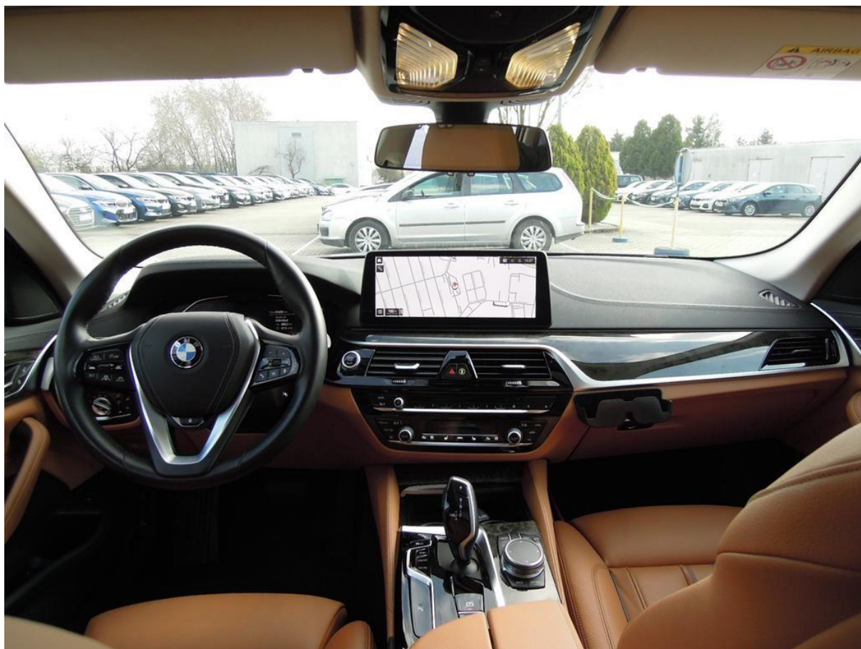
Fot. nr 18