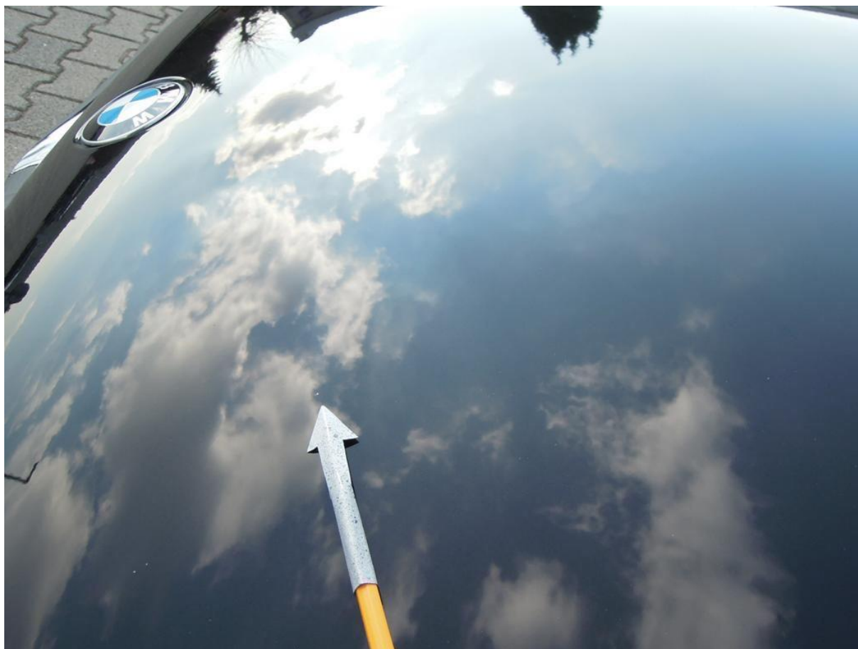
Fot. nr 34