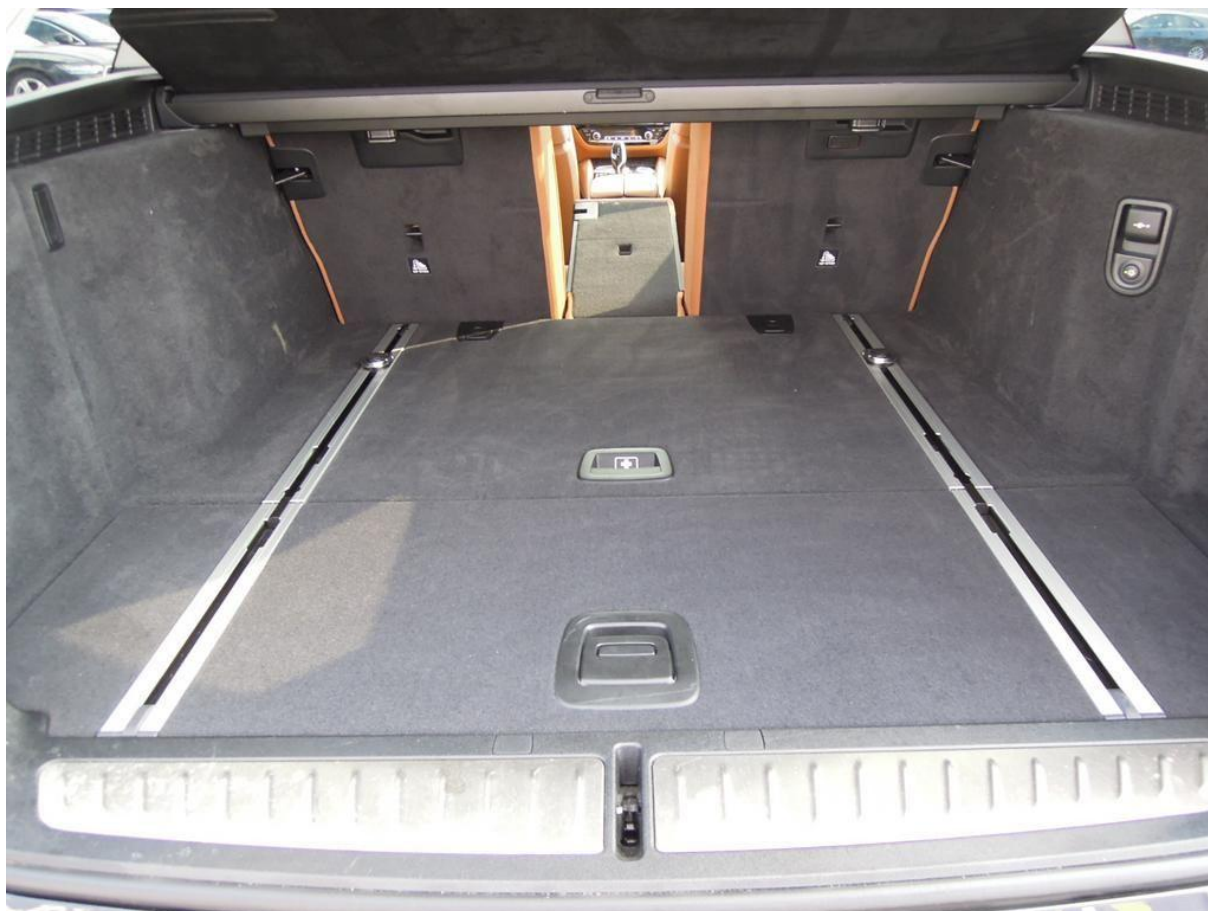
Fot. nr 24