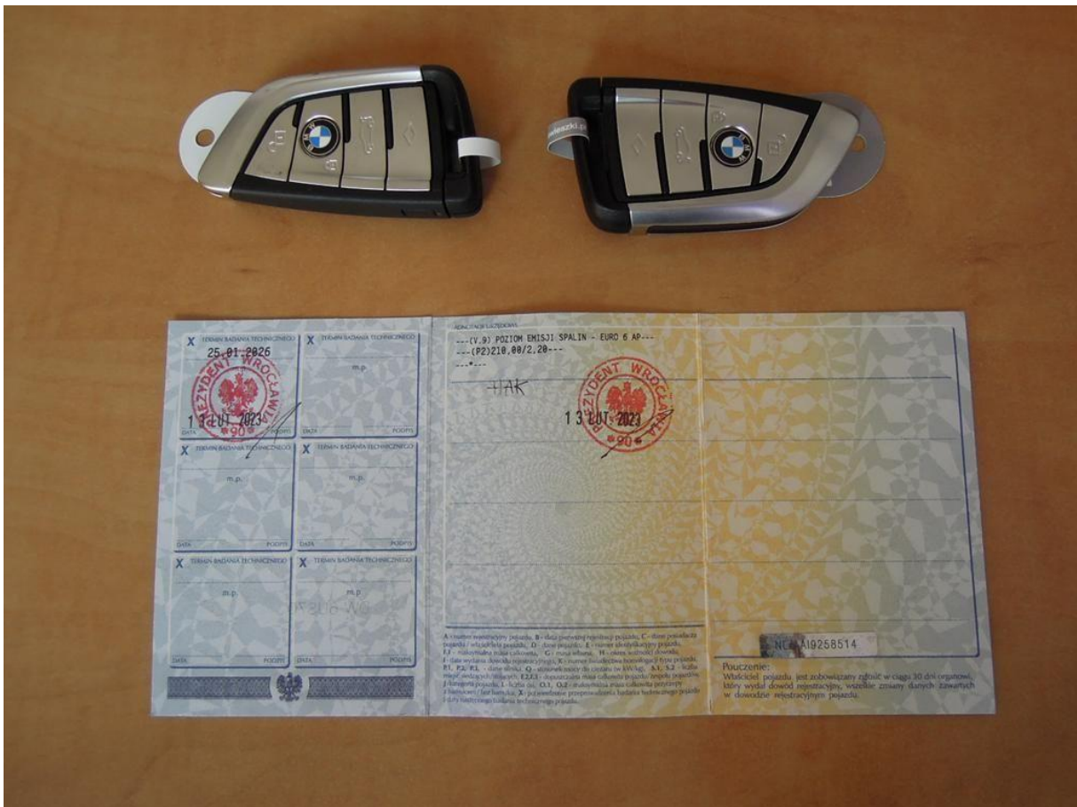
Fot. nr 62

Dokument wystawiony elektronicznie, wa ny bez podpisu