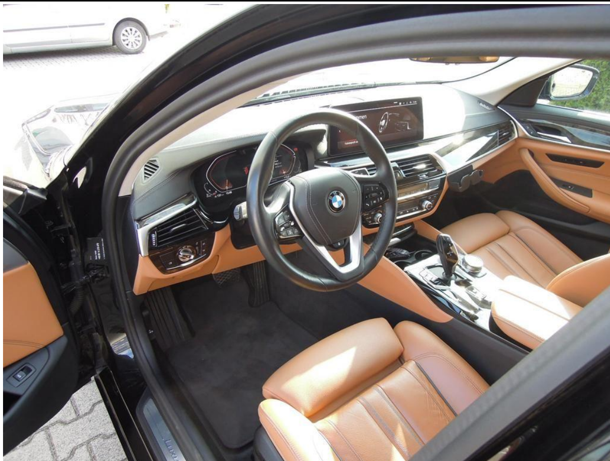
Fot. nr 15