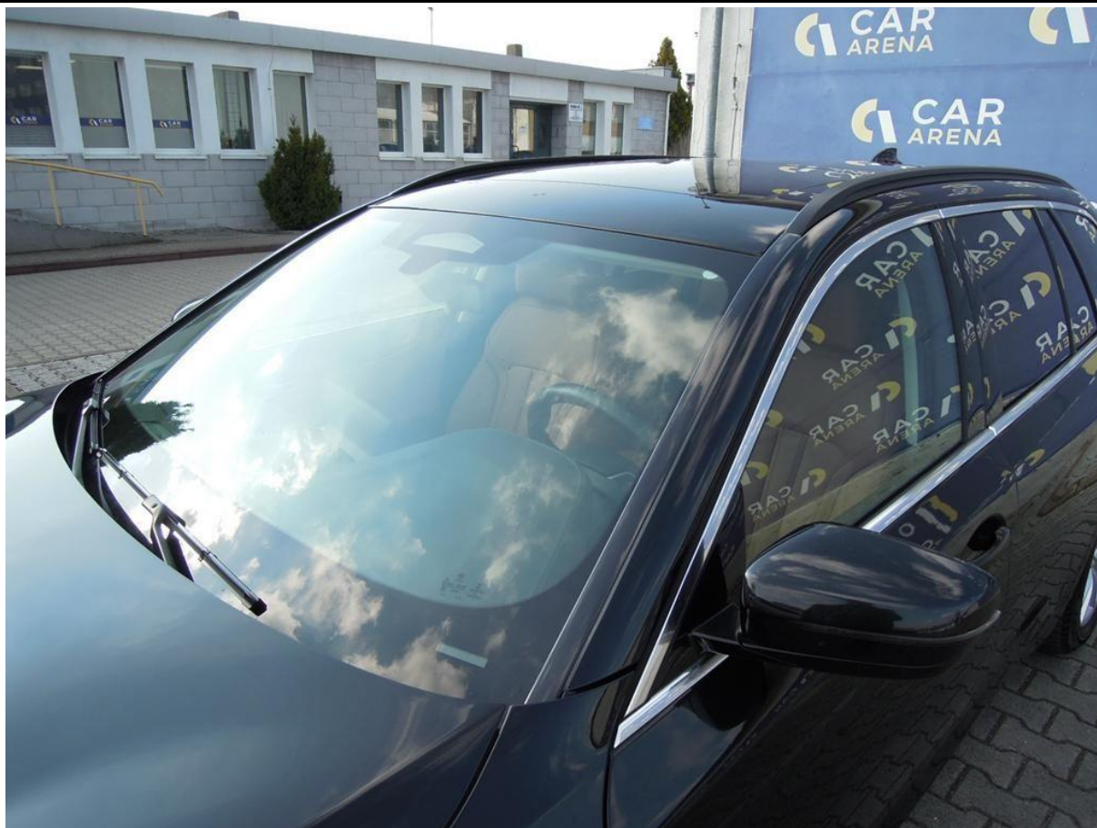
Fot. nr 37