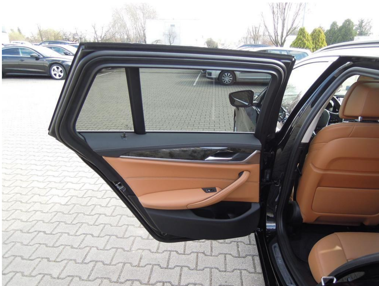
Fot. nr 16