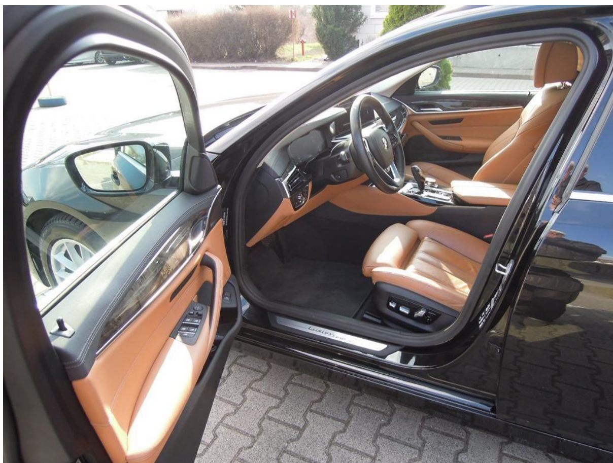
Fot. nr 14