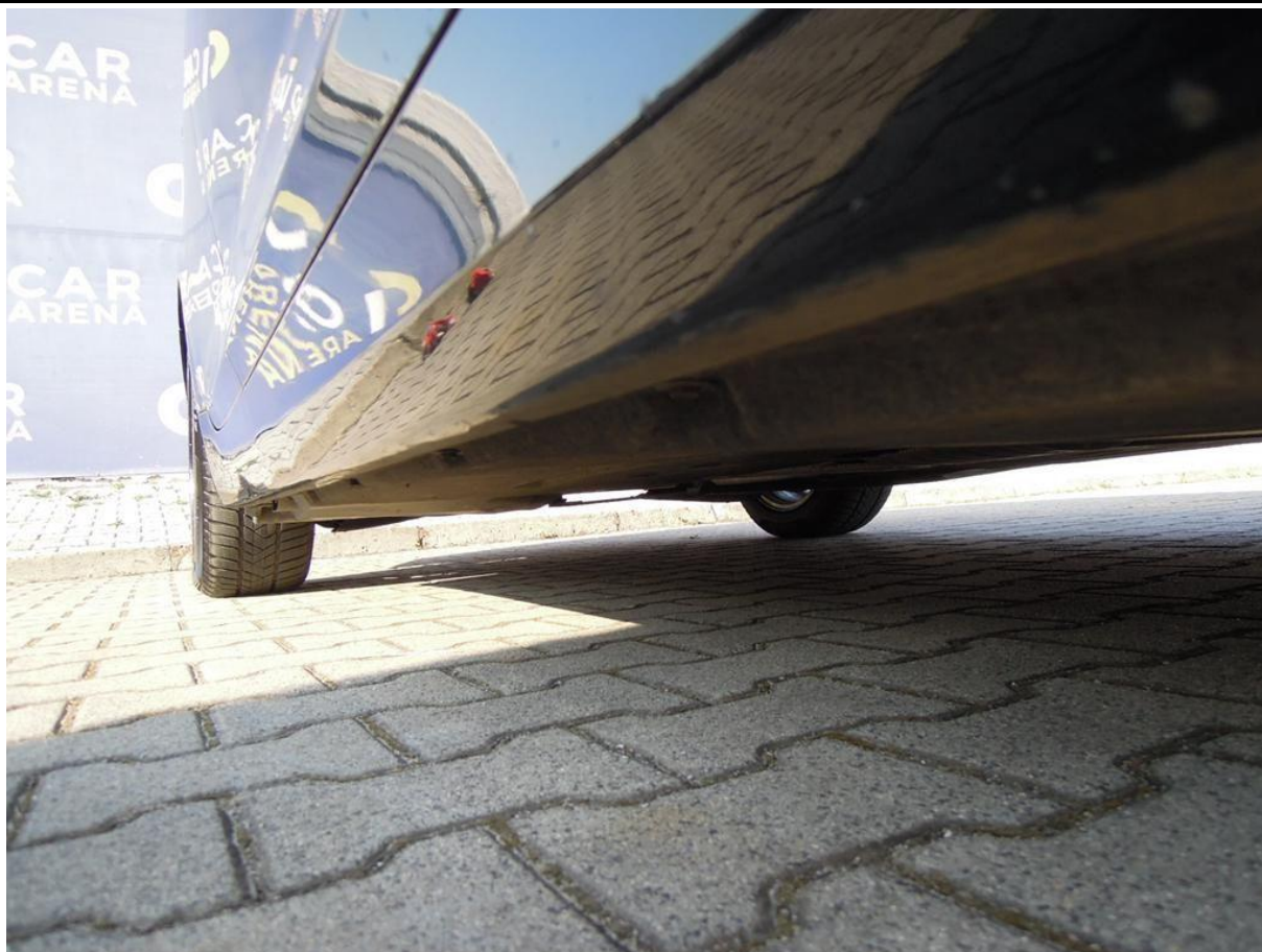
Fot. nr 55