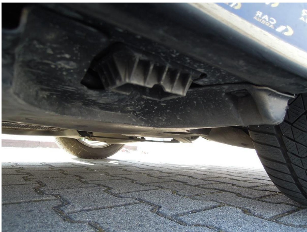
Fot. nr 58