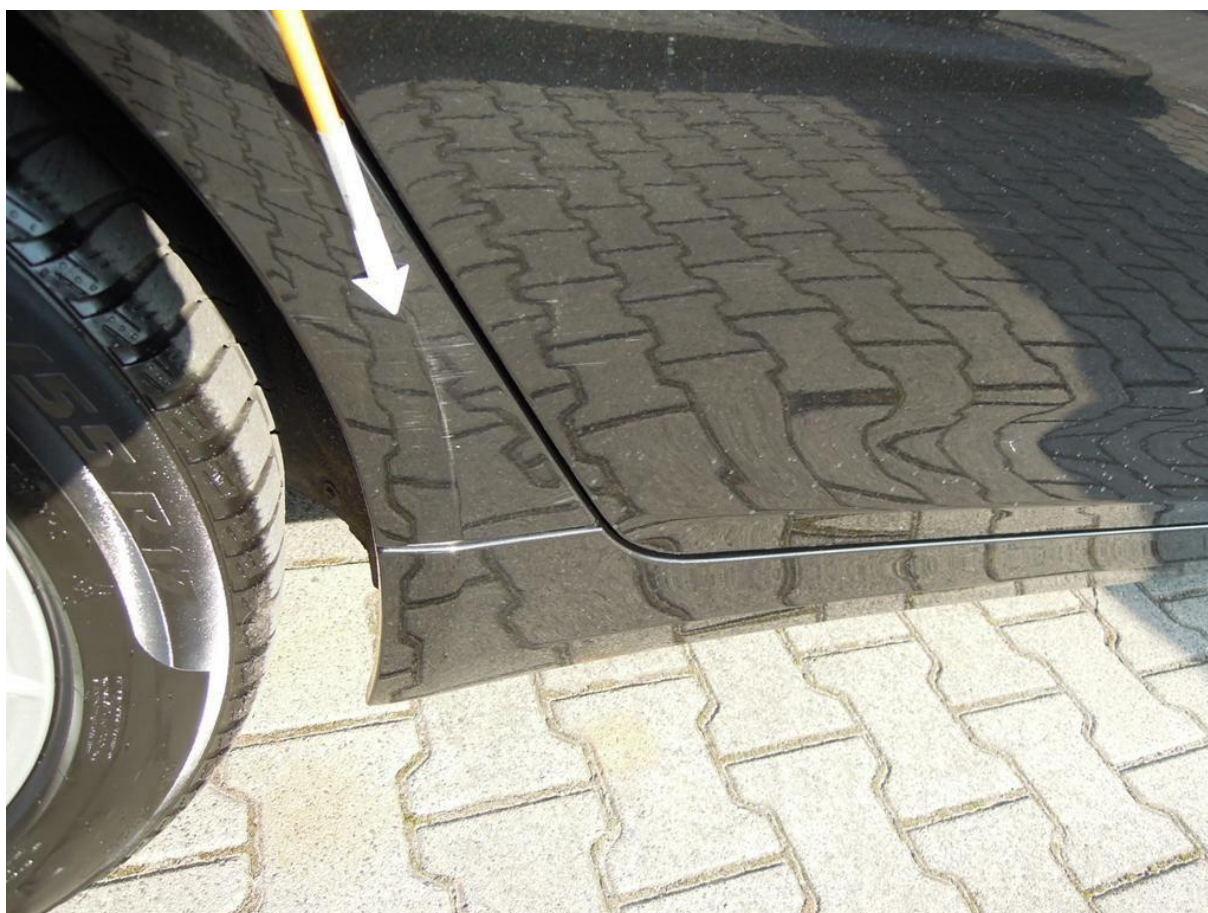
Fot. nr 44