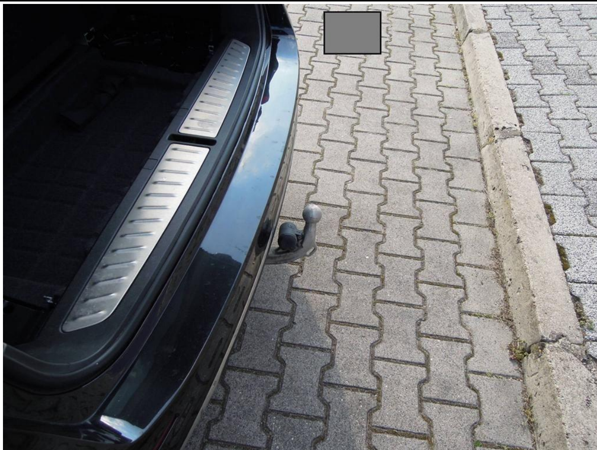
Fot. nr 27