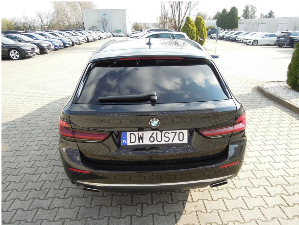
Fot. nr 3