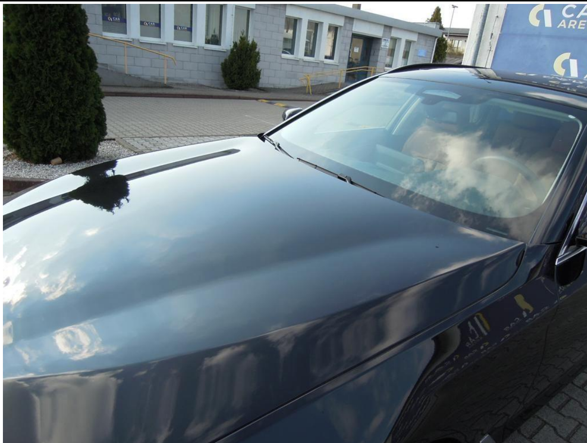
Fot. nr 35