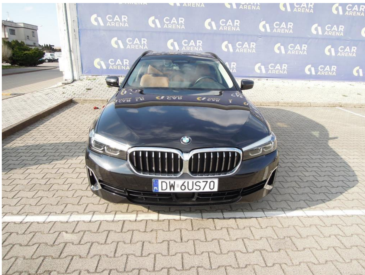
Fot. nr 6