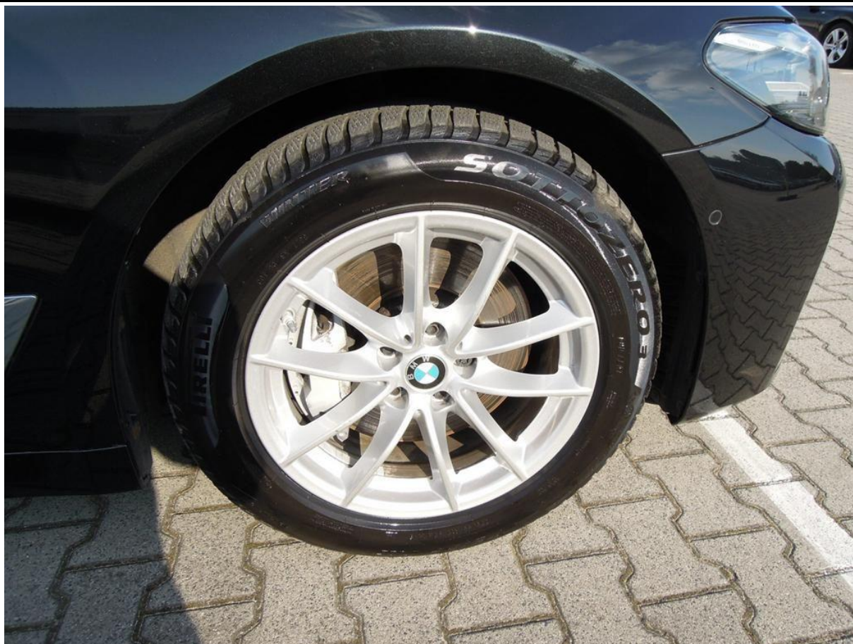
Fot. nr 49