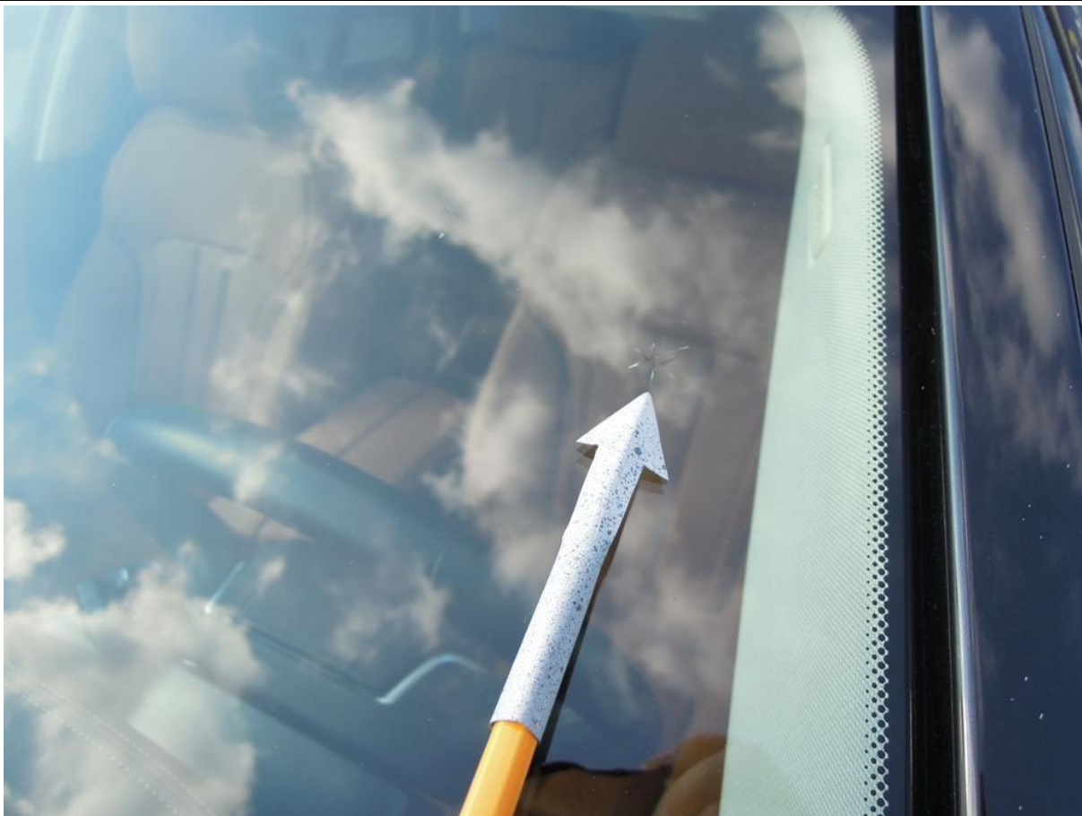
Fot. nr 39