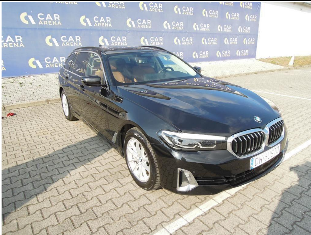
Fot. nr 5