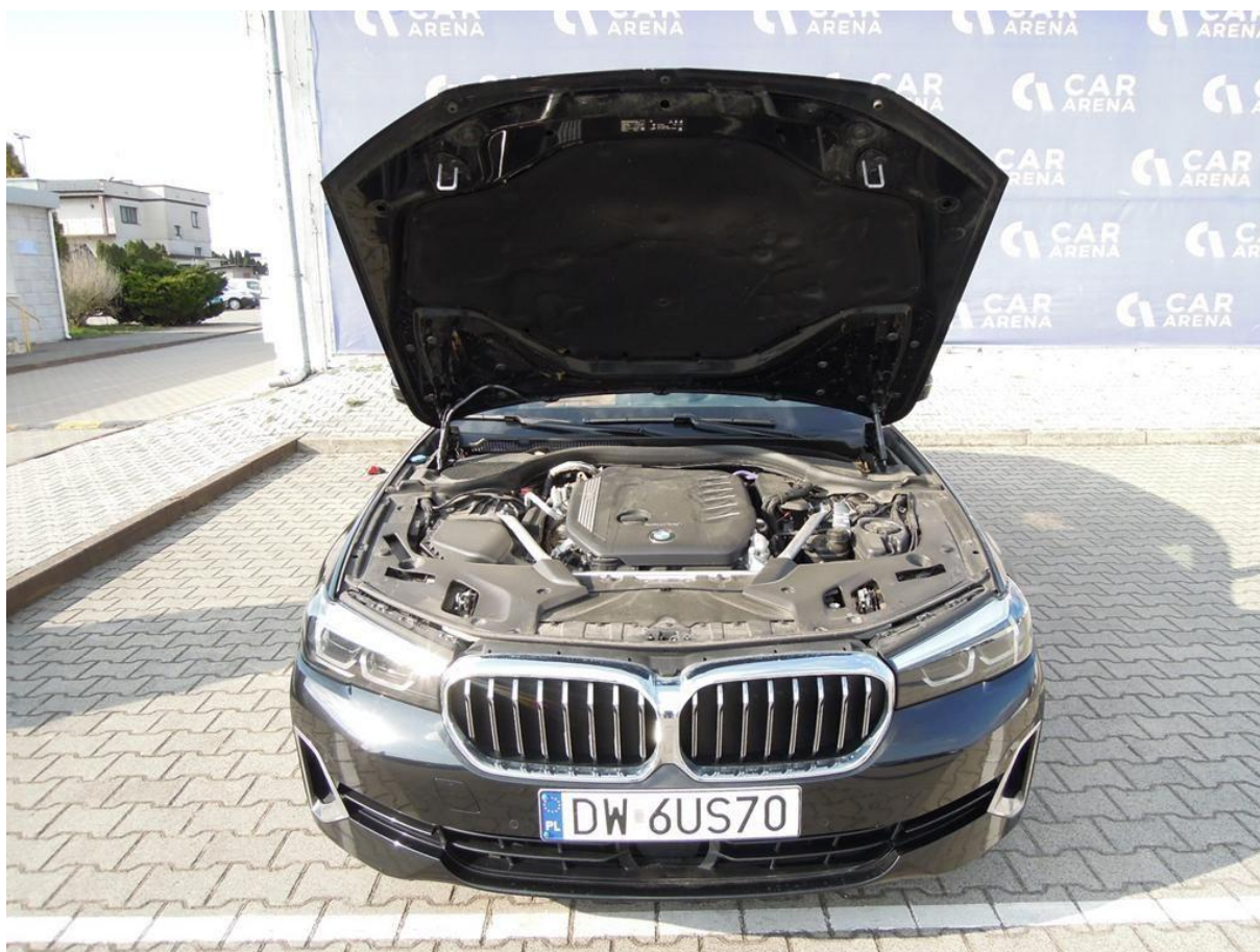
Fot. nr 10