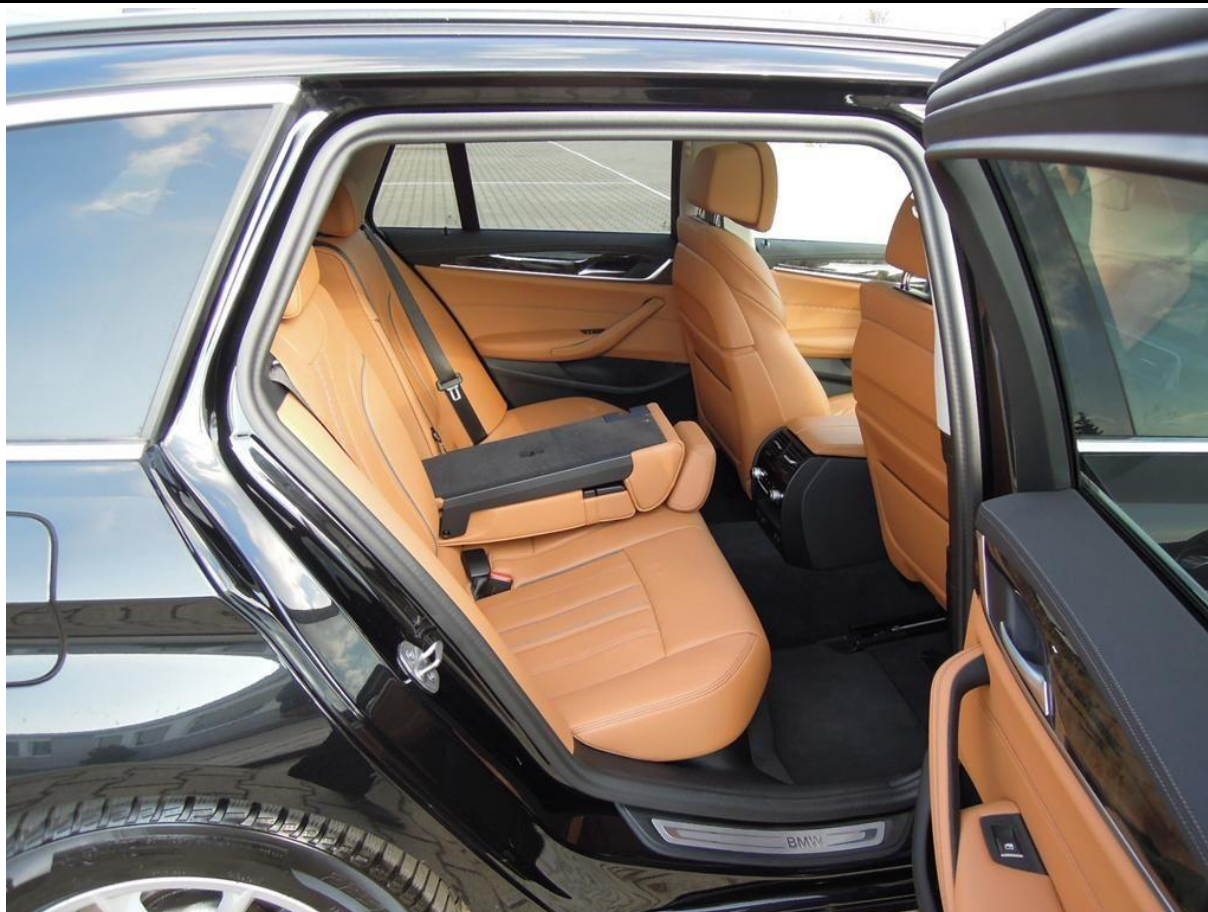
Fot. nr 29