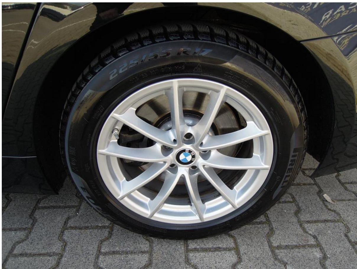
Fot. nr 48