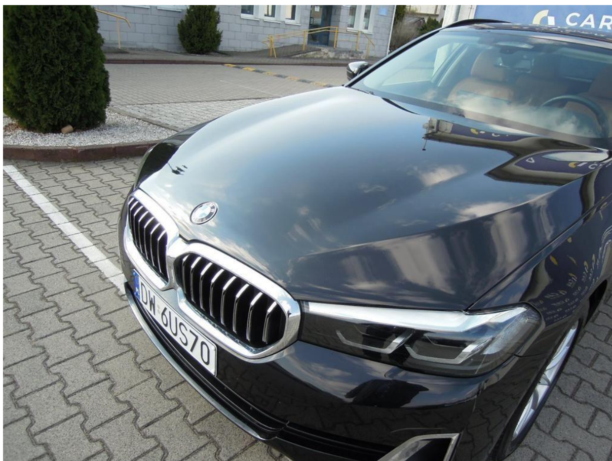
Fot. nr 32