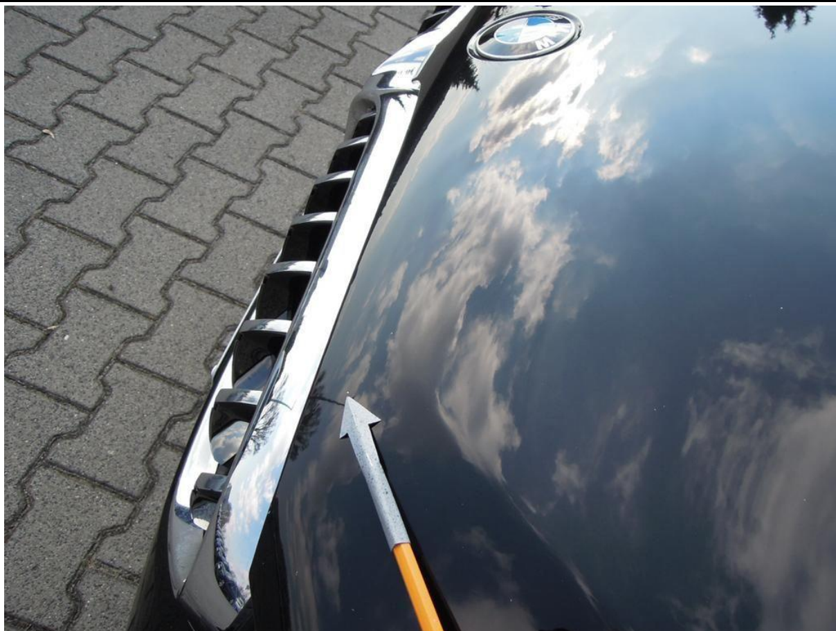
Fot. nr 33