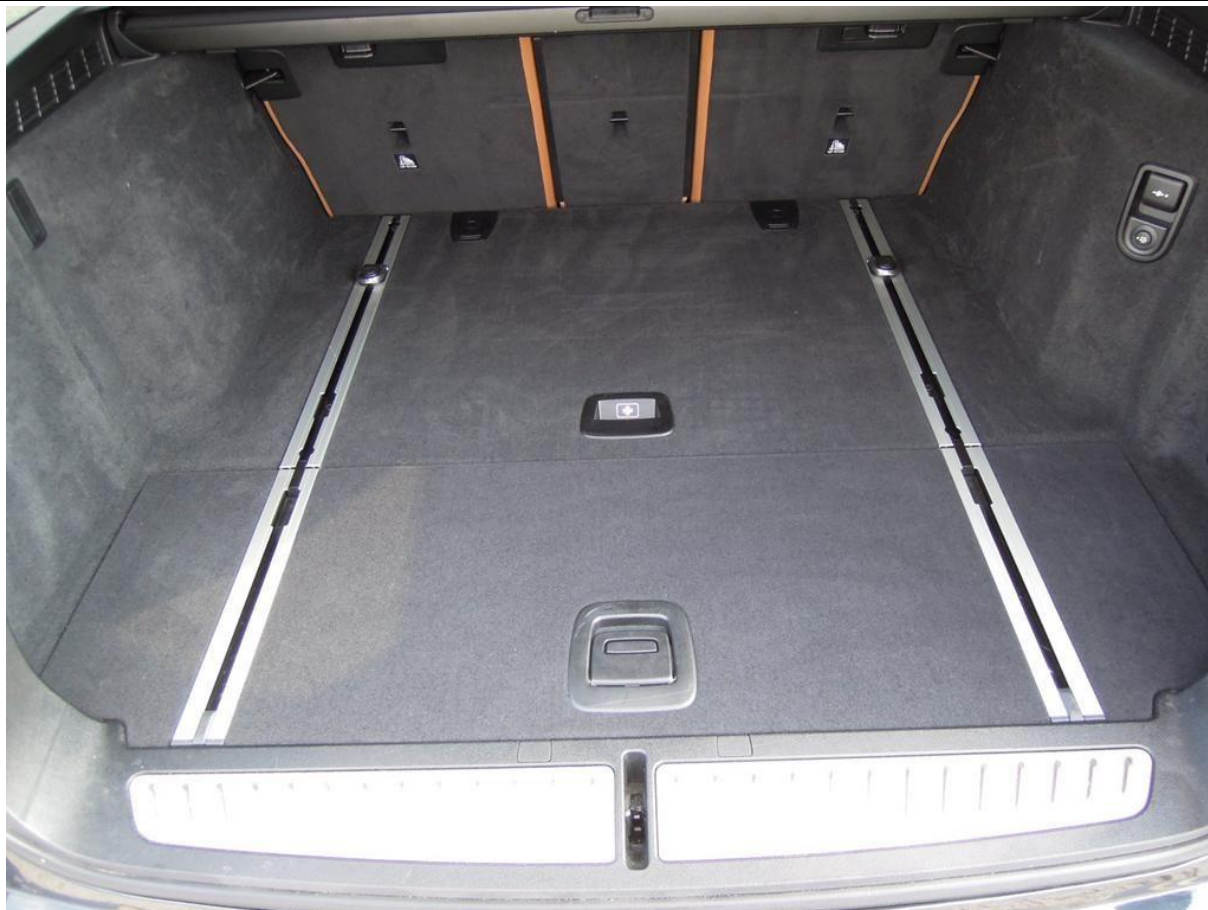
Fot. nr 23