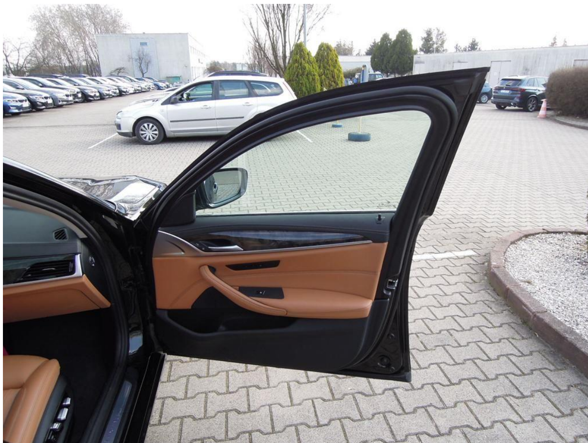
Fot. nr 30