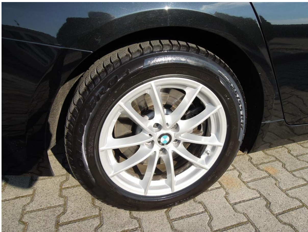
Fot. nr 50