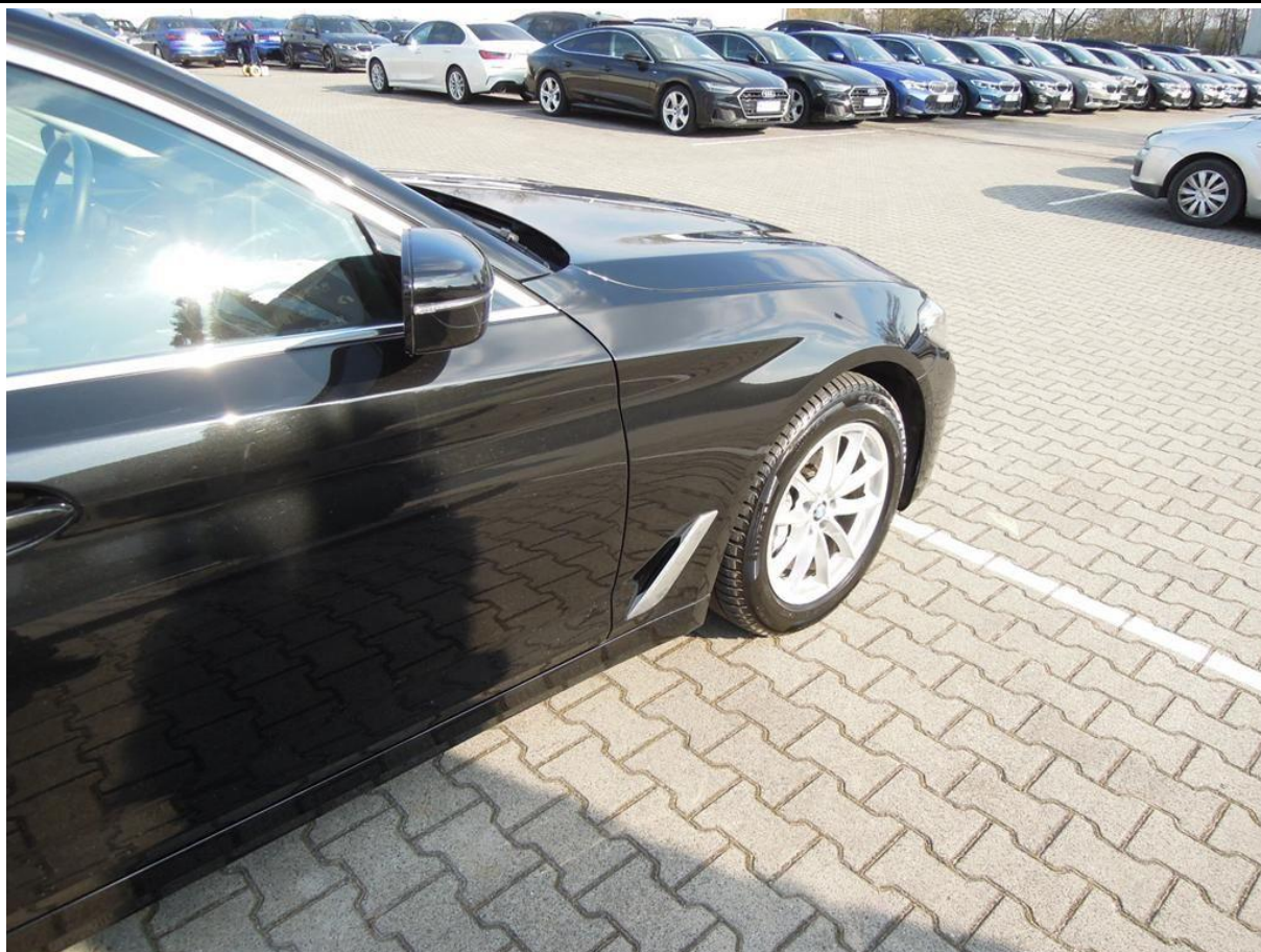
Fot. nr 41