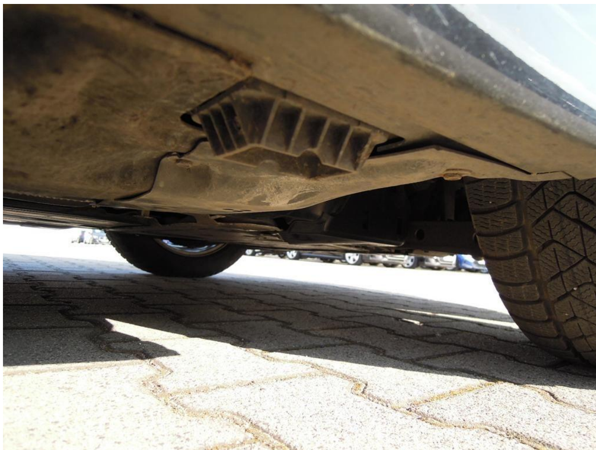
Fot. nr 54