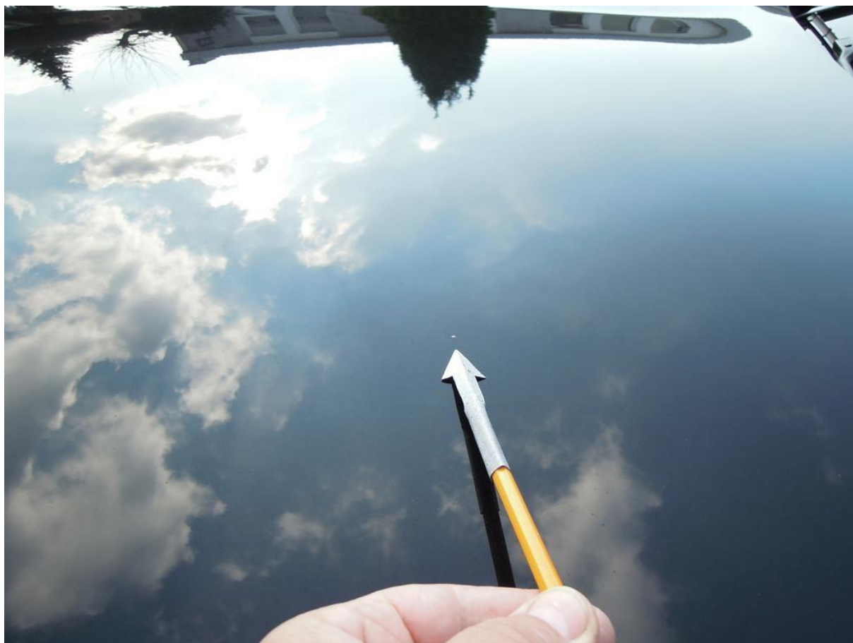
Fot. nr 36