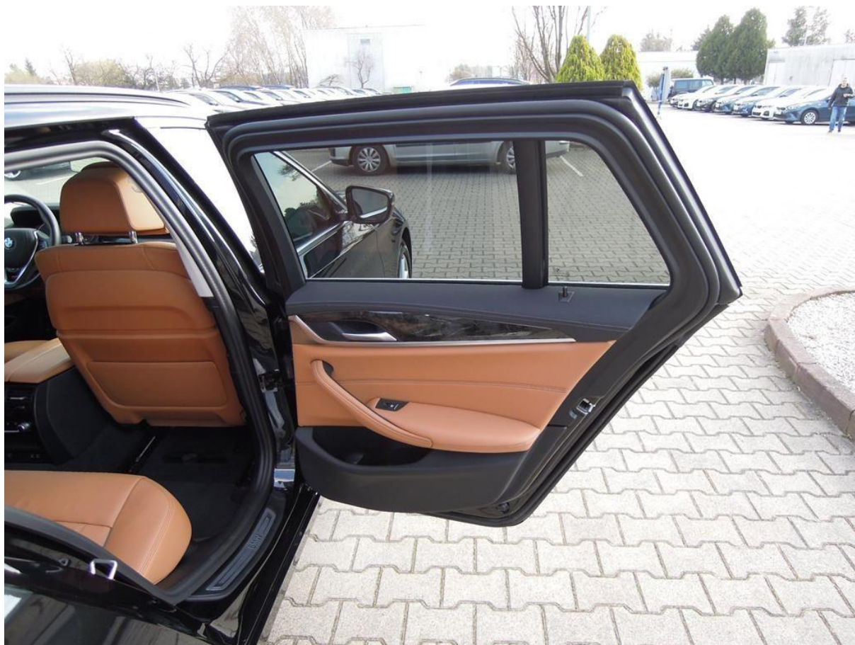
Fot. nr 28