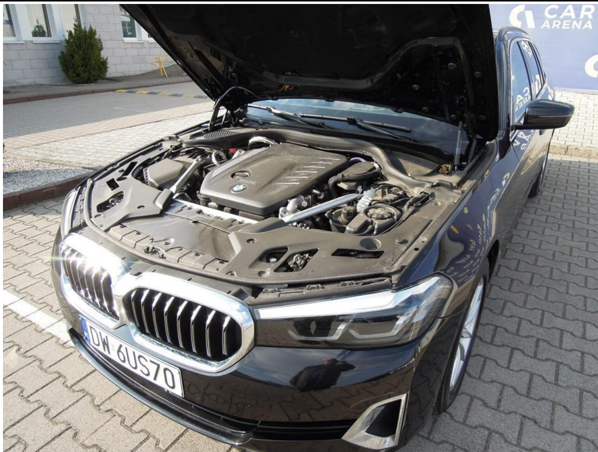
Fot. nr 11