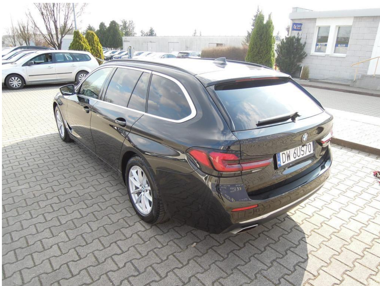
Fot. nr 2