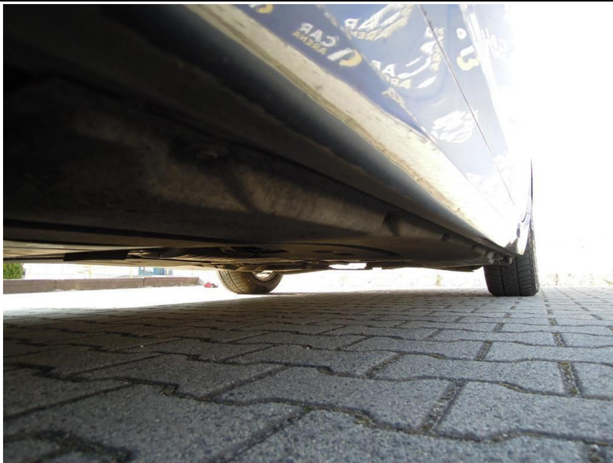
Fot. nr 53