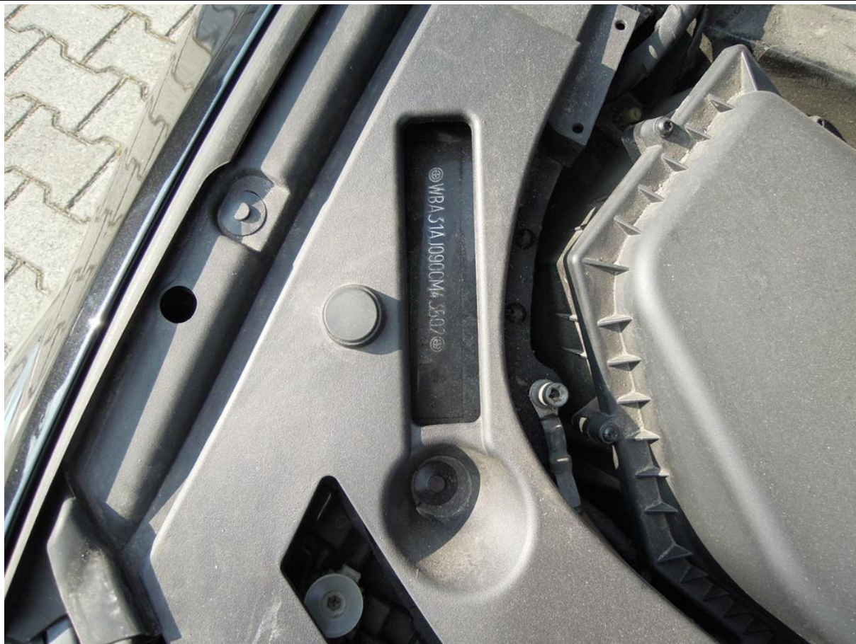
Fot. nr 7