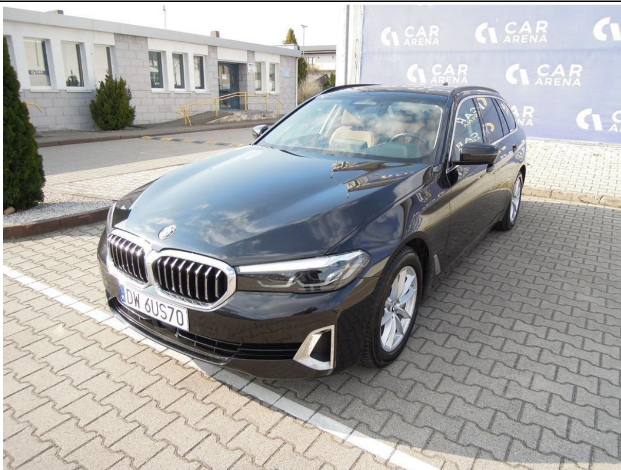
Fot. nr 1