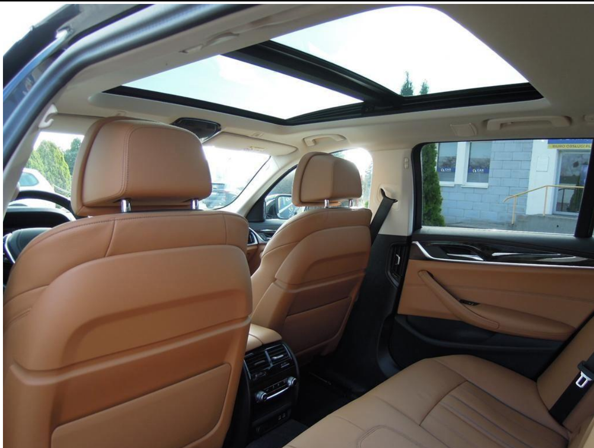
Fot. nr 19