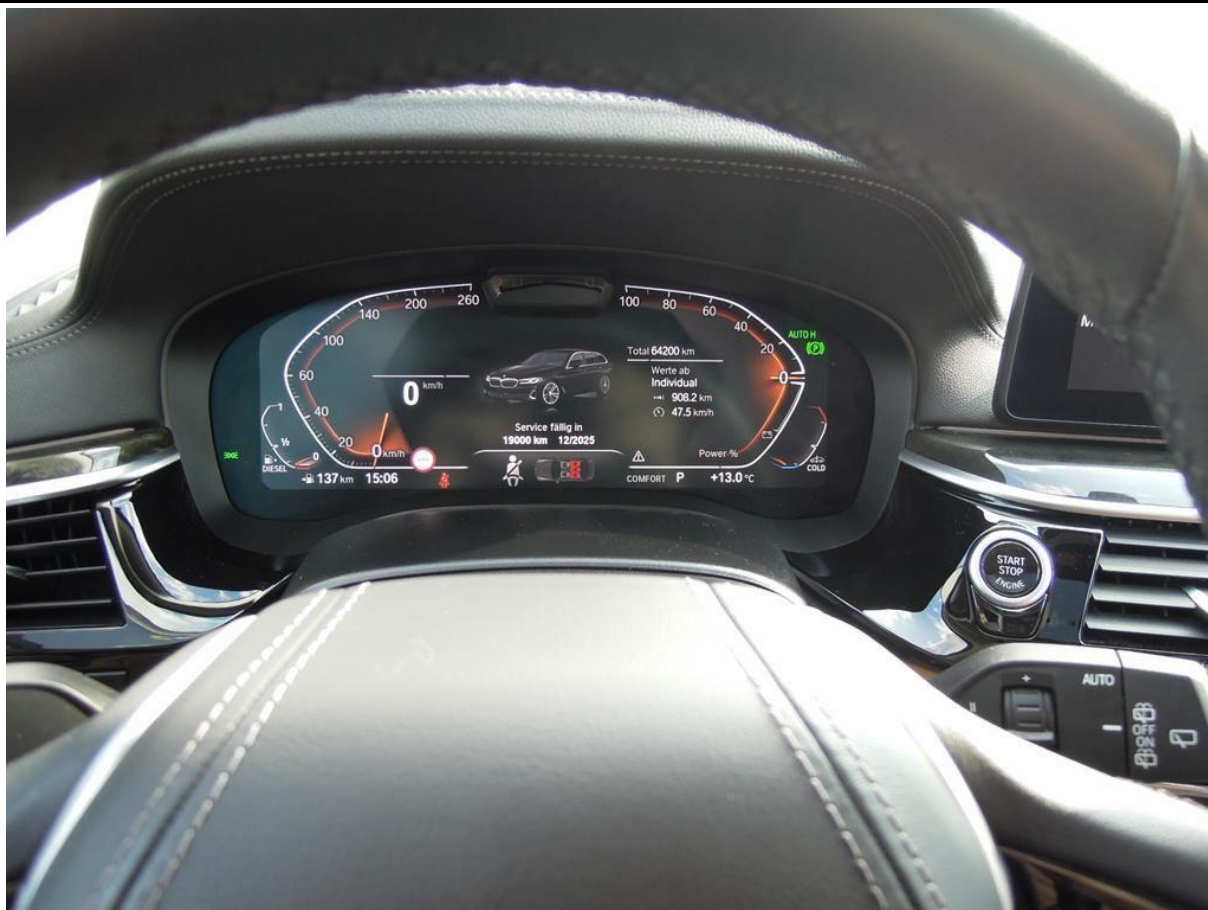
Fot. nr 9