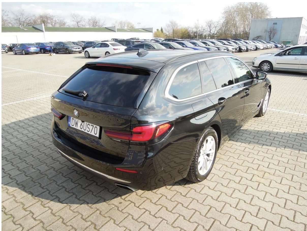
Fot. nr 4