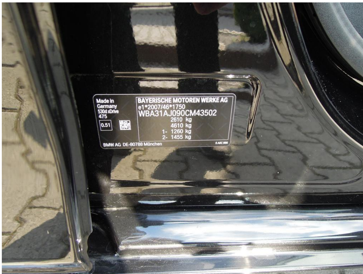
Fot. nr 8