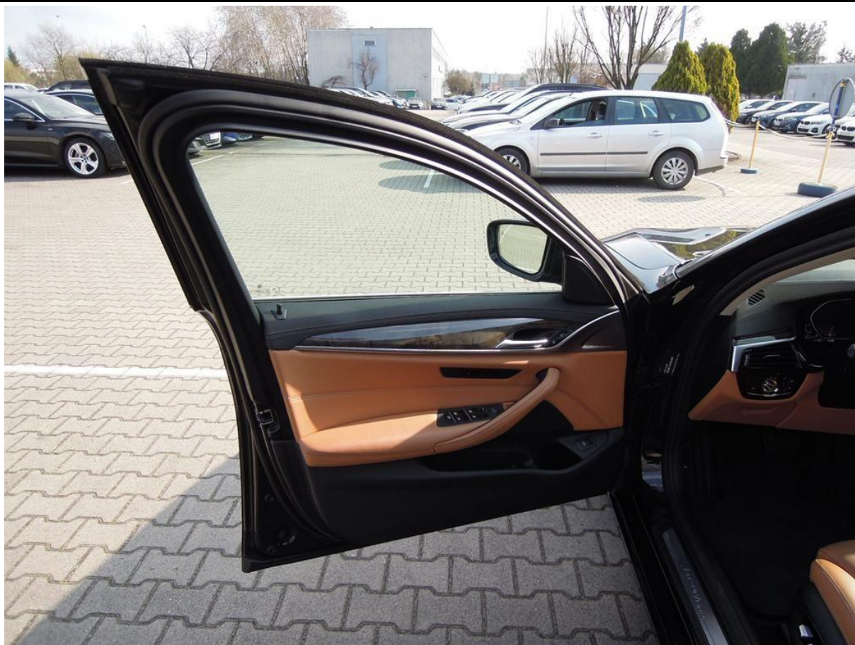
Fot. nr 13