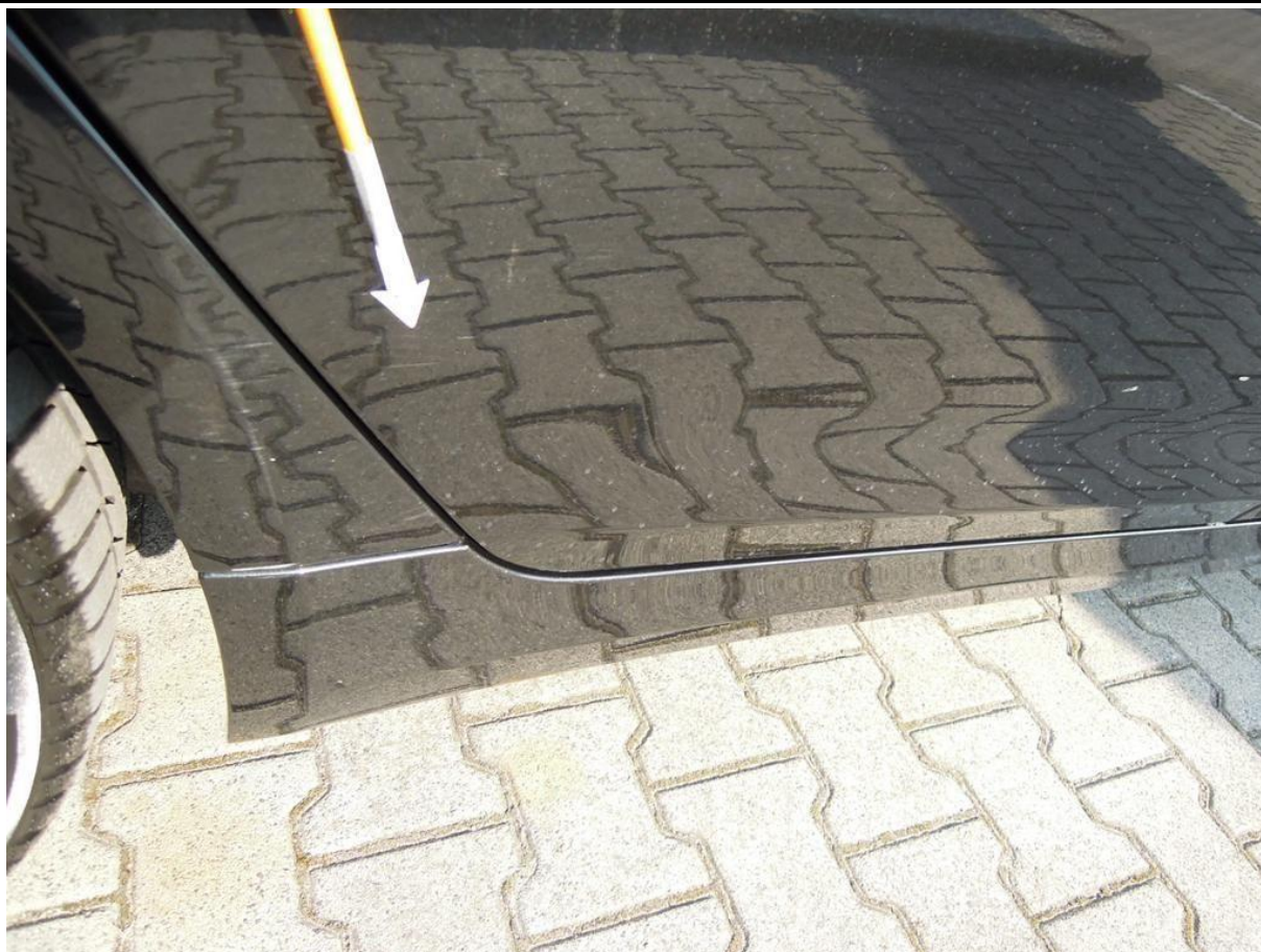
Fot. nr 45