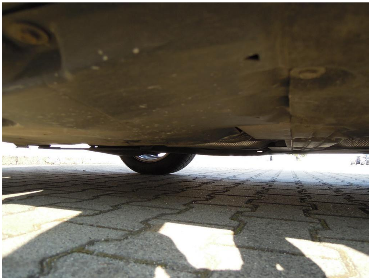
Fot. nr 56