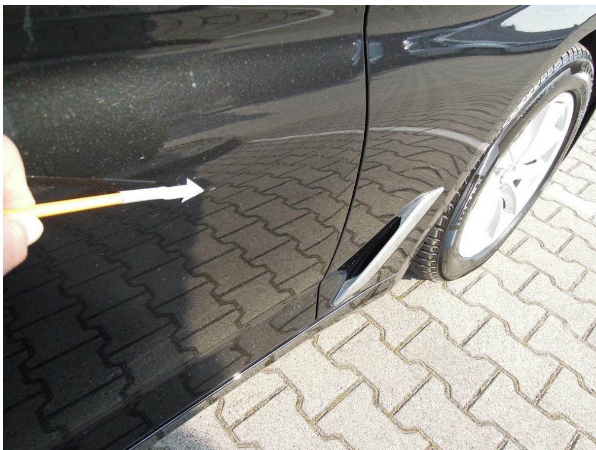
Fot. nr 42