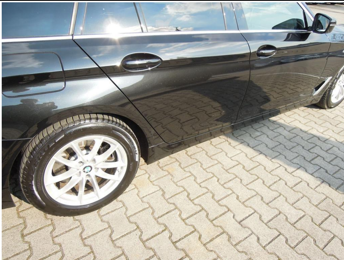
Fot. nr 43