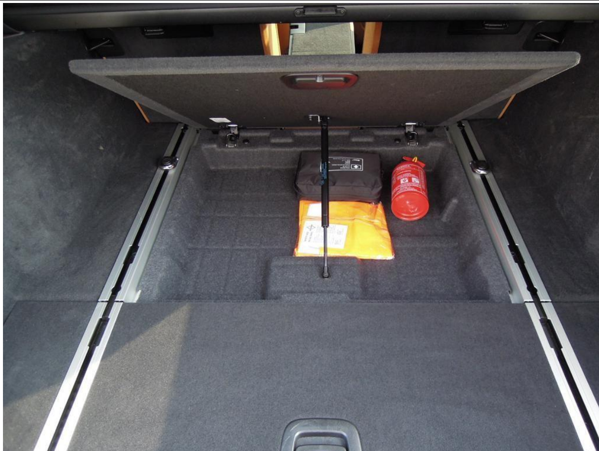
Fot. nr 25