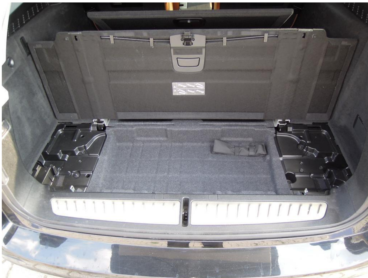
Fot. nr 26