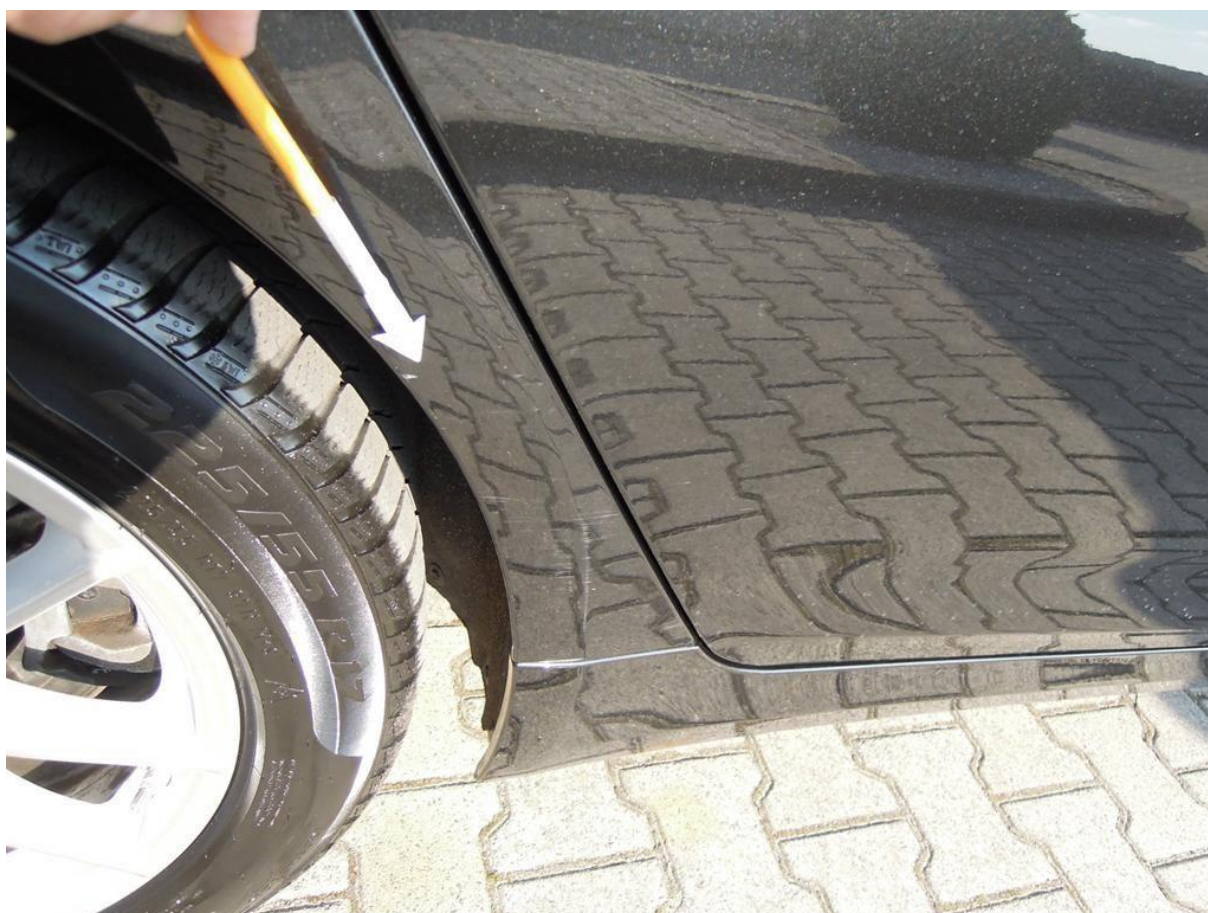
Fot. nr 46