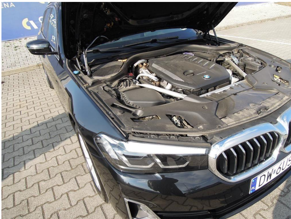
Fot. nr 12