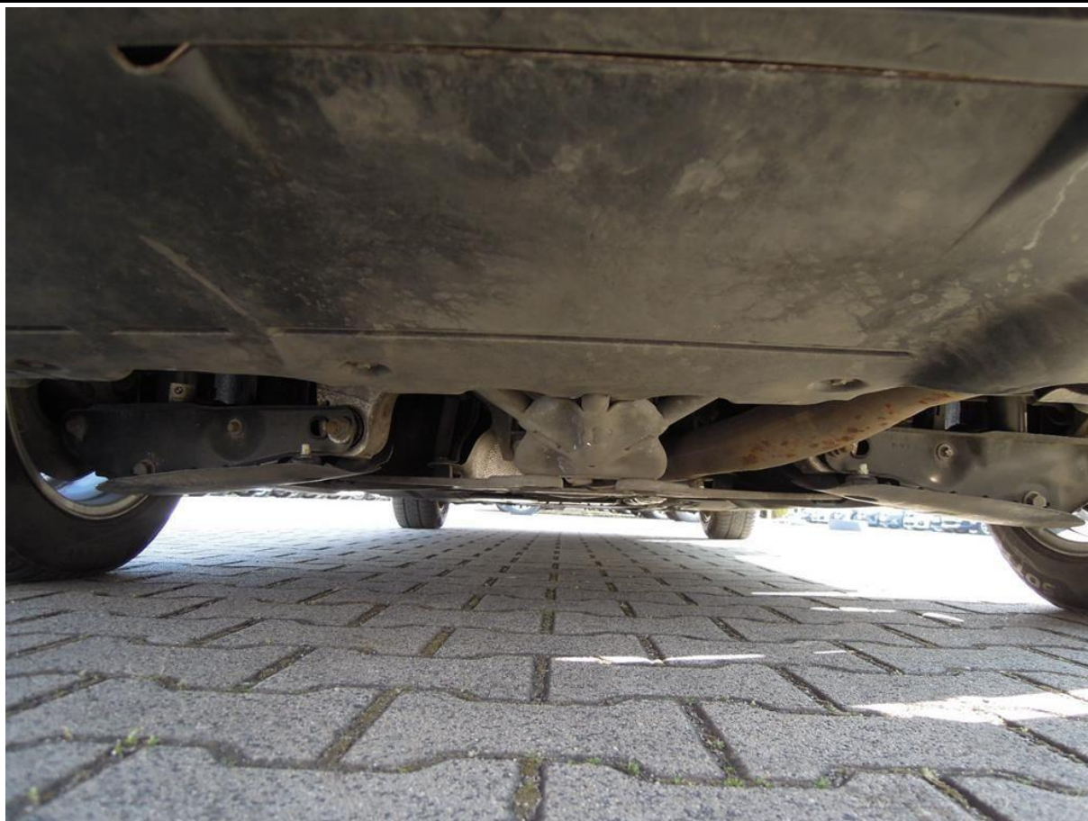
Fot. nr 57