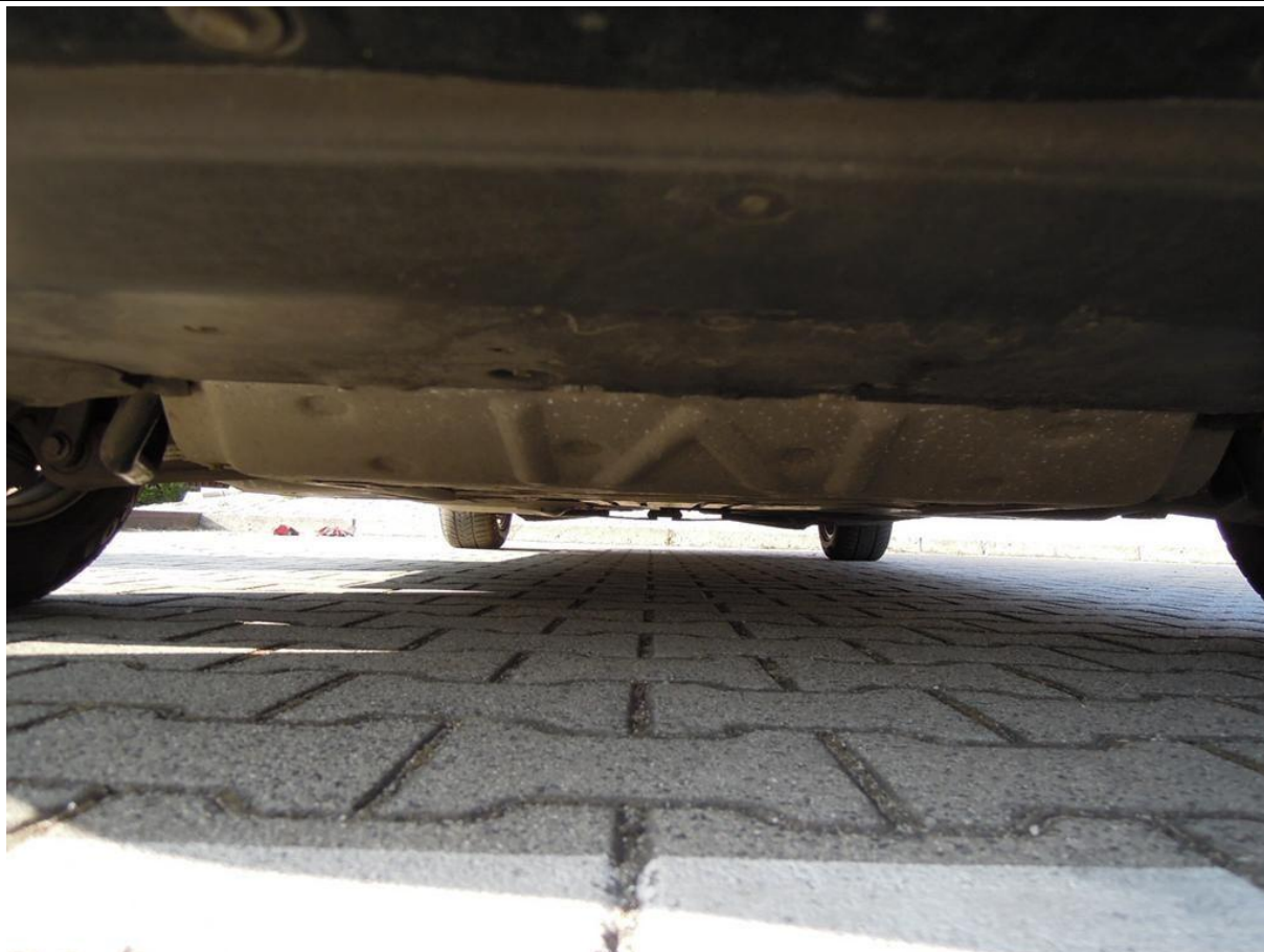
Fot. nr 51