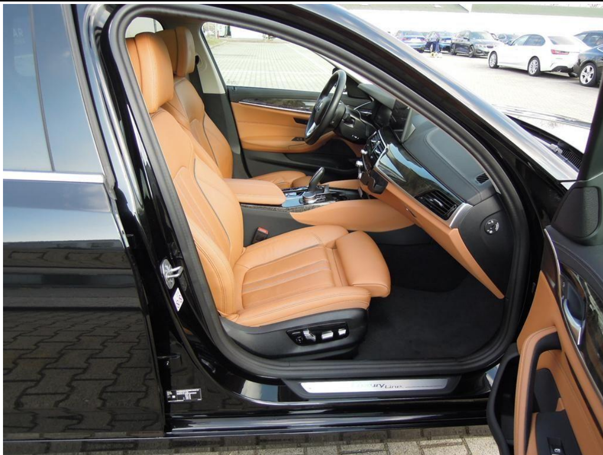
Fot. nr 31