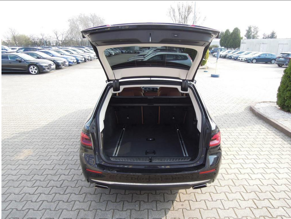
Fot. nr 21