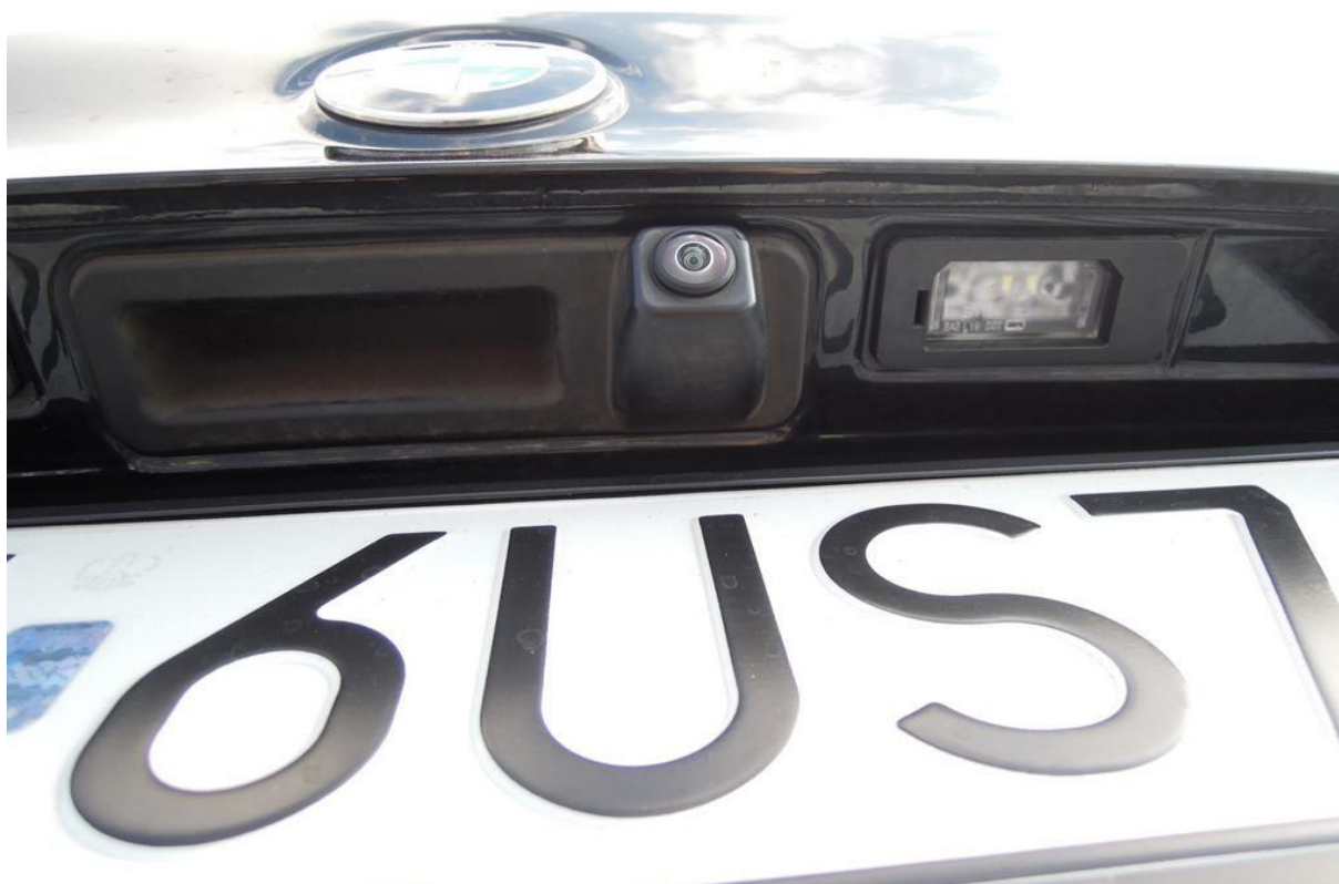
Fot. nr 22