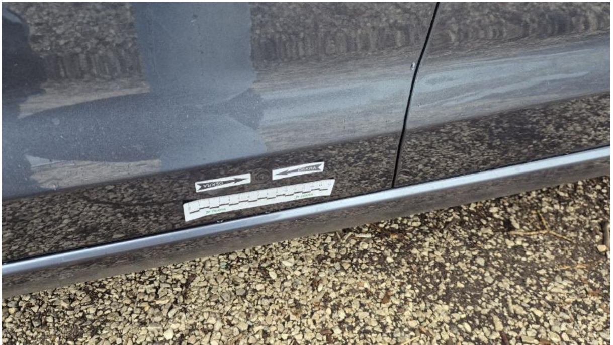
Fot. 49 Drzwi przed L - Wgniecenie/odkształcenie 1