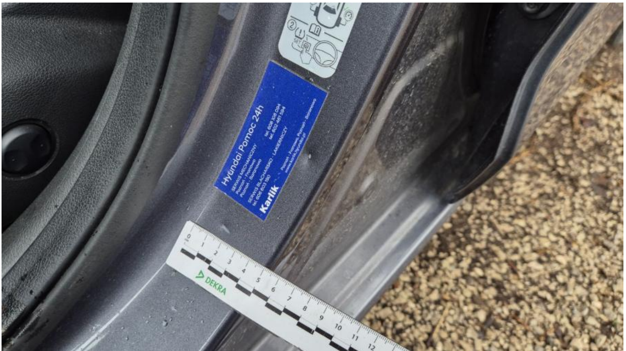
Fot. 50 Słupek środkowy L - Rysa/odprysk 1