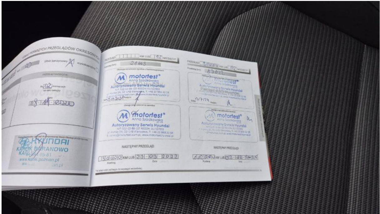
Fot. 31 Książka serwisowa – ostatni przegląd