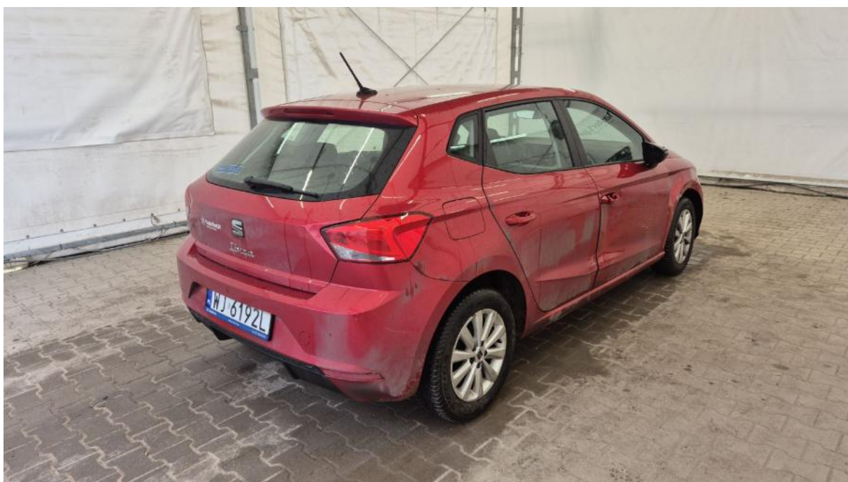
Fot. 7 Przekątna tylna prawa