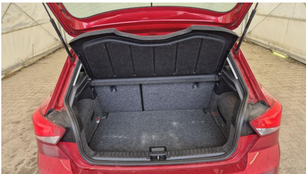
Fot. 24 Bagażnik