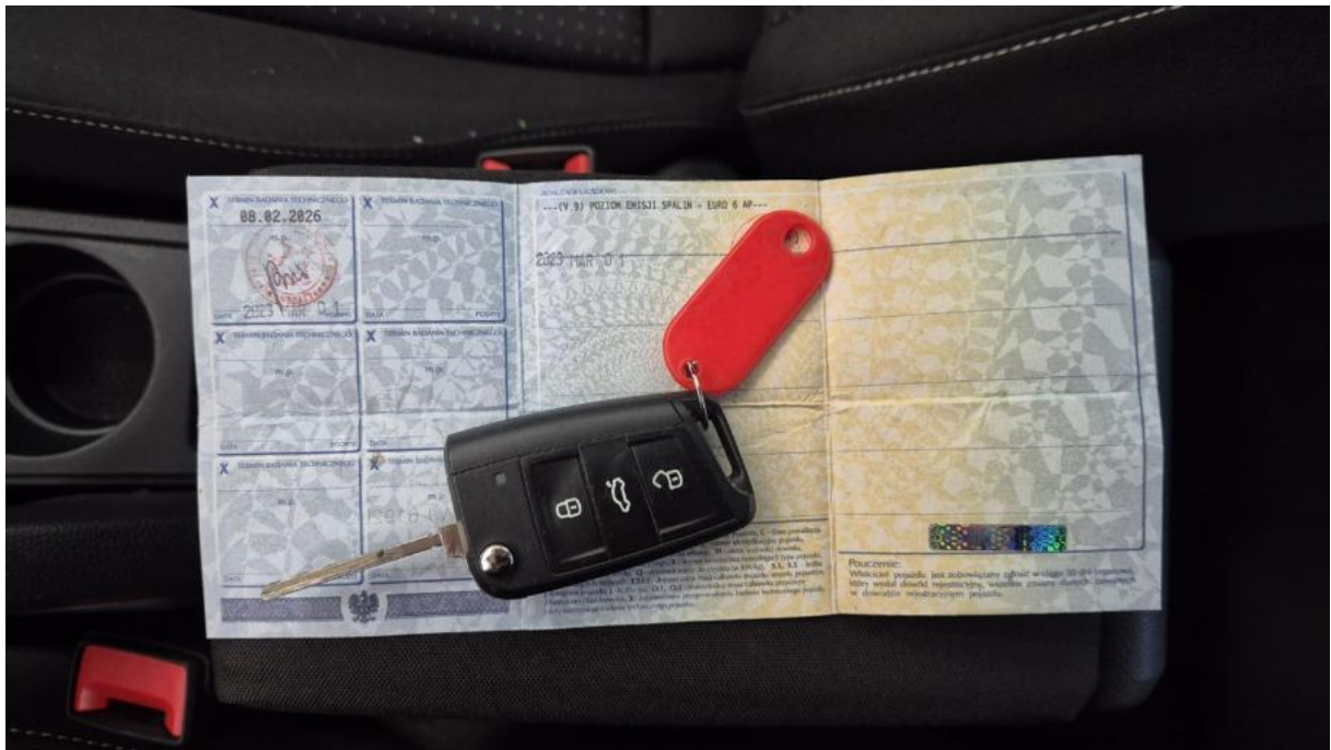
Fot. 31 Dow. Rej. Str.2 i klucze