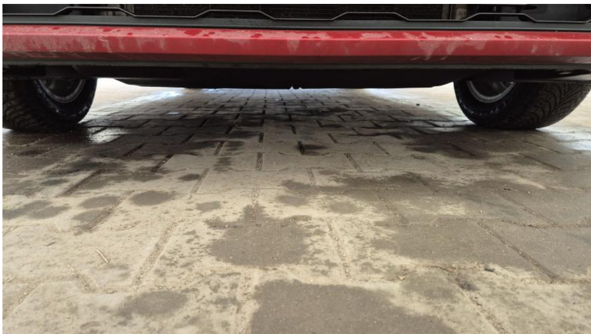
Fot. 26 Spód pojazdu przód