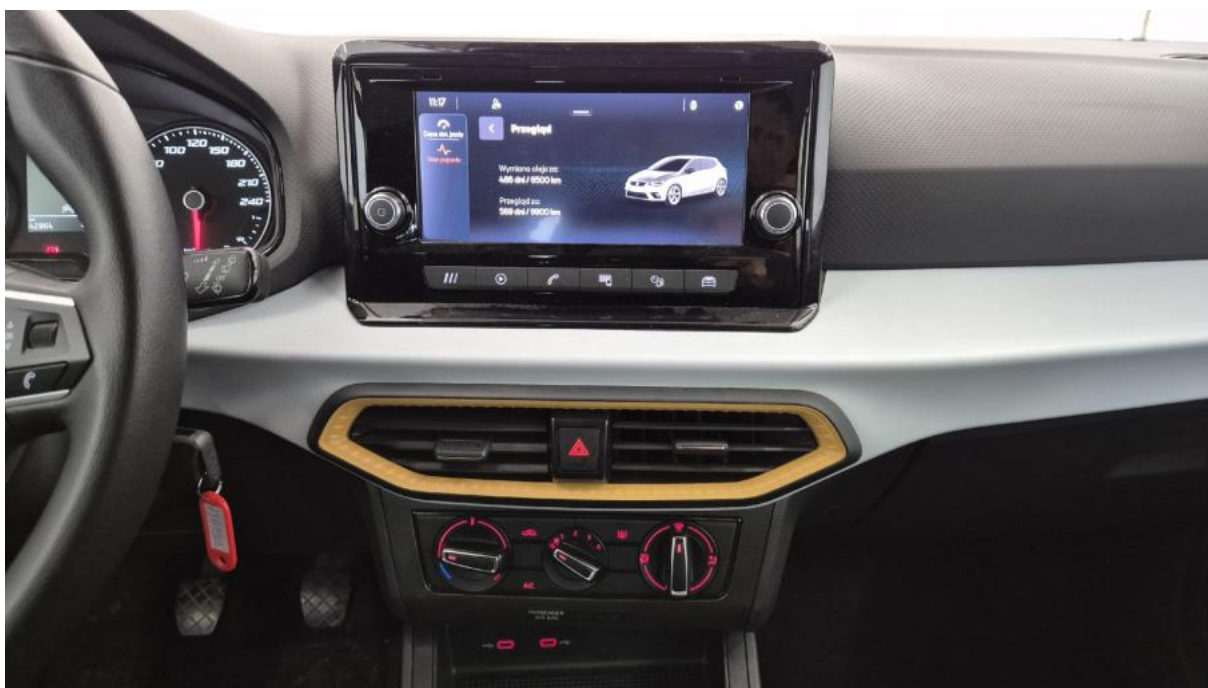
Fot. 19 Konsola środkowa