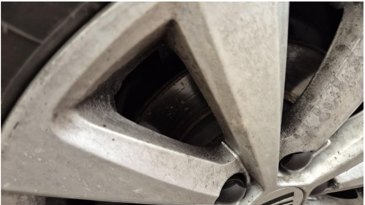
Fot. 28 Tarcza hamulcowa przednia lewa