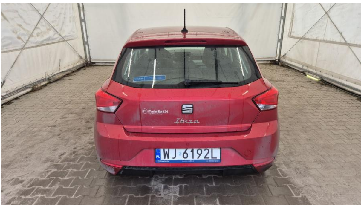
Fot. 8 Tyt