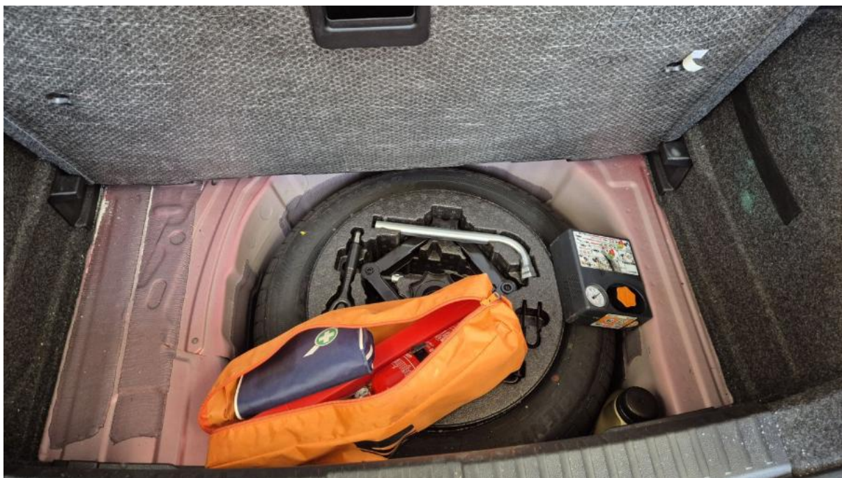
Fot. 25 Koło zapasowe