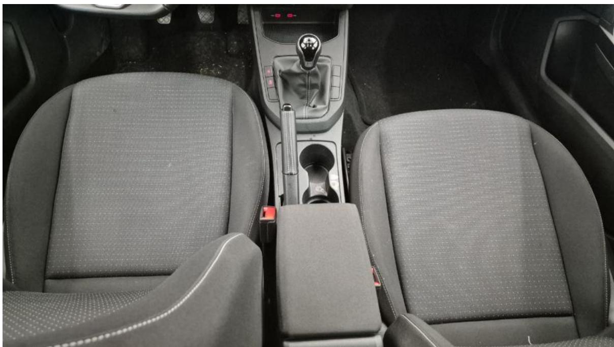
Fot. 20 Tuneł środkowy