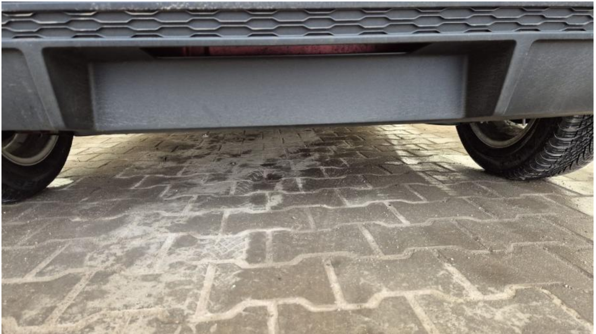
Fot. 27 Spód pojazdu tył