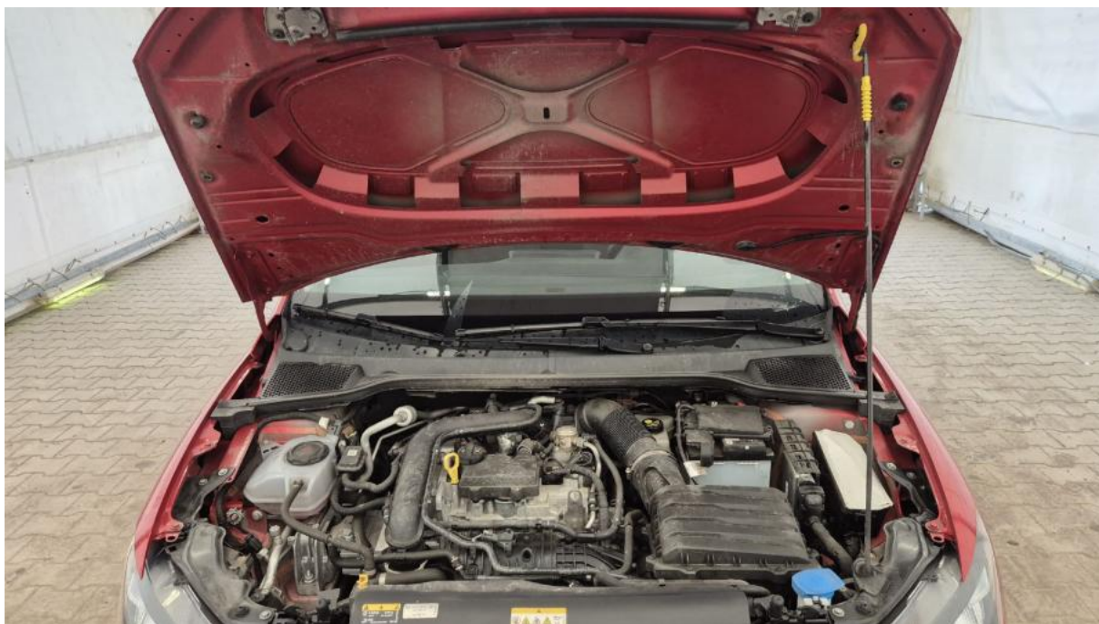
Fot. 23 Komora silnika