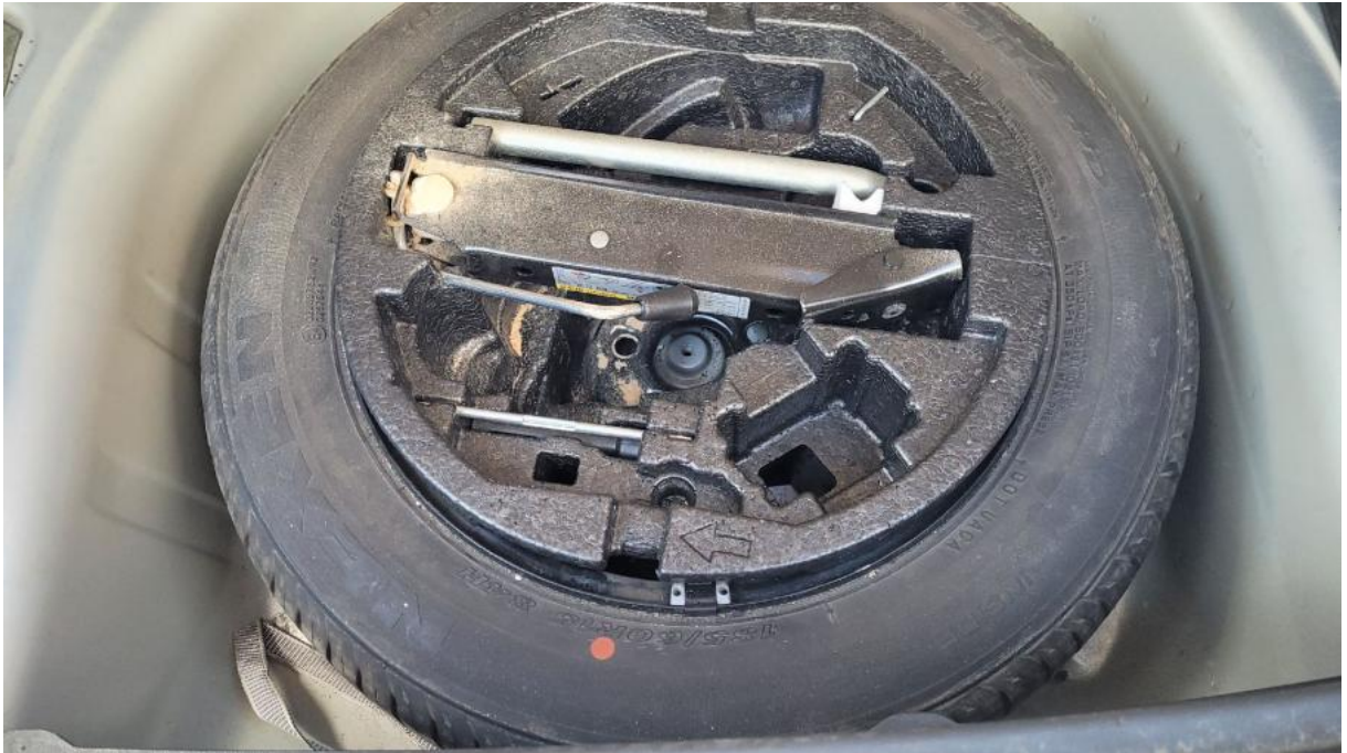
Fot. 25 Koło zapasowe