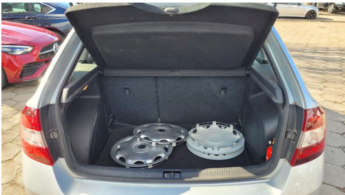
Fot. 24 Bagażnik