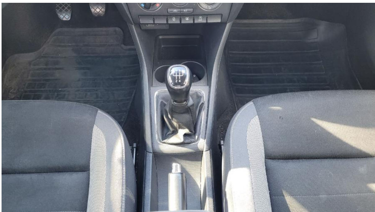
Fot. 20 Tunel środkowy