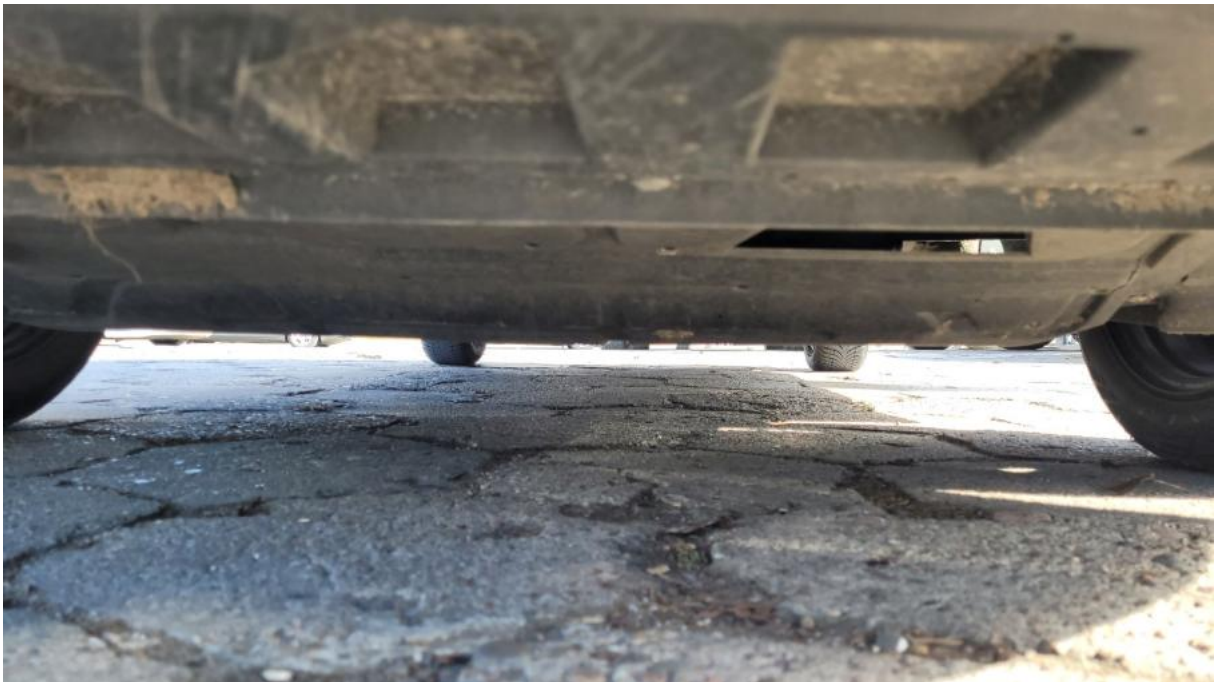
Fot. 26 Spód pojazdu przód