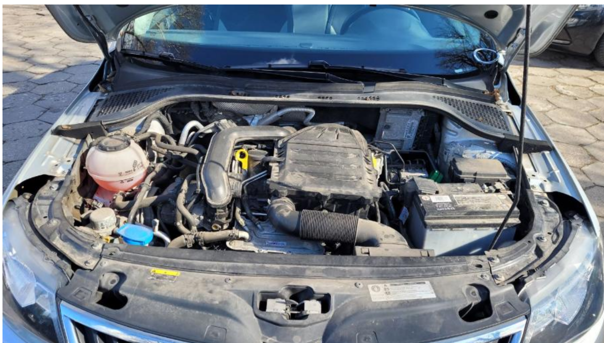
Fot. 23 Komora silnika