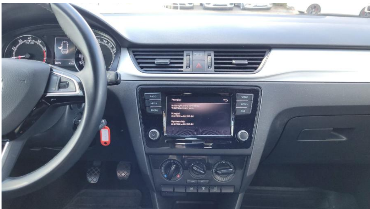
Fot. 19 Konsola środkowa