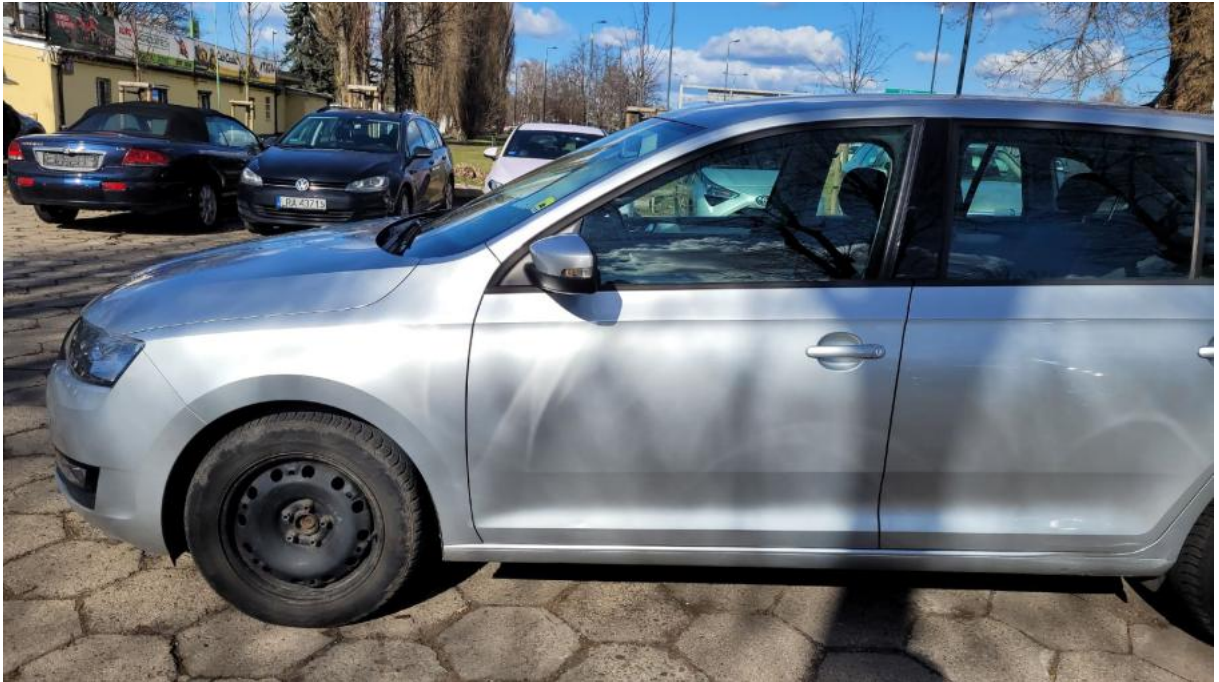
Fot. 11 Bok lewy z przodu