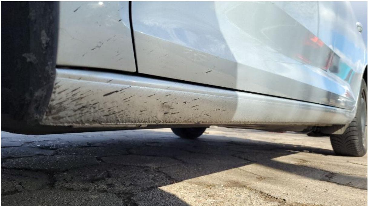
Fot. 12 Próg lewy (widok od przodu)