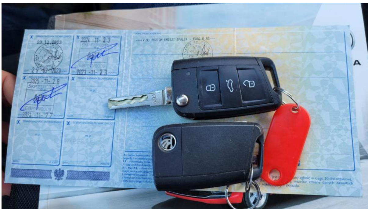
Fot. 29 Dow. Rej. Str.2 i klucze