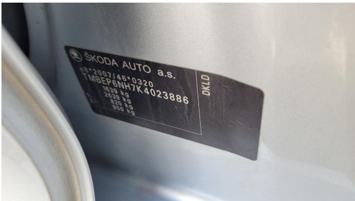
Fot. 14 Tabliczka znamionowa