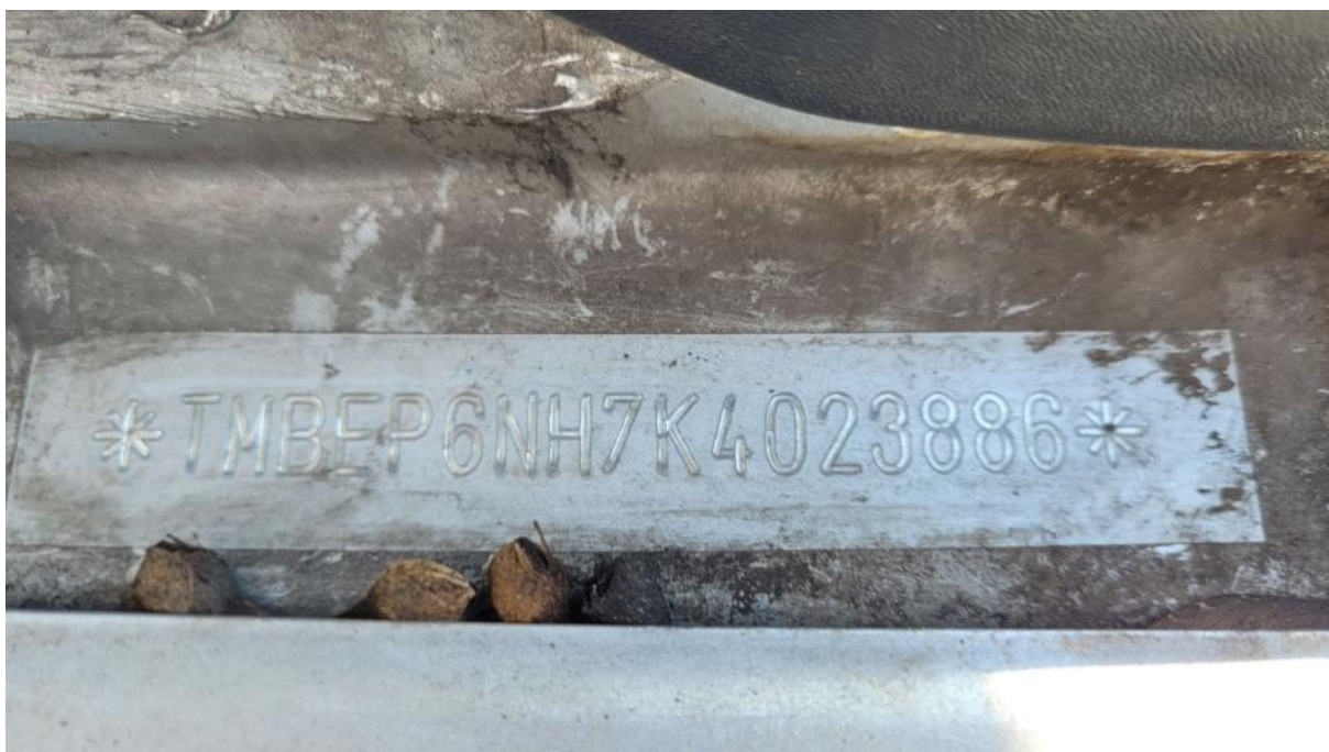
Fot. 13 Numer identyfikacyjny