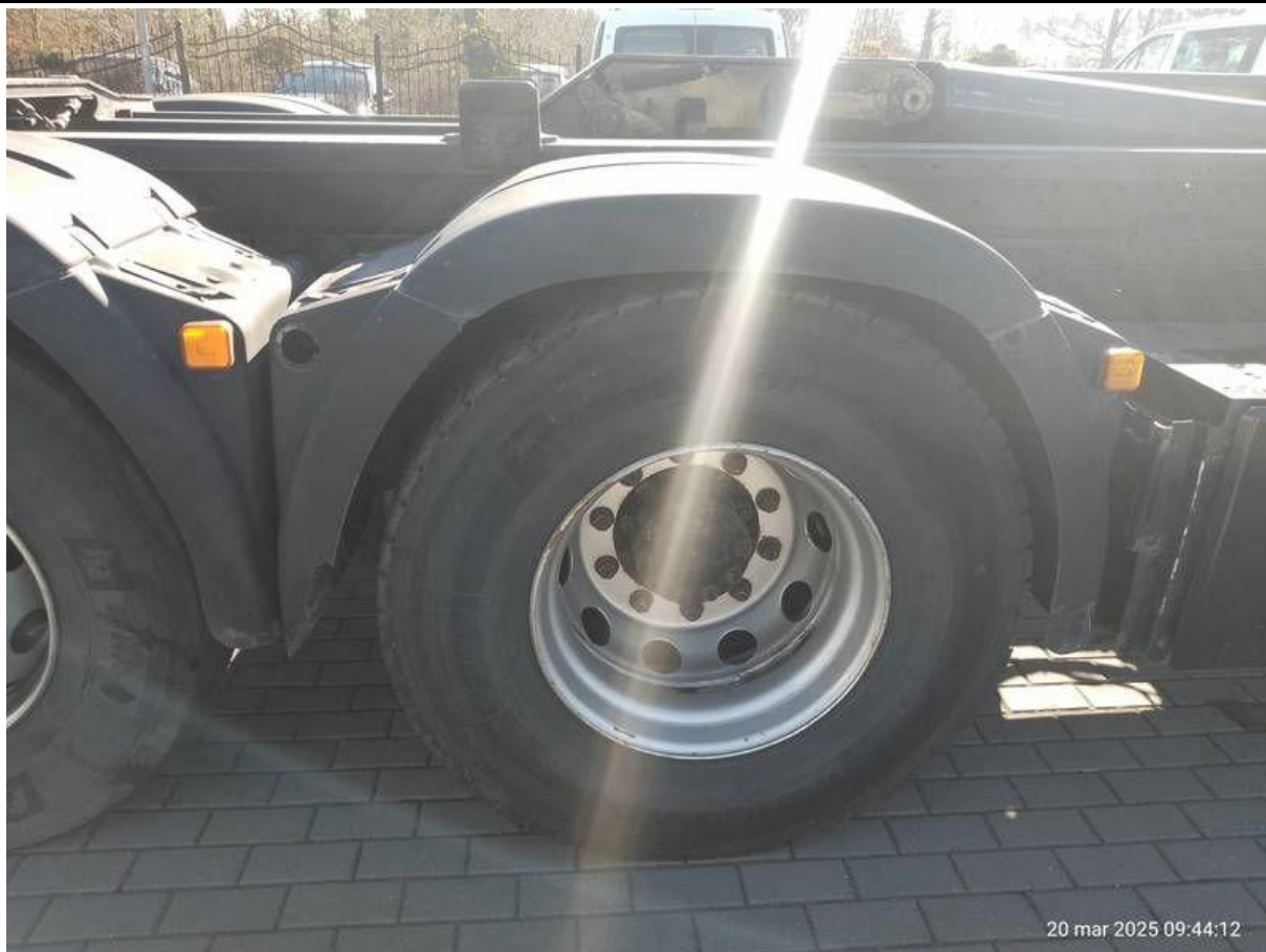
Fot. nr 49