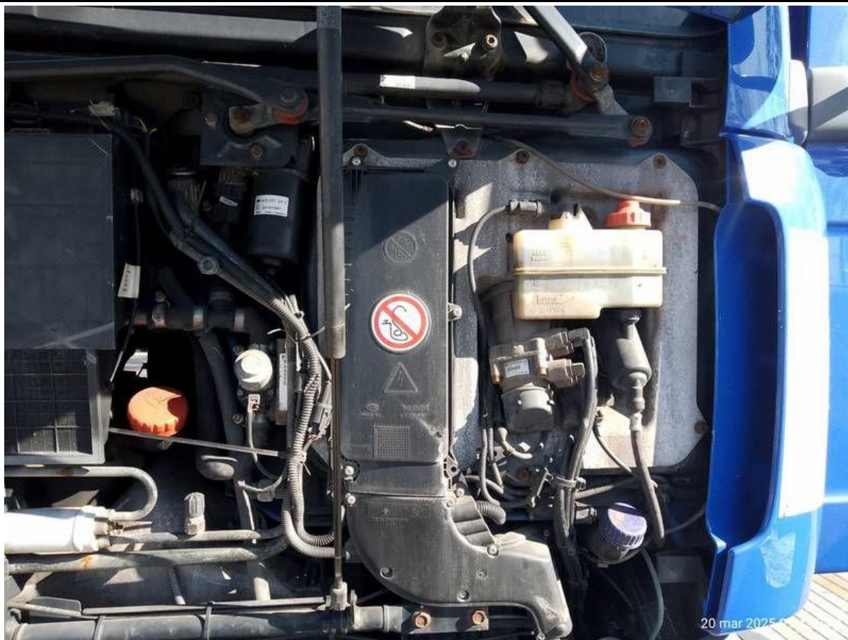
Fot. nr 35