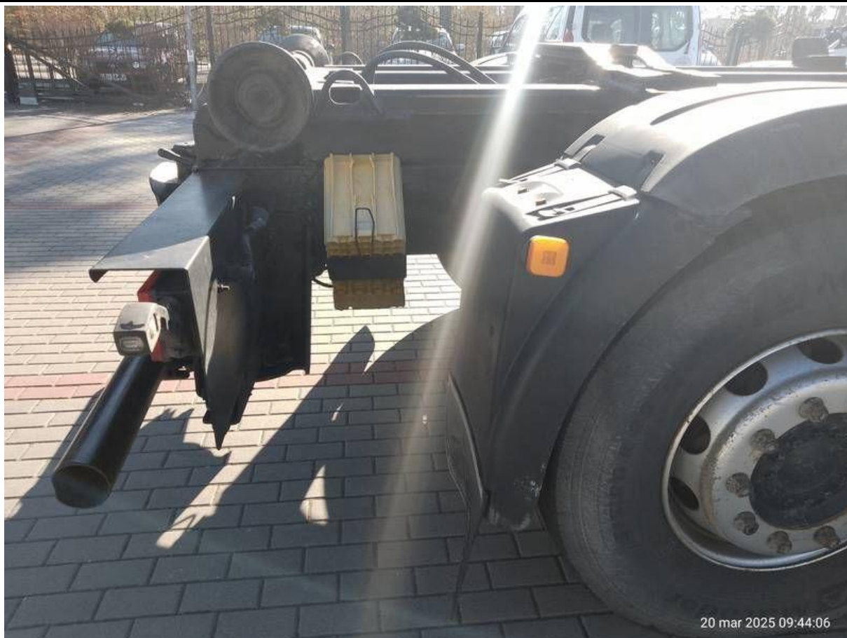
Fot. nr 47