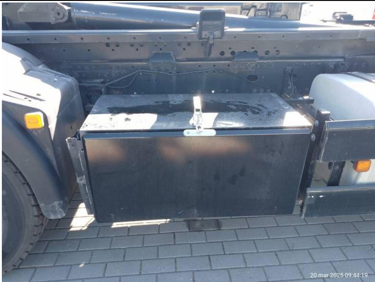
Fot. nr 51