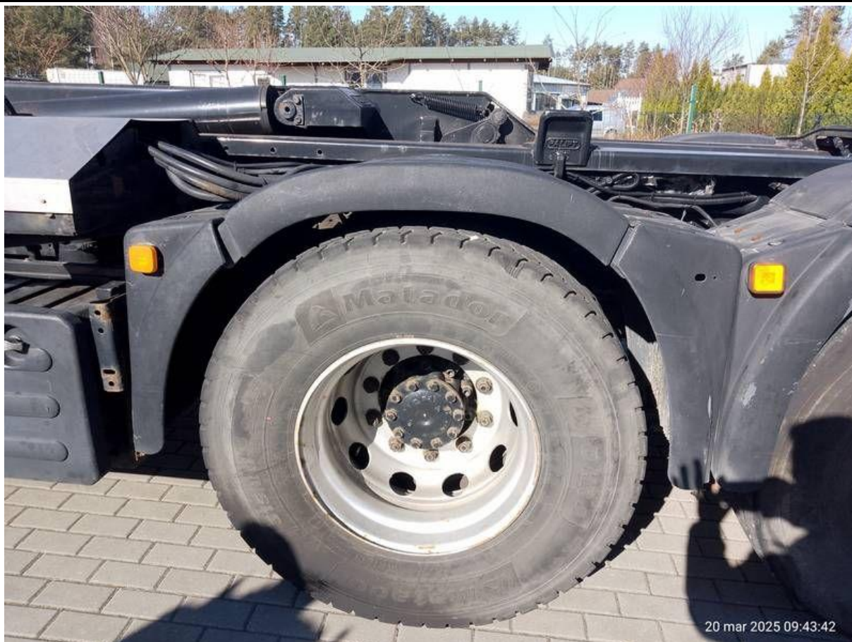
Fot. nr 41