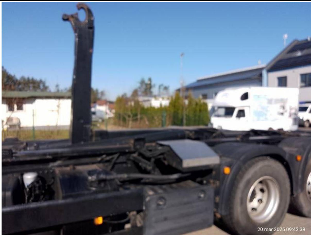
Fot. nr 37