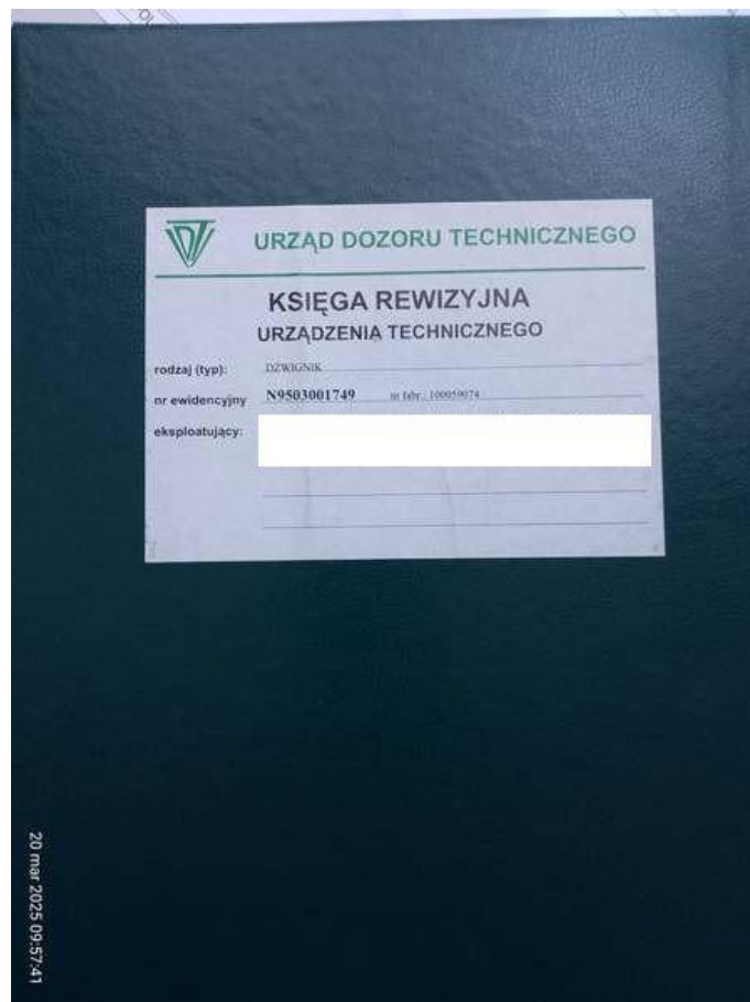
Fot. nr 56