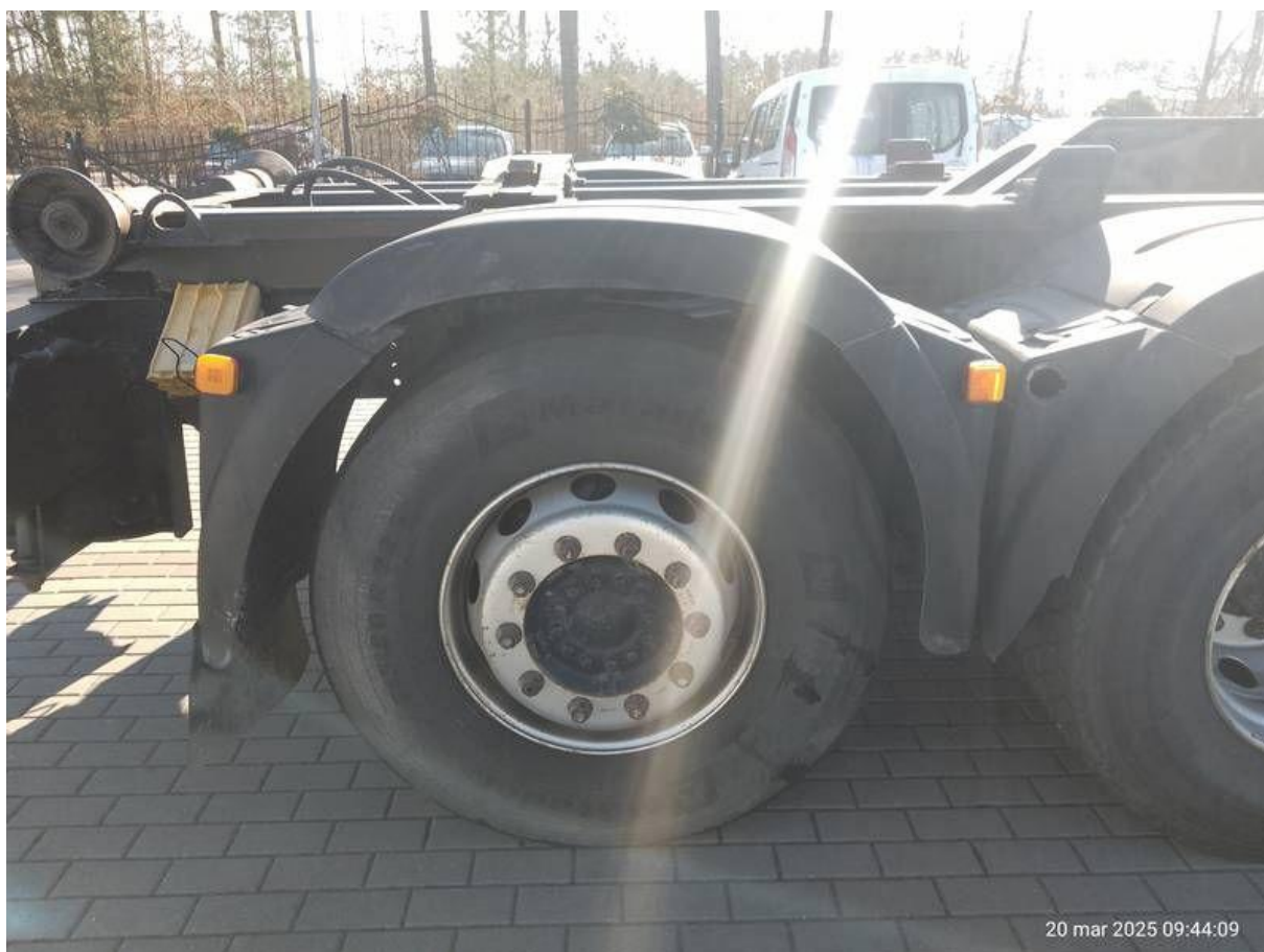
Fot. nr 48