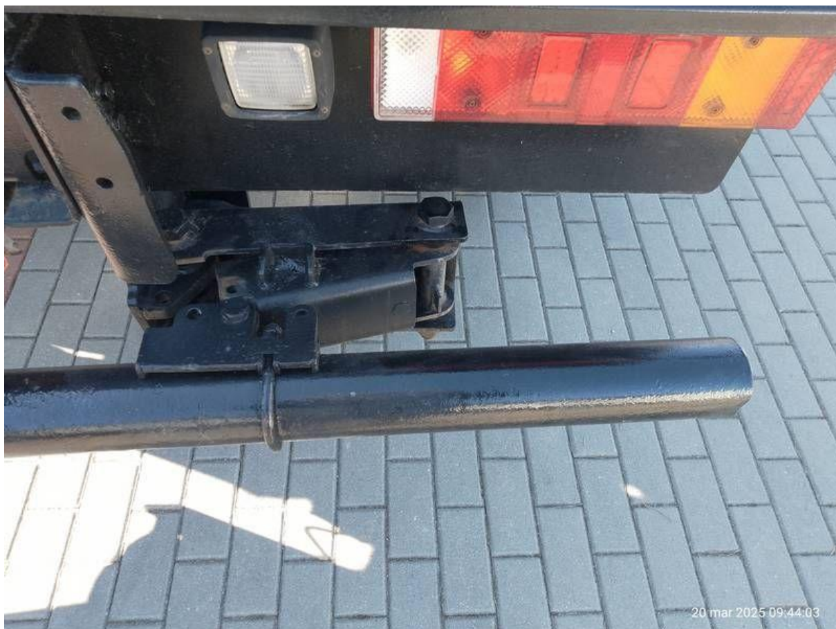
Fot. nr 46