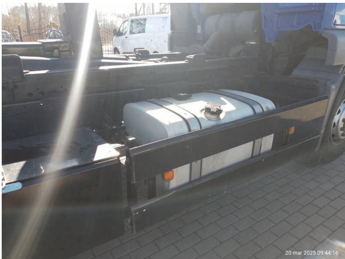
Fot. nr 50