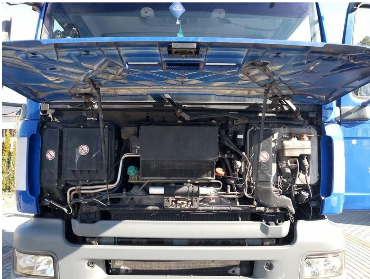
Fot. nr 34