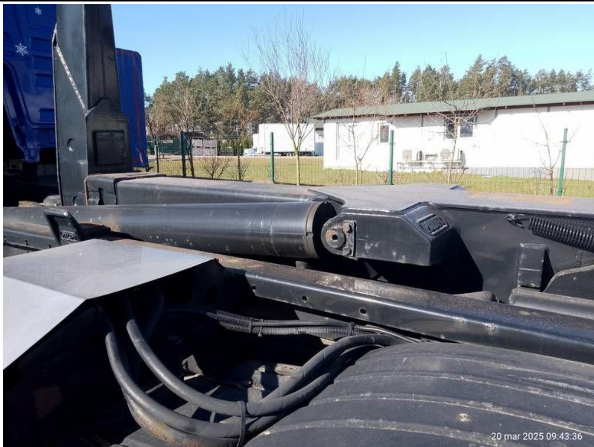
Fot. nr 39