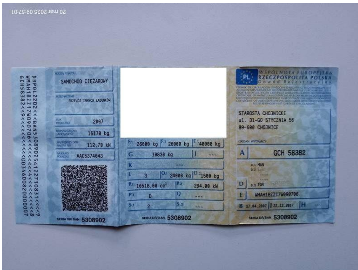
Fot. nr 53