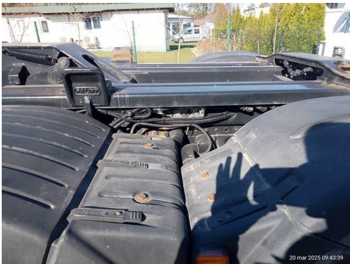
Fot. nr 40