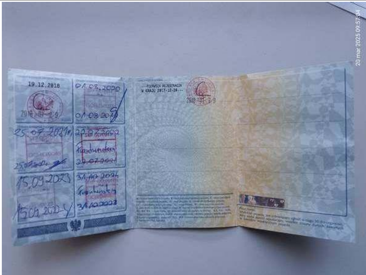
Fot. nr 55