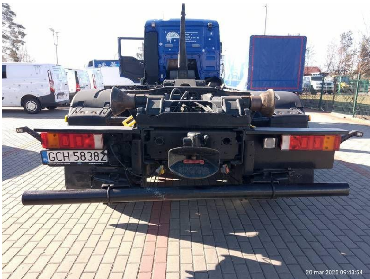
Fot. nr 43