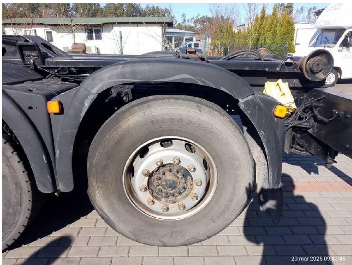
Fot. nr 42