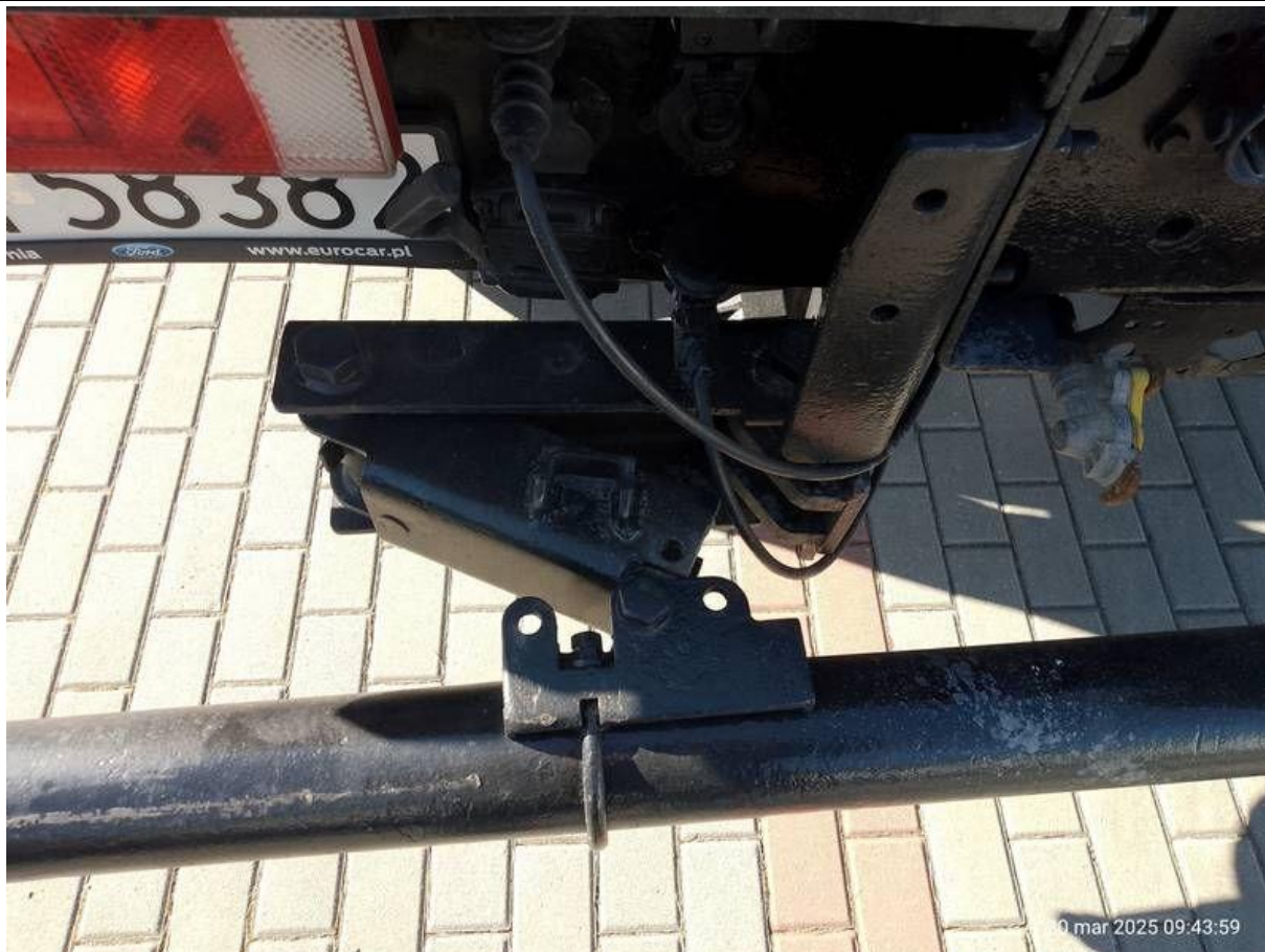
Fot. nr 45