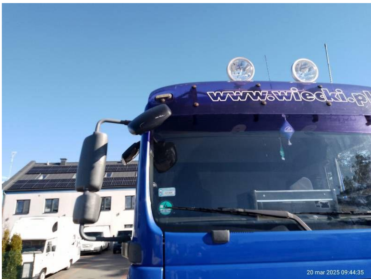
Fot. nr 52