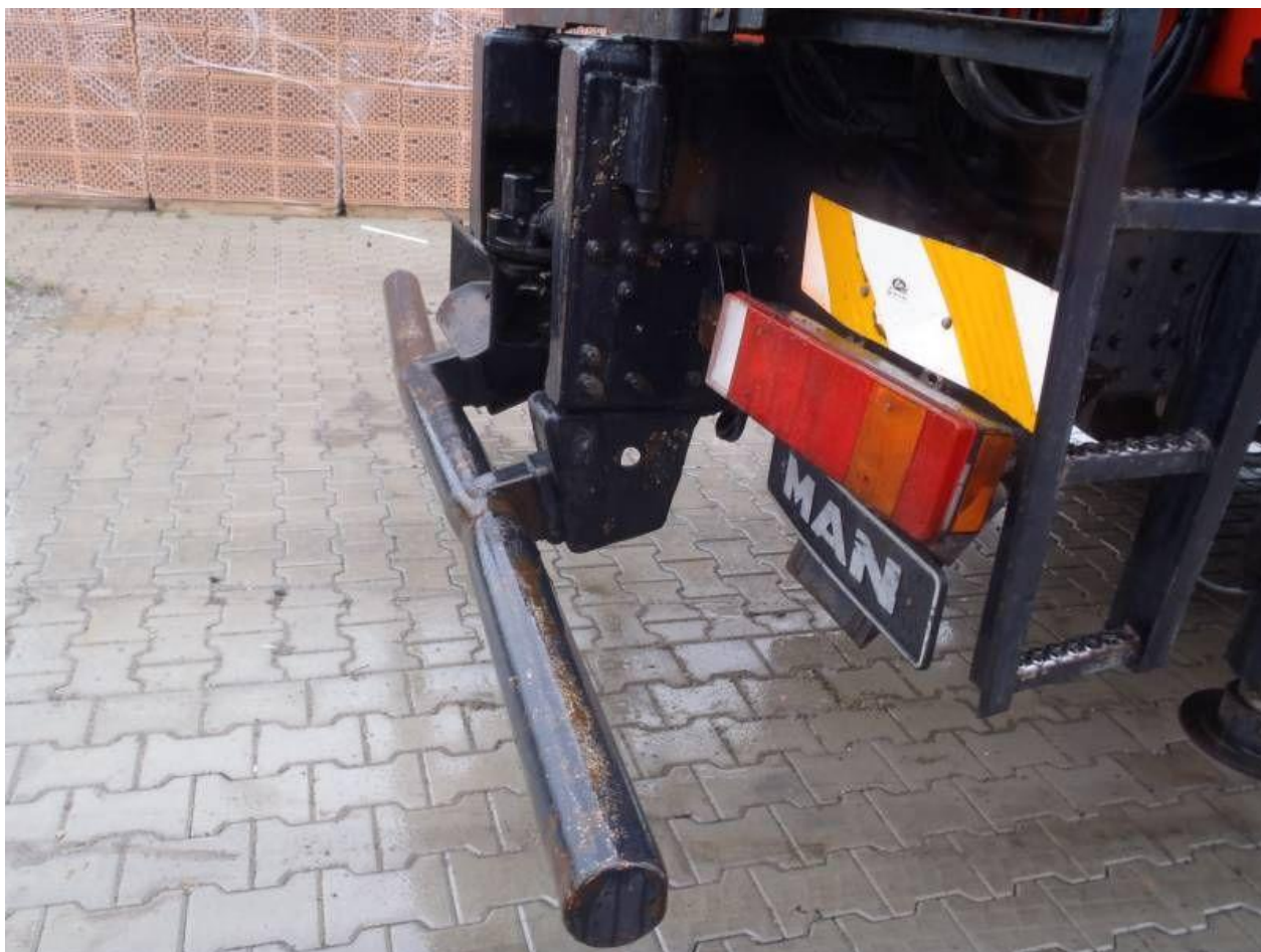
Fot. nr 108