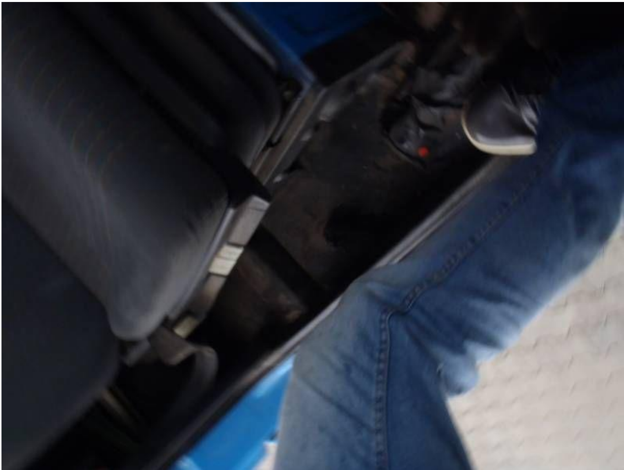
Fot. nr 101