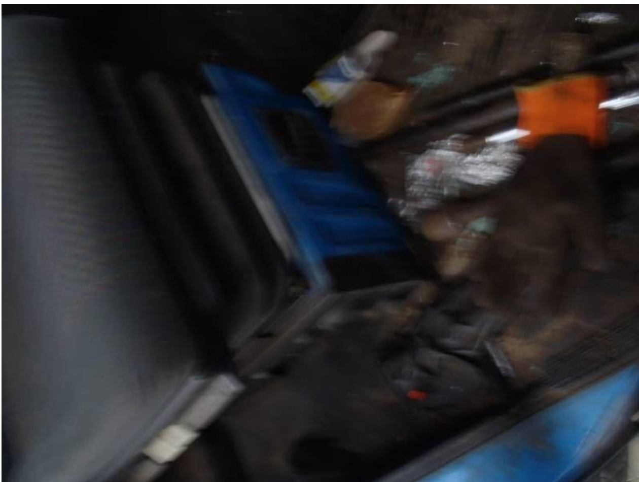
Fot. nr 102