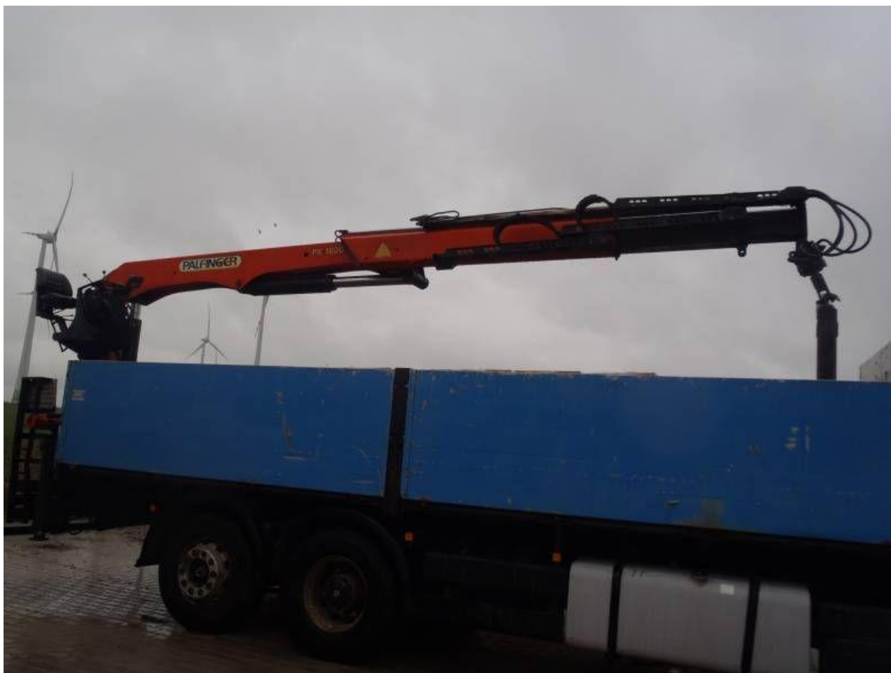
Fot. nr 104