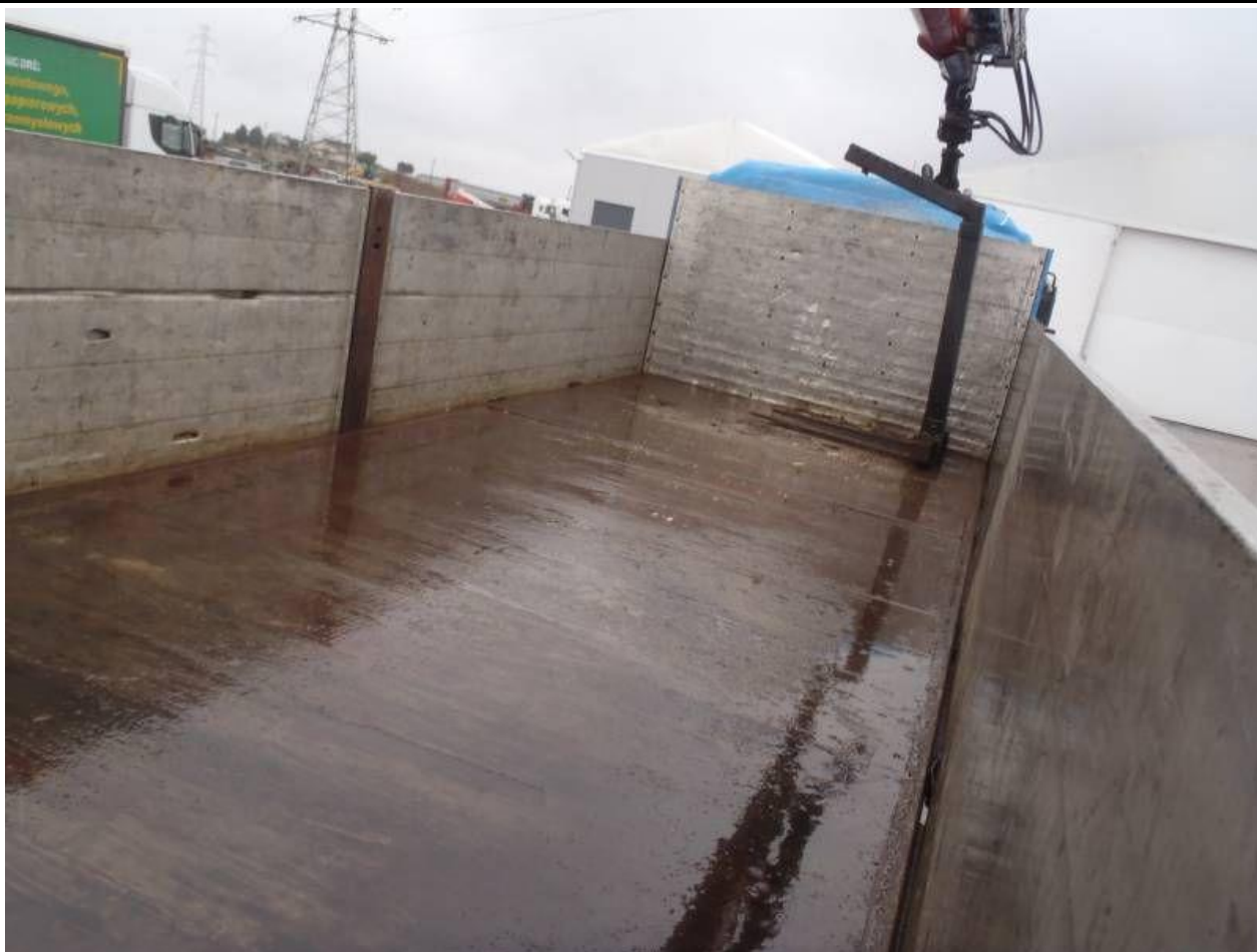
Fot. nr 107