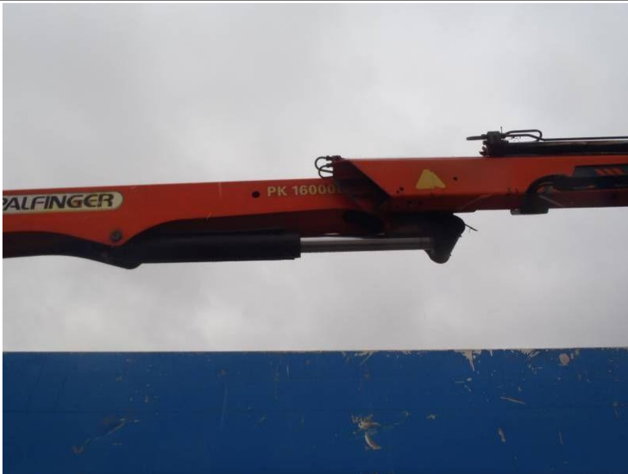
Fot. nr 105