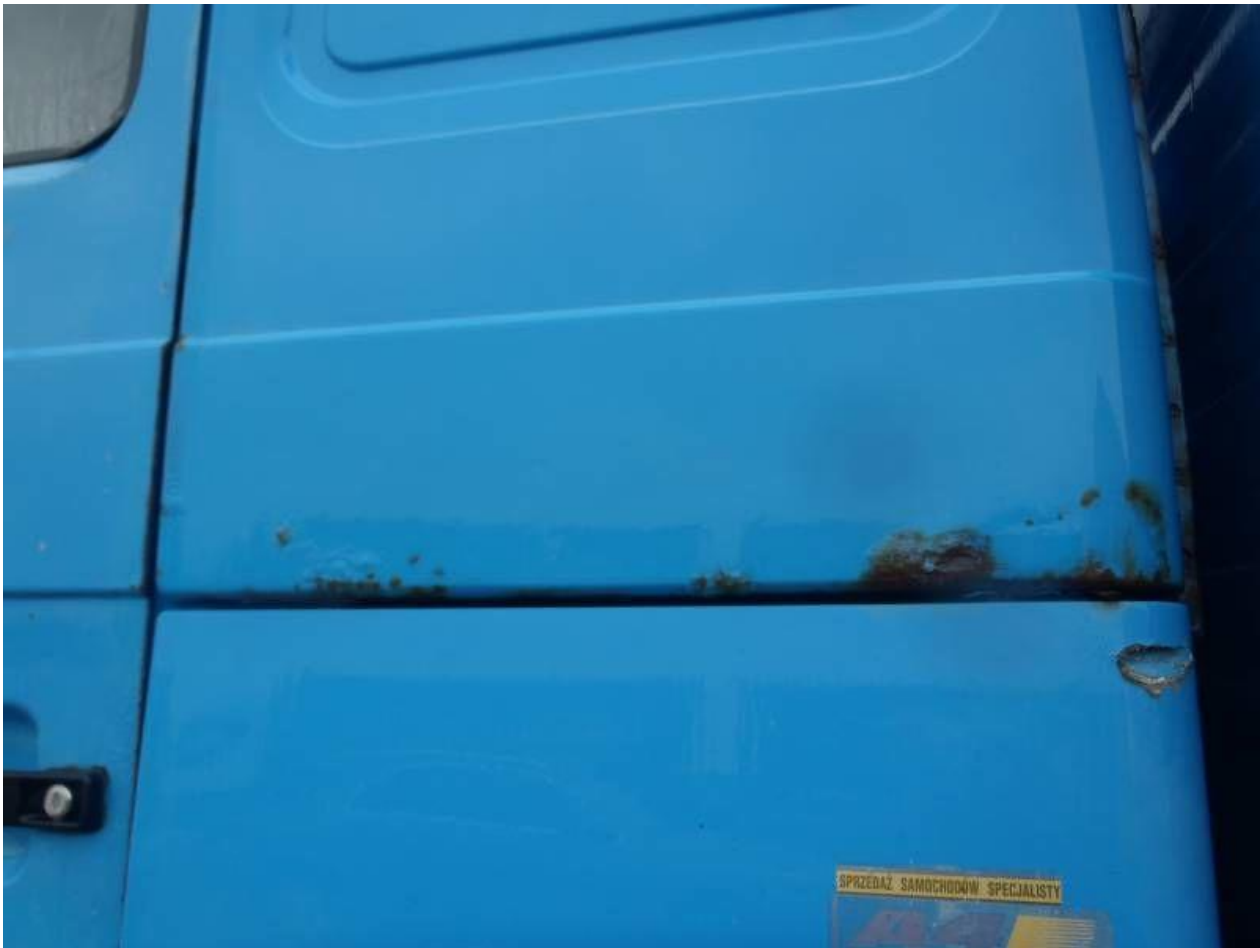
Fot. nr 111