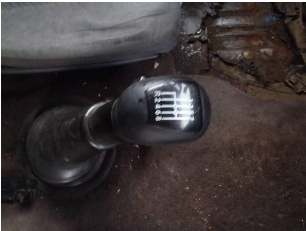
Fot. nr 98