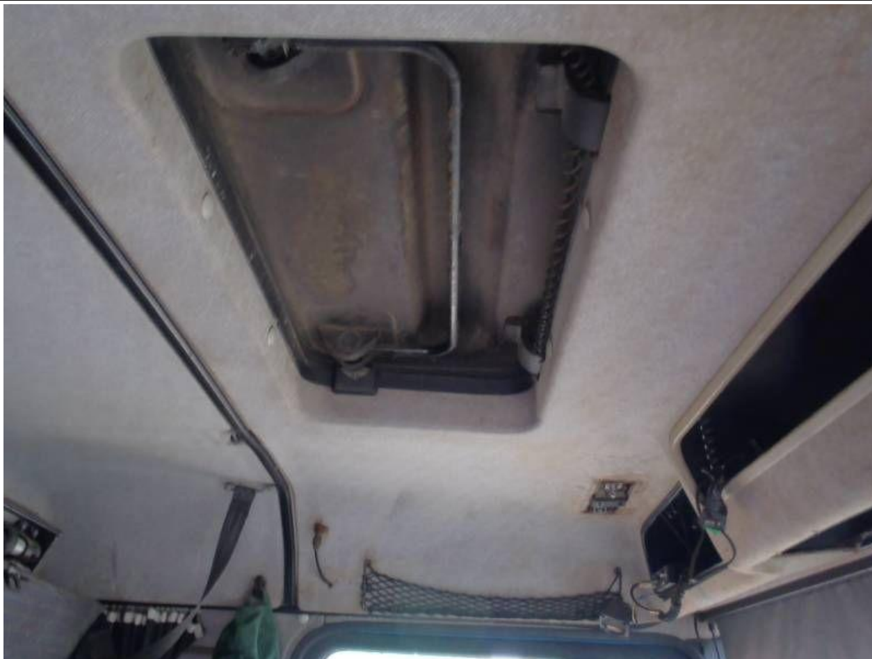
Fot. nr 97