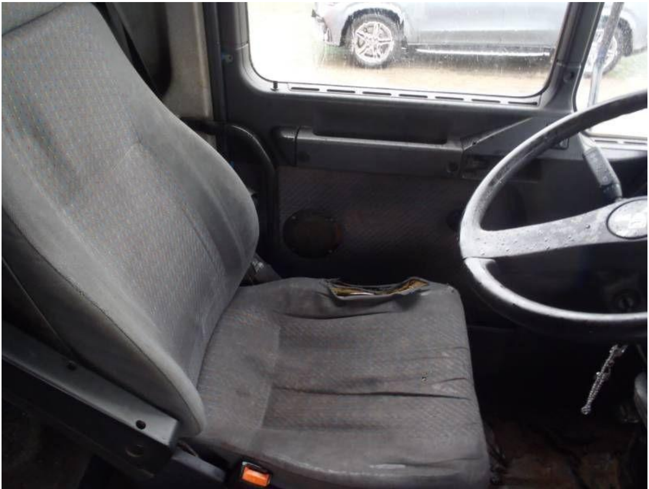
Fot. nr 99