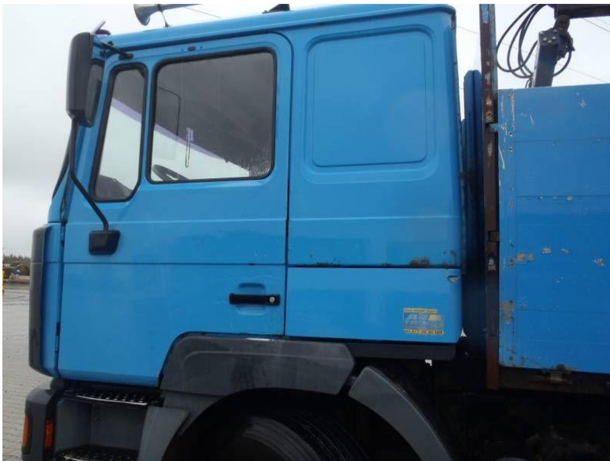
Fot. nr 110