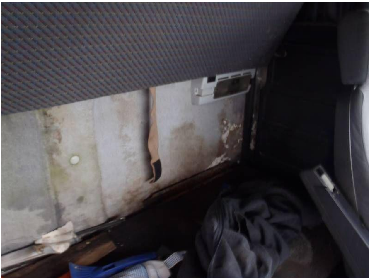
Fot. nr 100