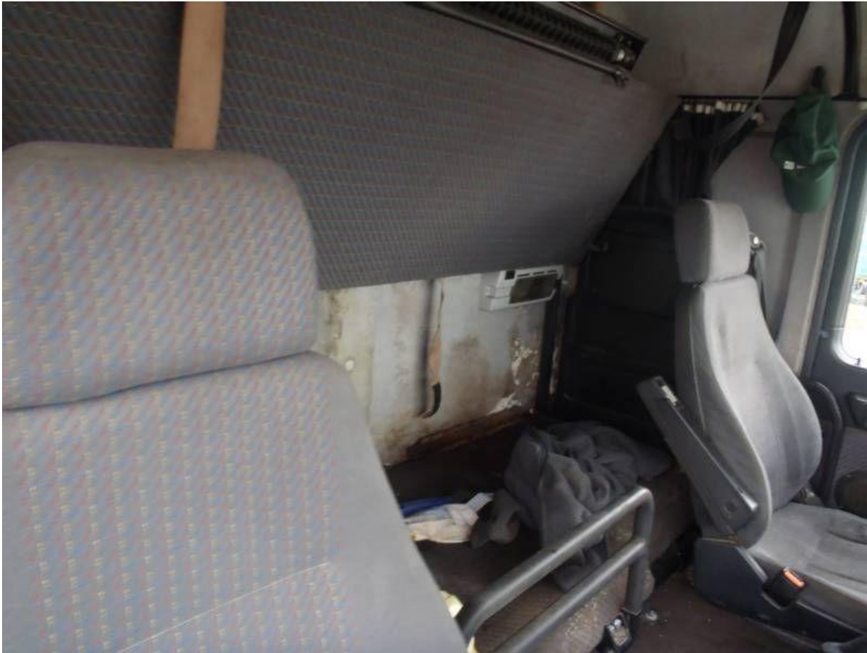
Fot. nr 95