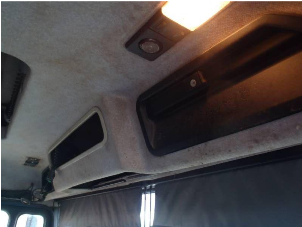
Fot. nr 96