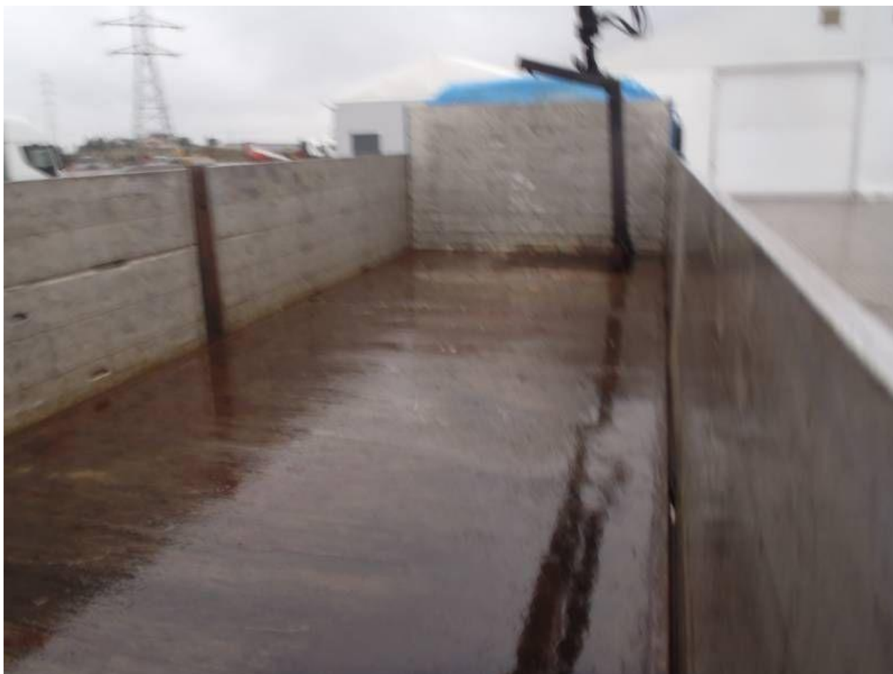
Fot. nr 106