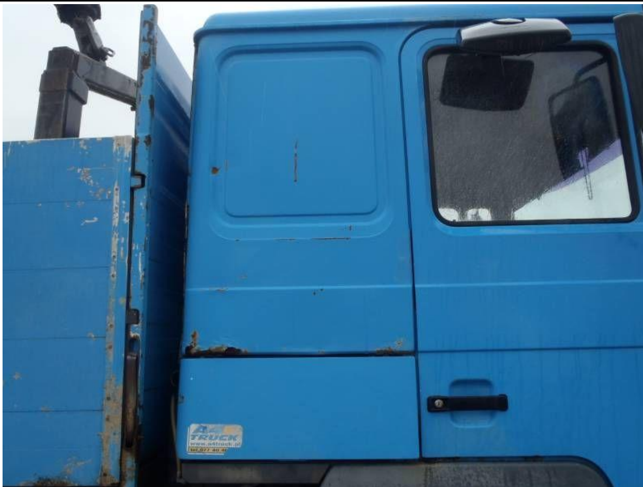
Fot. nr 103