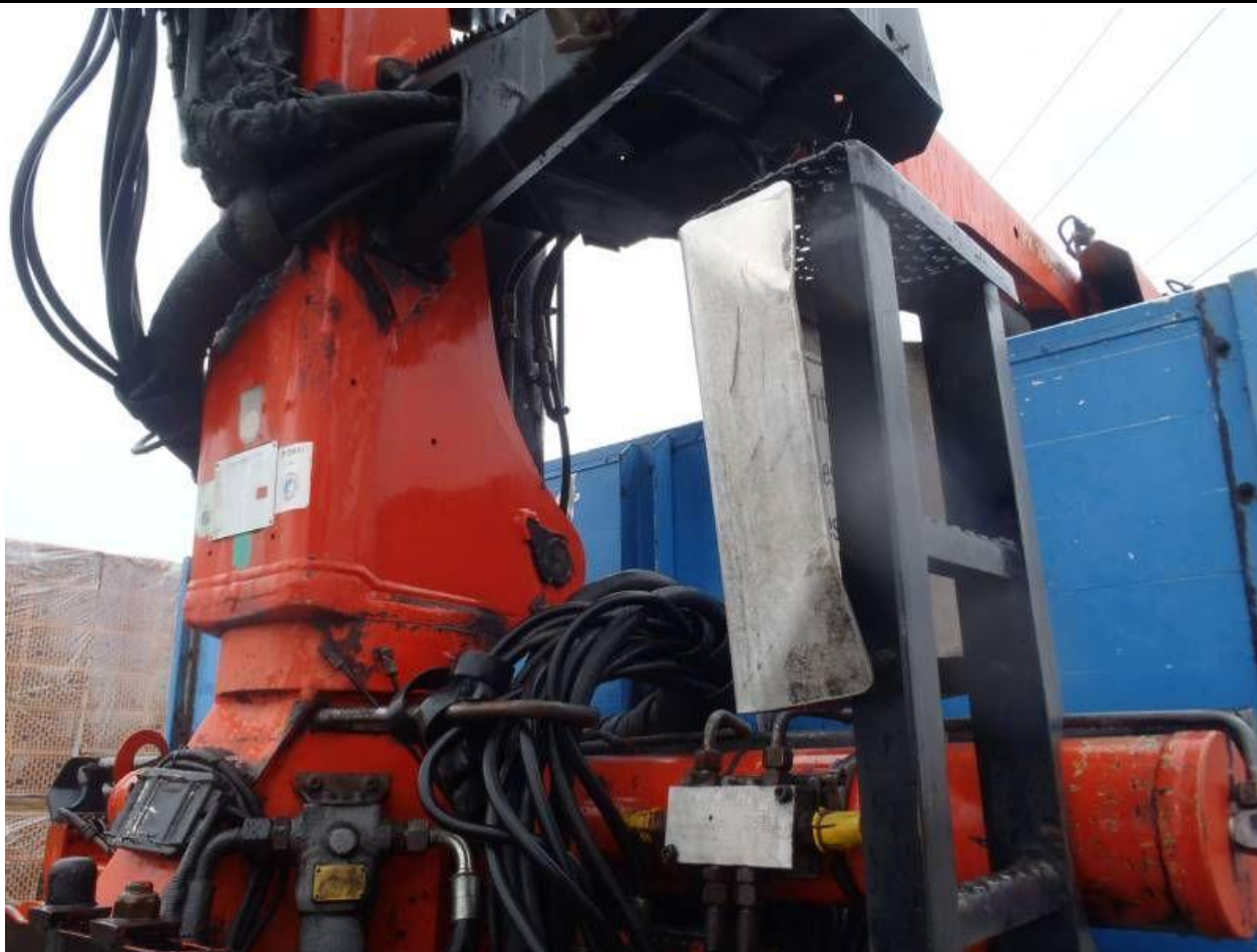
Fot. nr 109