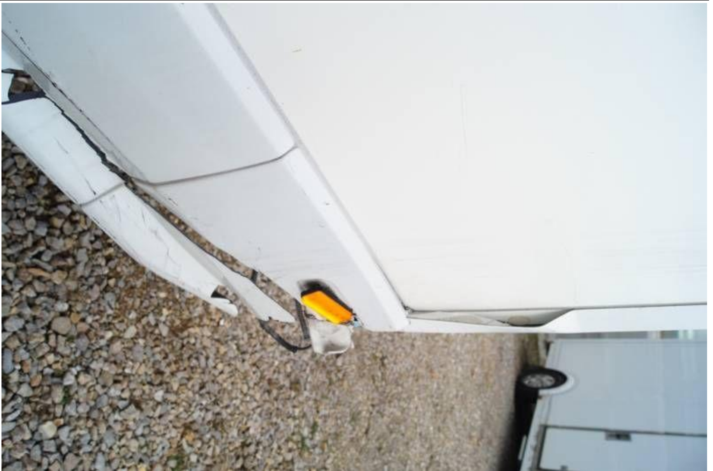
Fot. nr 27