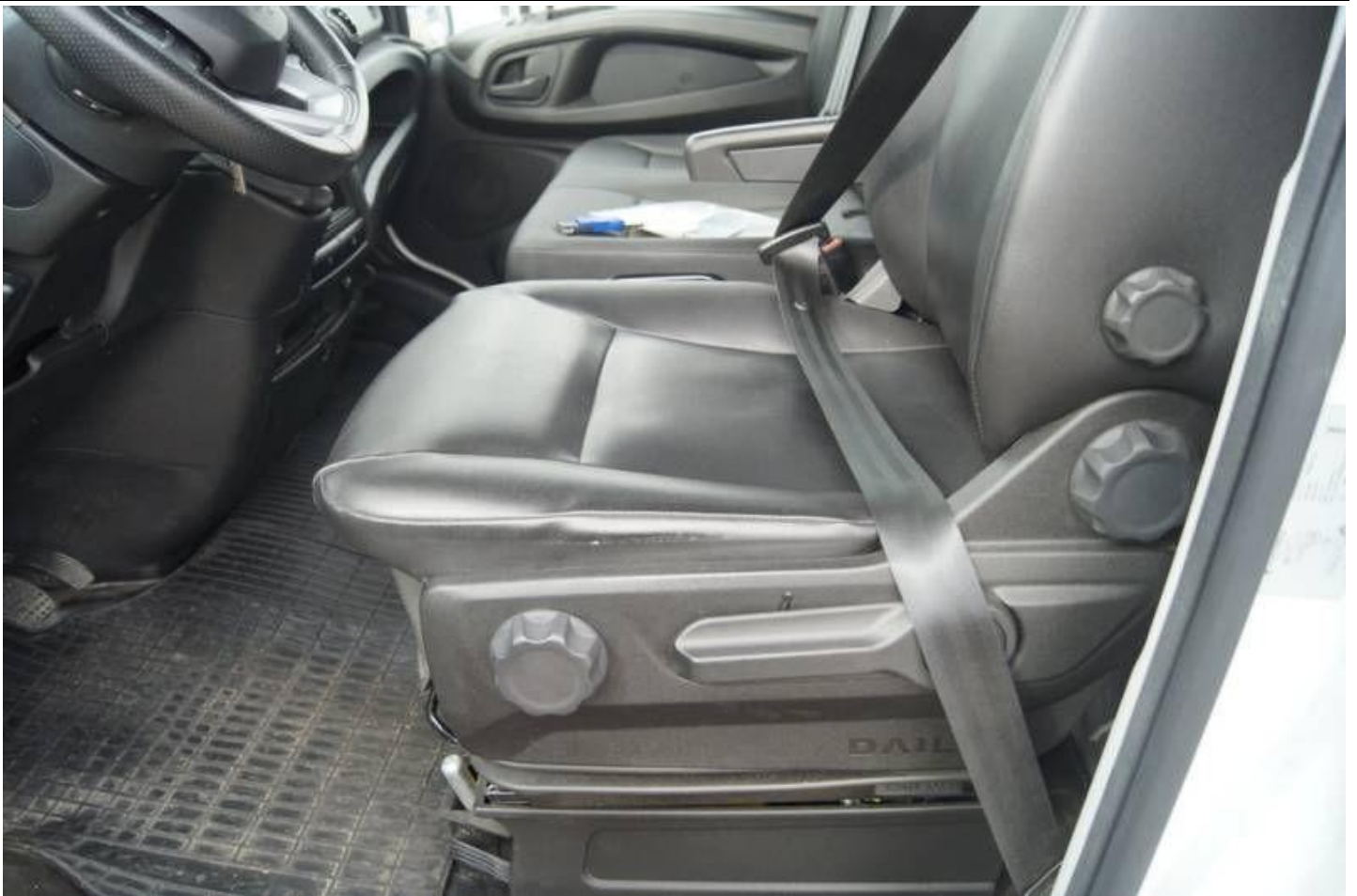
Fot. nr 29