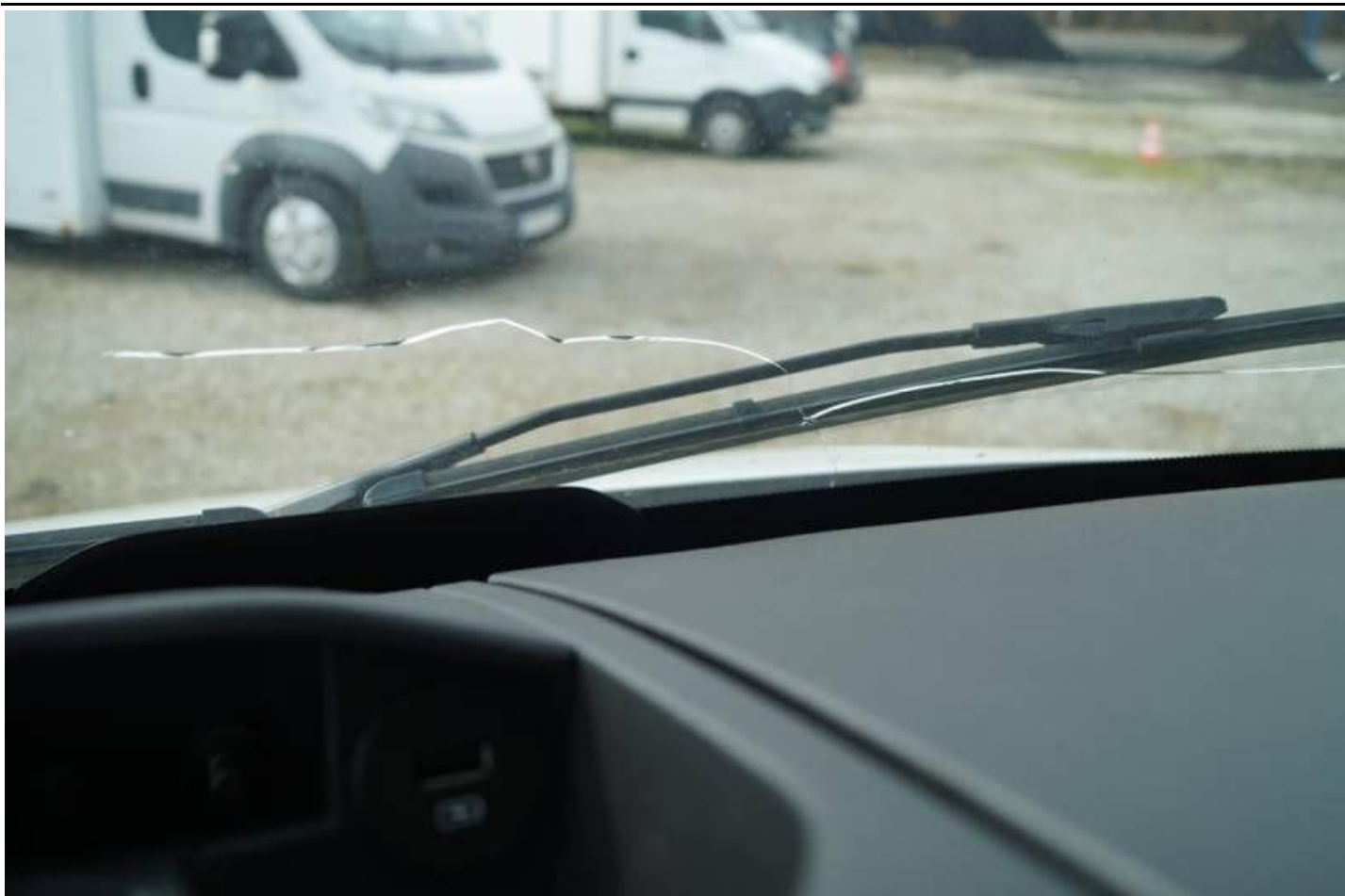
Fot. nr 31