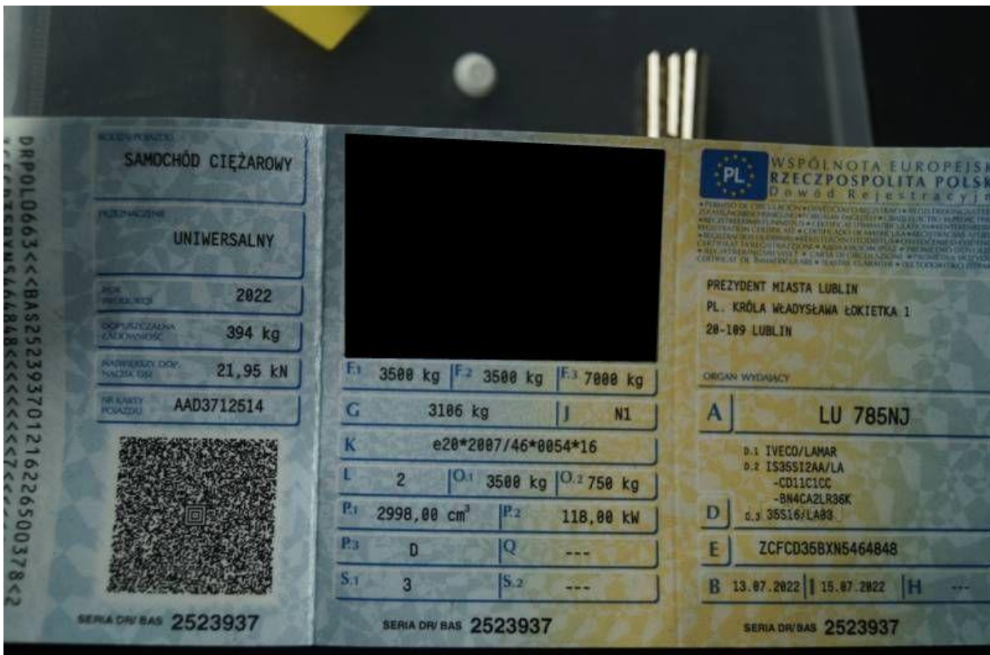
Fot. nr 32