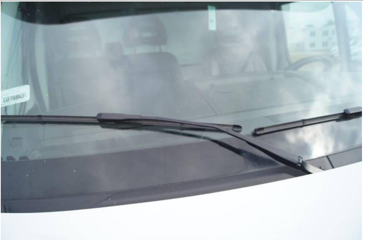
Fot. nr 15