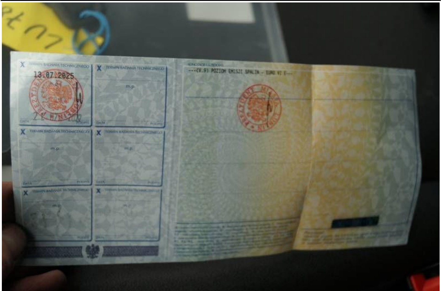
Fot. nr 33

Dokument wystawiony elektronicznie, wa ny bez podpisu