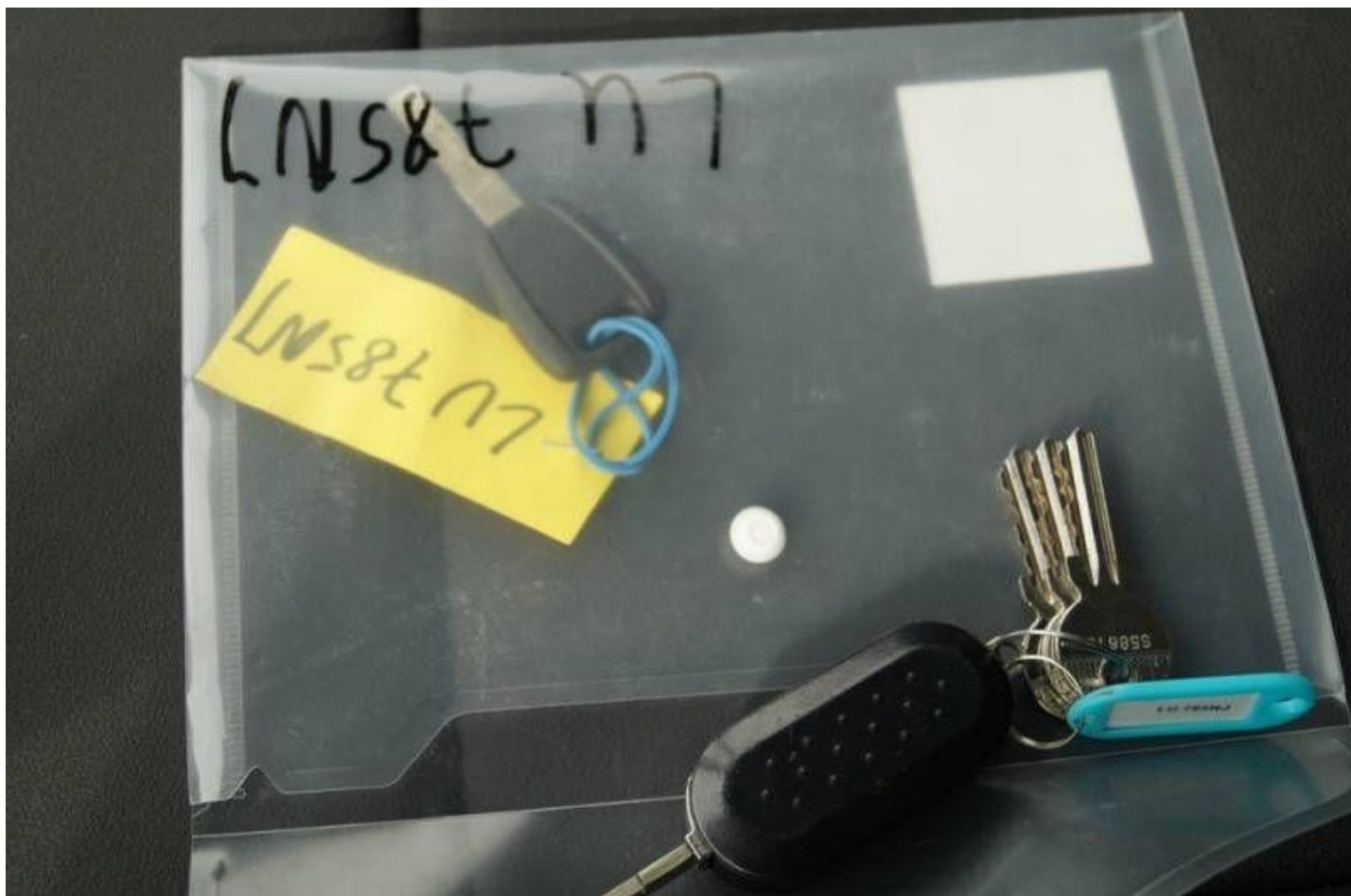
Fot. nr 12