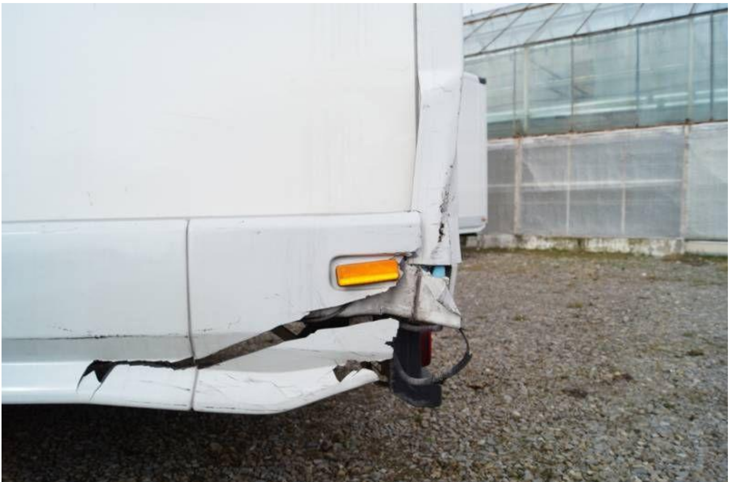
Fot. nr 28