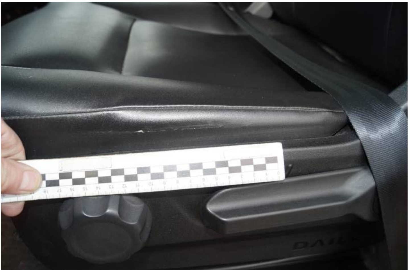
Fot. nr 30