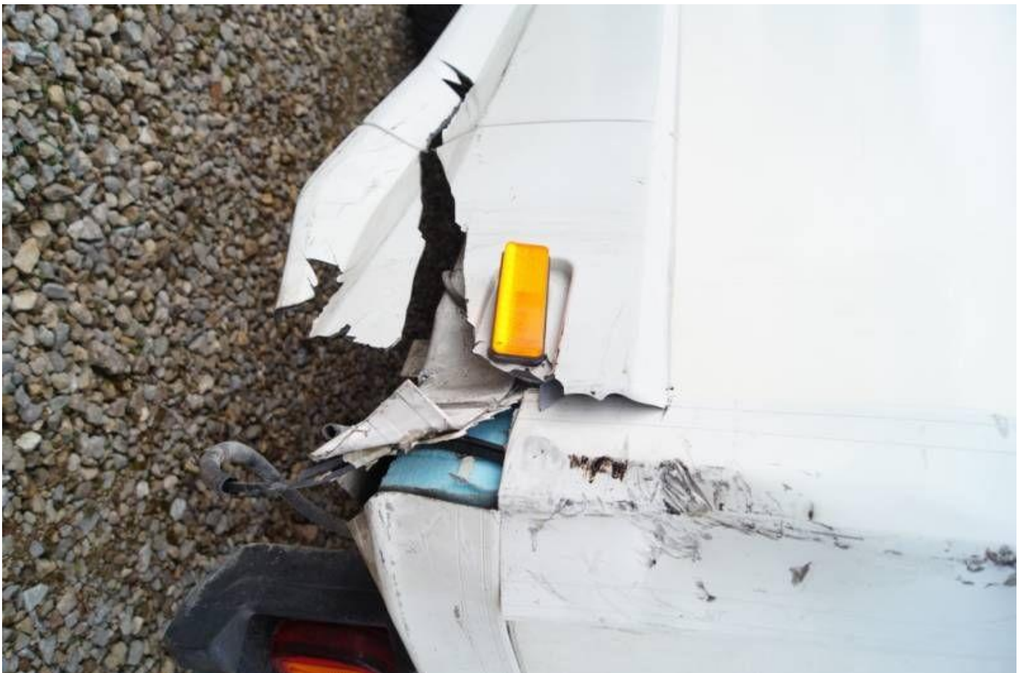
Fot. nr 26