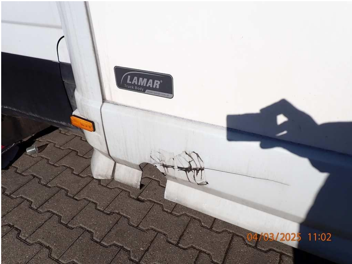
Fot. nr 61

Dokument wystawiony elektronicznie, wa ny bez podpisu