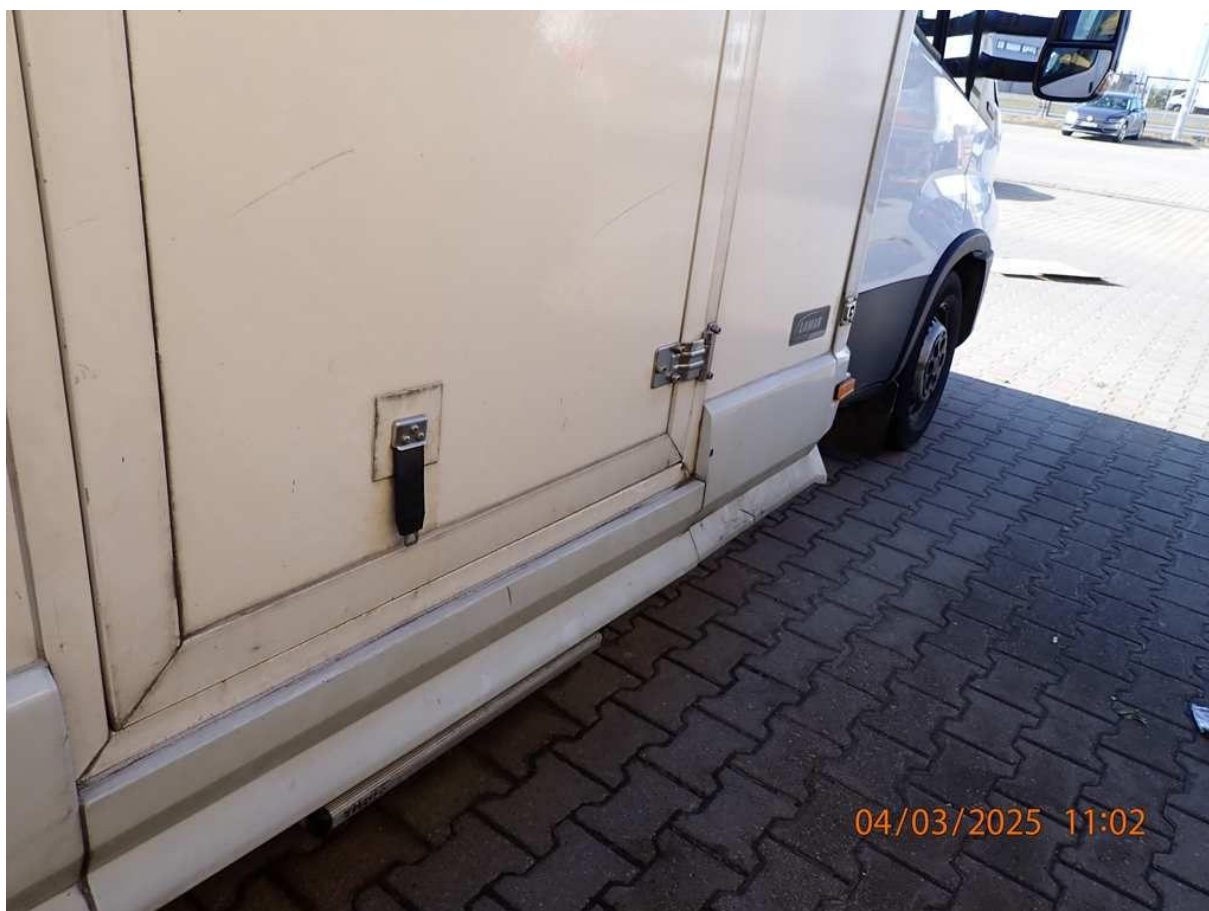
Fot. nr 58