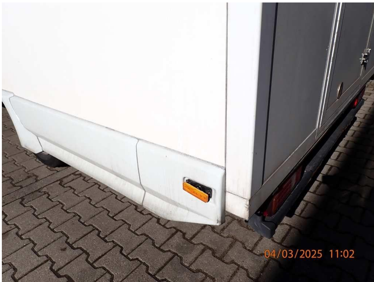
Fot. nr 60