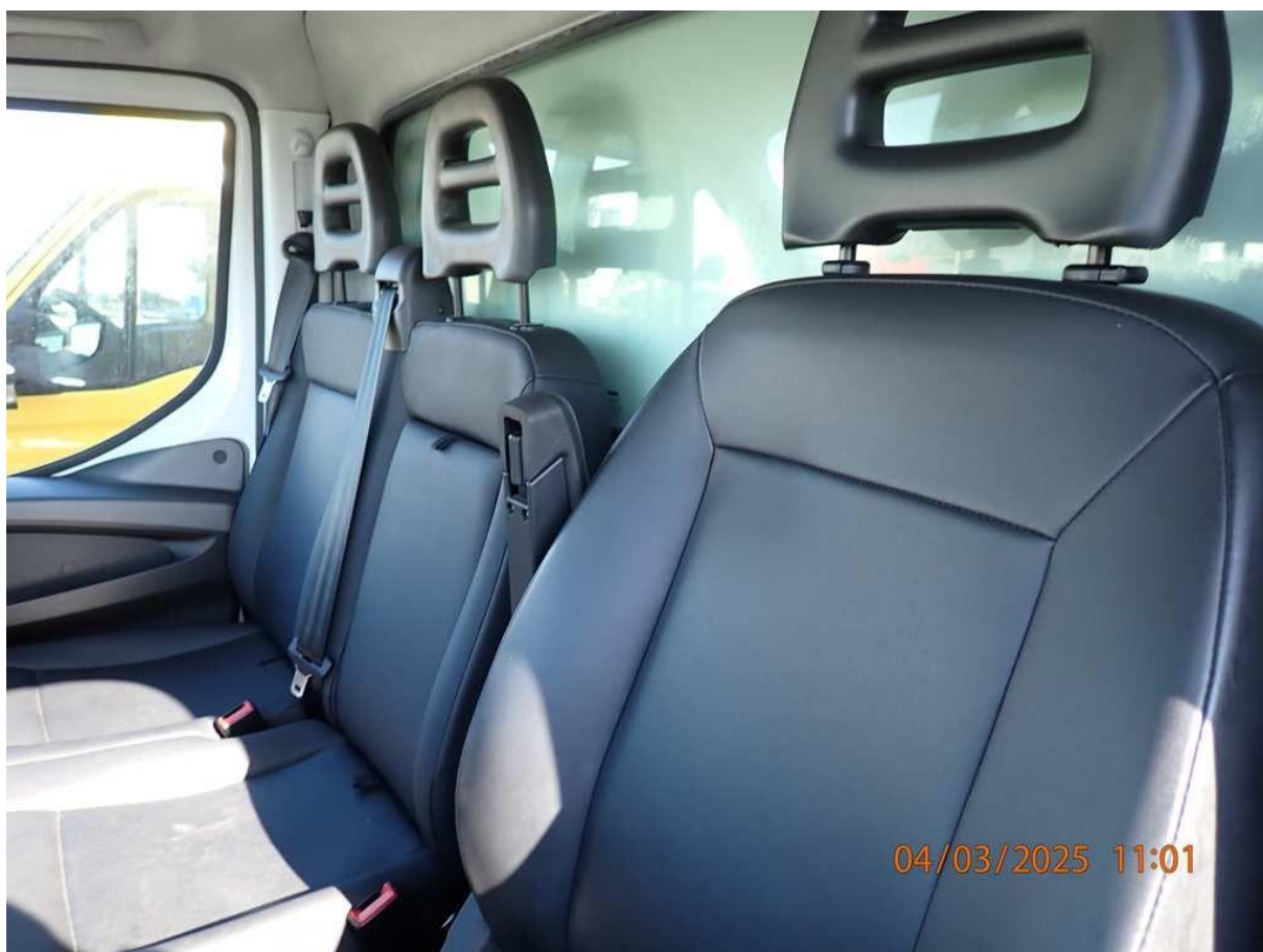
Fot. nr 56