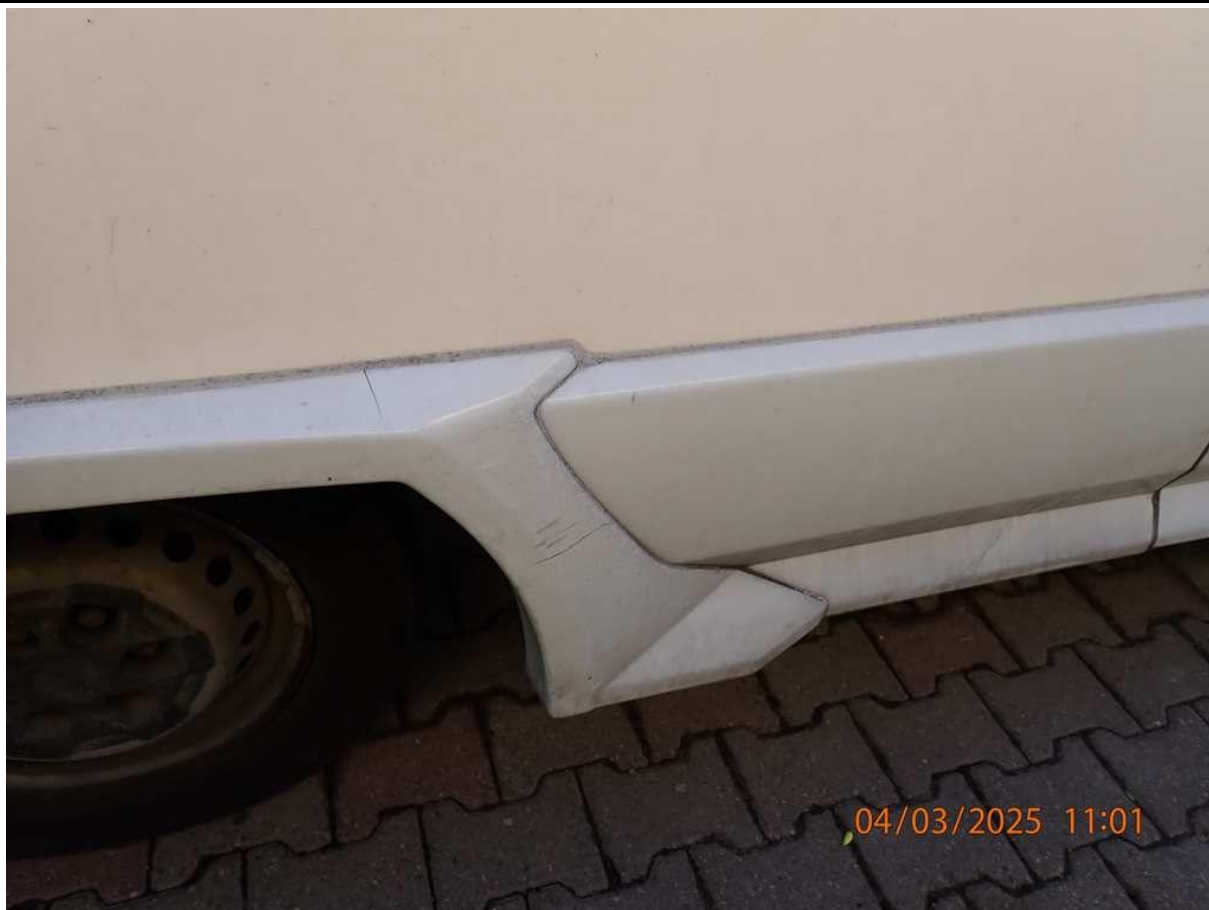
Fot. nr 57