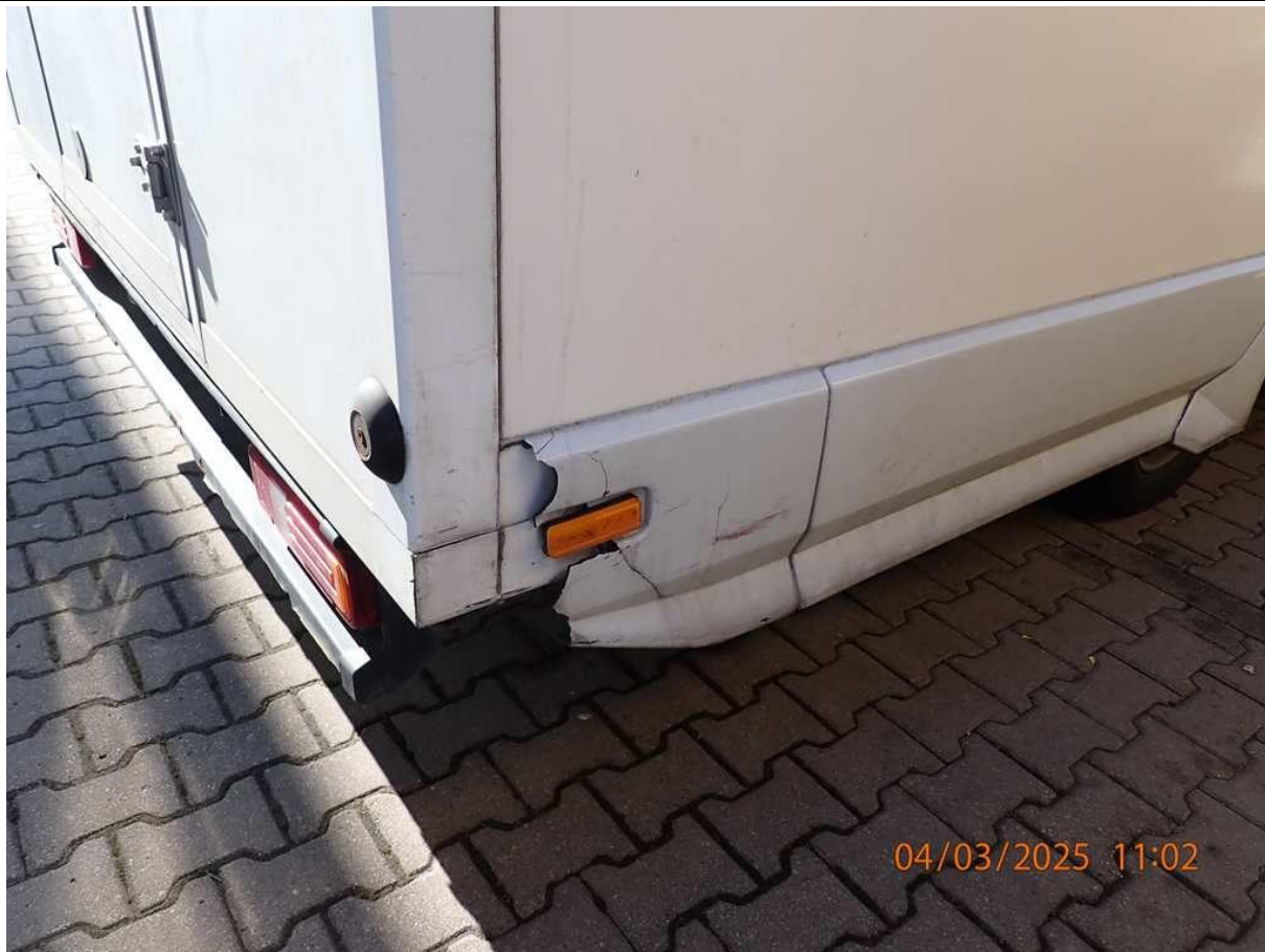
Fot. nr 59