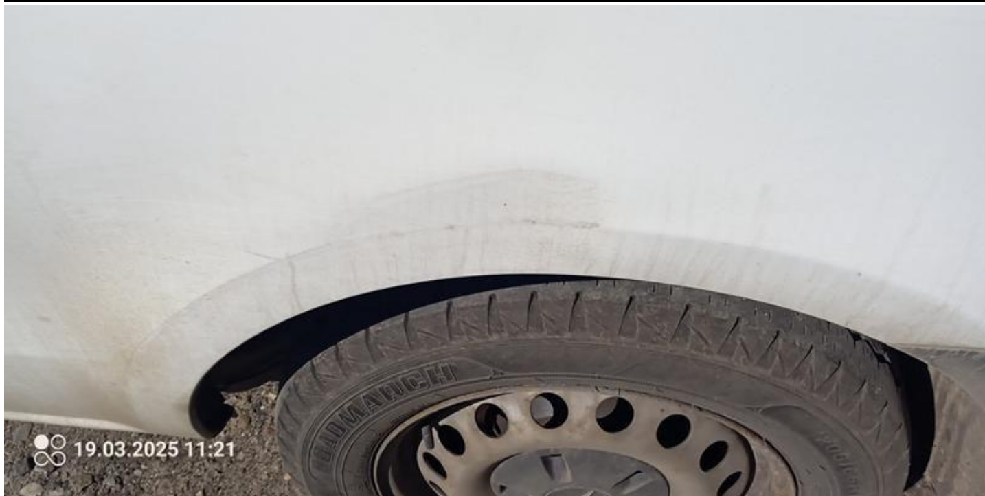
Fot. nr 41