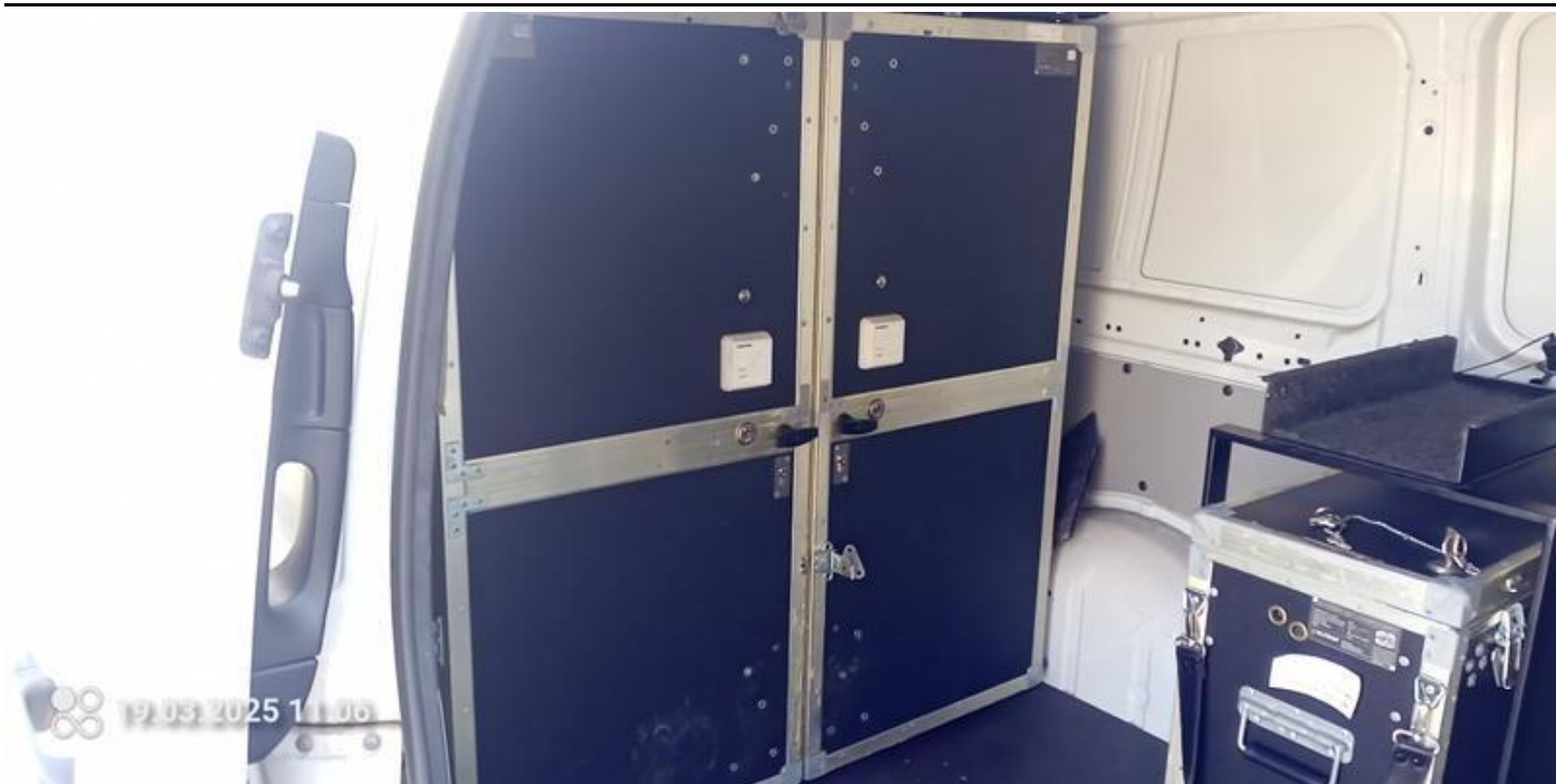
Fot. nr 21