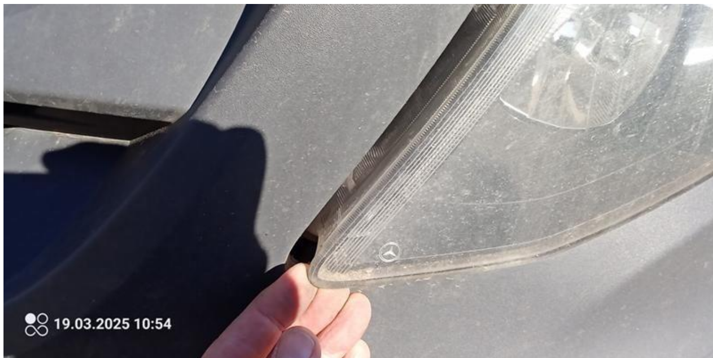
Fot. nr 16