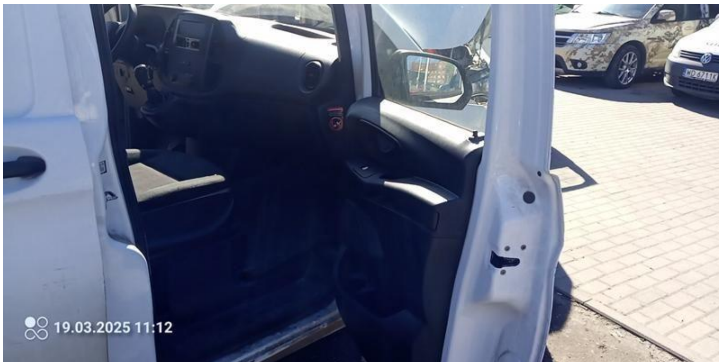
Fot. nr 28