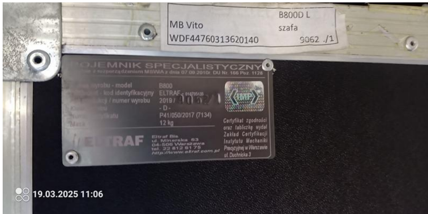
Fot. nr 20