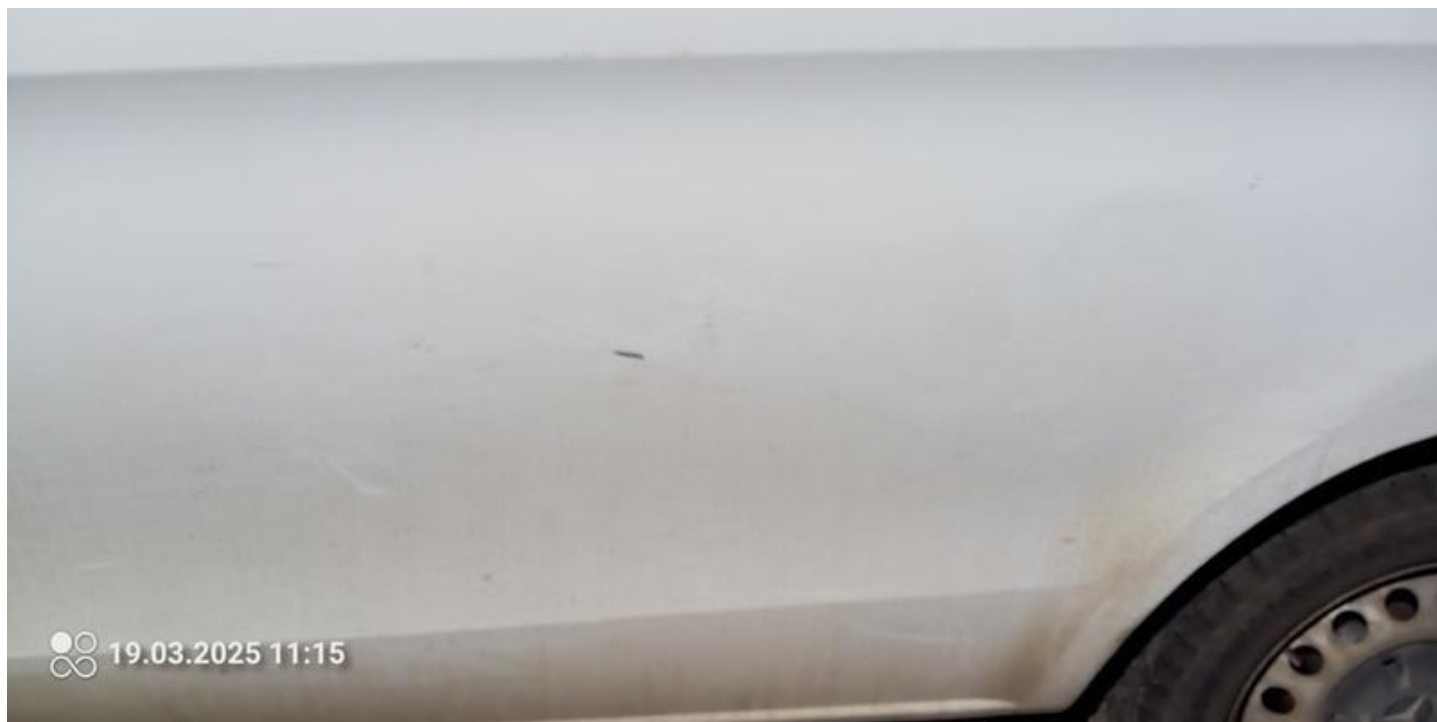
Fot. nr 34