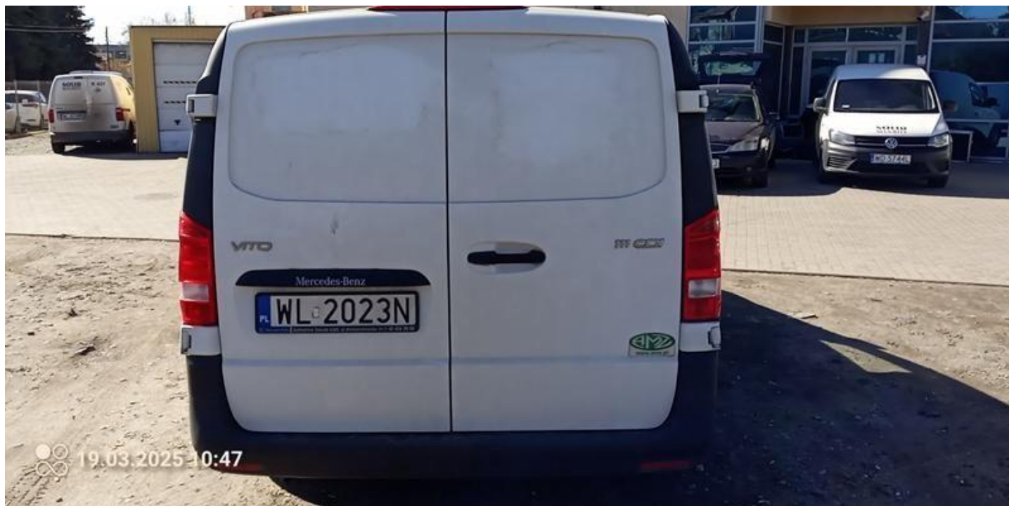
Fot. nr 4