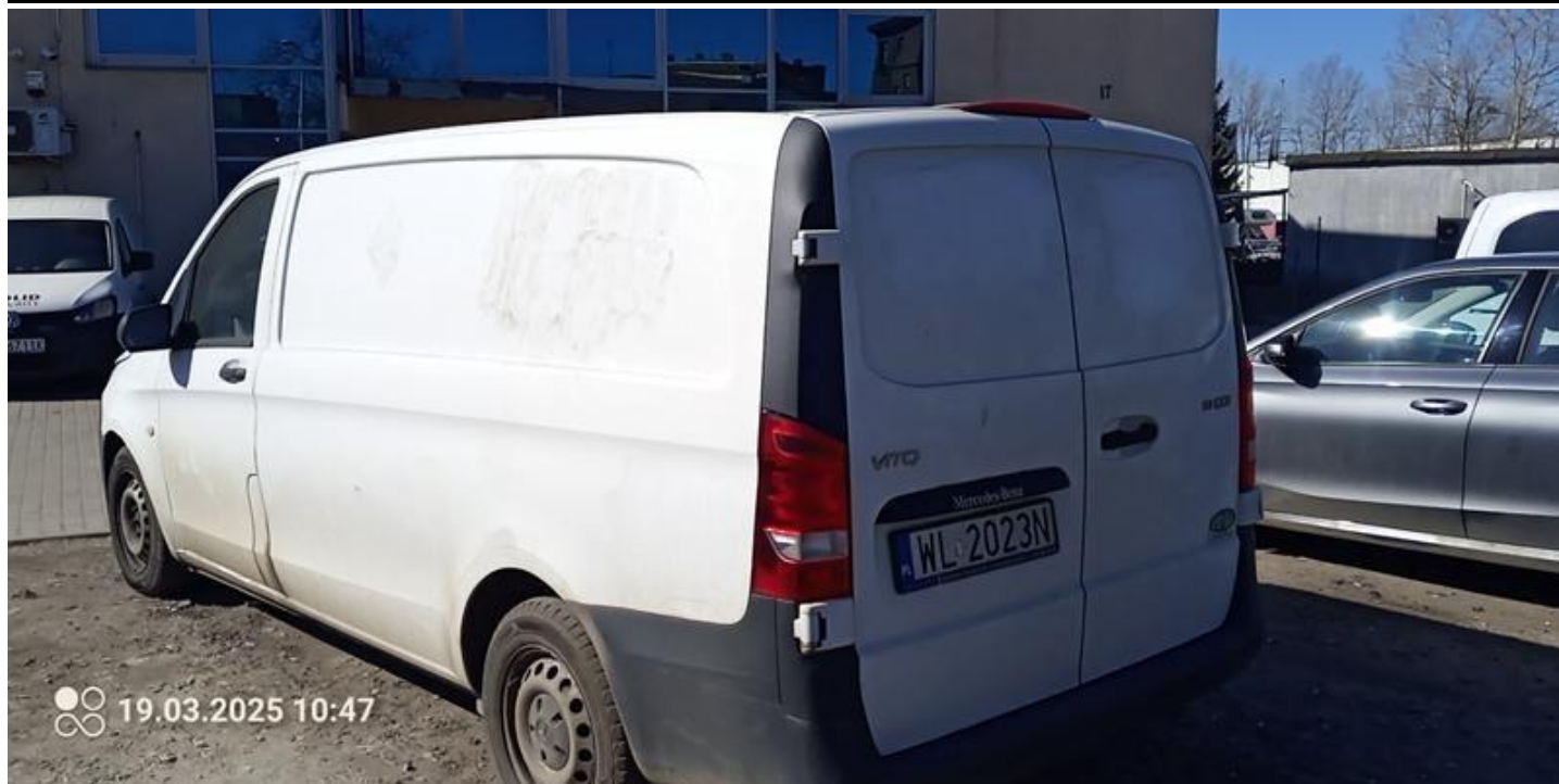
Fot. nr 3