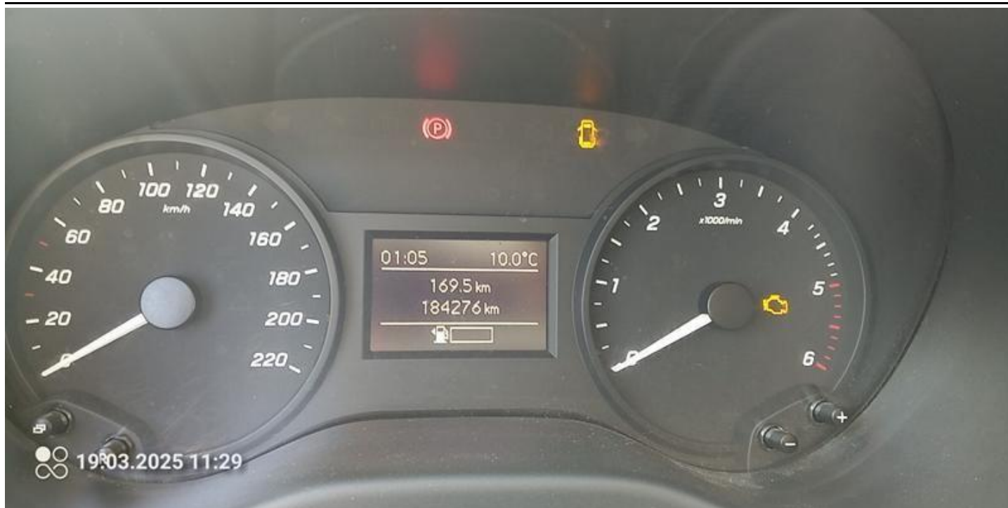
Fot. nr 11