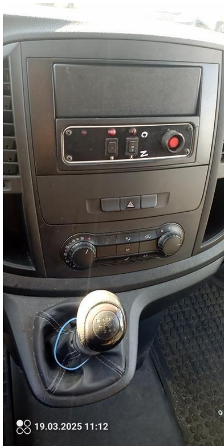
Fot. nr 26