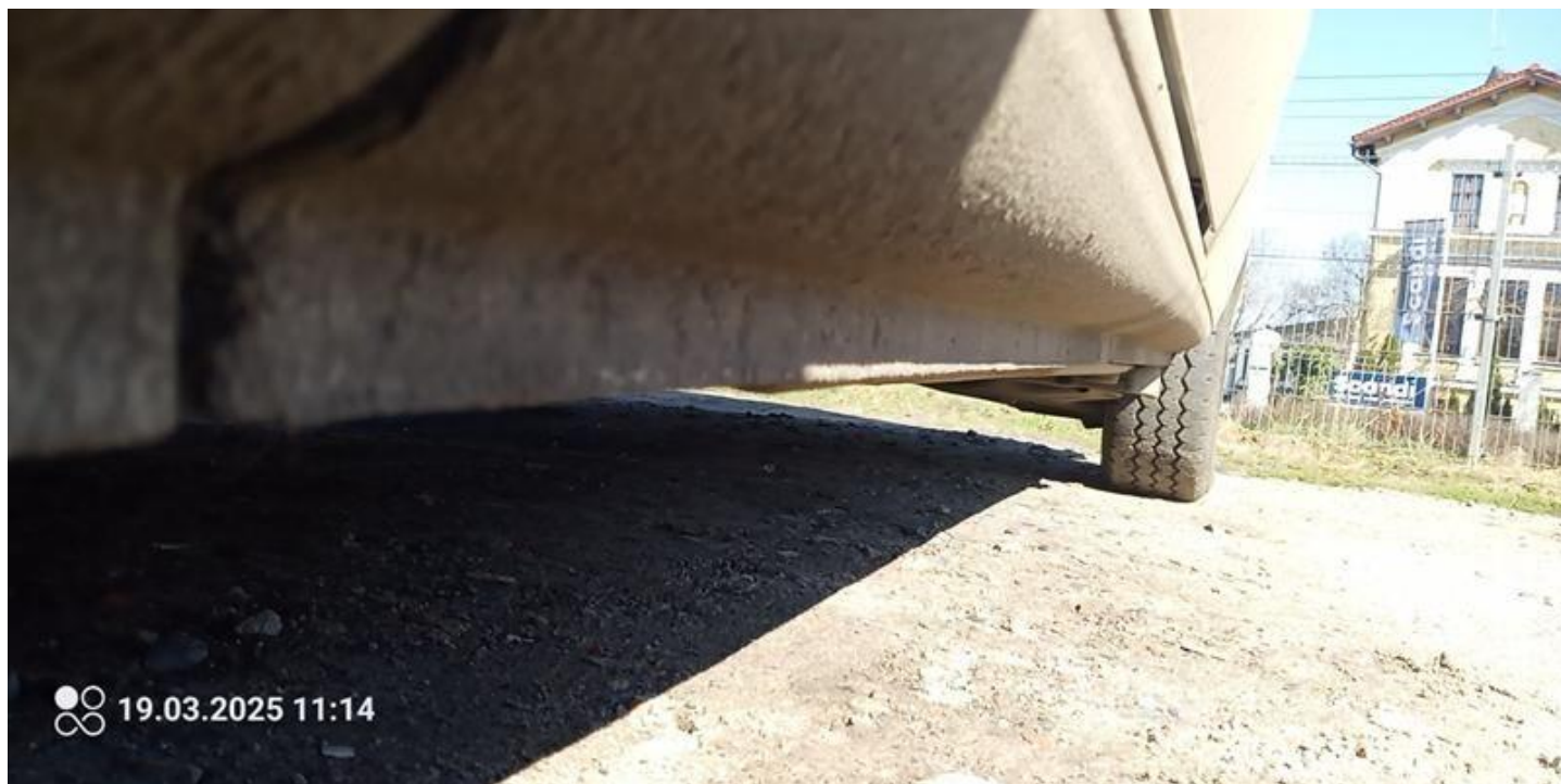
Fot. nr 32