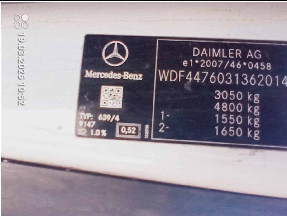
Fot. nr 9