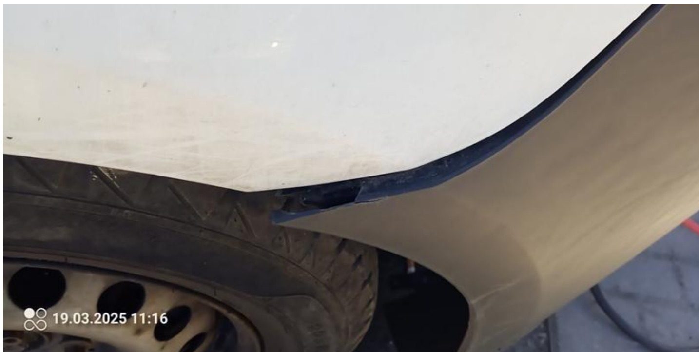
Fot. nr 40