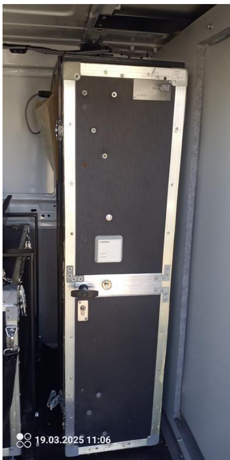
Fot. nr 22