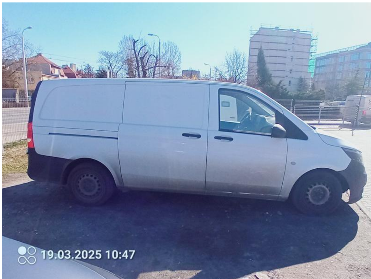
Fot. nr 6