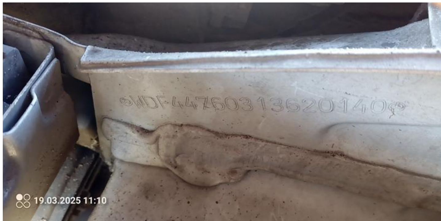
Fot. nr 10