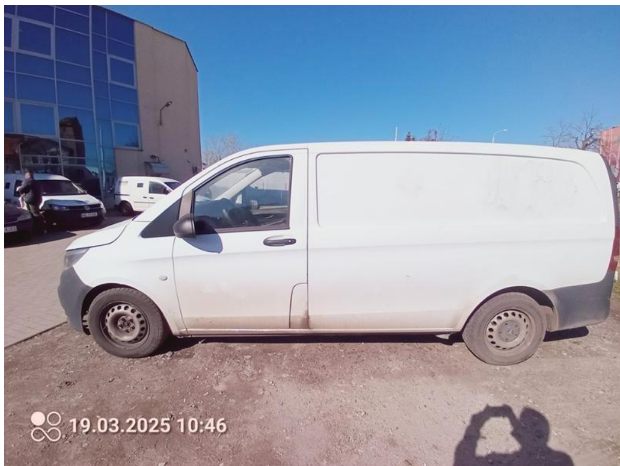
Fot. nr 2