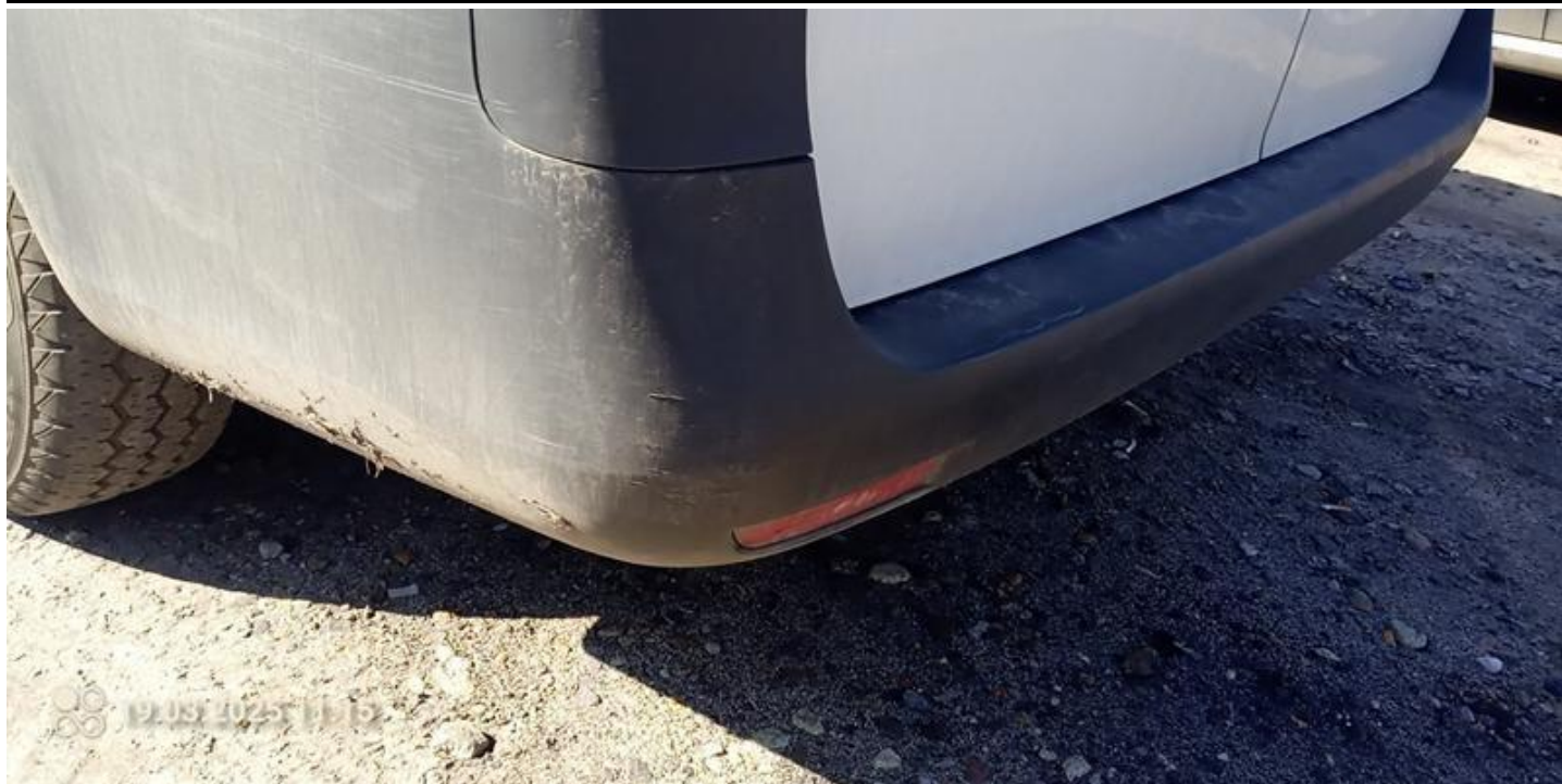
Fot. nr 35