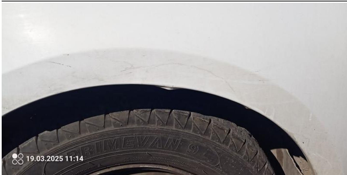
Fot. nr 31