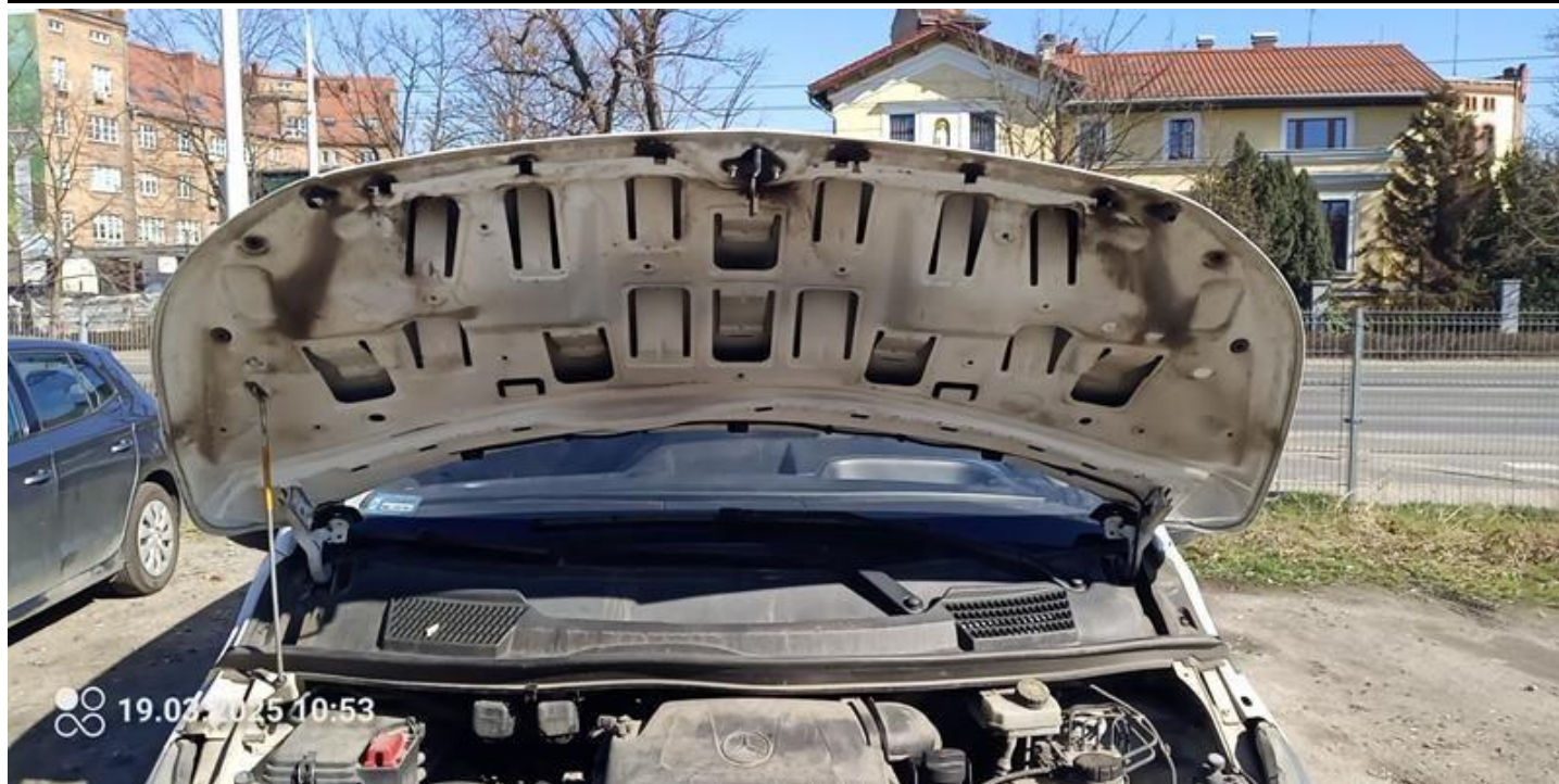
Fot. nr 15