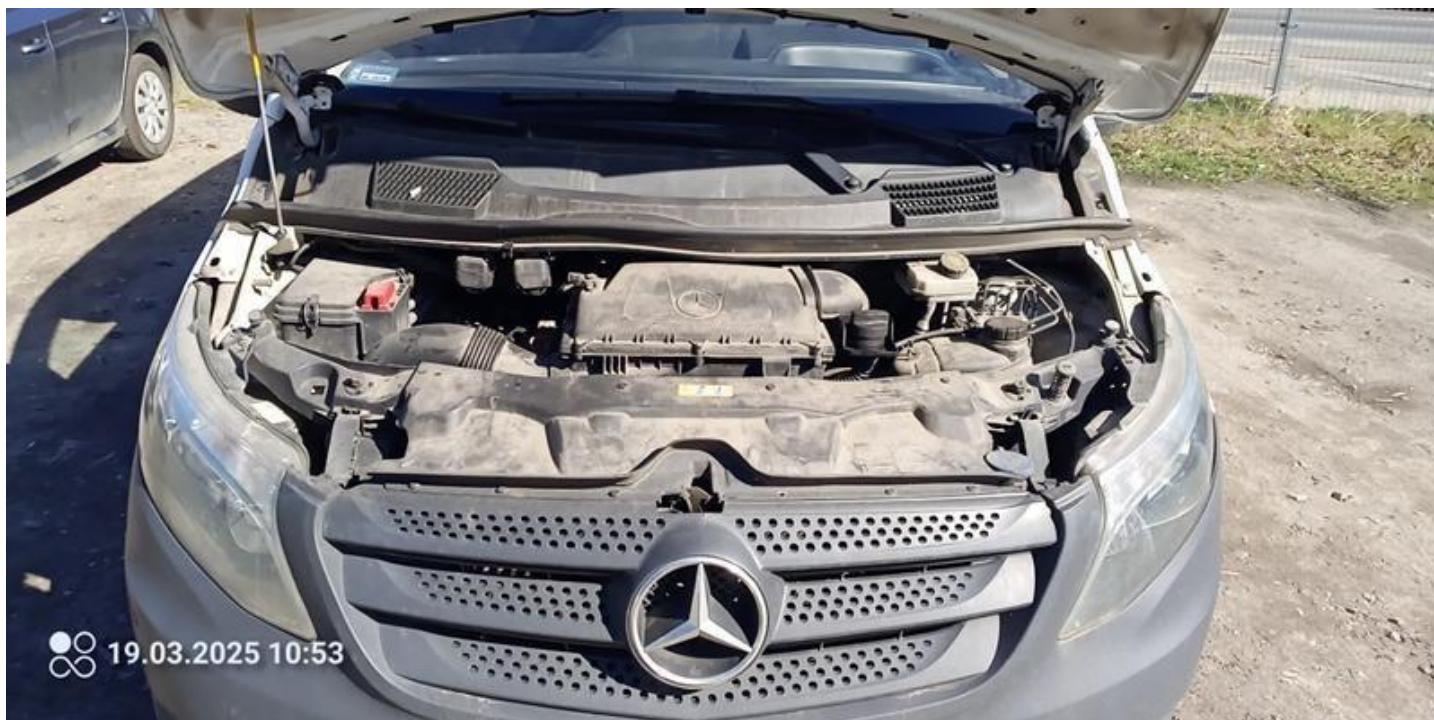
Fot. nr 14