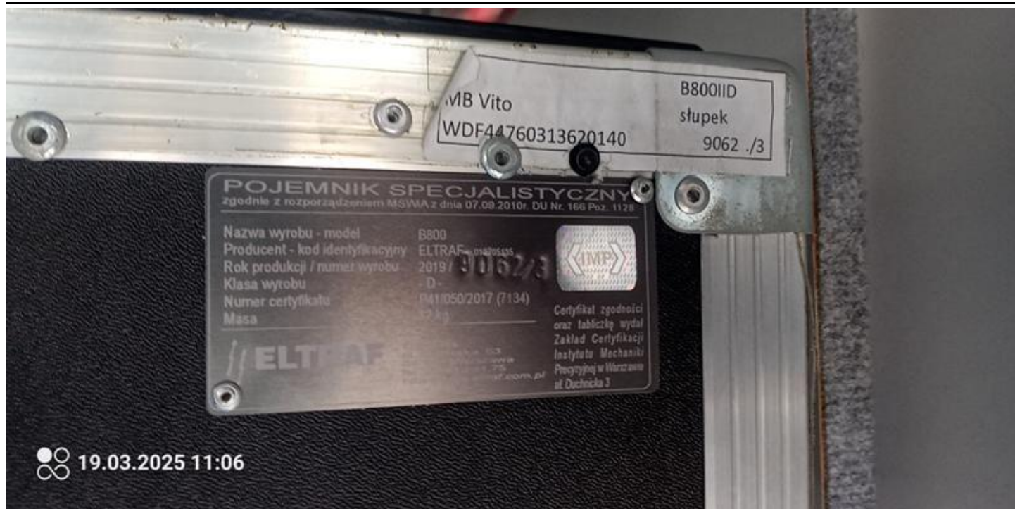
Fot. nr 19