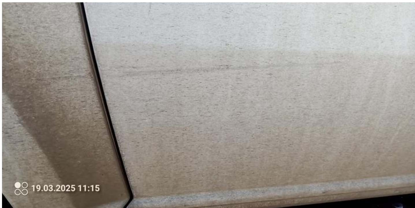
Fot. nr 38