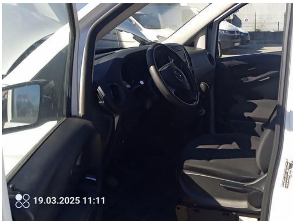
Fot. nr 24