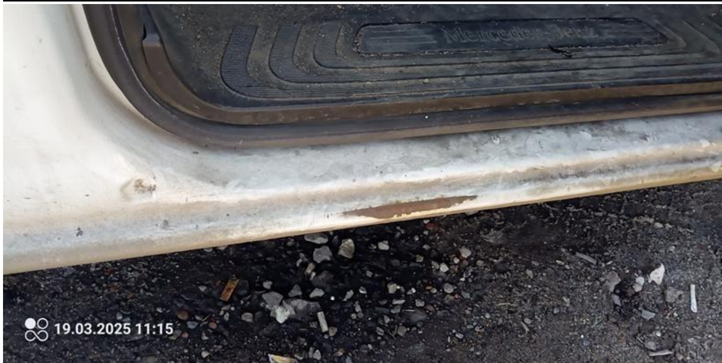
Fot. nr 39