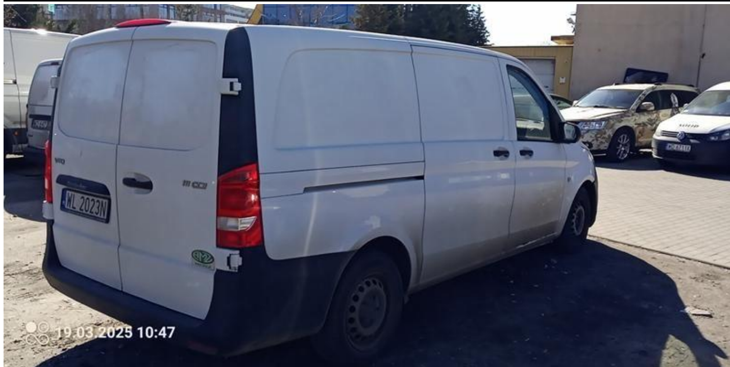
Fot. nr 5