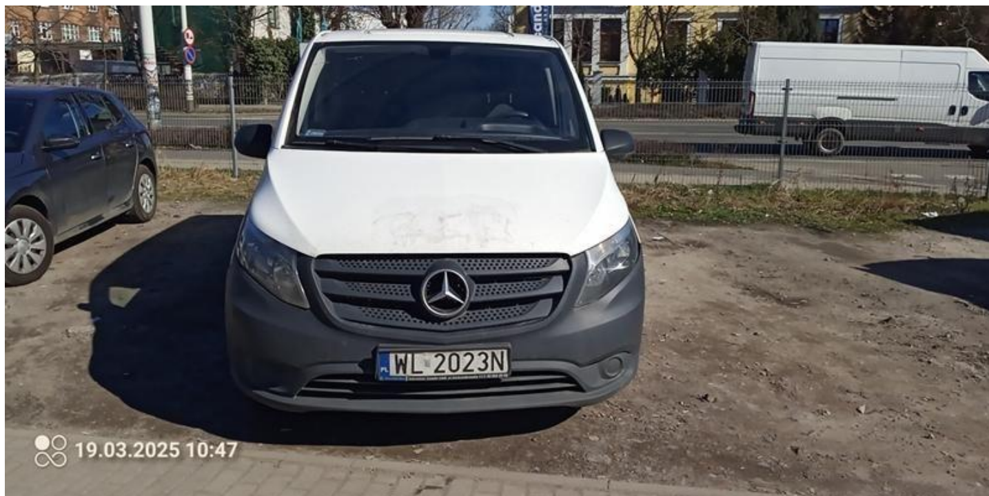
Fot. nr 8