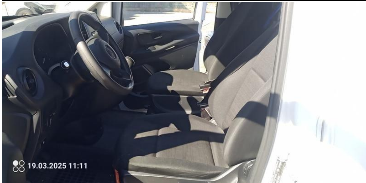
Fot. nr 25