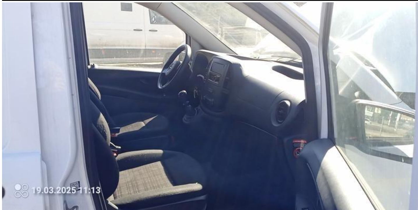
Fot. nr 29