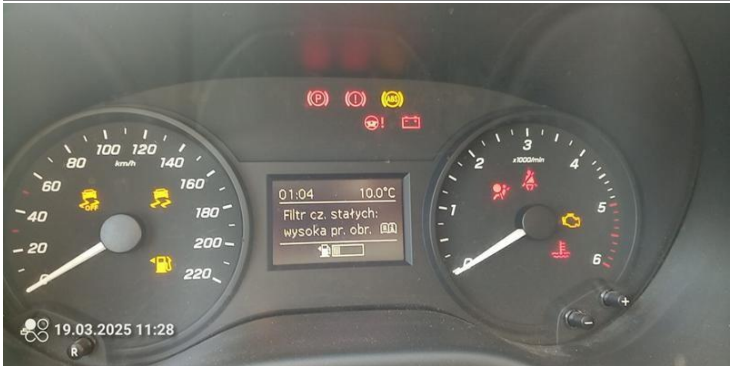
Fot. nr 43