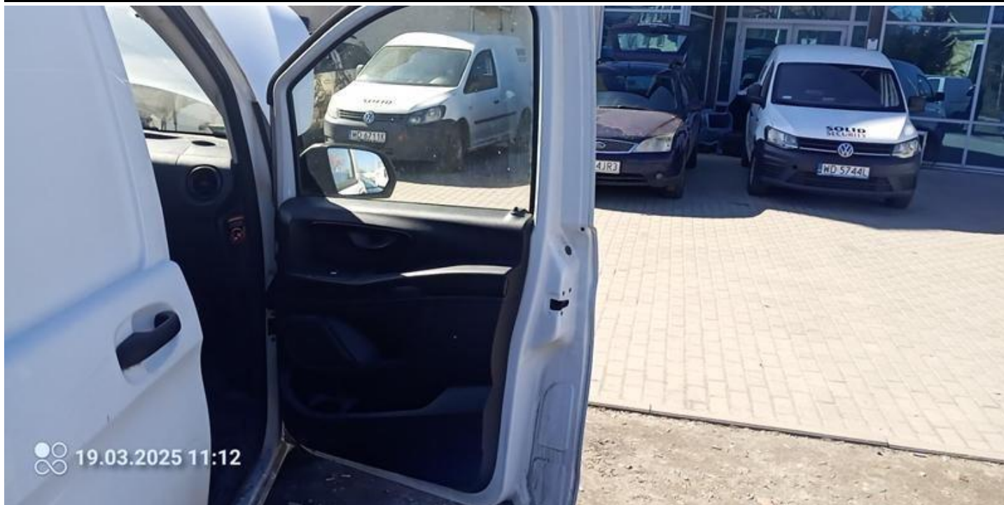
Fot. nr 27