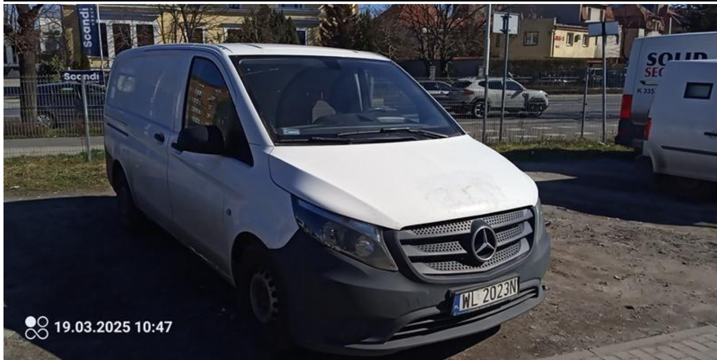
Fot. nr 7