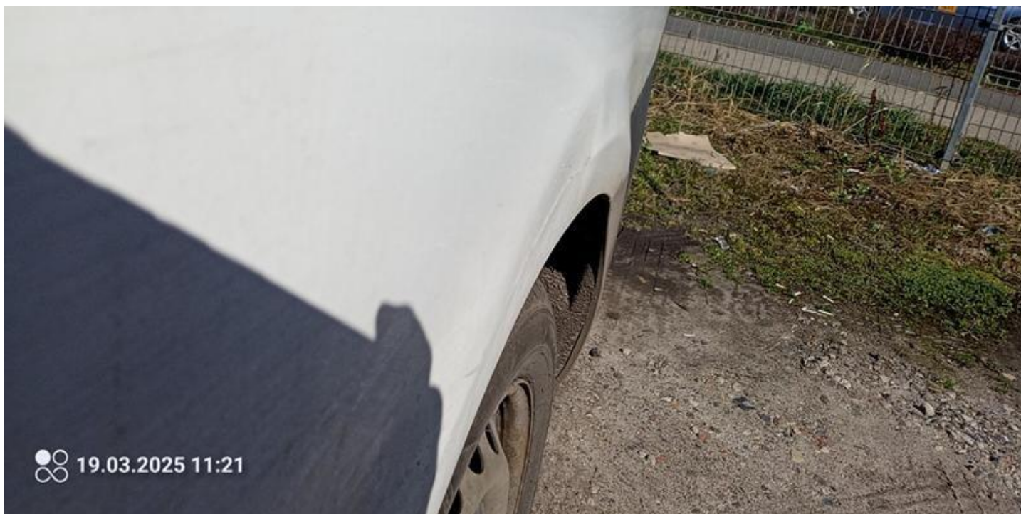
Fot. nr 42