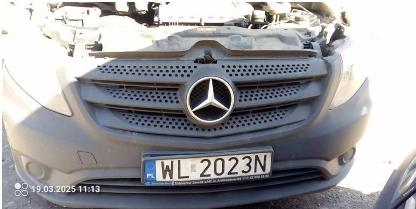
Fot. nr 30