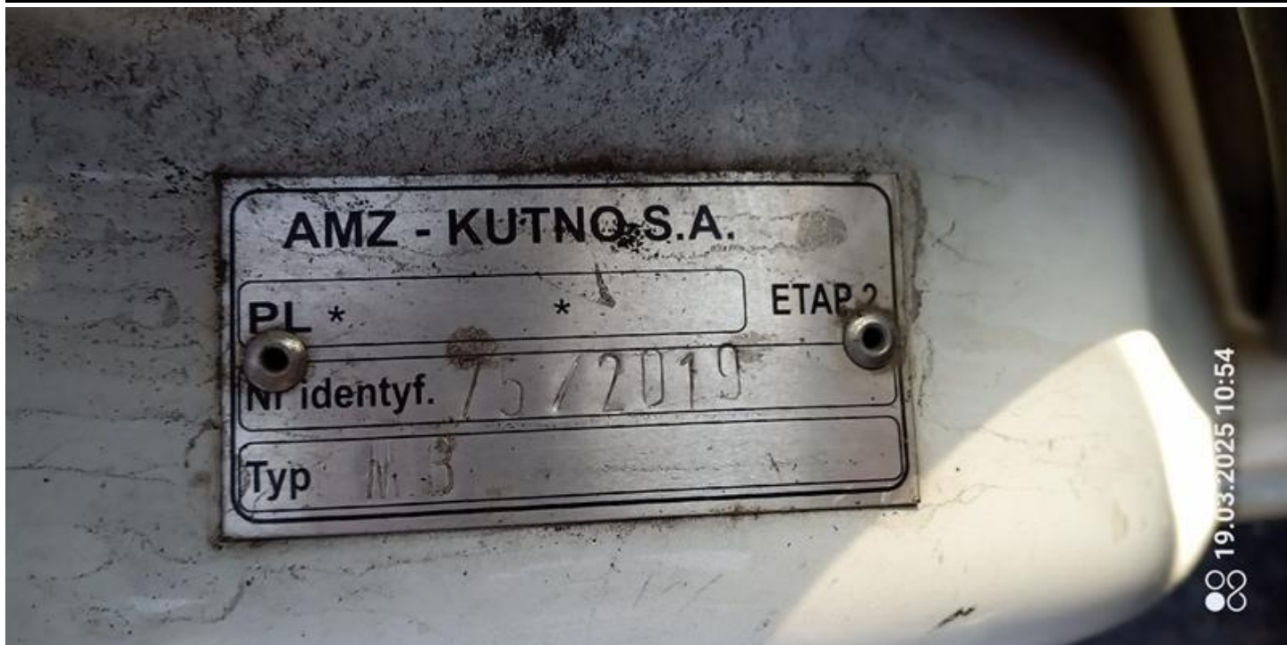
Fot. nr 17