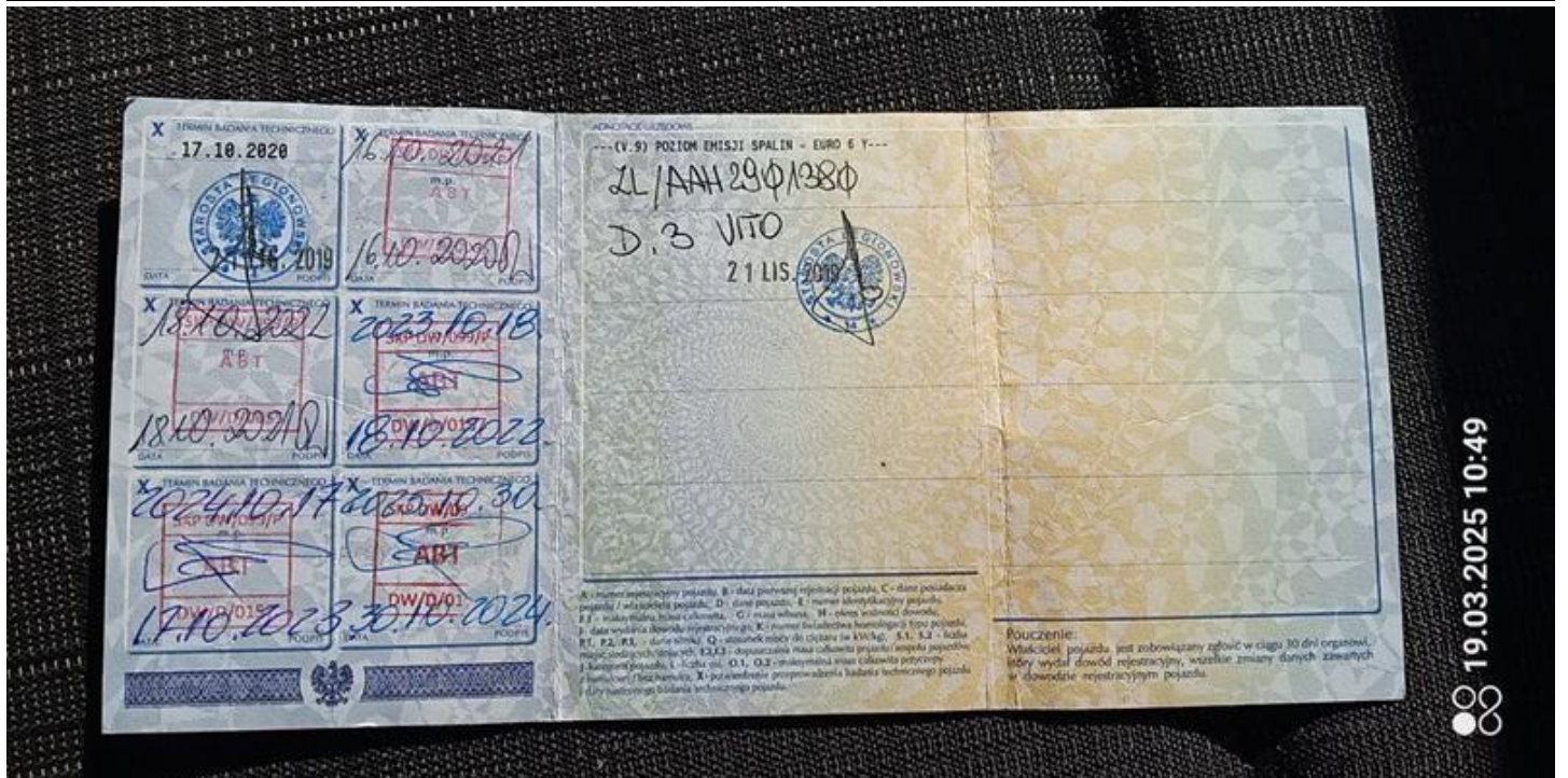
Fot. nr 45

Dokument wystawiony elektronicznie, wa ny bez podpisu