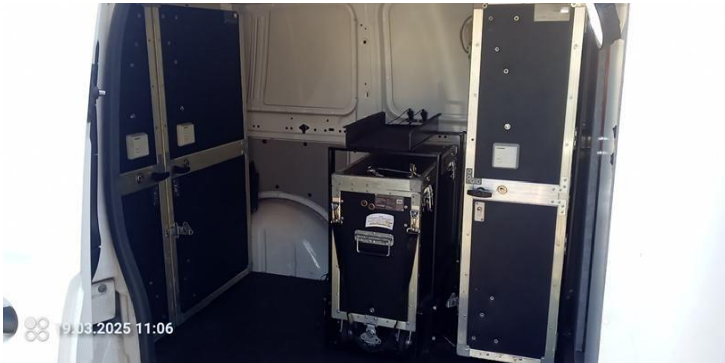
Fot. nr 18