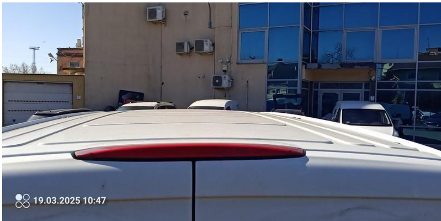
Fot. nr 12