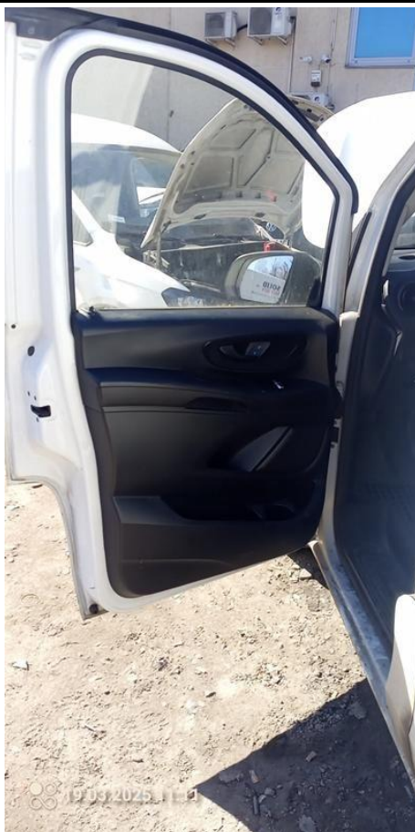
Fot. nr 23