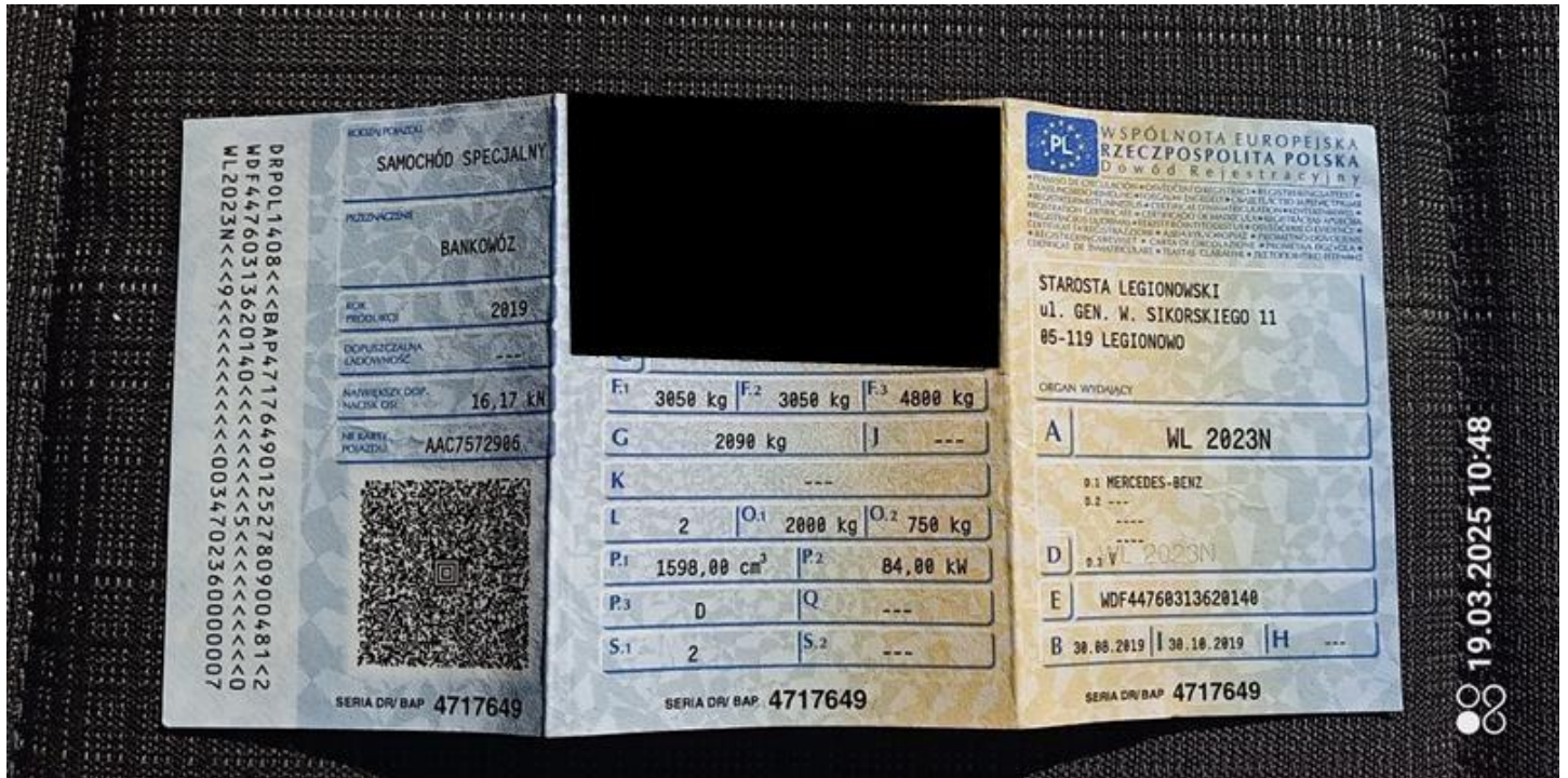
Fot. nr 44