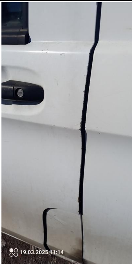
Fot. nr 33