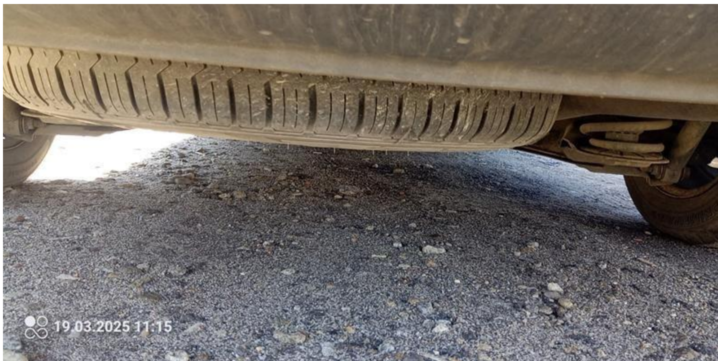
Fot. nr 36