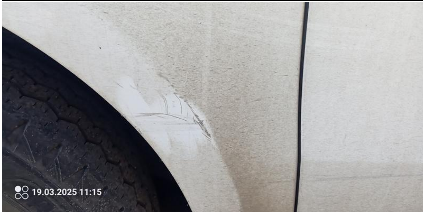
Fot. nr 37