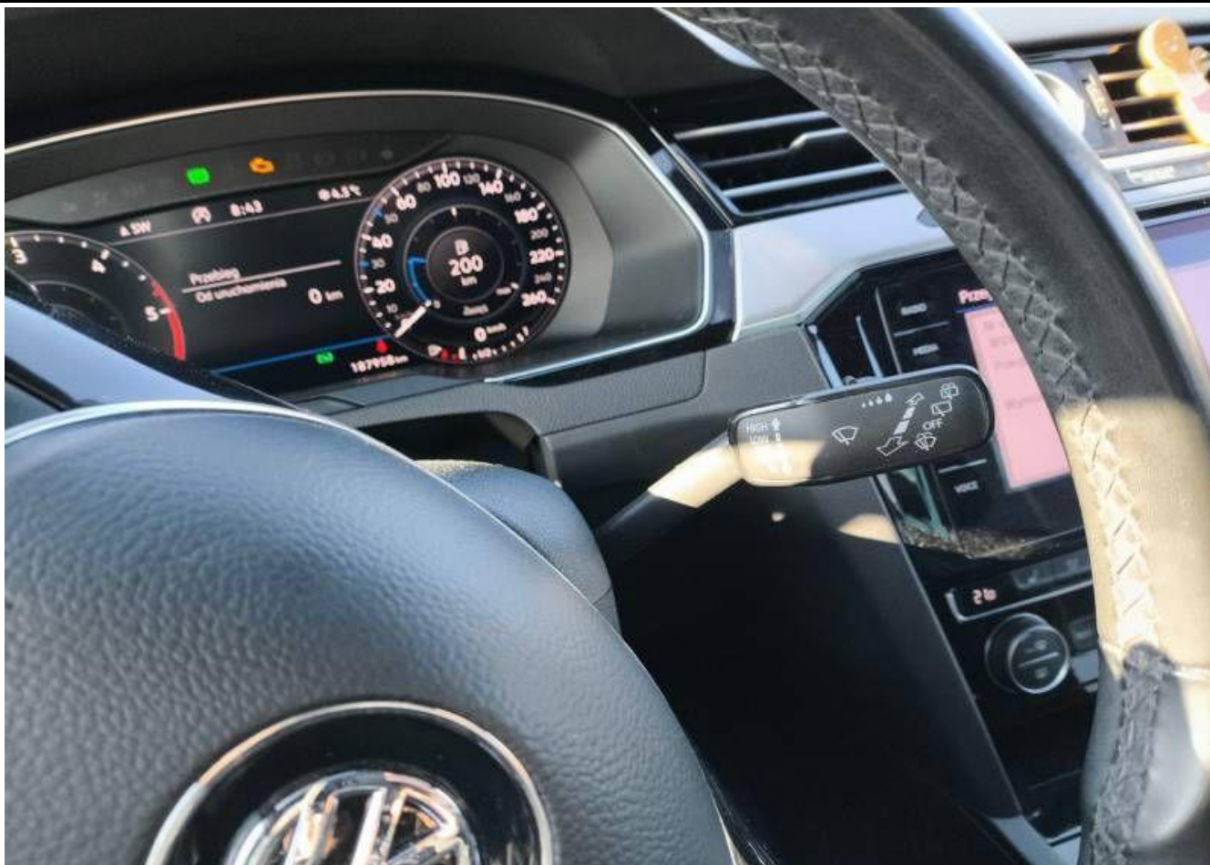
Fot. nr 11