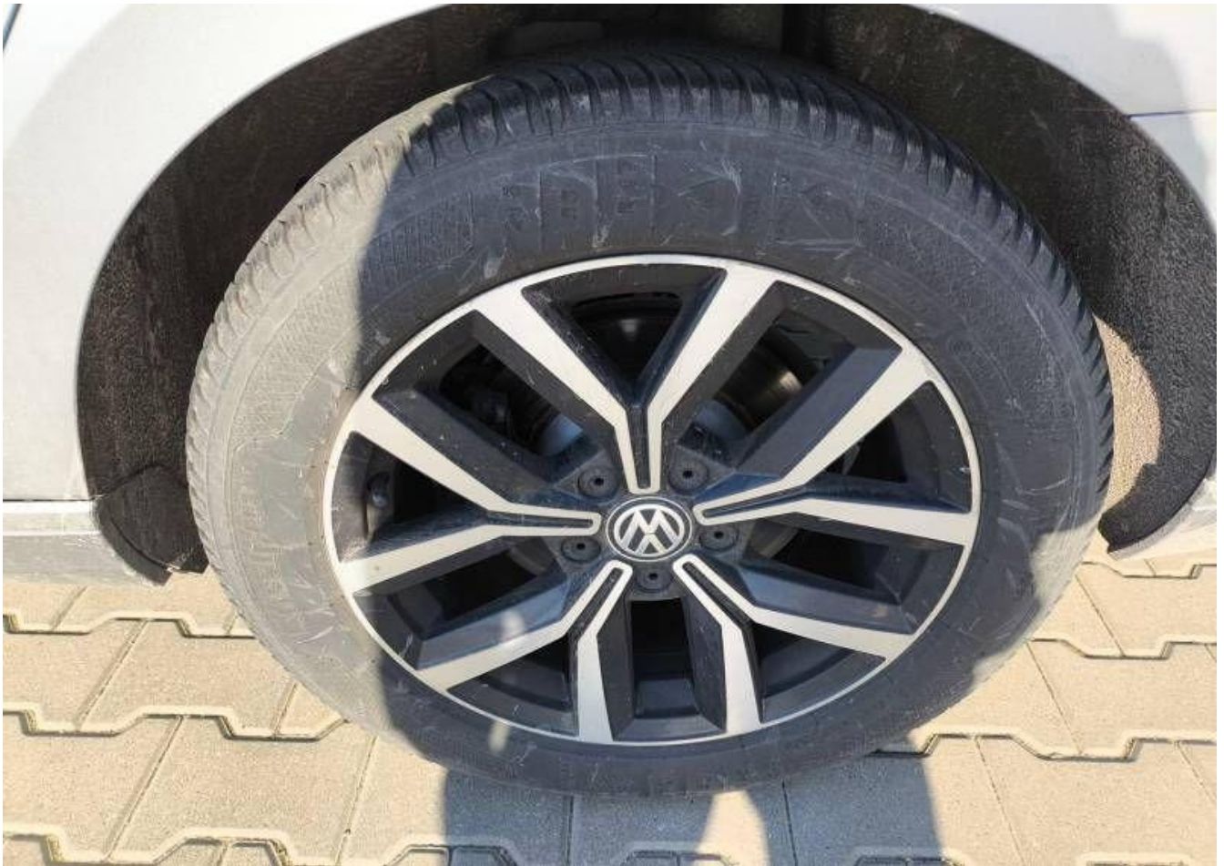
Fot. nr 31