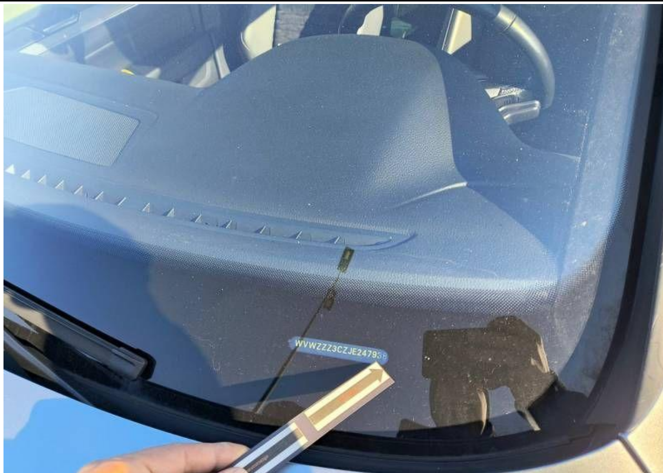
Fot. nr 37