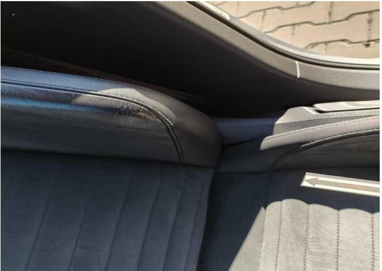
Fot. nr 45