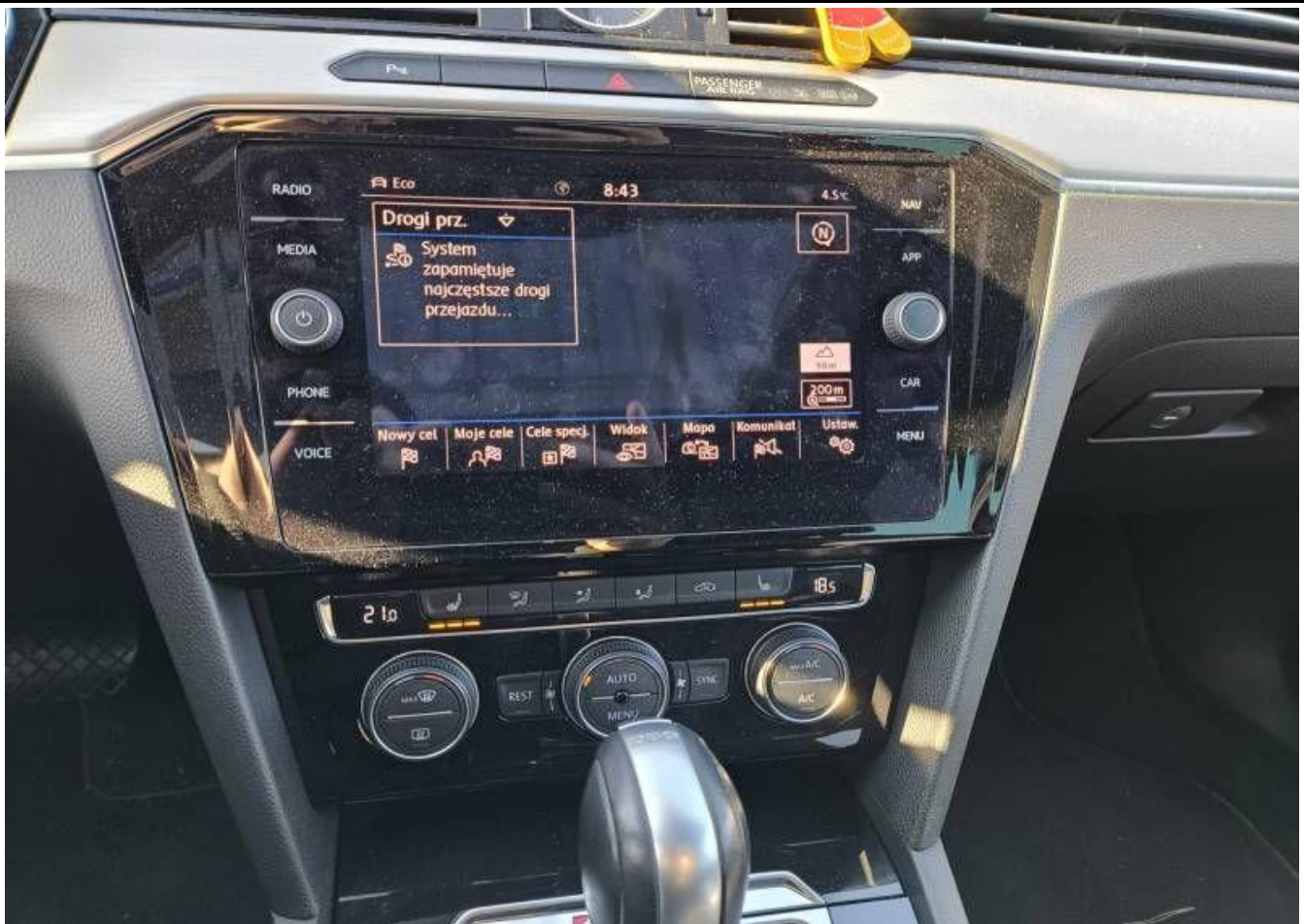
Fot. nr 15