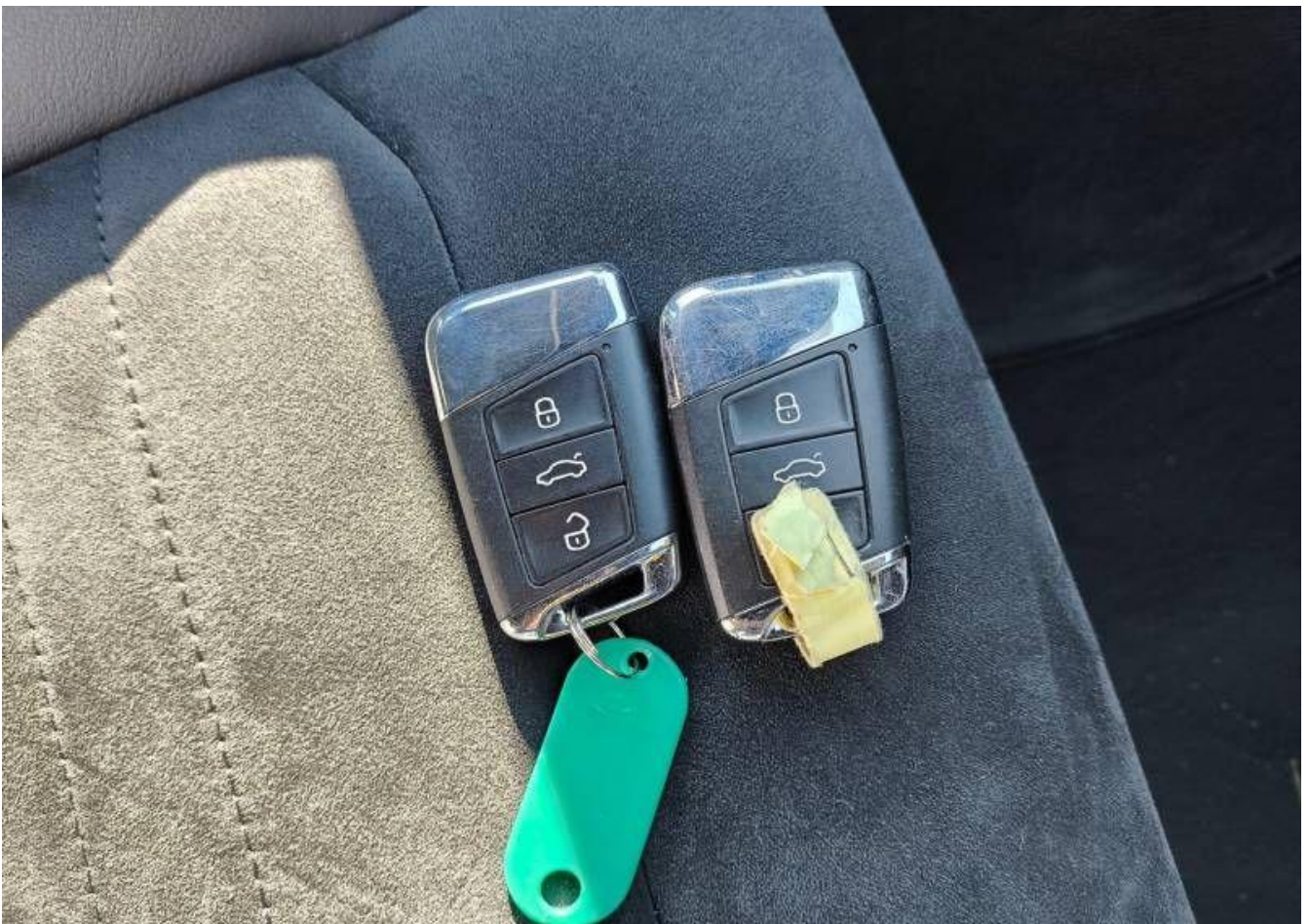
Fot. nr 46