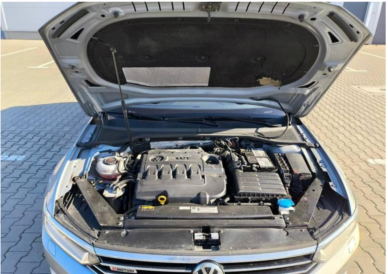
Fot. nr 28