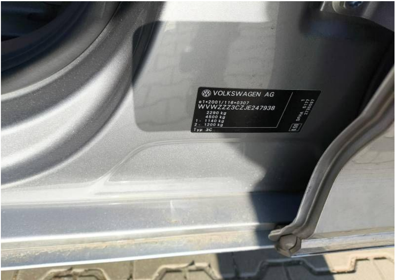
Fot. nr 9