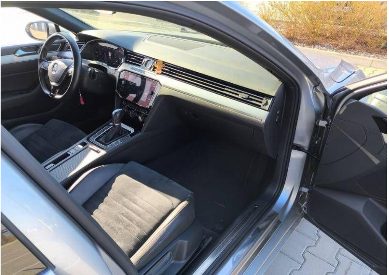
Fot. nr 27