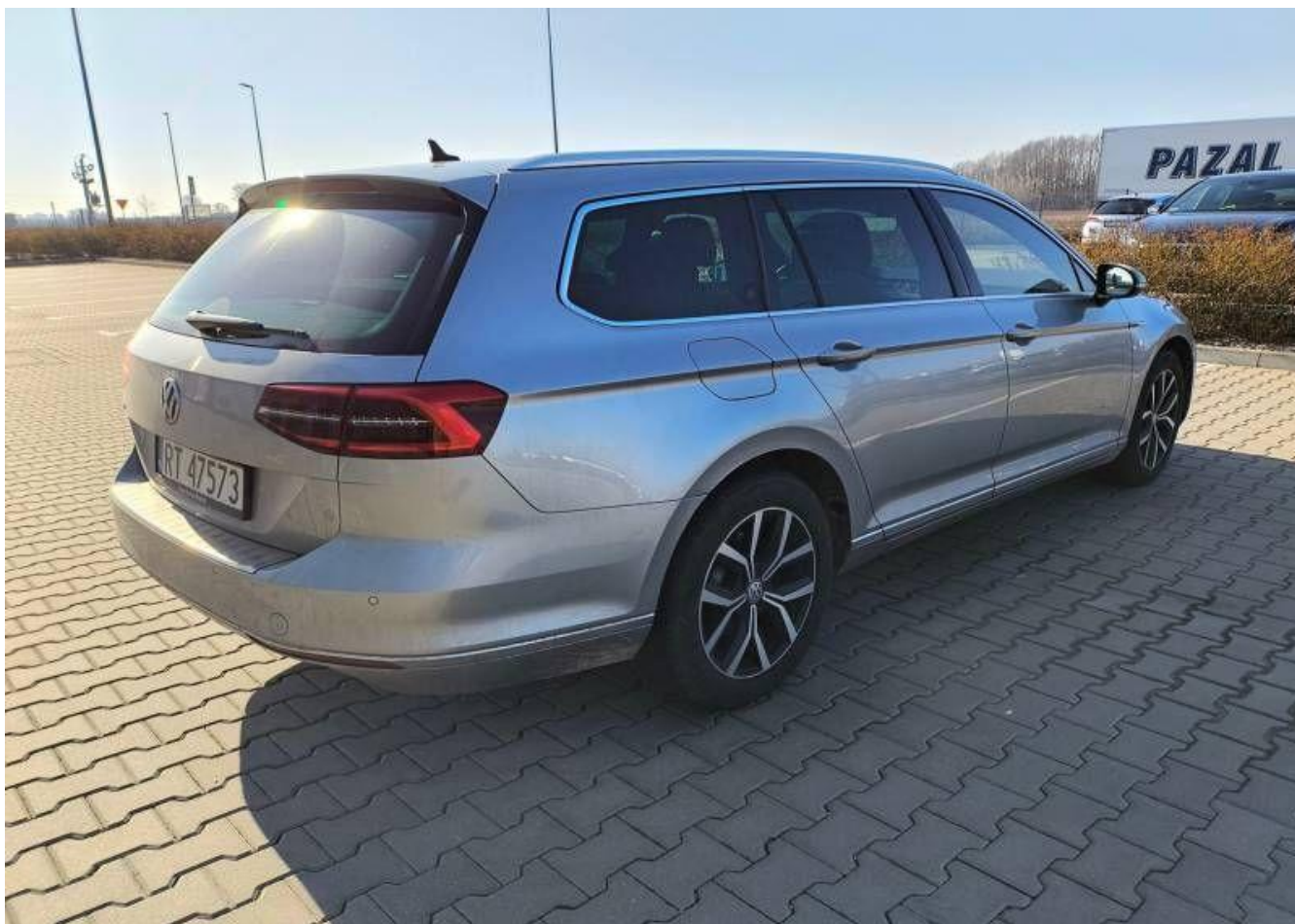
Fot. nr 4