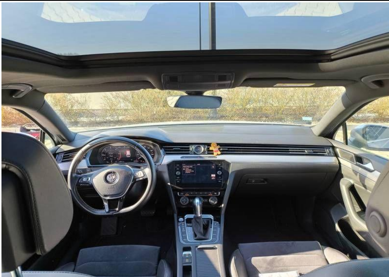
Fot. nr 21