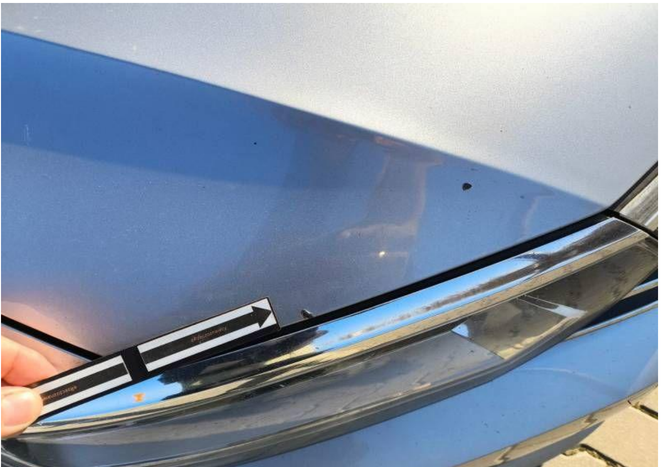
Fot. nr 36