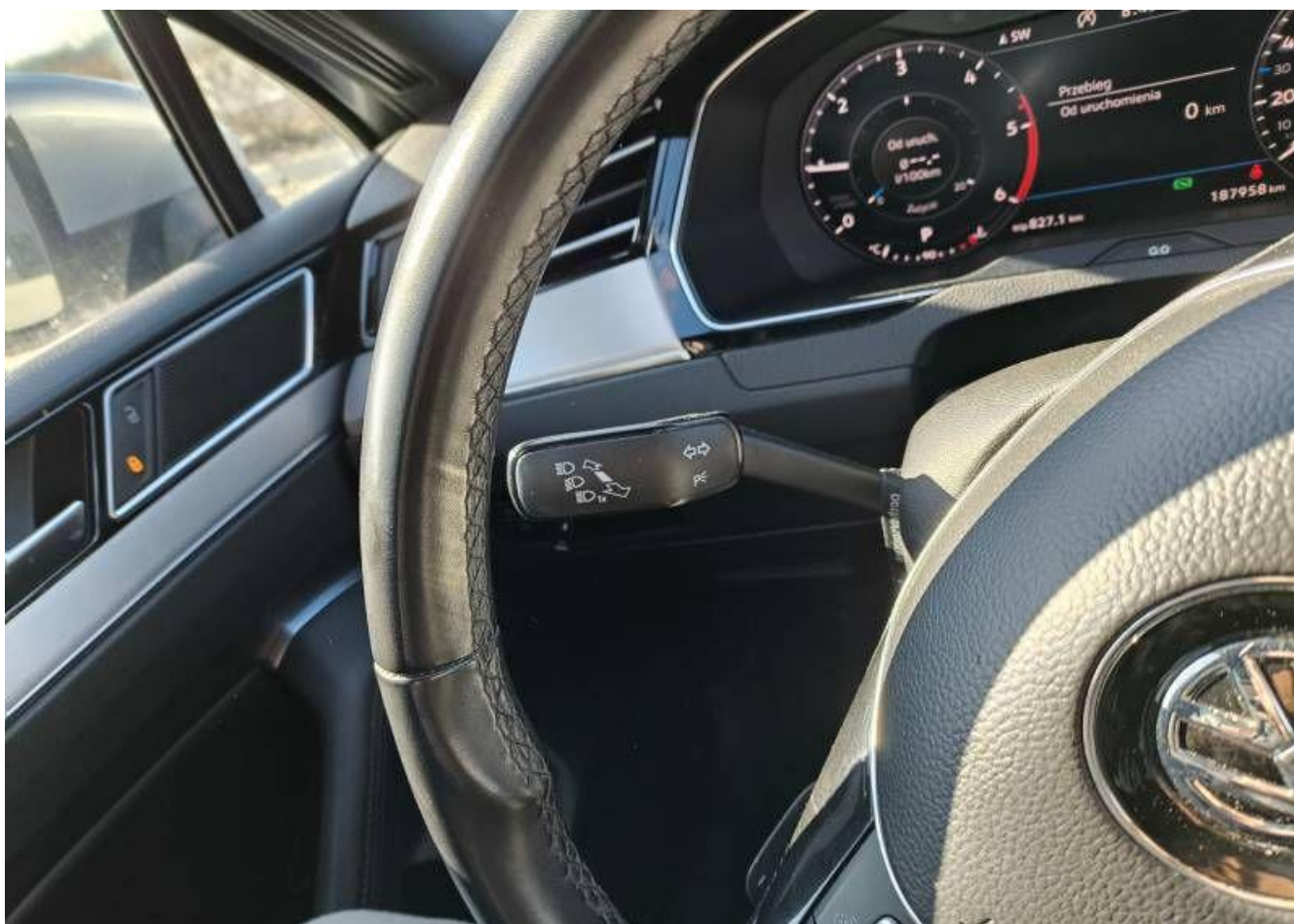
Fot. nr 12