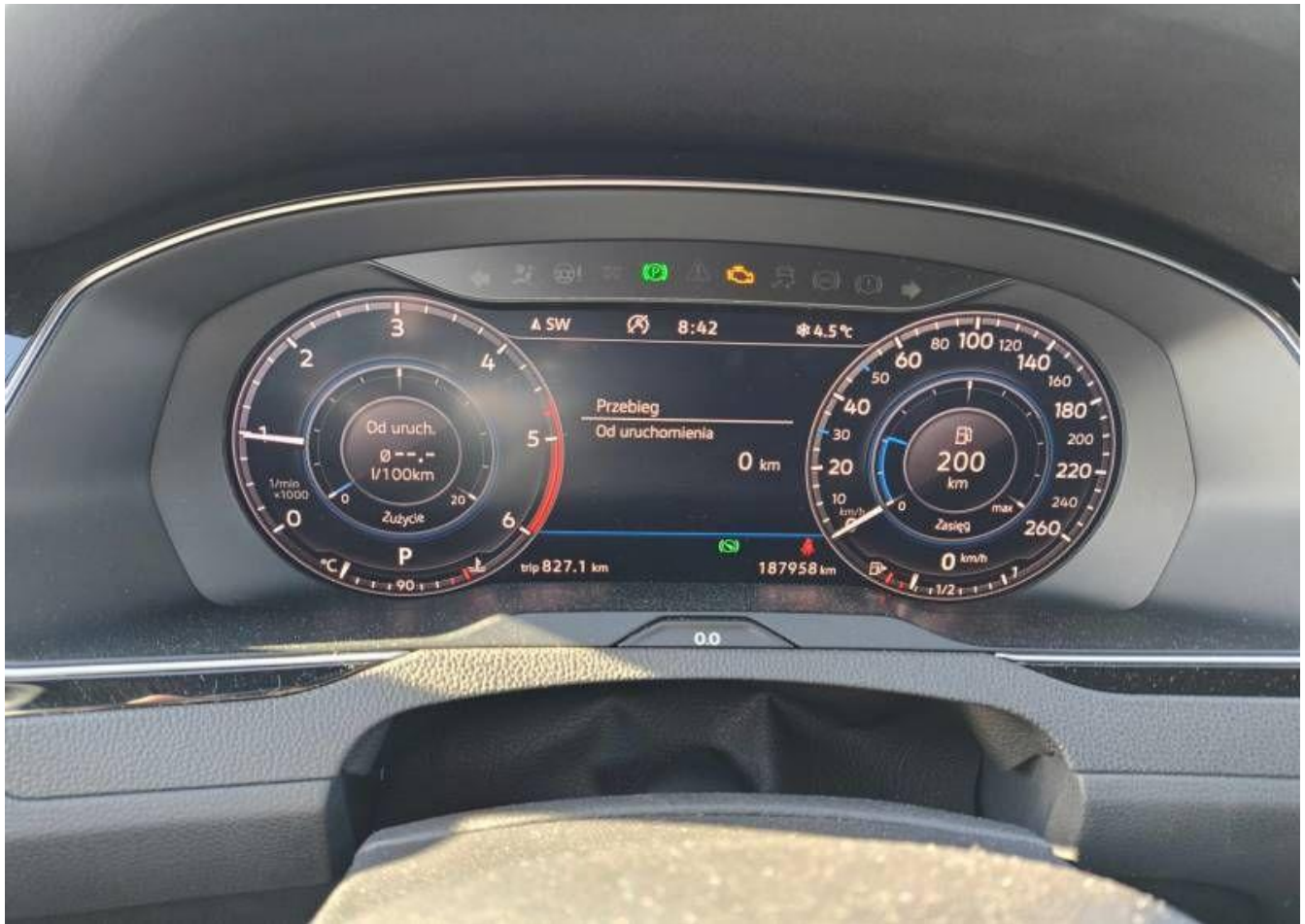
Fot. nr 7