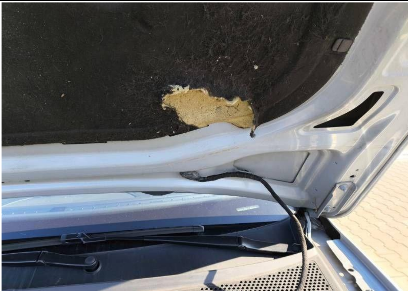
Fot. nr 29