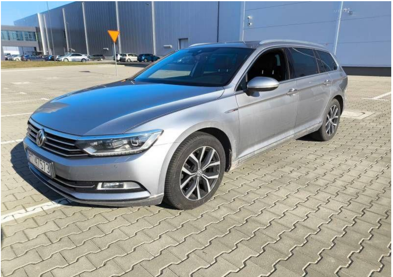
Fot. nr 1