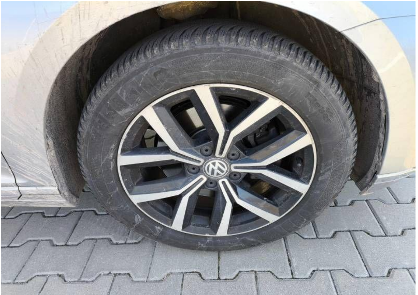
Fot. nr 33