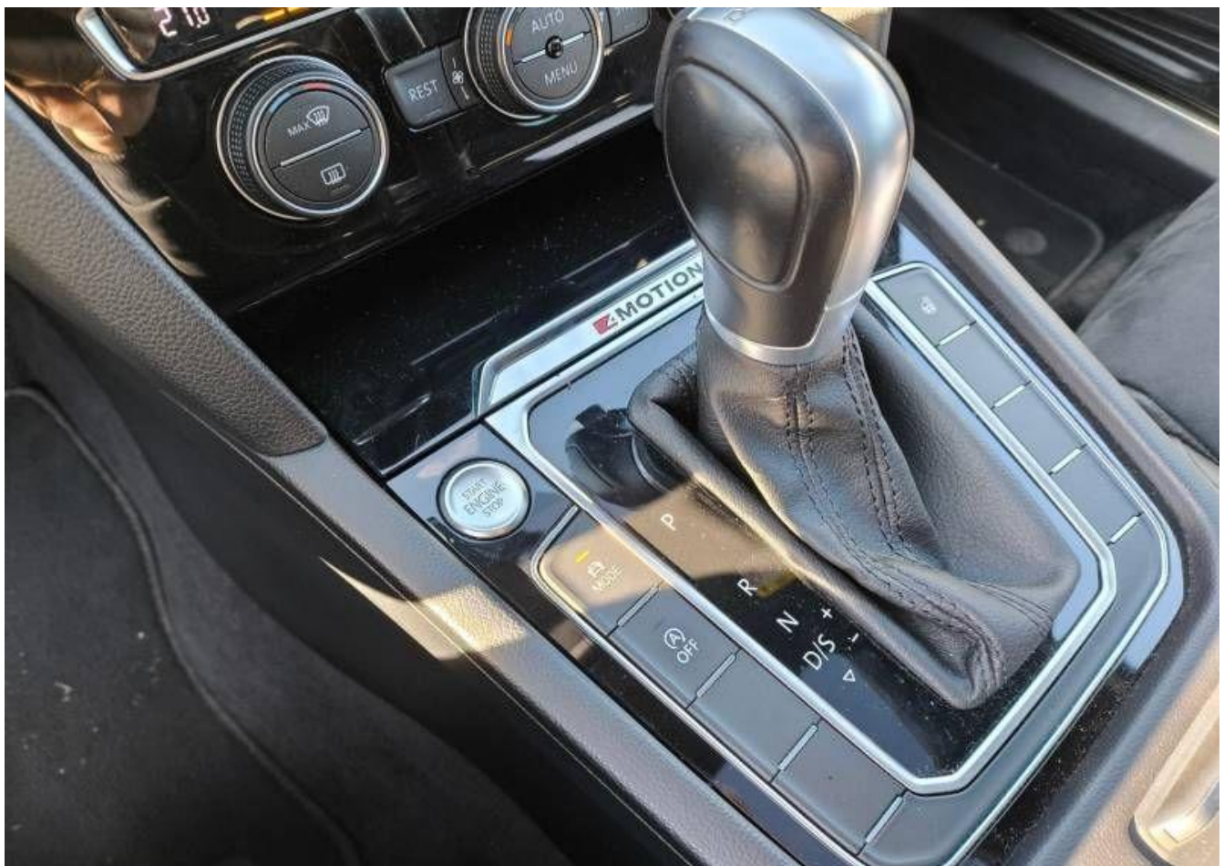
Fot. nr 16