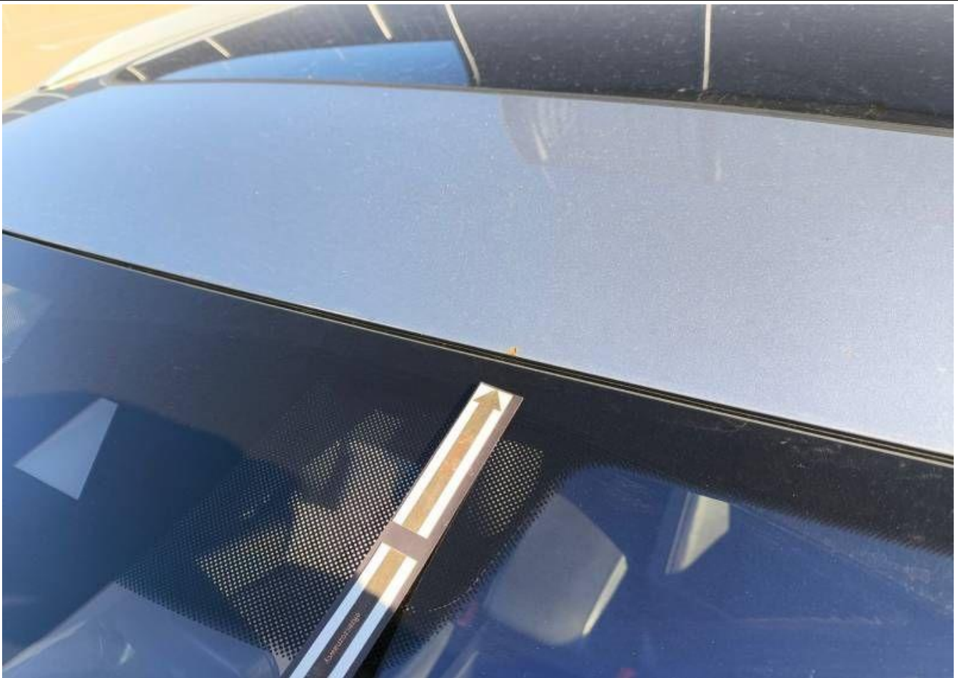
Fot. nr 41