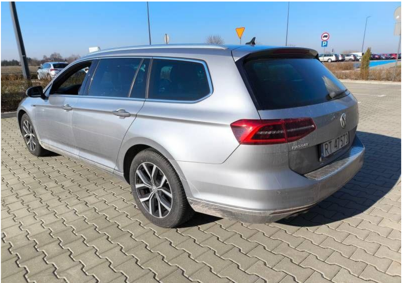
Fot. nr 2