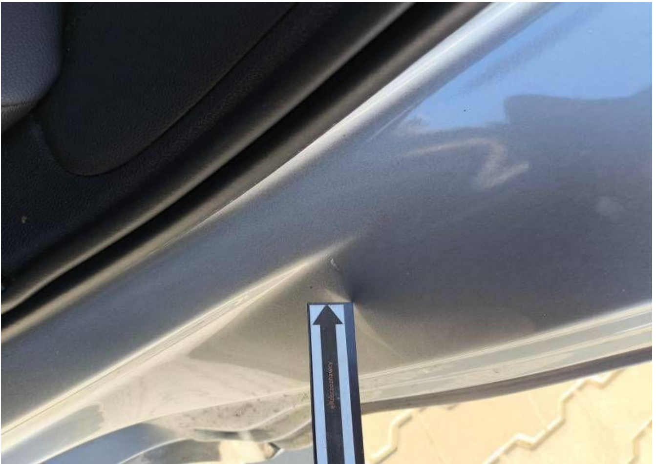
Fot. nr 43