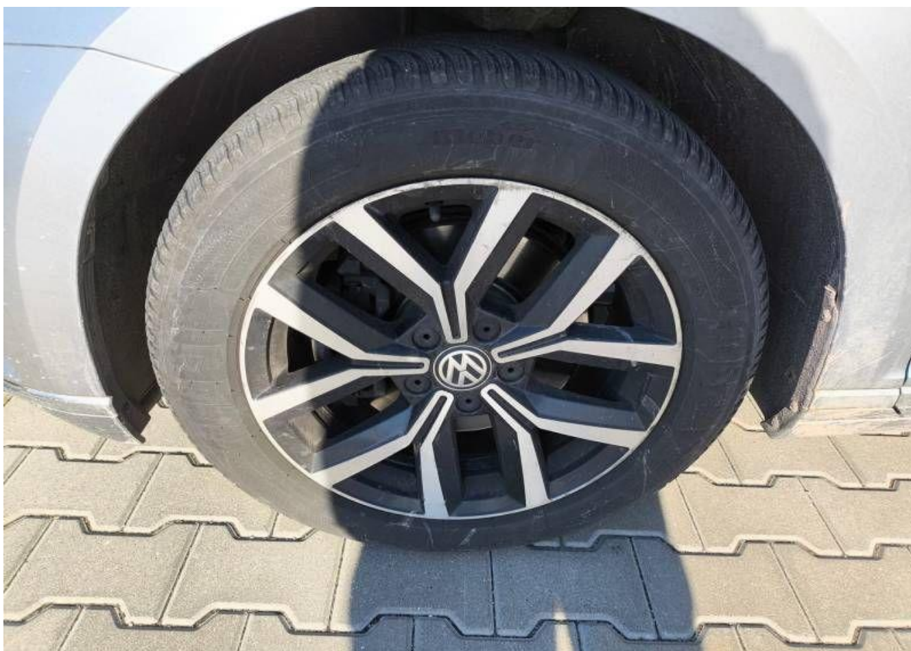
Fot. nr 30