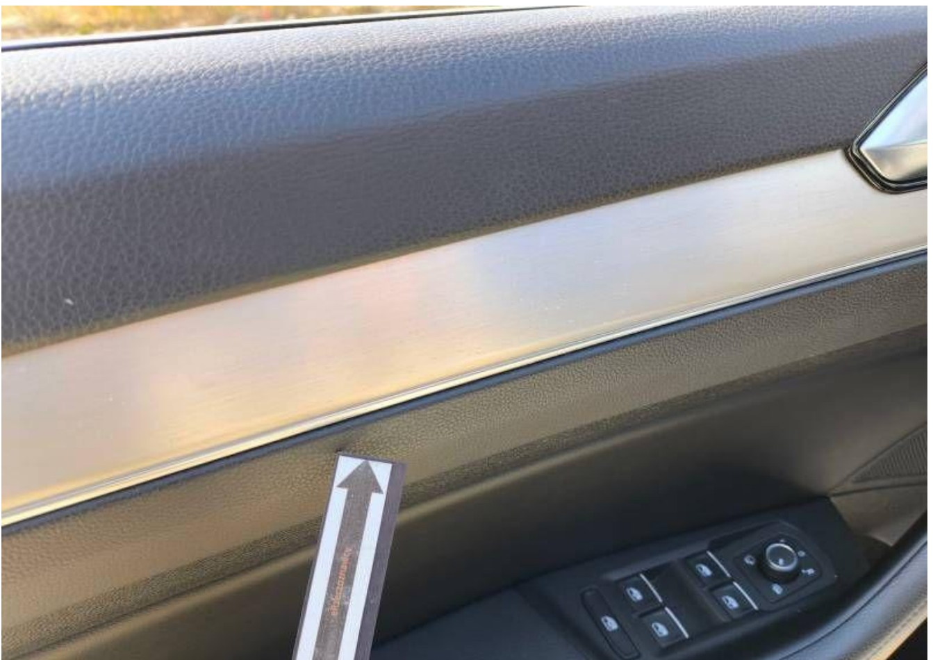
Fot. nr 44