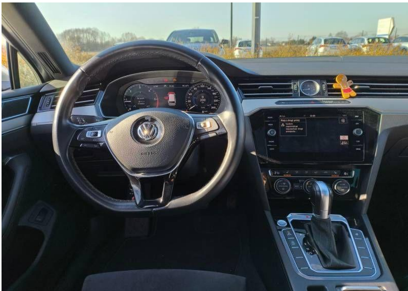
Fot. nr 22