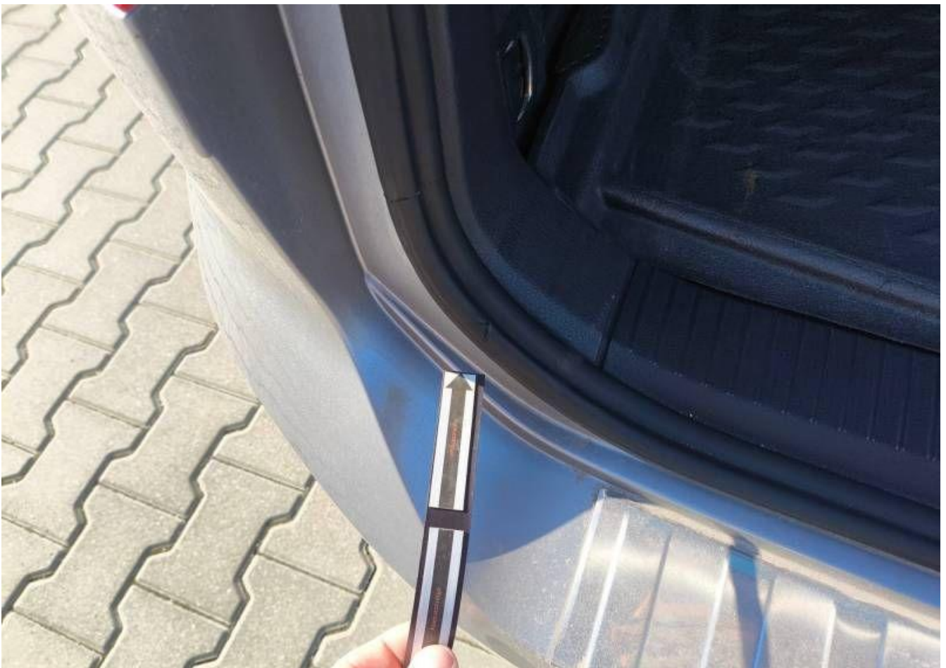
Fot. nr 40