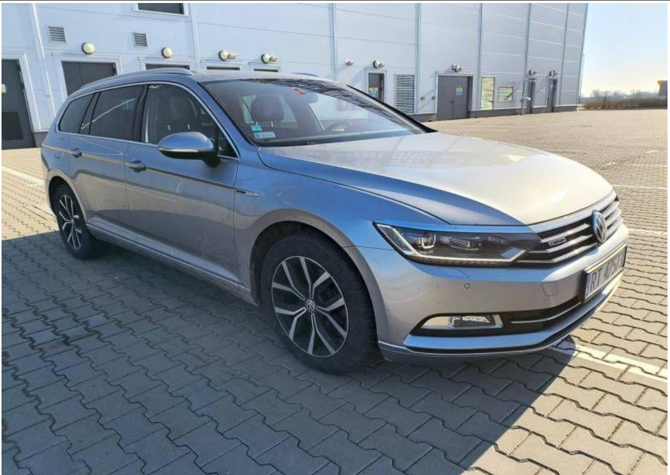
Fot. nr 5