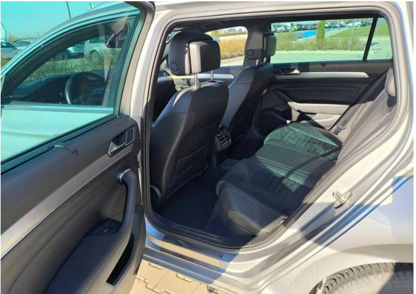
Fot. nr 19