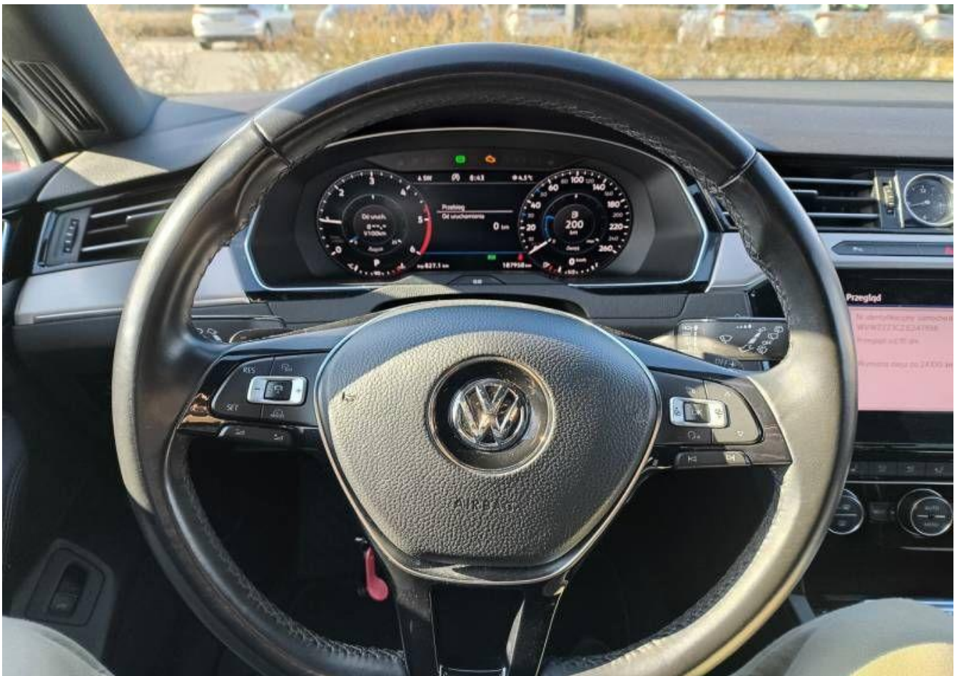
Fot. nr 10