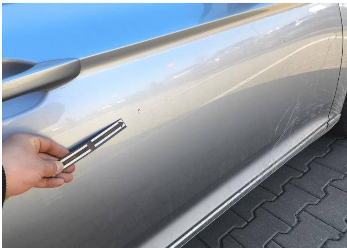
Fot. nr 38