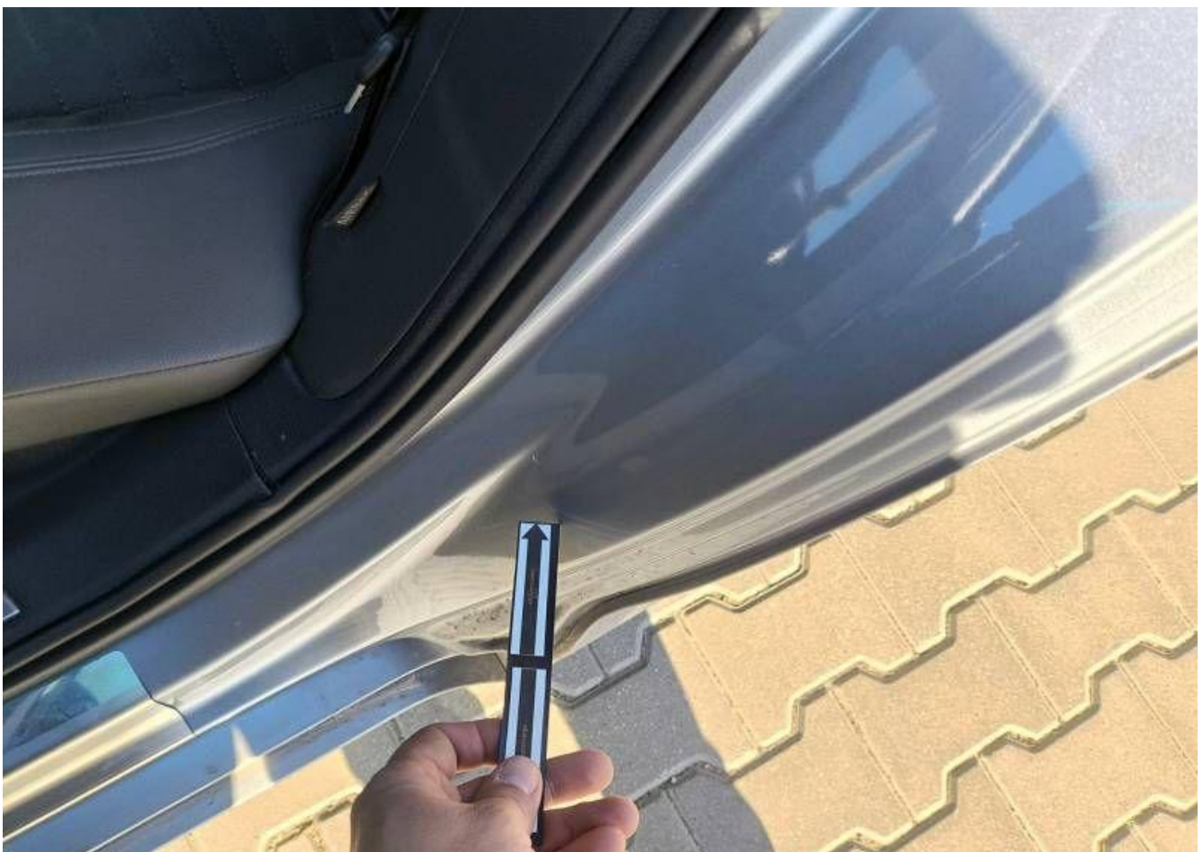
Fot. nr 42