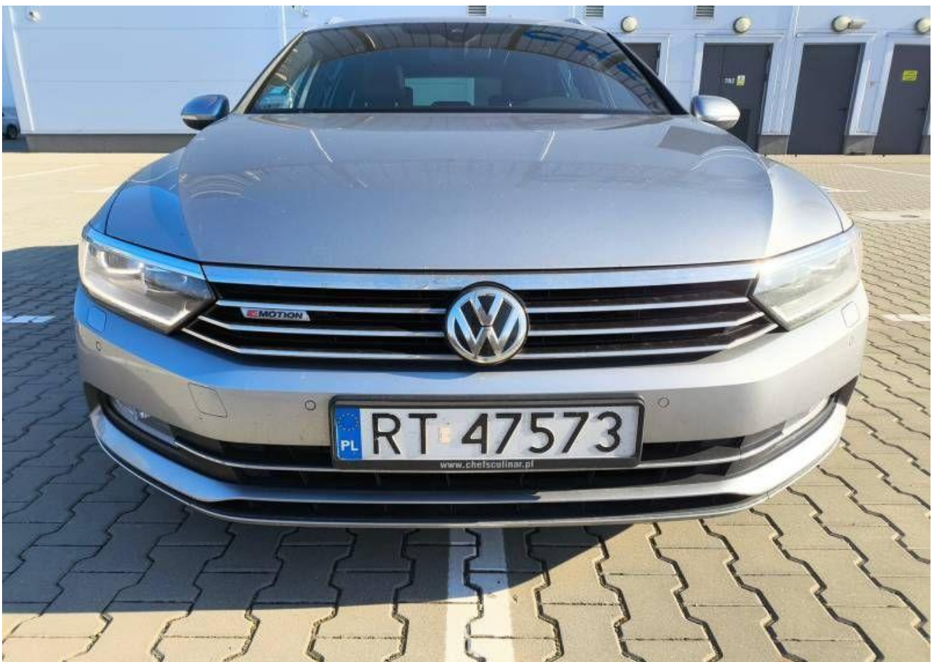
Fot. nr 6