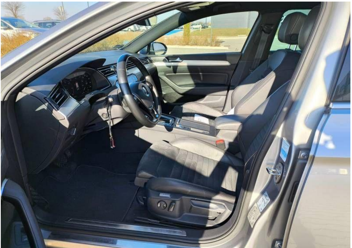
Fot. nr 18