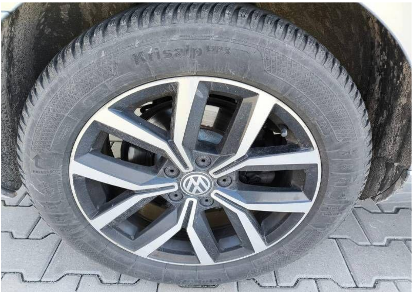
Fot. nr 32