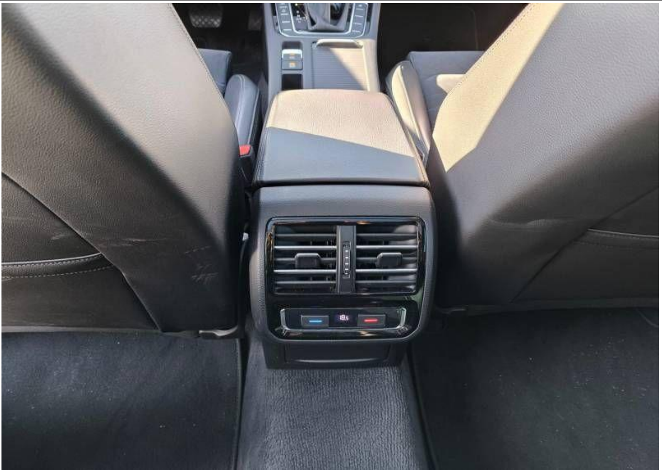
Fot. nr 23