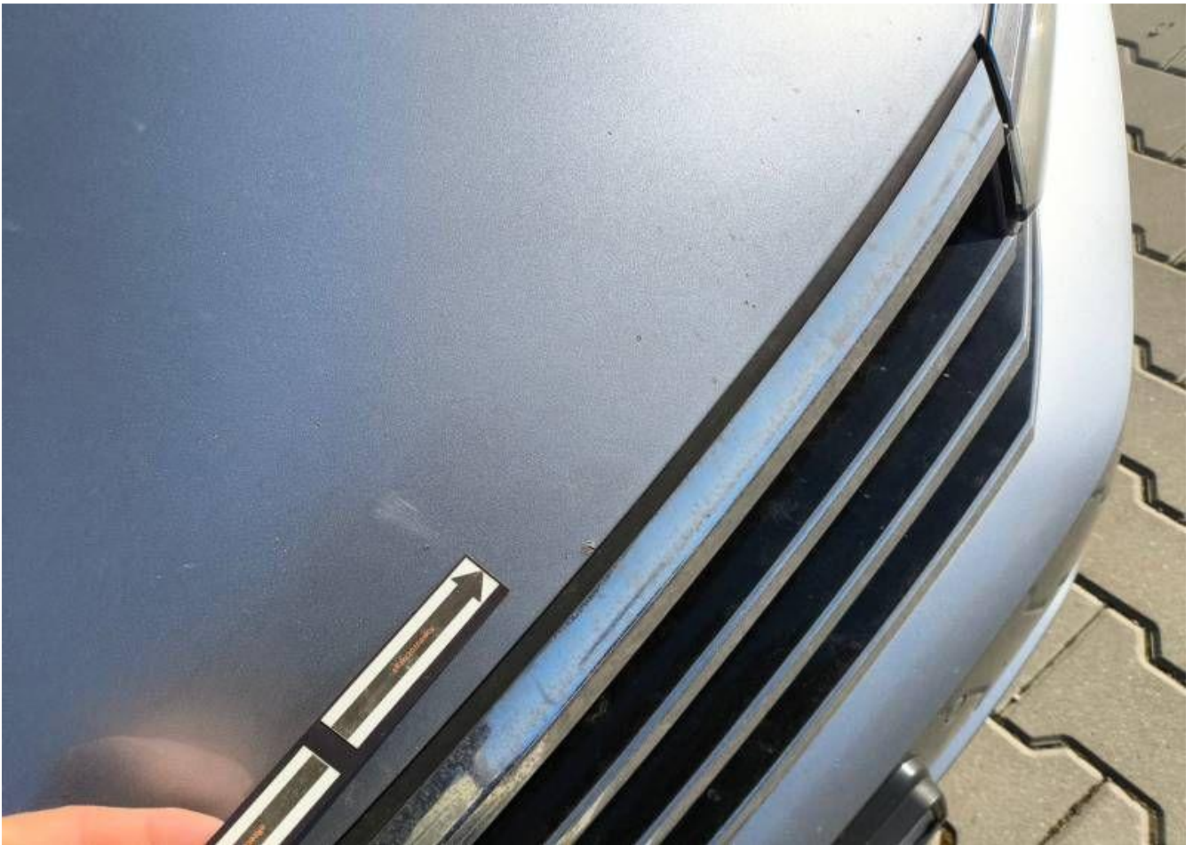
Fot. nr 35