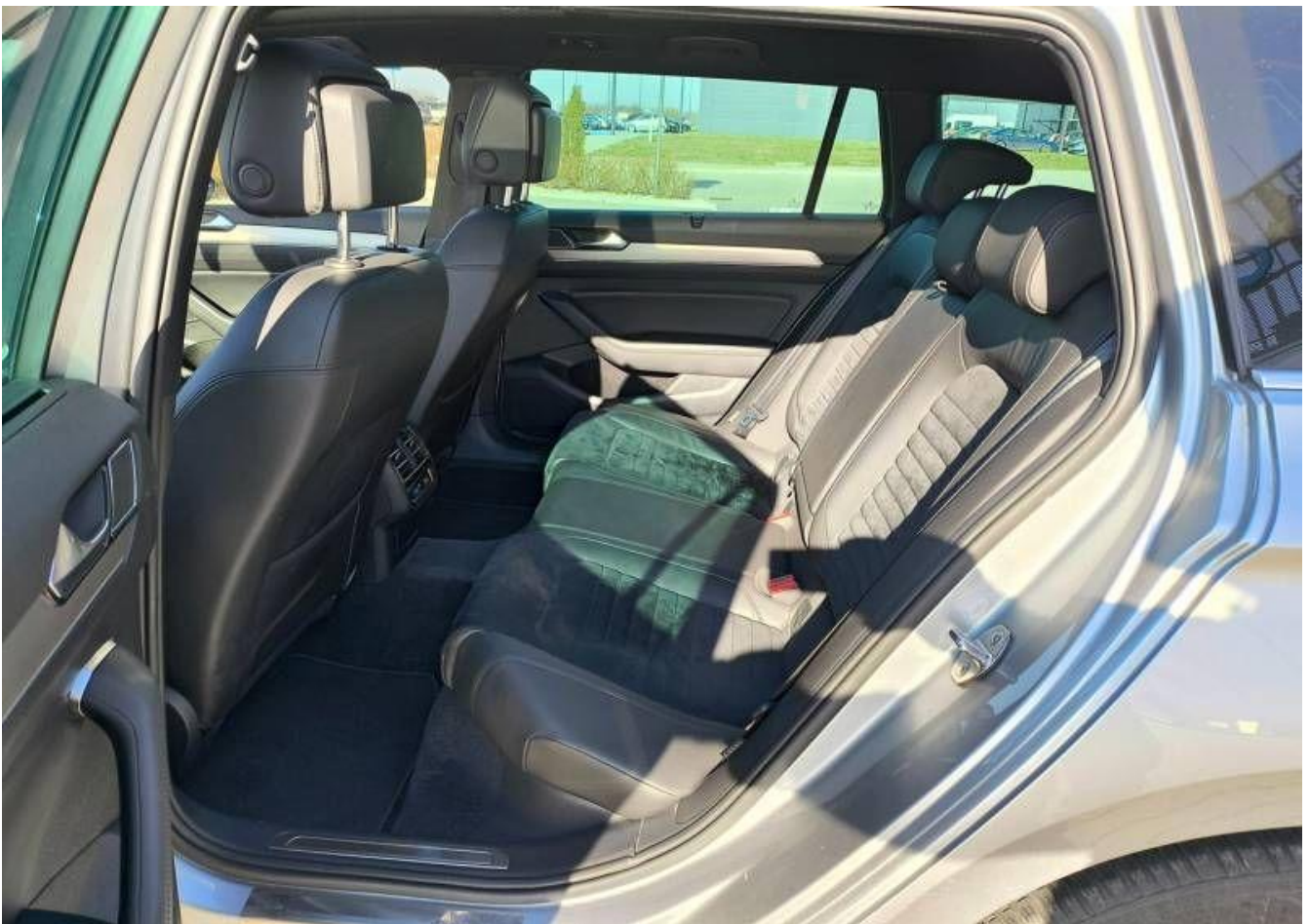
Fot. nr 20