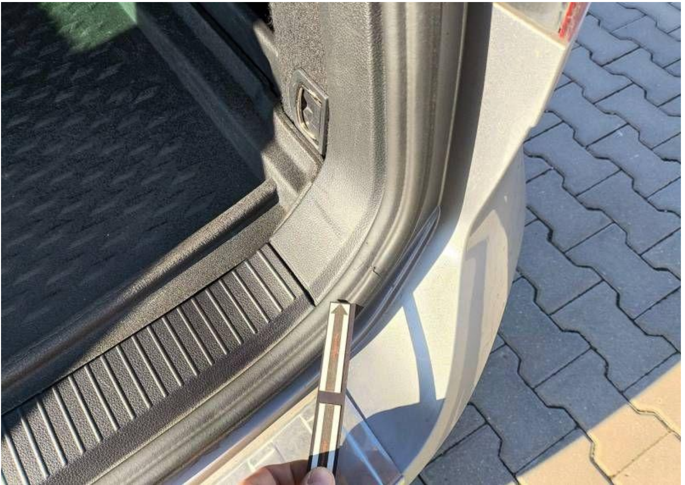
Fot. nr 39