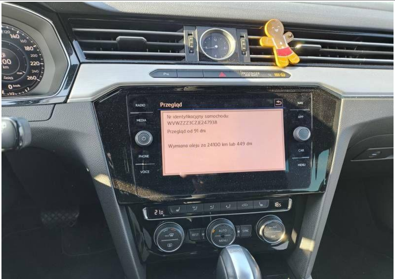
Fot. nr 13