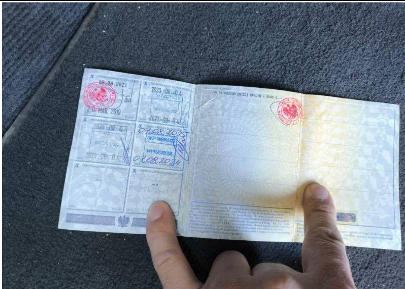
Fot. nr 49

Dokument wystawiony elektronicznie, wa ny bez podpisu