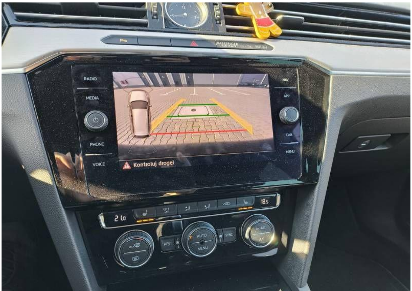
Fot. nr 14