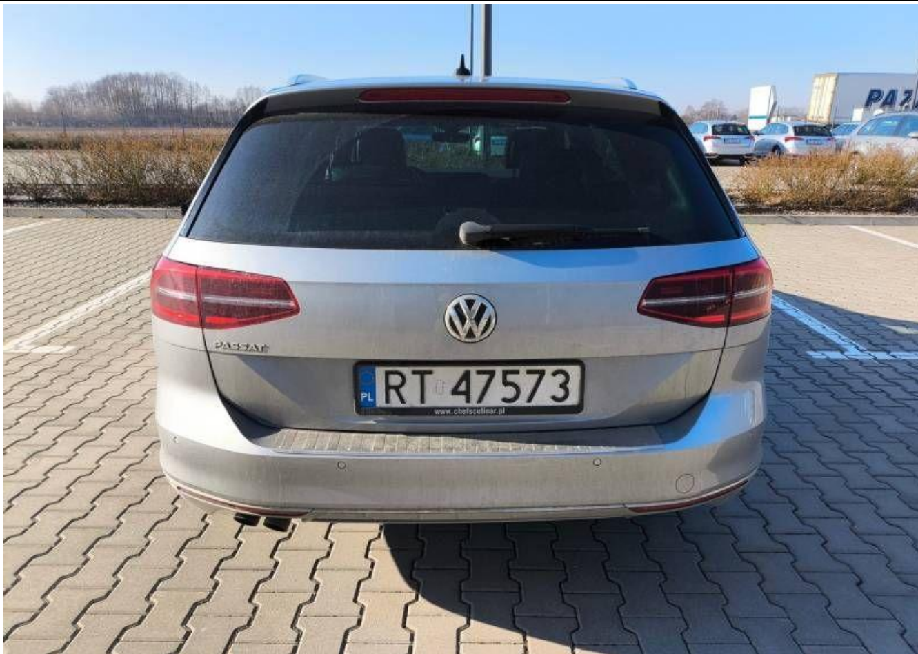
Fot. nr 3