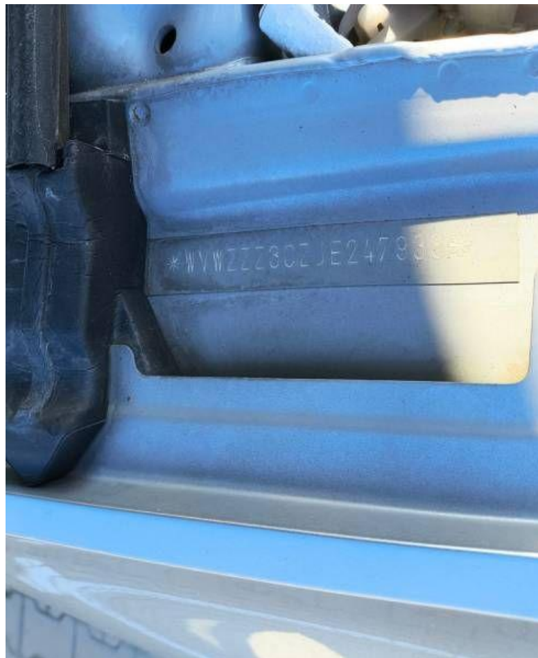
Fot. nr 8