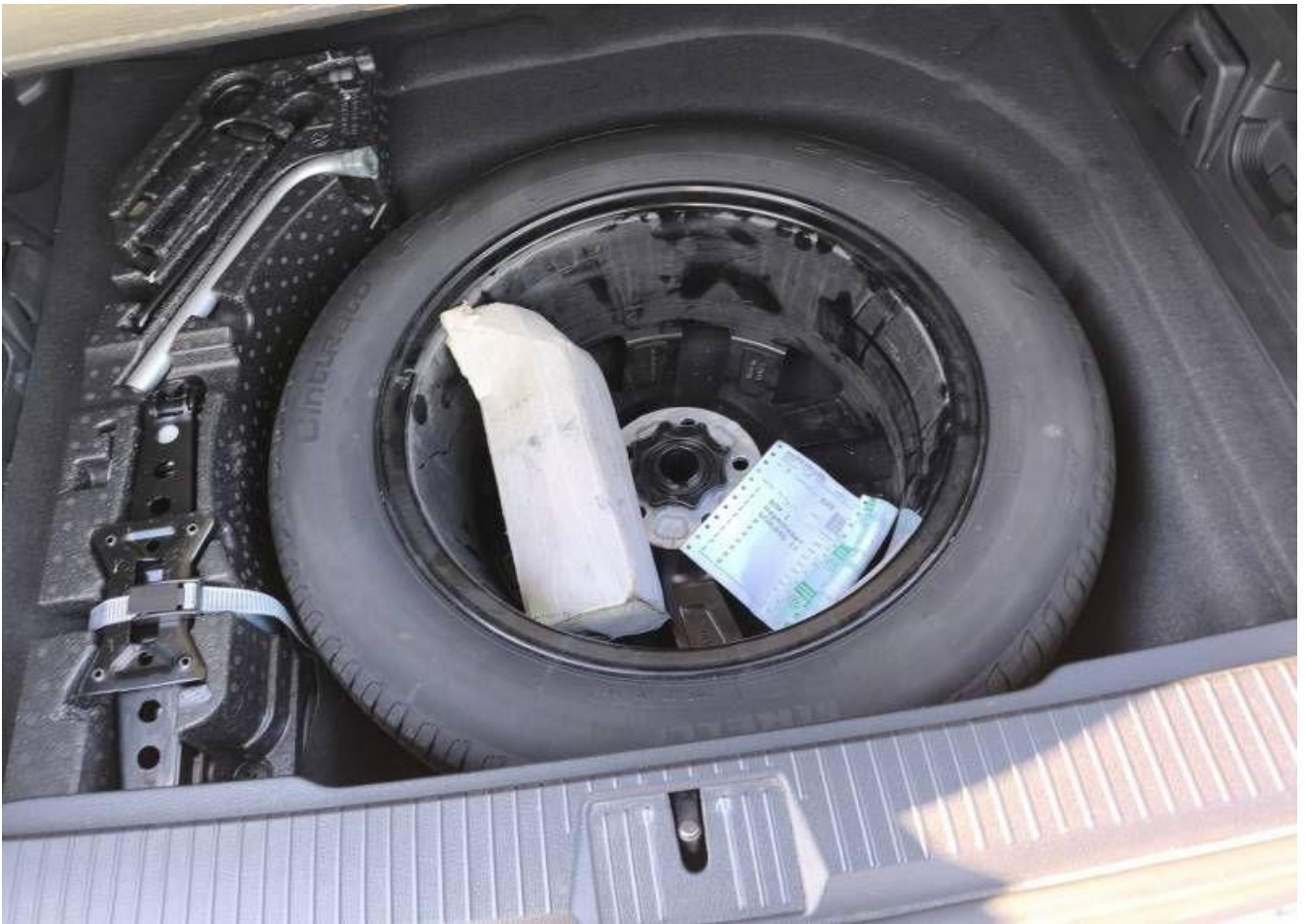
Fot. nr 25