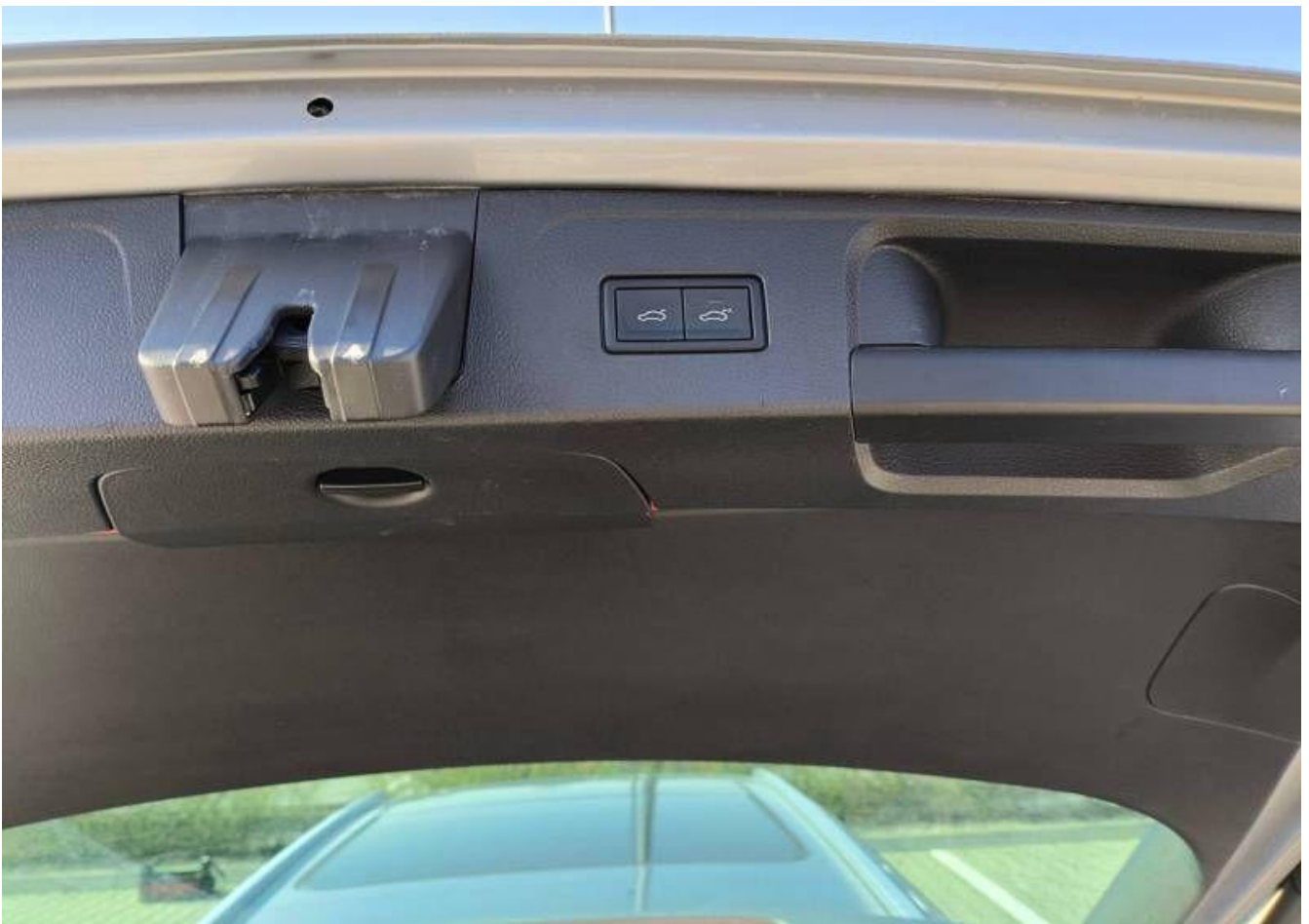
Fot. nr 26