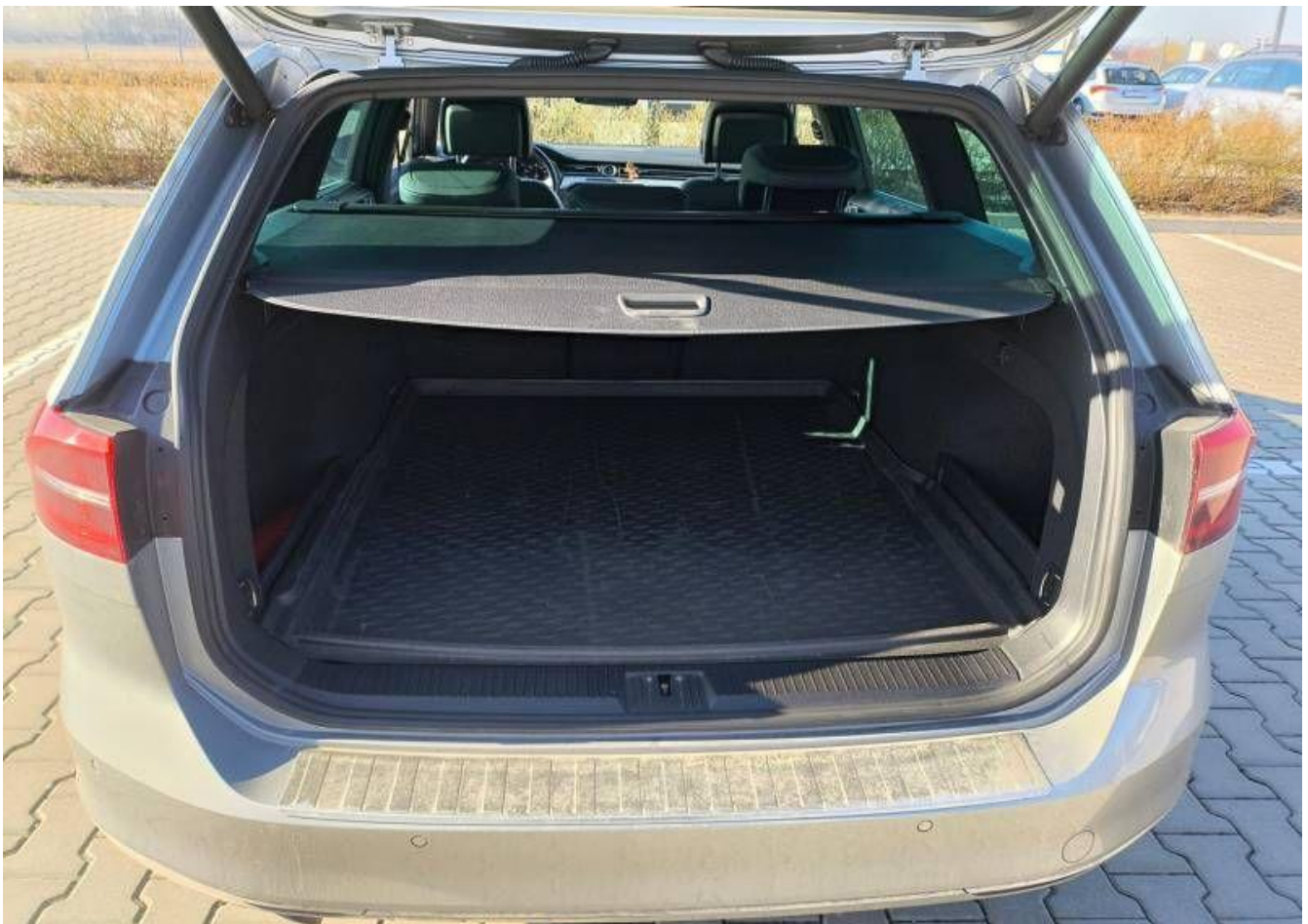
Fot. nr 24