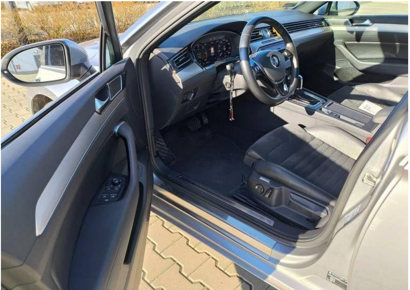
Fot. nr 17