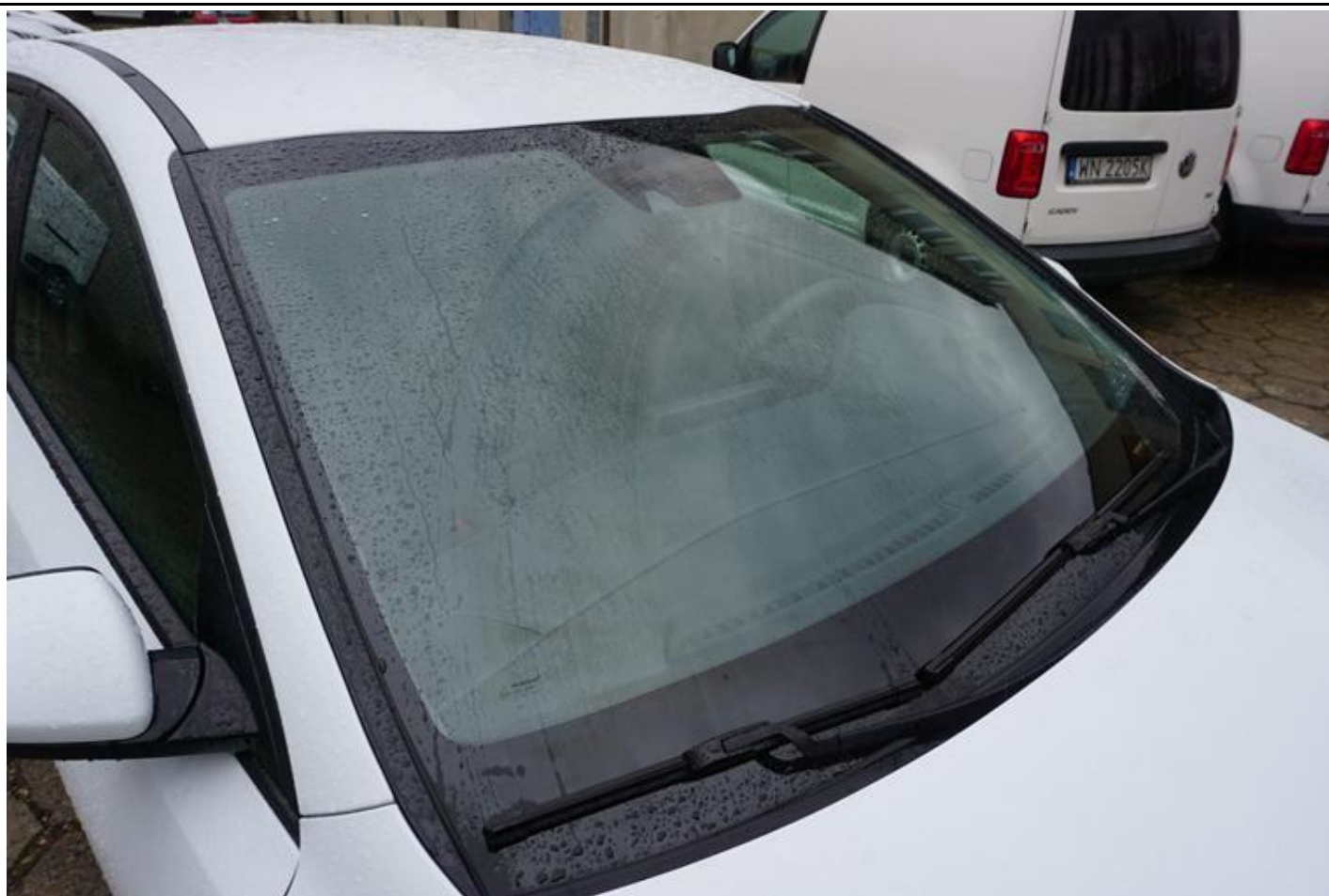
Fot. nr 67