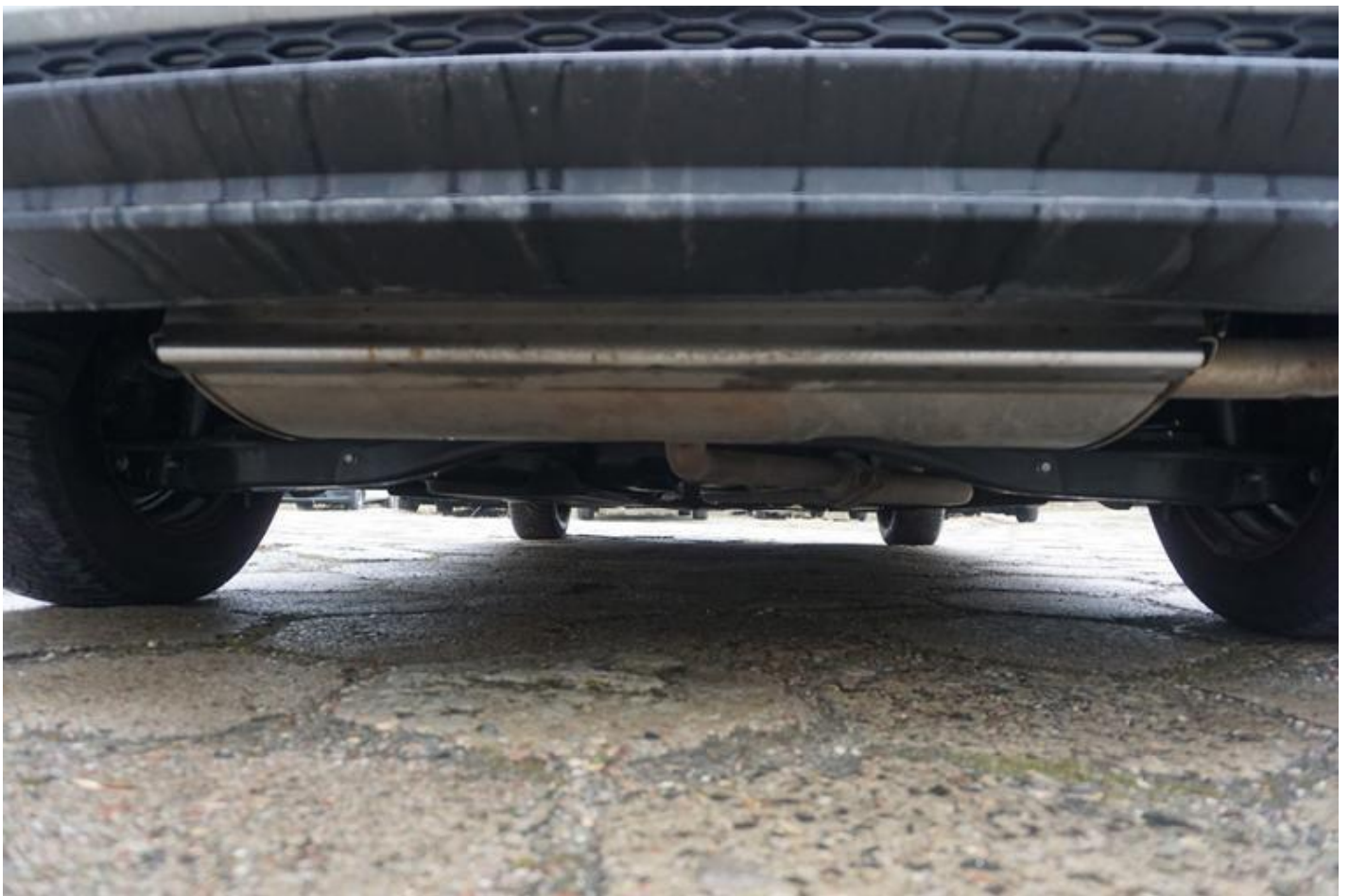
Fot. nr 70