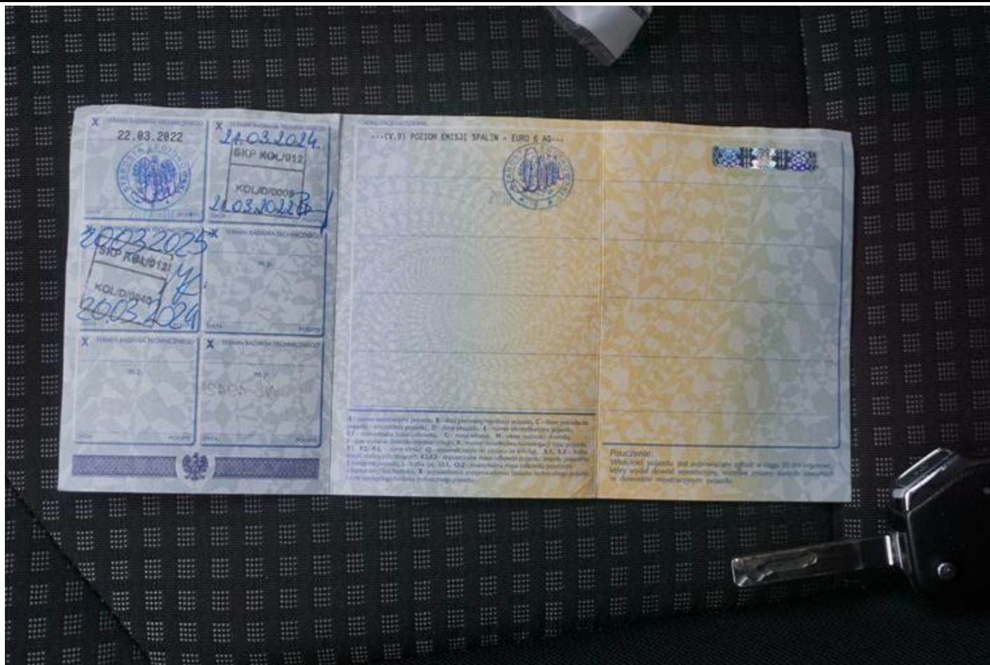
Fot. nr 75

Dokument wystawiony elektronicznie, wa ny bez podpisu