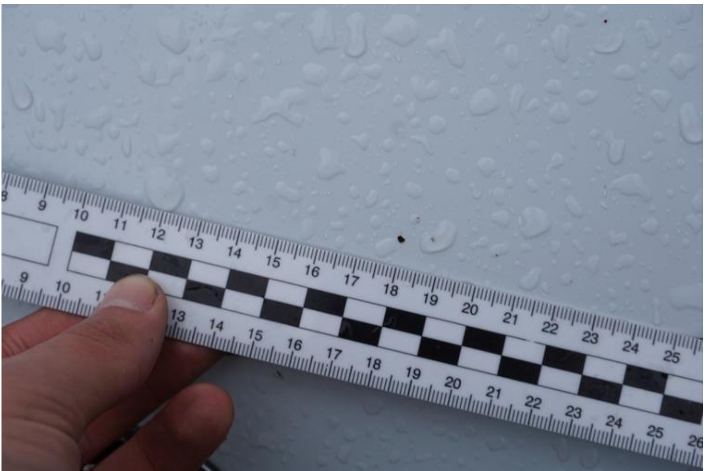
Fot. nr 64