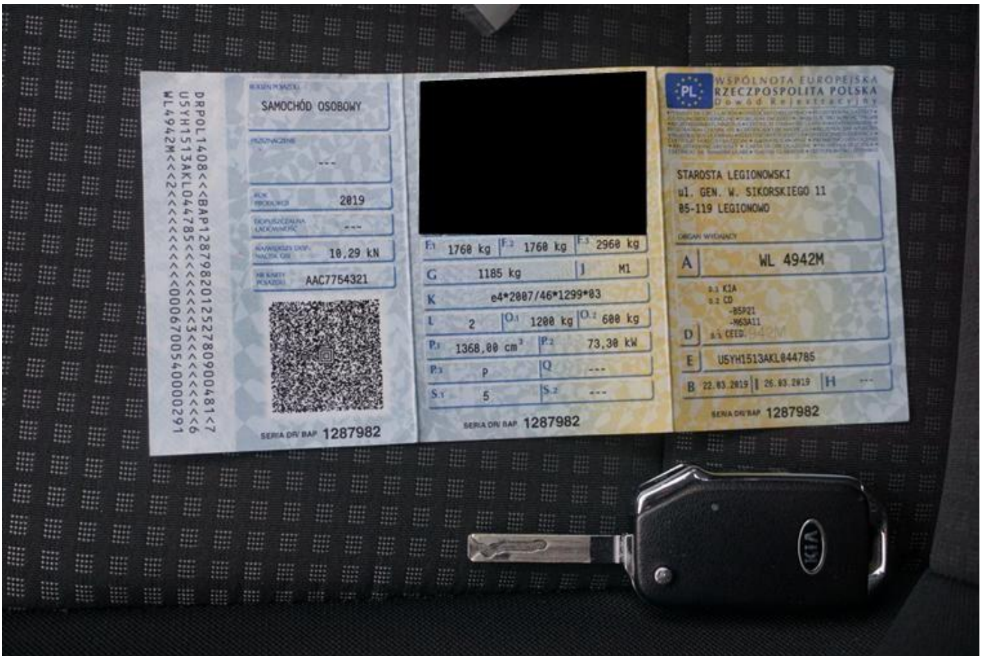
Fot. nr 74