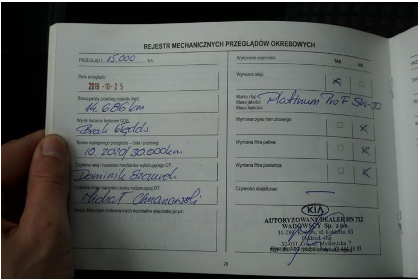
Fot. nr 72