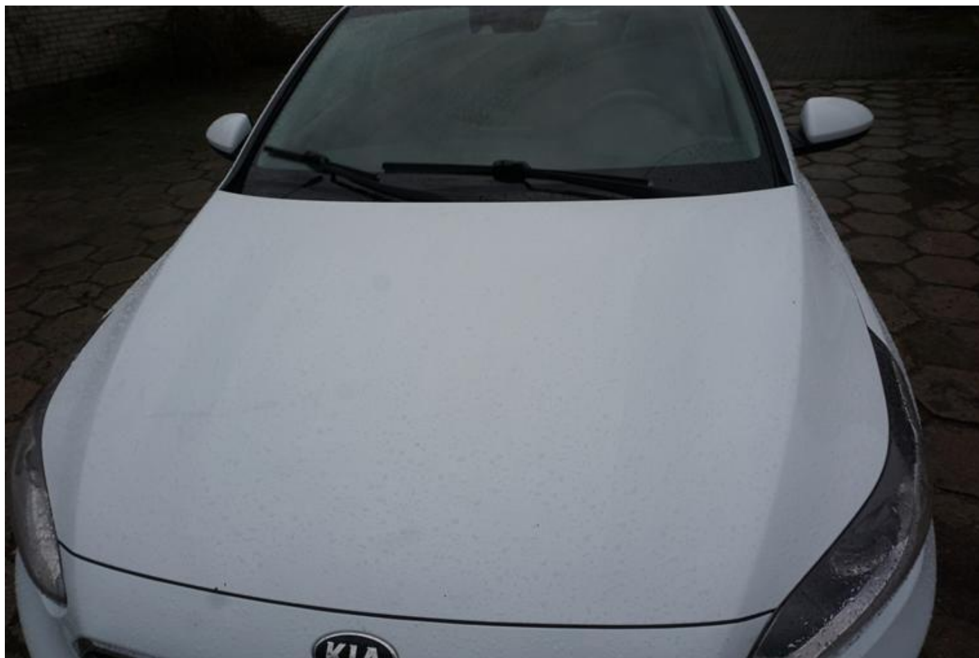
Fot. nr 62