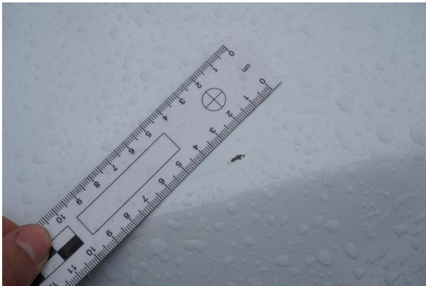
Fot. nr 66