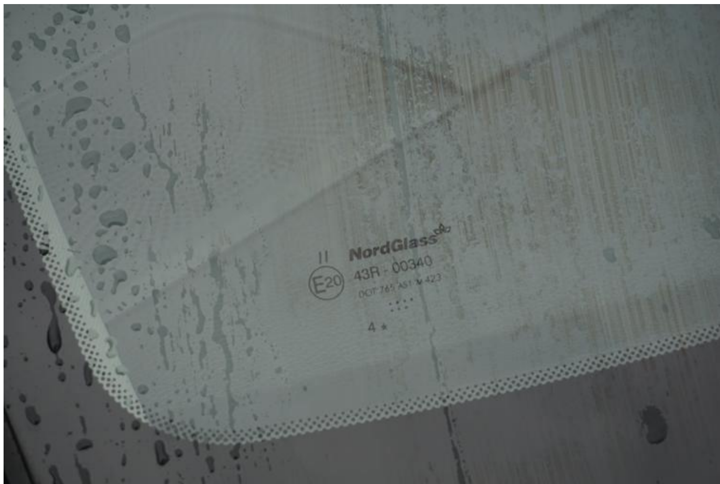
Fot. nr 68