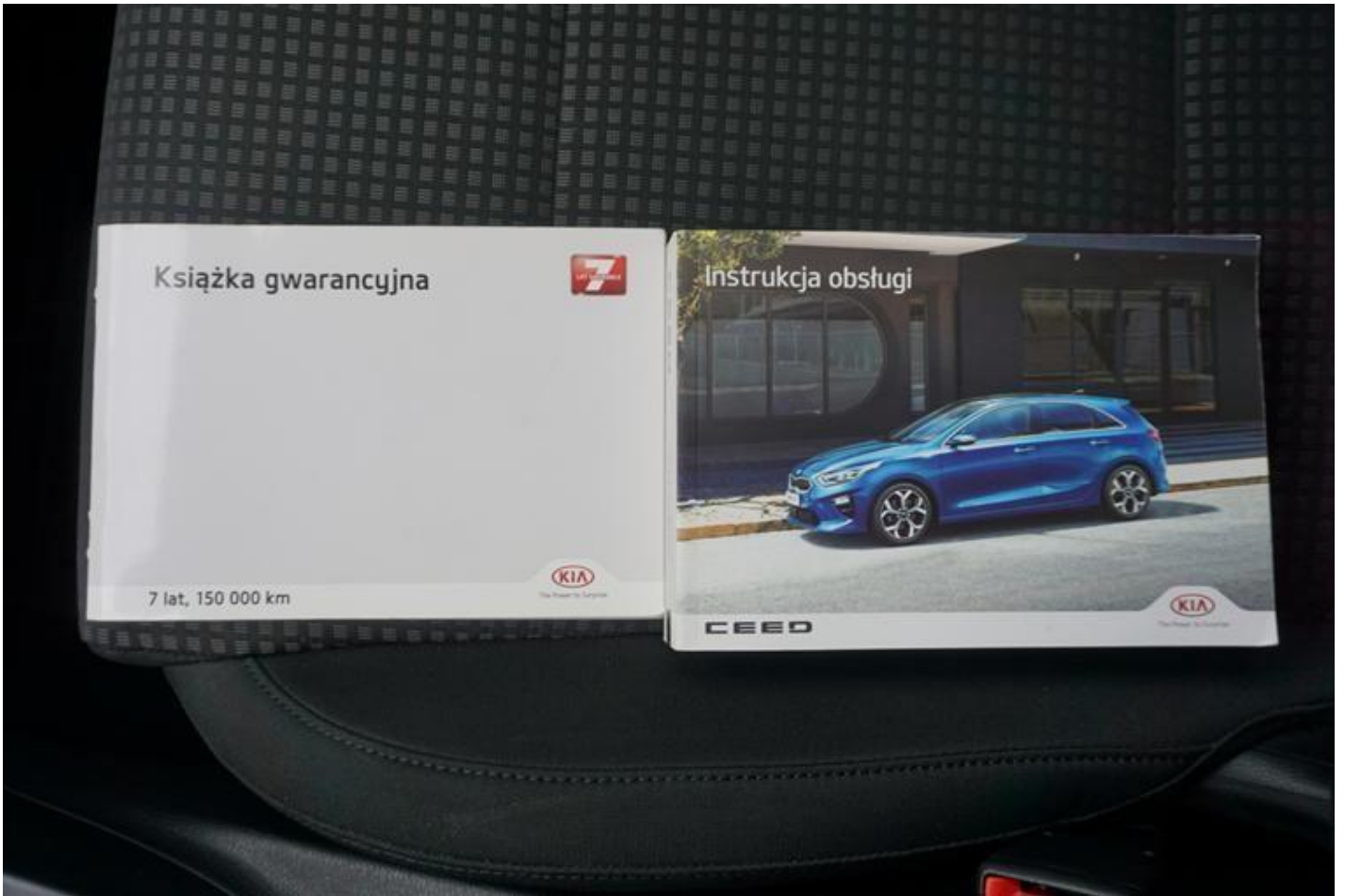
Fot. nr 73