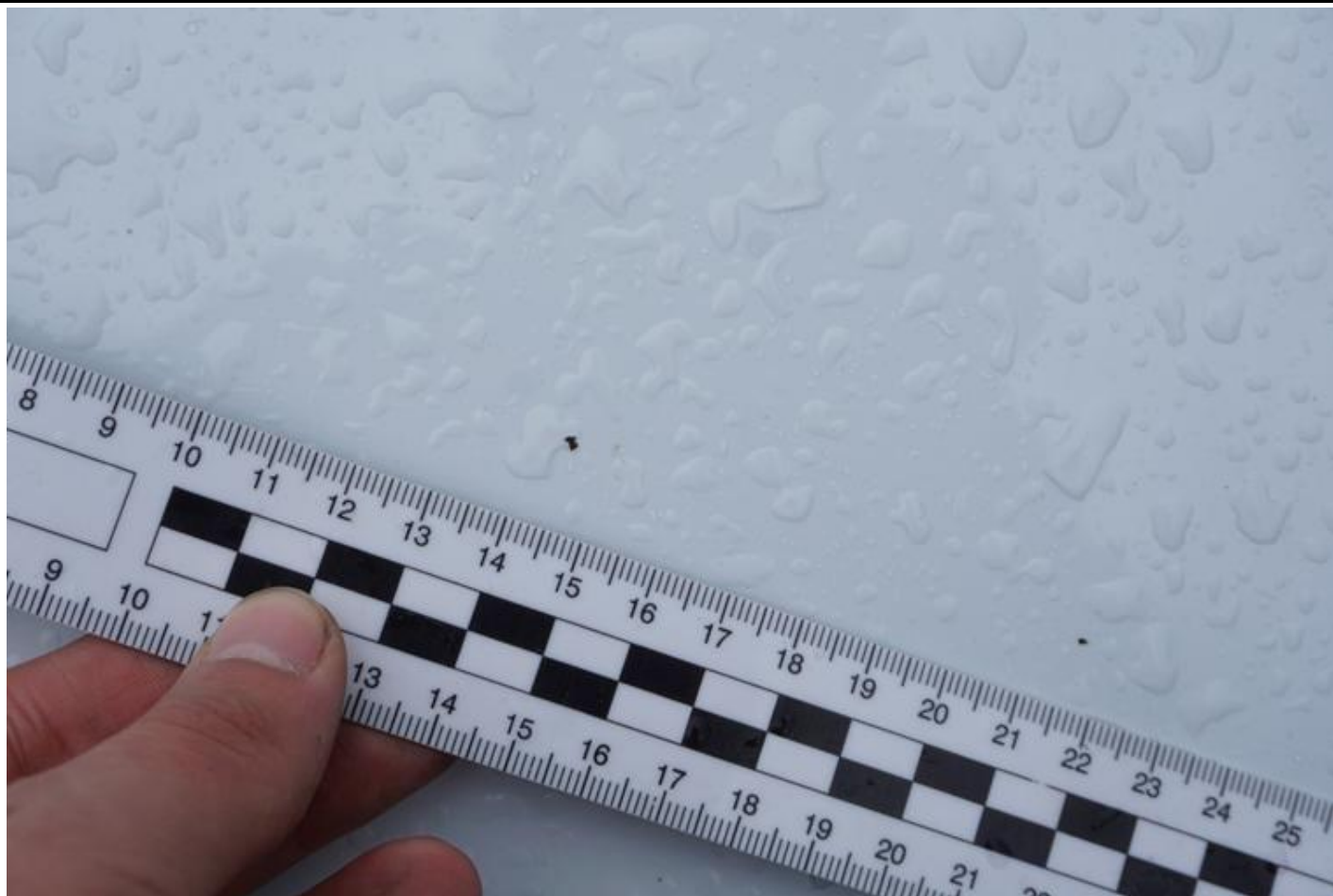
Fot. nr 65