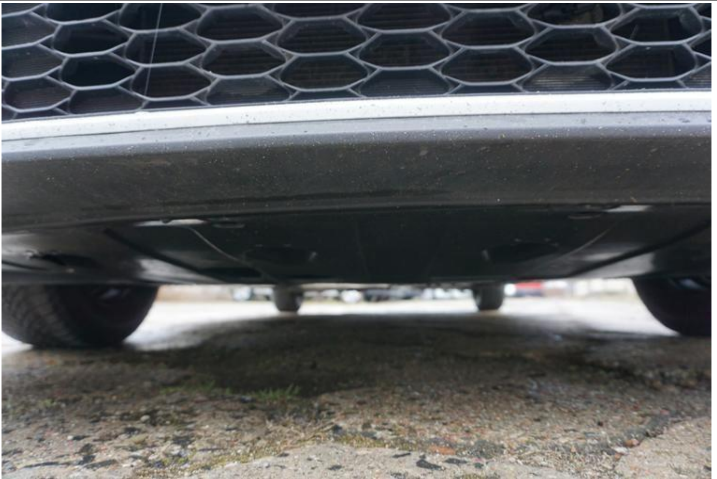
Fot. nr 69