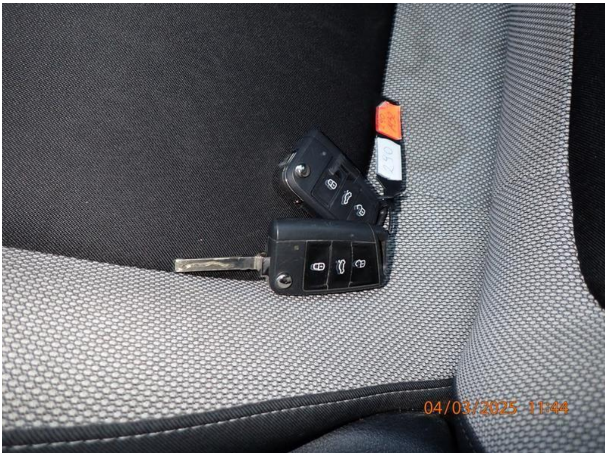
Fot. nr 76

Dokument wystawiony elektronicznie, wa ny bez podpisu