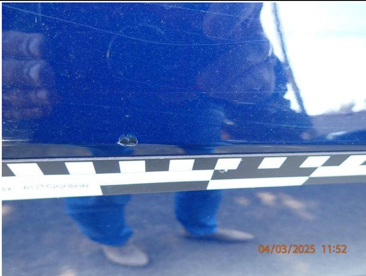
Fot. nr 67