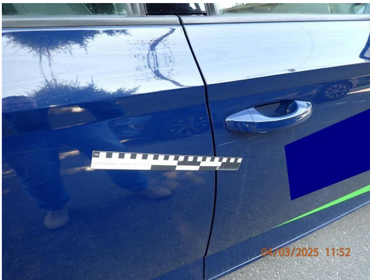
Fot. nr 68