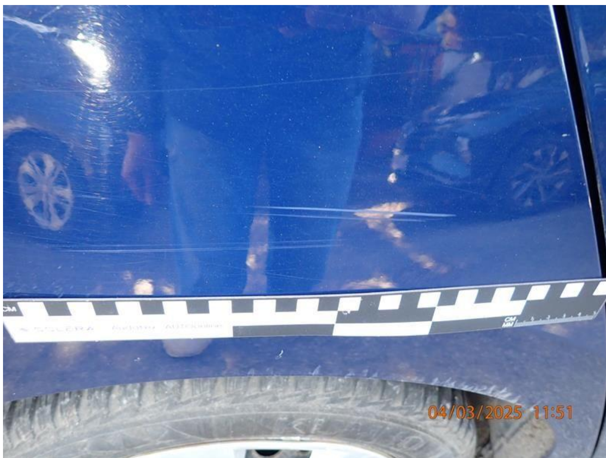
Fot. nr 64