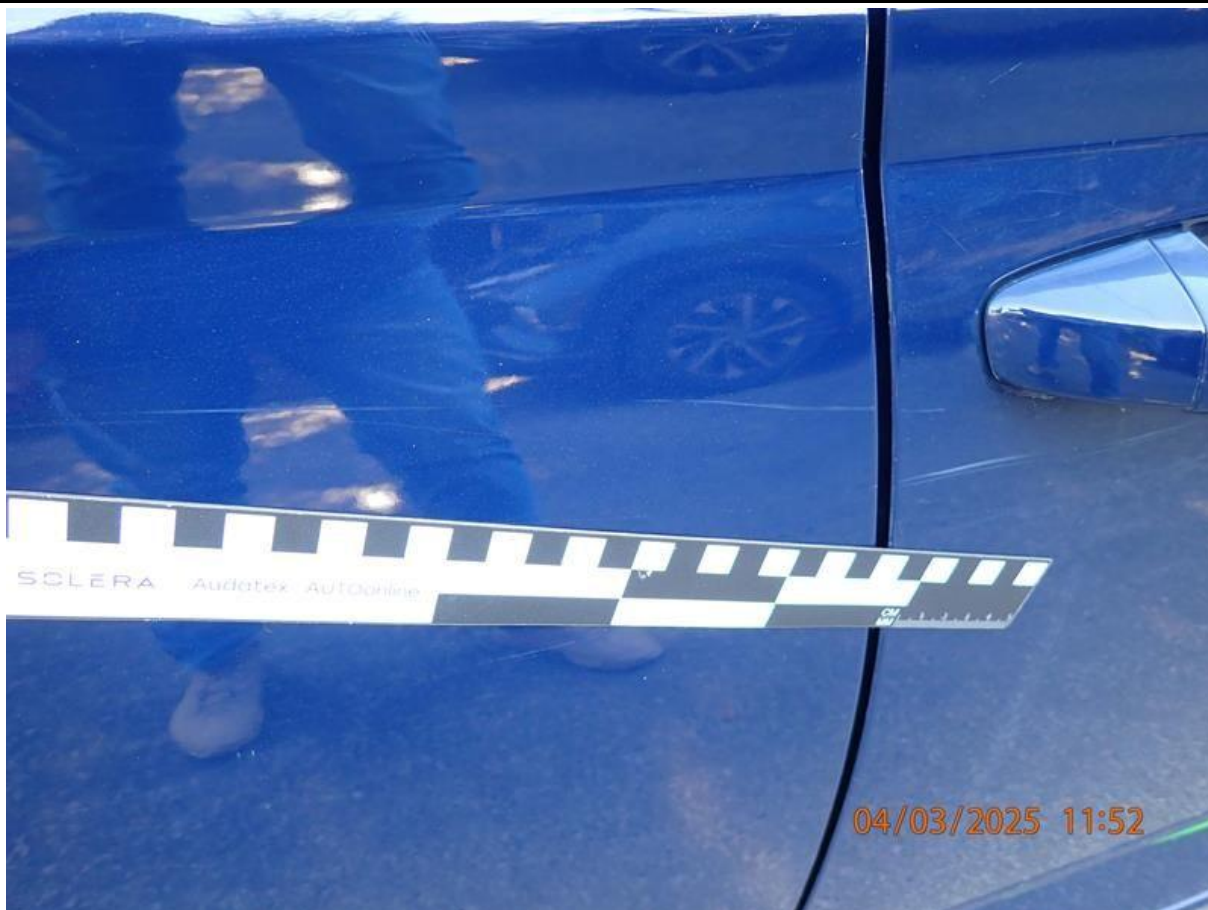
Fot. nr 69