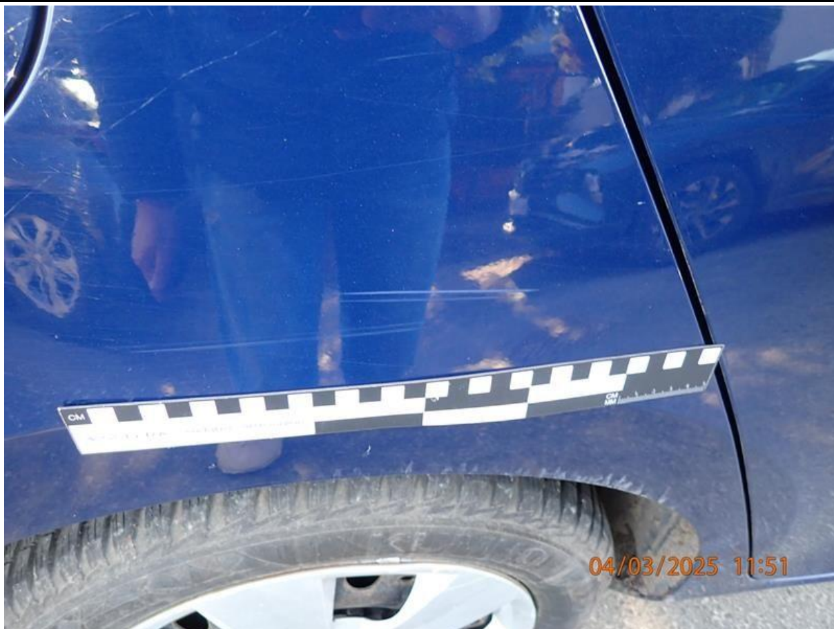
Fot. nr 63