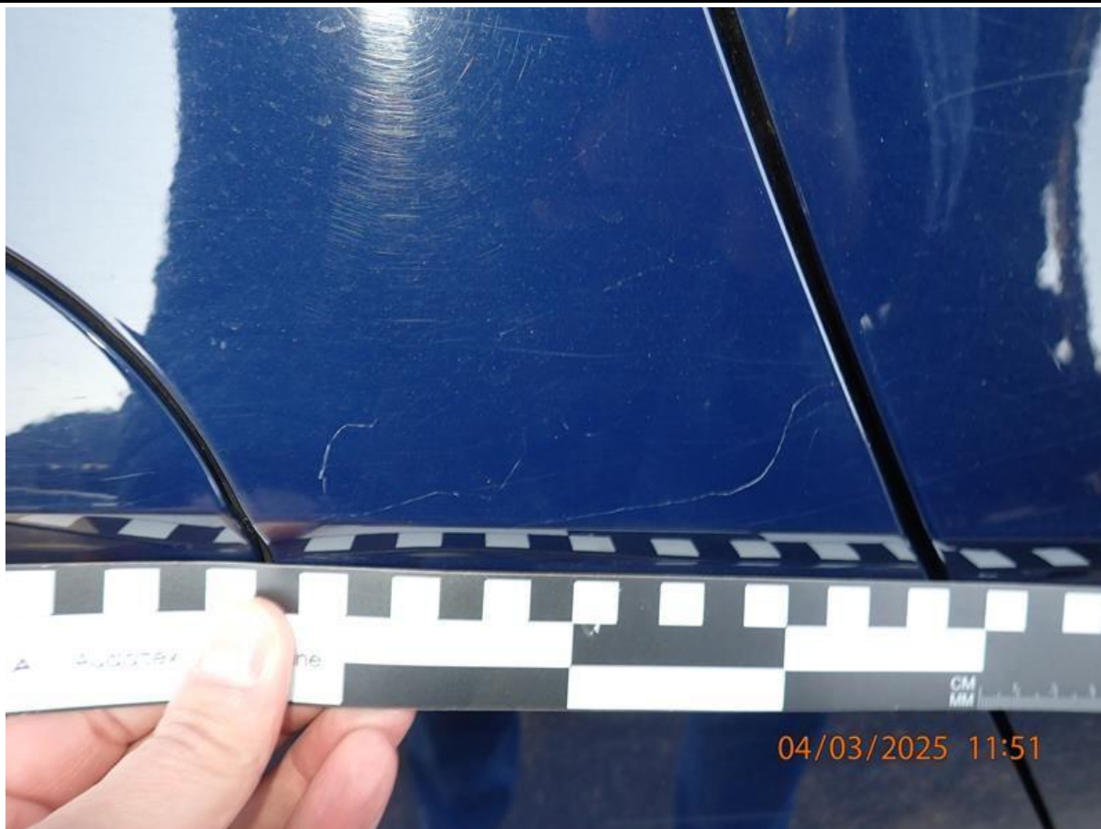
Fot. nr 65