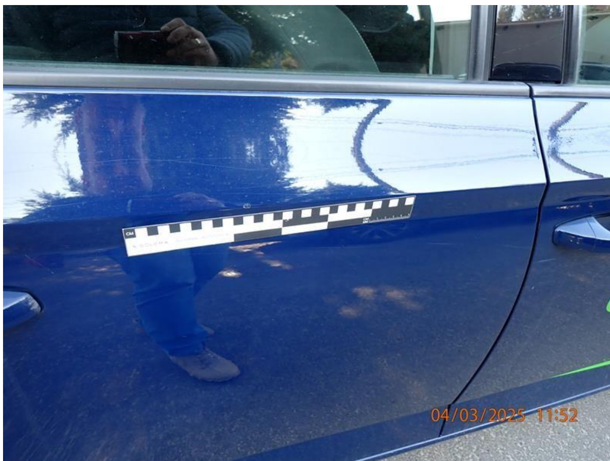
Fot. nr 66