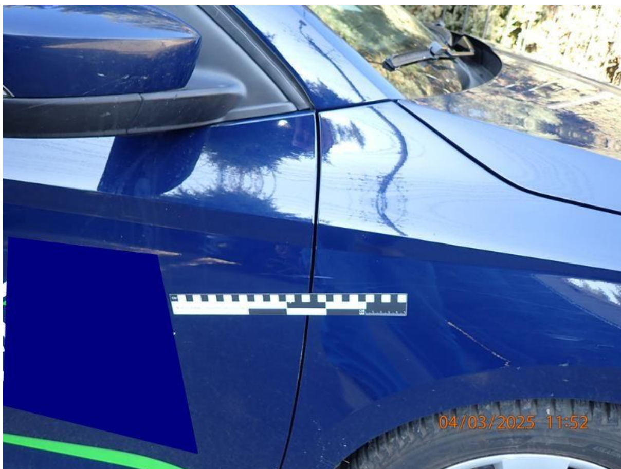
Fot. nr 72