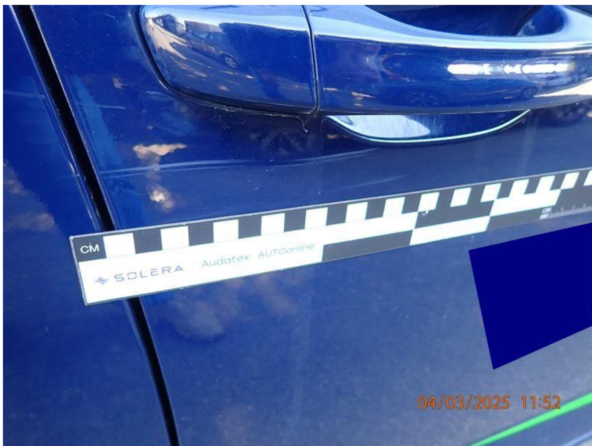
Fot. nr 70