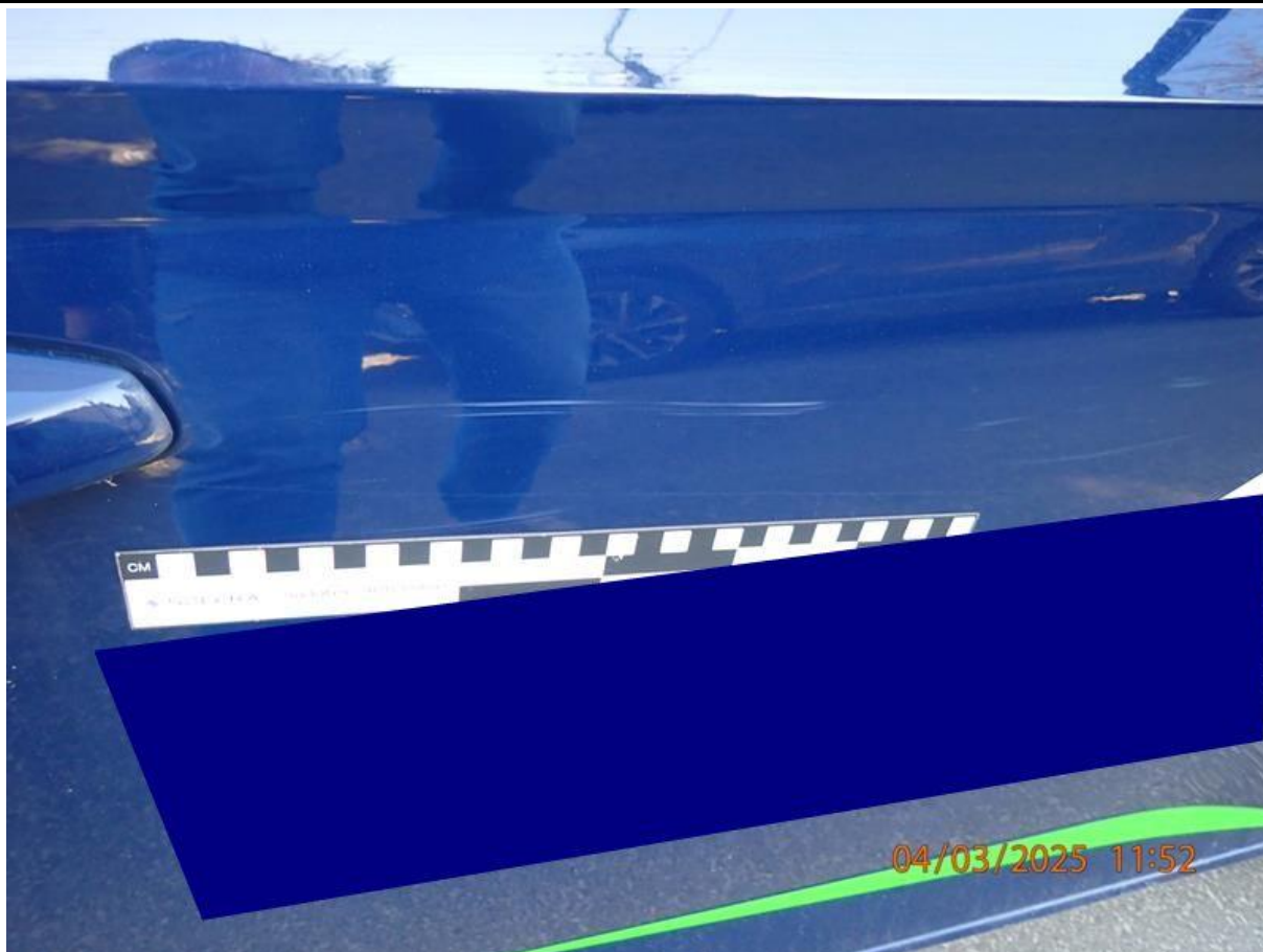
Fot. nr 71