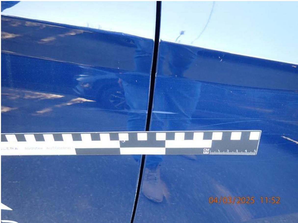
Fot. nr 73