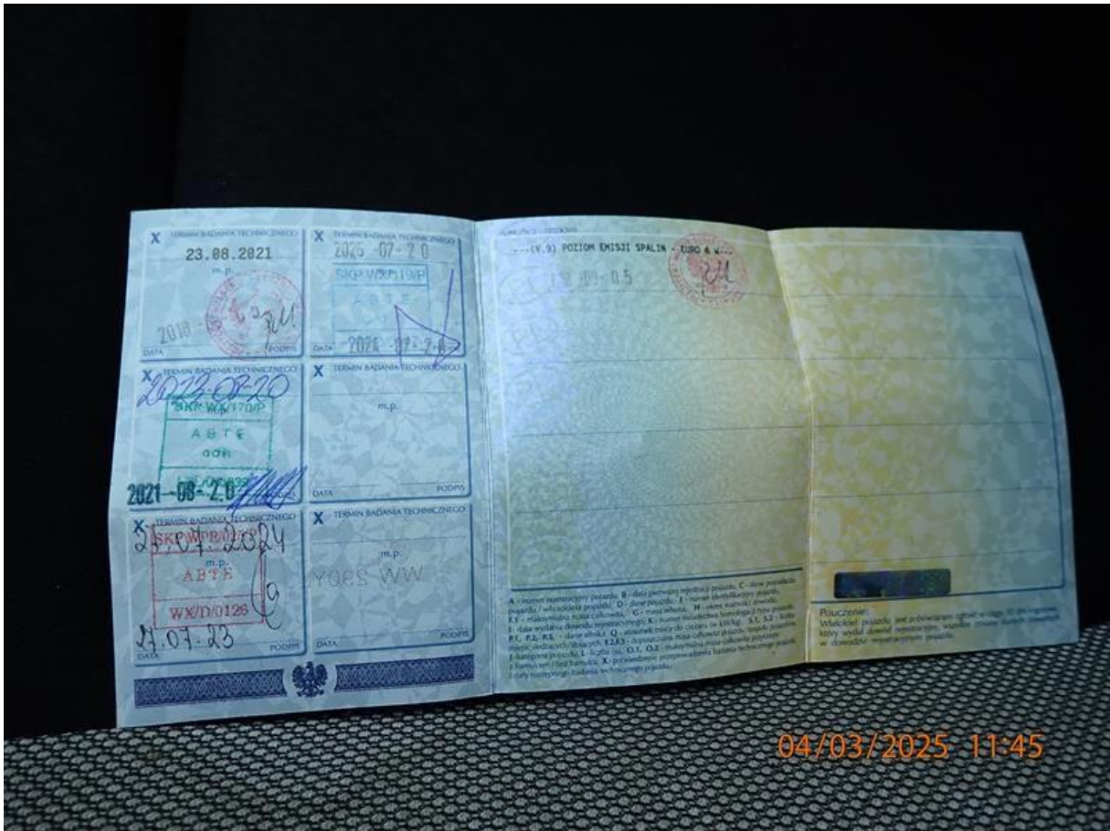
Fot. nr 75