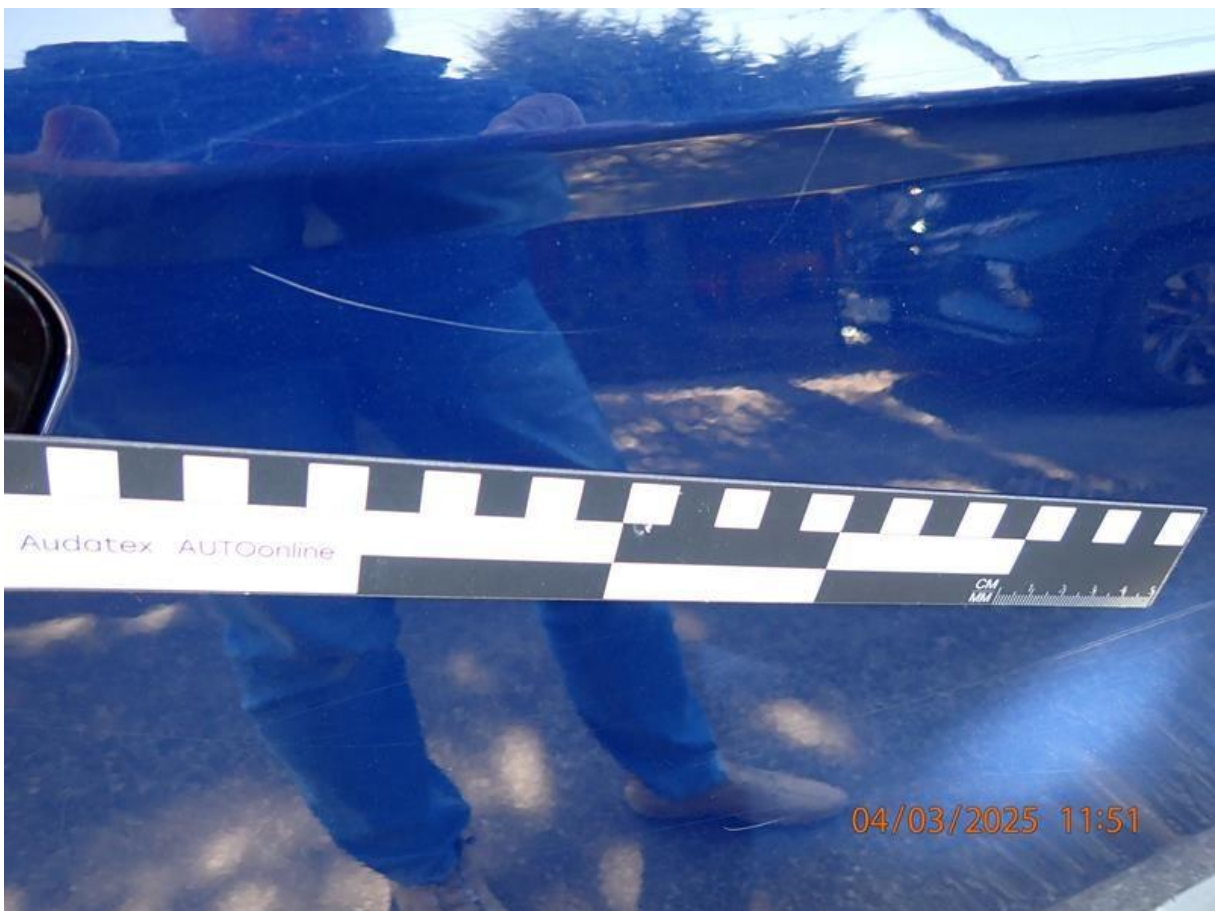
Fot. nr 62