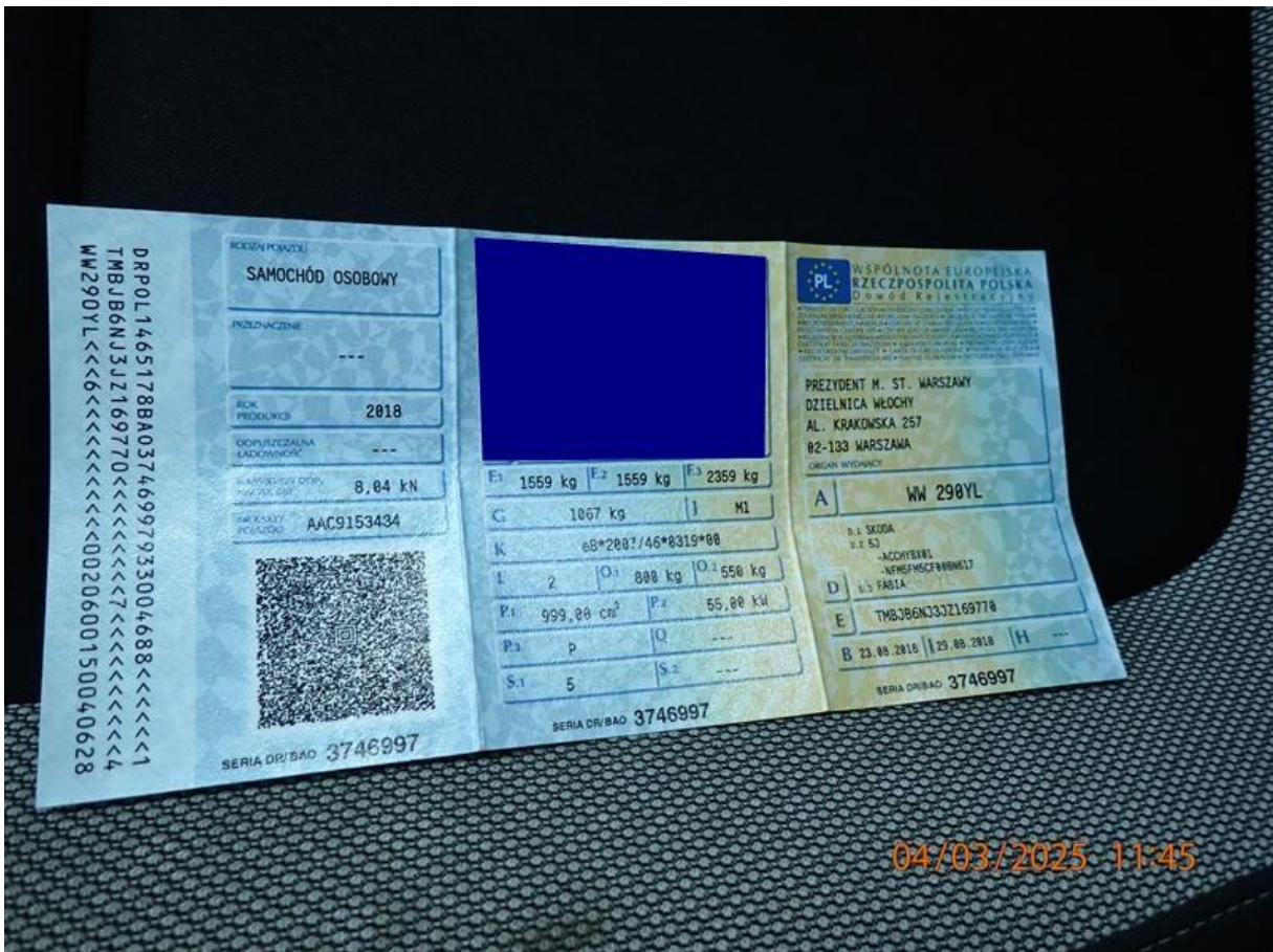
Fot. nr 74