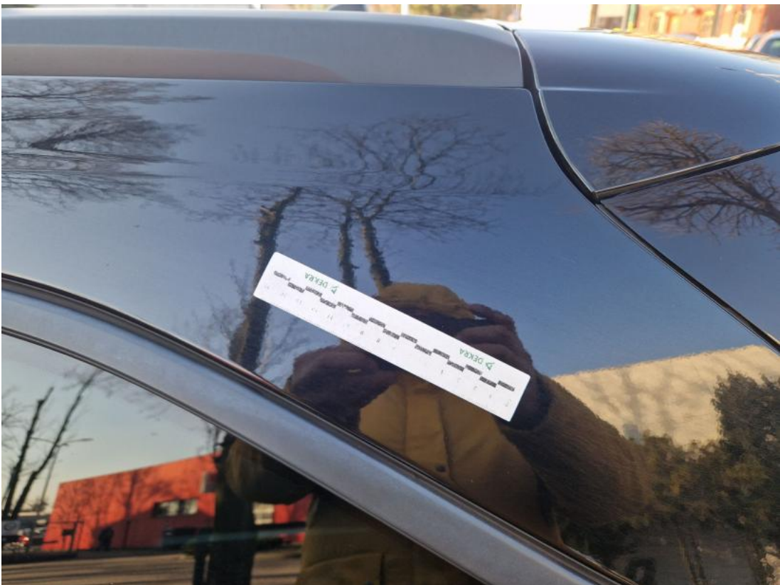
Fot. 44 Błotnik tylny L / Ściana boczna L - zdjęcie poglądowe 1