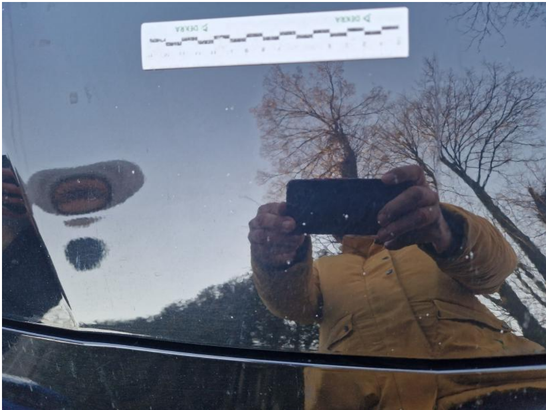
Fot. 35 Pokrywa komory silnika - Rysa/odprysk 1