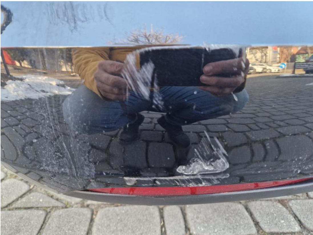
Fot. 43 Zderzak tylny - Wgniecenie/odkształcenie 1