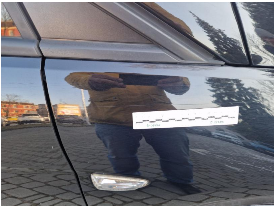
Fot. 36 Błotnik przedni P - zdjęcie pogładowe 1