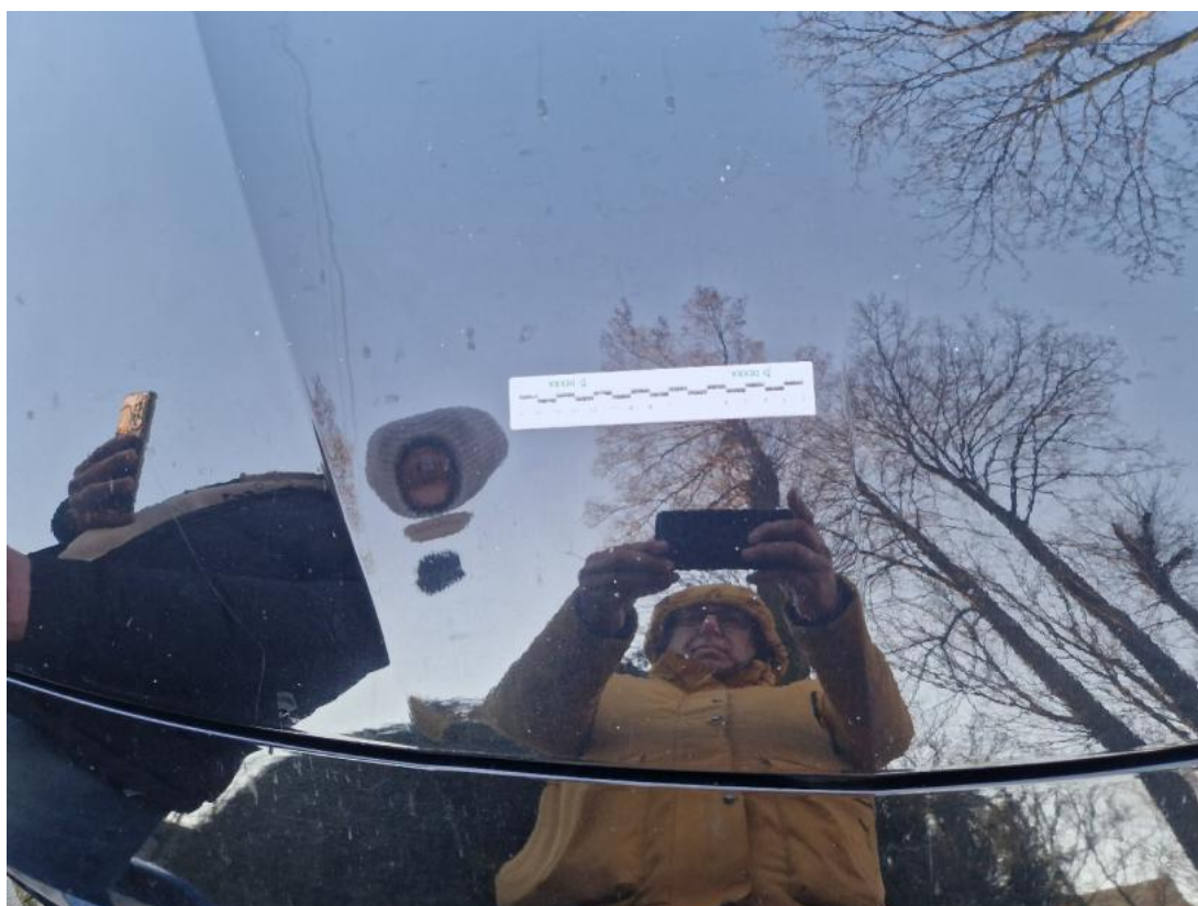
Fot. 34 Pokrywa komory silnika - zdjęcie poglądowe 1