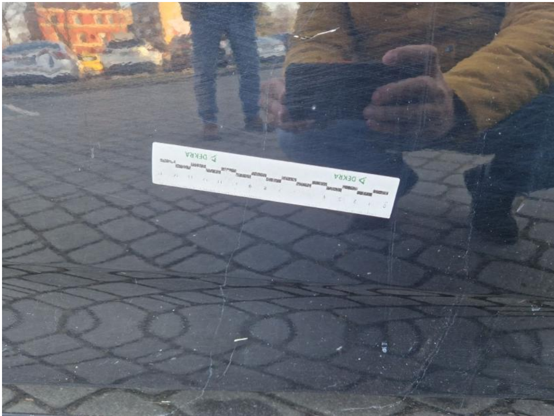
Fot. 39 Drzwi przednie P - Inne 1