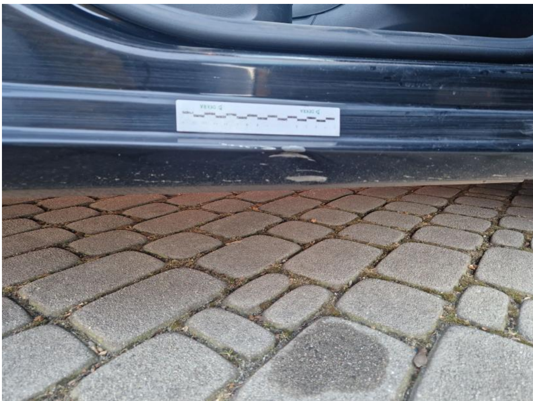
Fot. 40 Próg P - zdjęcie poglądowe 1