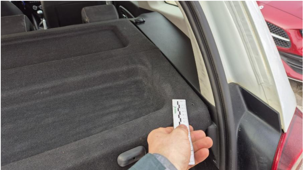
Fot. 67 Półka/roleta tylna - Inne 1