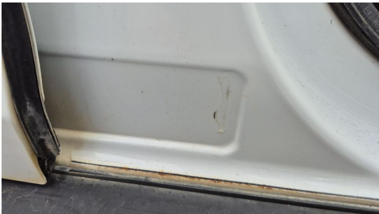
Fot. 14 Tabliczka znamionowa