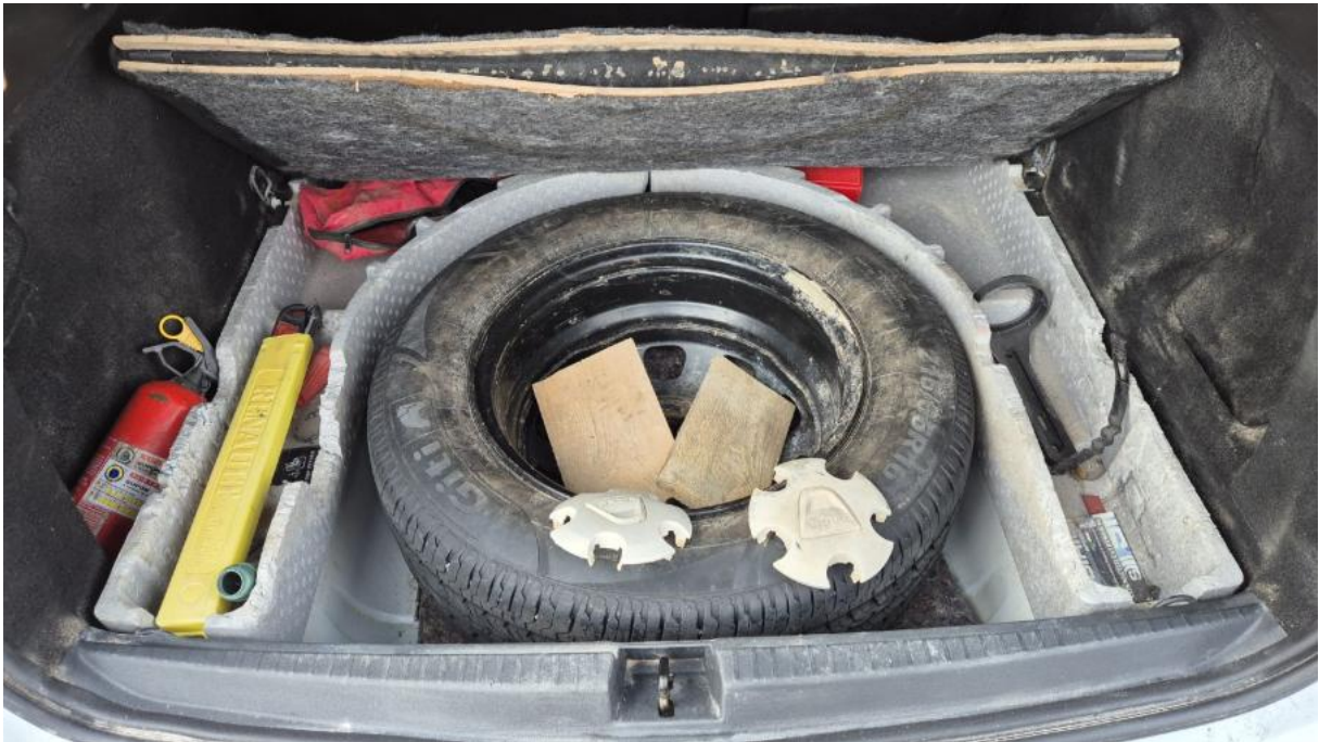
Fot. 25 Koło zapasowe