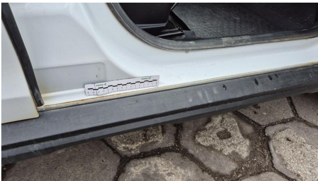
Fot. 47 Próg P - Inne 1