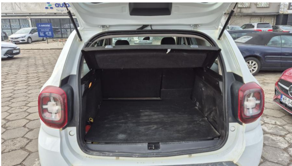
Fot. 24 Bagażnik