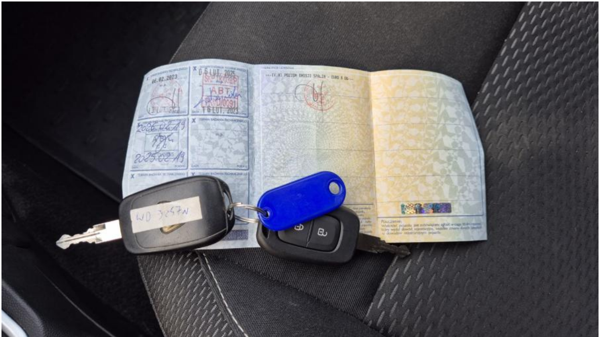
Fot. 31 Dow. Rej. Str.2 i klucze