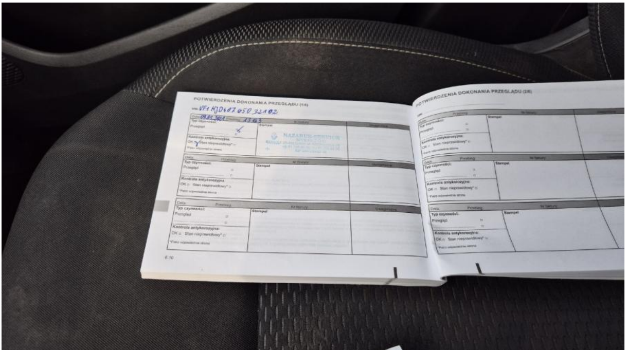
Fot. 32 Książka serwisowa – dane