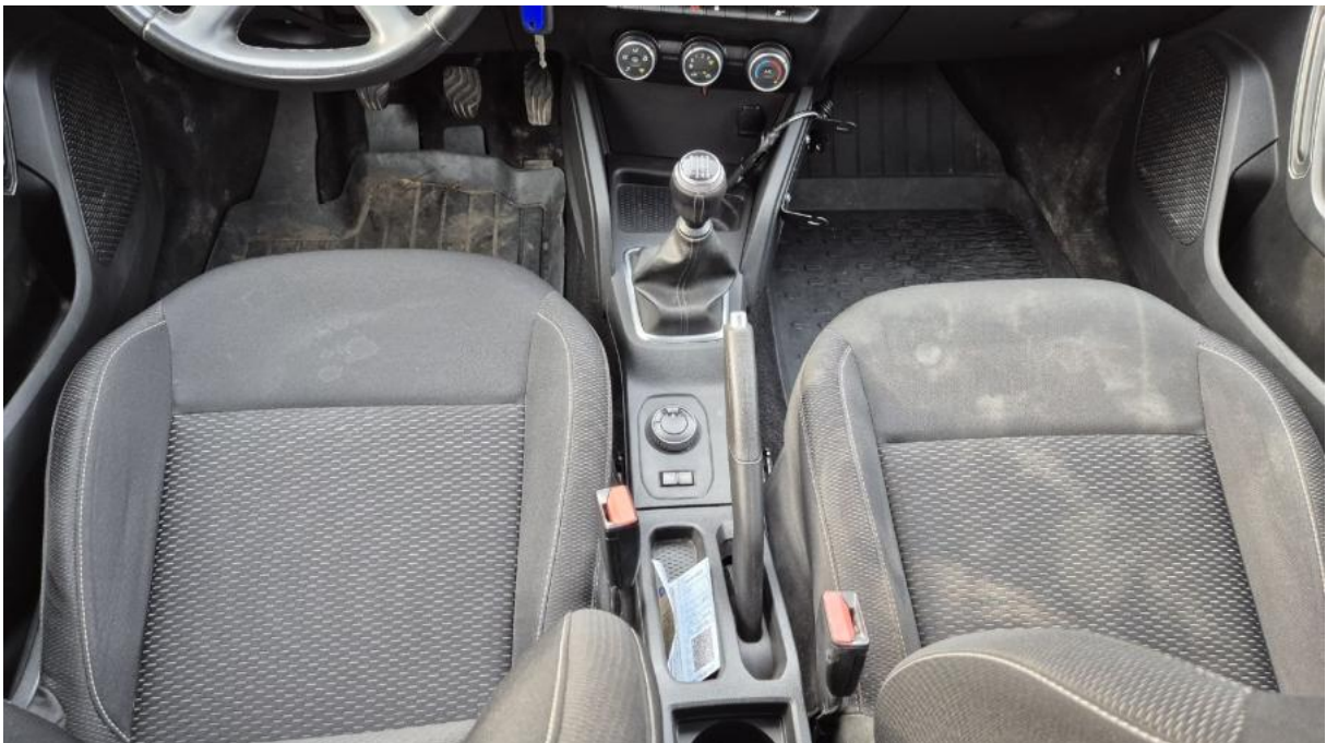
Fot. 20 Tuneł środkowy