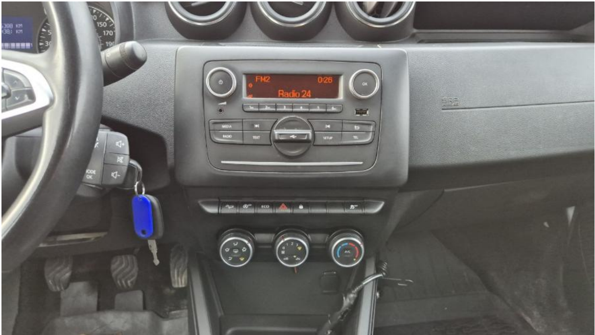
Fot. 19 Konsola środkowa