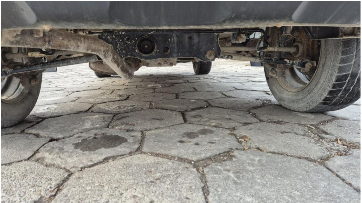
Fot. 27 Spód pojazdu tył