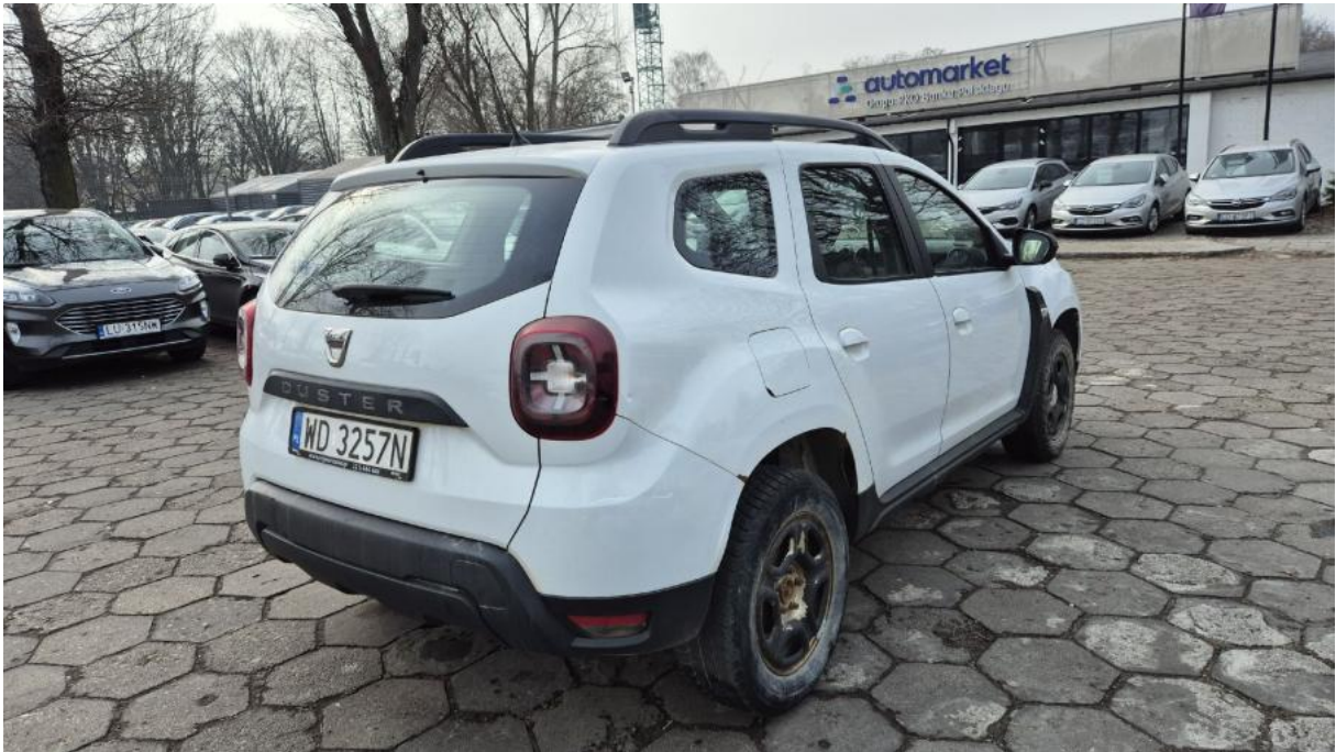
Fot. 7 Przekątna tylna prawa