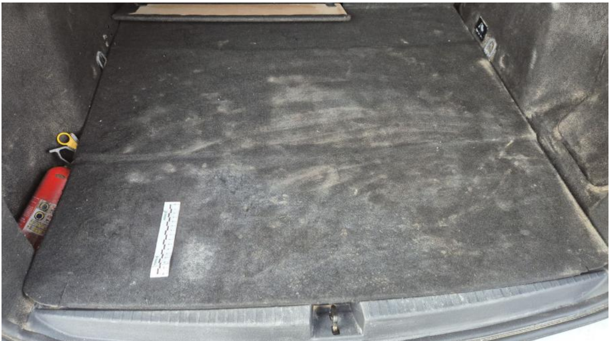
Fot. 68 Wykładzina podłogi bagażnika - Inne 1