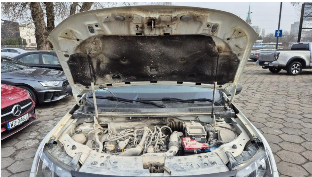
Fot. 23 Komora silnika