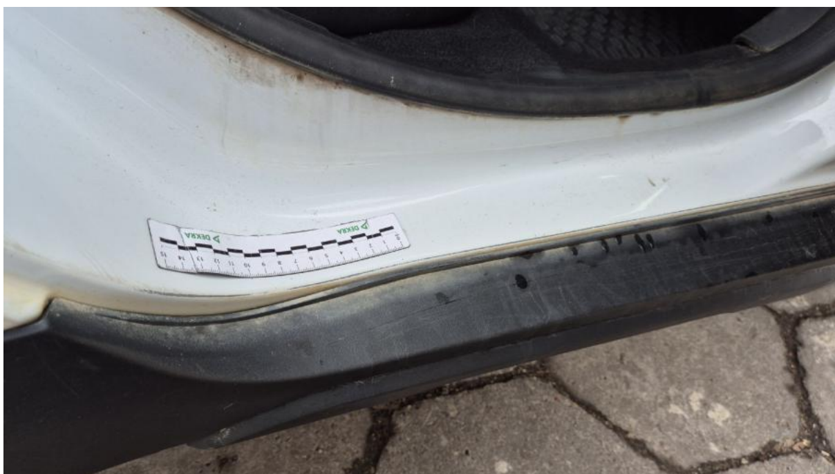
Fot. 48 Próg P - Inne 2