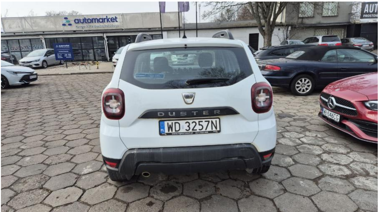
Fot. 8 Tył