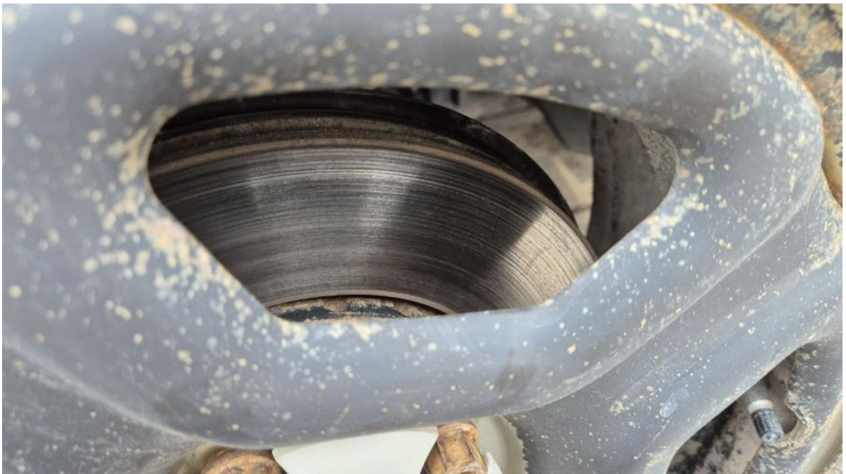
Fot. 28 Tarcza hamulcowa przednia lewa