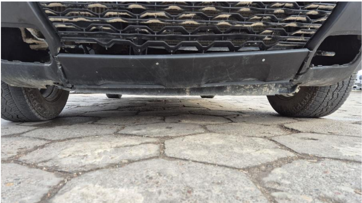
Fot. 26 Spód pojazdu przód