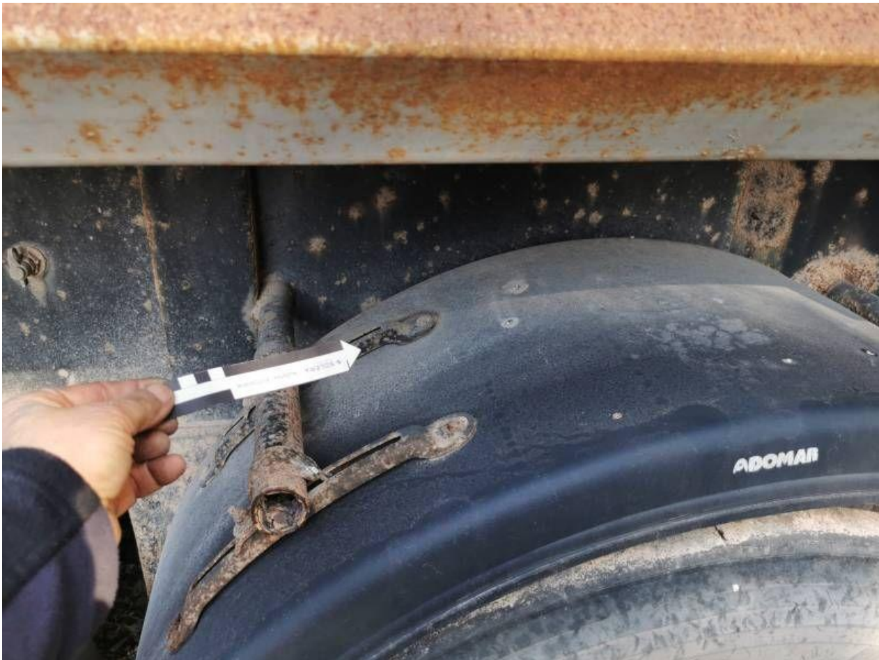
Fot. nr 93