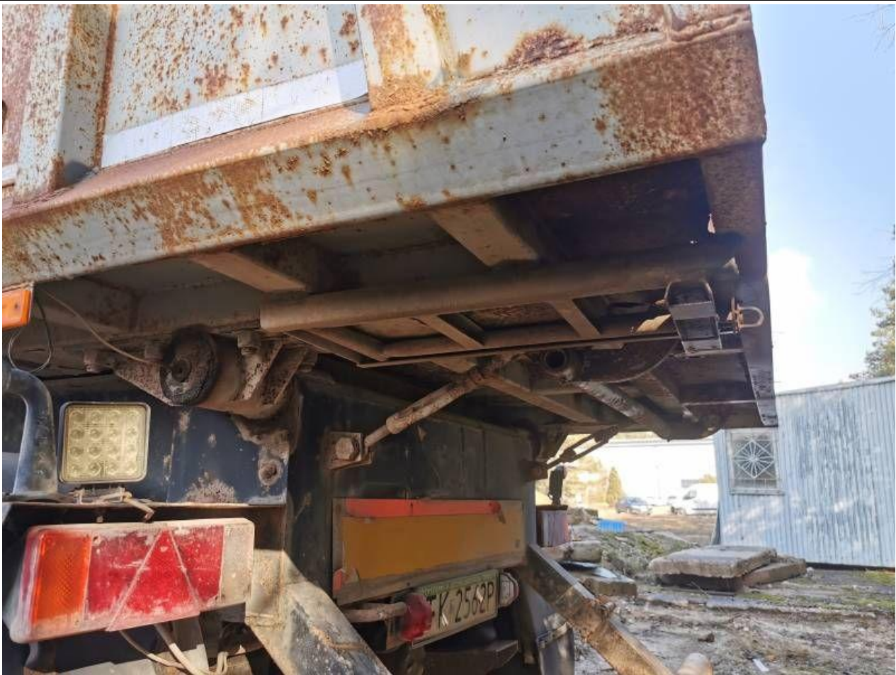
Fot. nr 63