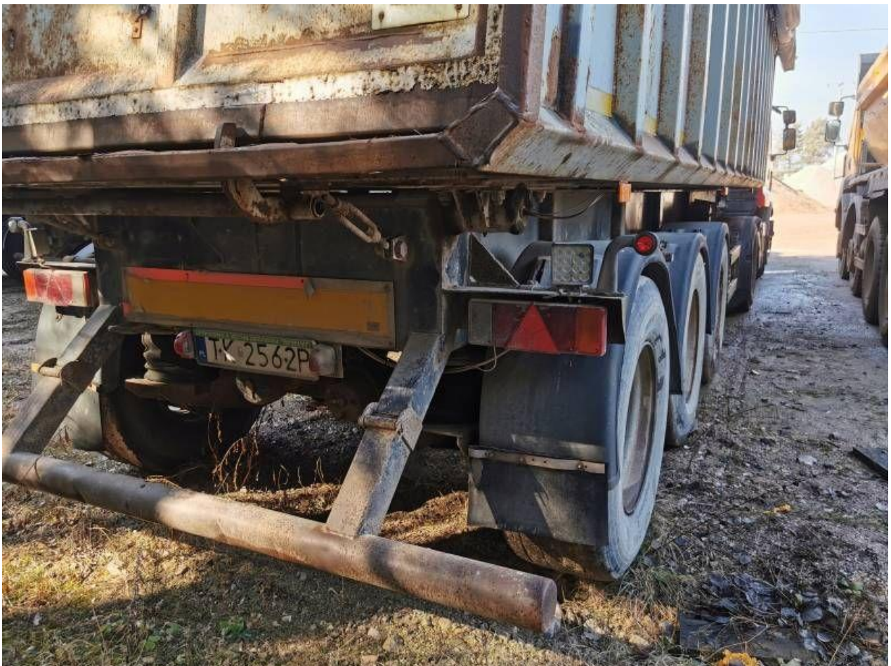
Fot. nr 46