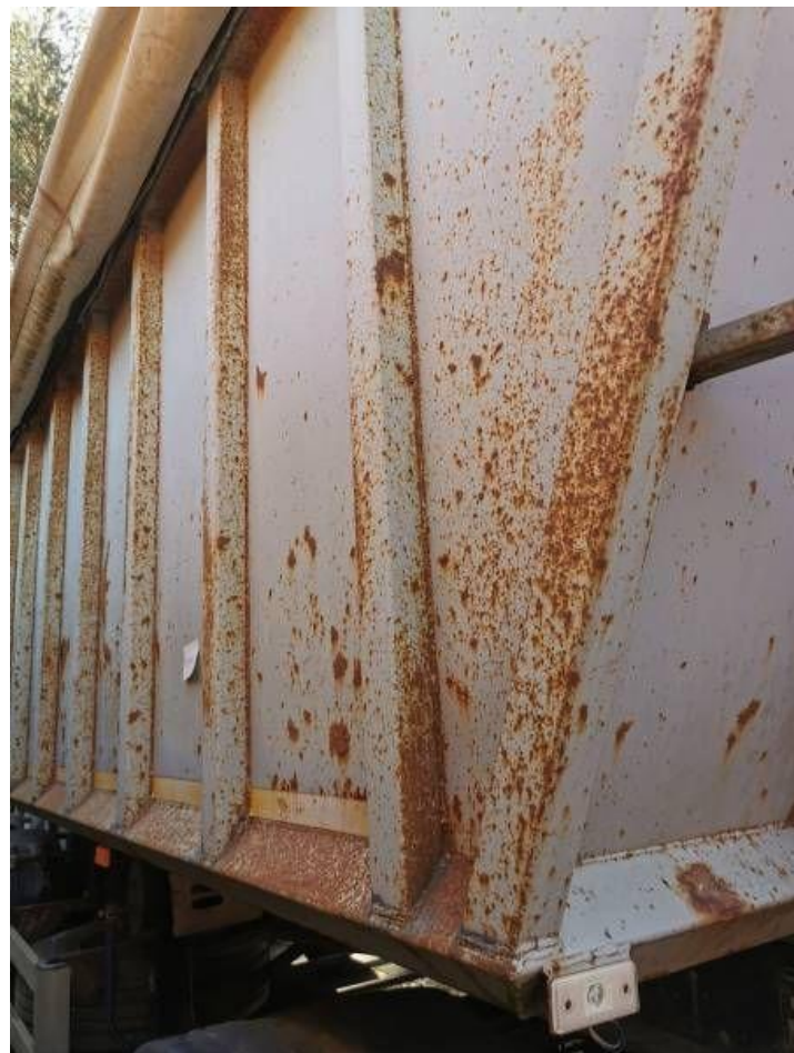
Fot. nr 34