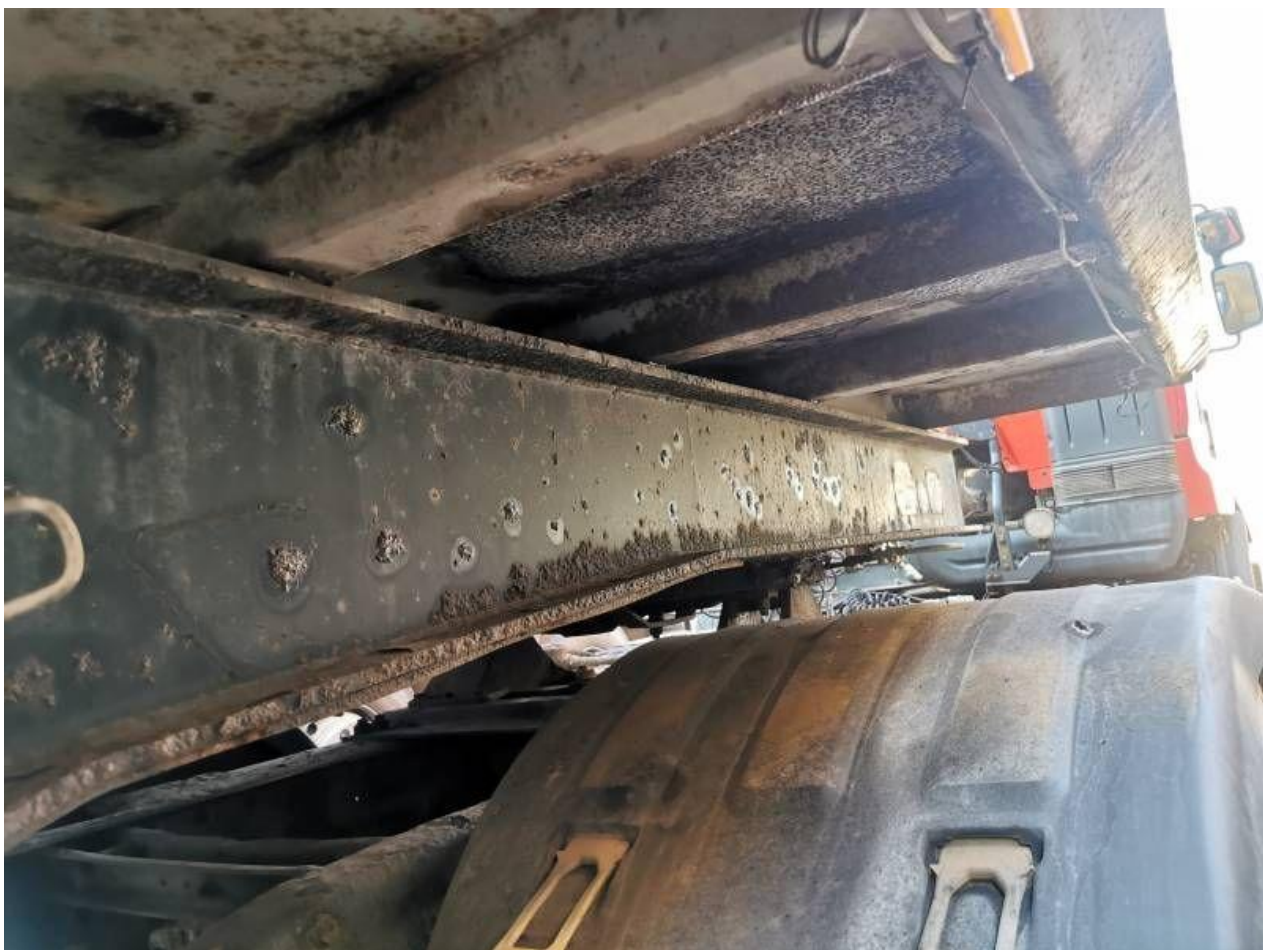
Fot. nr 78