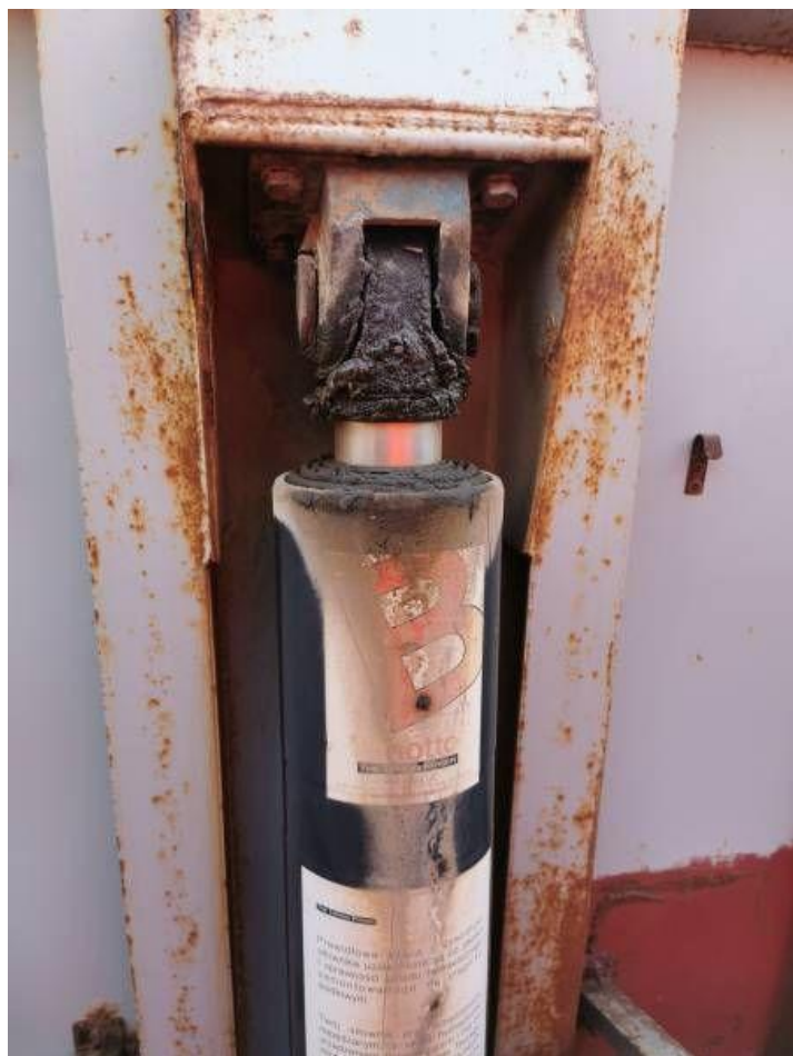
Fot. nr 26