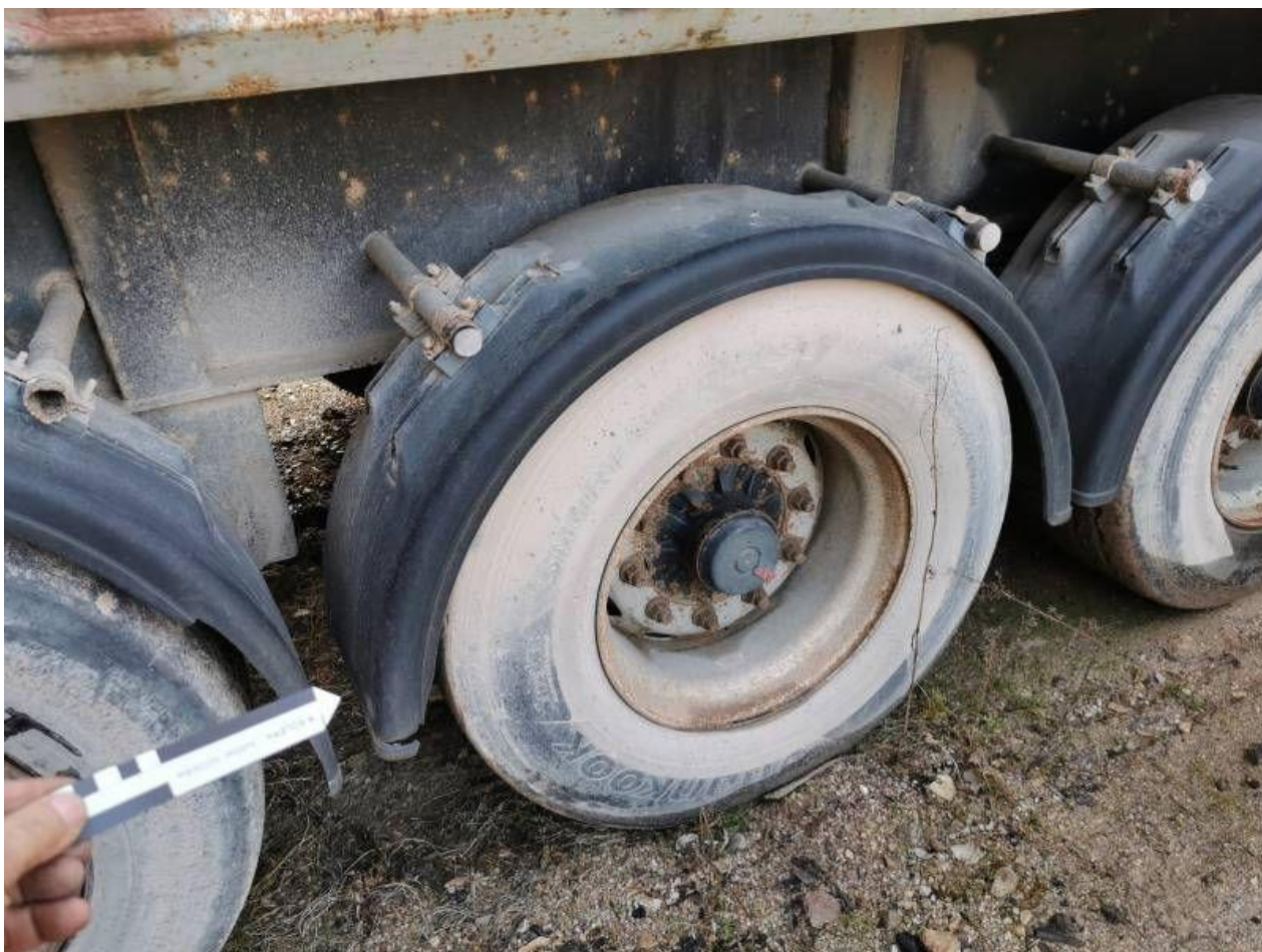
Fot. nr 102