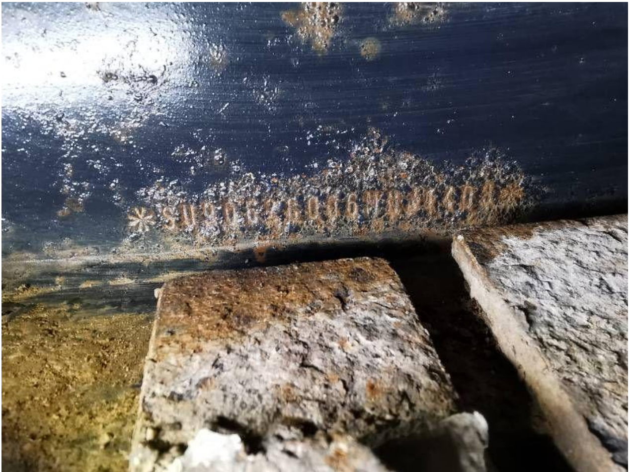
Fot. nr 11