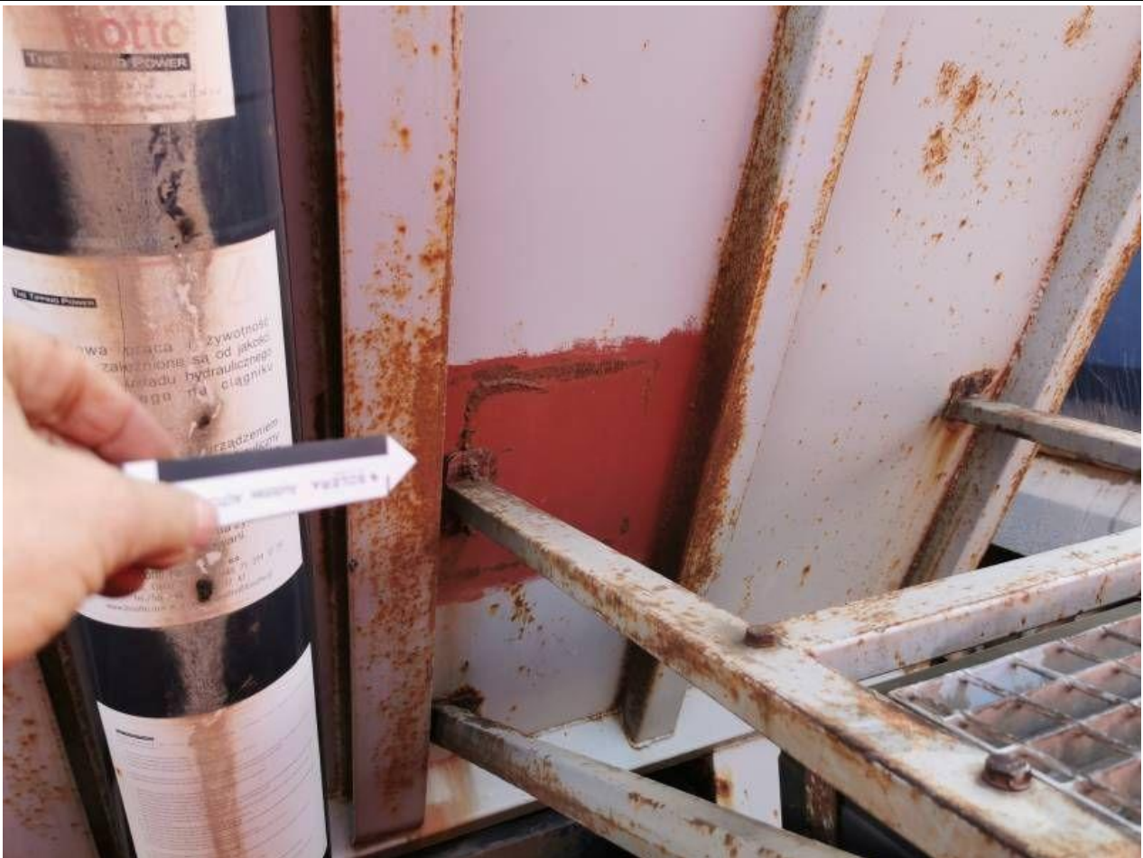
Fot. nr 23