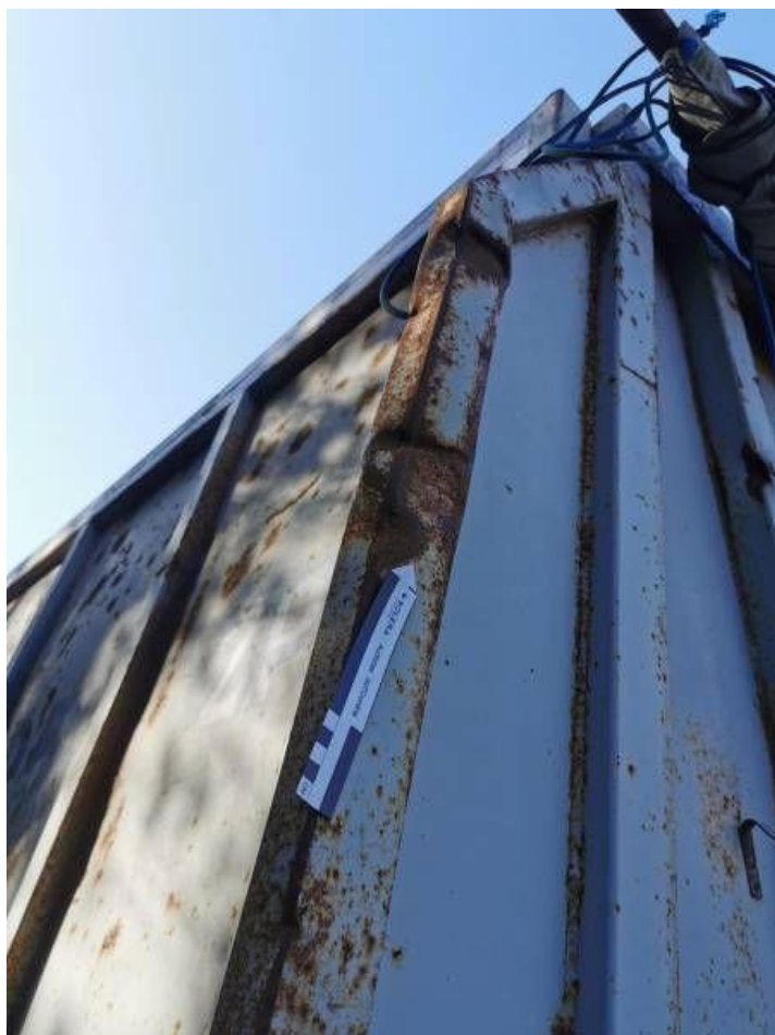
Fot. nr 42