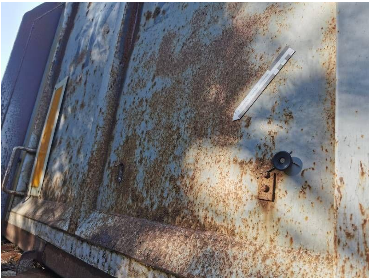
Fot. nr 49