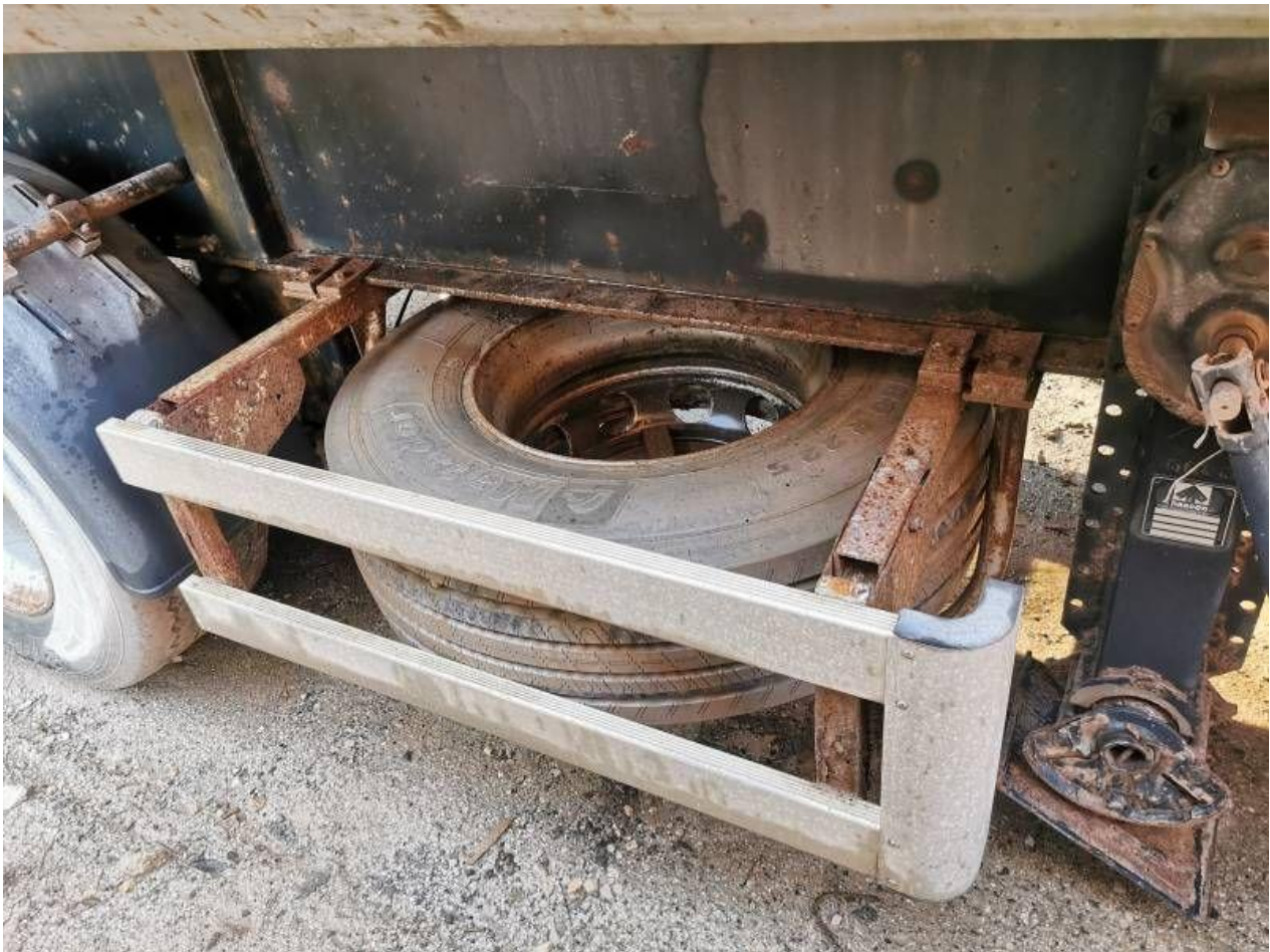
Fot. nr 83