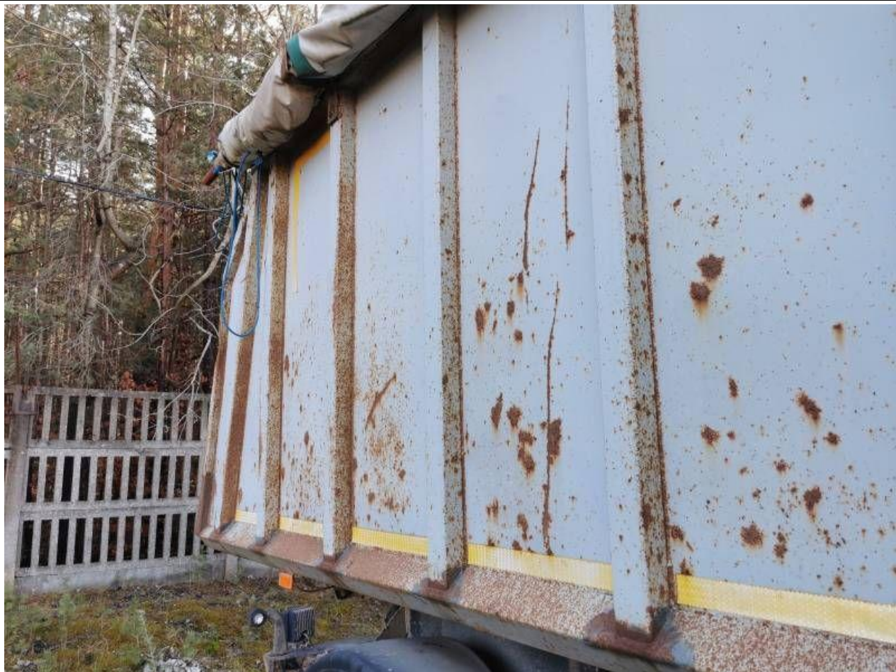
Fot. nr 39