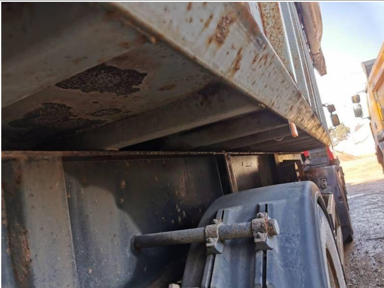
Fot. nr 75