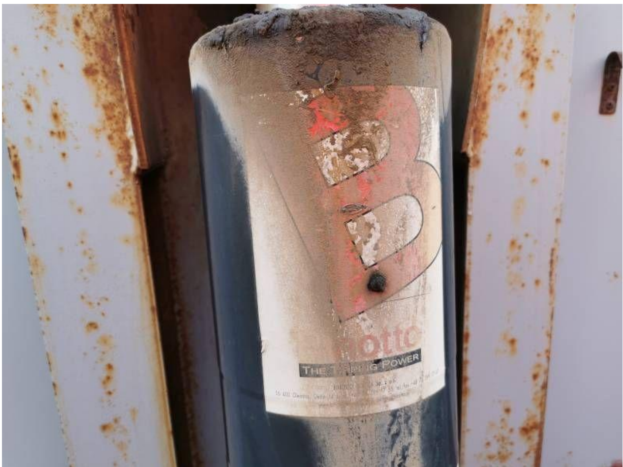
Fot. nr 28