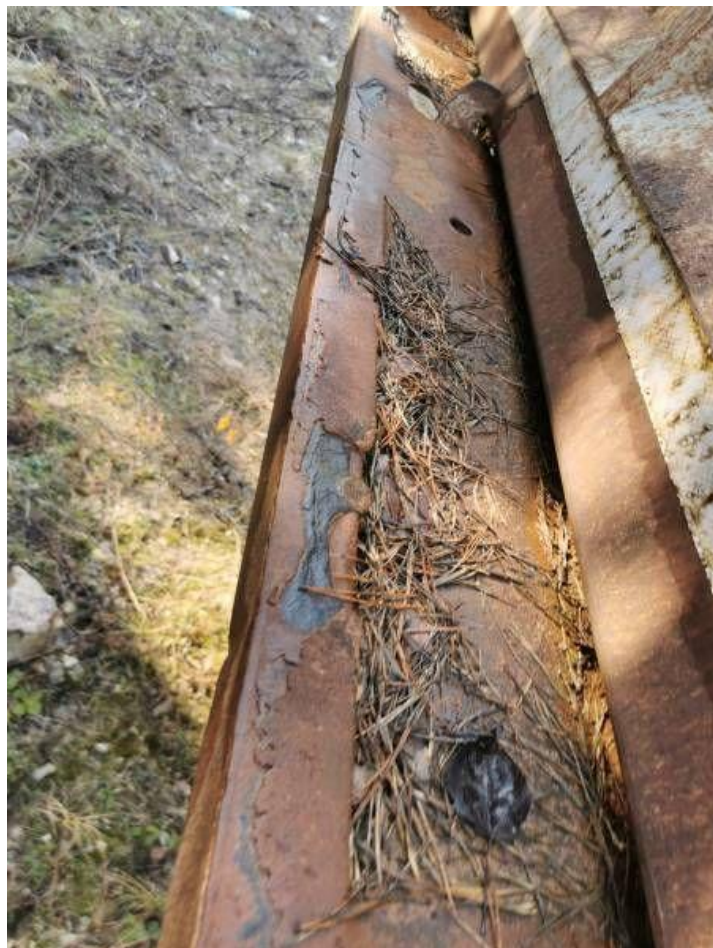
Fot. nr 52