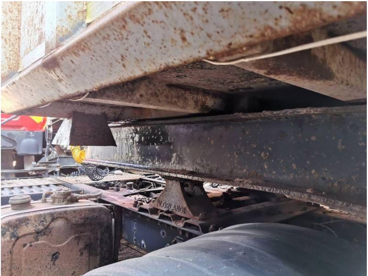
Fot. nr 71