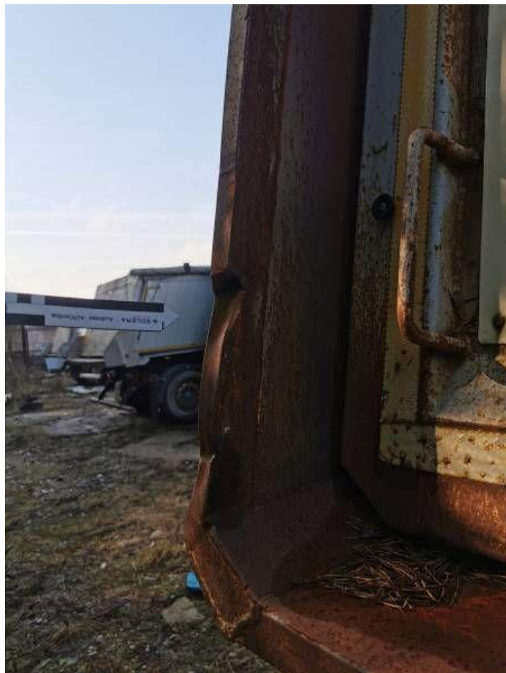
Fot. nr 54