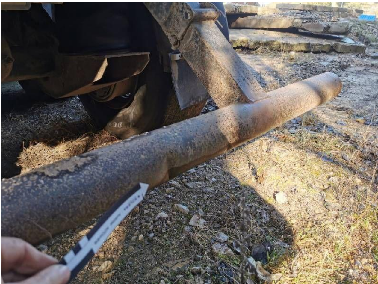
Fot. nr 96