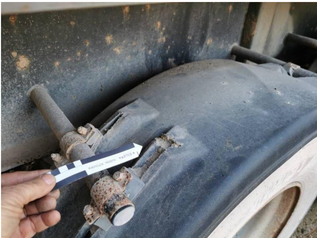
Fot. nr 104