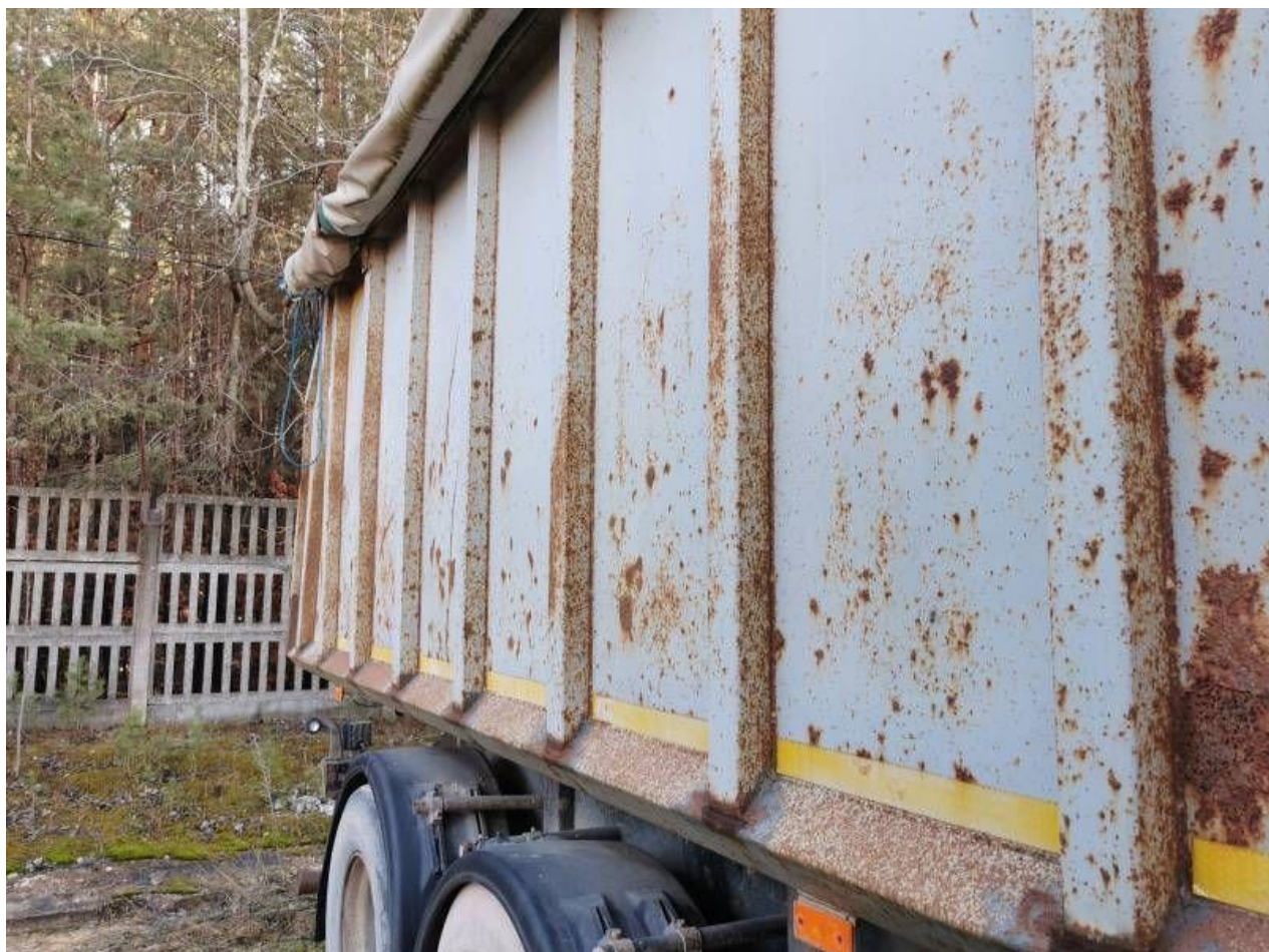
Fot. nr 38