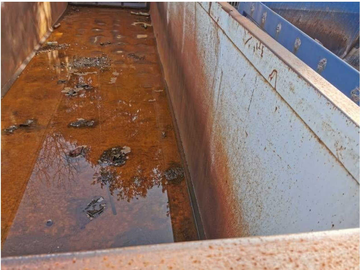
Fot. nr 16