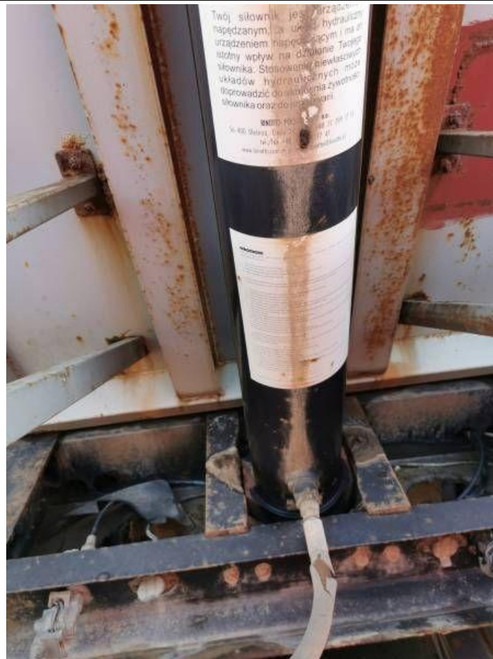
Fot. nr 27