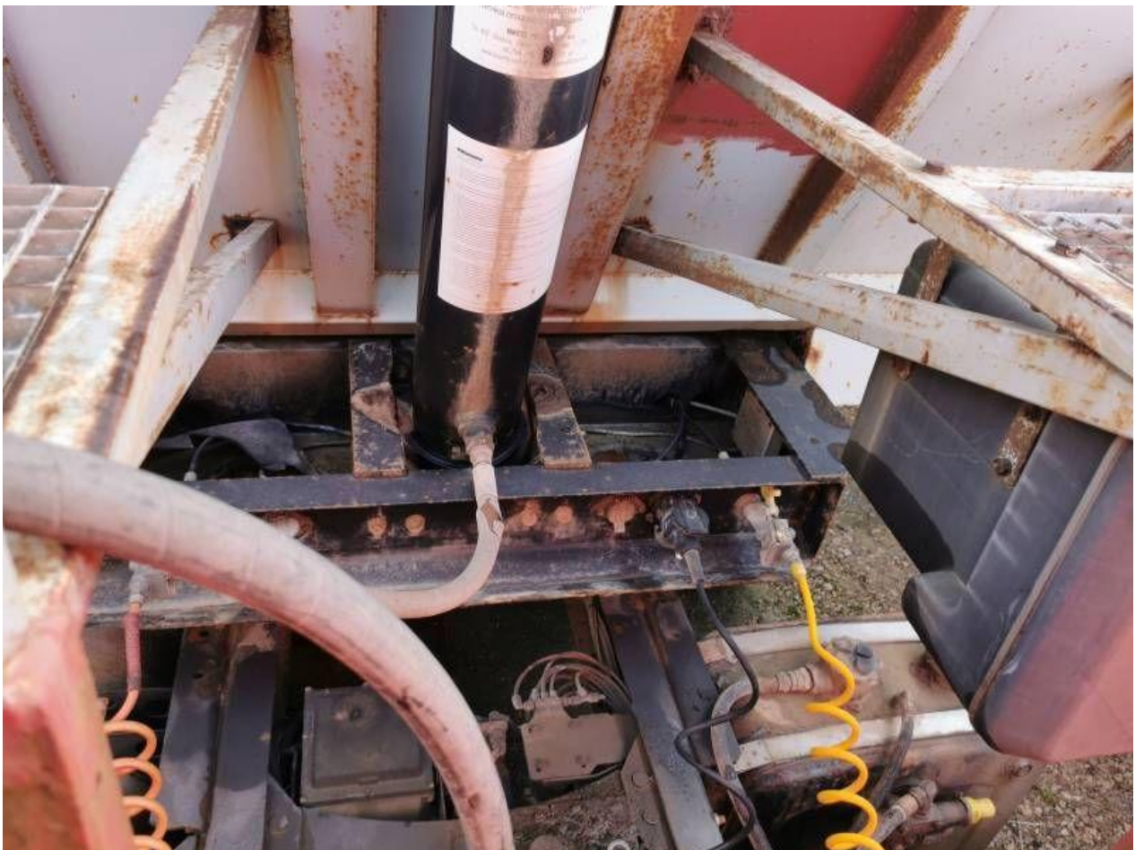
Fot. nr 24