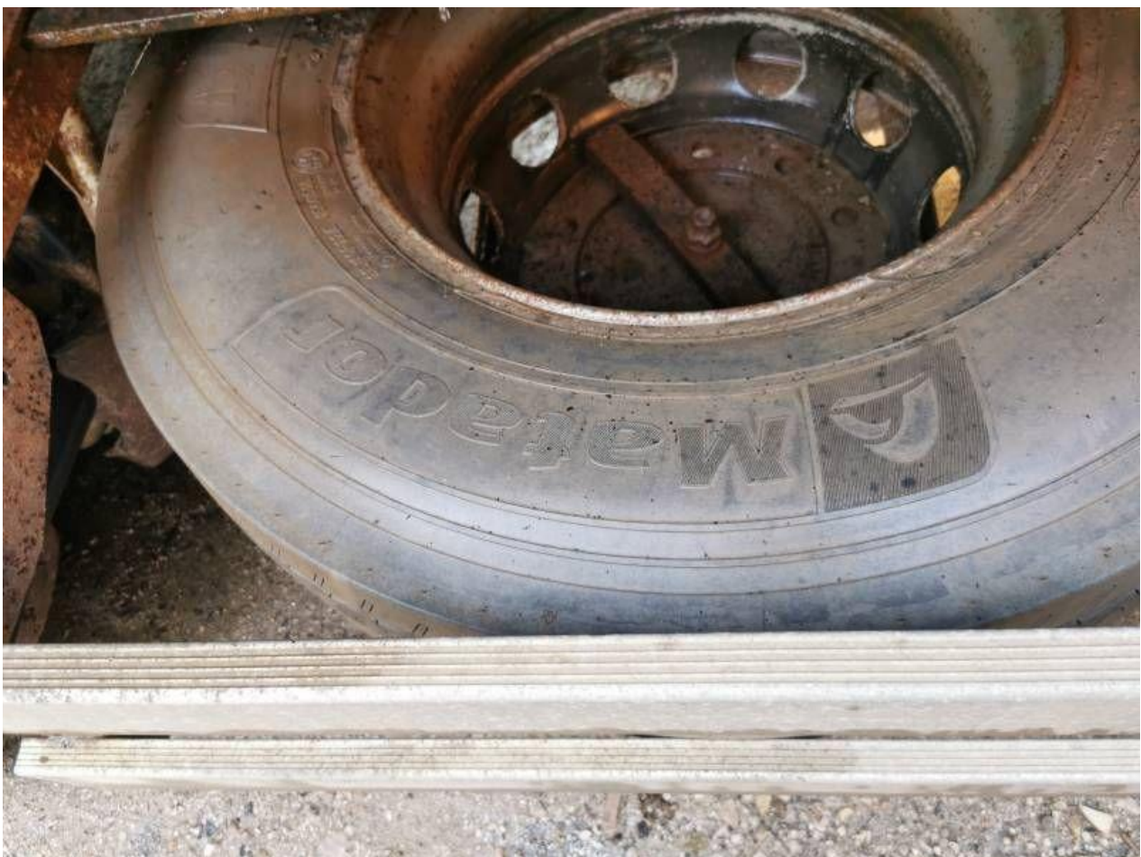
Fot. nr 84