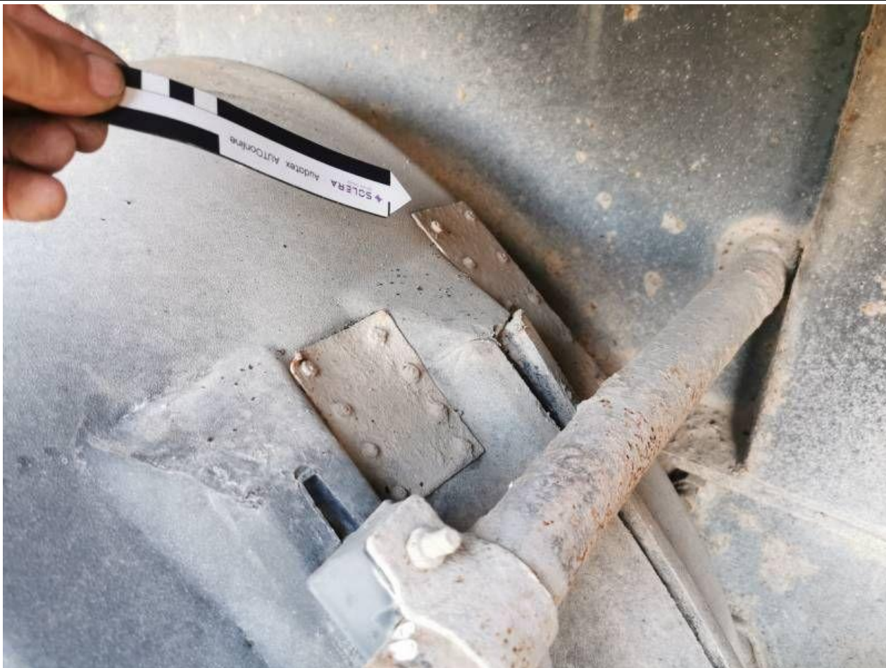
Fot. nr 101