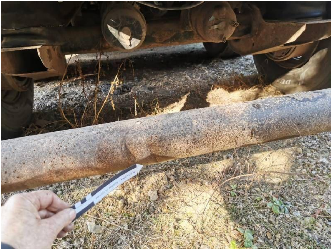
Fot. nr 97