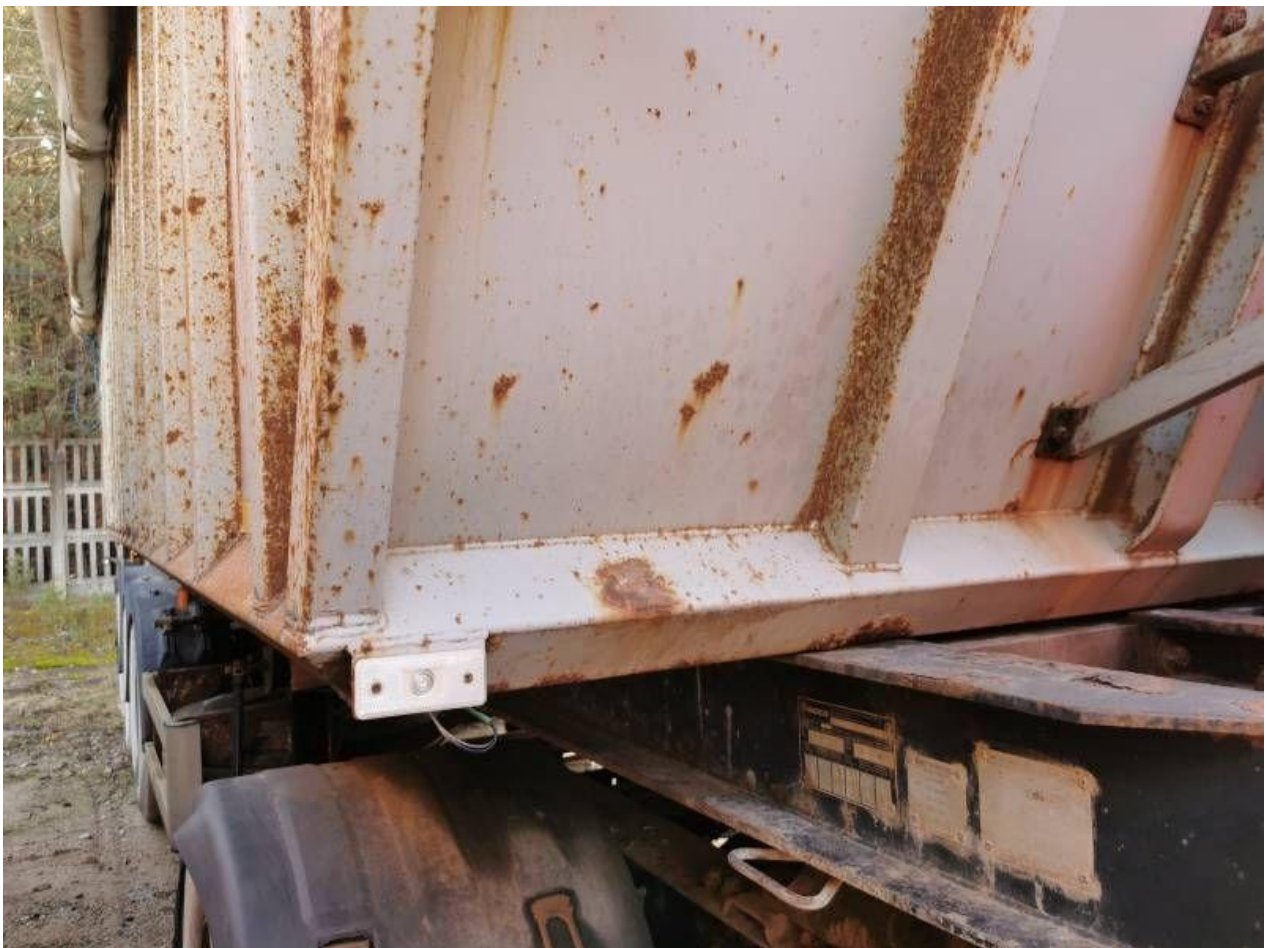
Fot. nr 32