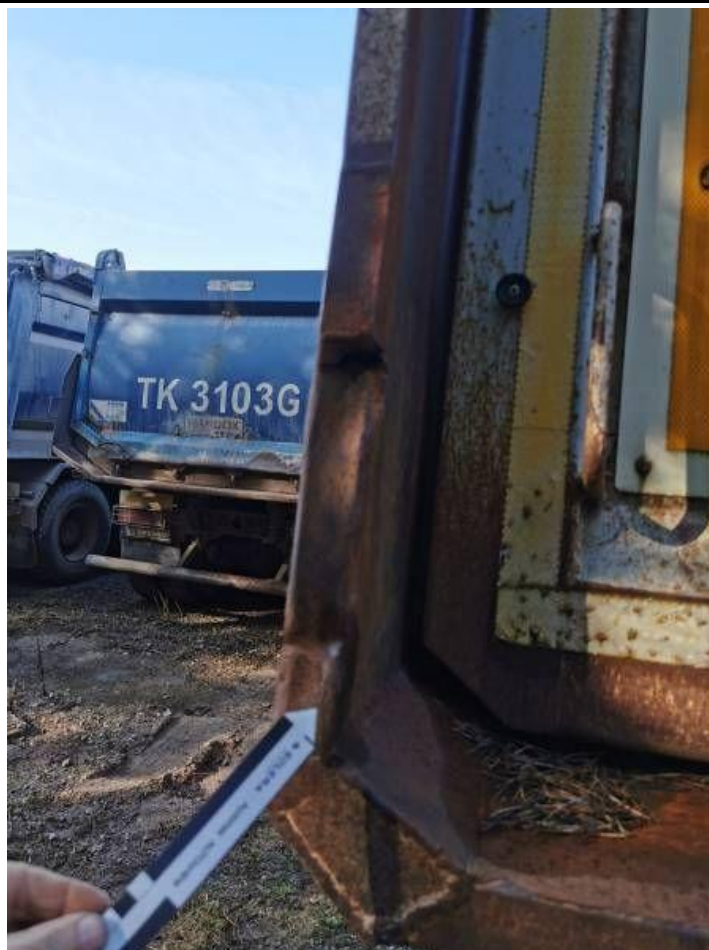
Fot. nr 55