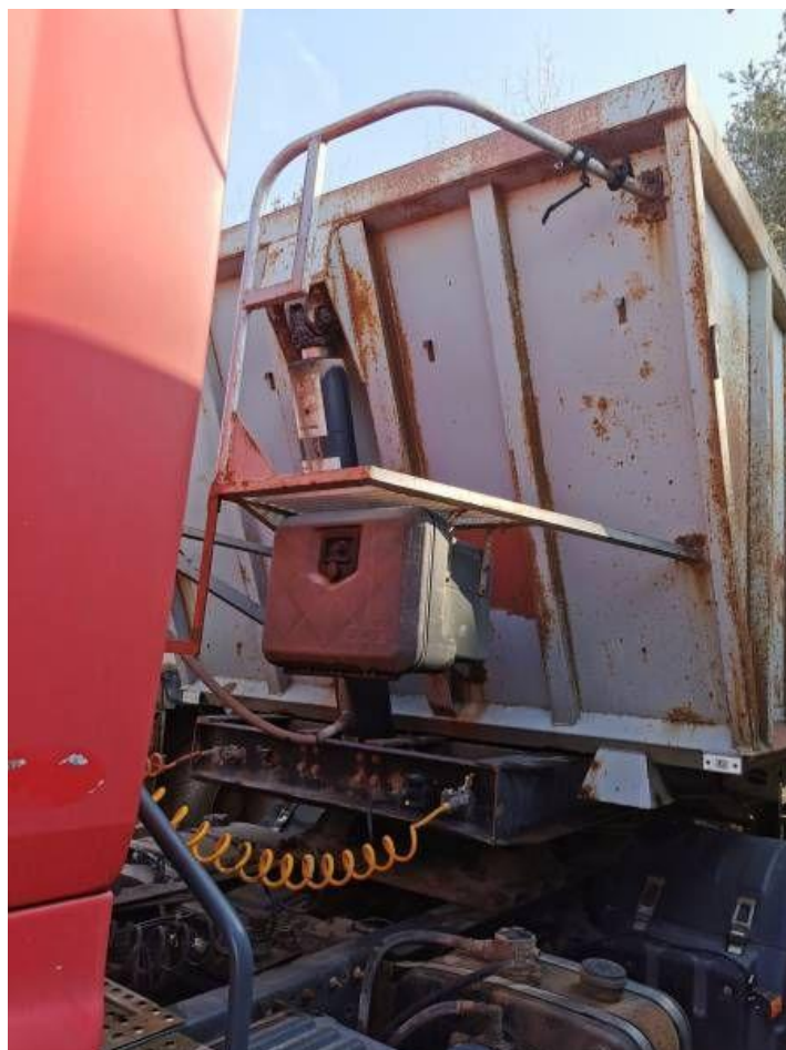
Fot. nr 8