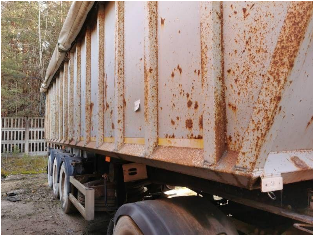
Fot. nr 33