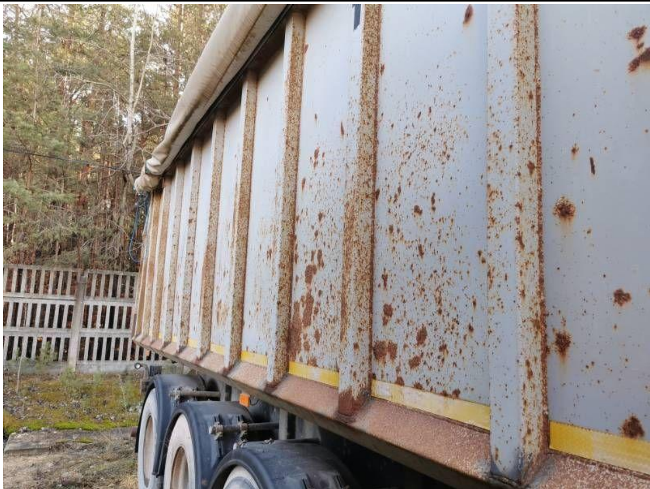
Fot. nr 37