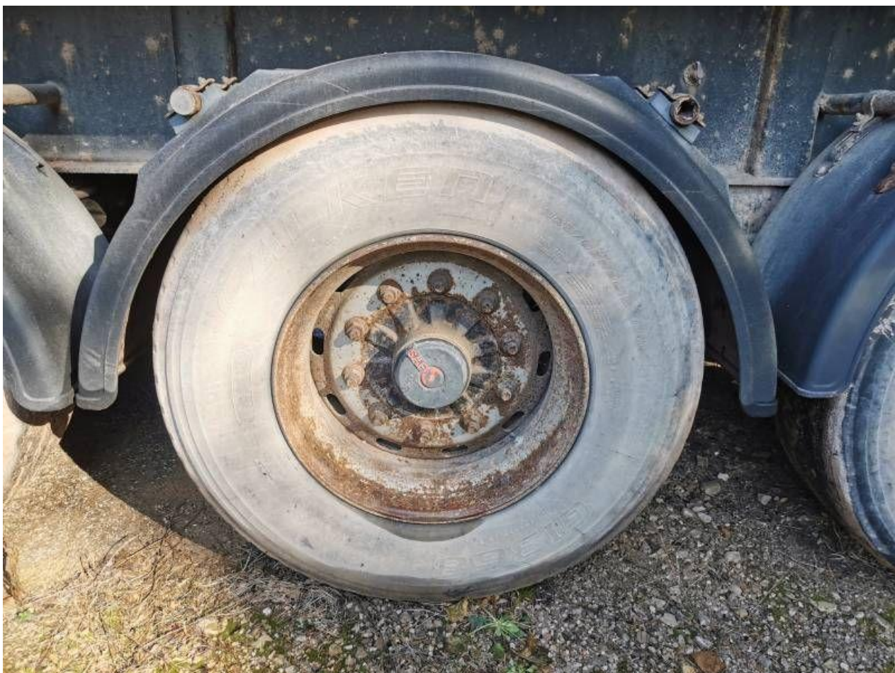
Fot. nr 90