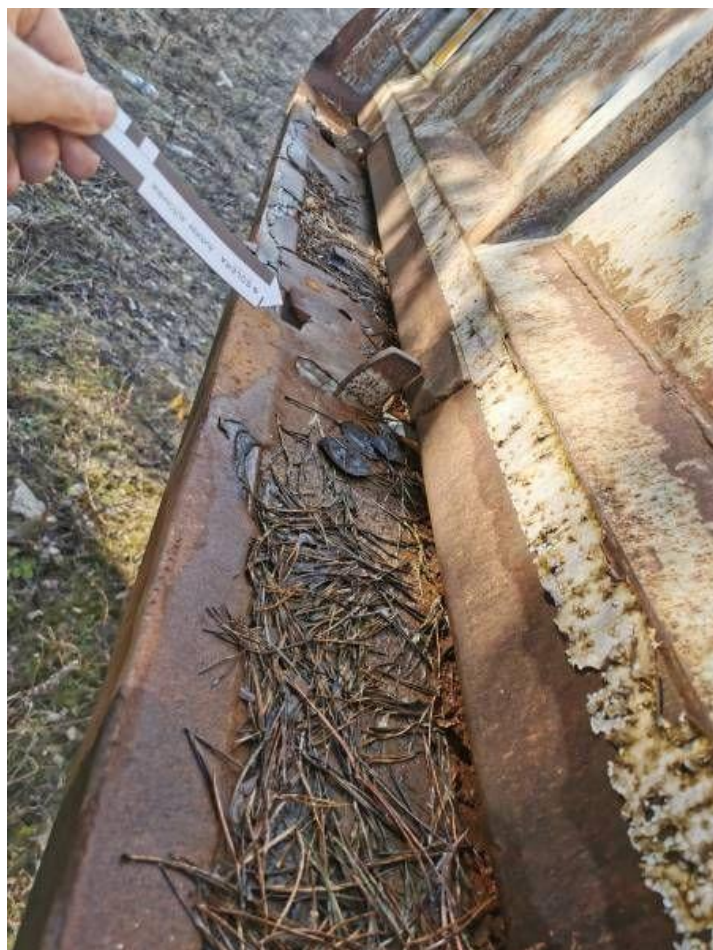
Fot. nr 50