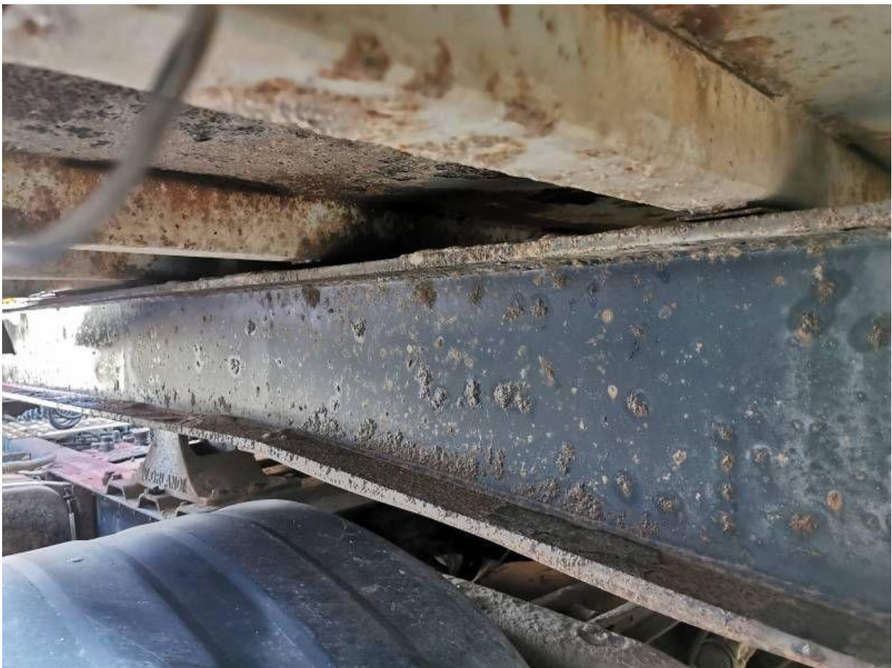
Fot. nr 70