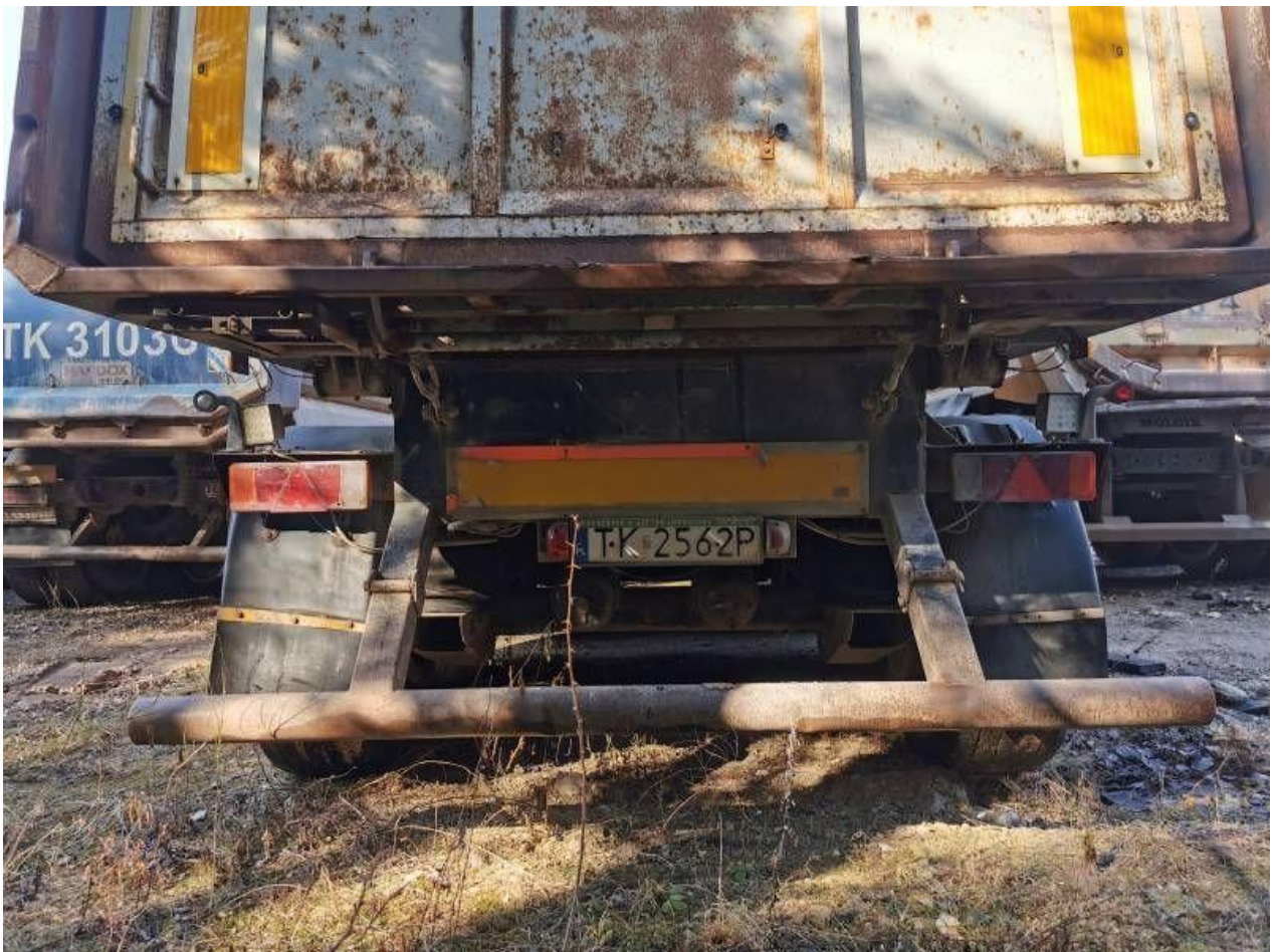
Fot. nr 60