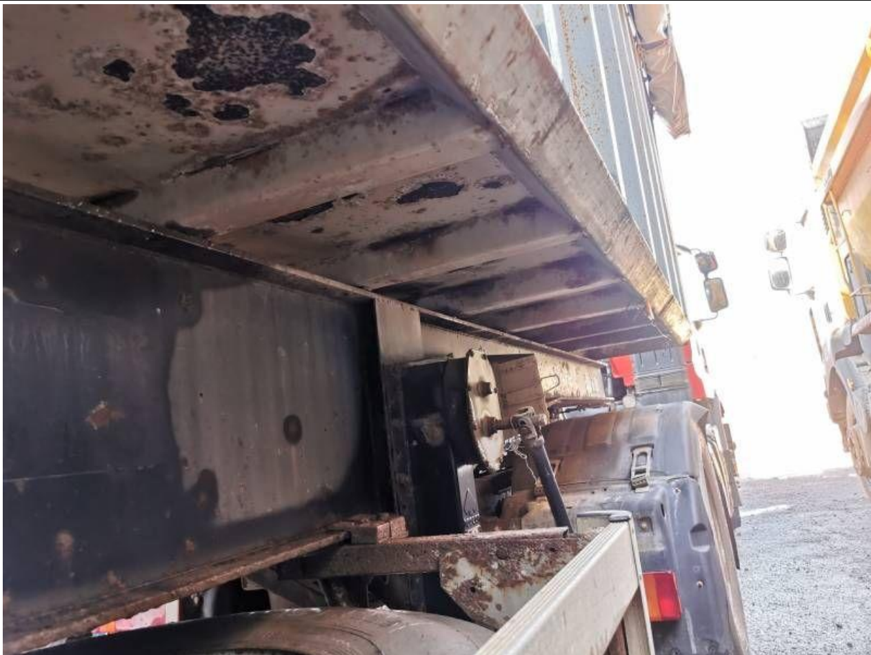
Fot. nr 77