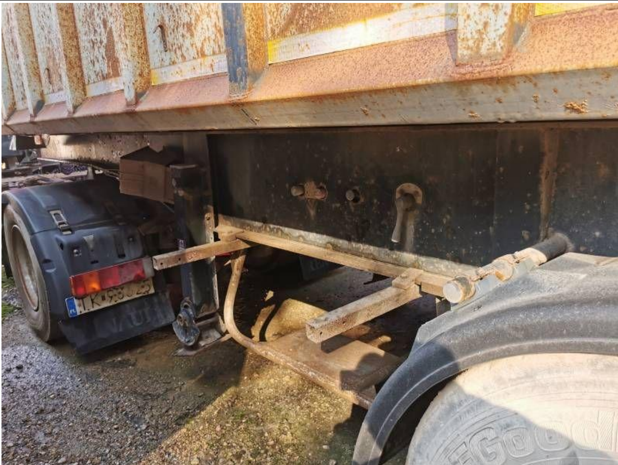
Fot. nr 65