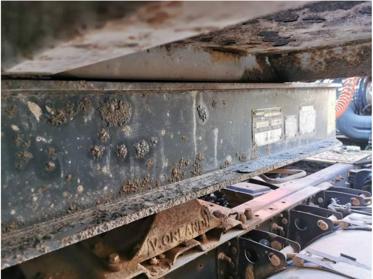
Fot. nr 81