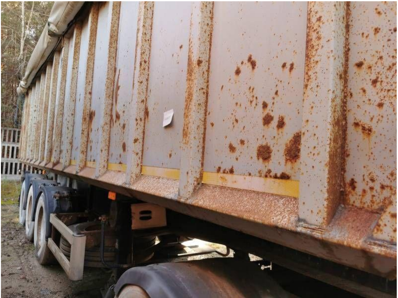
Fot. nr 35