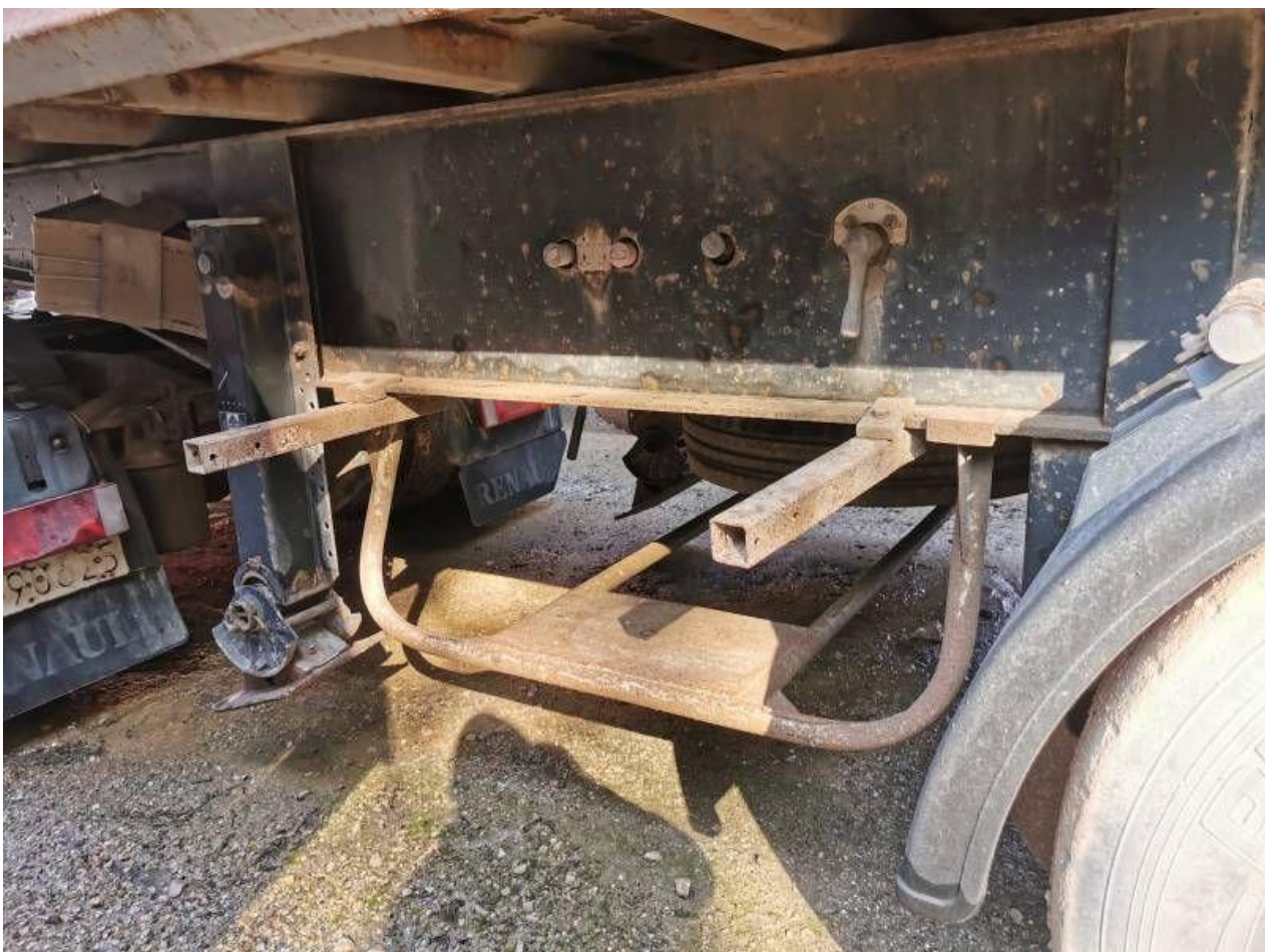
Fot. nr 66