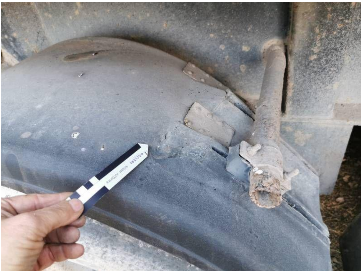
Fot. nr 100