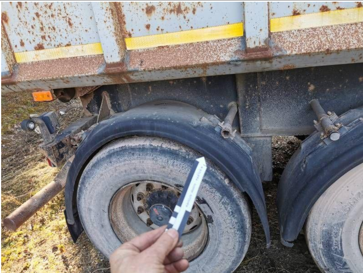
Fot. nr 99