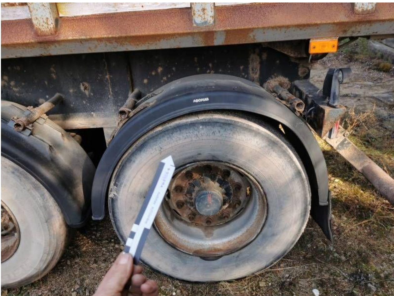
Fot. nr 94