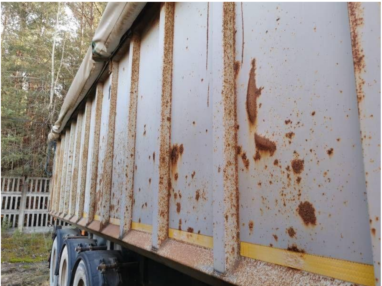
Fot. nr 36