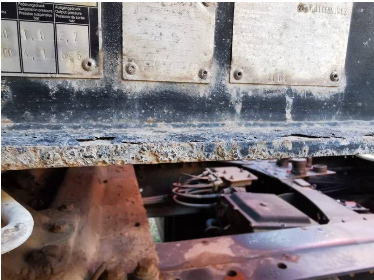
Fot. nr 108