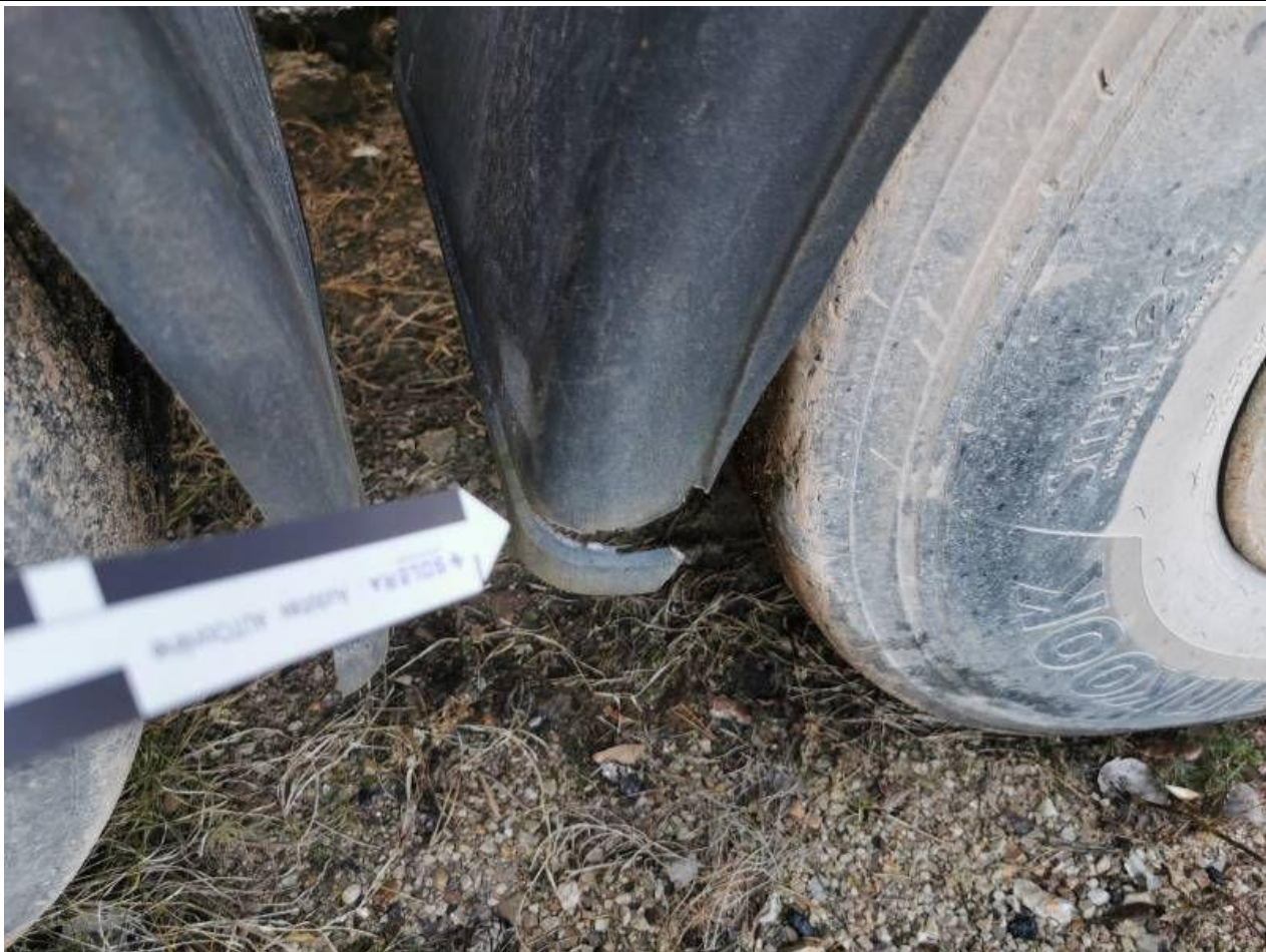
Fot. nr 103