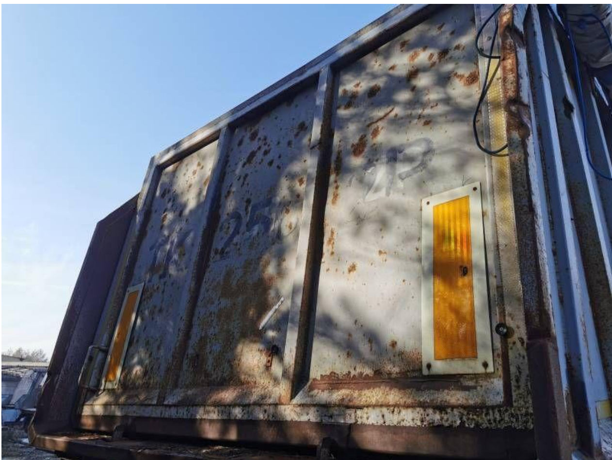
Fot. nr 48