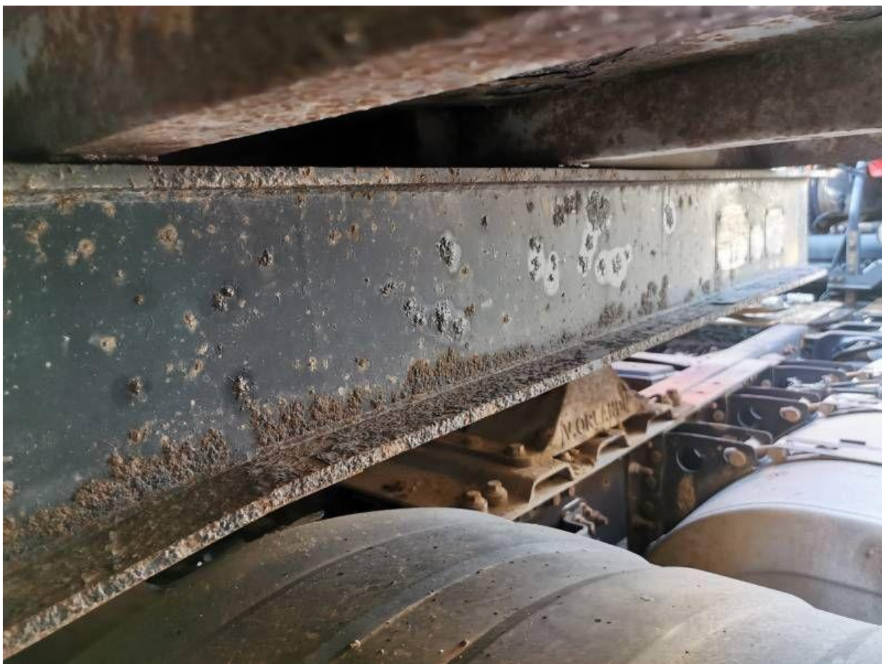
Fot. nr 80