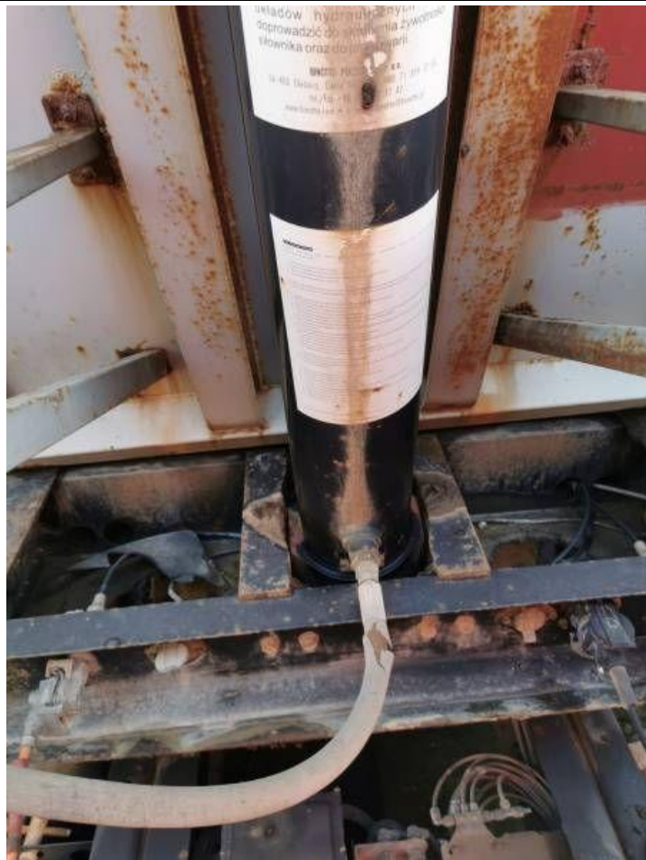
Fot. nr 25