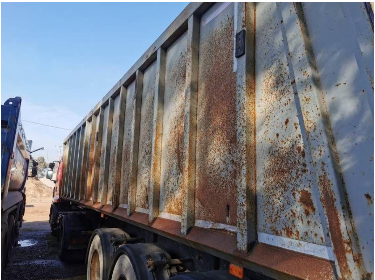
Fot. nr 58