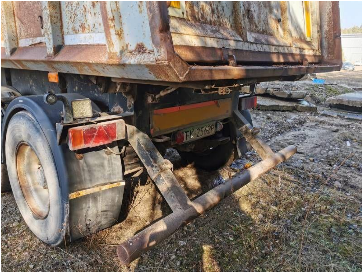
Fot. nr 59