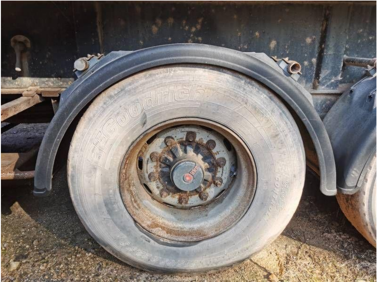
Fot. nr 91