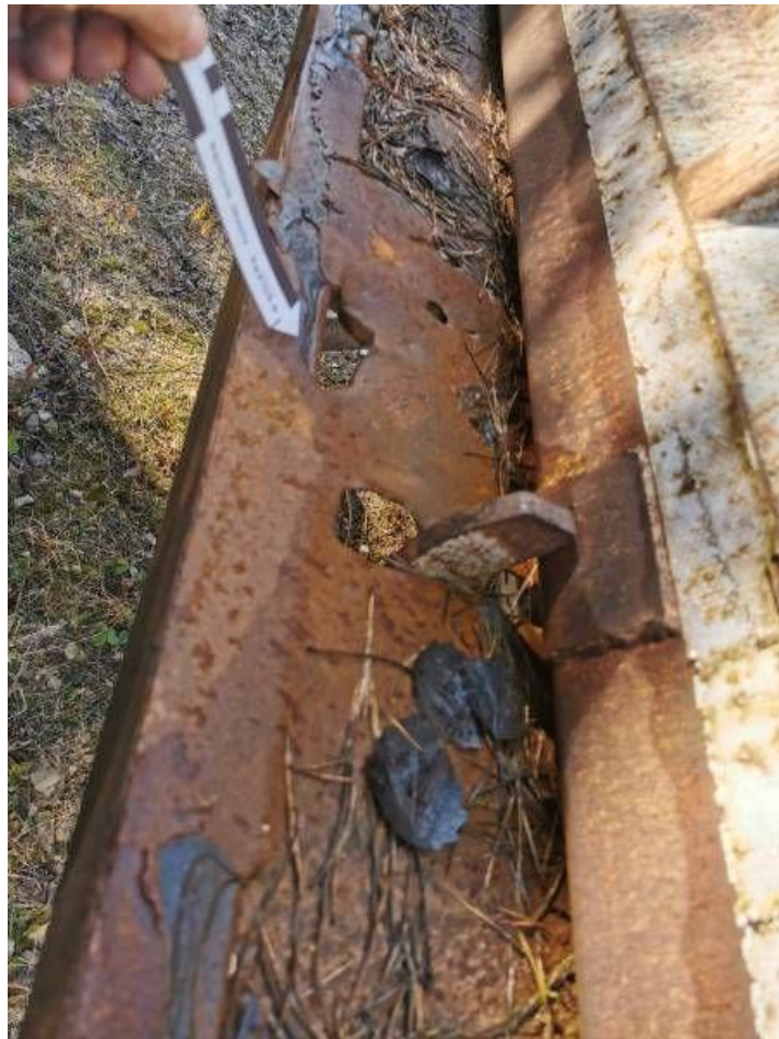
Fot. nr 51