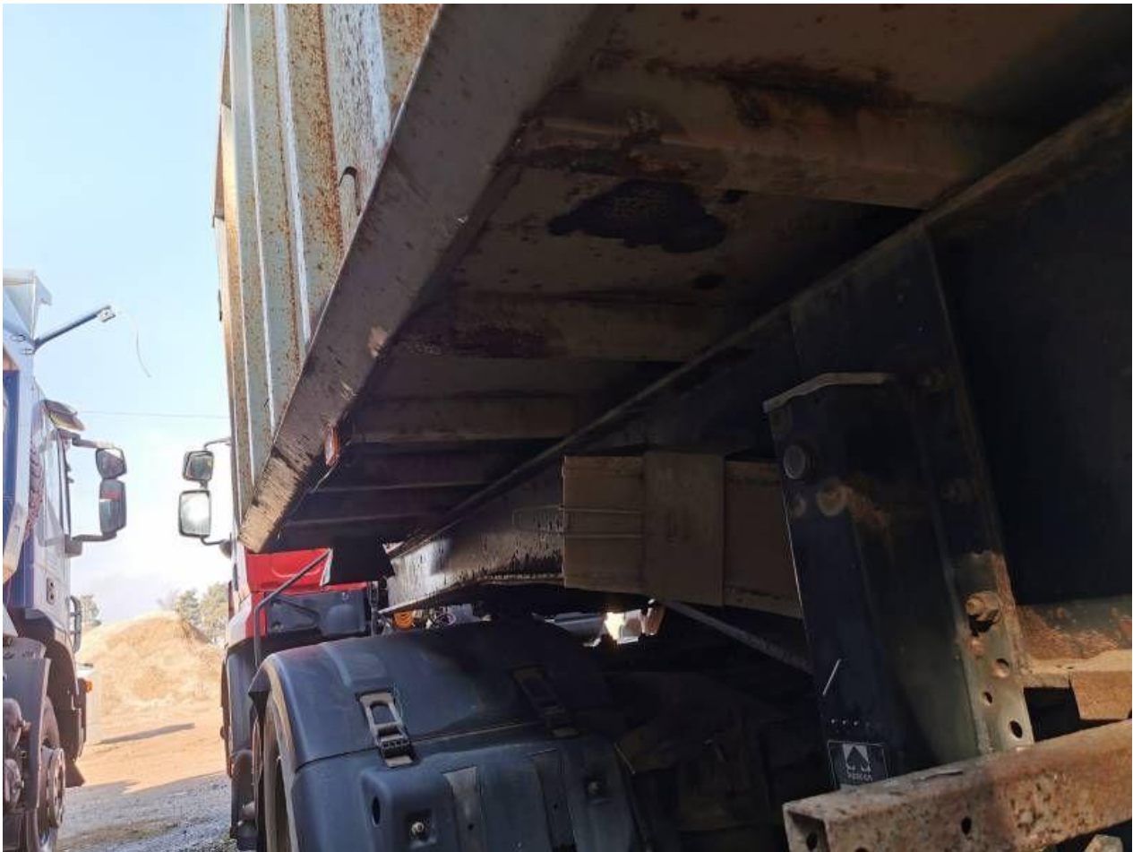
Fot. nr 69