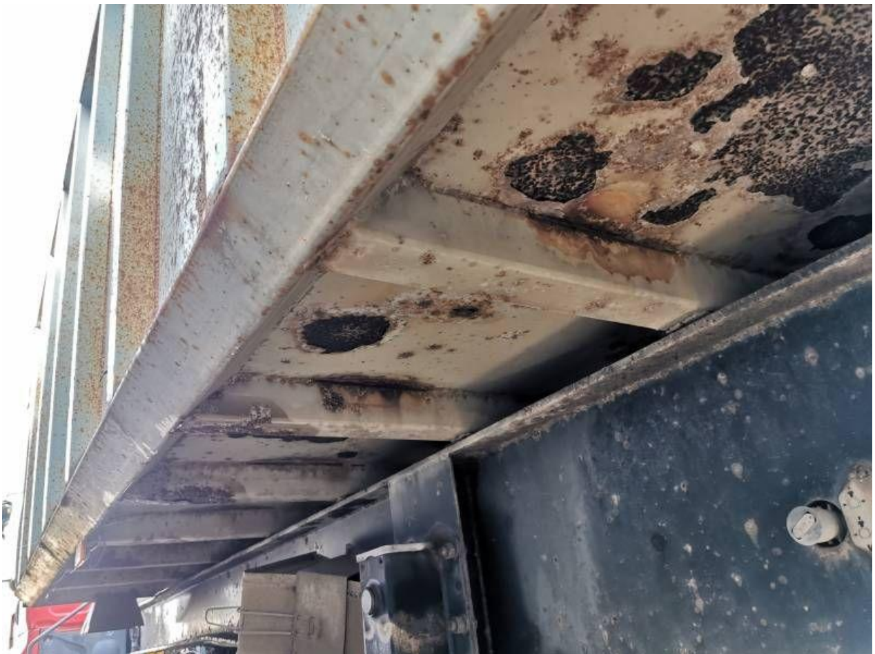
Fot. nr 68