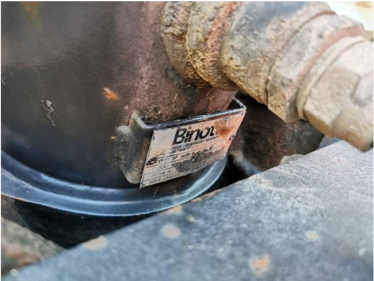
Fot. nr 29