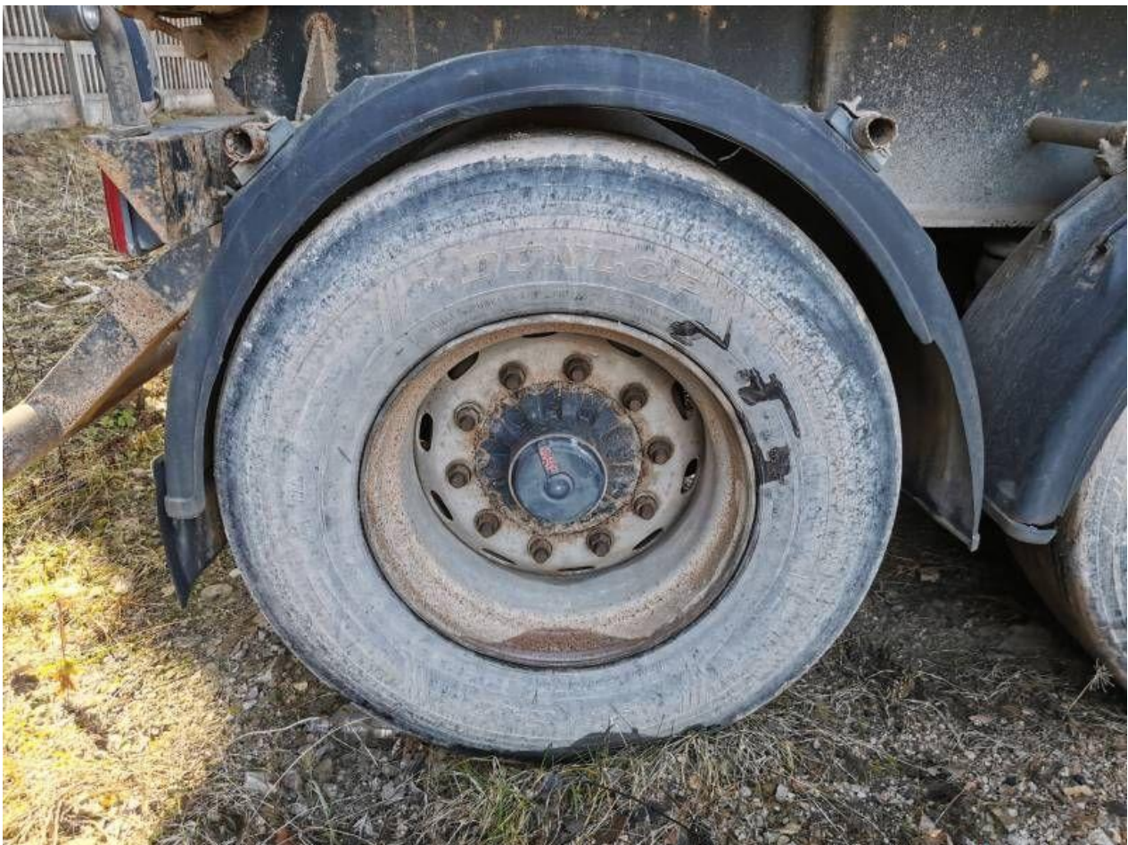
Fot. nr 88