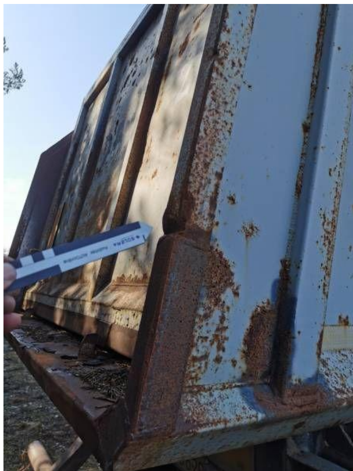
Fot. nr 40