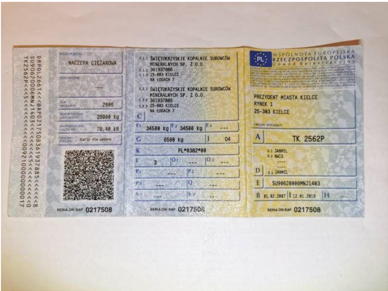
Fot. nr 110

Dokument wystawiony elektronicznie, wa ny bez podpisu