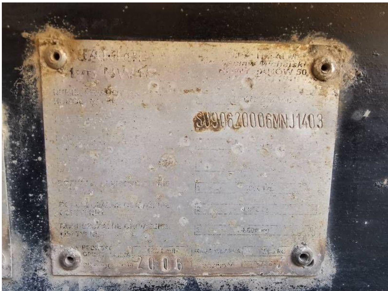
Fot. nr 14