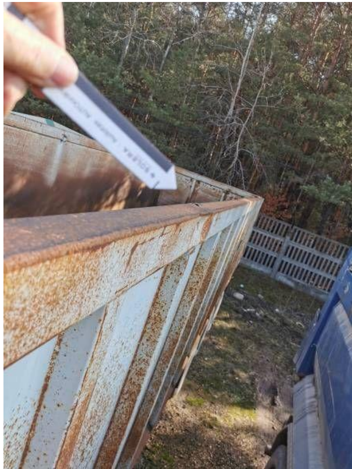
Fot. nr 19