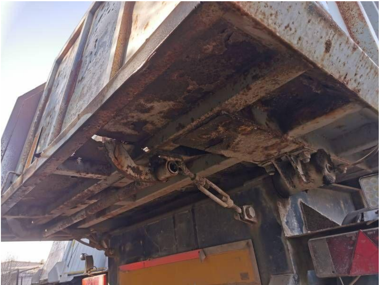
Fot. nr 61