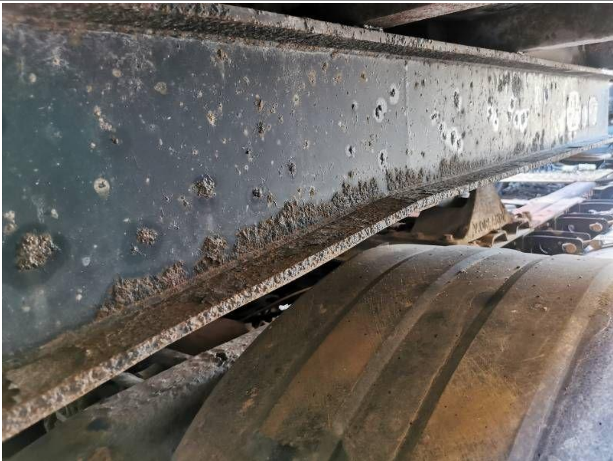
Fot. nr 79