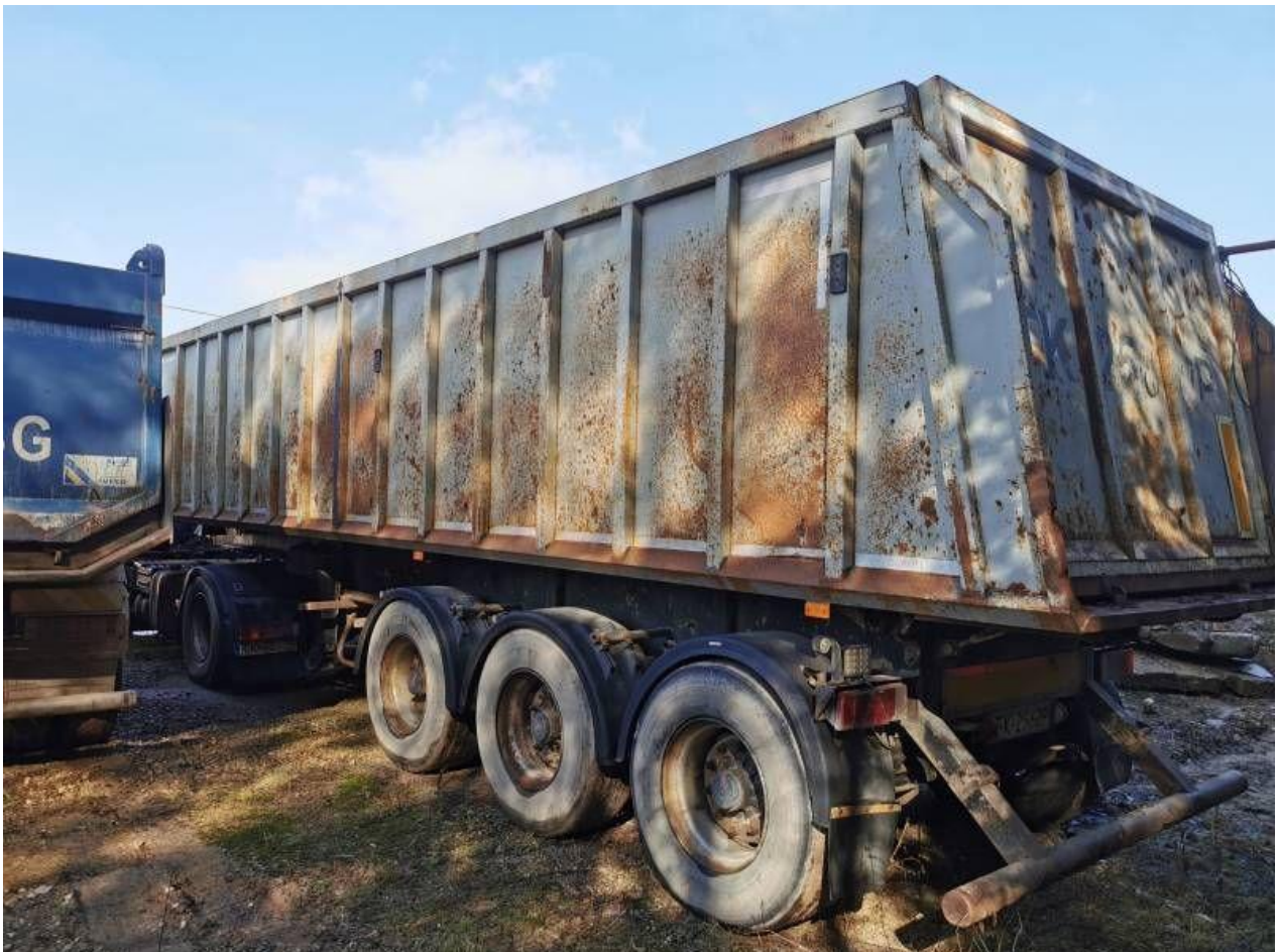
Fot. nr 2