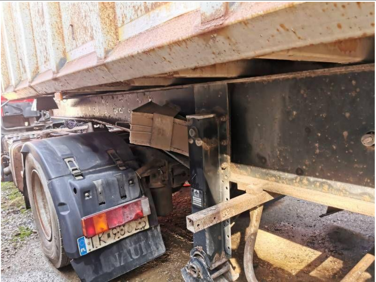
Fot. nr 67