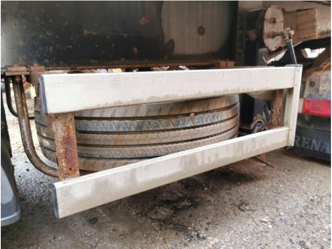
Fot. nr 85