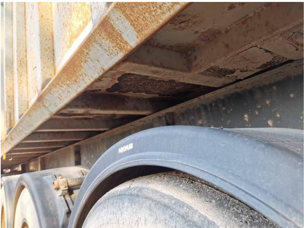
Fot. nr 64