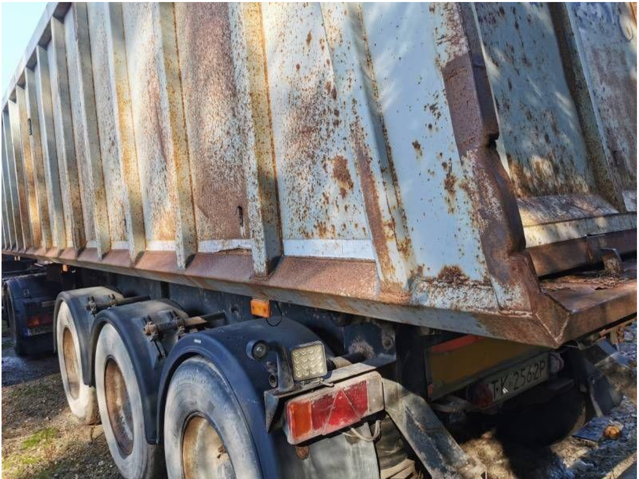
Fot. nr 57