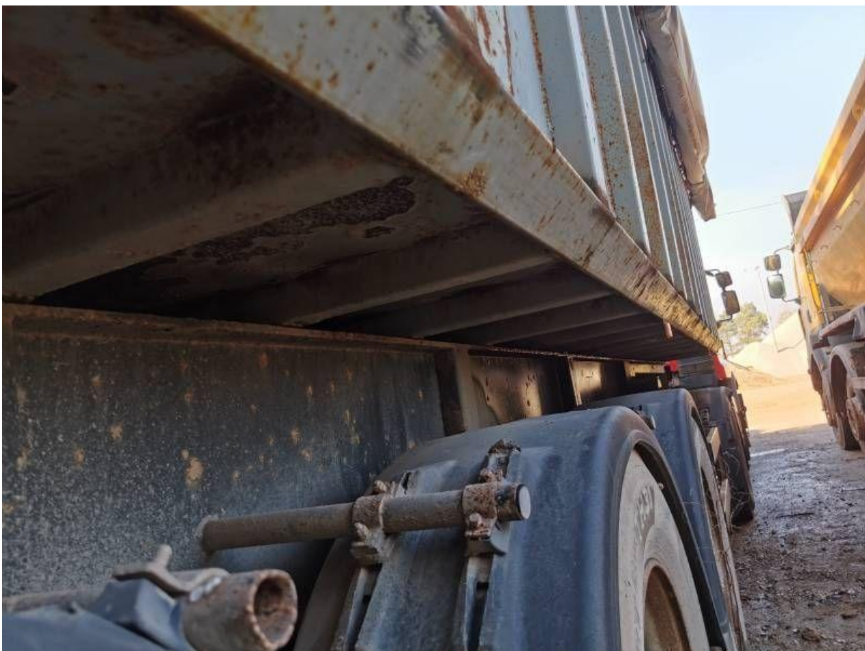
Fot. nr 74