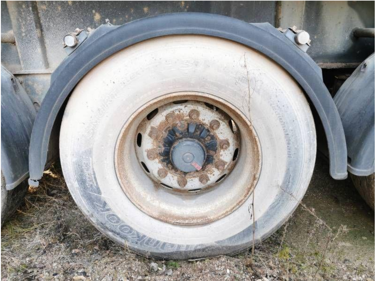
Fot. nr 87