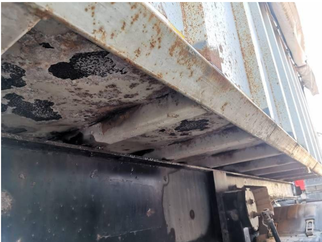
Fot. nr 76