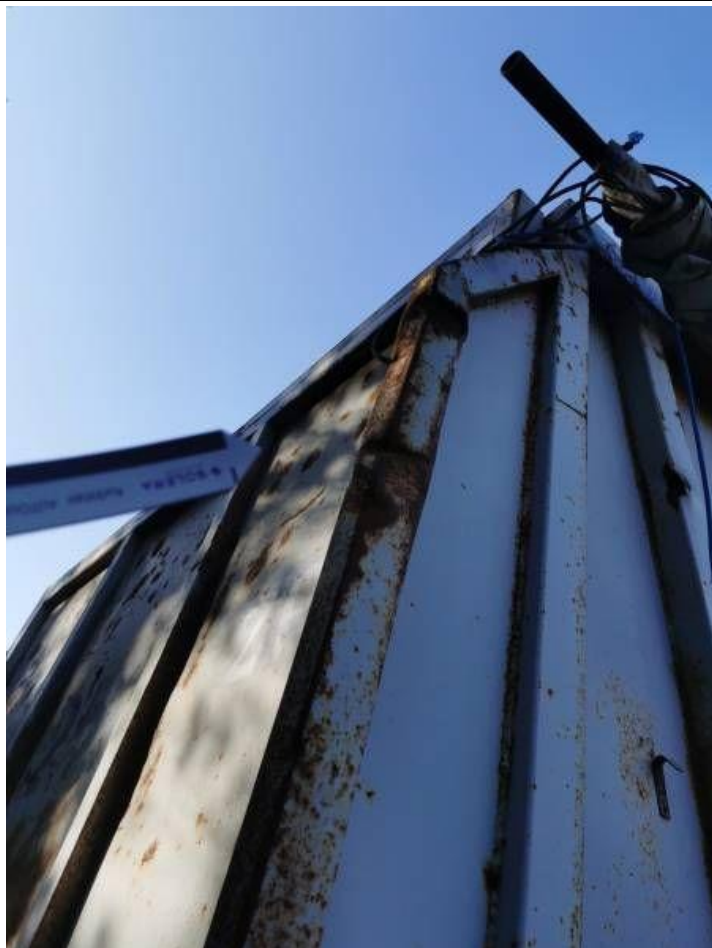
Fot. nr 41