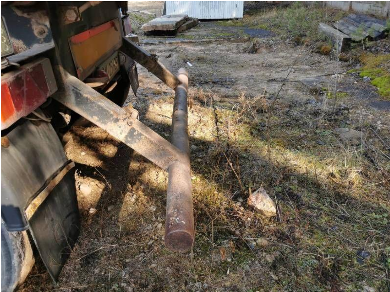
Fot. nr 95