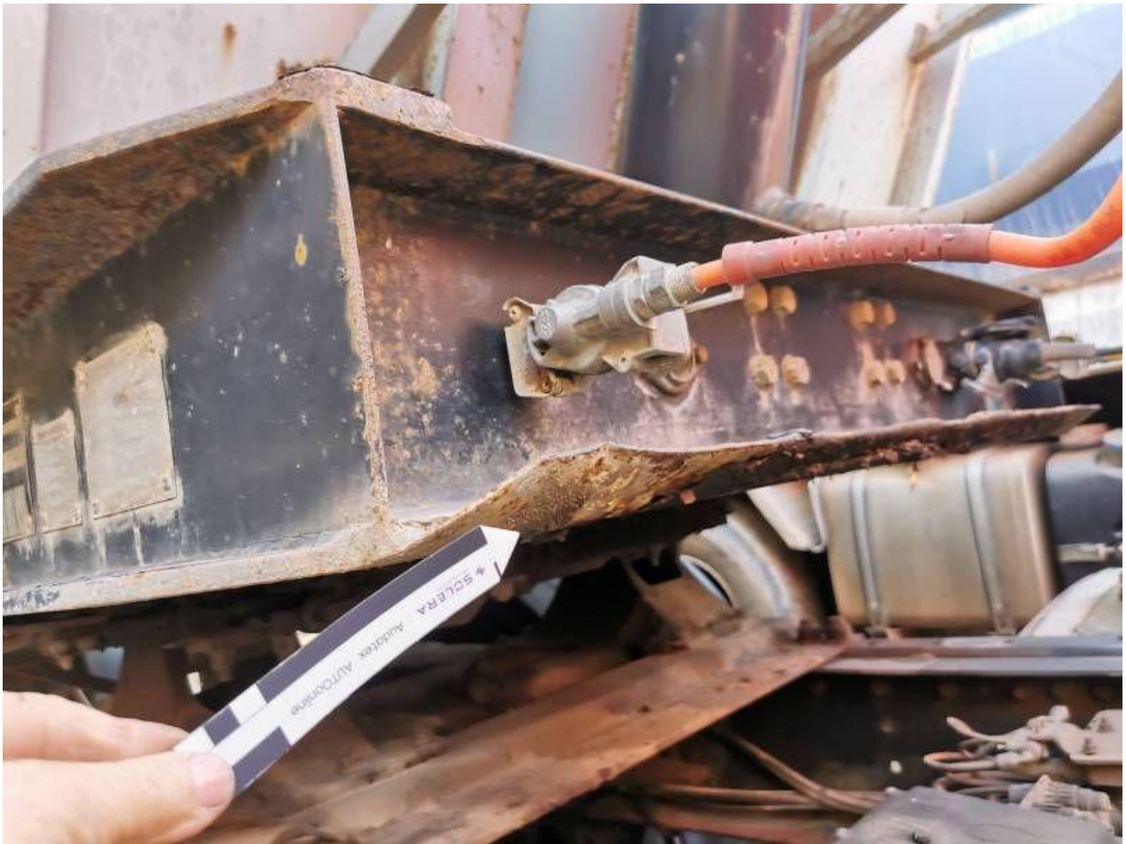
Fot. nr 31