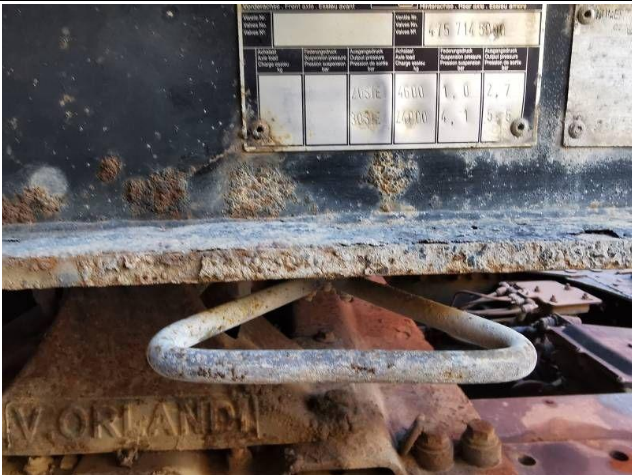
Fot. nr 107