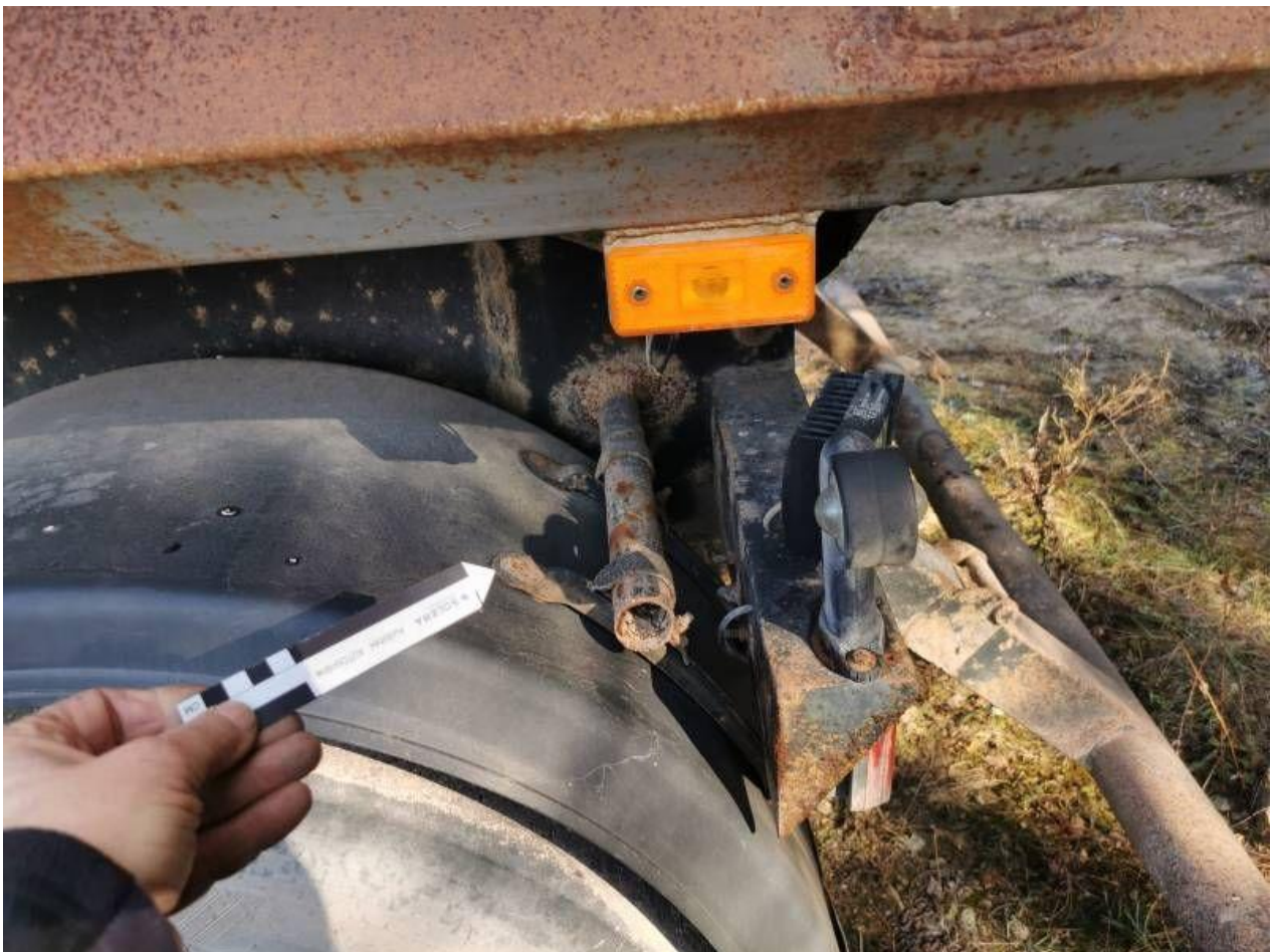
Fot. nr 92