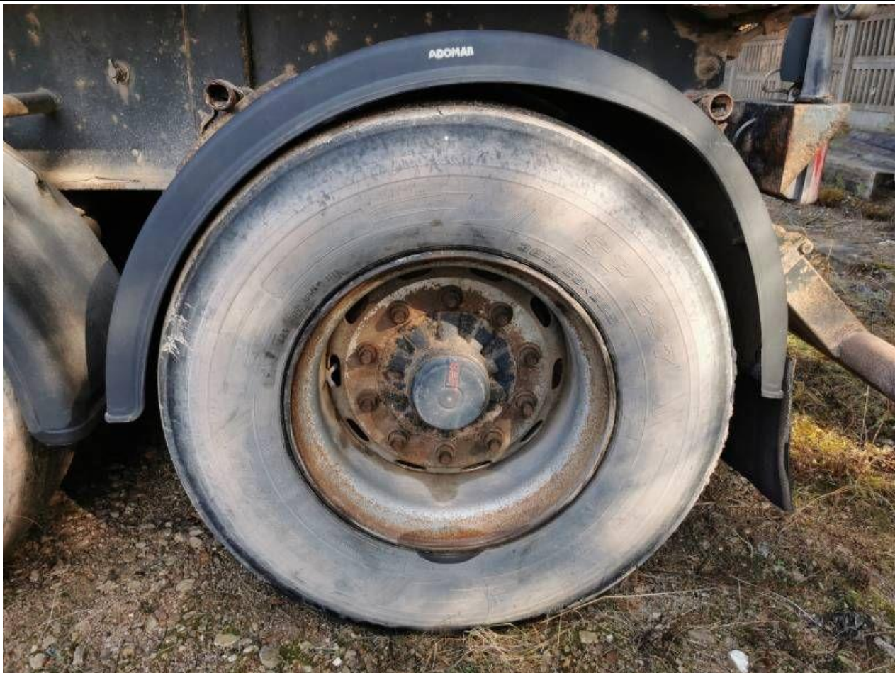
Fot. nr 89