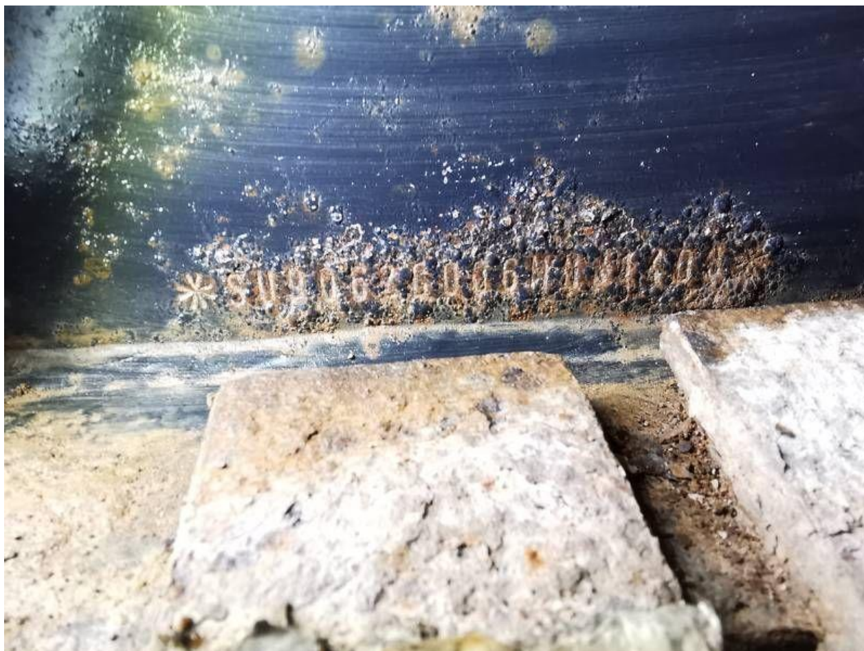
Fot. nr 10