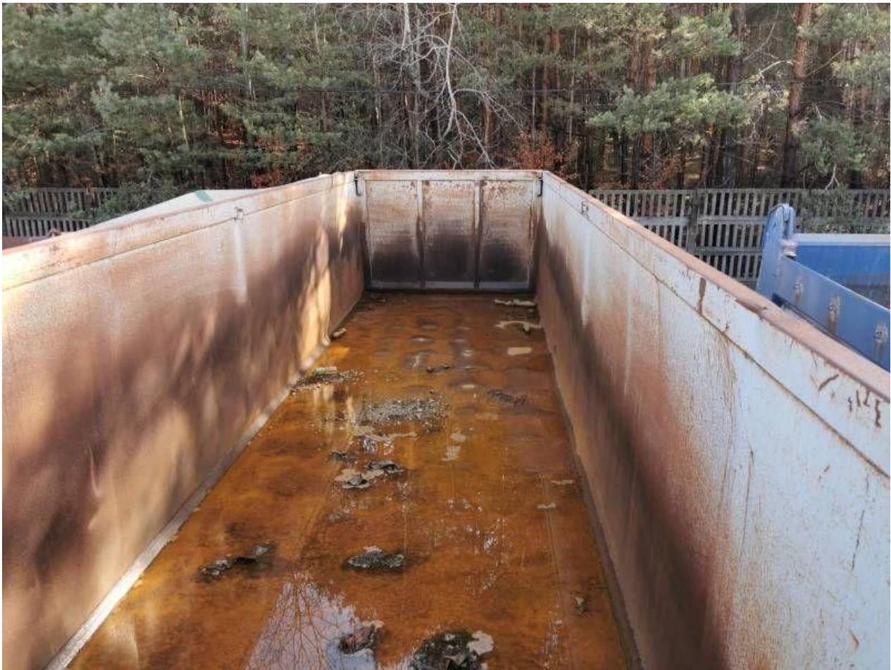
Fot. nr 15