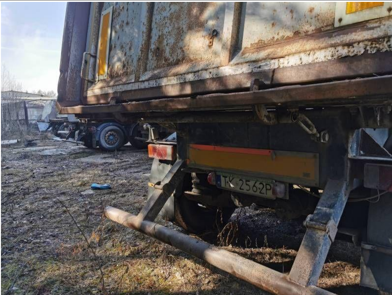
Fot. nr 47