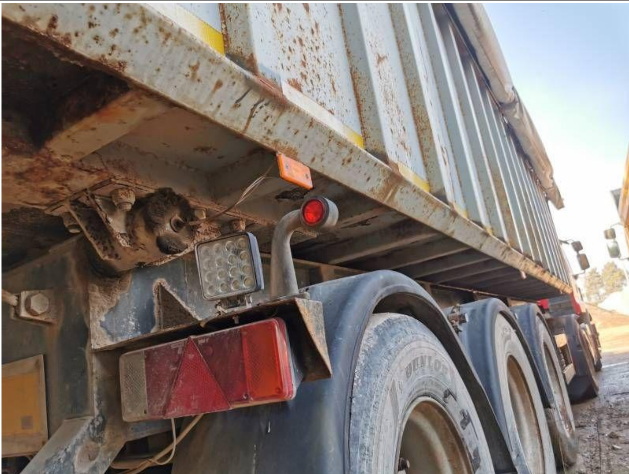
Fot. nr 73