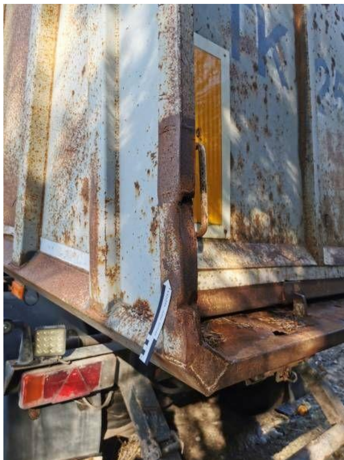
Fot. nr 56