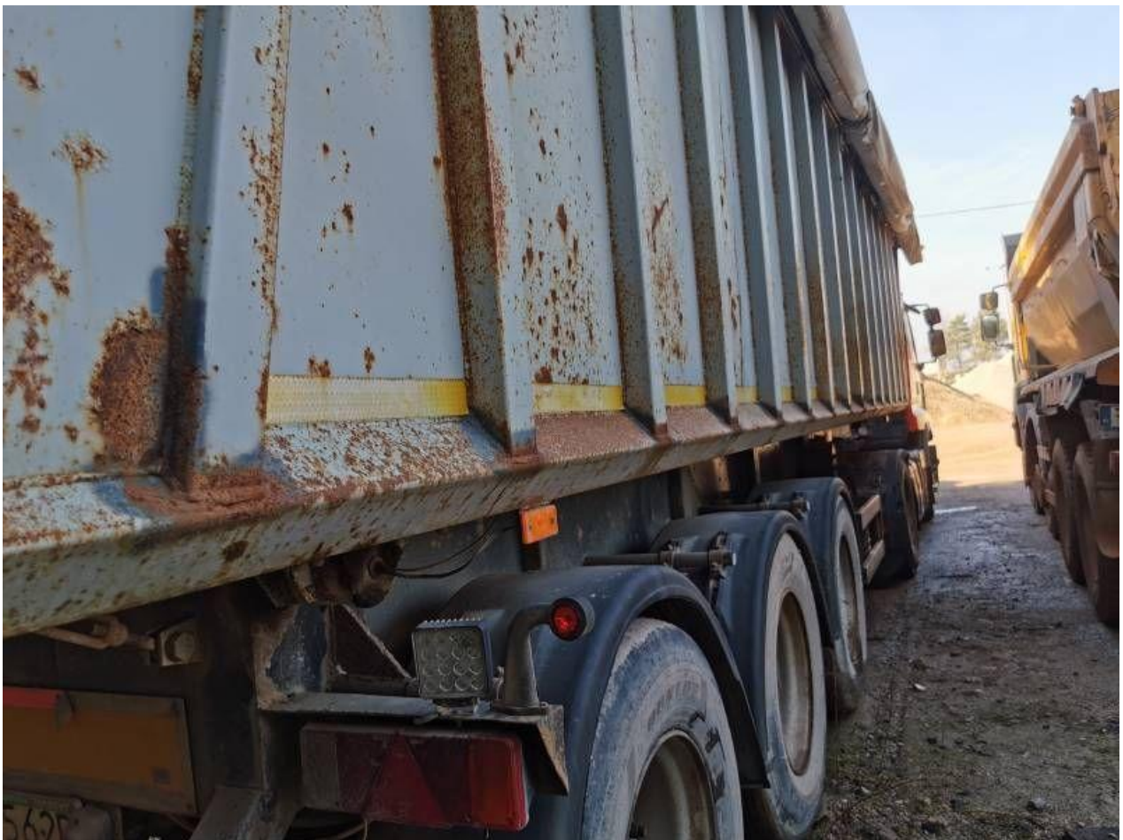
Fot. nr 44