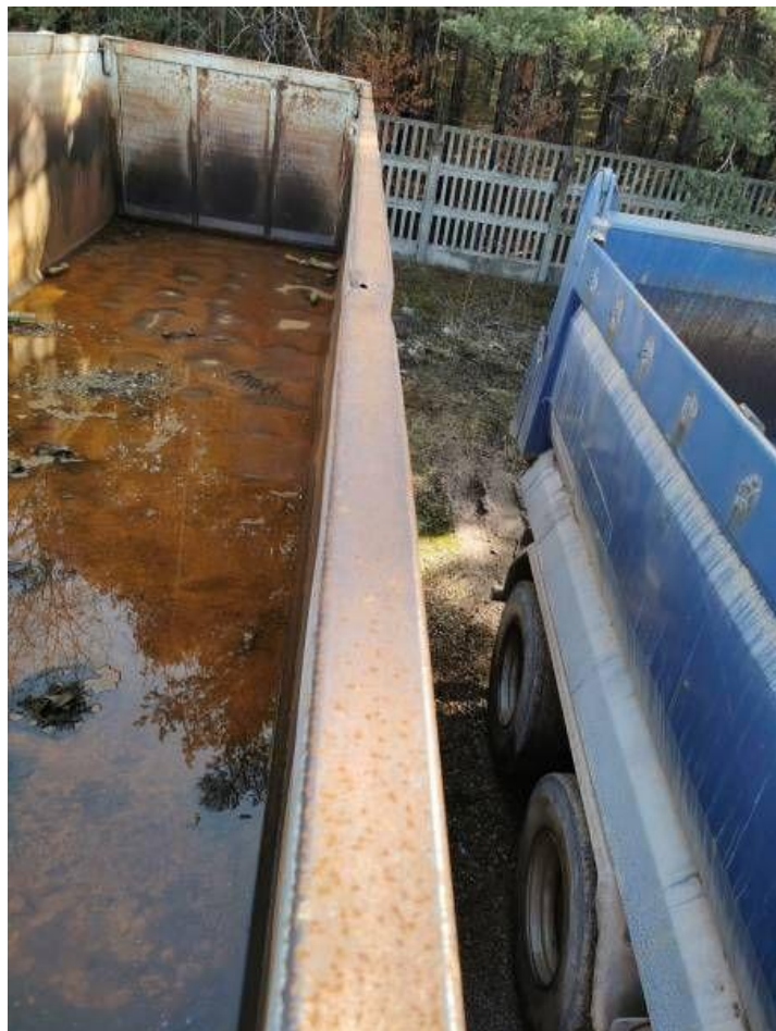
Fot. nr 20