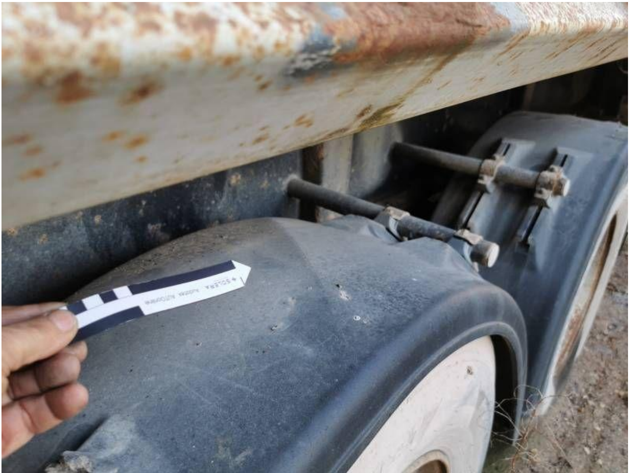
Fot. nr 105