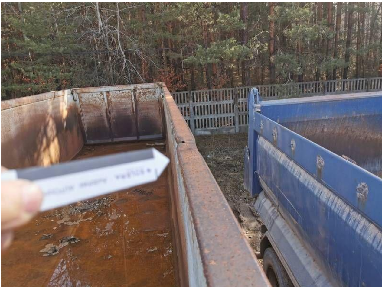
Fot. nr 18