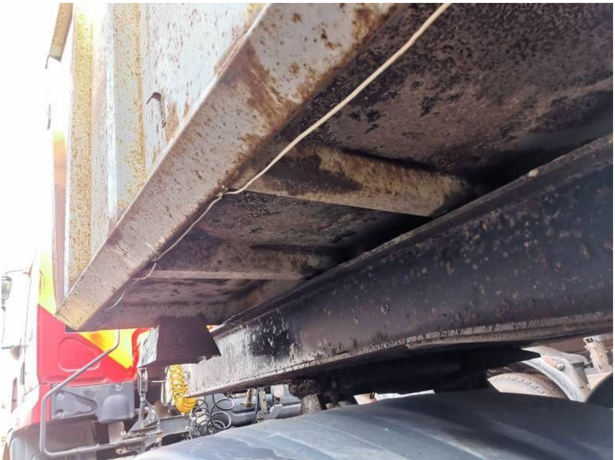
Fot. nr 72