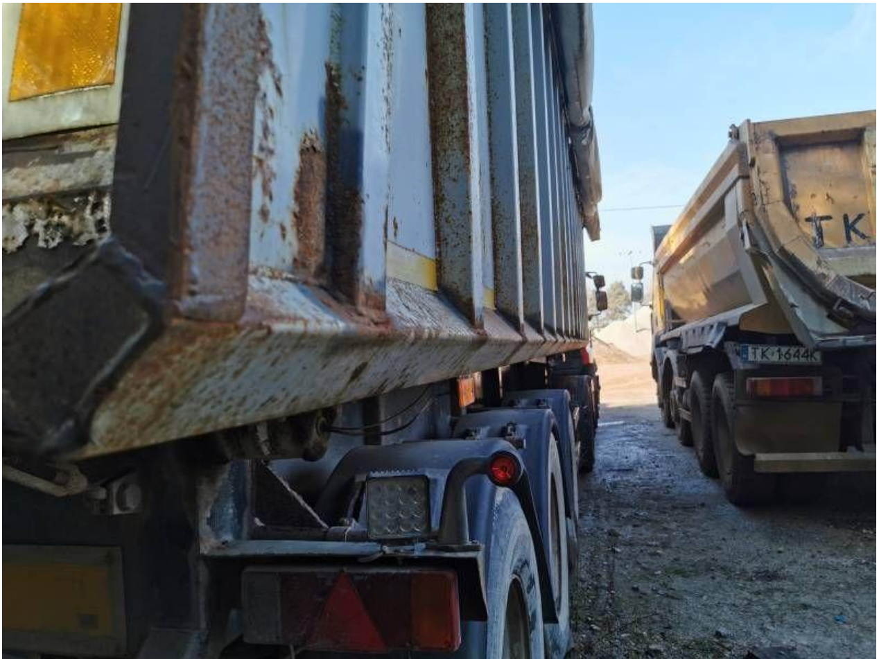
Fot. nr 45