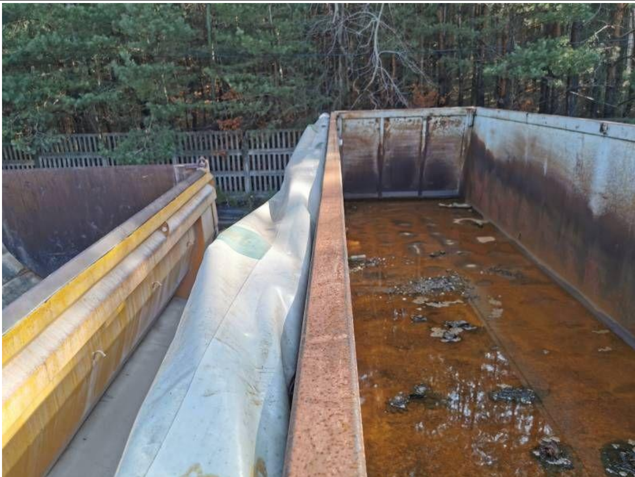
Fot. nr 21