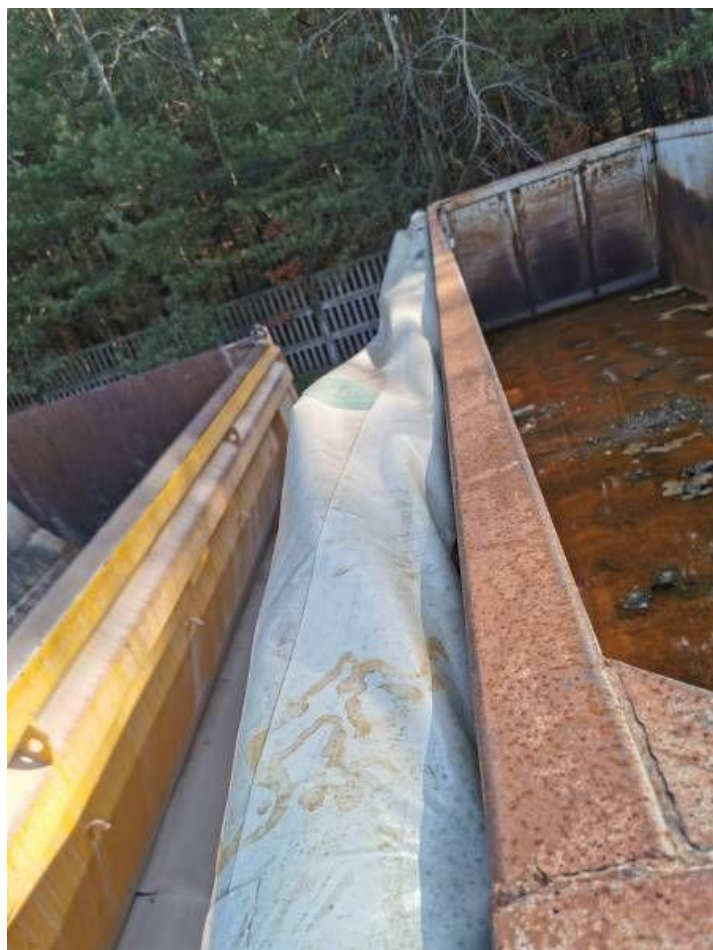
Fot. nr 22