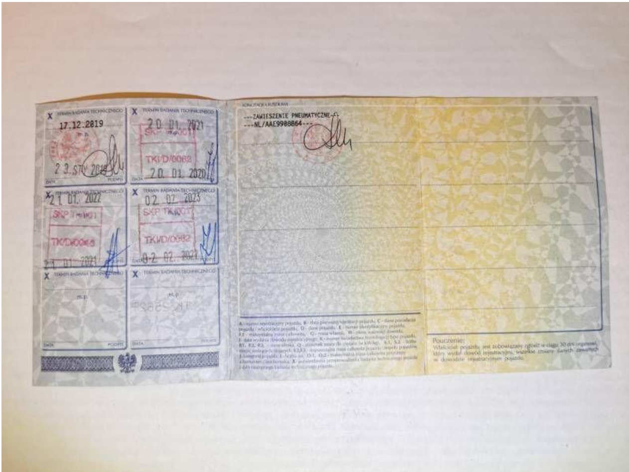
Fot. nr 109