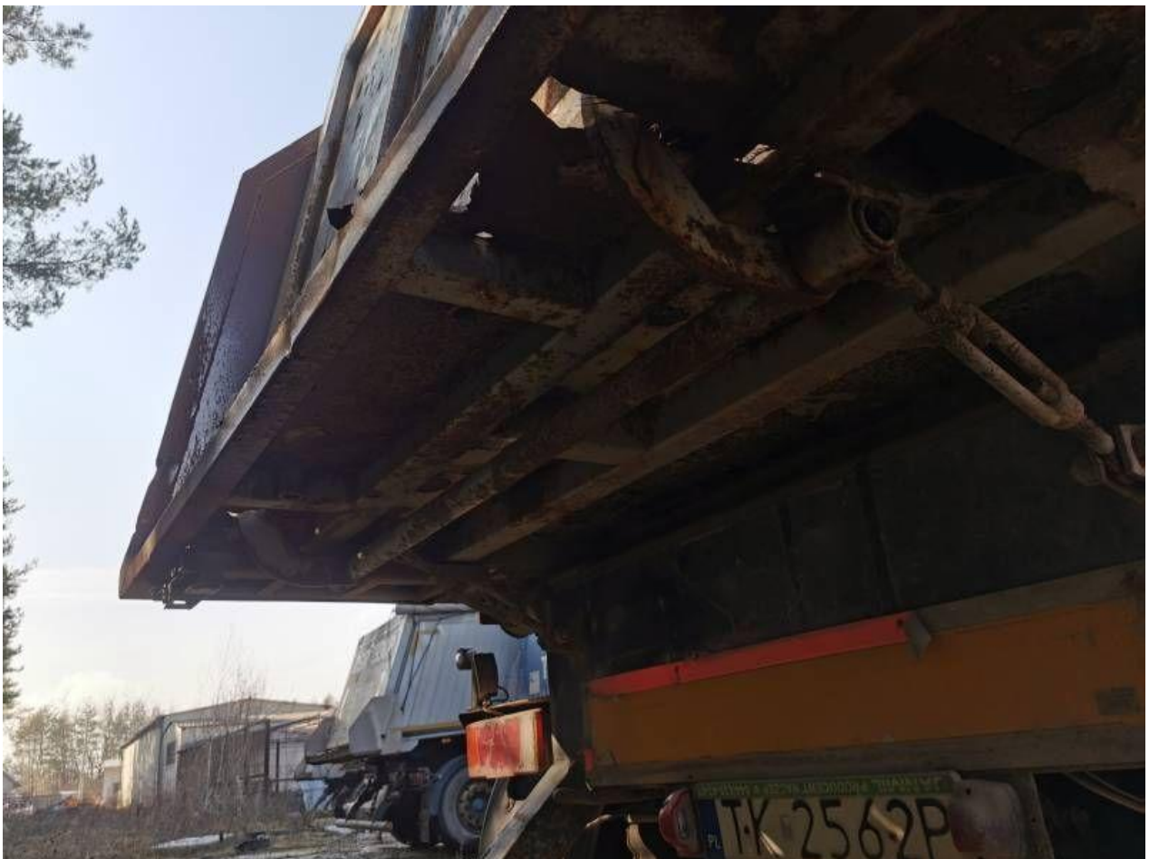
Fot. nr 62