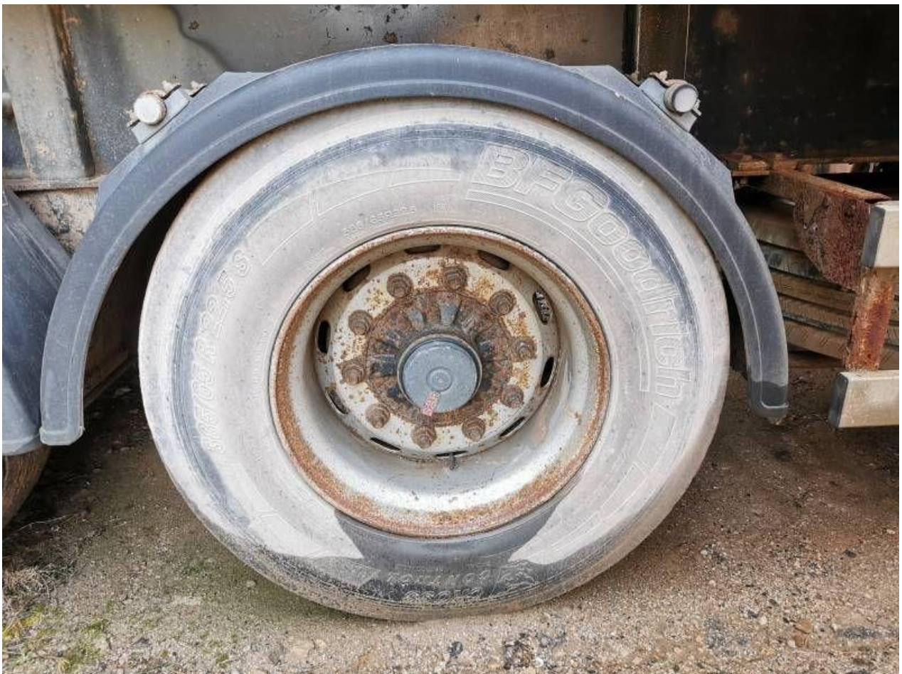
Fot. nr 86