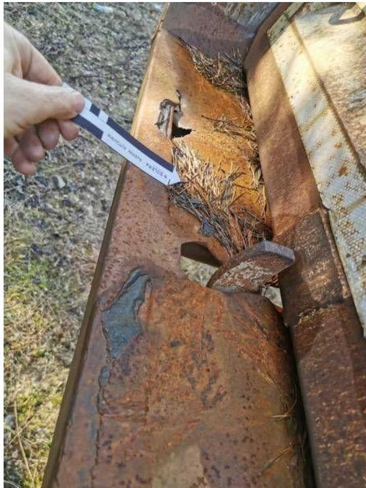
Fot. nr 53