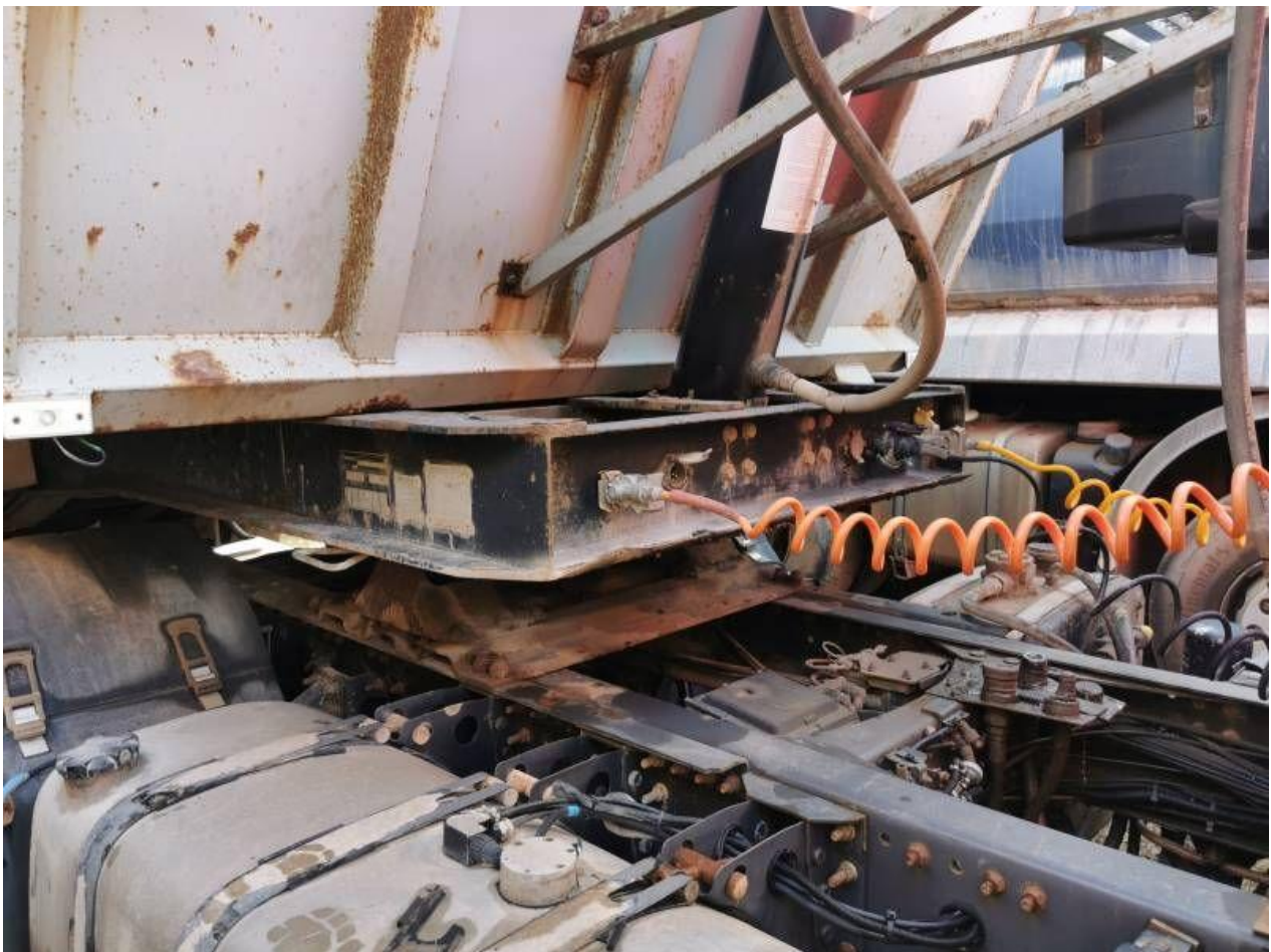
Fot. nr 30