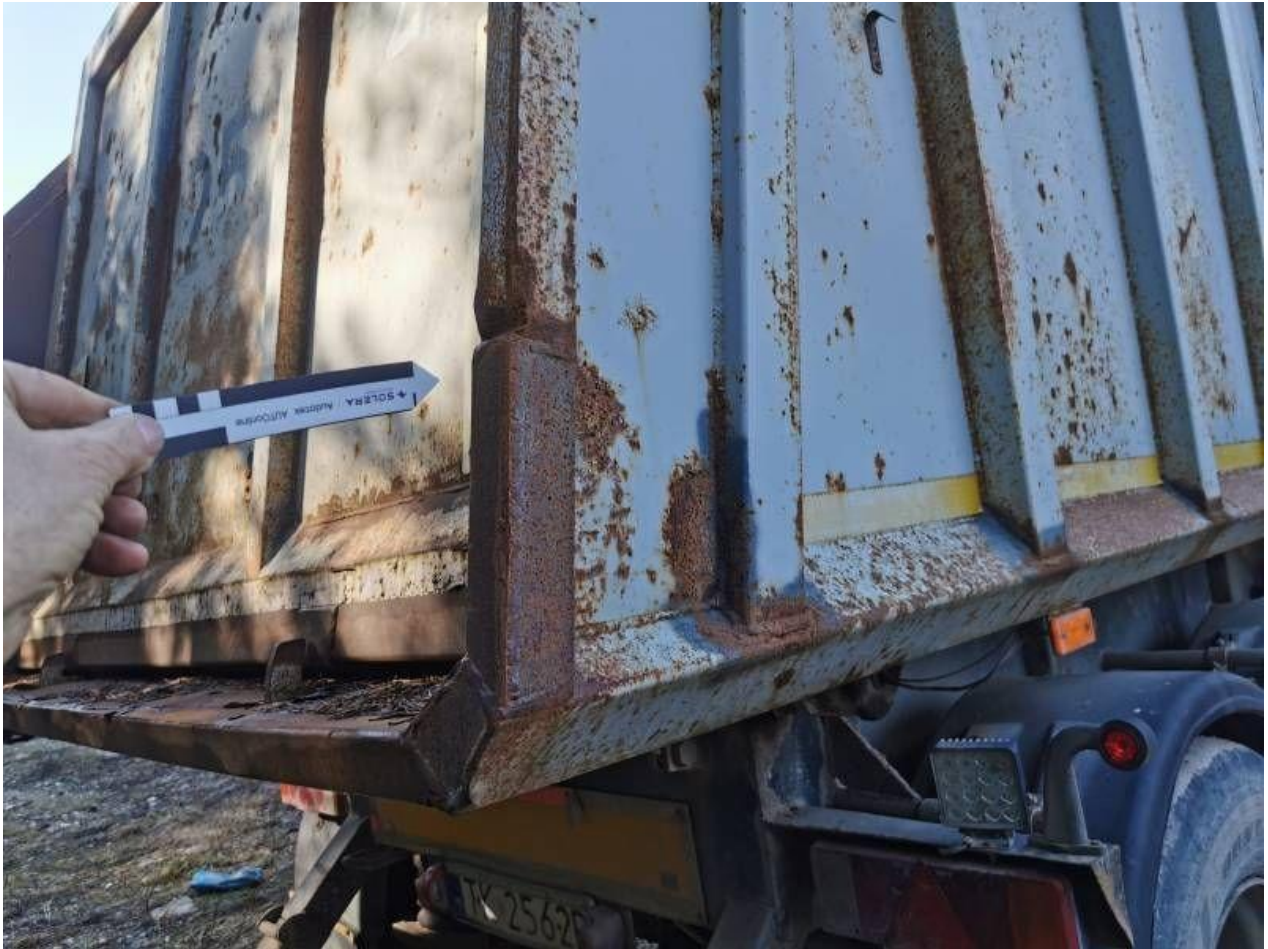
Fot. nr 43