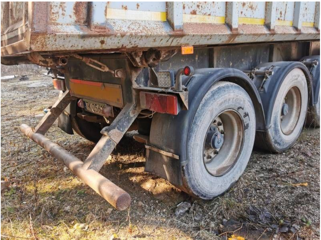
Fot. nr 98