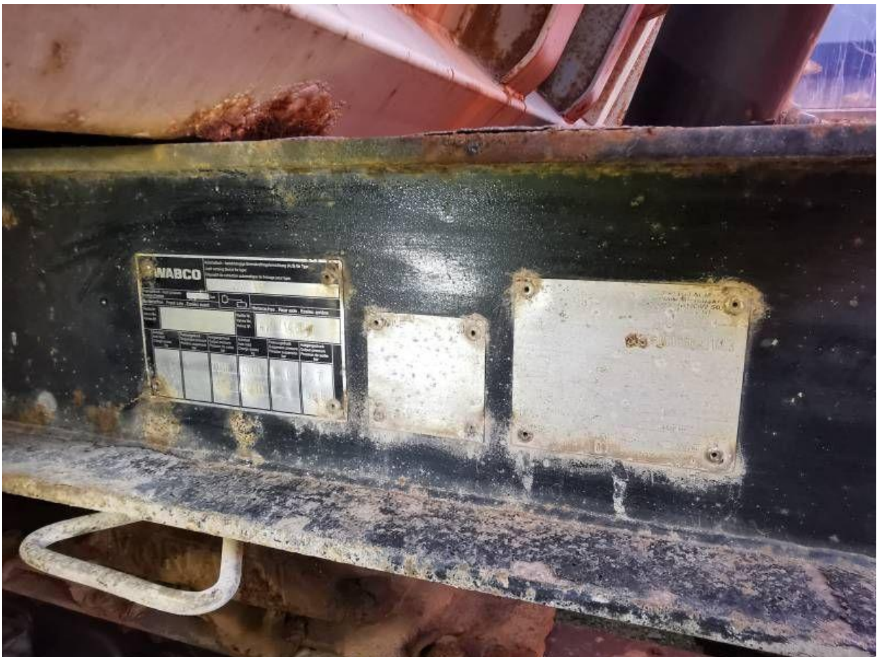
Fot. nr 106