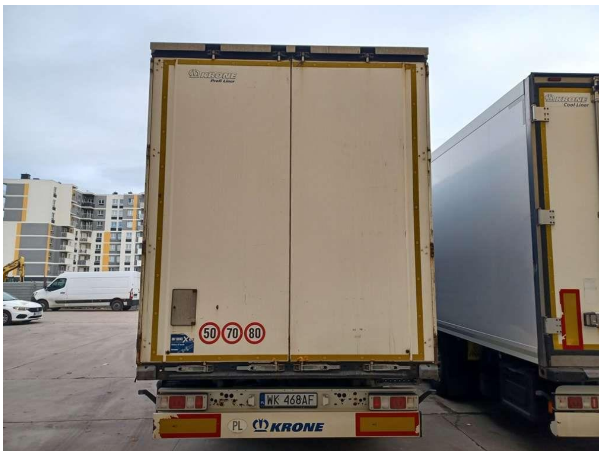
Fot. nr 6