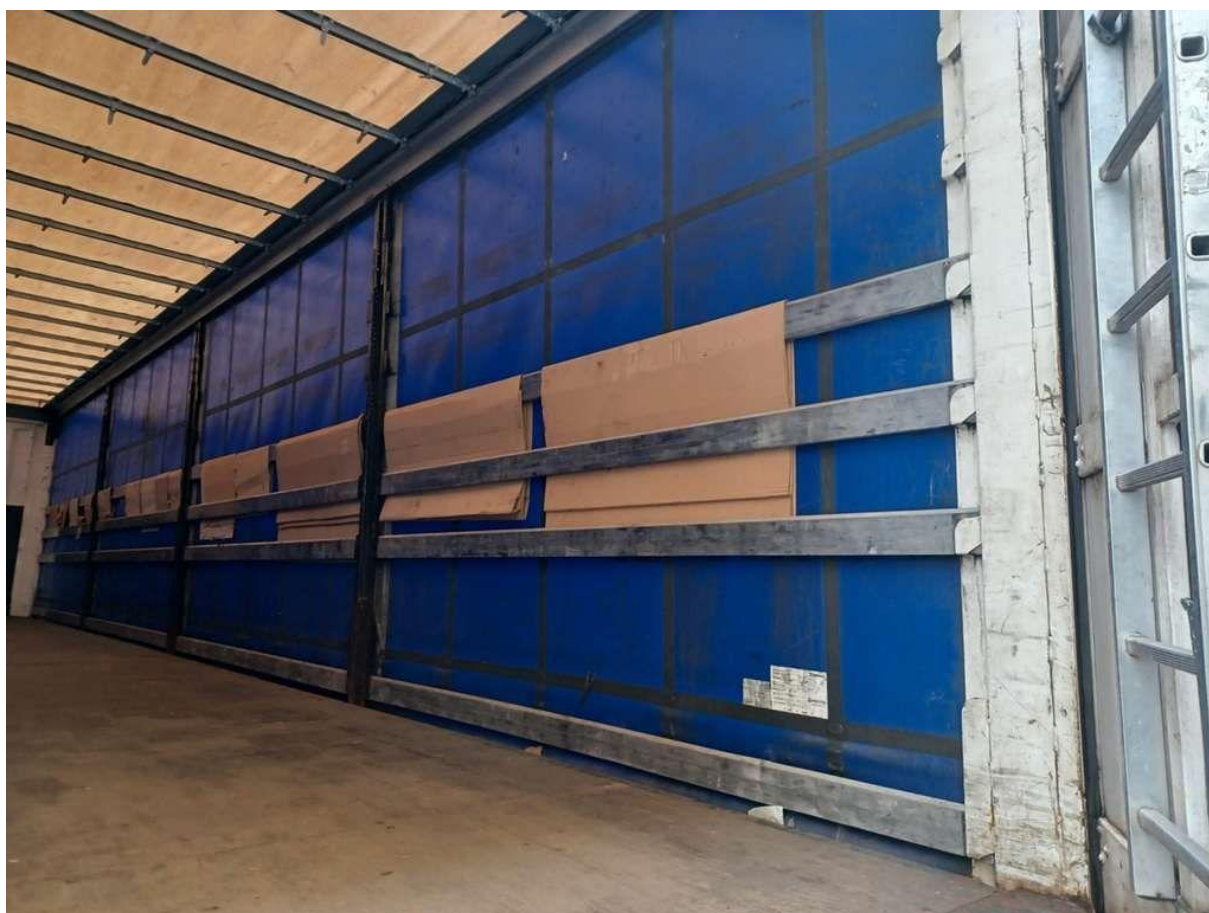
Fot. nr 36