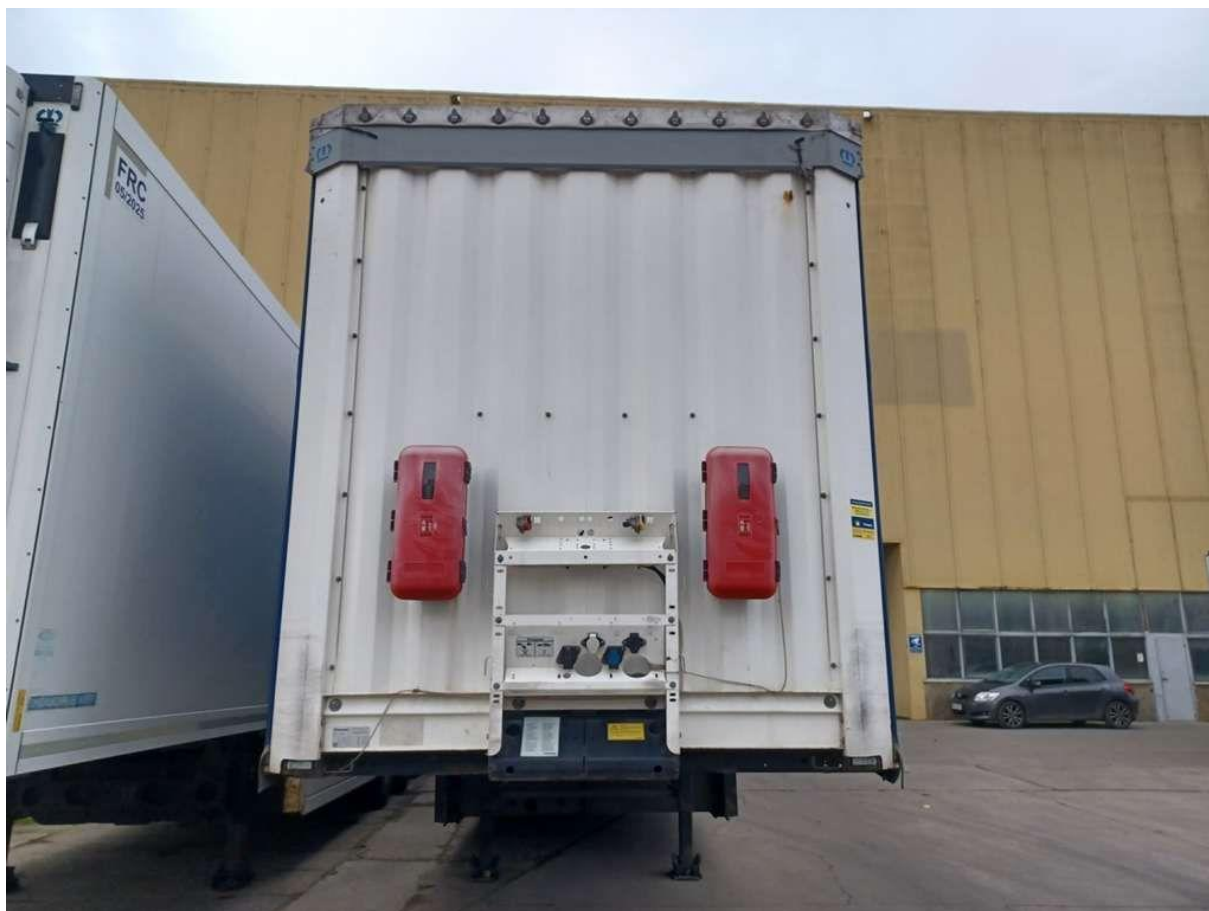
Fot. nr 10