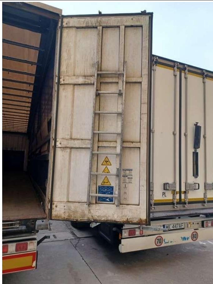
Fot. nr 29