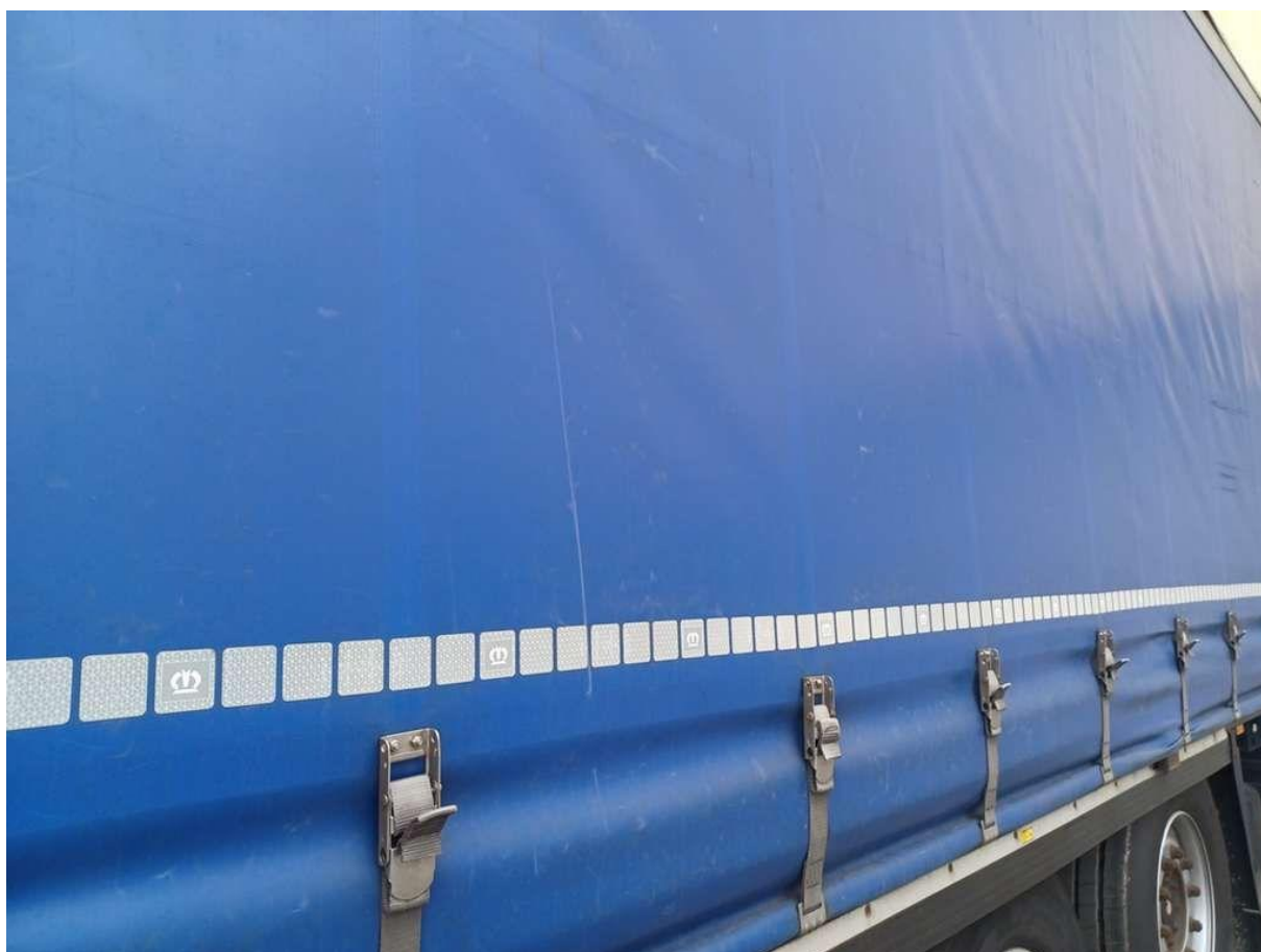
Fot. nr 28