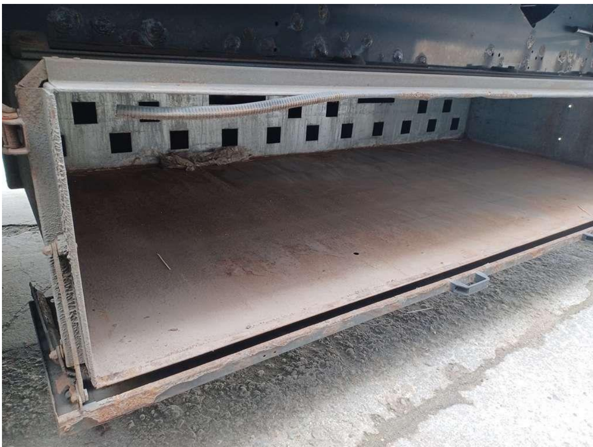
Fot. nr 24