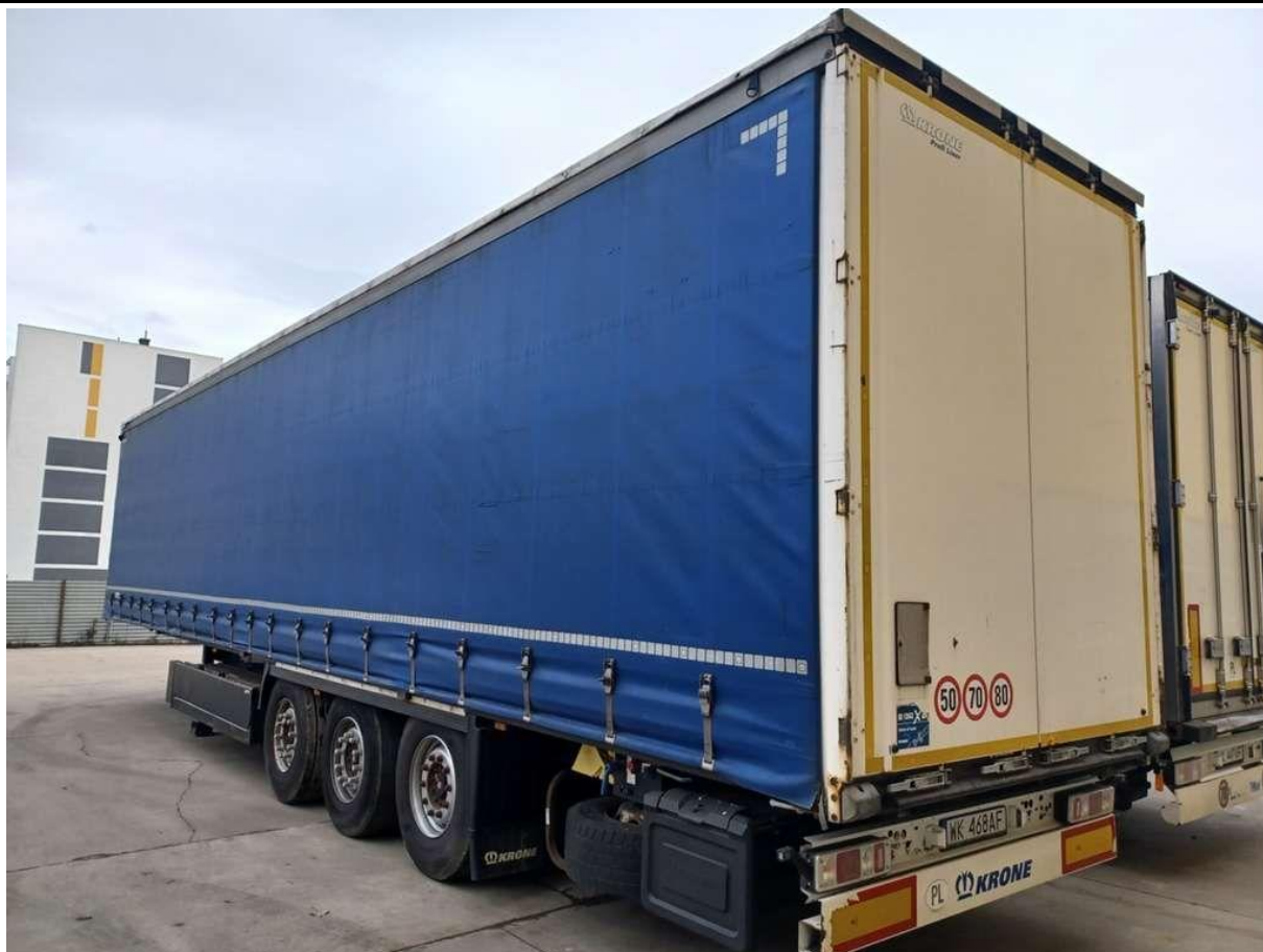
Fot. nr 5