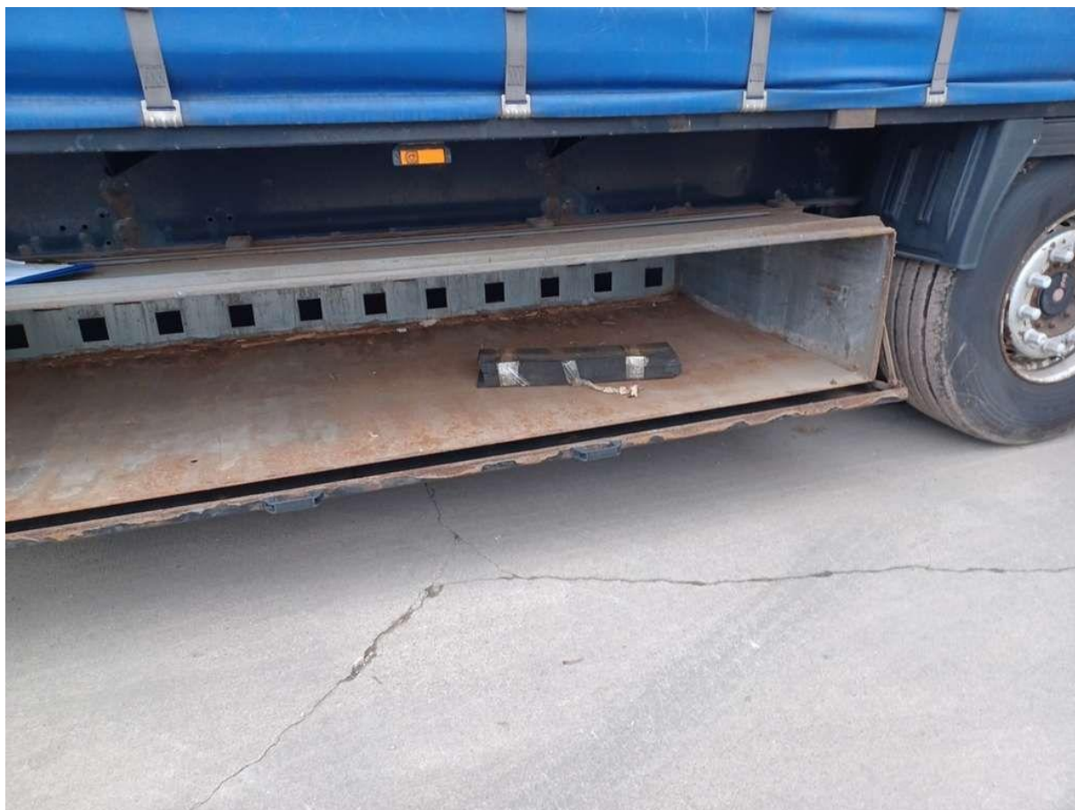
Fot. nr 26