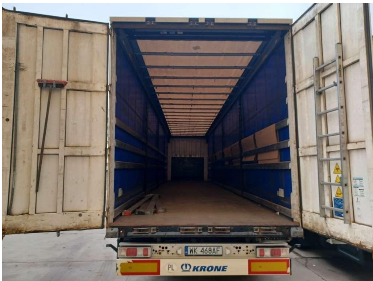
Fot. nr 32