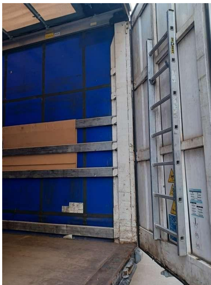
Fot. nr 40