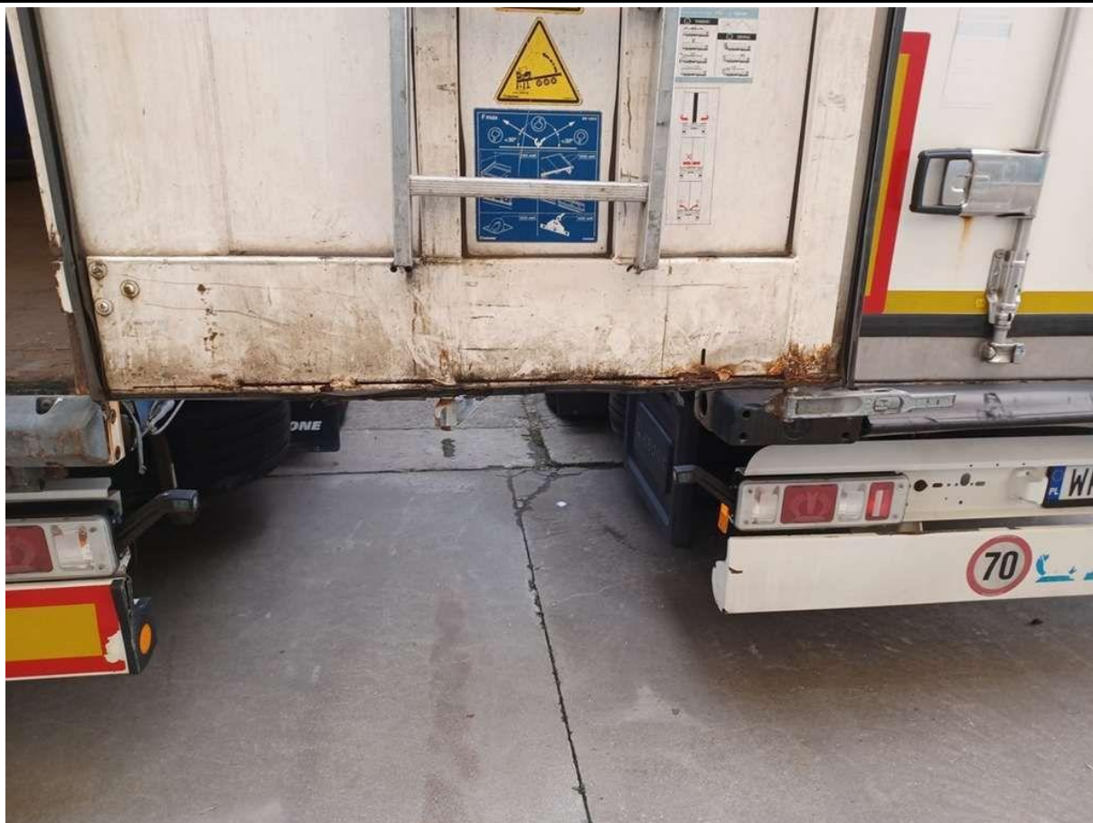
Fot. nr 31