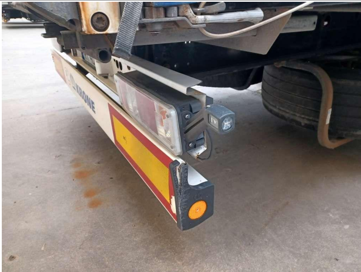
Fot. nr 19