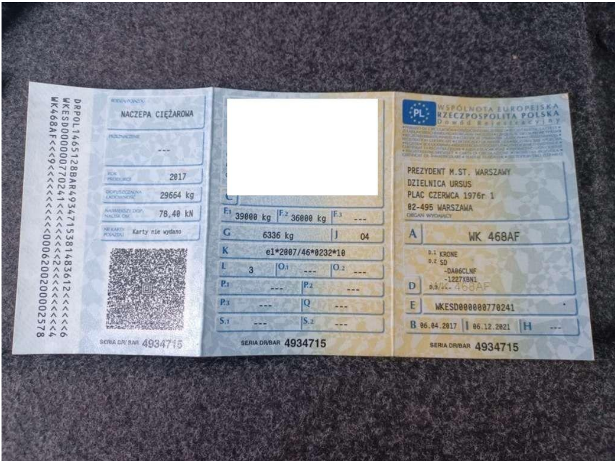
Fot. nr 47