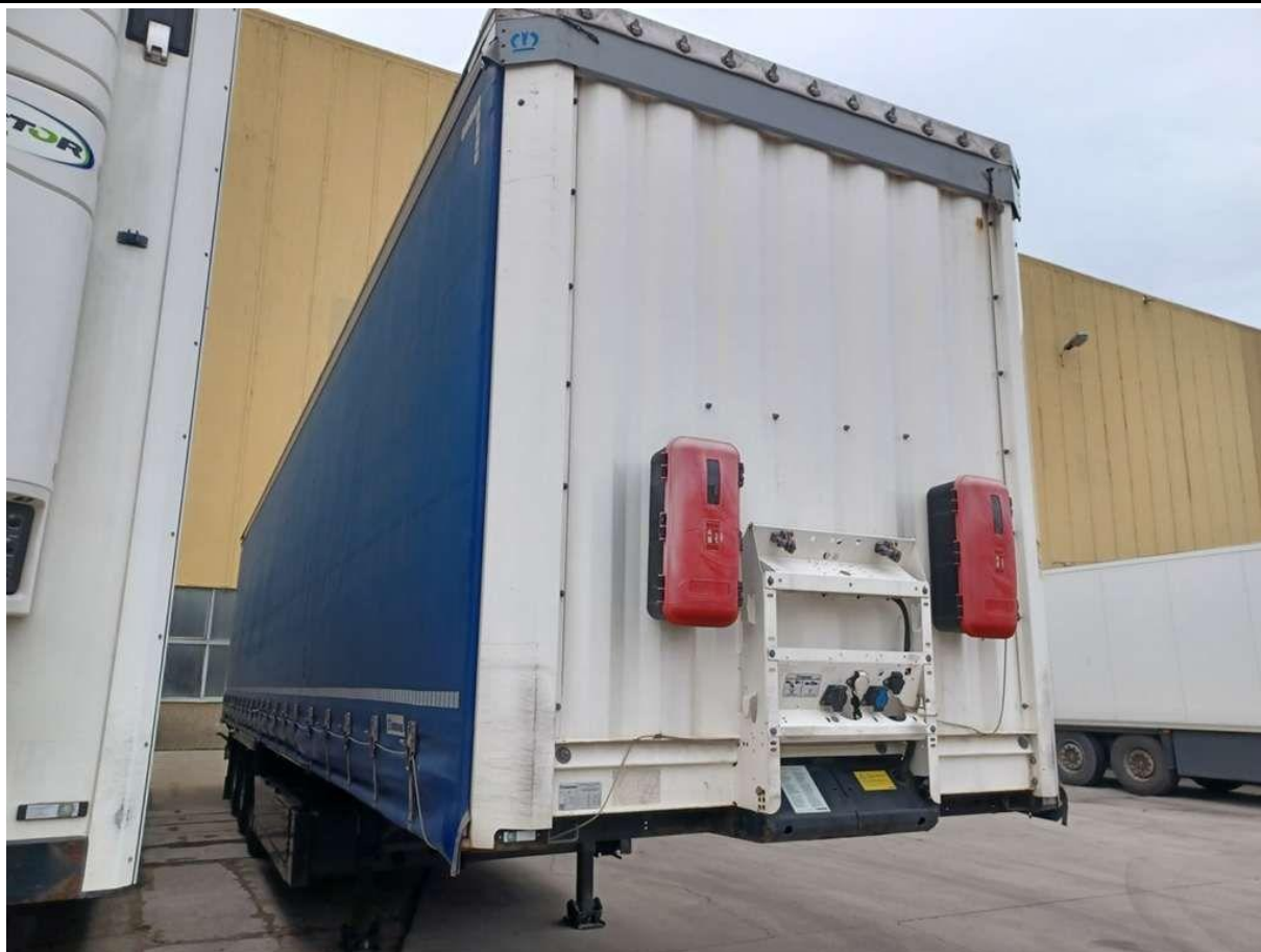
Fot. nr 9