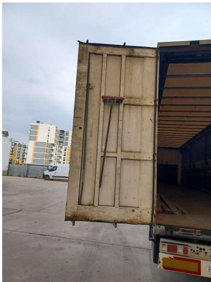
Fot. nr 30