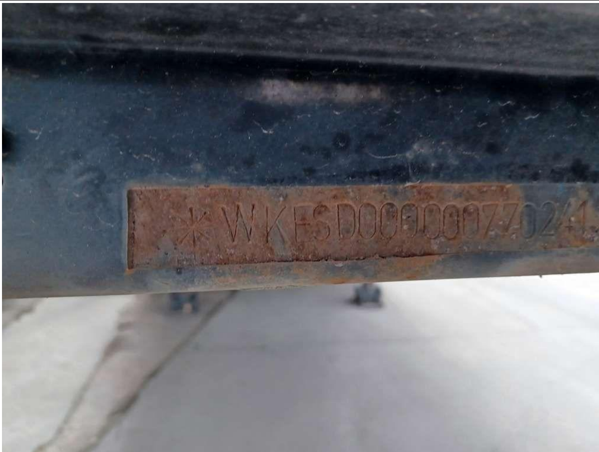
Fot. nr 11