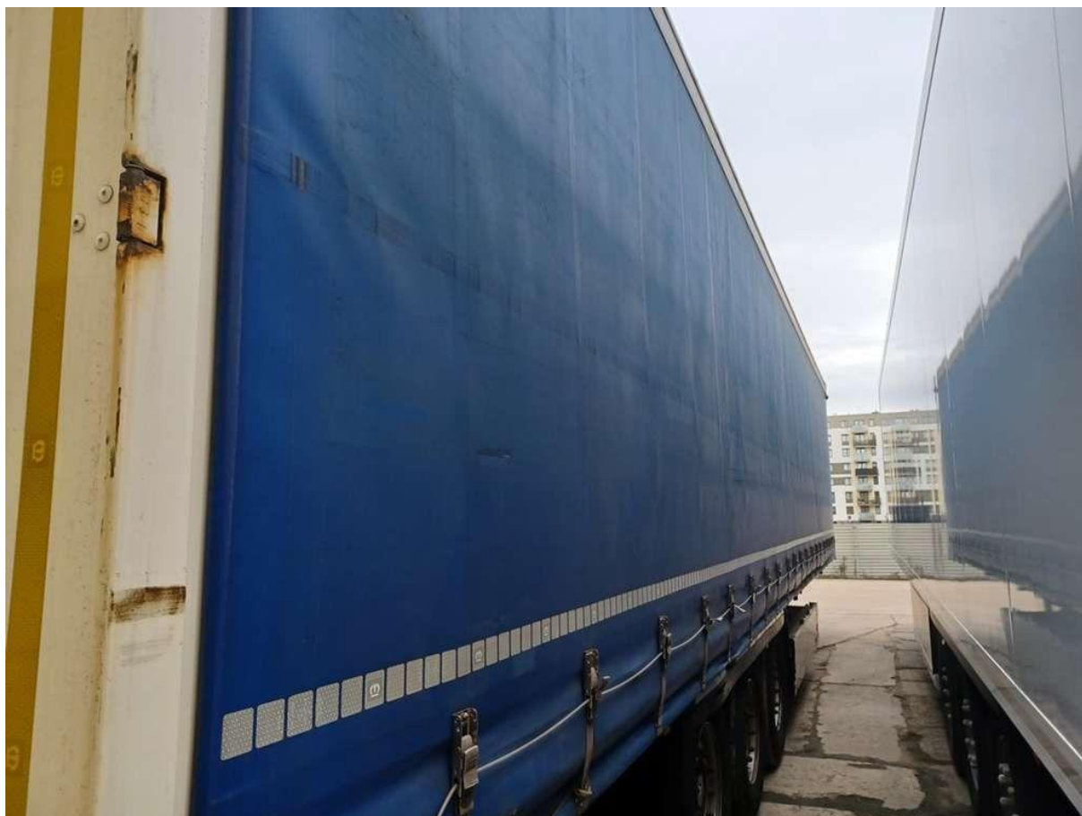
Fot. nr 8