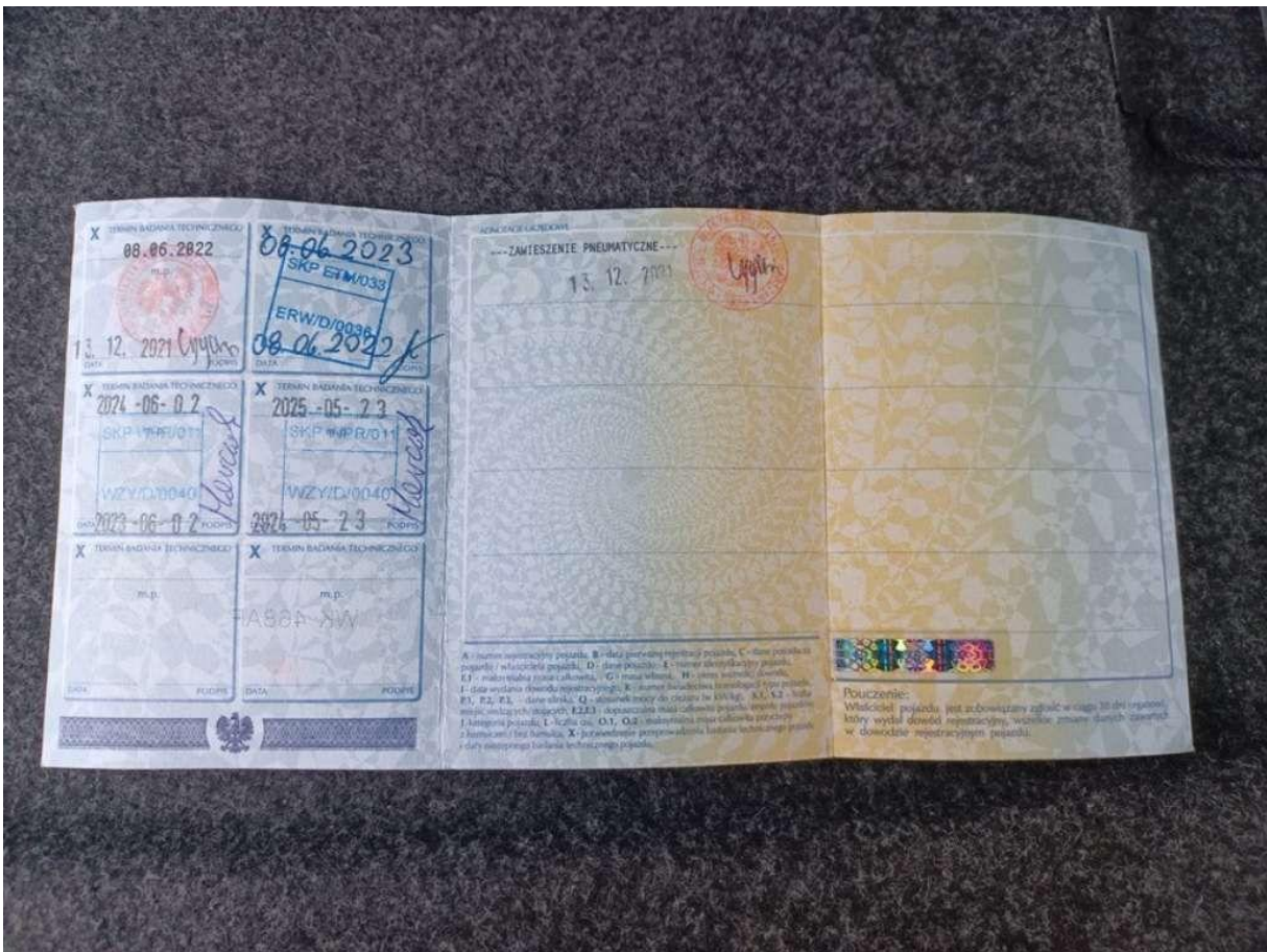
Fot. nr 48

Dokument wystawiony elektronicznie, wa ny bez podpisu