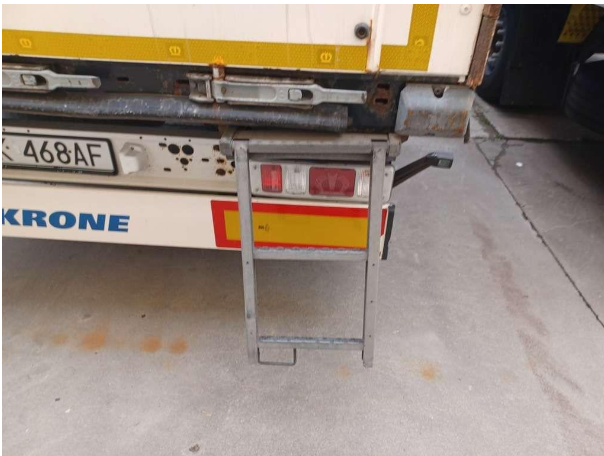
Fot. nr 46