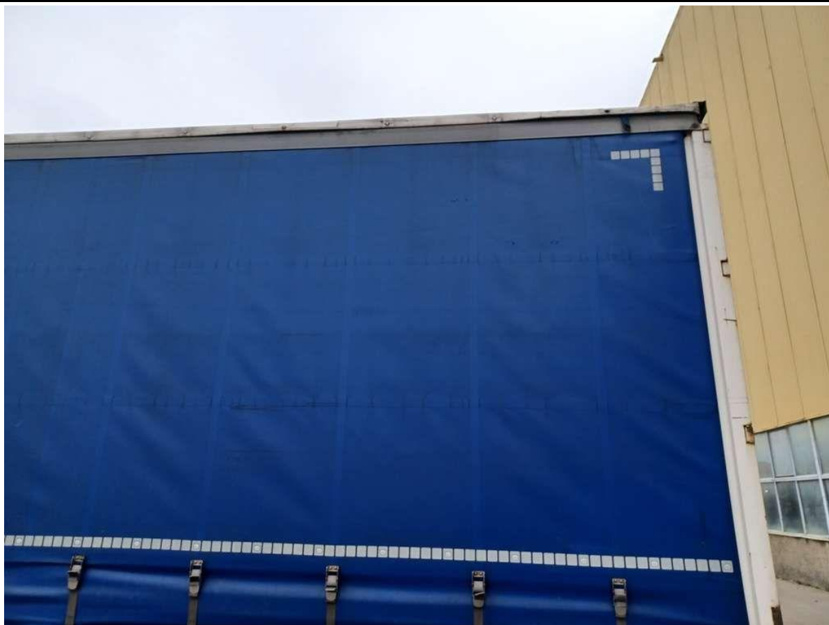
Fot. nr 13