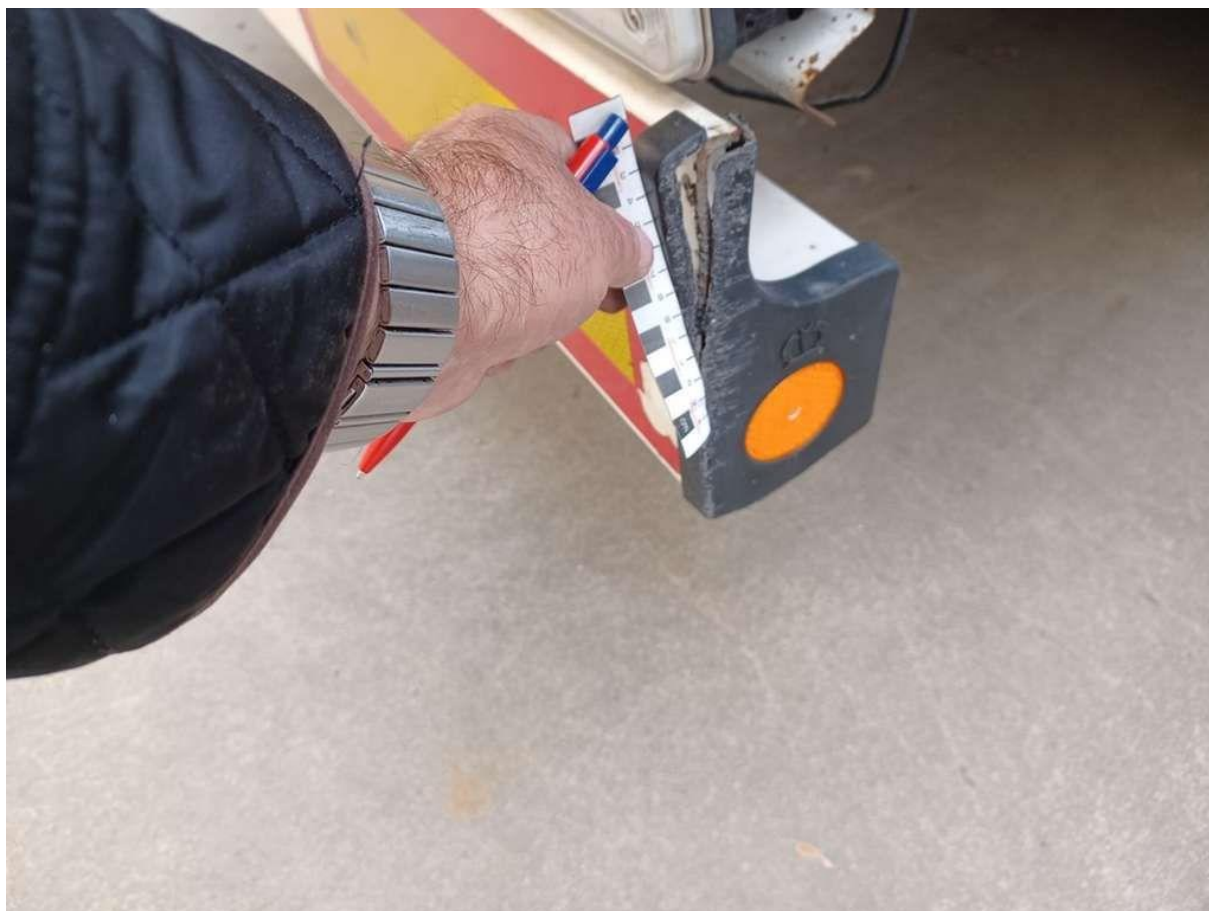
Fot. nr 44