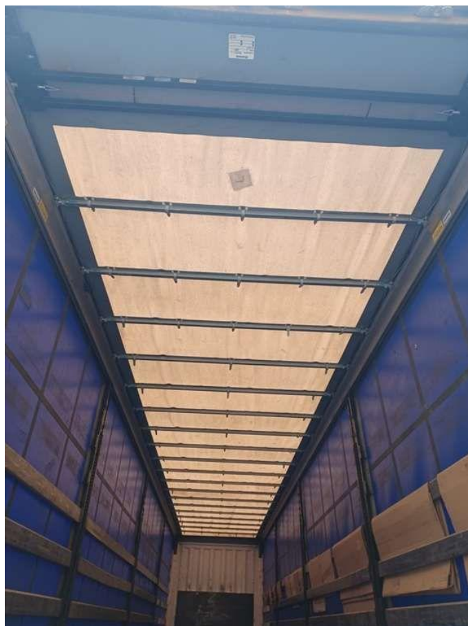
Fot. nr 34