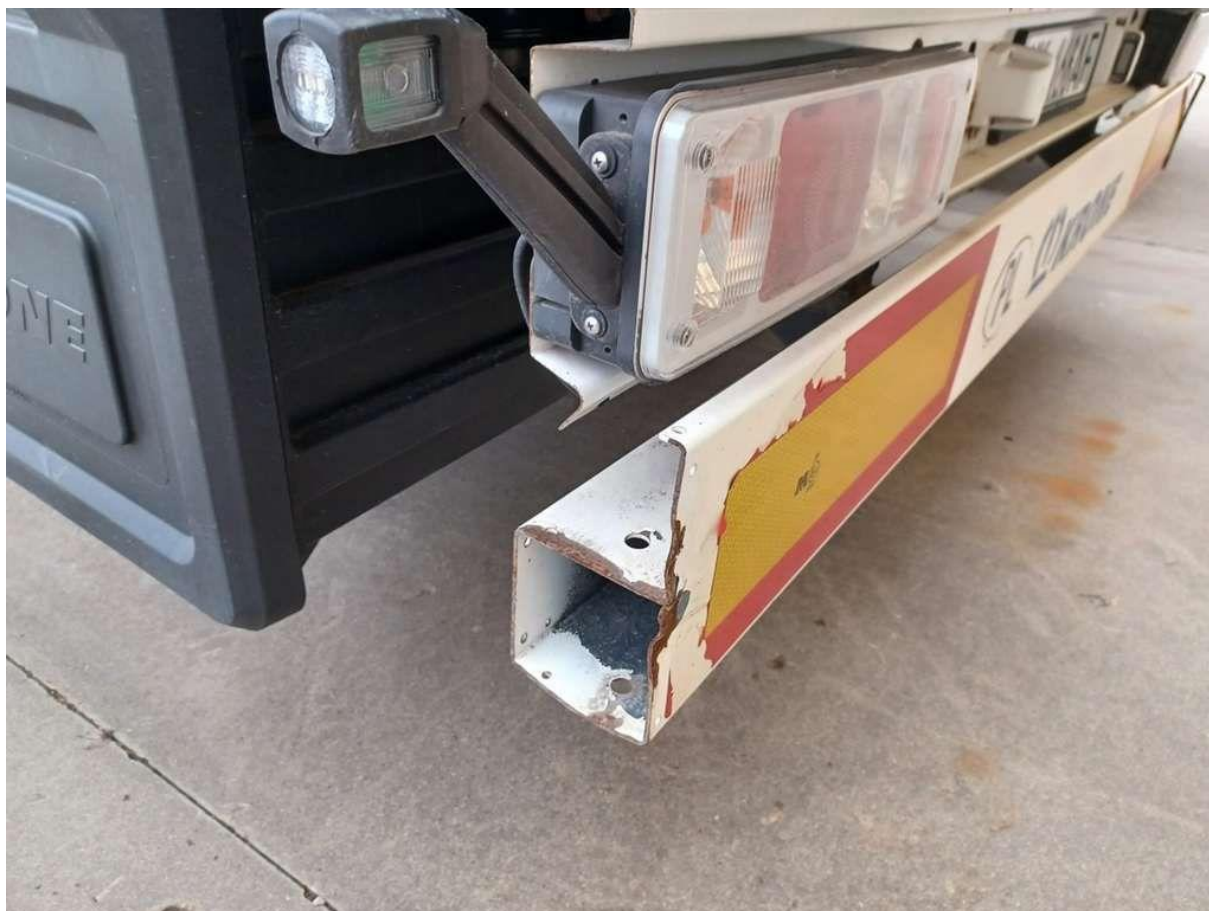
Fot. nr 18