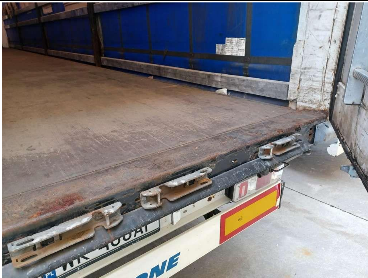
Fot. nr 39