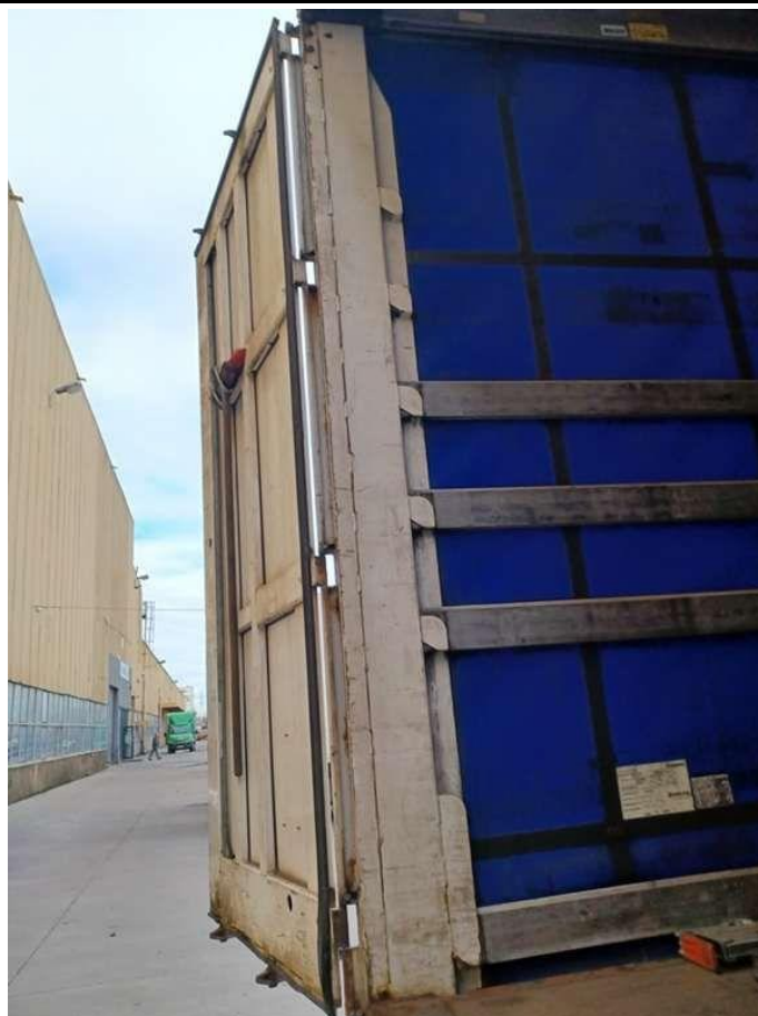
Fot. nr 41