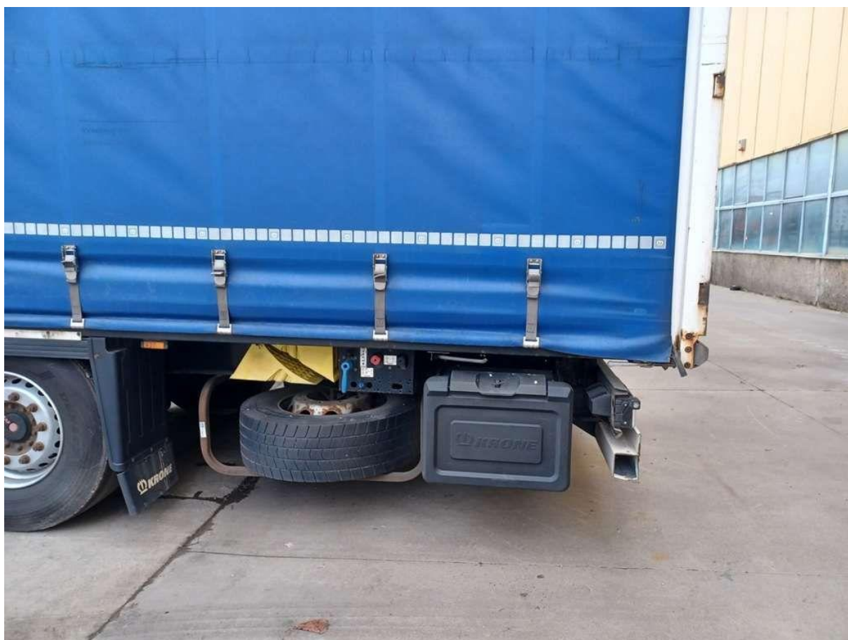
Fot. nr 4