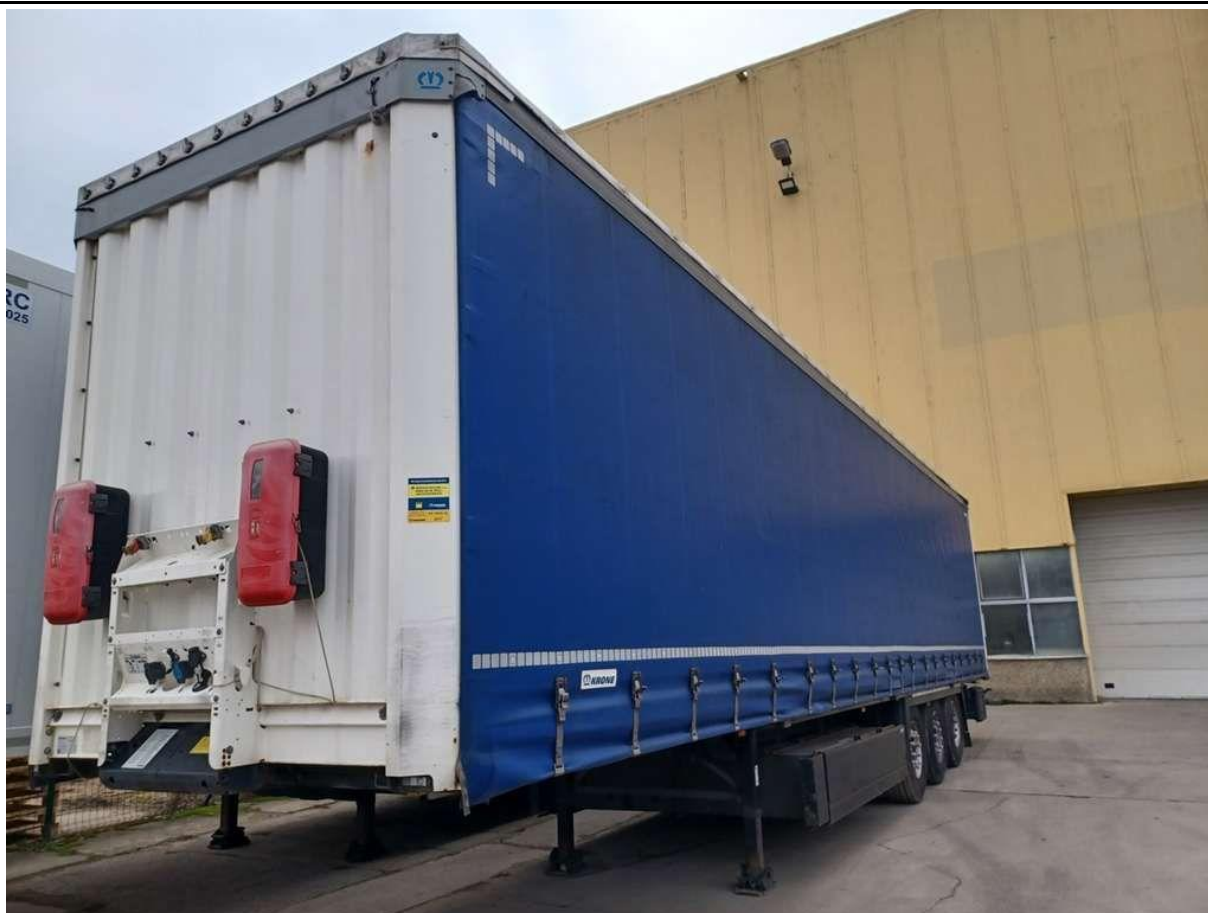
Fot. nr 1