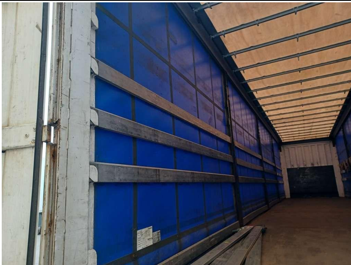
Fot. nr 35