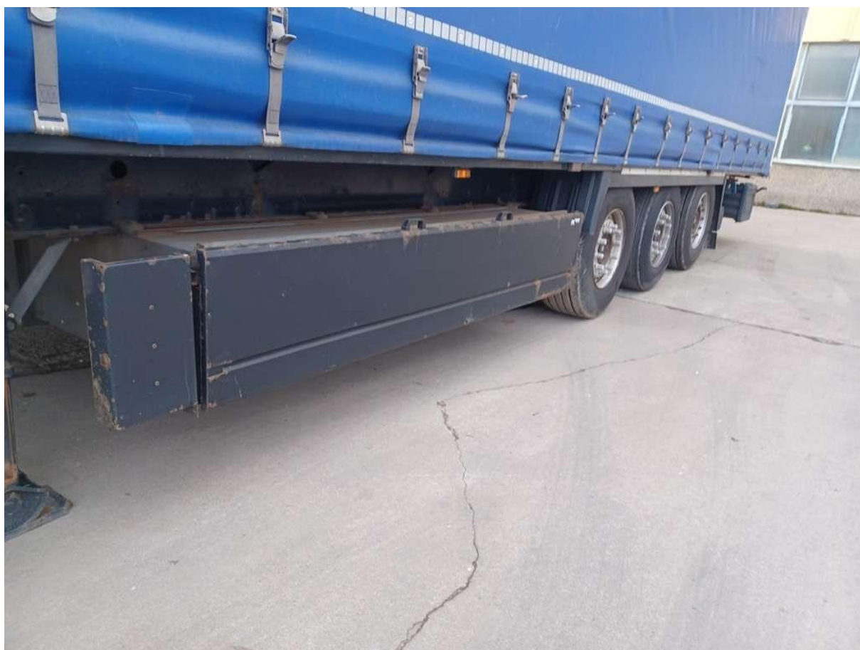
Fot. nr 16