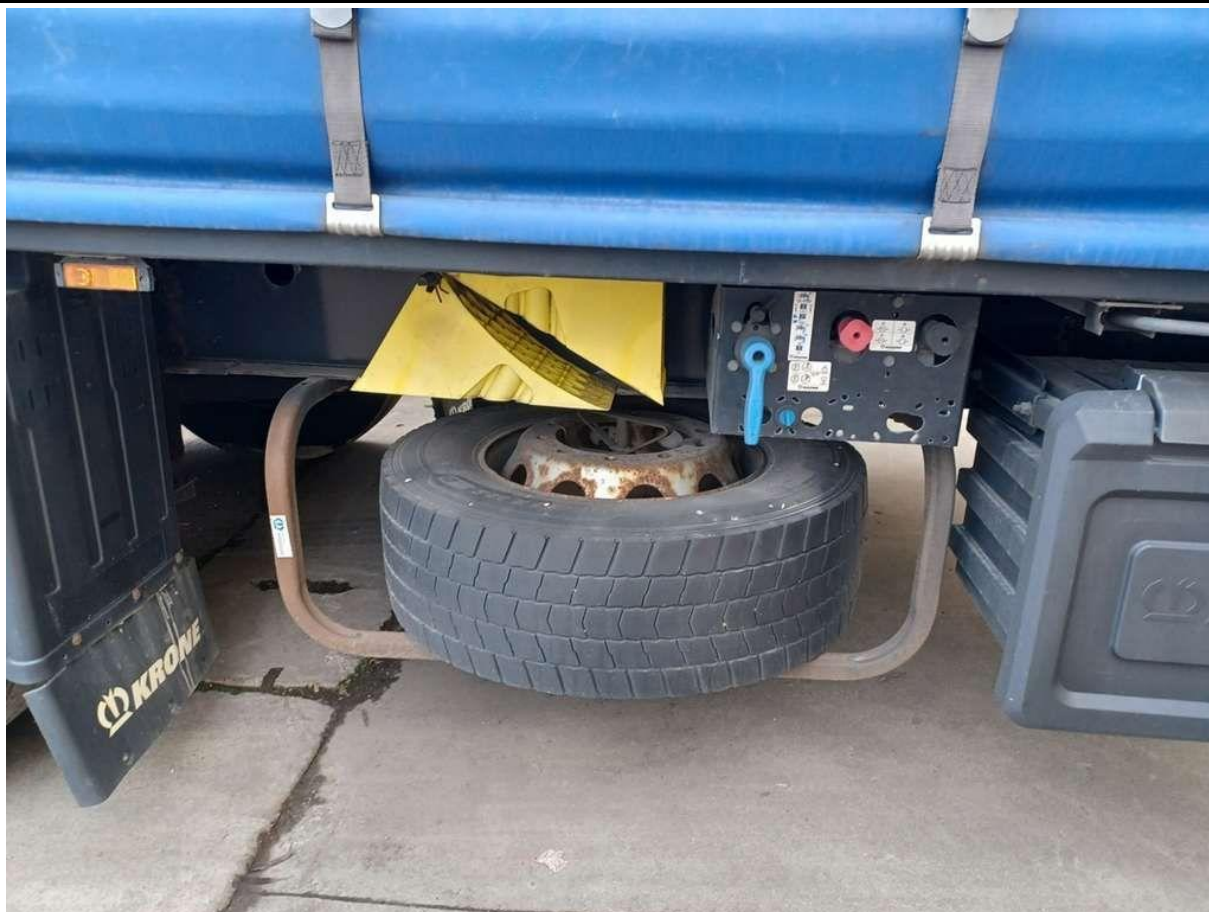
Fot. nr 17