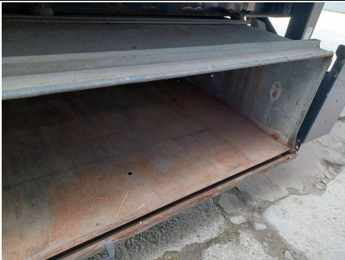
Fot. nr 25