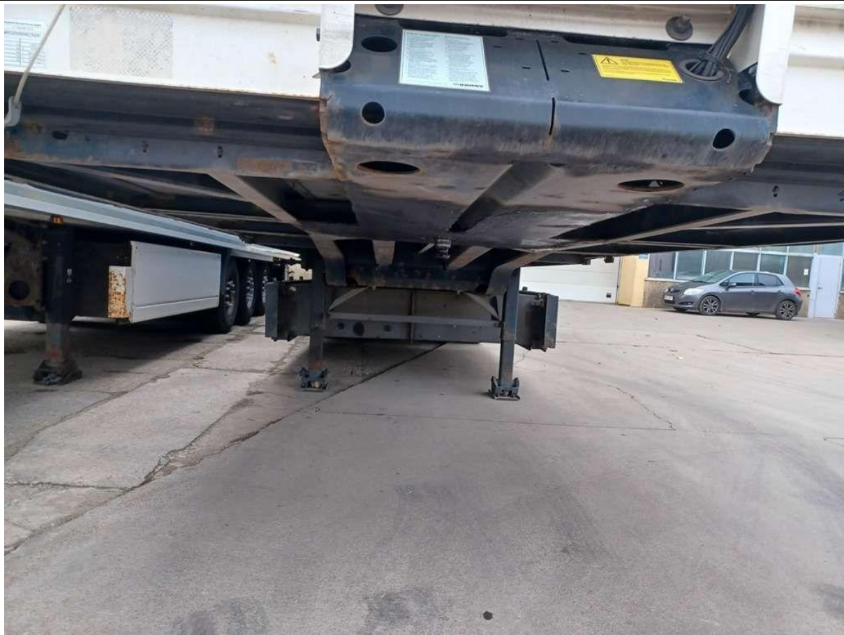
Fot. nr 15