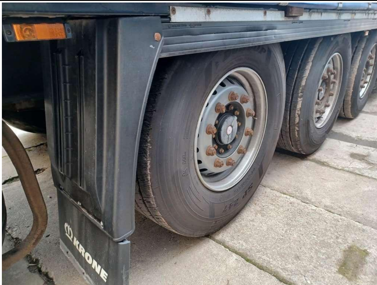
Fot. nr 21