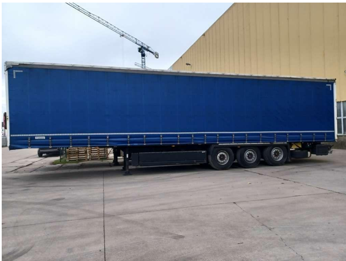
Fot. nr 2