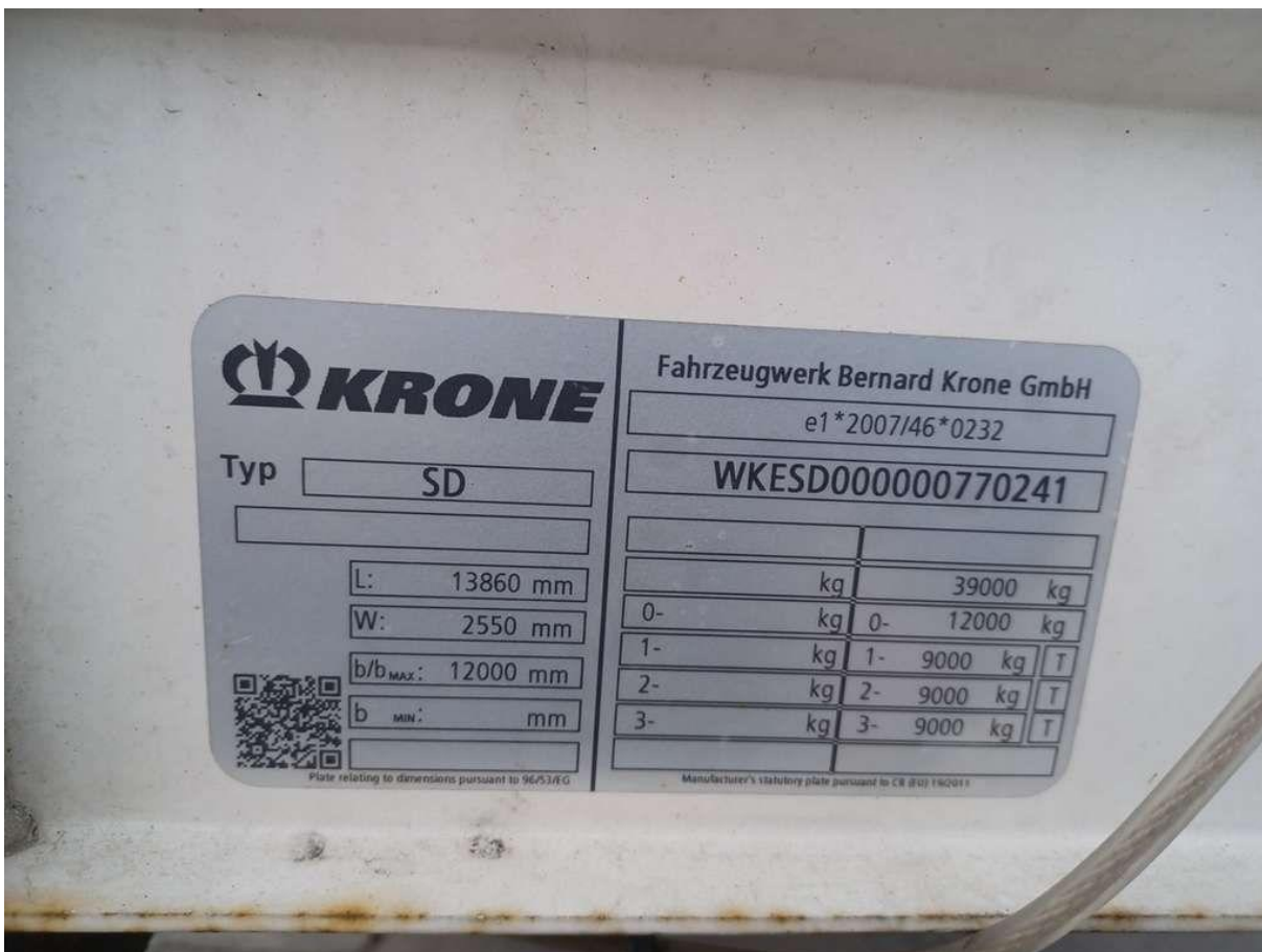
Fot. nr 12