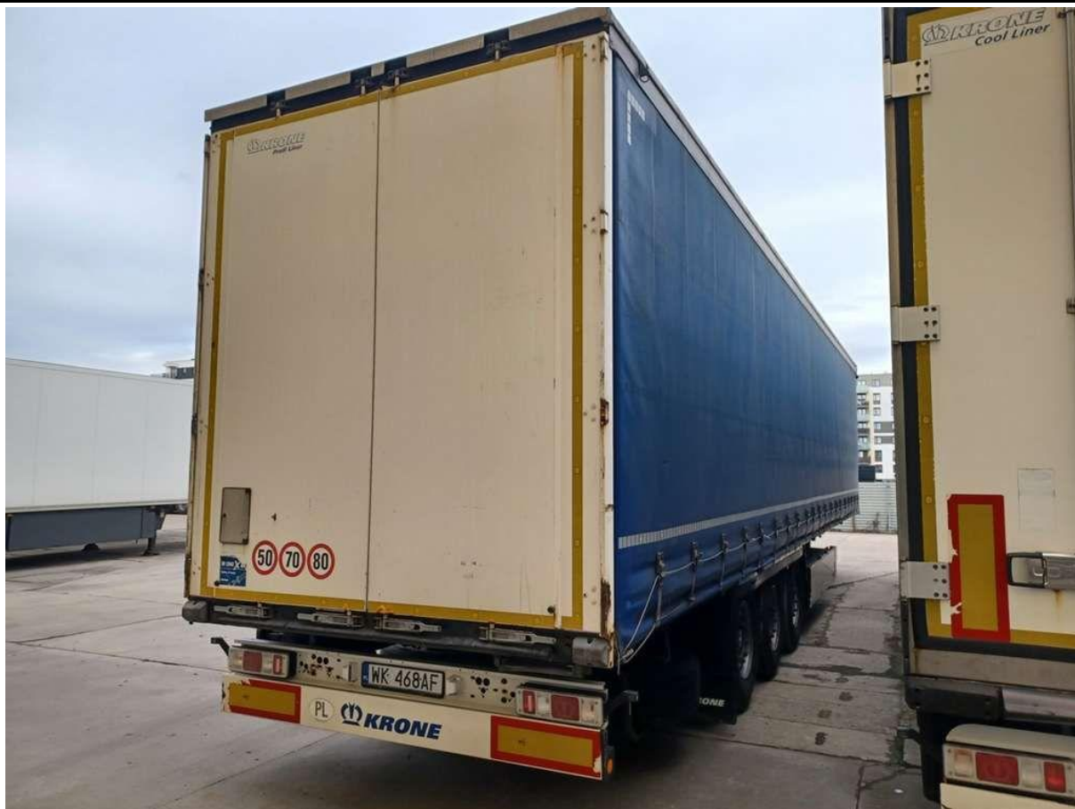
Fot. nr 7