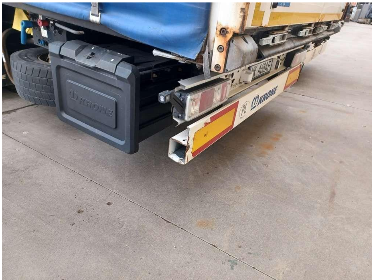
Fot. nr 14