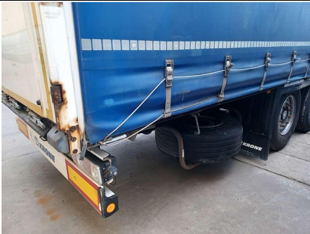
Fot. nr 43