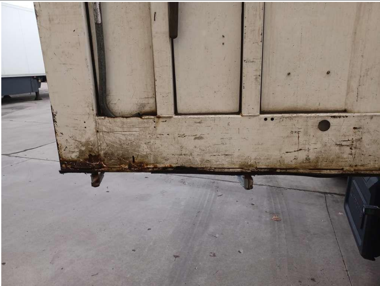
Fot. nr 33