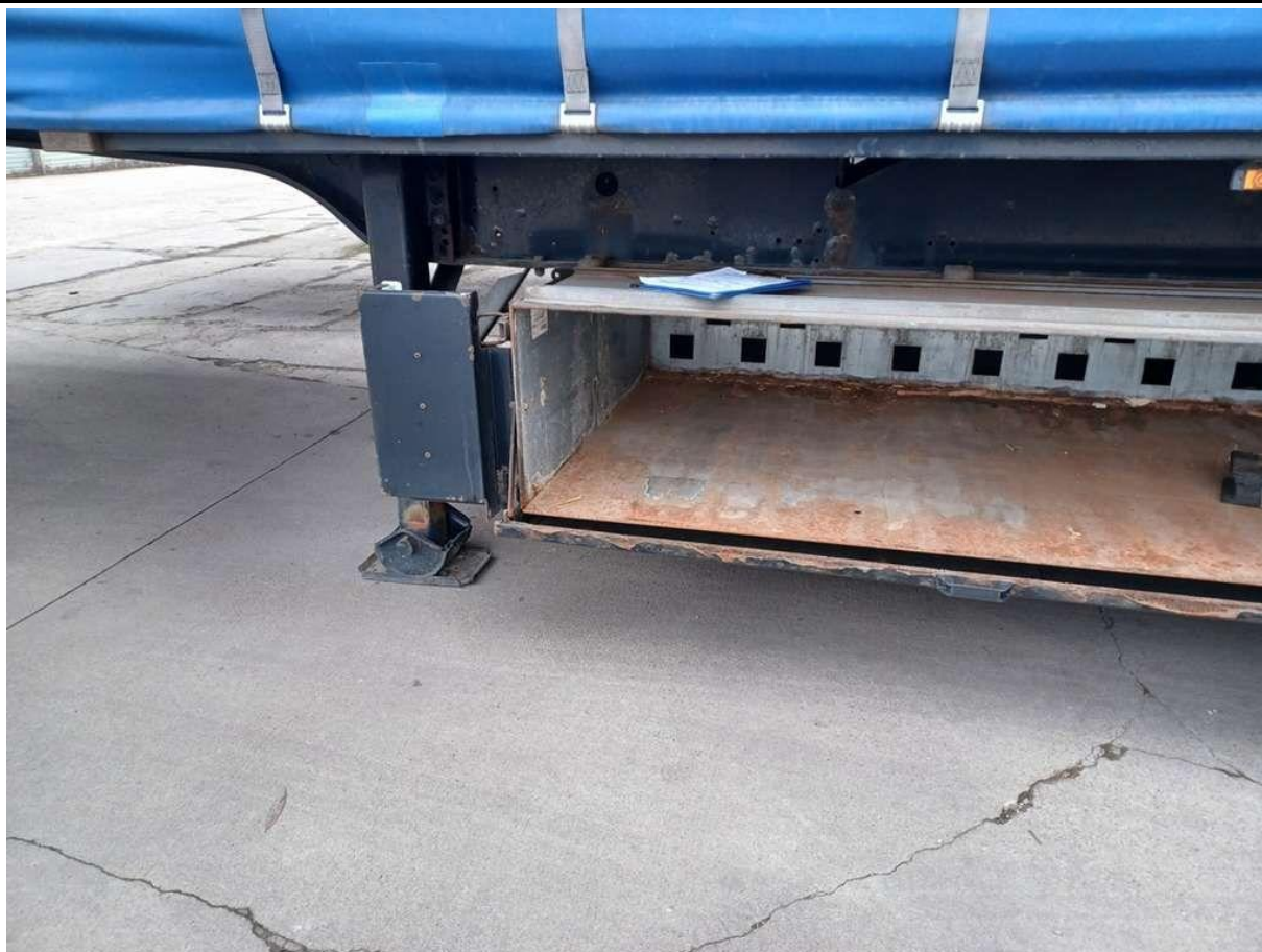
Fot. nr 27