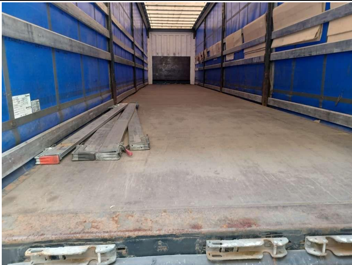
Fot. nr 37