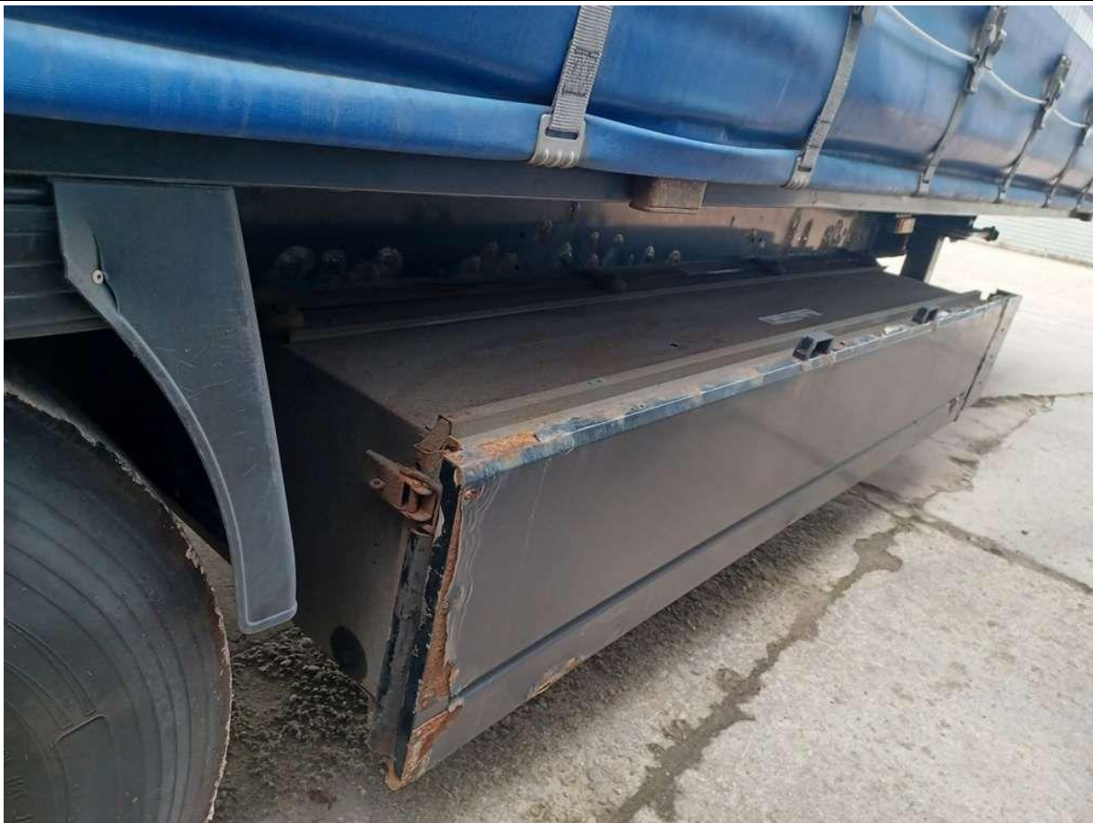
Fot. nr 23