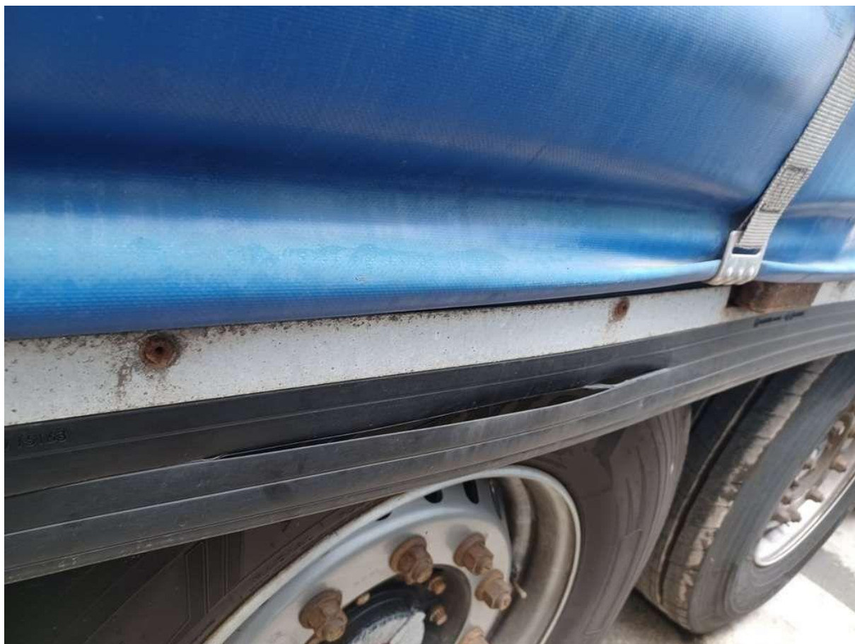
Fot. nr 22