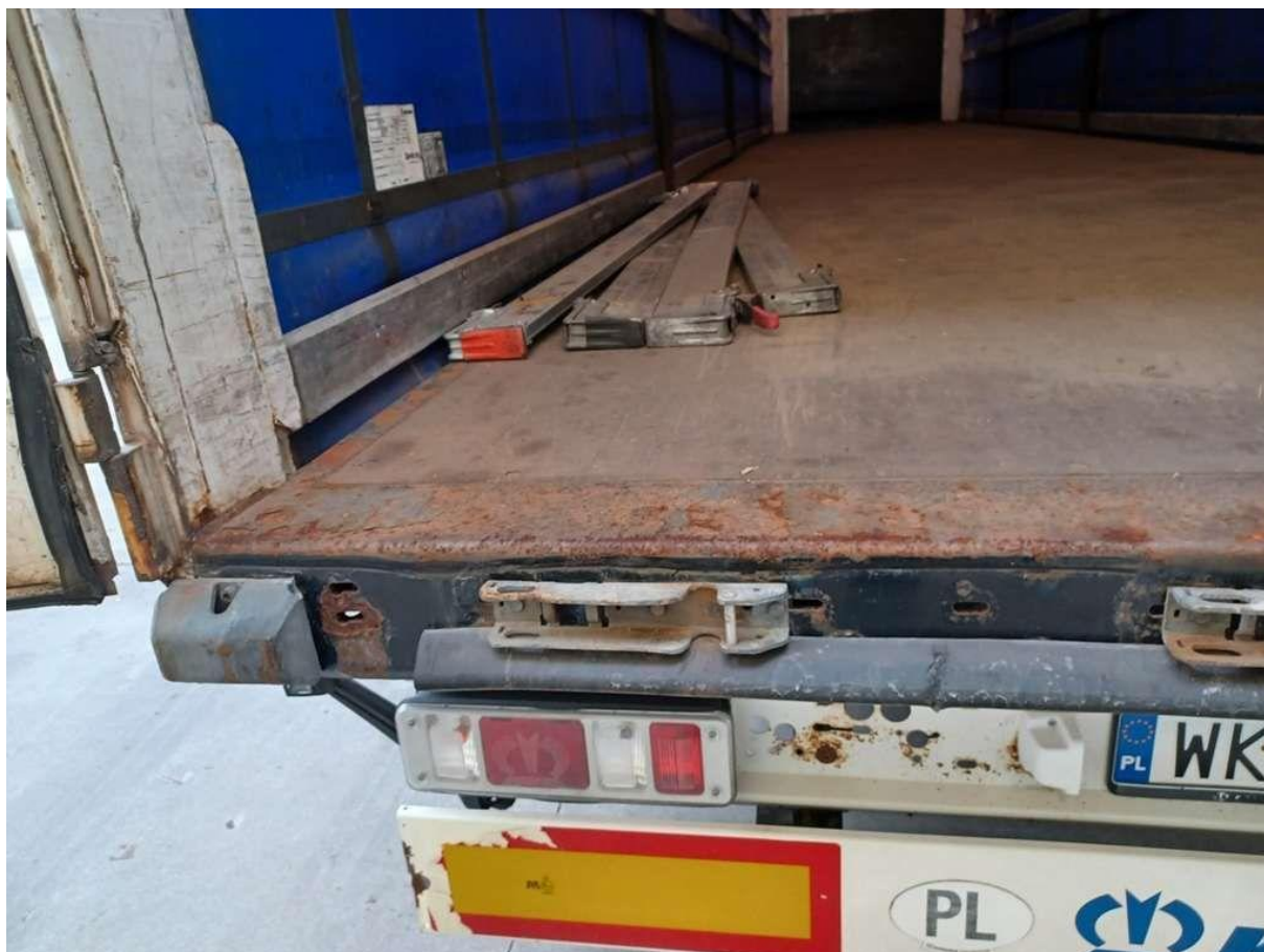
Fot. nr 38