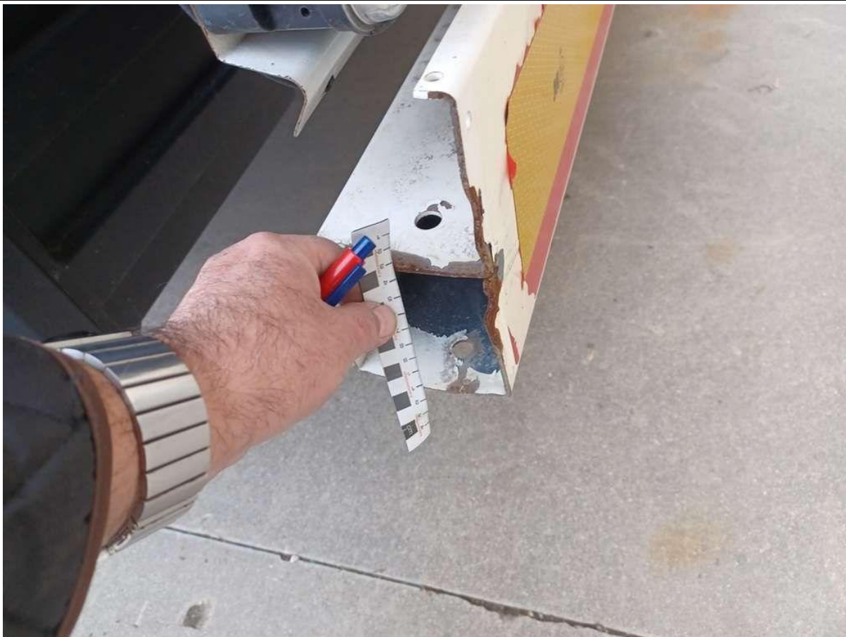
Fot. nr 45