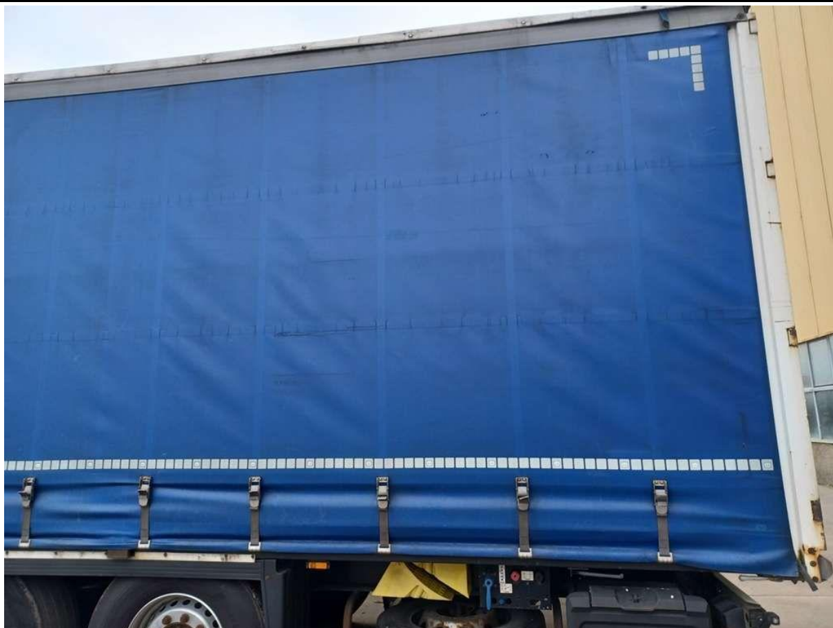
Fot. nr 3