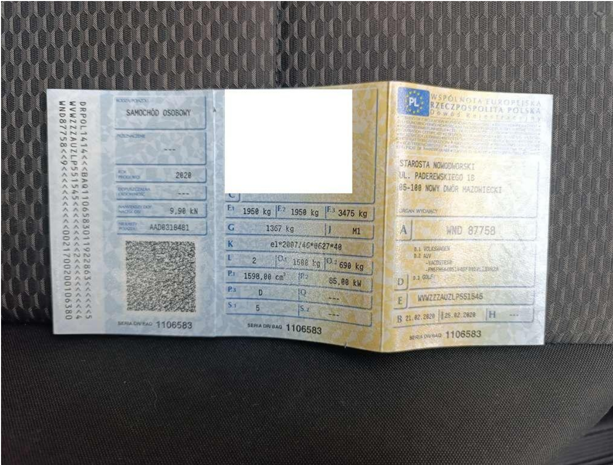
Fot. nr 43