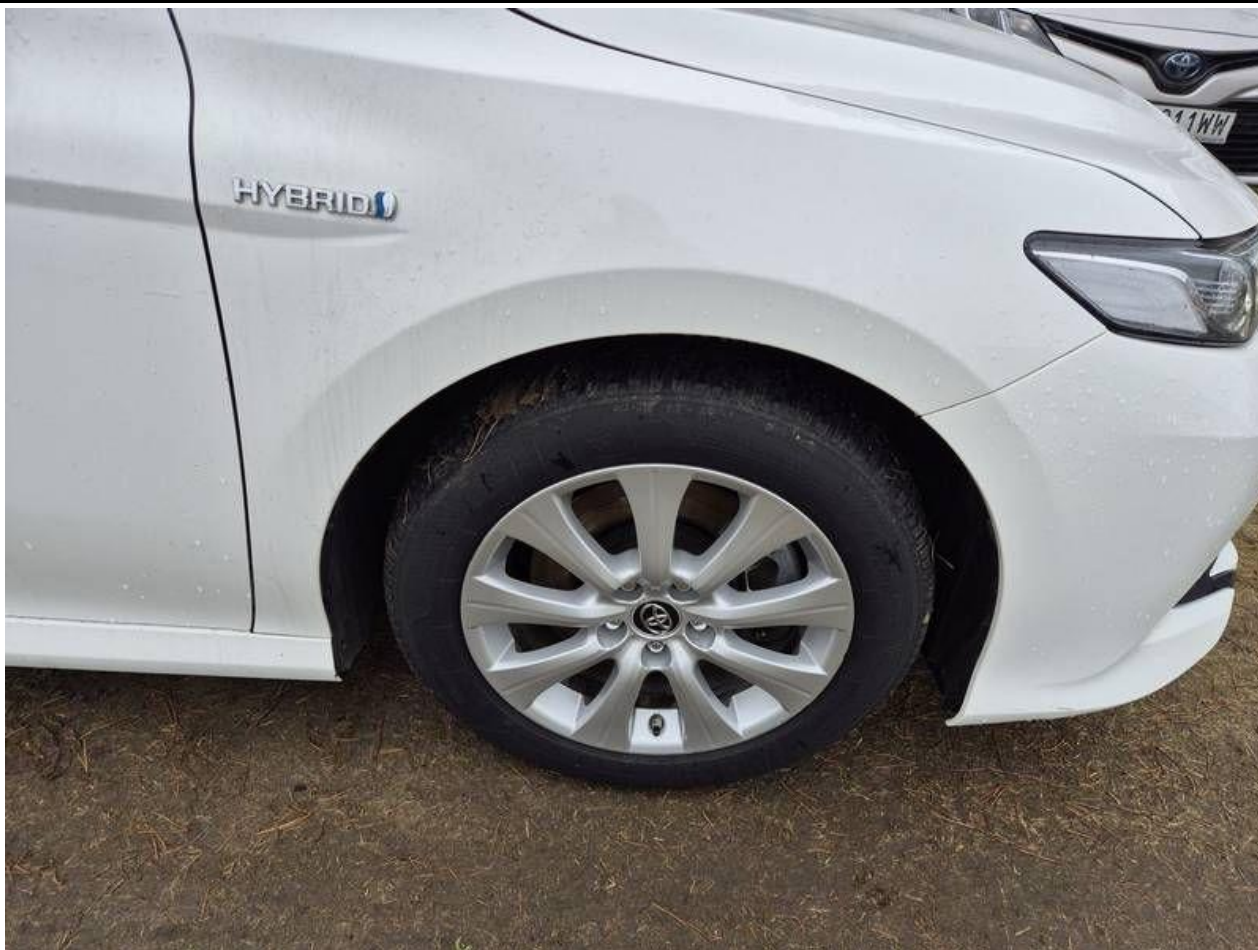
Fot. nr 49