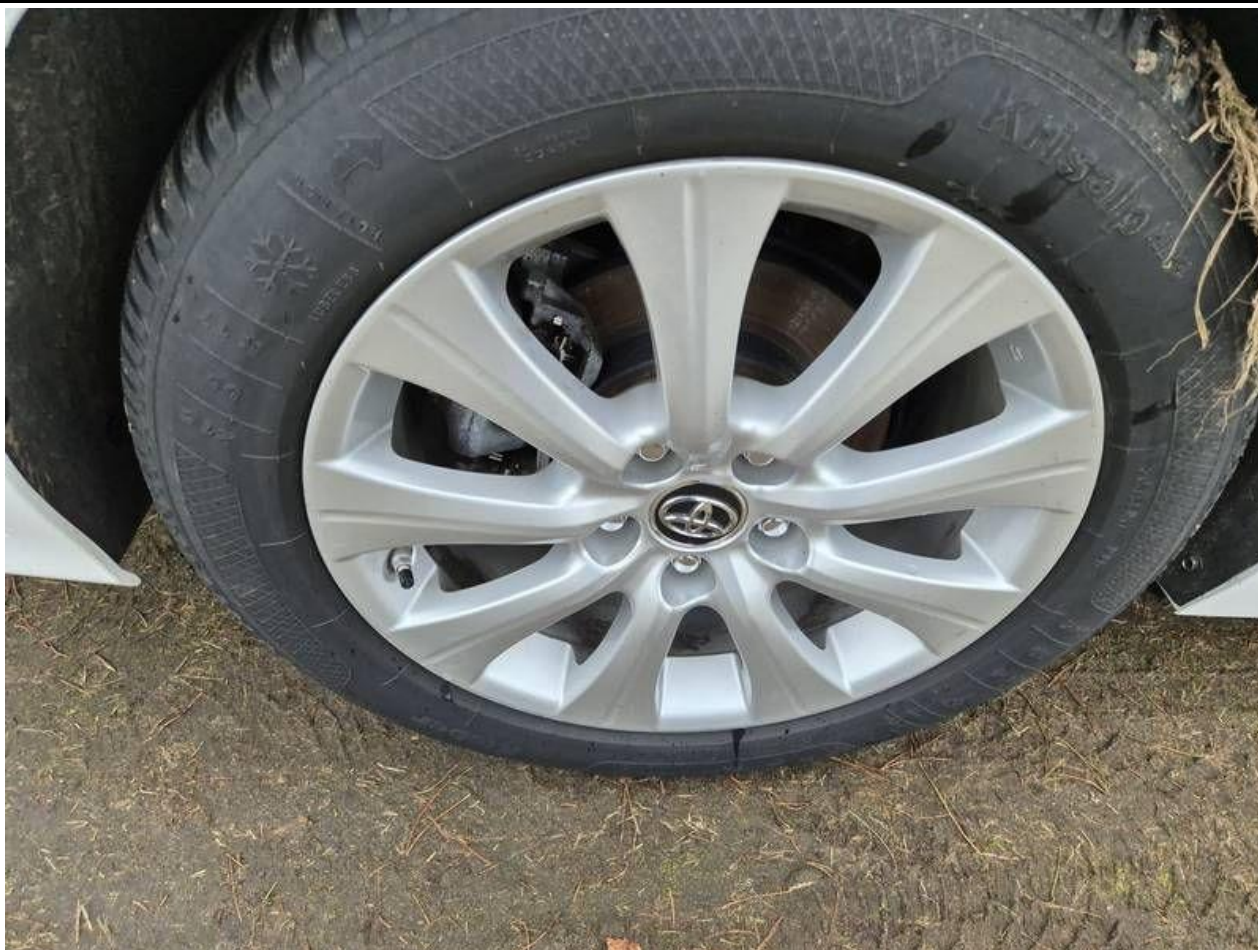
Fot. nr 47