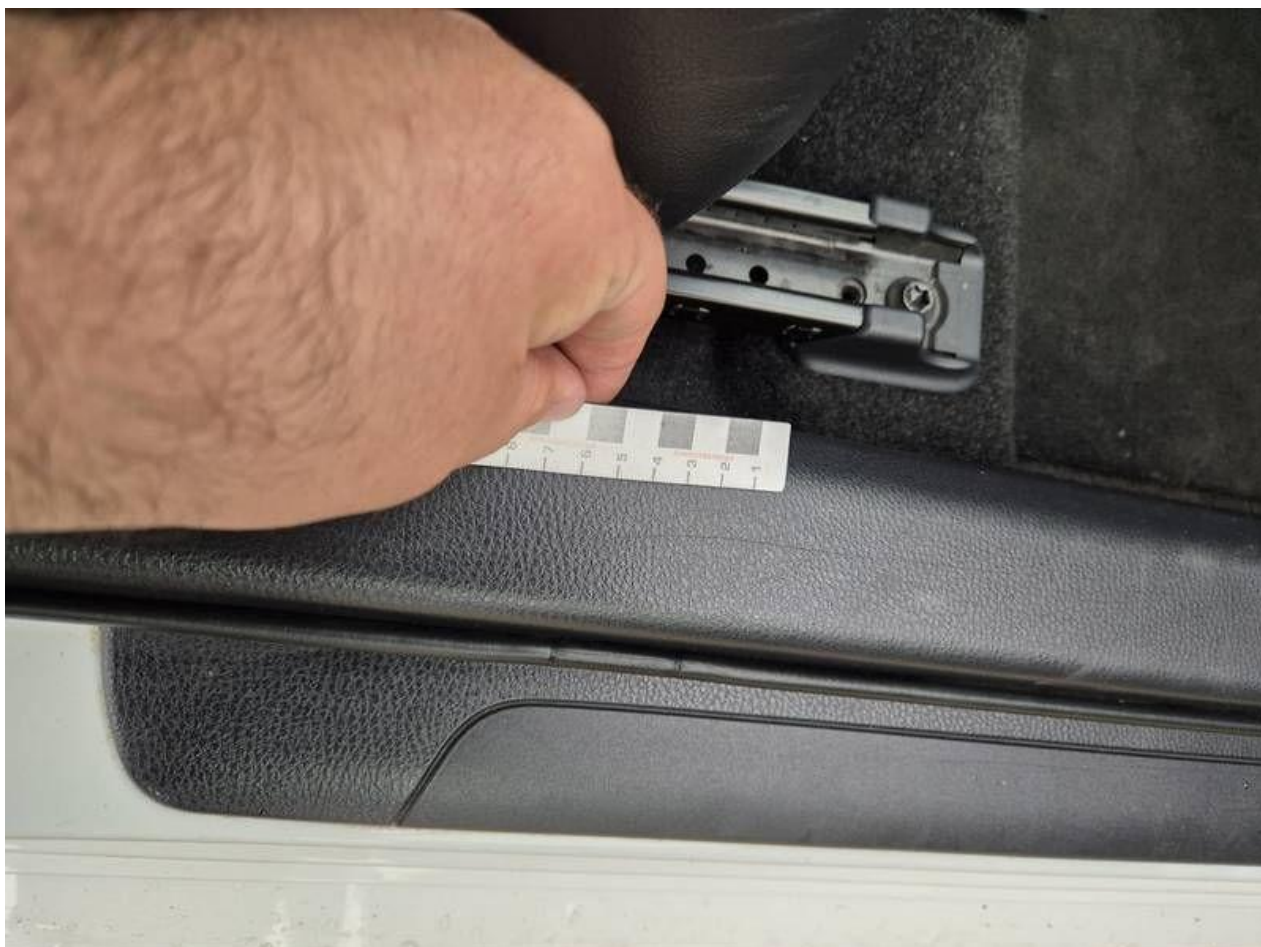
Fot. nr 58