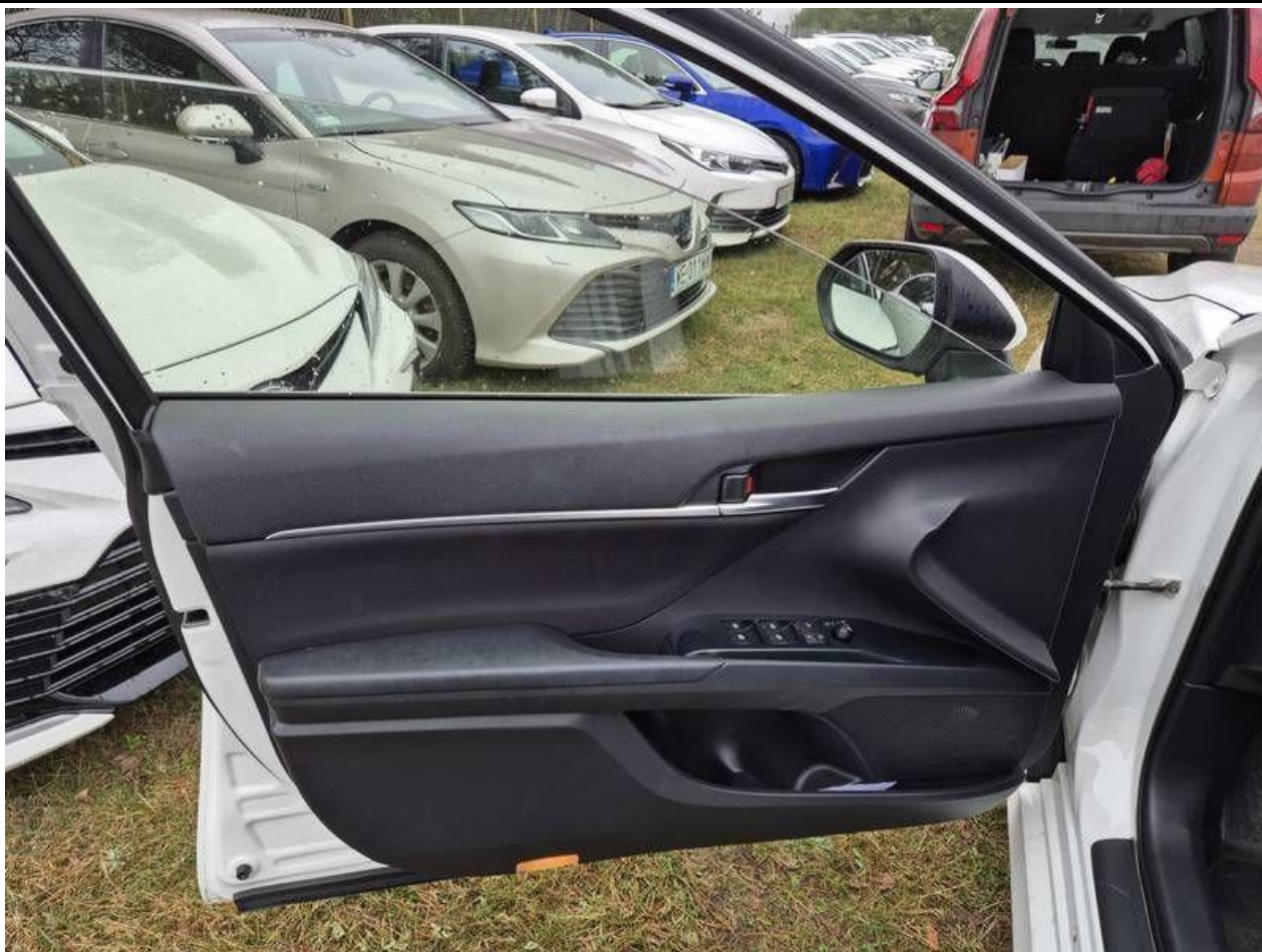
Fot. nr 51