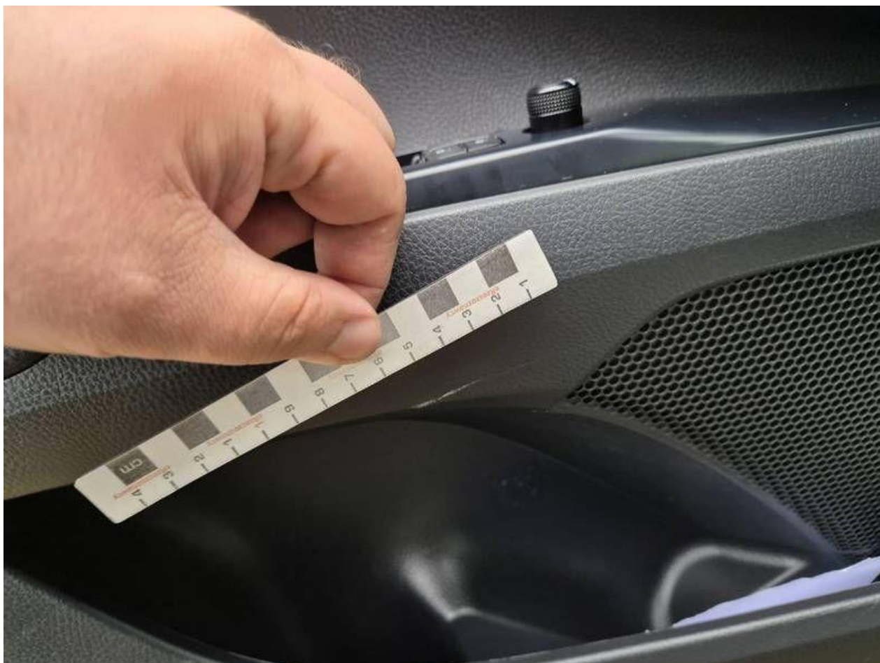
Fot. nr 52