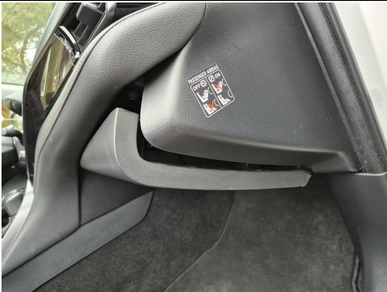
Fot. nr 59