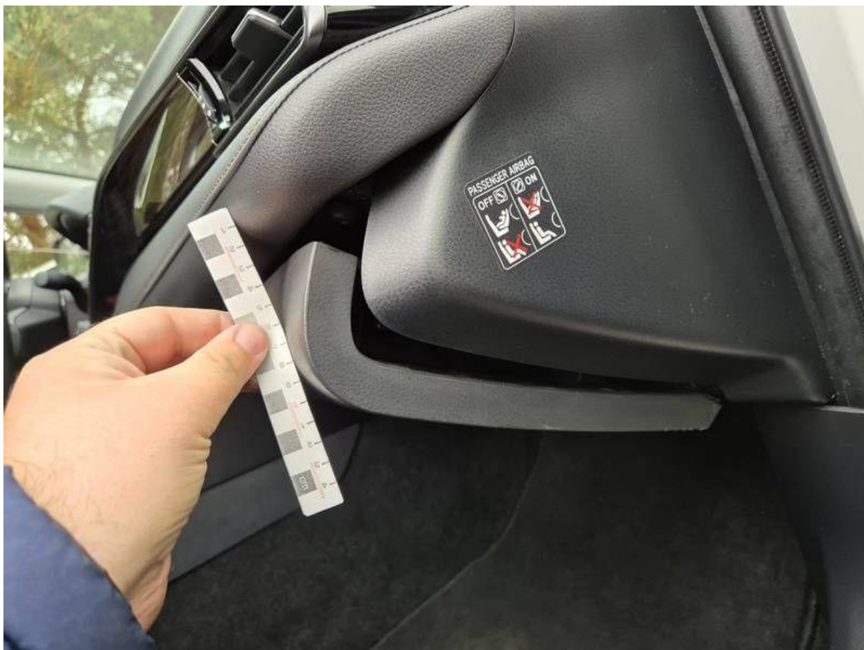
Fot. nr 60