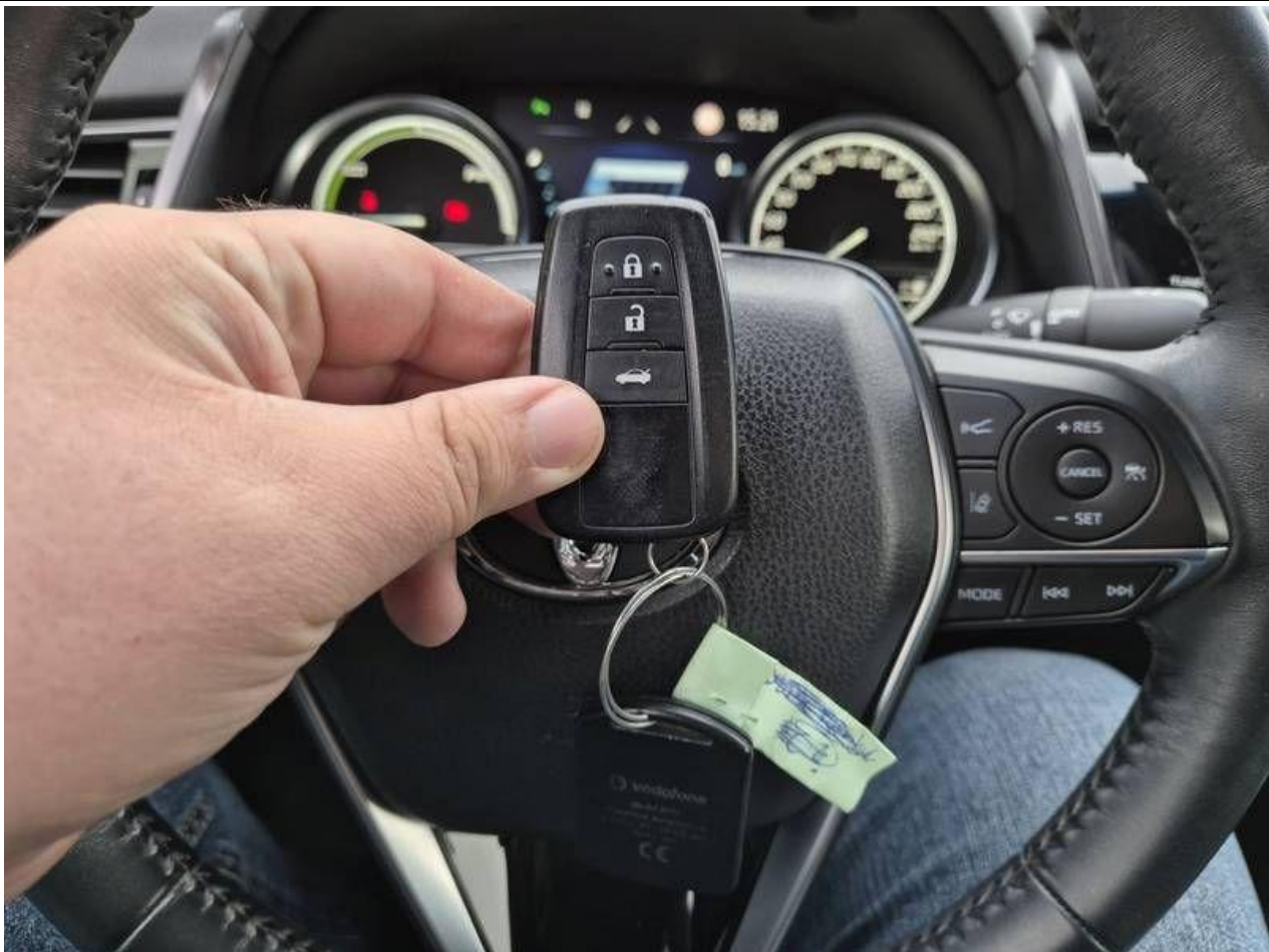
Fot. nr 61