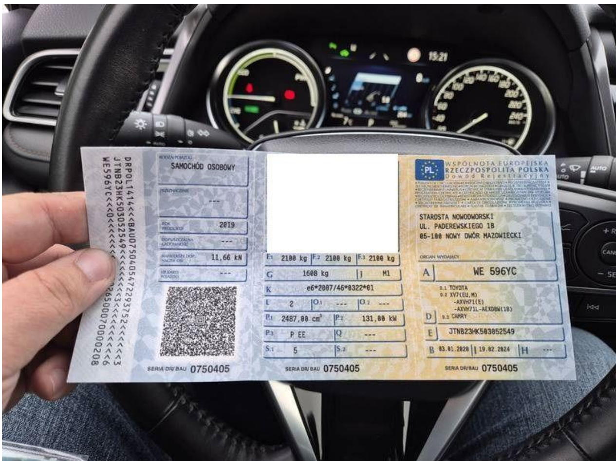
Fot. nr 62