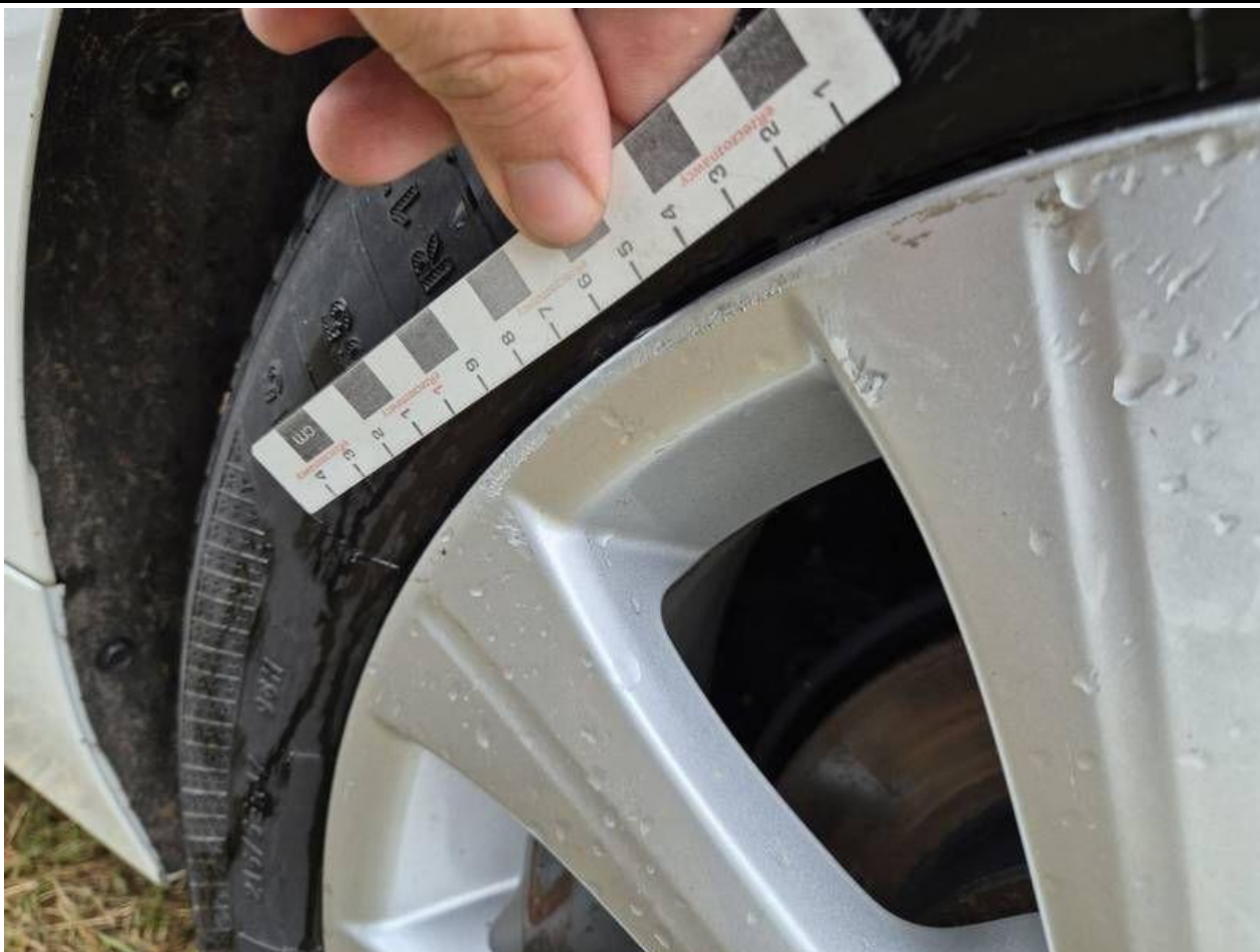
Fot. nr 55