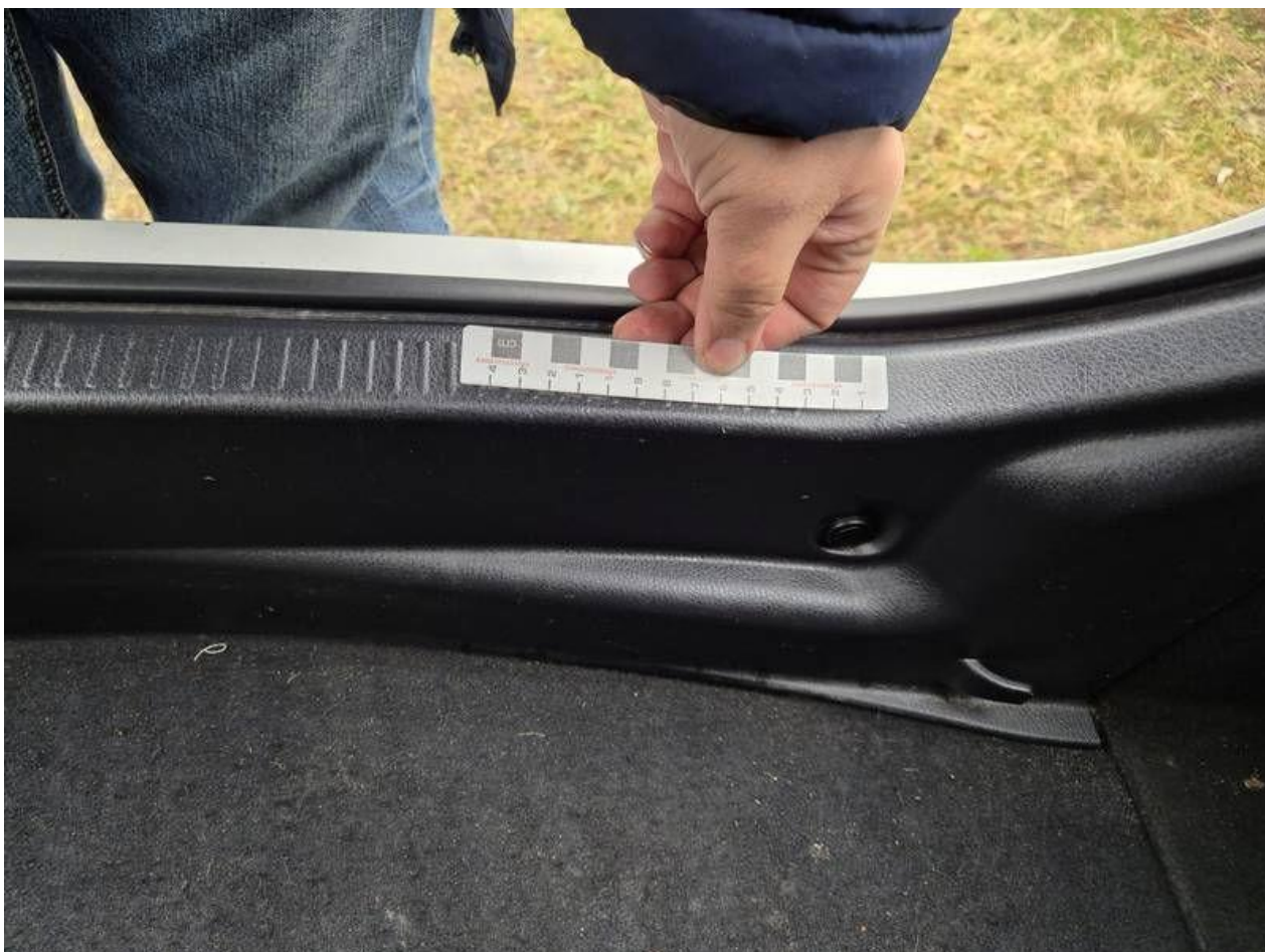
Fot. nr 56