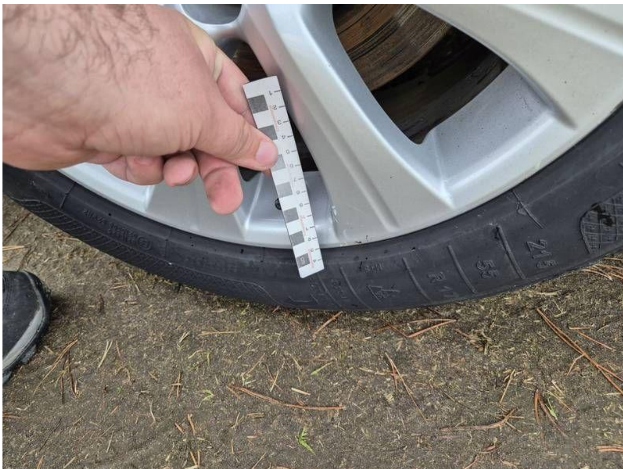
Fot. nr 50