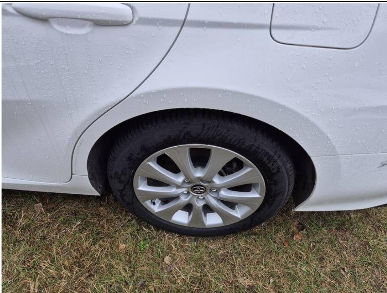
Fot. nr 53