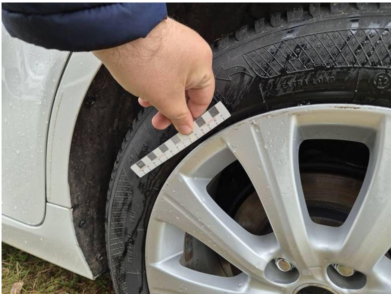
Fot. nr 54