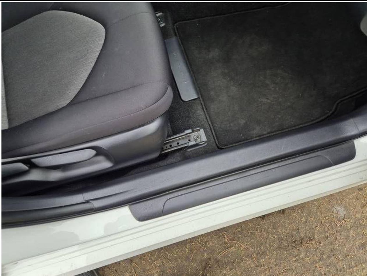
Fot. nr 57