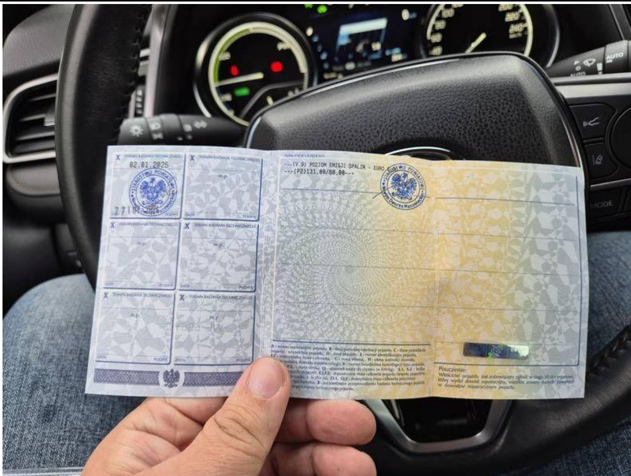
Fot. nr 63