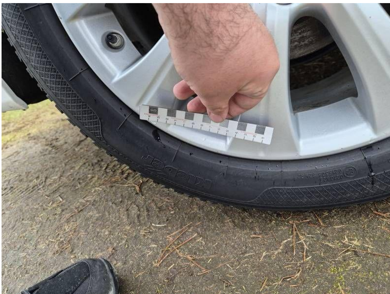
Fot. nr 48