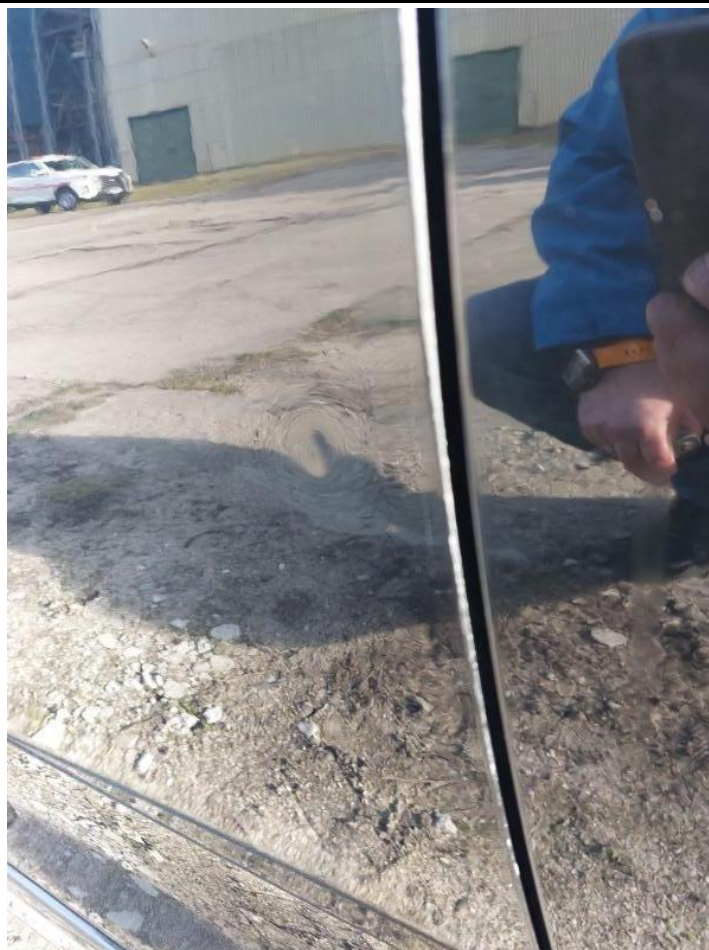
Fot. nr 109