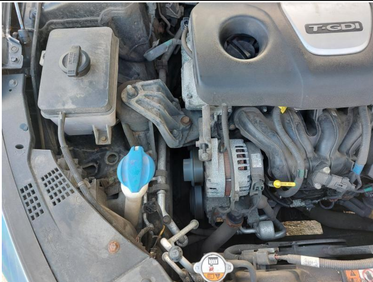
Fot. nr 105