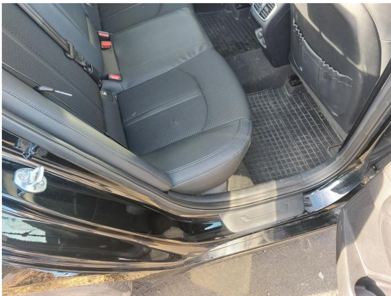
Fot. nr 96