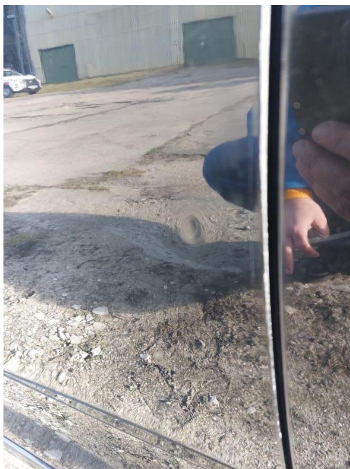
Fot. nr 110