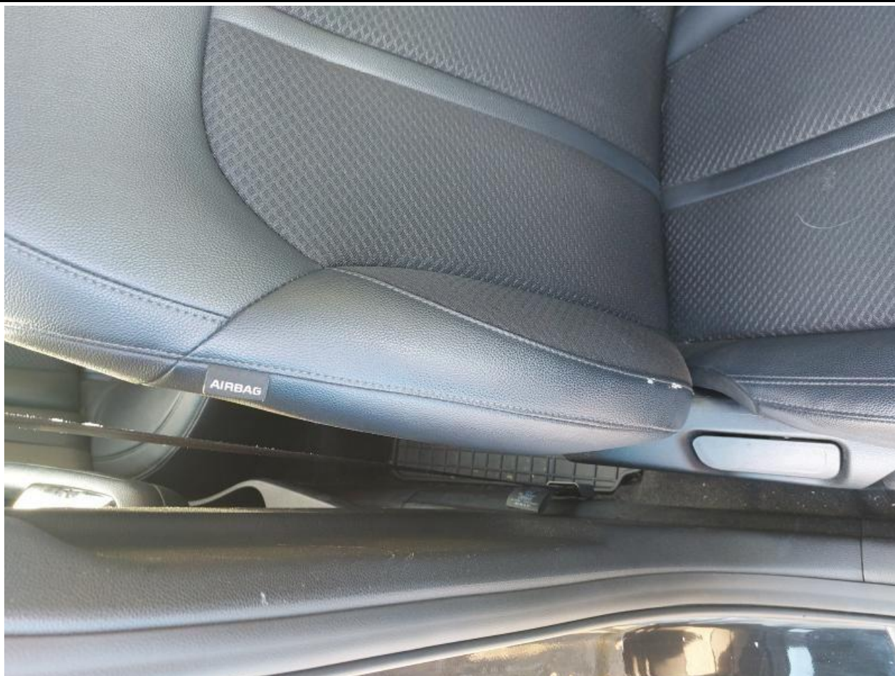
Fot. nr 101