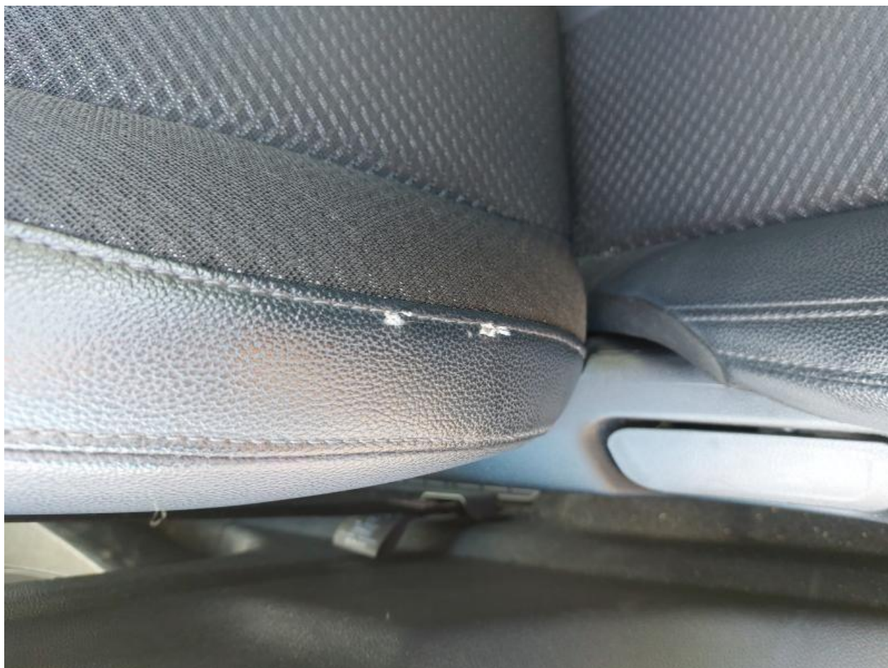
Fot. nr 102