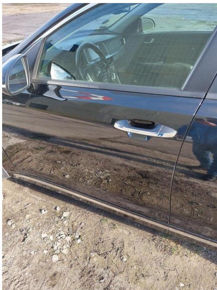
Fot. nr 108