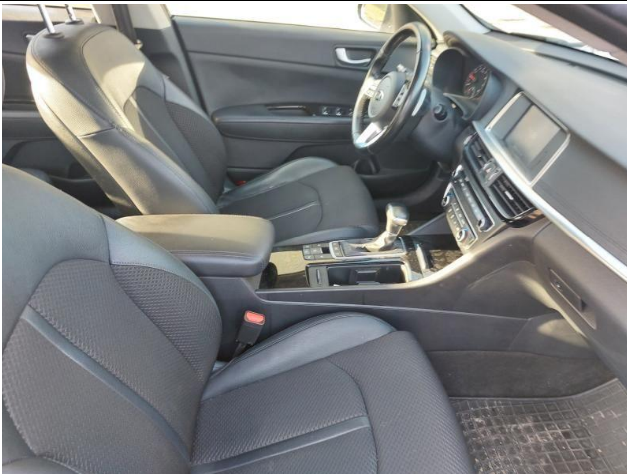
Fot. nr 103