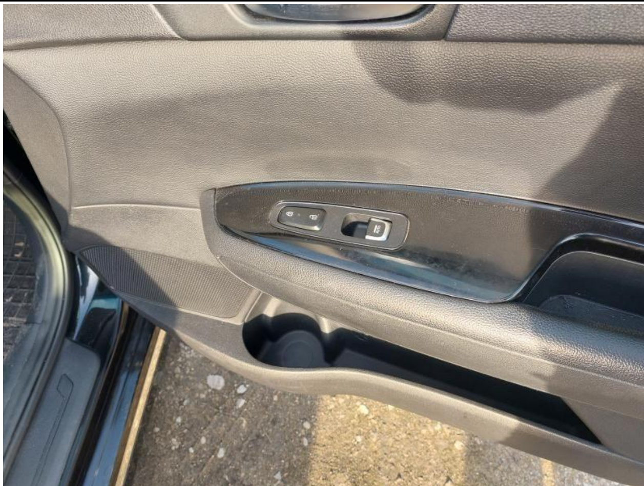
Fot. nr 99