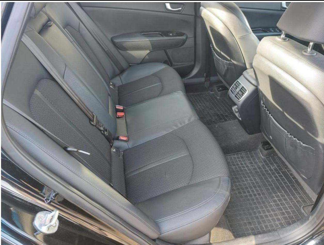
Fot. nr 97