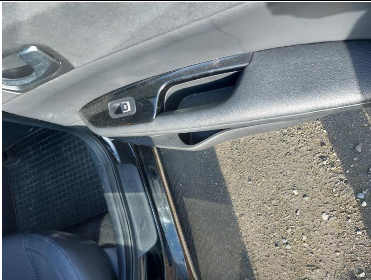
Fot. nr 95