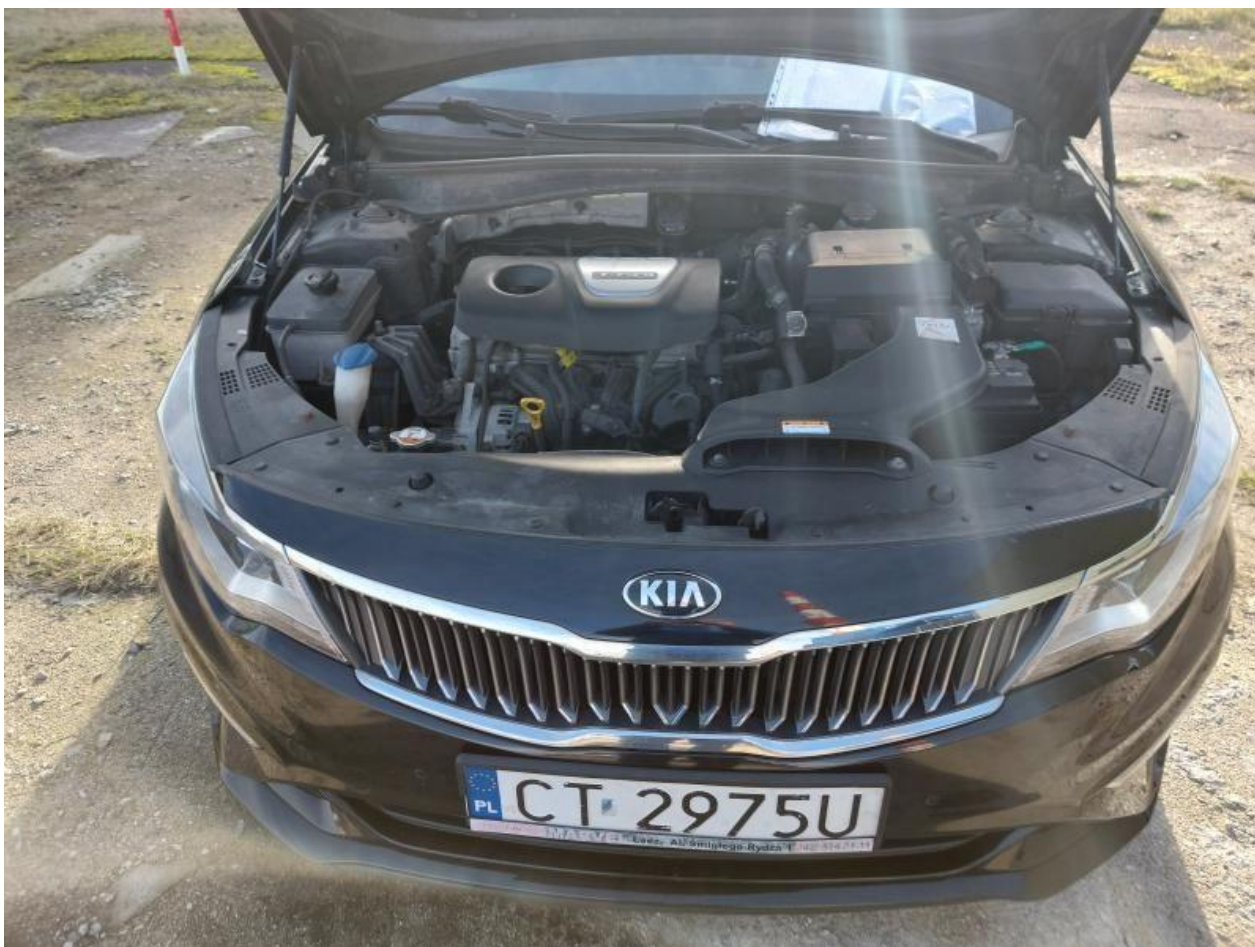
Fot. nr 104