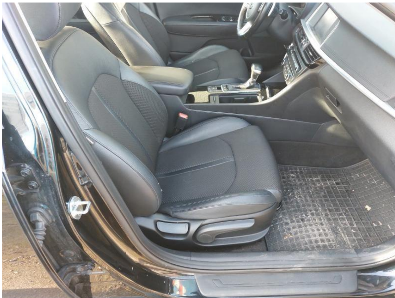
Fot. nr 100