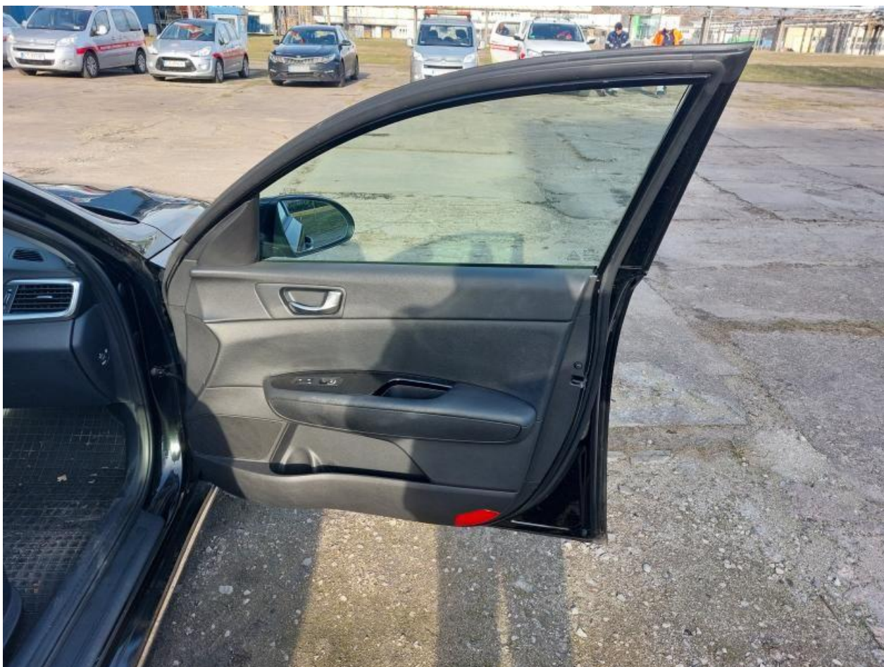
Fot. nr 98