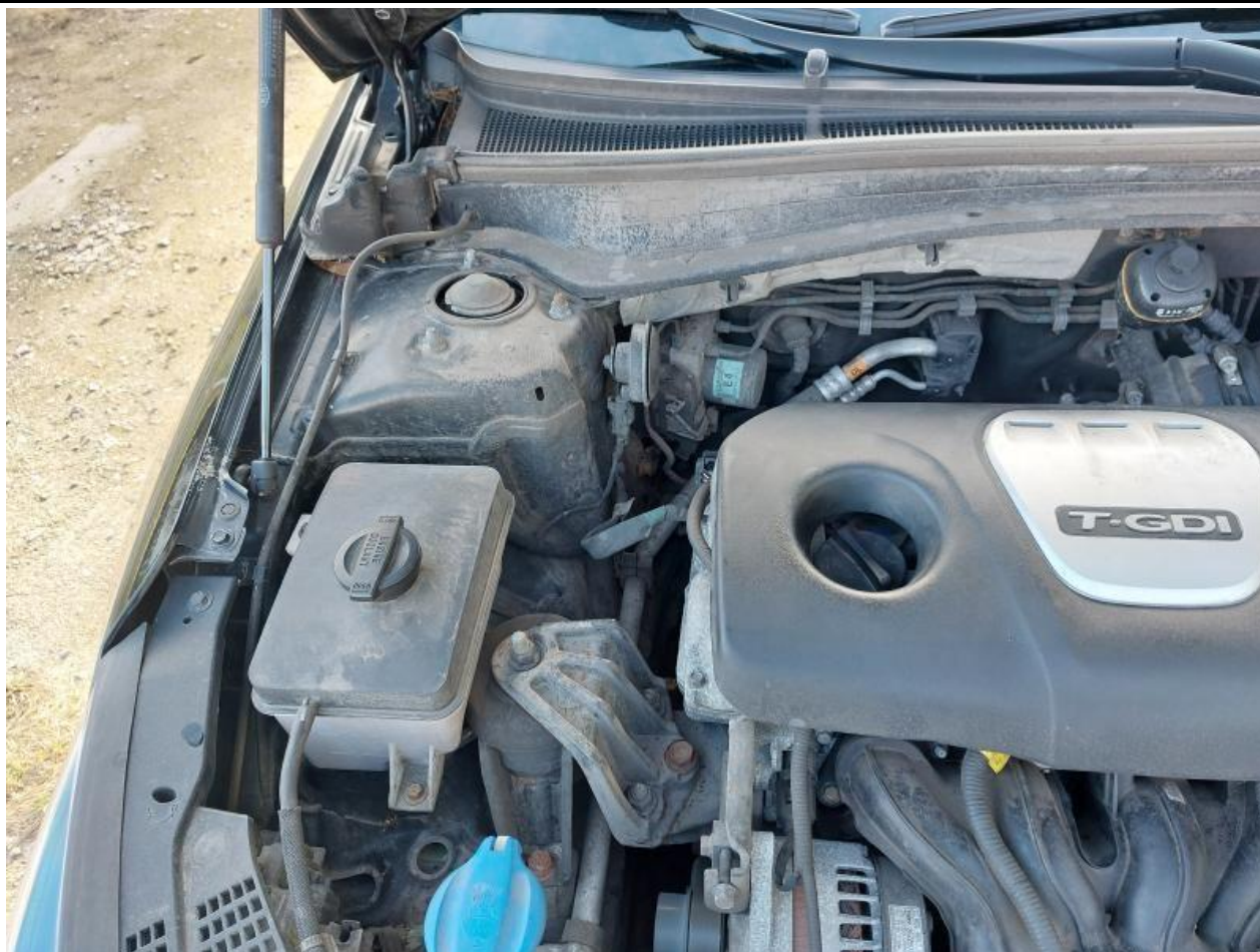
Fot. nr 107