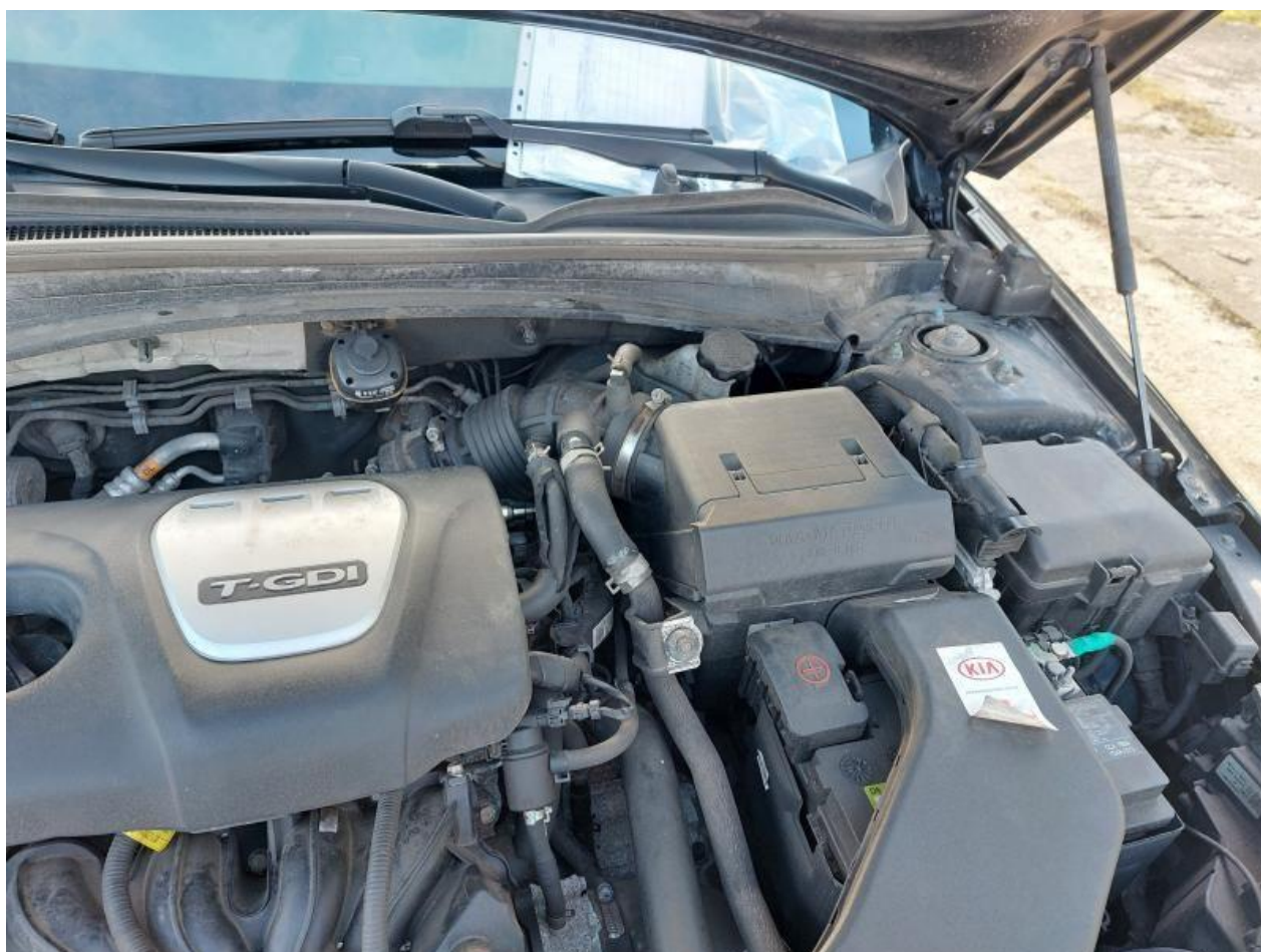
Fot. nr 106