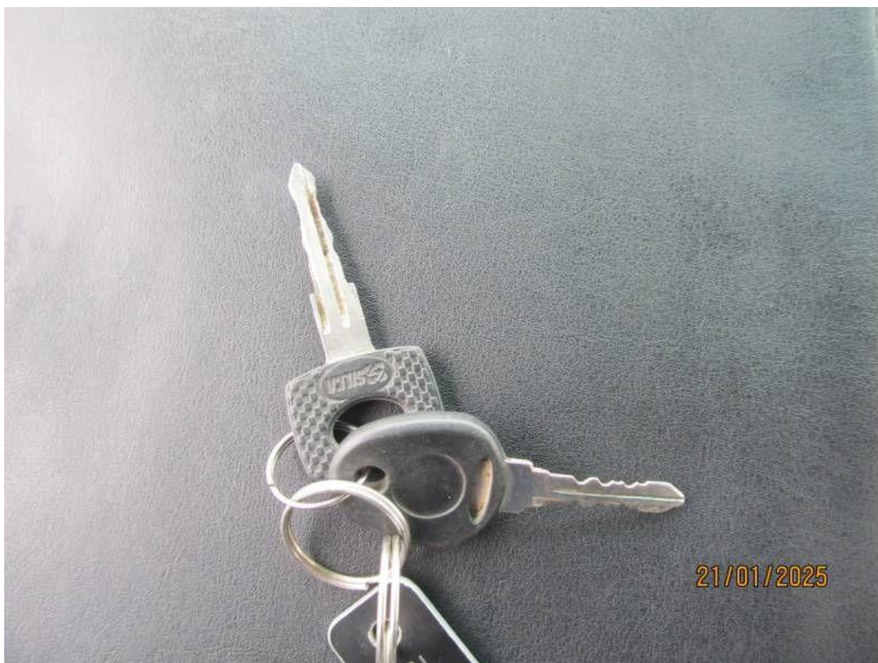
Fot. nr 80