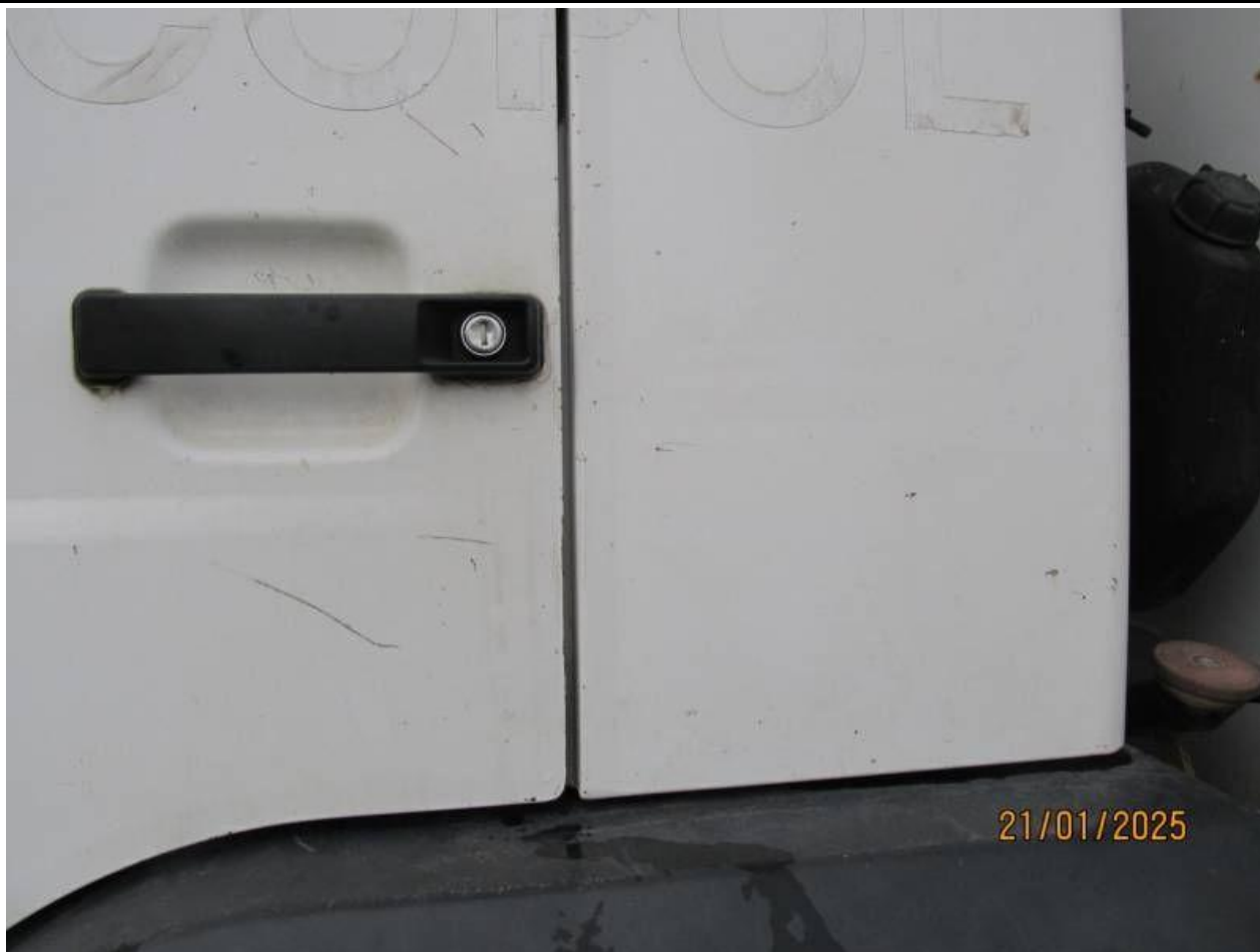
Fot. nr 77