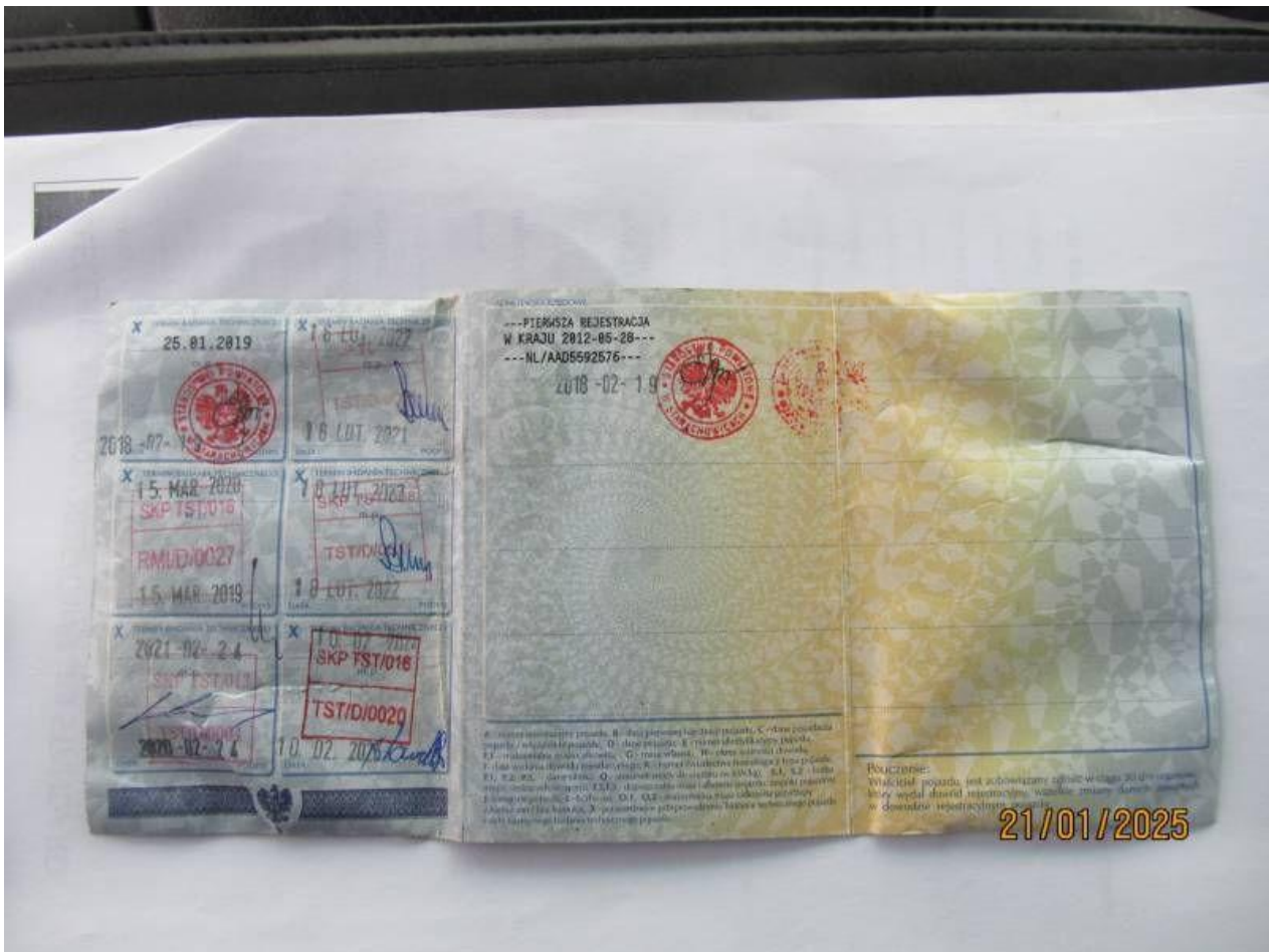
Fot. nr 84

Dokument wystawiony elektronicznie, wa ny bez podpisu