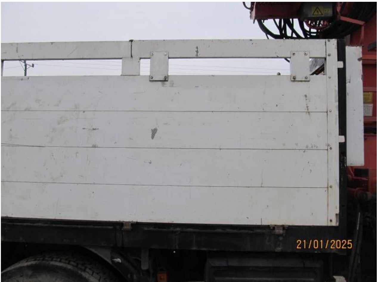
Fot. nr 70