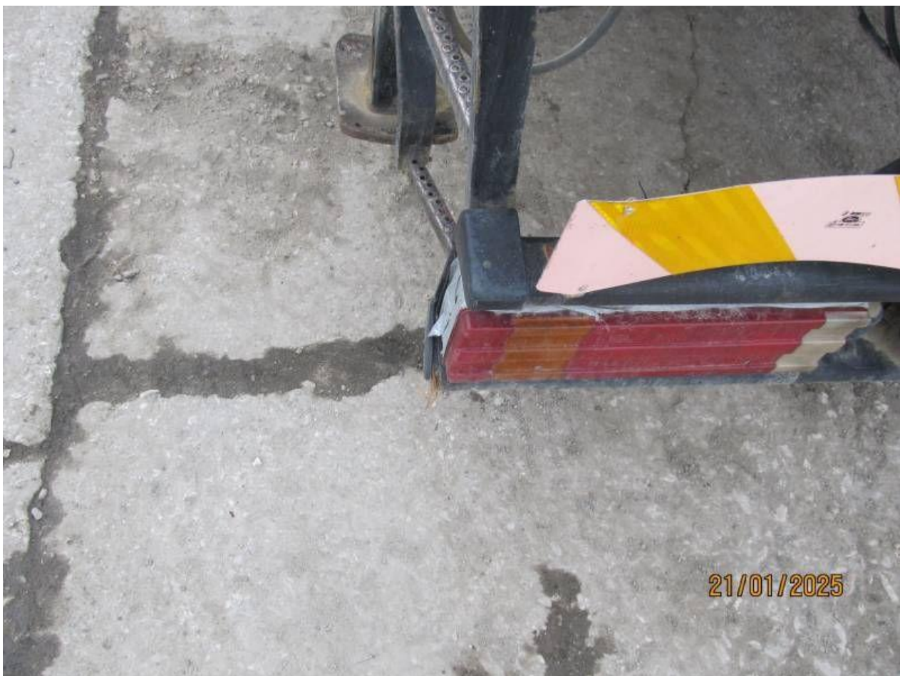
Fot. nr 66