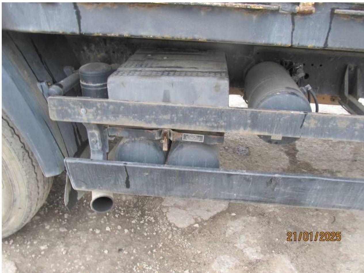
Fot. nr 74