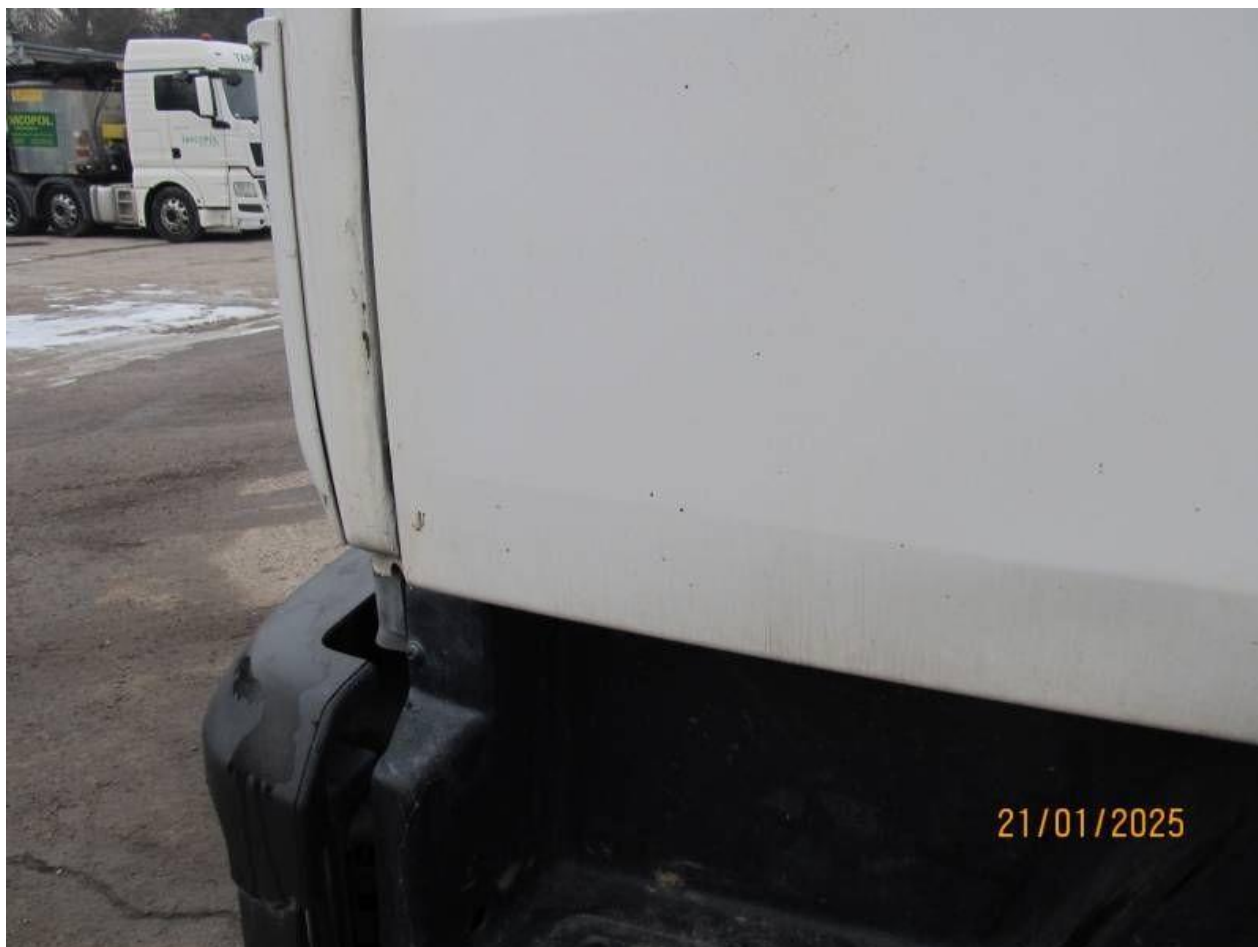
Fot. nr 76