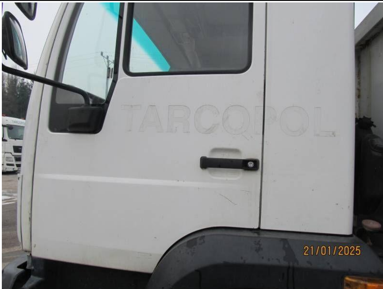
Fot. nr 75