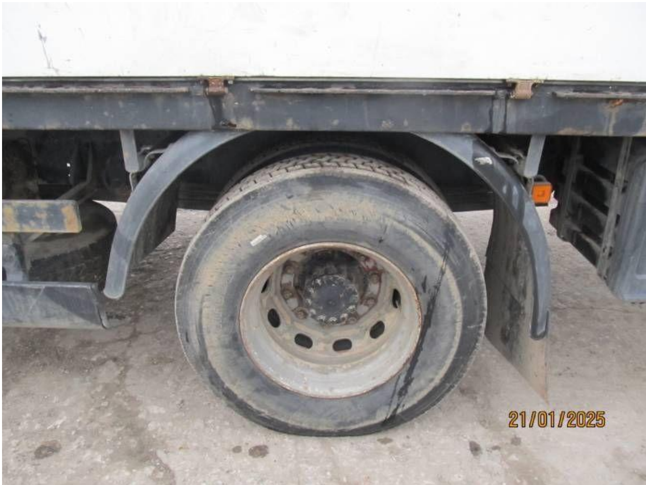
Fot. nr 71