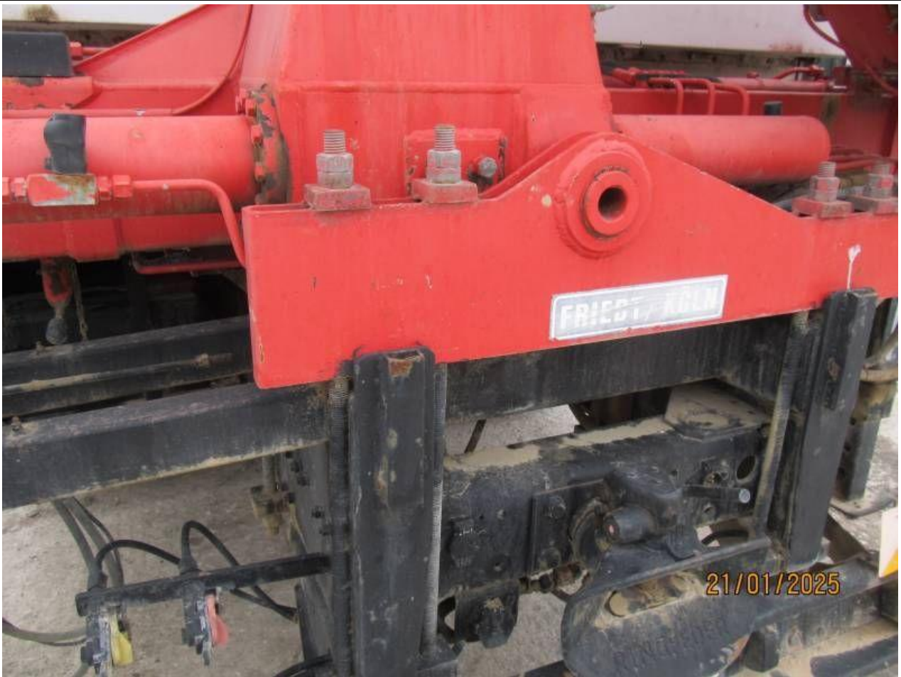
Fot. nr 69