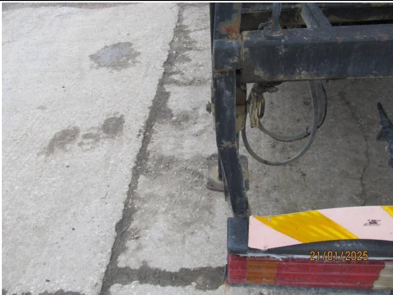
Fot. nr 67