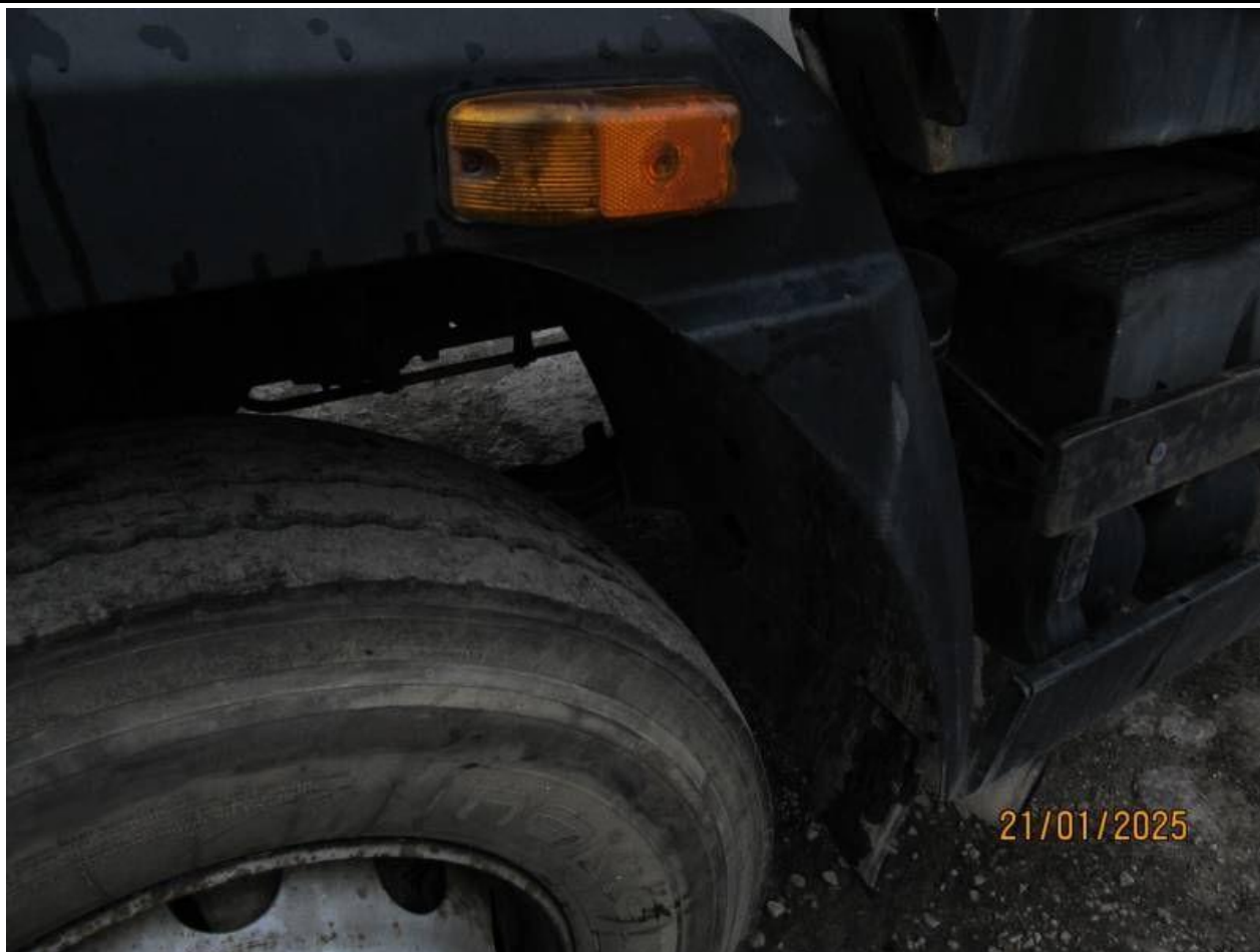
Fot. nr 79