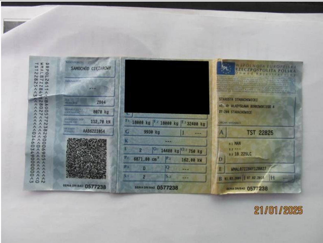
Fot. nr 83