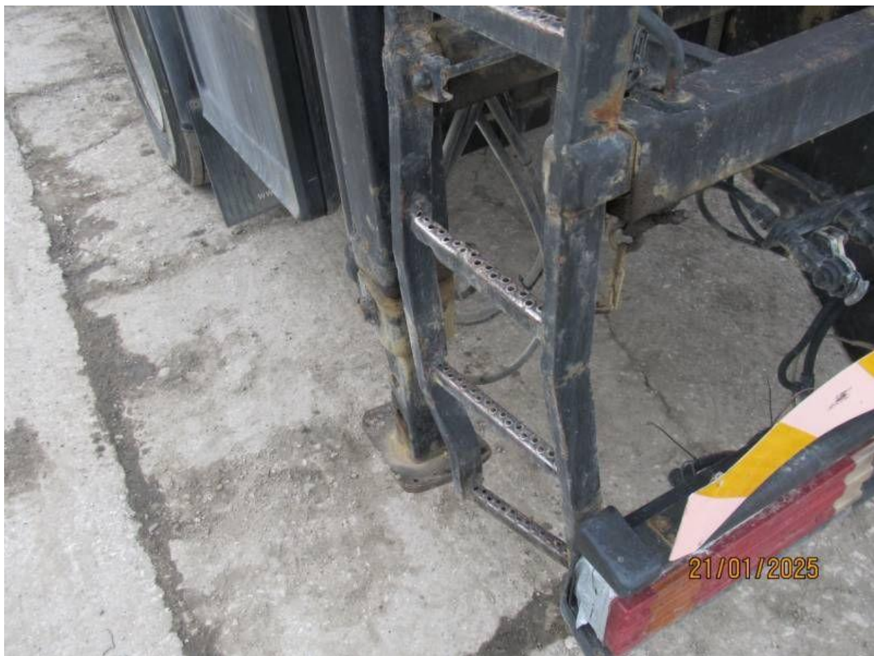
Fot. nr 68