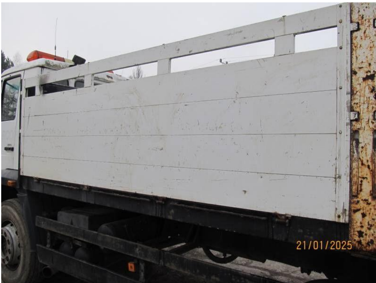
Fot. nr 72