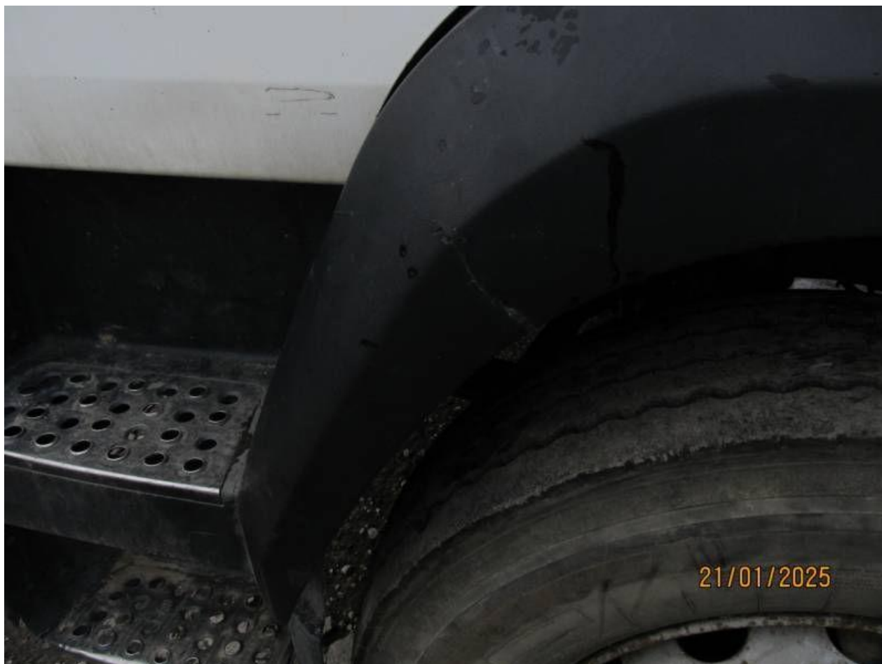
Fot. nr 78