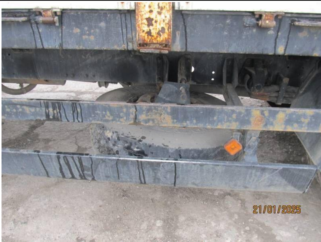
Fot. nr 73