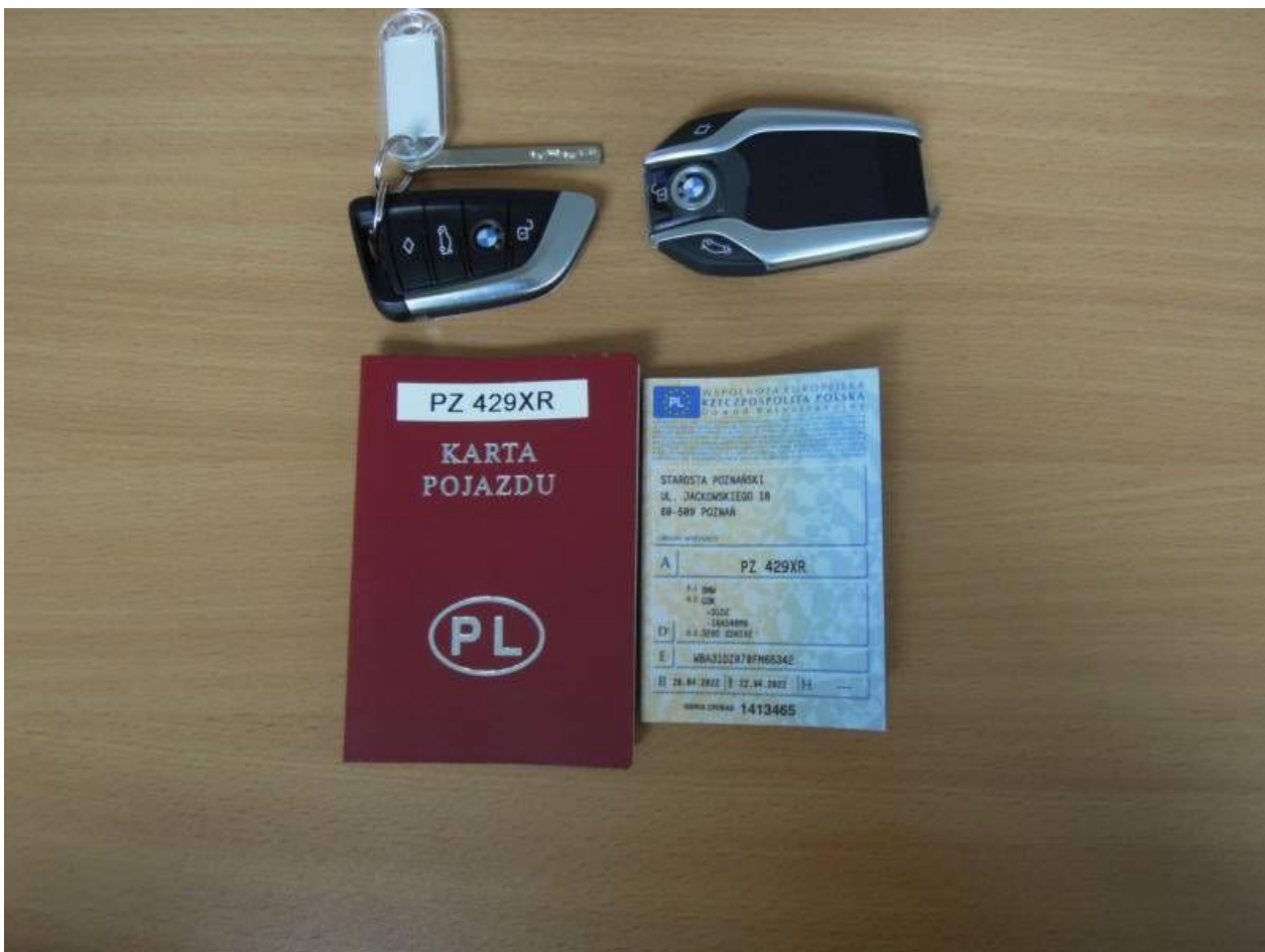
Fot. nr 66