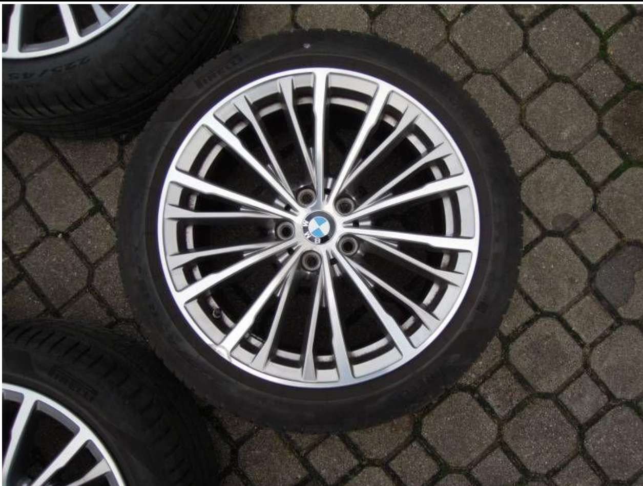
Fot. nr 65