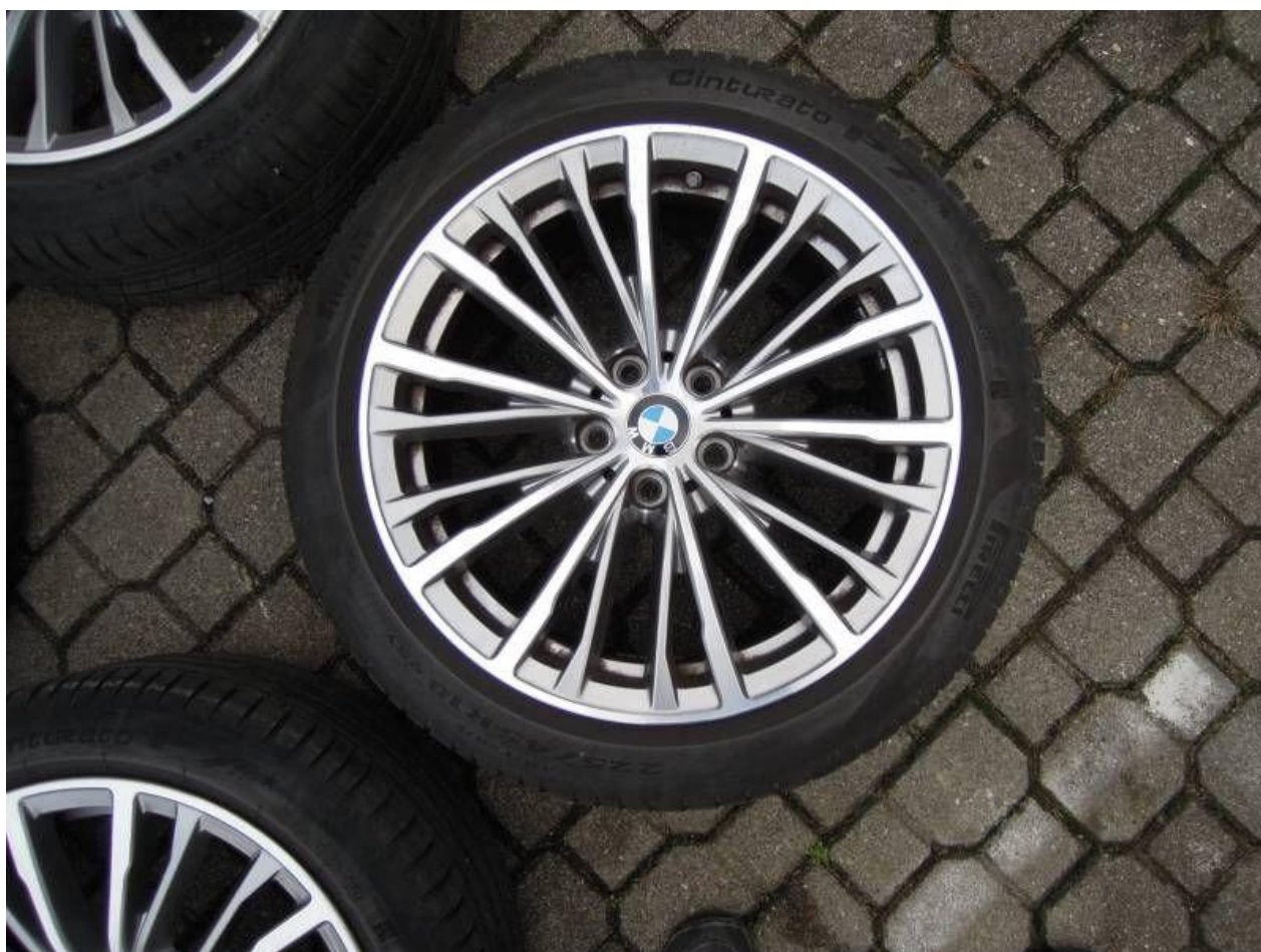
Fot. nr 64