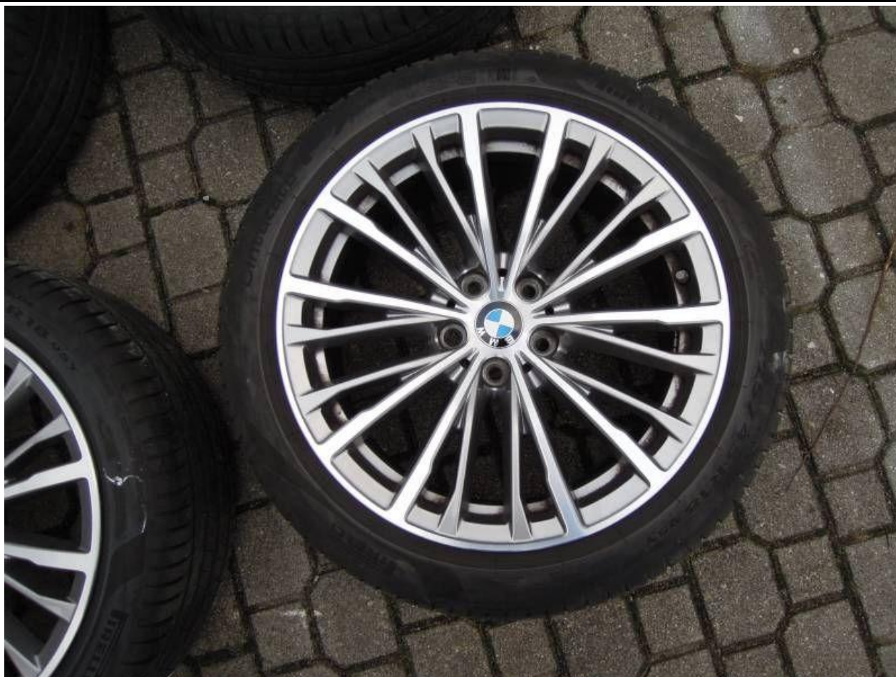
Fot. nr 63