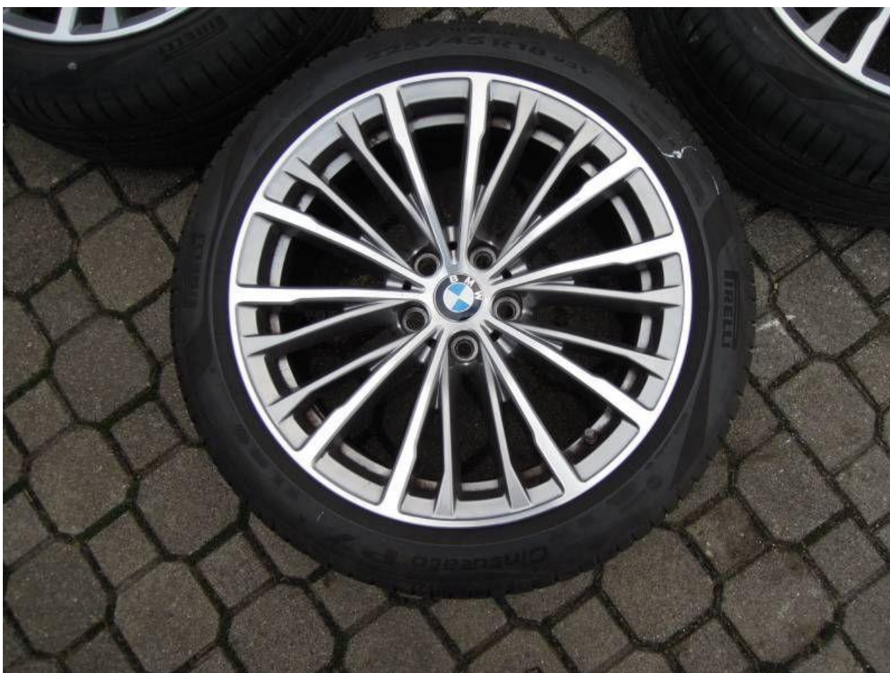
Fot. nr 62