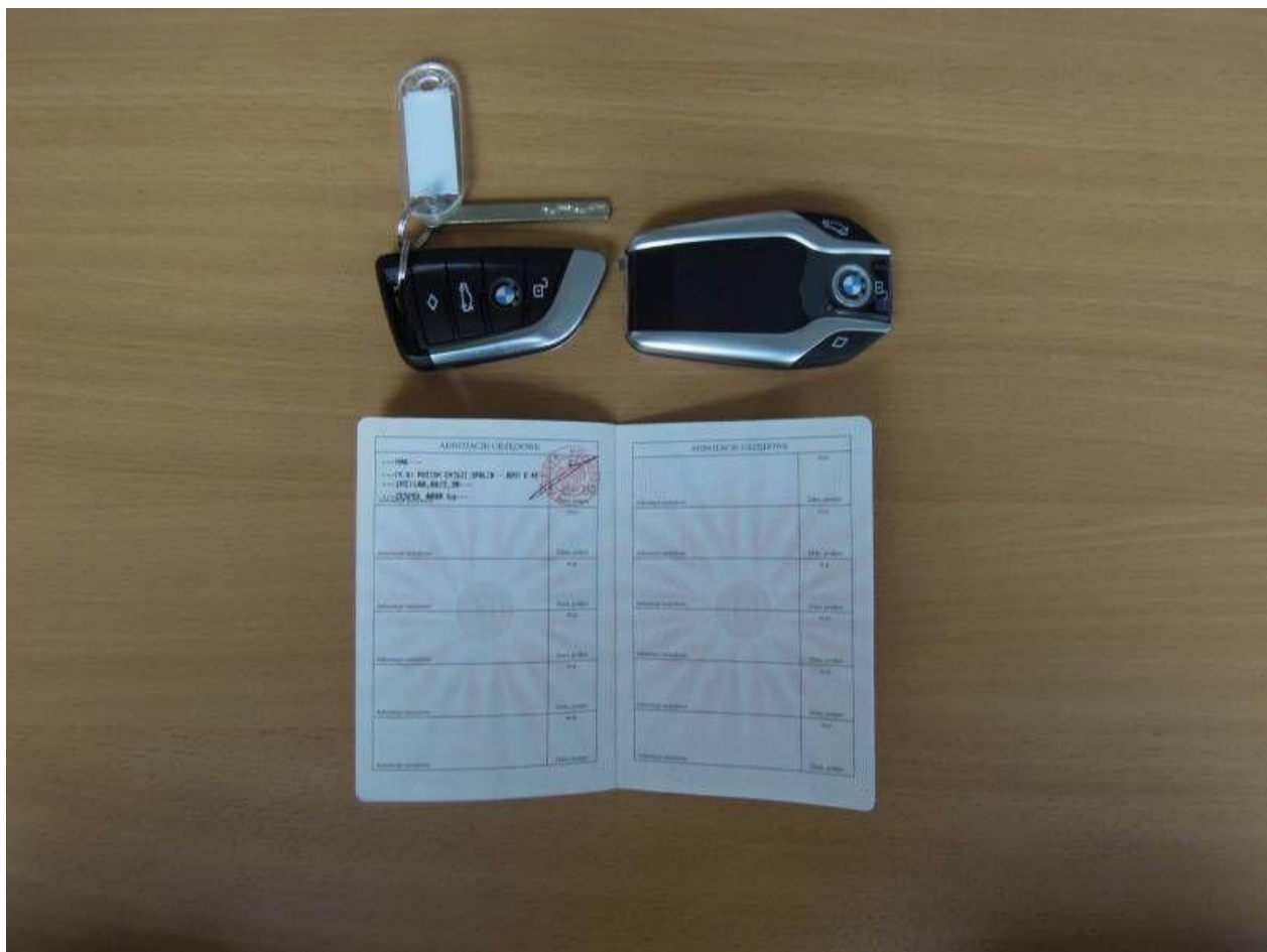
Fot. nr 70

Dokument wystawiony elektronicznie, wa ny bez podpisu