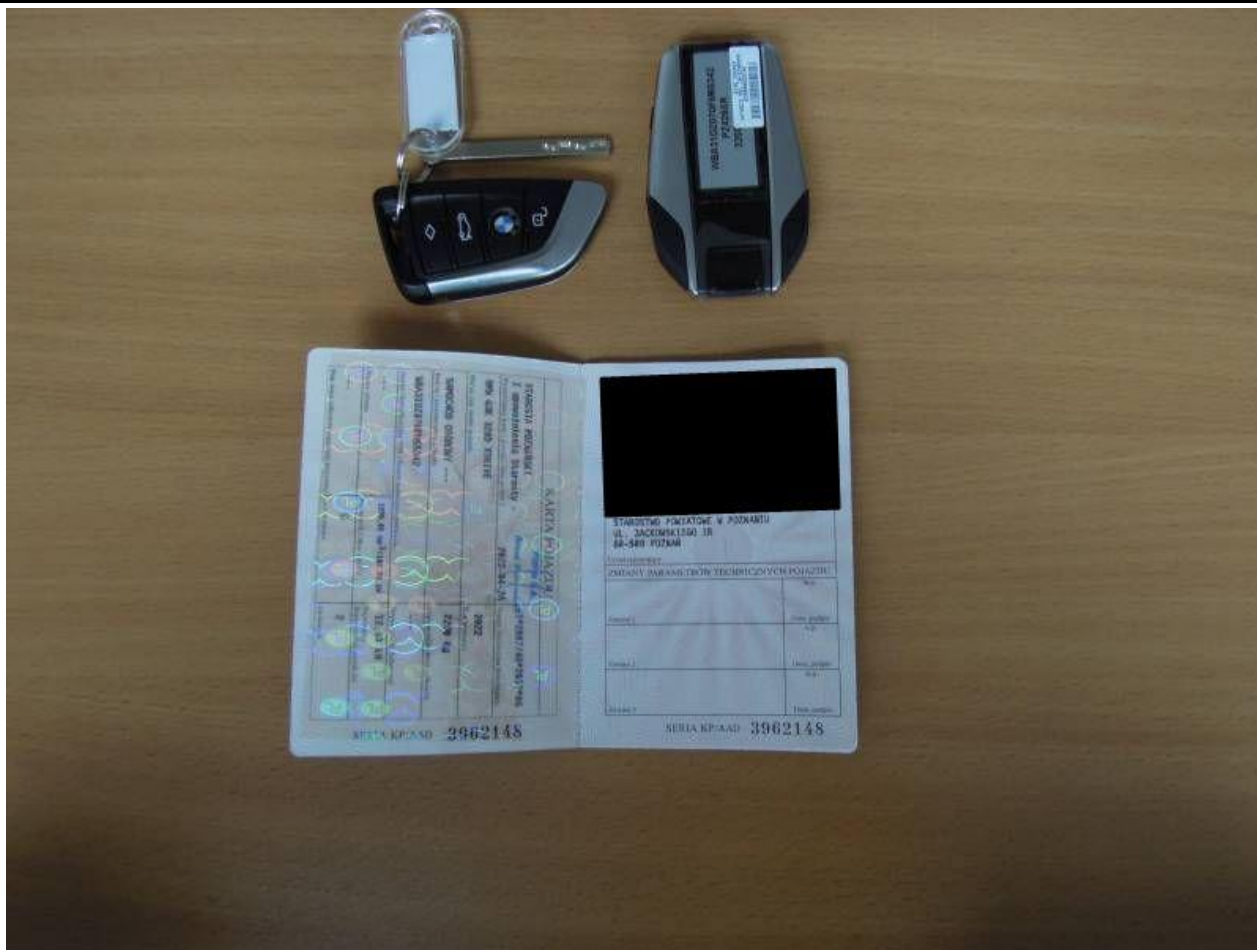
Fot. nr 69