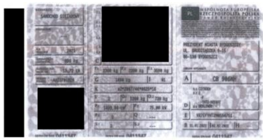
Fot. 20. Dowód rejestracyjny.