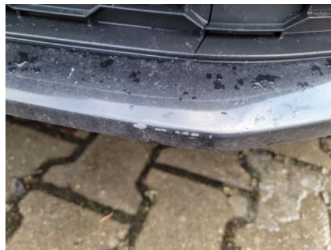
Fot. 42 Zderzak przedni cz dolna - Rysa/odprysk 1