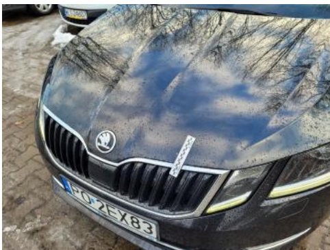
Fot. 37 Pokrywa komory silnika - zdjęcie poglądowe 1