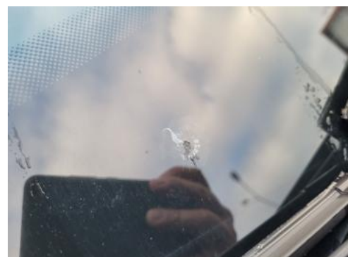
Fot. 40 Szyba czołowa - Pęknięcie/rozerwanie 1