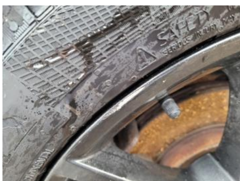
Fot. 51 Felga przednia L - Rysa/odprysk 1