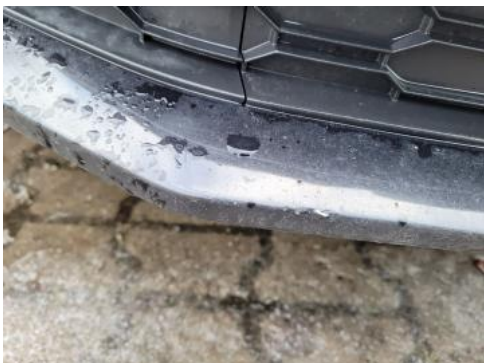
Fot. 41 Zderzak przedni cz dolna - zdjęcie poglądowe 2