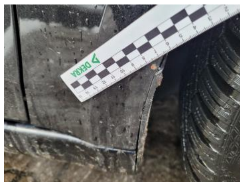
Fot. 44 Błotnik przedni P - Rysa/odprysk 1