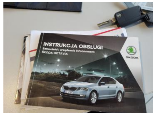
Fot. 36 Instrukcje