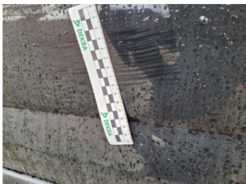
Fot. 49 Drzwi przed L - zdjęcie pogładowe 2