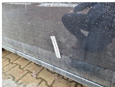
Fot. 48 Drzwi przed L - zdjęcie poglądowe 1