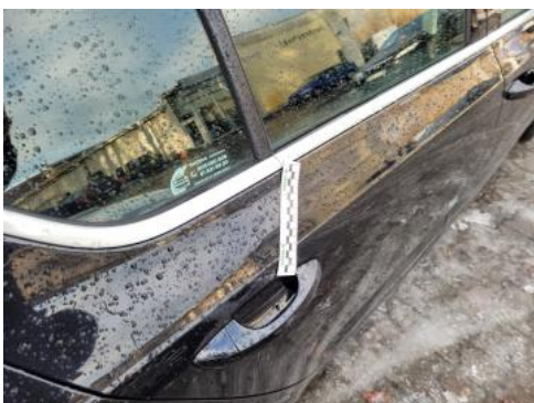
Fot. 45 Drzwi tylne P - zdjęcie poglądowe 1