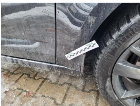
Fot. 43 Błotnik przedni P - zdjęcie poglądowe 1