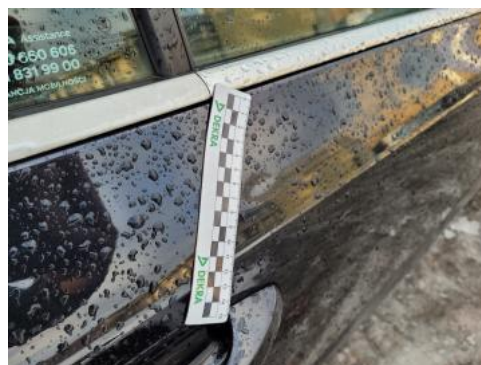
Fot. 46 Drzwi tylne P - Wgniecenie/odkształcenie 1