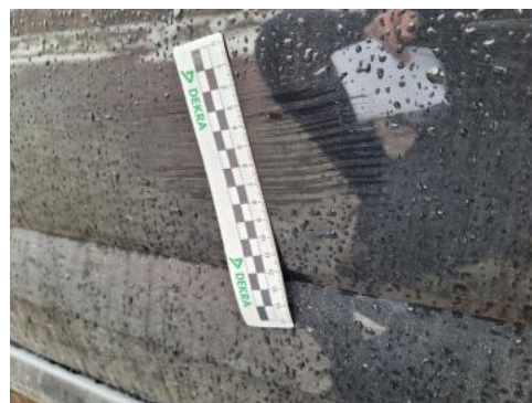
Fot. 50 Drzwi przed L - Wgniecenie/odkształcenie 1