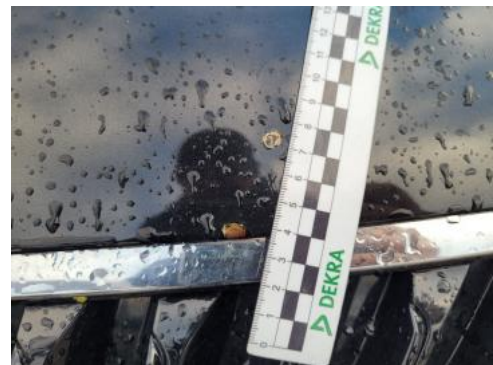
Fot. 38 Pokrywa komory silnika - Rysa/odprysk 1