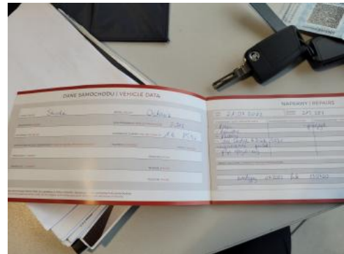
Fot. 34 Książka serwisowa – dane