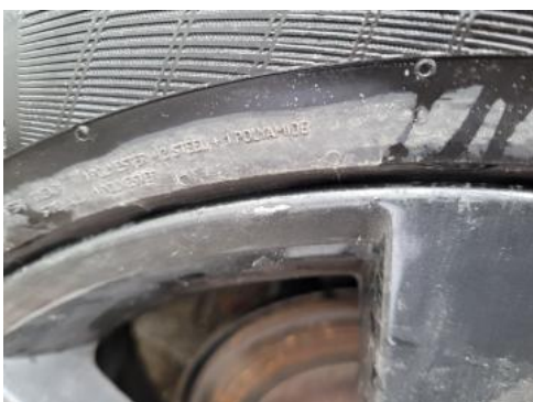
Fot. 47 Felga tylna P - Rysa/odprysk 1