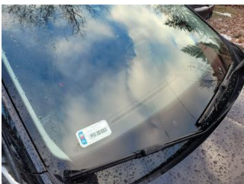
Fot. 39 Szyba czołowa - zdjęcie poglądowe 1